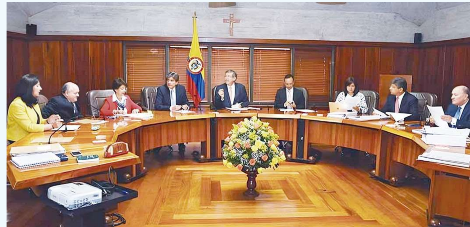
La Corte Constitucional, expidió la sentencia SU-546 de 2023.

En este sentido, el vicepresidente ejecutivo de la Adih, anunció "esperamos que la Gobernación del Huila, pueda convocar este espacio, ya notificamos a la Defensoría del Pueblo para que ella en materia digamos de lo que le corresponde en el tema normativo, asumir la