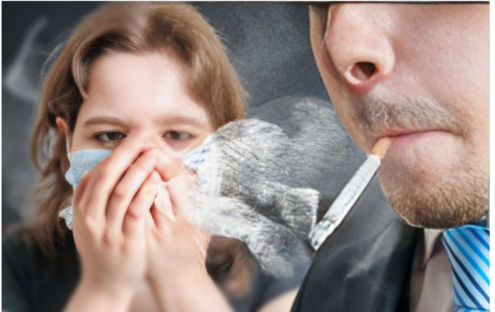
Fumar cigarrillos es la forma más extendida de consumo de tabaco en todo el mundo, según la OMS.