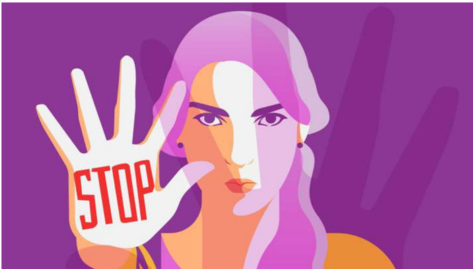
La Procuraduría realizó un taller para formar a sus funcionarios en estrategias para la atención efectiva de los casos de violencias basadas en género que son competencia de la entidad.

casos relacionados con violencia de género. La intervención oportuna y efectiva ante los jueces de la República es esencial para garantizar que los derechos de las víctimas sean protegidos y que la justicia cumpla su rol fundamental de corregir las desigualdades.