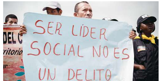
Líderes sociales en peligro