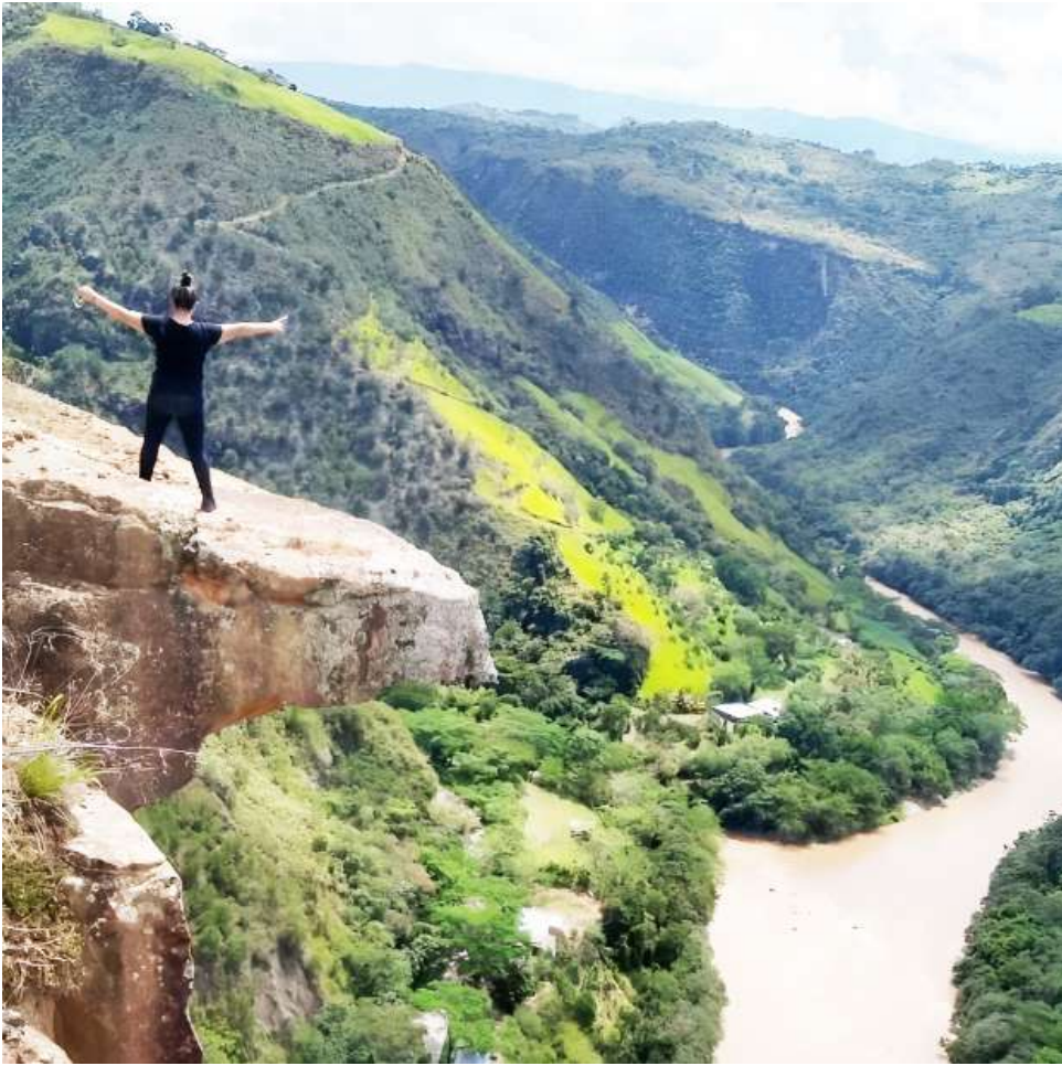
El Huila, con sus paisajes, tiene mucho potencial turístico.