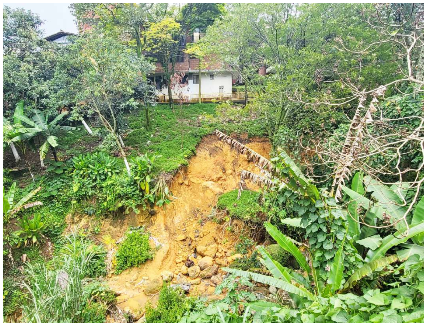
Imagen de referencia derrumbe en zona rural.

tización para que todos estemos preparados ante situaciones de riesgo. No queremos que esto vuelva a ocurrir”, subrayó un líder comunitario de la vereda.