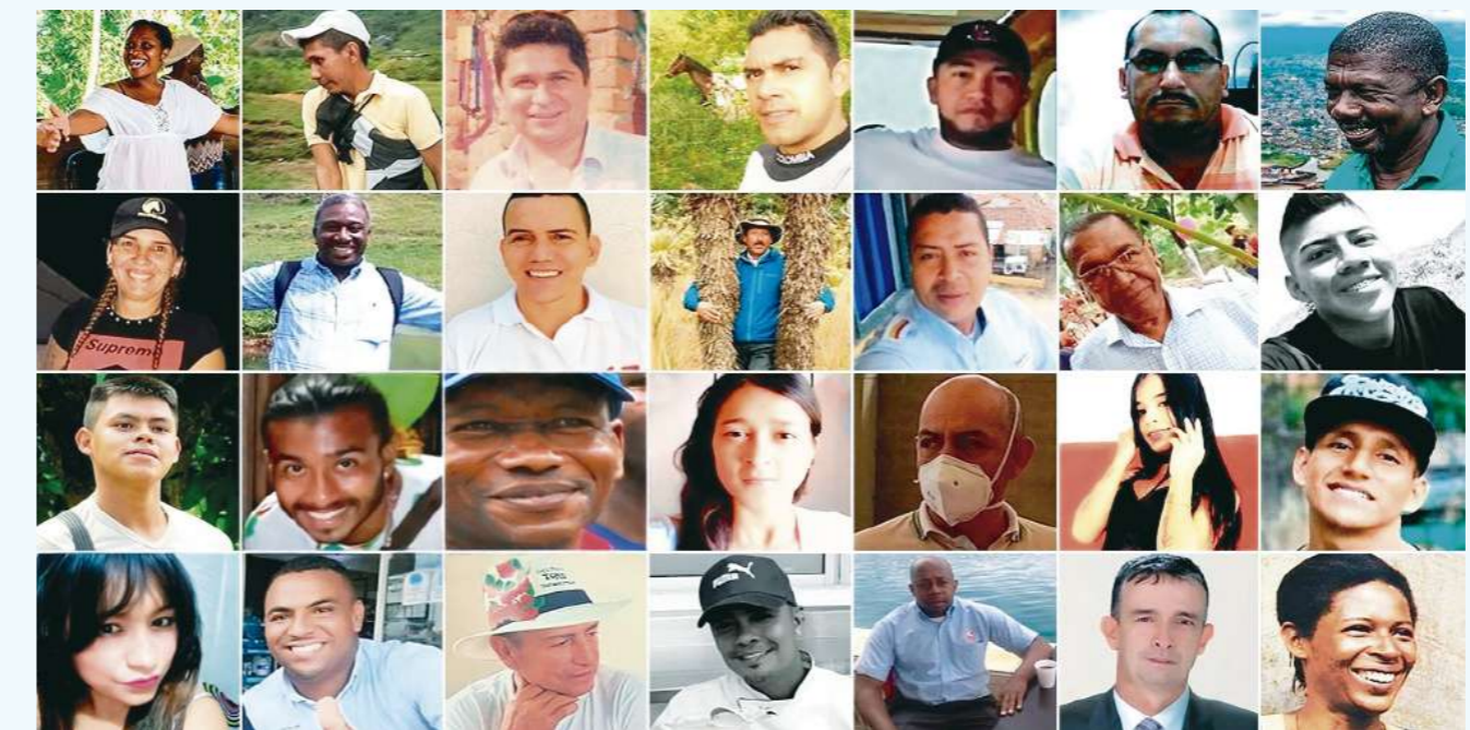
Hasta el 5 de octubre de 2024, Indepaz ha contabilizado 138 líderes sociales que han sido víctimas de la violencia en Colombia.

En este sentido, según la Sentencia SU-546 de 2023 de la Corte Constitucional, veinte líderes sociales y