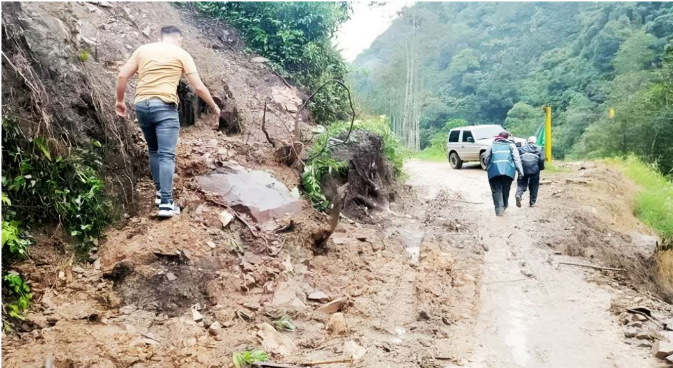
Se deben identificar los puntos críticos por escenario de riesgo y realizar el monitoreo y seguimiento en zonas urbanas y rurales.

davales”, señaló la administrativa. En este sentido, el Consejo Municipal de Gestión del Riesgo de Desastres de cada municipio, debe de articular los planes de contingencia, es la preparación para poder enfrentar situaciones adversas que se deriven de las precipitaciones, en esta articulación es importante tener en cuenta los organismos de socorro, la Defensa Civil, Cruz Roja, Bomberos e instituciones técnicas como la Corporación Autónoma Regional del Alto Magdalena, entre otros estamentos. “Se revisa en cada uno de estos planes de contingencia, cuáles son los escenarios de riesgo que se puedan presentar en el territorio y hay que darle un tratamiento. Estar muy atentos con el monitoreo y el seguimiento, en la zona urbana y rural, de esta