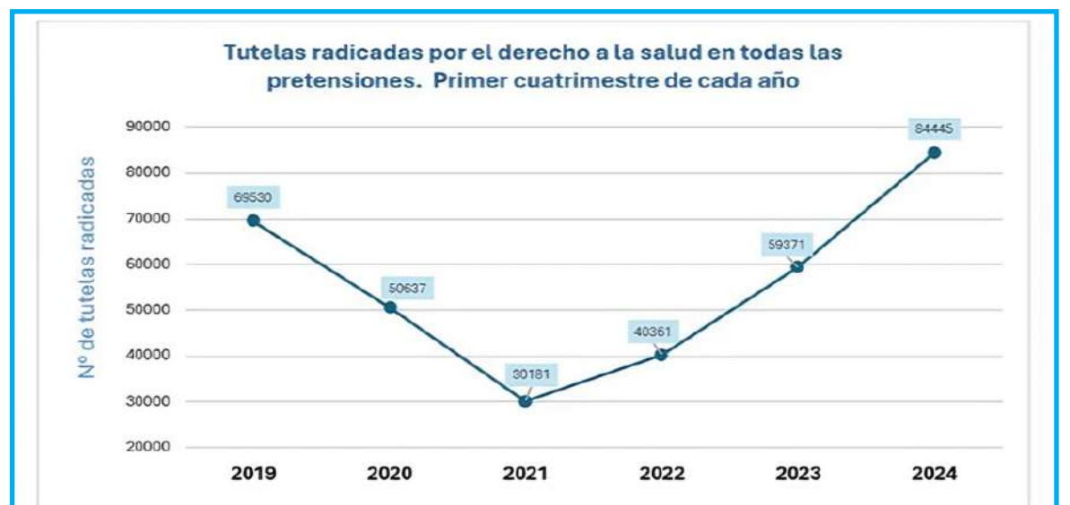
Gráfico 6. Tutelas radicadas en salud para todas las pretensiones.

Los pacientes, en última instancia, son los más afectados por este desfinanciamiento, pues se enfrentan a demoras en la atención, dificultades para acceder a medicamentos y procedimientos, y una creciente incertidumbre sobre el estado de su salud. Por ello, es urgente que se tomen decisiones acertadas y a largo plazo, que permitan garantizar el derecho a la salud de todos los colombianos.