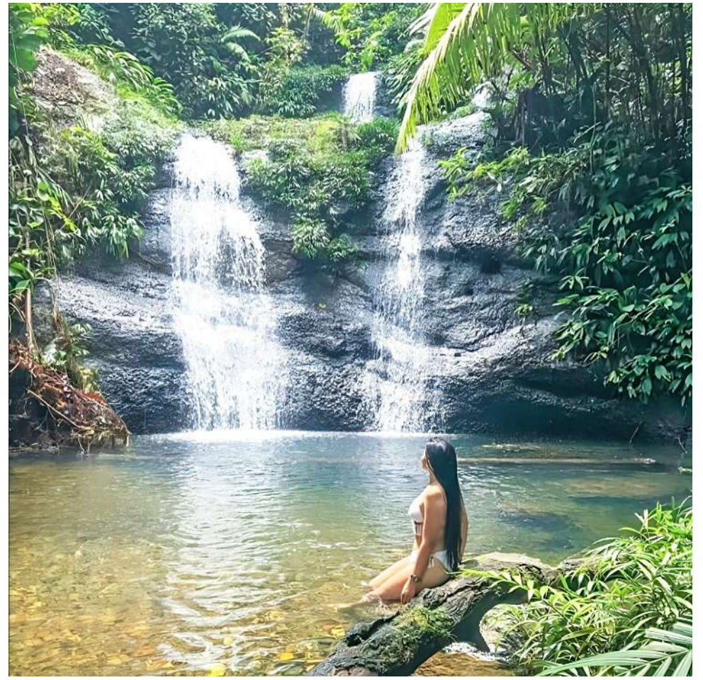
Las fuentes hídricas huilenses también son un atractivo especial.

ña cuestionó la insuficiencia del apoyo financiero que se le había asignado hasta el momento: “El apoyo del Departamento es de dos millones de pesos, pero ¿cómo vamos a enviar a una representante del Huila con solo dos millones de pesos? Eso es vergonzoso. Estamos hablando de una joven que va a representar todo lo que somos, nuestro turismo, nuestras tradiciones y no podemos tirarla a los lobos con tan poco respaldo”.