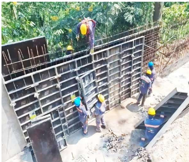
Se espera que el proyecto tenga un impacto positivo en el comercio y la industria agrícola de la región.