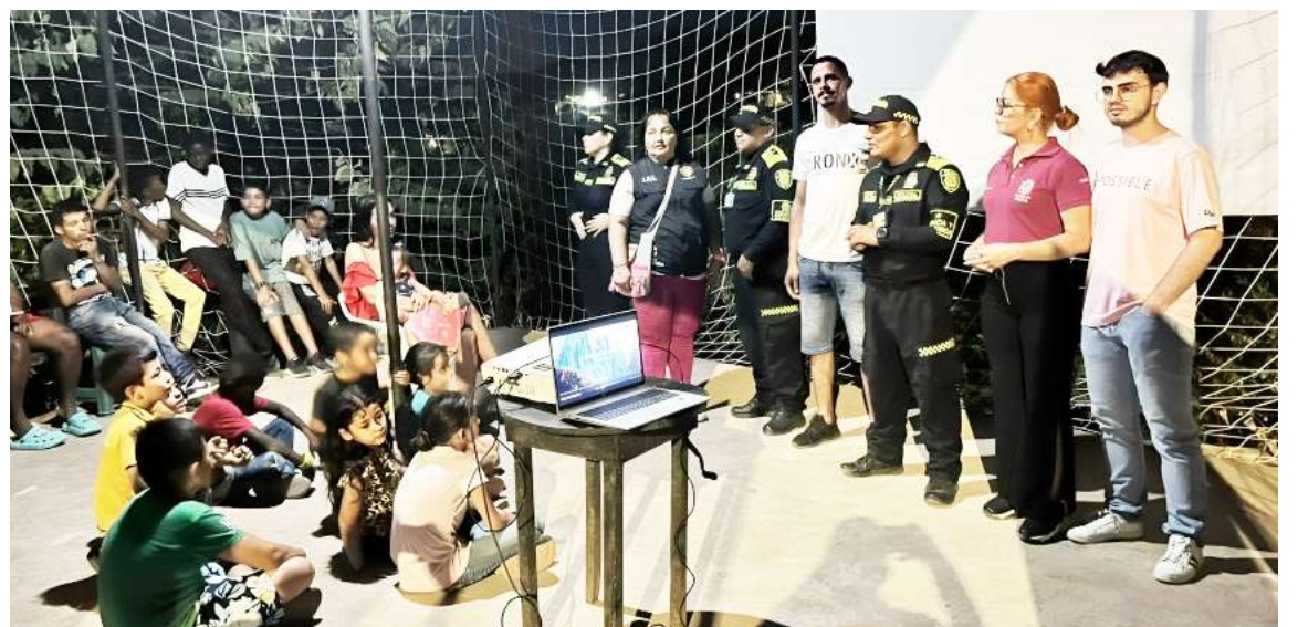
La Policía Metropolitana de Neiva, ejecutando la estrategia Plan Fortaleza 4, en cabeza del grupo de Protección a la Infancia y Adolescencia, en articulación con alcaldía municipal, presidentes de junta de acción comunal y la comunidad del Asentamiento Sergio Younes, realizan Cine al barrio con niños, niñas y adolescentes.