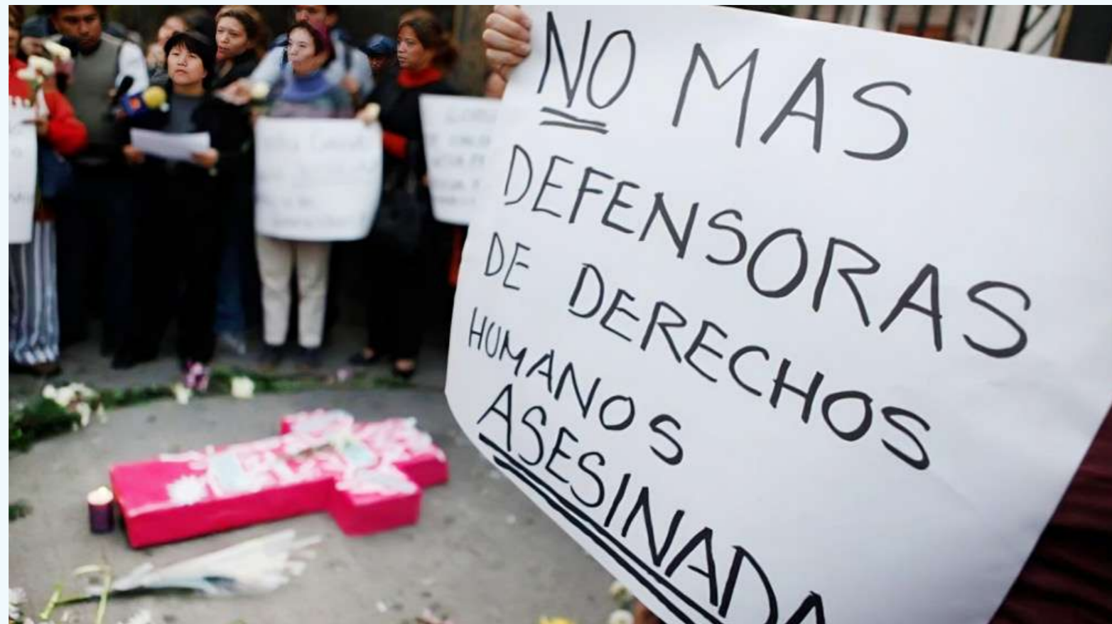
Las cifras de victimización contra este grupo poblacional son alarmantes.

Organizaciones sociales, defensores de derechos humanos, sindicalistas e indígenas, se reunieron y solicitaron la constitución de la Mesa Territorial de Garantías, cuyo principal objetivo es analizar la política de seguridad, protección y garantía de no repetición en contra de los líderes en el territorio huilense.