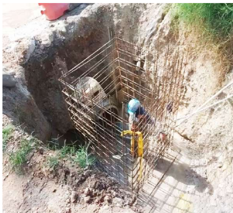
Aunque se esperaba que la obra fuera entregada a inicios de febrero del 2025, con los retrasos, se proyecta para mayo.

El proyecto La Plata - Gallego no solo beneficiará a las poblaciones locales, sino que también se espera que tenga un impacto positivo en el comercio y la industria agrícola de la región. La conexión más fluida hacia el Pacífico facilitará la movilización de productos, reduciendo costos y tiempos de transporte.