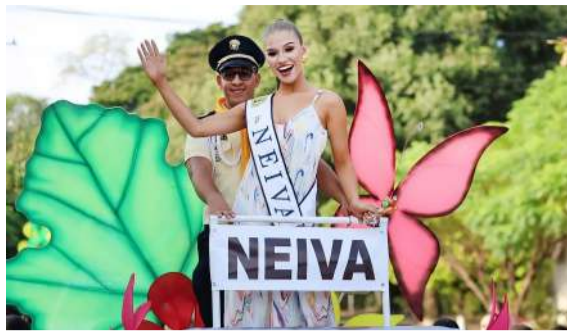
Huila presente en el reinado nacional del turismo