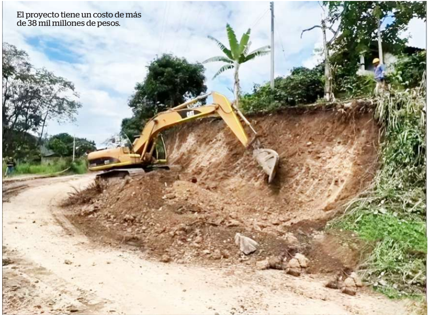
El proyecto tiene un costo de más de 38 mil millones de pesos.