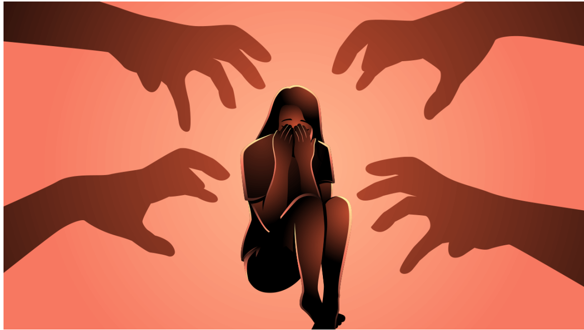
De los procesos priorizados en todo el país, 172 corresponden a investigaciones por feminicidio.

La Procuraduría, consciente de esta realidad, ha lanzado una serie de capacitaciones en todo el país con el objetivo de preparar a los procuradores judiciales penales y a los personeros para que puedan enfrentar de manera más eficaz los