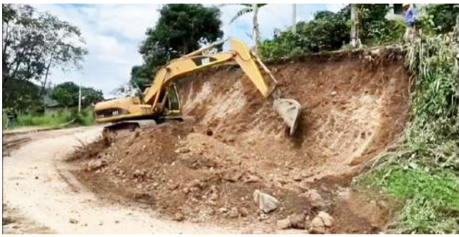
La vía La Plata - Gallego será retomada la próxima semana