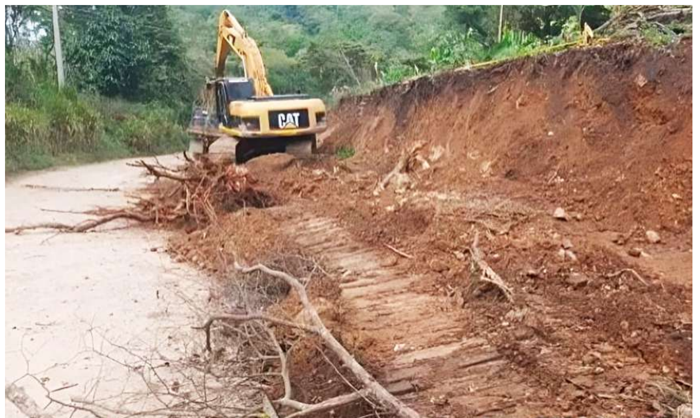
Las obras fueron suspendidas a inicios de septiembre por dificultades técnicas externas.

El proyecto cuenta con una inversión significativa de 38.139.811.851 pesos, de los cuales más de 25 mil millones han sido aportados por el Gobierno Nacional, mientras que el departamento del Huila ha comprometido más de 16 mil millones de pesos.