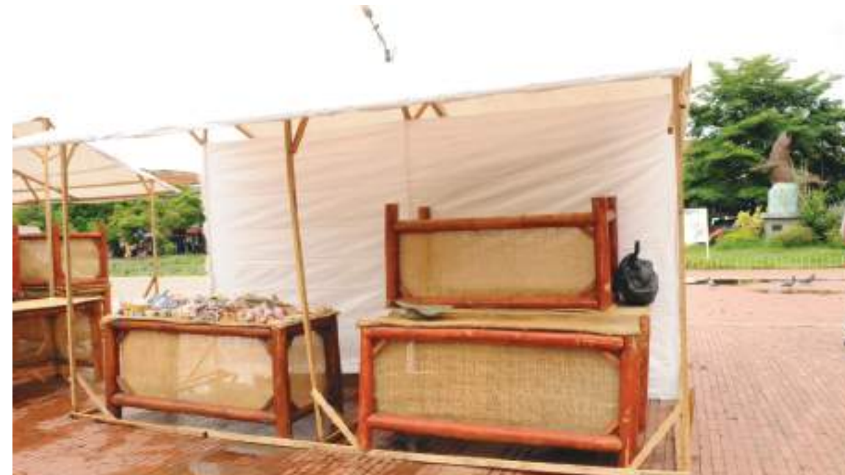
Espacios como este se entregará a cada uno de los expositores.