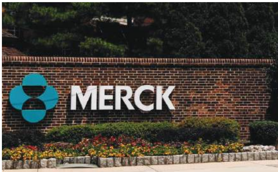
Una pregunta clave es si se debe restringir el uso del medicamento en embarazadas o en mujeres en edad fértil.

Otra pregunta clave es si el medicamento debe ofrecerse a pacientes que hayan sido vacunados o que hayan tenido previamente COVID-19. Merck no estudió el fármaco en personas vacunadas, pero los datos de un puñado de pacientes con infecciones previas sugirieron que tenía pocos beneficios. El medicamento funciona mejor cuando se administra dentro de los cinco días posteriores a los primeros síntomas de COVID-19.