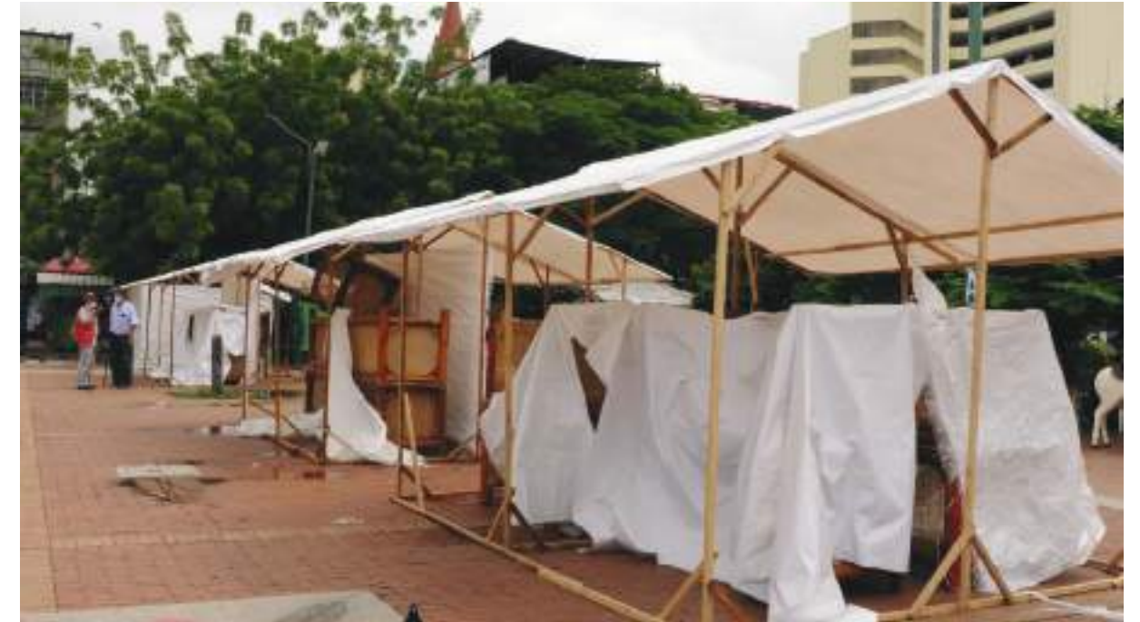
La plaza Cívica está ubicada en donde funcionó la antigua galería de Neiva.