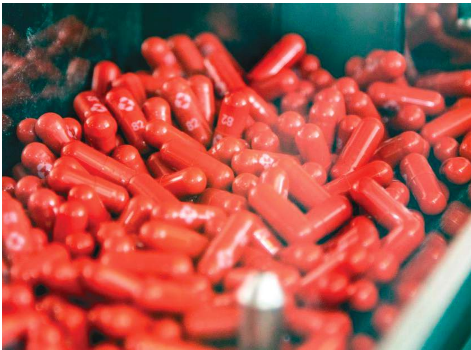
La reunión se produjo mientras las infecciones en Estados Unidos están aumentando nuevamente y las autoridades sanitarias de todo el mundo se esfuerzan por evaluar la amenaza.

En su revisión de inocuidad, el personal de la FDA dijo que los estudios en animales sugirieron que el medicamento de Merck podría causar defectos congénitos cuando se administra en dosis altas. Los reguladores dijeron que están considerando una prohibición completa del uso de molnupiravir durante el embarazo y otras medidas de precaución, incluida la recomendación de anticonceptivos para algunas pacientes que tomen el fármaco.