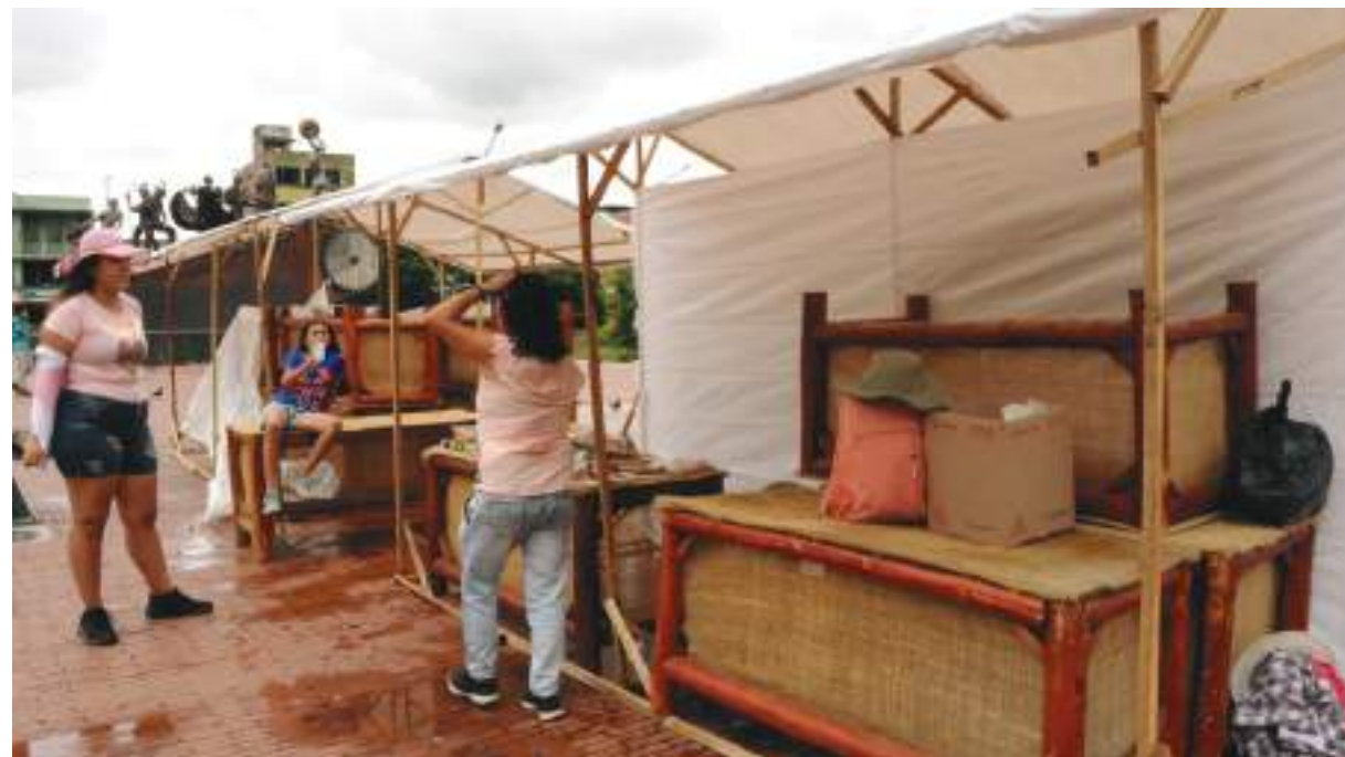
La mujer cabeza de familia será una de las protagonistas en la feria.

La Feria sirve también para visibilizar los talentos y emprendimientos y para contribuir a la generación de oportunidades para las personas que como los artesanos e informales hacen el esfuerzo de crear empresa.