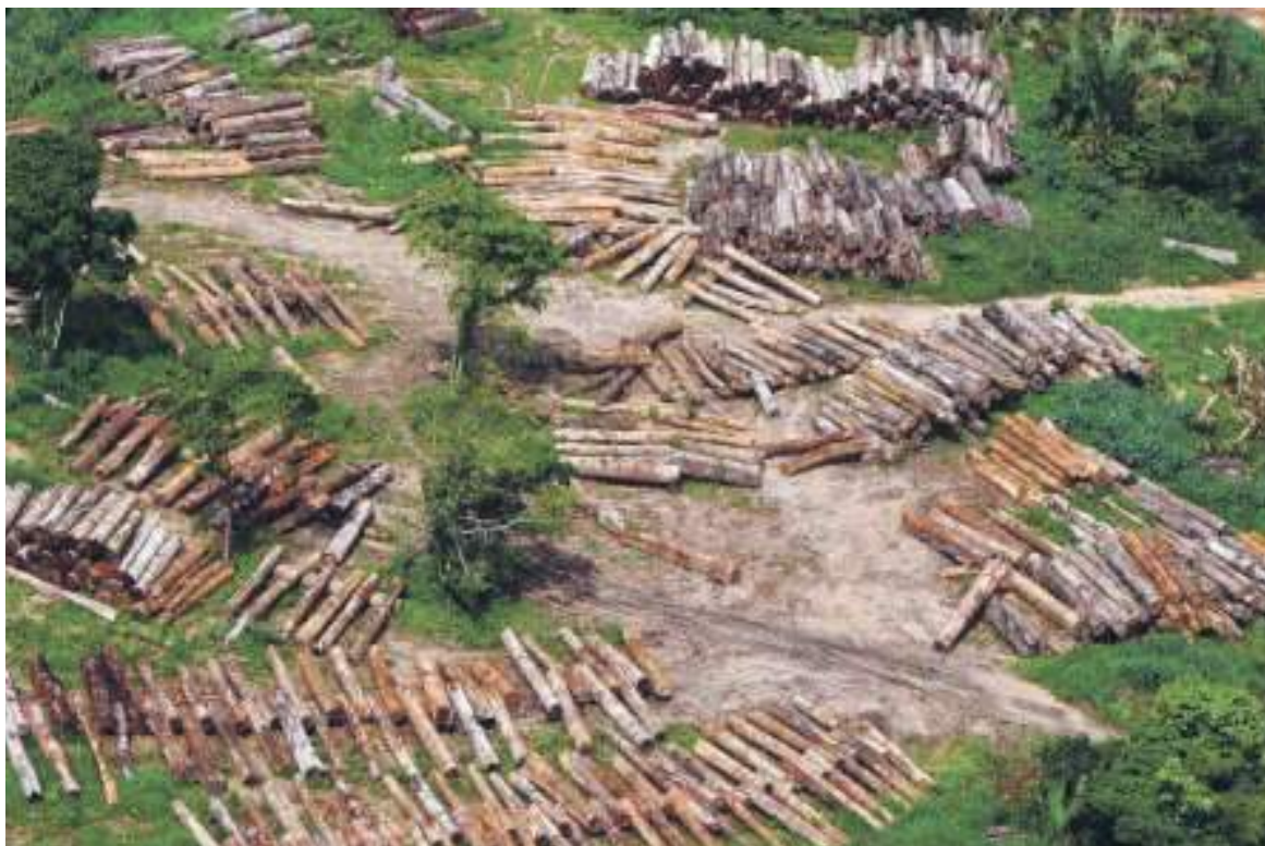
Los índices se registraron gracias a la acción de la fuerza pública con la campaña Artemisa, la aplicación de la ley de delitos ambientales y el uso de la tecnología.

"Todas las acciones nuestras son de un gran compromiso con la acción climática, con la carbono neutralidad, y la protección integral de la naturaleza como activo estratégico y allí están en activo las fuerzas".