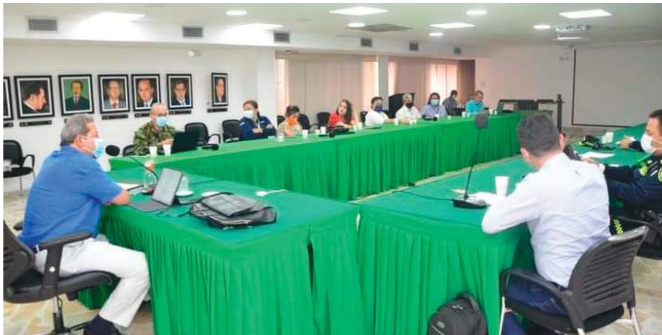
La Procuraduría solicitó a gobernadores, alcaldes y comandantes de Policía, poner en marcha operativos de inspección, vigilancia y control al uso, almacenamiento, distribución, transporte y comercialización de artículos pirotécnicos.