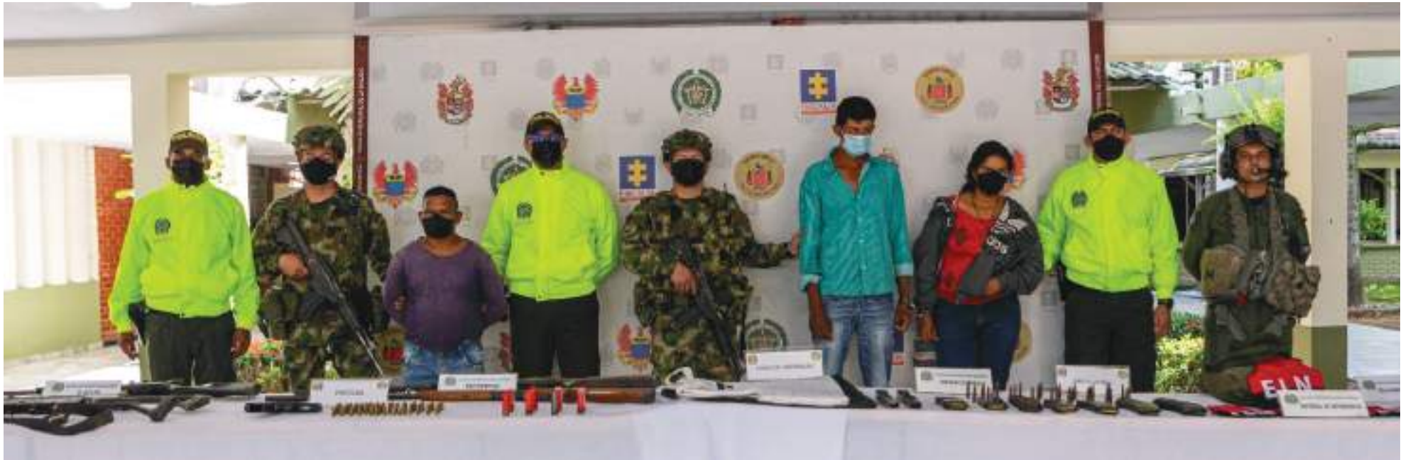
La operación permitió la captura del presunto cabecilla militar y un hombre y una mujer de su anillo de seguridad.

■ La operación permitió la captura del presunto cabecilla militar y un hombre y una mujer de su anillo de seguridad.