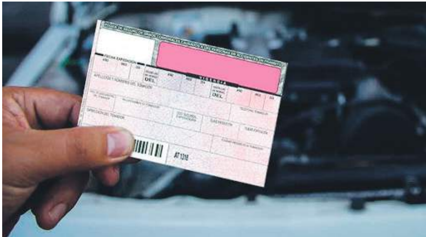
La ley genera un 10% en el valor de la prima del SOAT y prorroga por 2 años las licencias de conducción que vencerían entre el 1 y 31 de enero del 2022.

El proyecto, originalmente buscaba un descuento paulatino del 10% para el primer año, del 15% para el segundo y así consecuti-