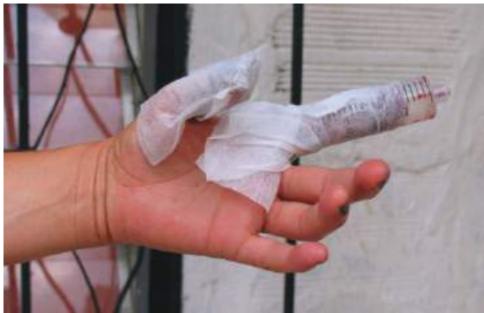
Los totes y cohetes son los artículos pirotécnicos que dejan más lesionados en el Huila.