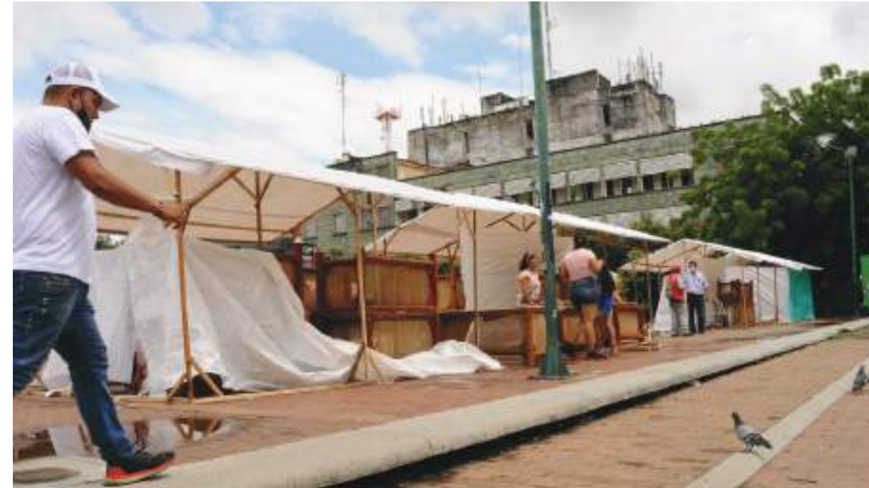
En stand se hará la oferta de los productos durante 26 días.