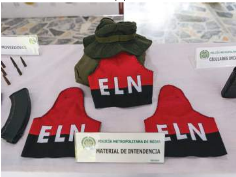
Se trata de alias Víctor, Pipas o el Indio y dos hombres que hacían parte de su seguridad, quienes fueron capturados en un hotel en la vereda La Chivera en el municipio de Villavieja.

Su amplia trayectoria criminal lo habrían convertido en una ficha estratégica para el cumplimiento de los objetivos, de ahí que el resultado operacional se traduce en un contundente golpe con el que las autoridades envían un claro mensaje al GAO ELN: en el Huila, los organismos de seguridad del Estado trabajan unidos para neutralizar las pretensiones de desestabilizar el orden público y la convivencia ciudadana, siempre articulados y de la mano con la población civil.