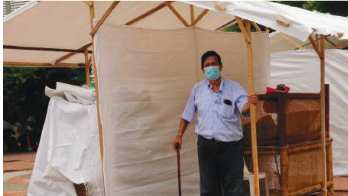
Los artesanos se preparaban para abrir su feria en La Plaza Cívica.