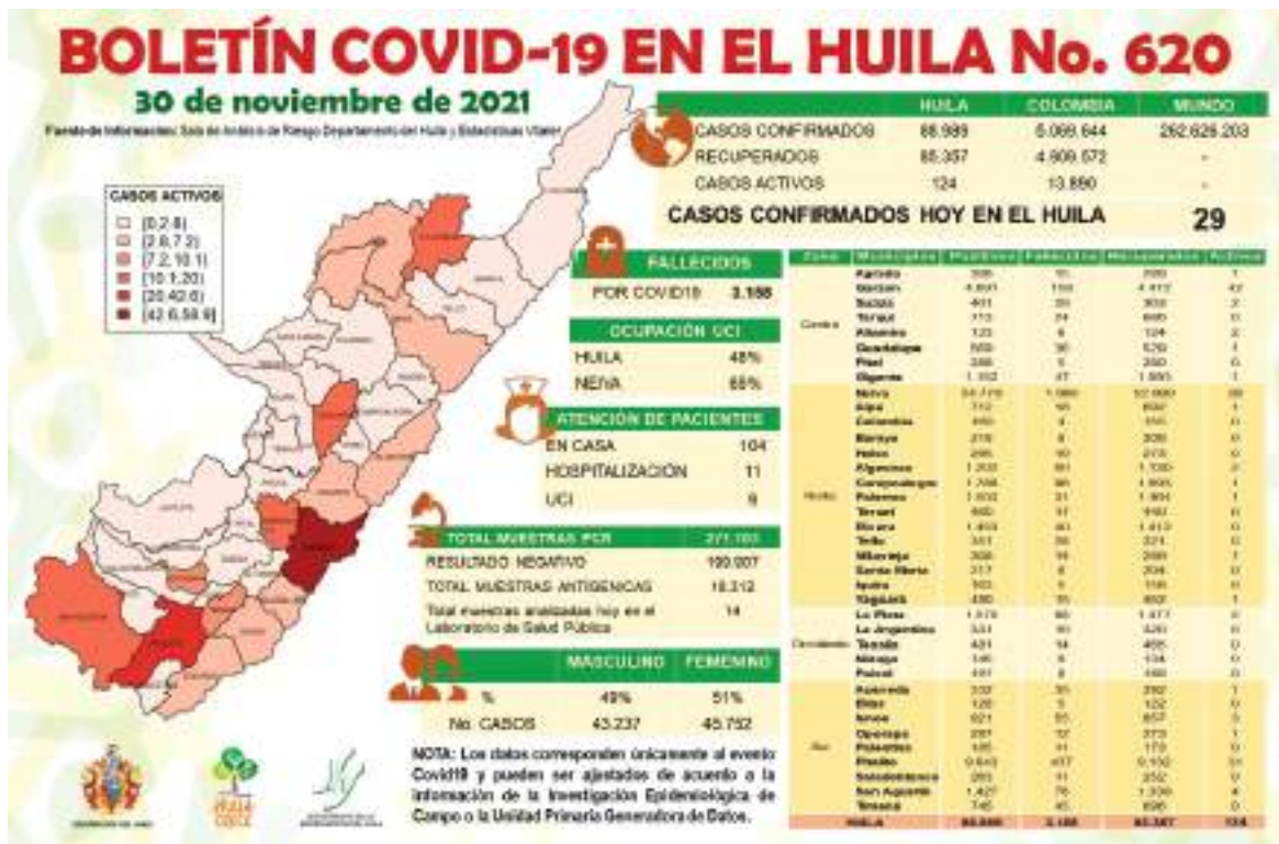
El porcentaje de ocupación de Unidad de Cuidados Intensivos en el departamento al cierre de la jornada es del 48% y en la ciudad de Neiva en 65%.

De igual manera, se detectó una leve baja en el ritmo de vacunación, ya que para el día se aplicaron un total de 319.293 dosis, de las cuales 73.626 corresponden a la segunda inyección mientras que otras 15.685 fueron monodosis.