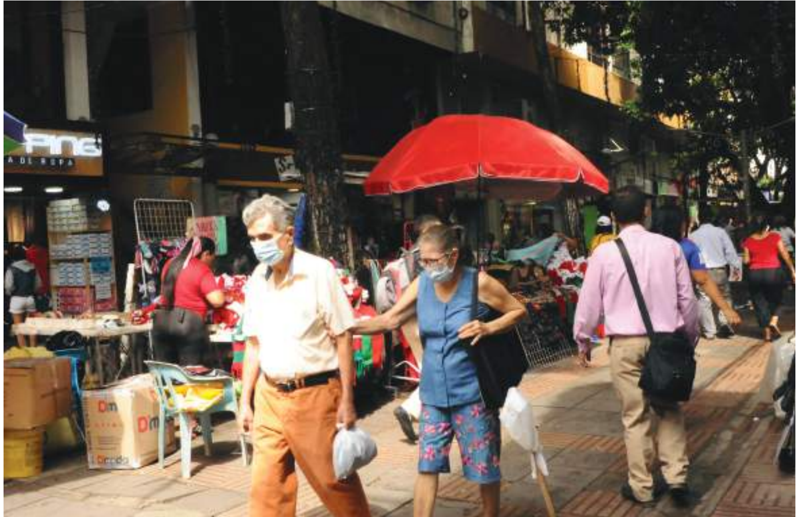
La Sala de Análisis del Riesgo para la vigilancia epidemiológica del evento Covid-19 reportó 29 contagios nuevos en 10 municipios.

que 55 colombianos fallecieron a causa de la enfermedad en las últimas 24 horas. De esta manera, el país llega a un total de 128.528 decesos a causa del virus desde el inicio de la pandemia.