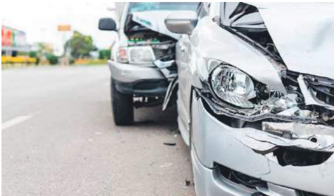
Ciudadanos indican que el descuento del 10% ya lo dan las aseguradoras.

Los conductores que hayan tenido buen comportamiento en las vías durante los años 2020 y 2021, tendrán un 10% de descuento en el SOAT, este valor se vería reflejado en el pago del año 2022.