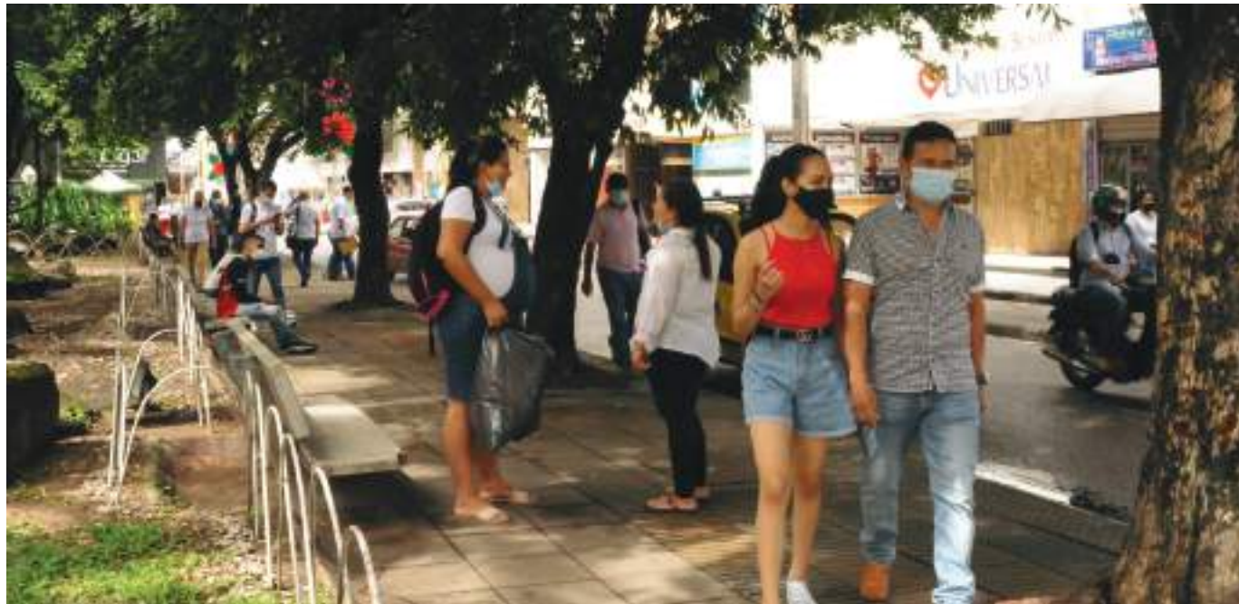
Colombia tuvo un aumento de 6,8% en mujeres ocupadas y de 2,2% en hombres en comparación con el mismo mes del año anterior.

Las 13 ciudades y áreas metropolitanas contribuyeron con 2,9 puntos porcentuales a la variación nacional, dominio en donde se