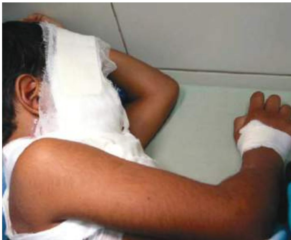
La Gobernación del Huila ya expidió la normatividad para fin de año y prohibió el uso de pólvora en el departamento.

Entre las motivaciones expuestas por la entidad en su petición, está la reiterada ocurrencia de accidentes con juegos pirotécnicos, cuyos casos han mantenido un preocupante promedio durante los últimos dos años (37 casos atendidos por las Comisarías de Familia en todo el país entre el 12 de marzo de 2020 y el 31 de agosto de 2021, según reportes del ICBF), que suelen multiplicarse durante esta época, pese a las restricciones legales que existen con respecto a su venta y ma-