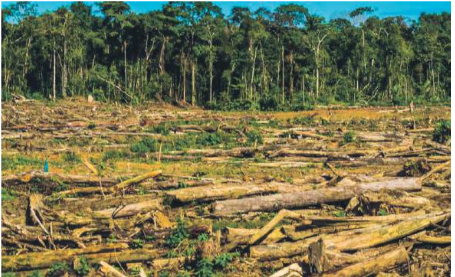
El presidente de la República, Iván Duque, dio a conocer que la tasa de deforestación en Colombia durante el primer semestre del año tuvo una reducción del 34%.

En ese sentido, señaló que las fuerzas colombianas han desarrollado apoyos tecnológicos como el nuevo equipo no tripulado de control de espacios en ciudades y