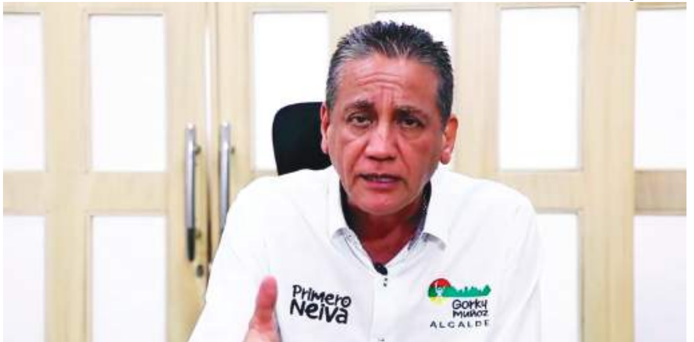
Gorky Muñoz Calderón, alcalde de Neiva, quien seguirá con sus funciones normalmente.

desarrolla, con fundamento, entre otros principios, en los de moralidad e imparcialidad, este último garantizado también por el Código de Procedimiento Administrativo y de lo Contencioso Administrativo en su artículo 3”, por lo que con el fin de dar cumplimiento a los principios de moralidad, transparencia e imparcialidad, se procede a designar alcalde ad hoc del municipio de Neiva.