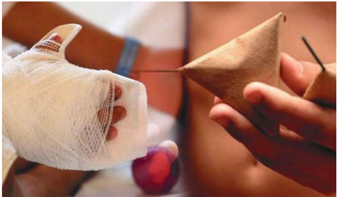
El Huila ya reportó el primer caso de persona lesionada con pólvora, en esta temporada de fin de año del 2021.

alarmas para el control de la venta y manipulación de la pólvora en esta época de fin de año, que es cuando más se incrementa.