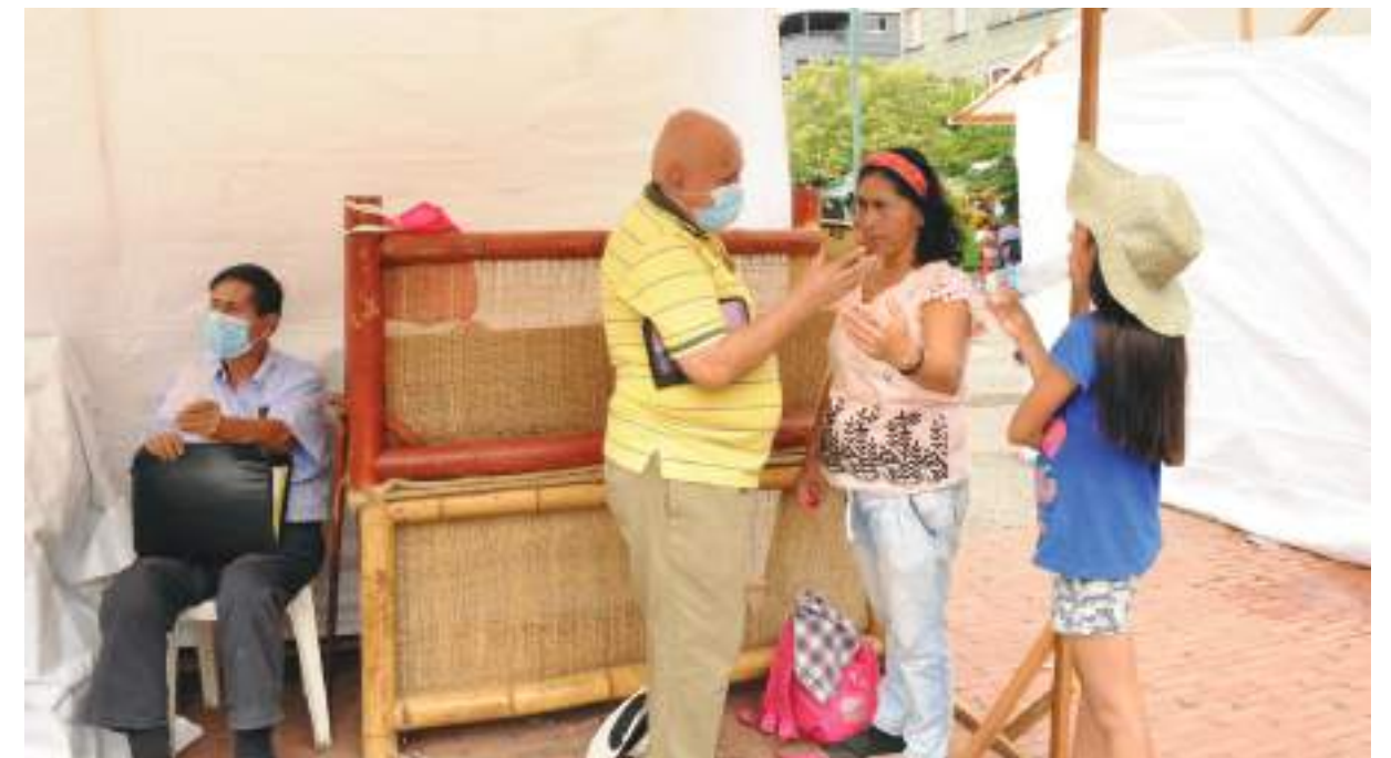
Diario del Huila siempre con la comunidad.