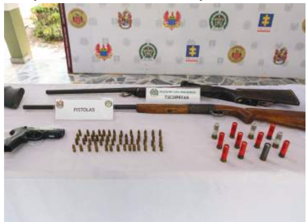
La contundente operación que contrarresta la intención del ELN de ingresar y por primera vez posicionar su estructura armada, la que tenía la misión de tomar posesión de las zonas que en el pasado fueron ocupadas por el frente 17 Angelino Godoy.