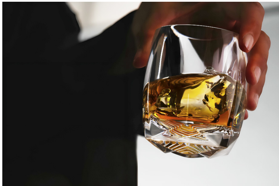
Según el estudio, los mensajes que señalan que beber alcohol de forma moderada puede ser bueno para la salud son "erróneos".

Sobre la ingesta de este tipo de productos, la advertencia común se centra en las cantidades: no beber en exceso. Y es que el consumo desenfrenado de bebidas alcohólicas trae consigo toda suerte de efectos negativos.