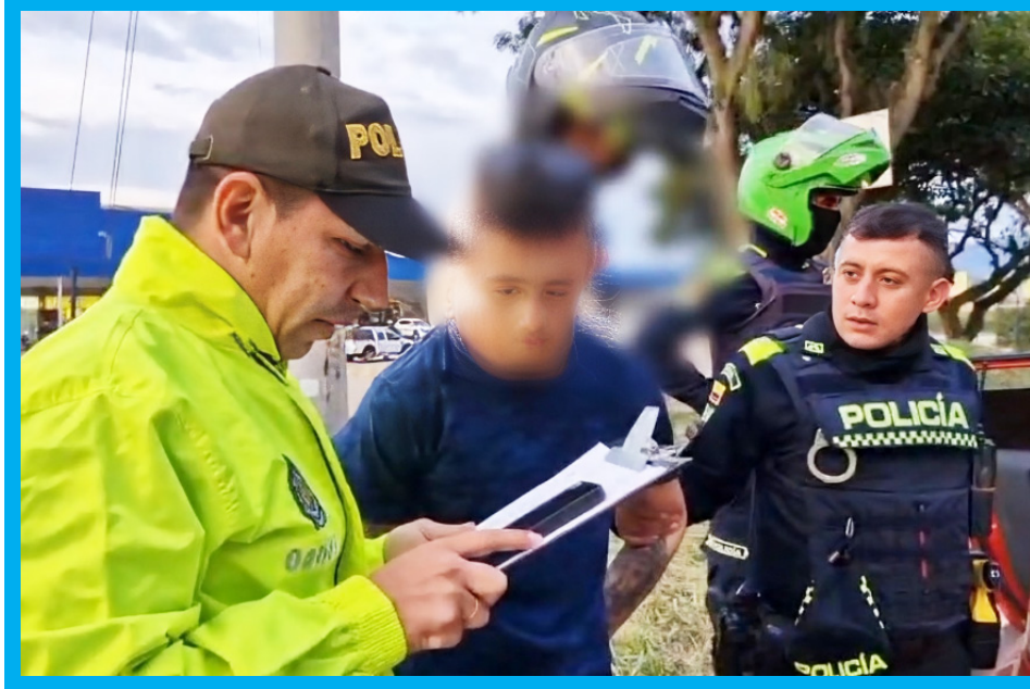
El dron le seguía el rastro al presunto delincuente.

“Esta semana las unidades policiales detuvieron a un facineroso que había atracado a un cafetero en el año 2022, en la vía que comunica al municipio de Altamira con Garzón y al ver un puesto de control, emprendió la huida y con el dron se adelantó un seguimiento”, resaltó el mandatario.