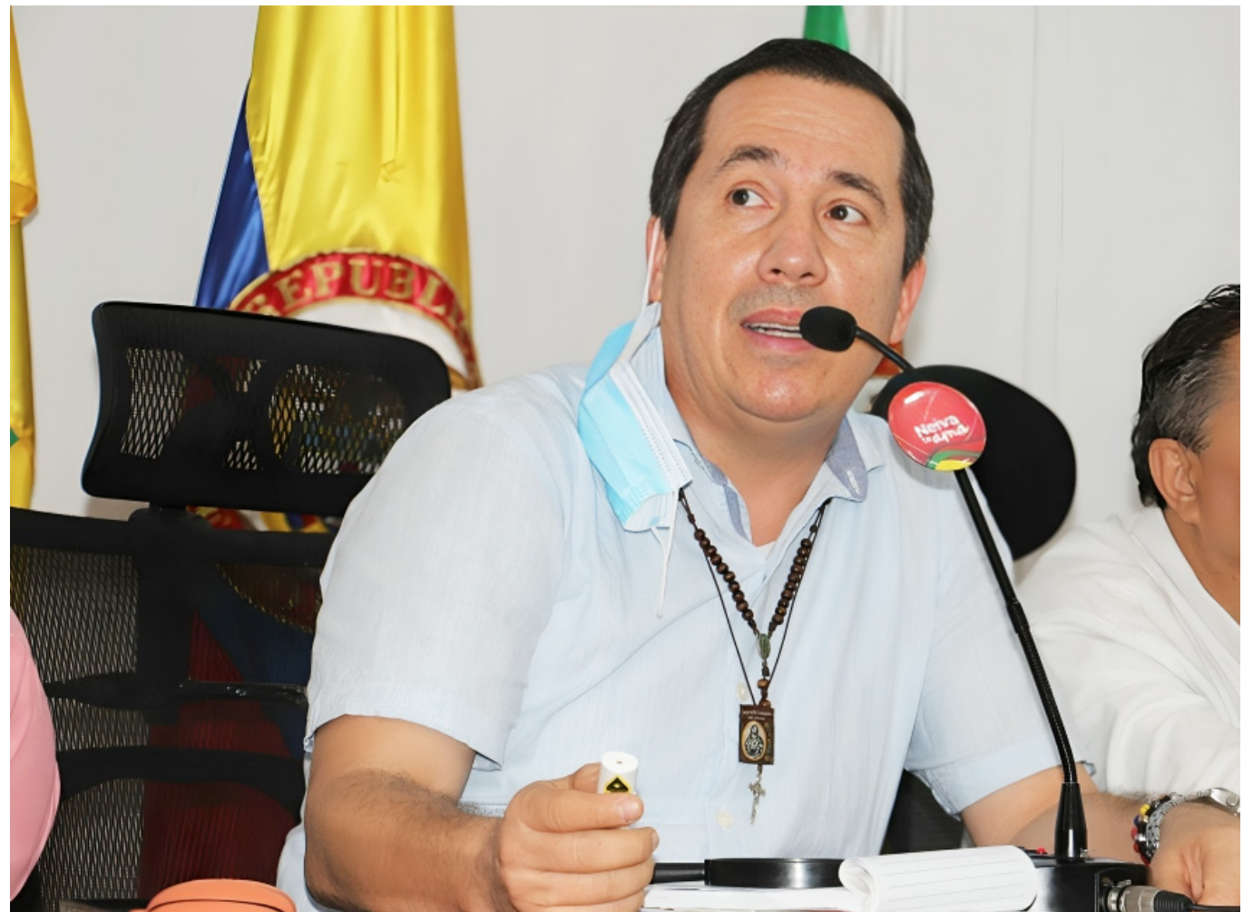
El Concejo cuestionó el papel poco activo de la Contraloría.

La Contraloría realizó una calificación negativa de los estados financieros en el municipio, sin embargo, se abstuvo de realizar un concepto de indicadores financieros pues “se evidenció diferencia entre la información reportada en el CHIP y la información publicada en la página web del Municipio de Neiva”, asegura el documento.