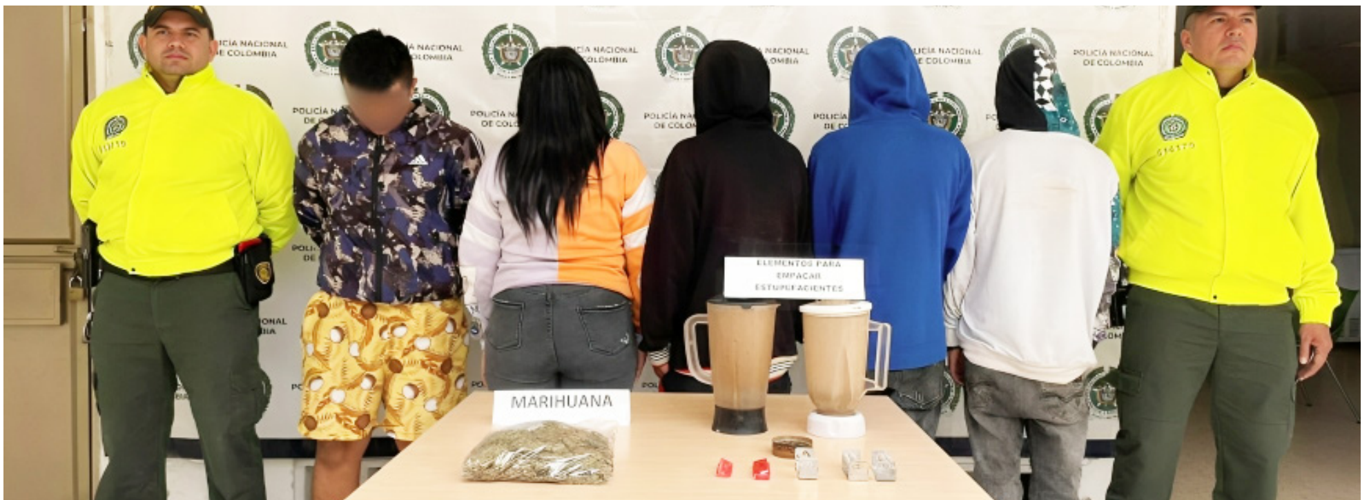
‘Los Españoles’, se dedican al hurto en diferentes modalidades.

En el momento la Fiscalía ya legalizó el procedimiento de captura, y se encuentra a la espera que se realicen las audiencias de imputación de cargos y solicitud de medida de aseguramiento.