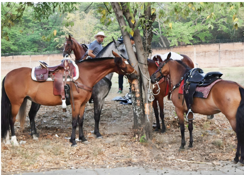
La propuesta busca regular las cabalgatas con enfoque en respeto a los equinos.

rinario debe certificar la salud de cada equino antes de la cabalgata, prohibiéndose la participación de animales con signos de maltrato, heridas o yeguas en el último tercio de gestación. Todos los equinos deben estar inscritos en un sistema informático de gestión y llevar un microchip para su identificación. Es obligatorio disponer de la documentación sanitaria adecuada, como el Pasaporte Equino, Libreta Sanitaria Equina y Guía Sanitaria de Movilización Interna, la cual debe ser verificada por el Instituto Colombiano Agropecuario (ICA). Los jineteros deben aprobar un curso de cuidado y bienestar animal impartido por instituciones reconocidas. Los operadores de las cabalgatas deben dividir el evento en etapas como desembarque, bahía, recorrido, y asegurar la infraestructura adecuada para el manejo de los equinos. Además, deben