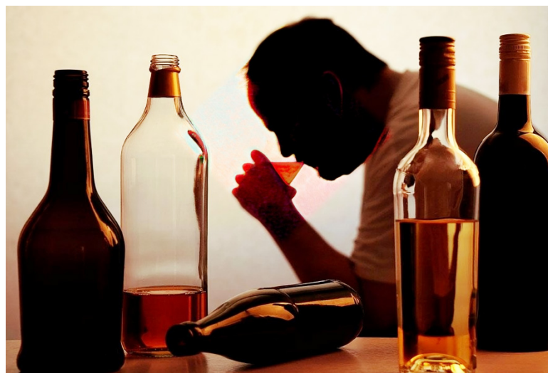
Existen licores con mayor grado de alcohol que otros. Los expertos en salud recomiendan beber con moderación.

20 g/día, equivalente a dos cervezas o dos copas de vino). Los resultados indicaron que los bebedores moderados no presentan un menor riesgo de fallecer en comparación con los bebedores ocasionales. Esto refuta la idea de que el consumo moderado de alcohol tiene beneficios para la salud.