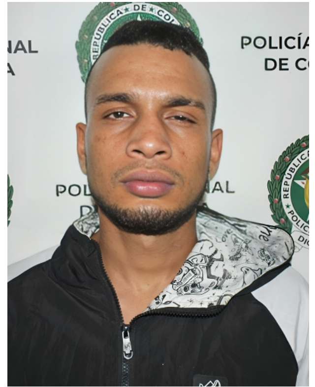
Caqueteño, 'Brujo', 'Morochó', 'Pajoy', 'Nairo', detenidos por comercializar 'droga'.