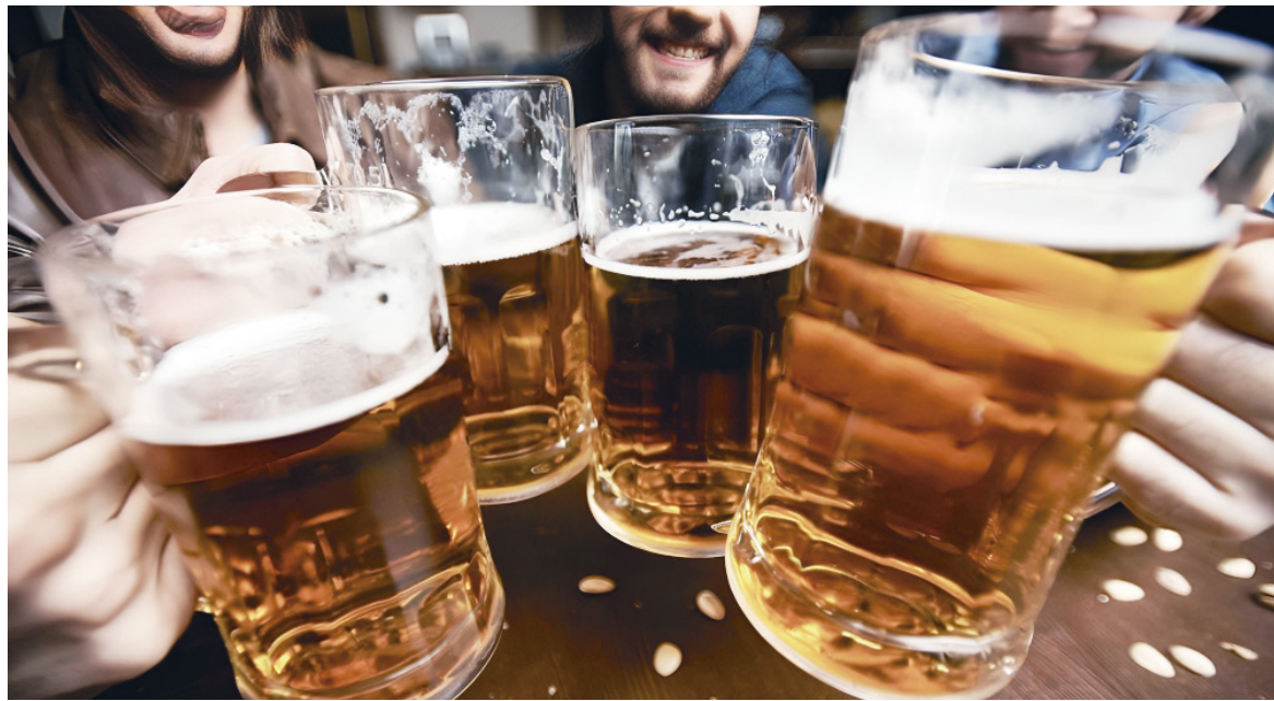
El consumo excesivo de bebidas embriagantes es nocivo para la salud.

El estudio comparó a bebedores ocasionales (quienes consumen alcohol una vez al mes o menos) con bebedores moderados (hasta