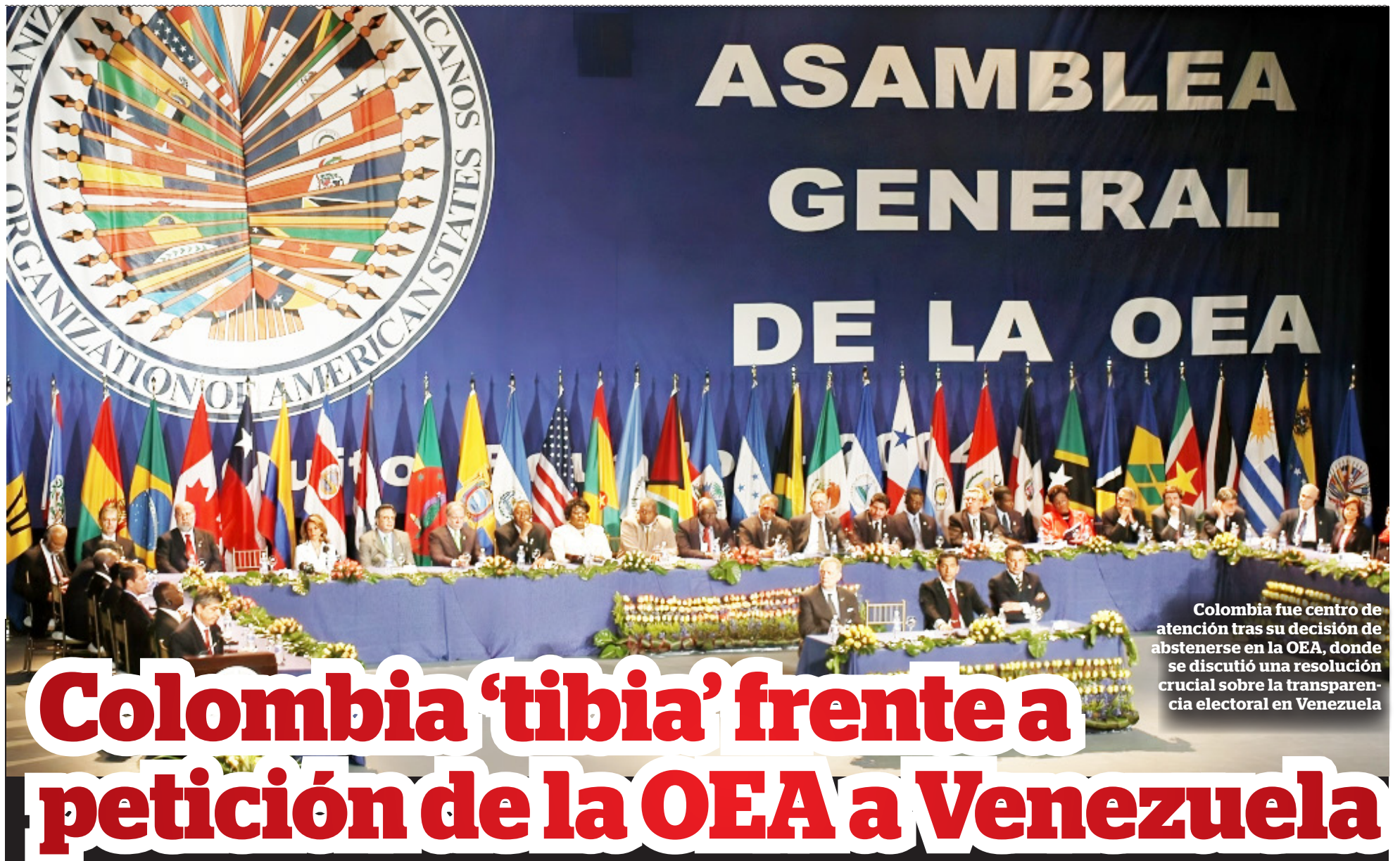
Colombia fue centro de atención tras su decisión de abstenerse en la OEA, donde se discutió una resolución crucial sobre la transparencia electoral en Venezuela