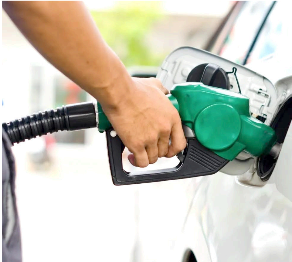
La última alza de la gasolina para el mes de noviembre fue de $600, dejando el galón en $14.564.

Por lo tanto, teniendo en cuenta que el valor que ha venido incrementando en el precio de la