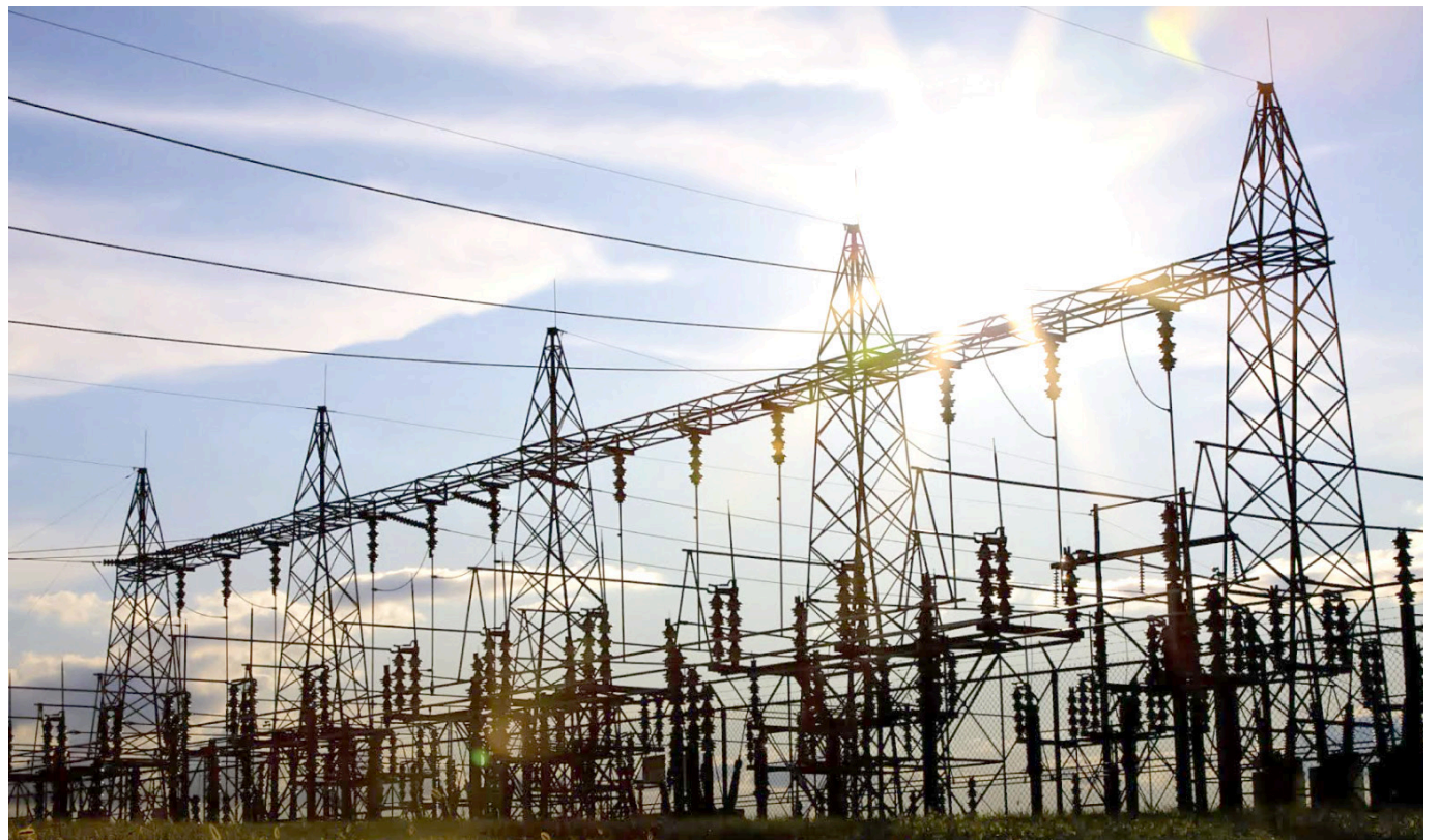
Es "necesario y urgente" adoptar de manera definitiva la resolución de la Creg sobre la opción tarifaria.

"Es fundamental mantener un balance adecuado entre tarifas eficientes, garantía en la prestación futura del servicio y sostenibilidad de las empresas como objetivo de política pública y regulación", concluyó José Camilo Manzur.