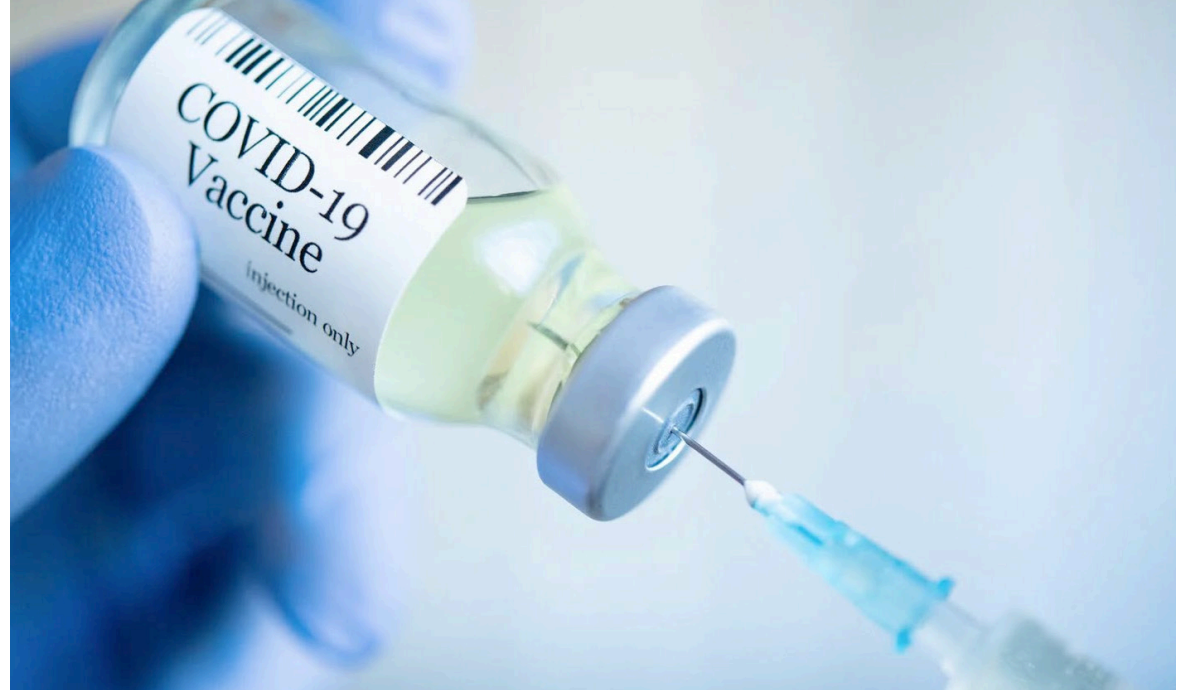
La vacuna contra el covid-19 se desarrolló en tiempo récord y salvó millones de vidas en todo el mundo.

En la región países como Chile sí le están suministrando a su población esta versión actualizada de la vacuna.