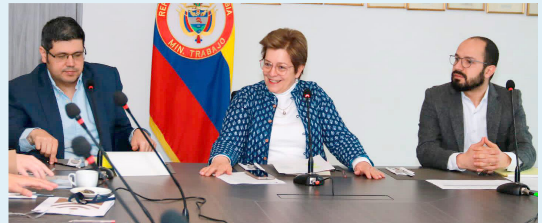
Cerca de 4 millones de trabajadores ganan un salario mínimo en Colombia.

De otra parte, anotó que se debe tener en cuenta la expectativa creciente por los incrementos de los combustibles, especialmente del ACPM (diésel), utilizado en su gran mayoría por la flota transportadora del país.