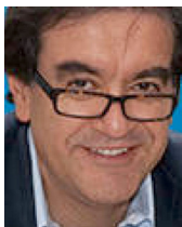
Pedro Medellín Torres

“Cuando López habla, pone a pensar al país” era la frase que sintetiza una época en que la política era hecha por políticos de partido con formación y comprensión del Estado y la sociedad, visitantes asiduos del arte y la literatura, y guiados por un espíritu crítico y capacidad de análisis. Por su riqueza conceptual y su agudeza argumental, esos políticos captaban toda la atención de los ciudadanos. Los debates en el Congreso eran verdaderas piezas de oratoria, que mantenían en vilo a la nación. De ellos, Alfonso López Michelsen era uno de los más caracterizados. Su conocimiento político y autoridad interpretativa le permitían captar muy bien el desenvolvimiento de la política colombiana. Cuando hablaba, ponía a pensar al país.