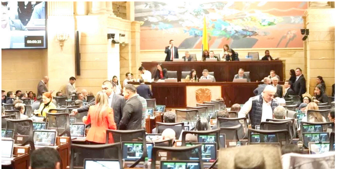
Debate de la reforma a la salud en plenaria de Cámara de Representantes.

Es decir, muchas cifras para tener en cuenta en el debate de estudio, votación y aprobación de la reforma a la salud, el cual, fue suspendido en el Congreso de la República, donde avanza el aval al articulado.