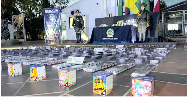
Lanzan llamado urgente para una navidad segura y sin pólvora