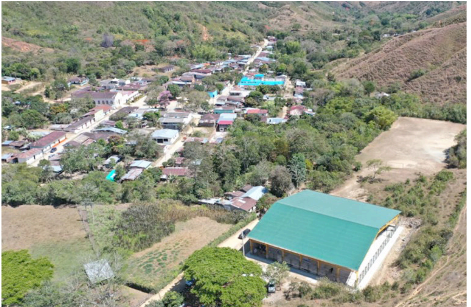
Monitorean los corregimientos de Aipecito, Chapinero, San Luis, Vegalarga.