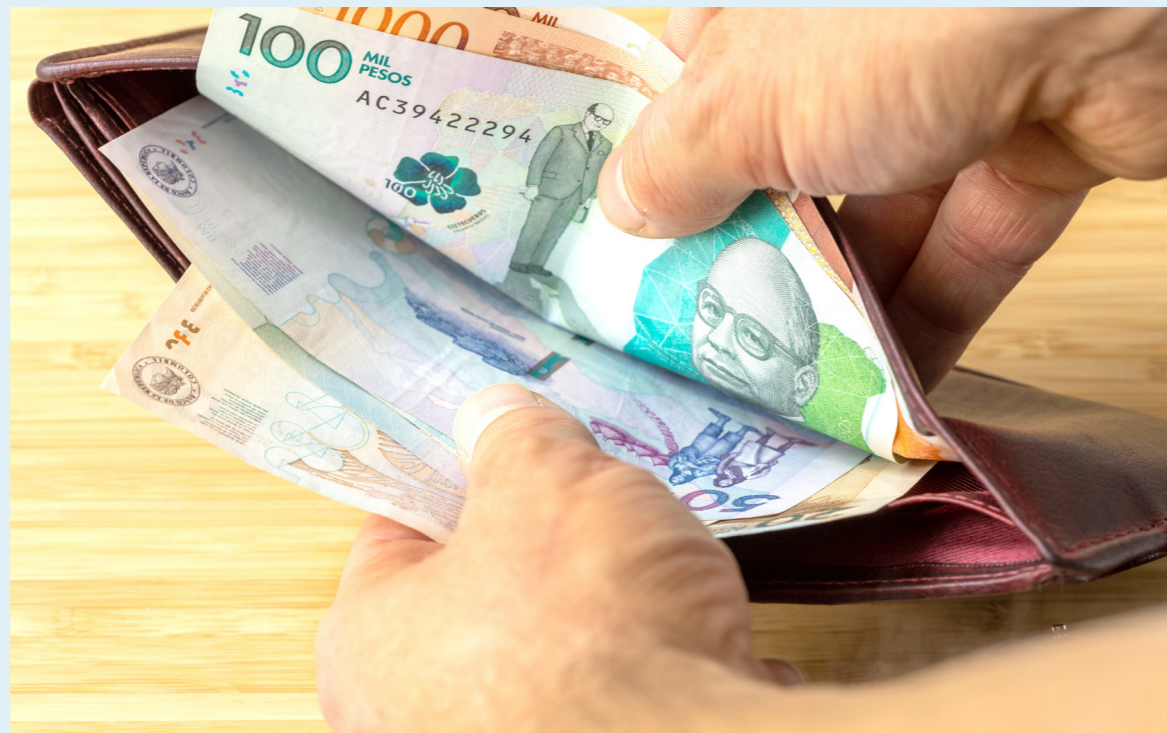
Tenga en cuenta que un aumento desbordado del salario mínimo puede incrementar las presiones sobre la inflación.

la agremiación que representa a los comerciantes del país, envió una carta a los miembros de la comisión séptima de la Cámara de Representantes, con una propuesta