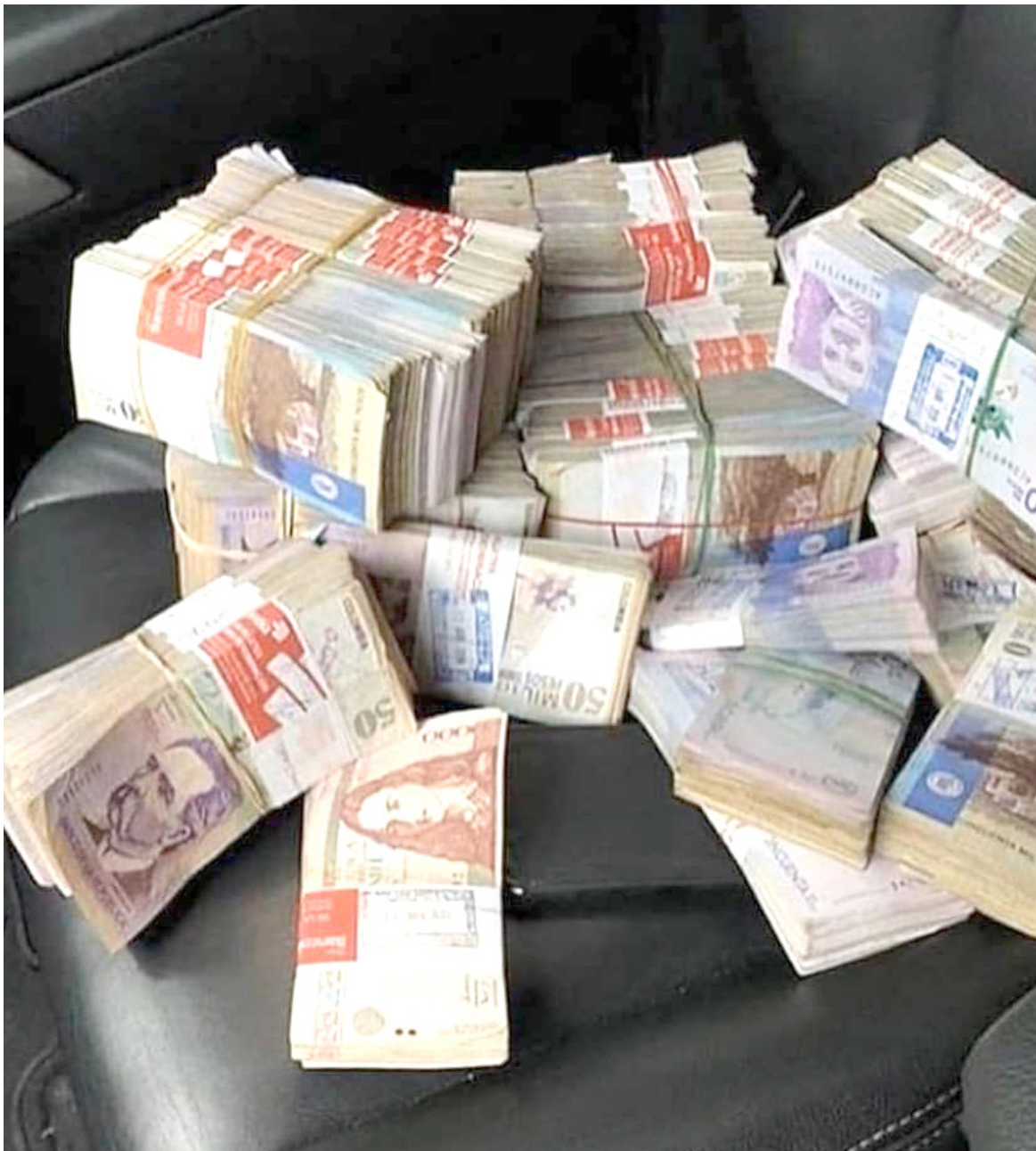
Solo el 15% de los acuerdos son incumplidos.

Asimismo, de estas obligaciones solo el 15% son incumplidas.