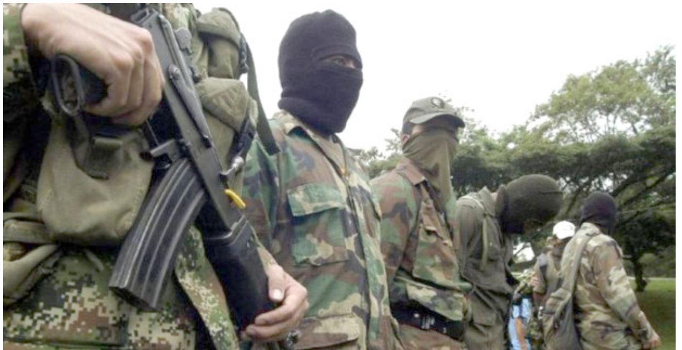
En zona rural de Neiva, solo haría presencia de disidencias del Estado Mayor Central.