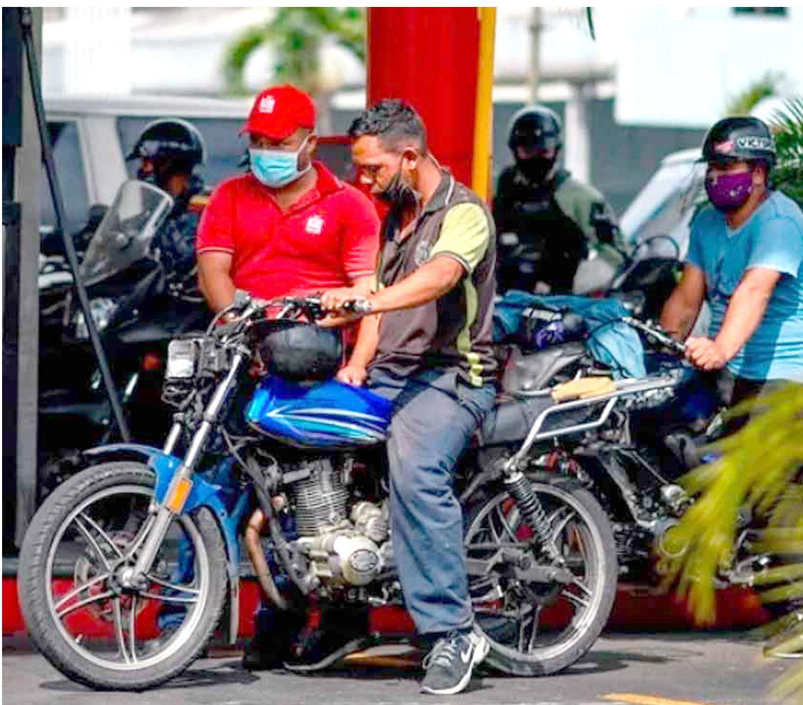
Se recomienda no acelerar innecesariamente para ahorrar la gasolina en una moto.

Entonces, mientras que el ministro Bonilla aseguró que "el ajuste de la gasolina ya está prácticamente cerrado", aún "queda la del precio de la gasolina a precio internacional y, a partir de entonces, los aumentos serán mínimos".