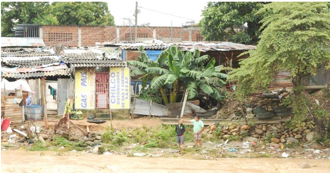
Este fenómeno se ve principalmente en los asentamientos humanos.

“Ellos siguen delinquirando, desde el municipio de Planadas, Tolima, que limita con nuestra región y en el corregimiento de Vegalarga, que es influenciada por el departamento del Caquetá. Ya en el municipio de Tello, si habrían campamentos”, agregó el secretario.