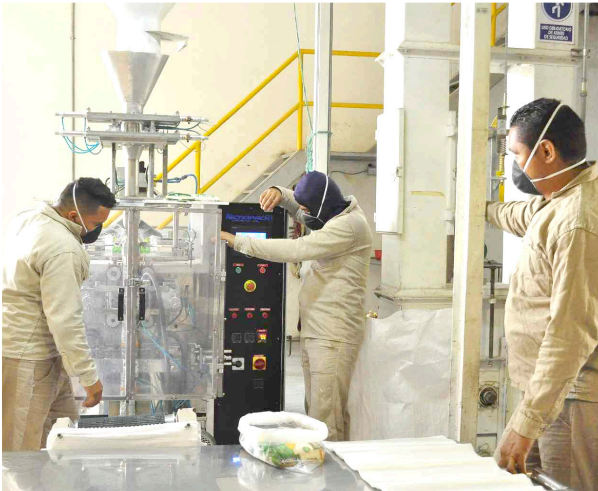
Aunque algunos sectores, como alojamiento y servicios de comida, han generado empleo, otros, como comercio y reparación de vehículos, industria manufacturera y actividades financieras, registraron notables contracciones.

niveles observados en octubre de 2017, antes de la pandemia, mientras que la de los hombres ha experimentado una recuperación más rápida, similar a los niveles de 2018.