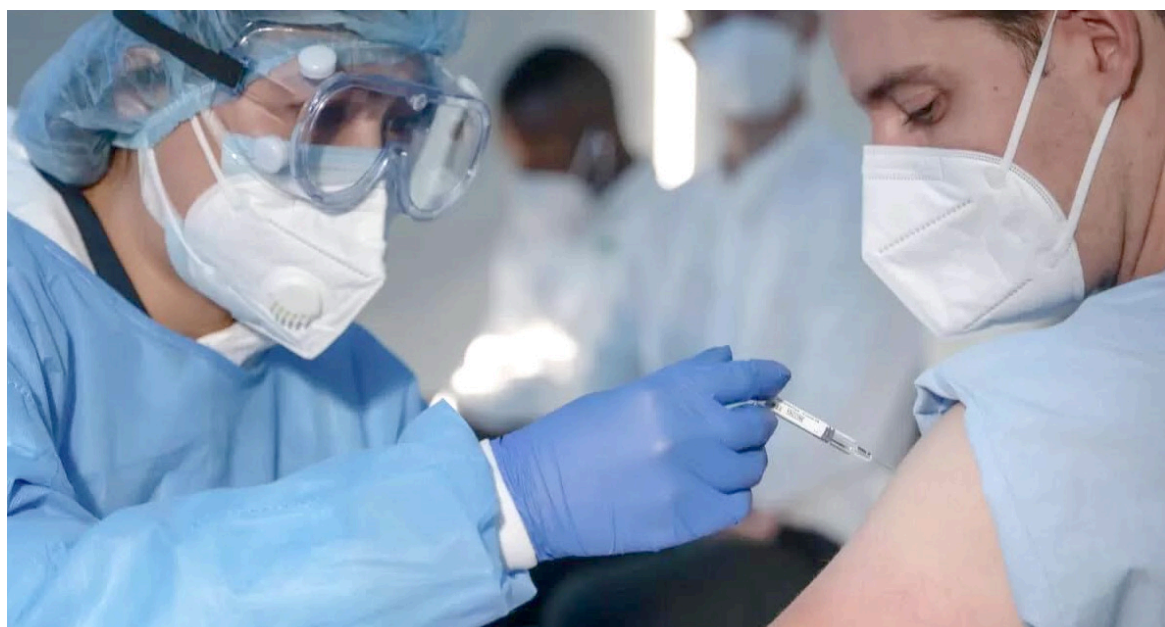
“En el caso de covid-19, dice Asocepic, las vacunas han demostrado ser altamente efectivas en los grupos de mayor vulnerabilidad como adultos mayores y personas con morbilidad crónica”.+

Sin embargo, la vacuna contra covid-19 que se administra actualmente en Colombia no es la más actualizada para tratar la enfermedad que ha evolucionado a nuevas variantes, distintas a la originaria, que desde China se propagó a todo el mundo en 2020. En total, 37.137.659 millones de colombianos cuentan con el esquema completo de esta vacuna.