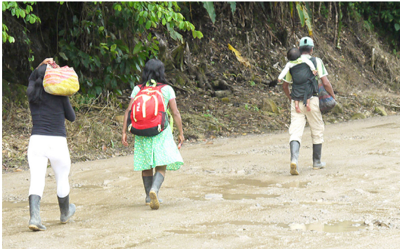
Desplazados estarían llegando a Neiva