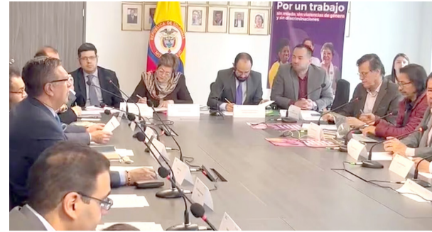
Este sería el tope al que llegaría el salario mínimo