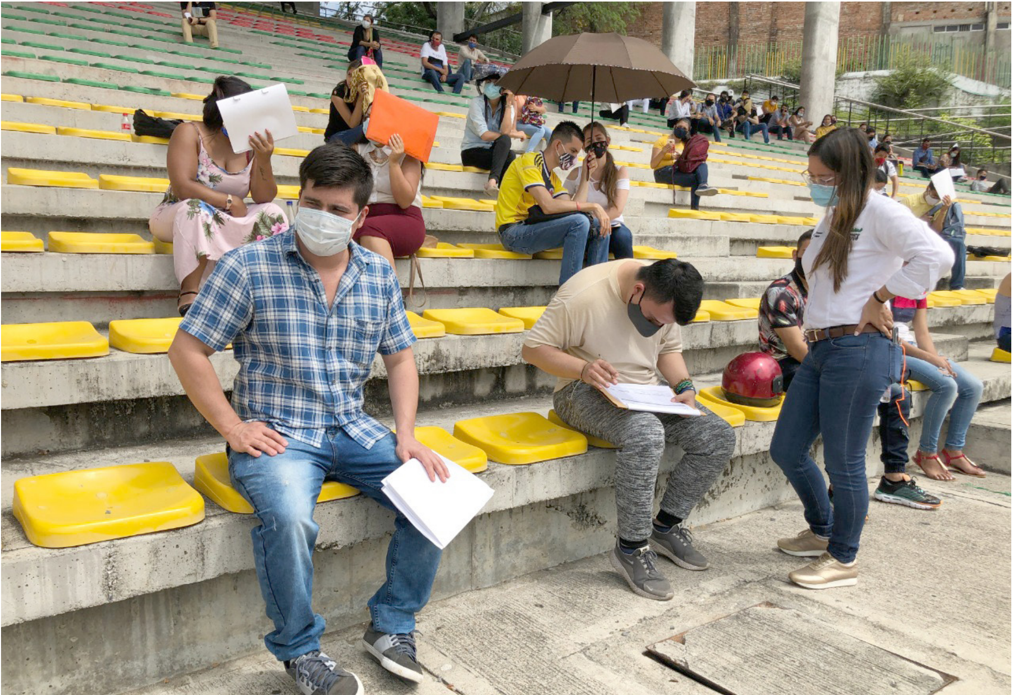
A pesar de que la tasa de desempleo en Colombia se mantiene en un solo dígito, Neiva destaca con una tasa del 12,2%, ubicándose como la sexta ciudad con más desempleados en el país.

■ La tasa de desempleo para el mes de octubre de 2023 se mantuvo en un solo dígito y con tendencia a la baja, al ubicarse en 9,2%, disminuyendo en 0,5% frente al mismo mes del año pasado, reveló el Departamento Administrativo Nacional de Estadísticas, DANE. Sin embargo, en Neiva se ubicó en 12,2% siendo la sexta ciudad del país con más desempleados.