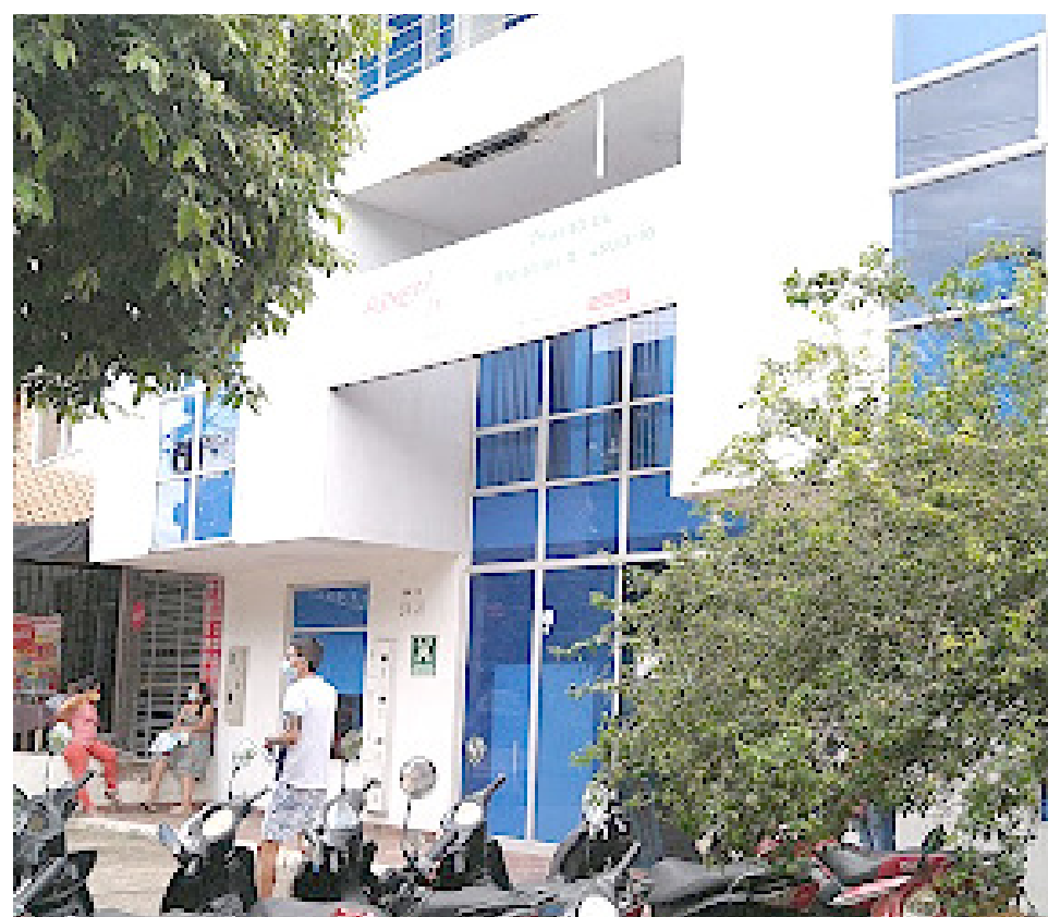
Esta EPS ha venido pagando sus obligaciones económicas.

complejidad y estos recursos serán direccionados para nuestro funcionamiento”, añadió la gerente.