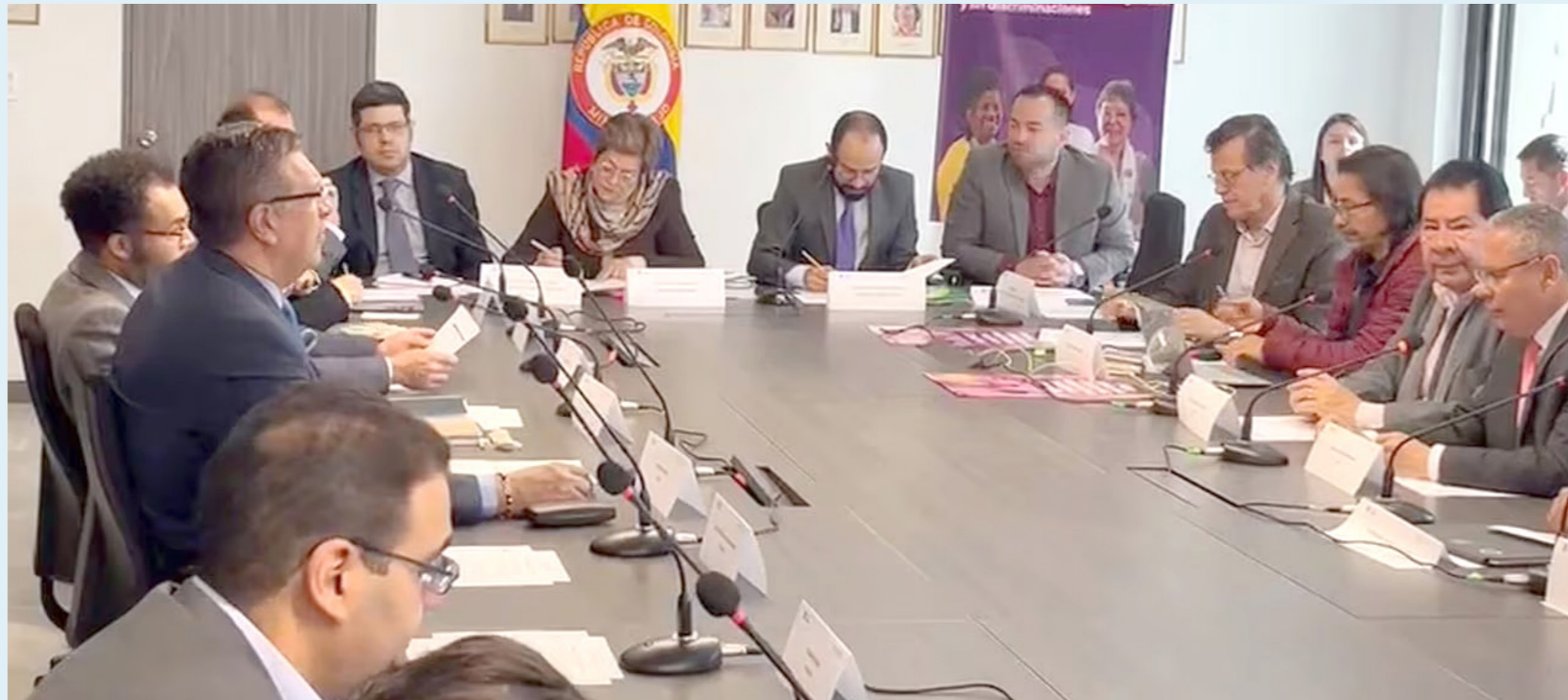
En diciembre inician las discusiones sobre el aumento del salario mínimo en Colombia.

"Esta variable que entraría en vigor a partir de enero o febrero de 2024, junto con el aumento confirmado que tendrán los peajes, impactará el precio de los alimentos, ya que su incremento afectará los fletes del transporte, costo que será trasladado al consumidor final", añadió.