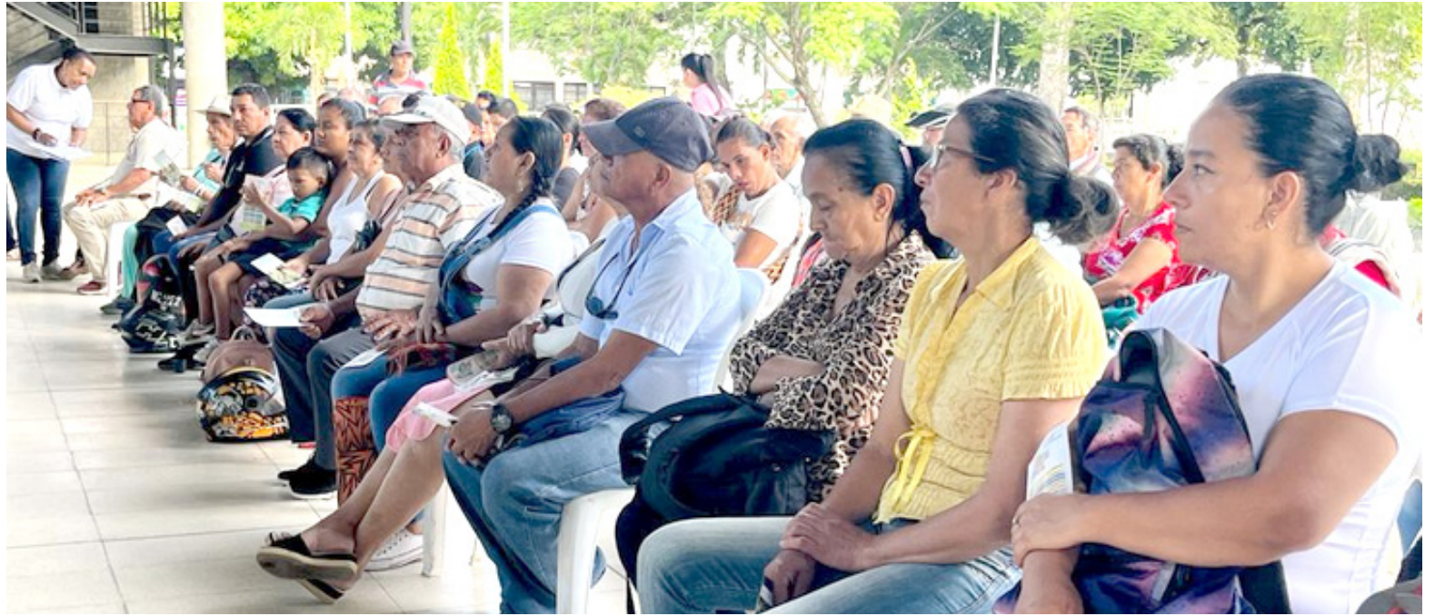
El 95% de las mujeres víctimas del conflicto armado, son por desplazamiento forzado.

“Ya con la legalización con el plan urbanístico, se pueden hacer los procesos de titulación, el pro-