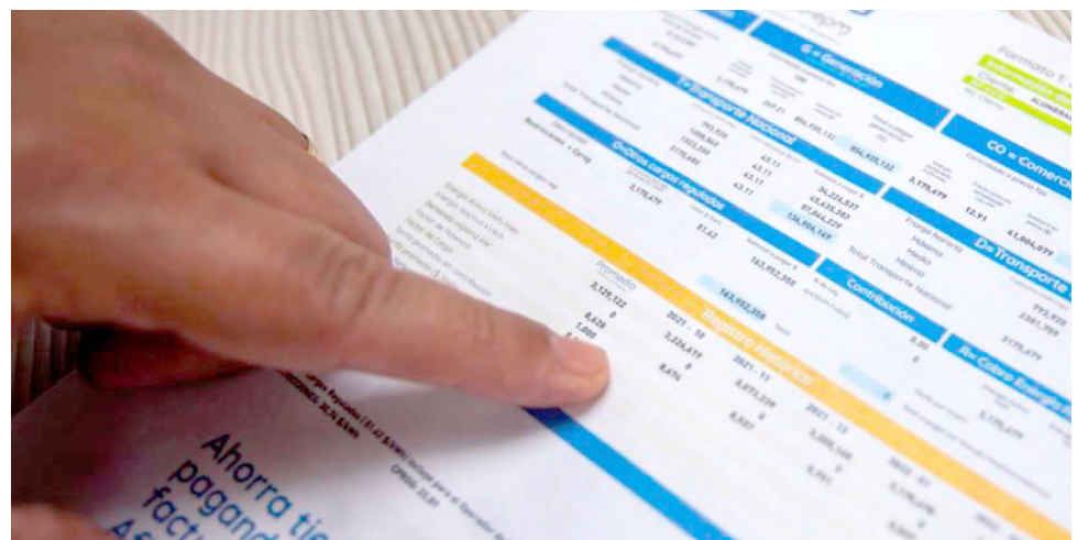
Se comienza a visualizar el aumento en la factura.

De acuerdo con la Unidad de Planeación Minero Energética (Upme), el resultado del Balance de Energía Útil en Colombia es que la energía útil representa tan sólo el 31 por ciento de la final y la ineficiencia en el consumo es