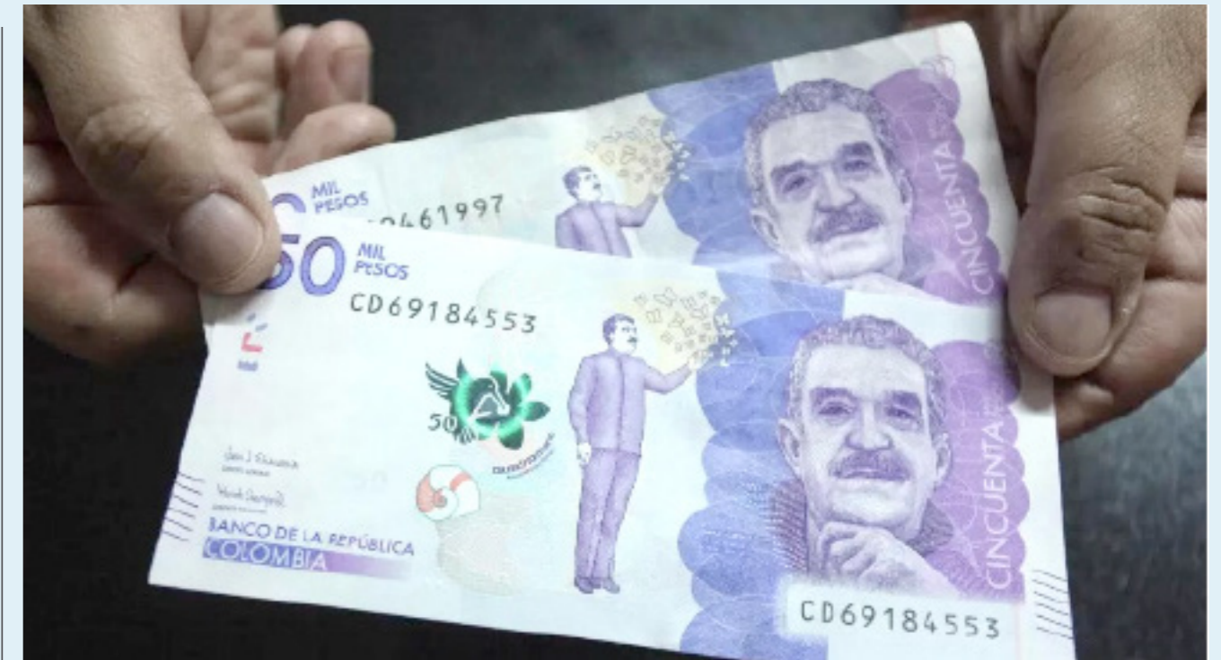
El aumento del salario mínimo estaría entre el 9 % y el 13 %.

El experto propone que, al fijar una cifra sobre este valor, sea el