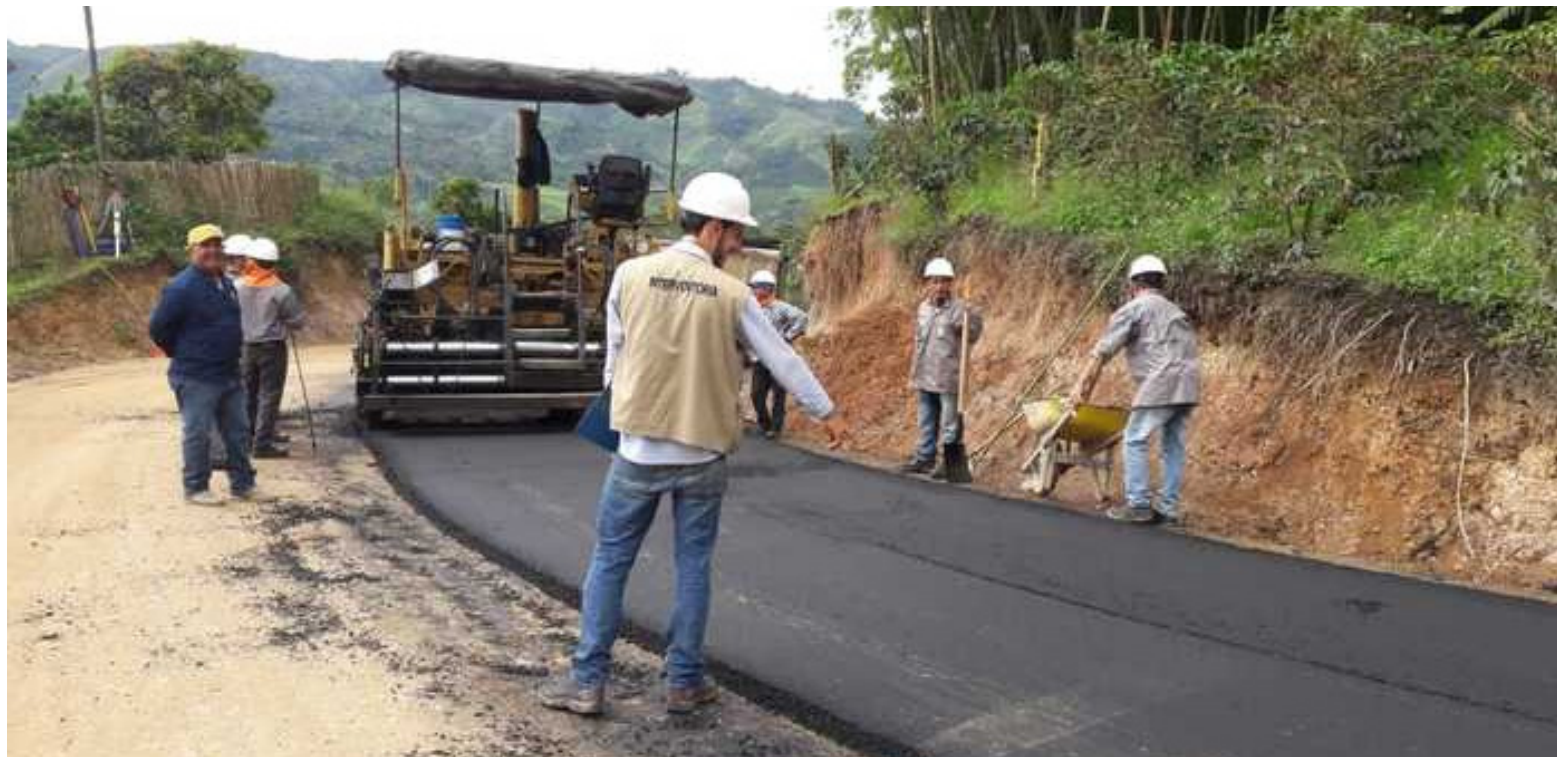
Los parlamentarios cuestionaron el flojo papel de las Interventorías.

las que estamos hablando, se empezaron en el año 2015, se han presentado fallas, desde los contratistas, del Gobierno Departamental, la iliquidez de la pasada sociedad constructora”, dijo el parlamentario.