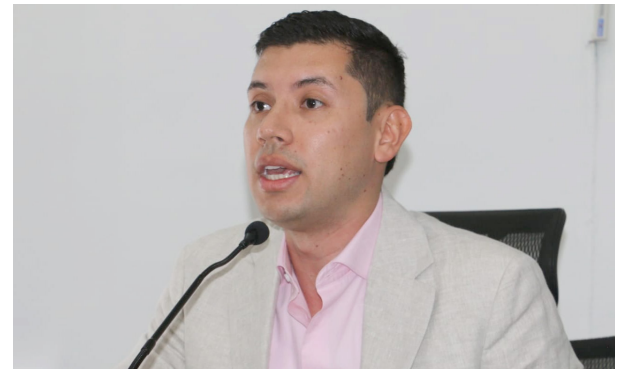
Personero fue posesionado