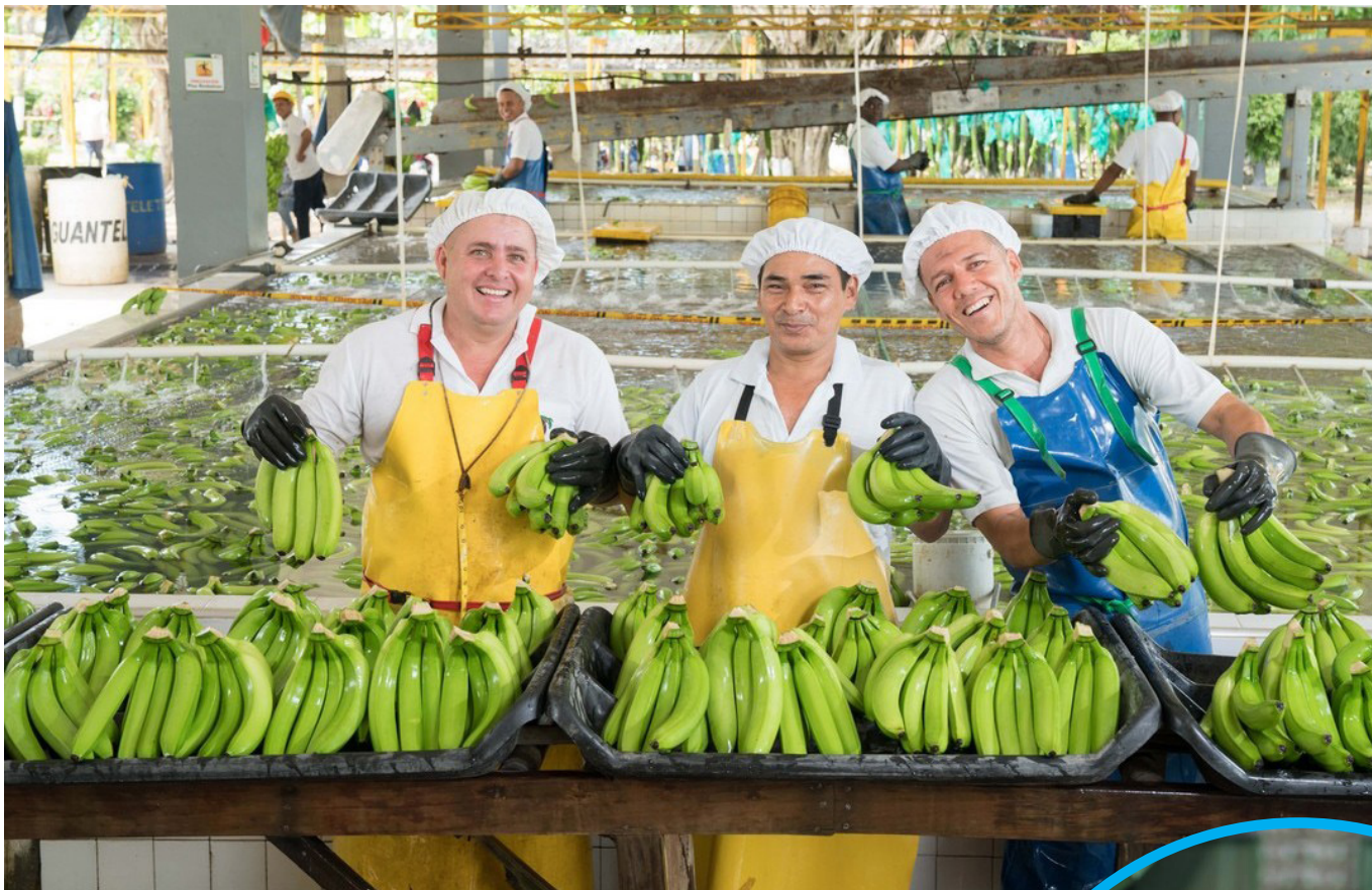
Actualmente, el país tiene un total de 43 millones de hectáreas cultivables.

■ Actualmente, el país tiene un total de 43 millones de hectáreas cultivables.