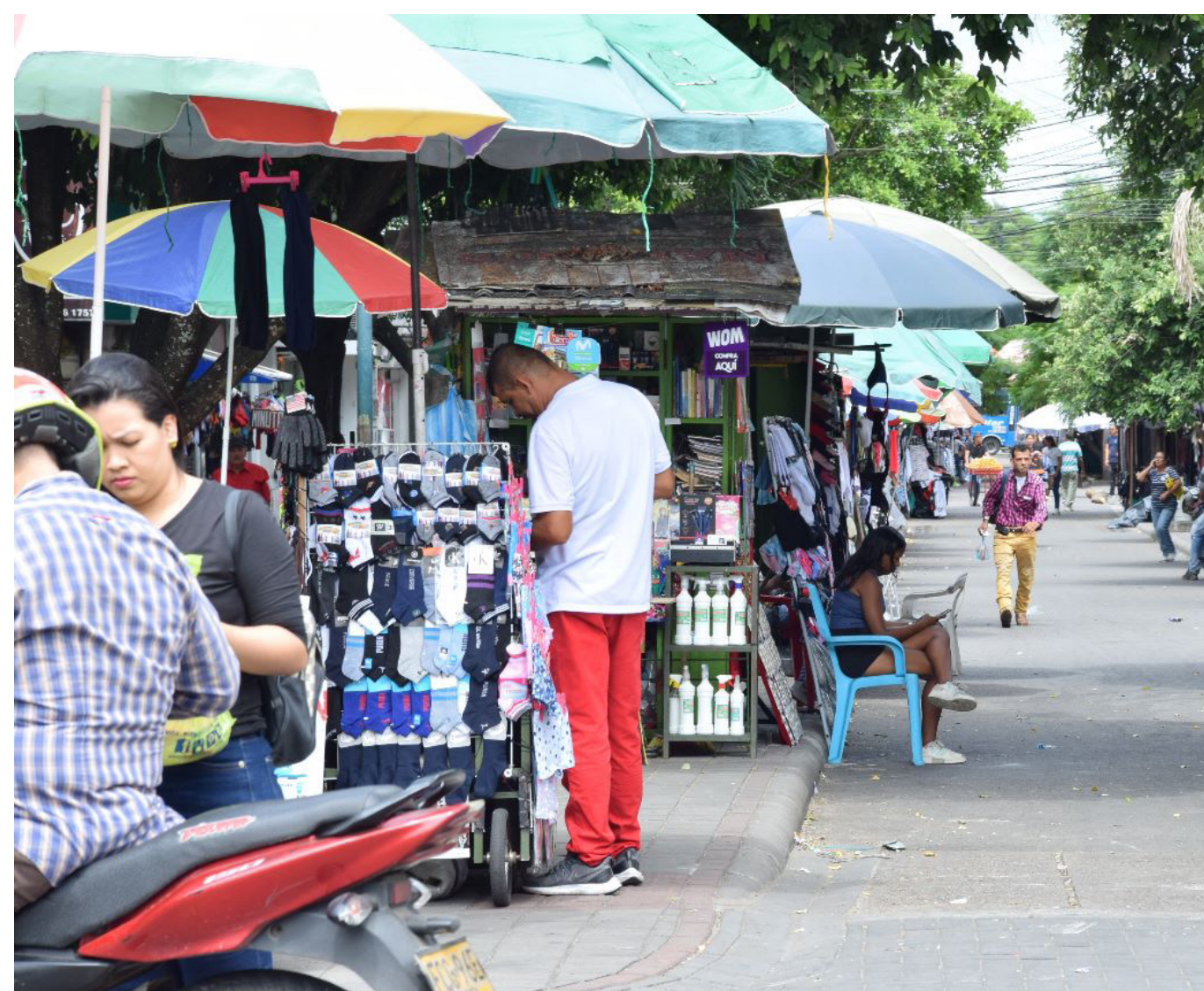
La tasa de desempleo en Colombia en septiembre fue de 10,7%.

Con el resultado de enero, aún faltarían 371.000 puestos de trabajo de los que se venían perdiendo desde agosto del año pasado, cuando había 23,2 millones de personas trabajando.