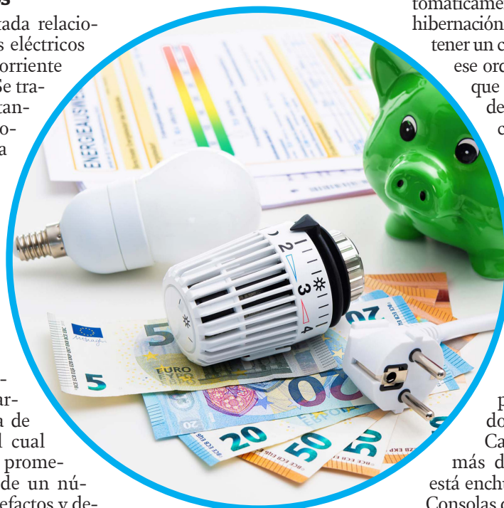
Los electrométricos pueden consumir energía a pesar de estar apagados.

Debido a la combinación de su función de generar calor por largos tiempos durante la cocción, se calcula que gasta entre 800 y 1.200 W por hora.