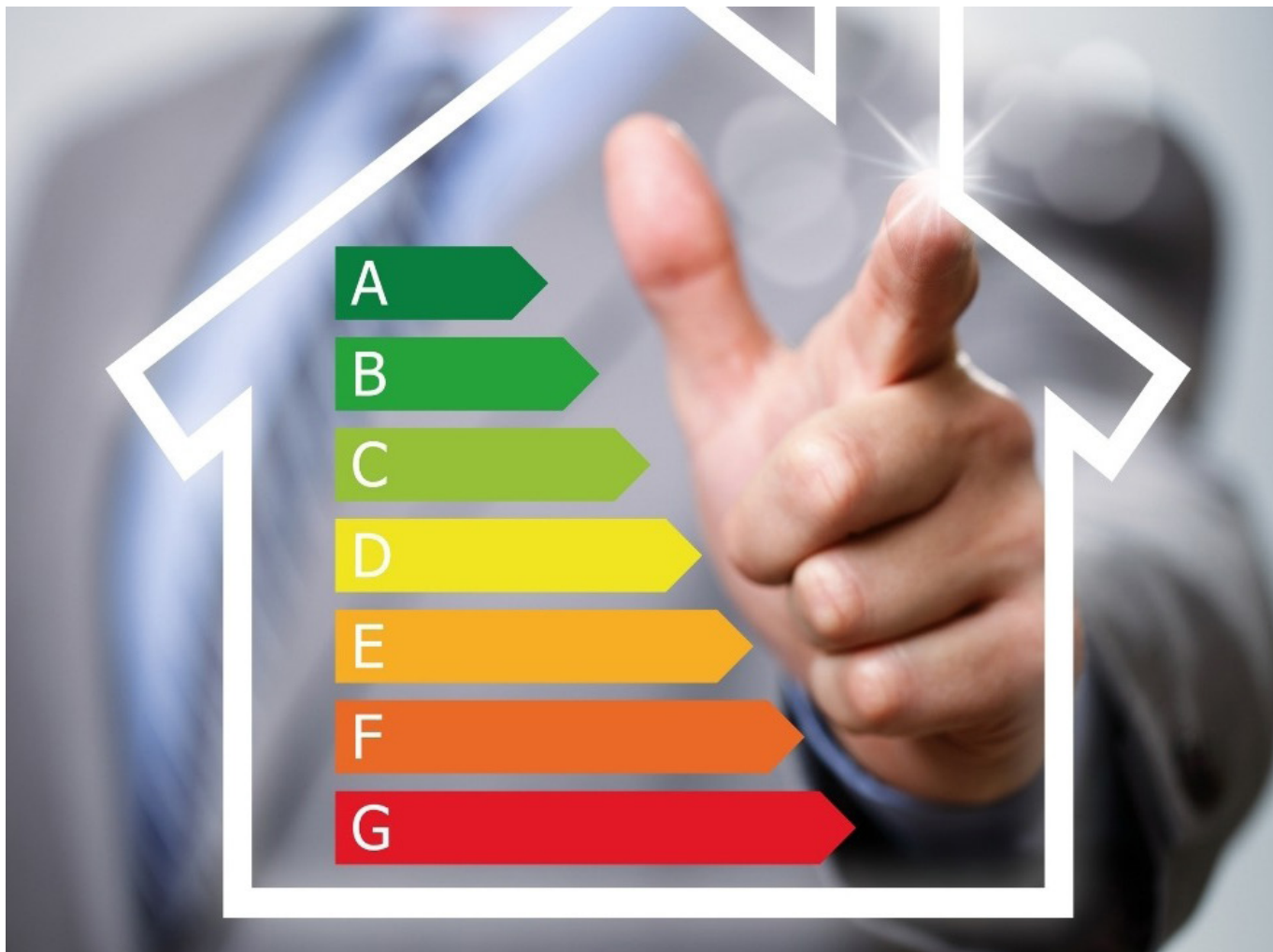
La recomendación principal para ahorrar luz es desconectar los electrodomésticos si no se están utilizando.

■ Pese a que estén apagados, ciertos electrométricos continúan consumiendo energía.