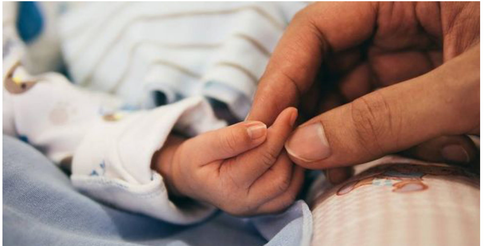
Según la Organización Mundial de la Salud, OMS, existen más de 7000 enfermedades raras.

De acuerdo con Gil, “las personas que padecen una enfermedad rara se están viendo afectadas por el incumplimiento en el giro de presupuestos máximos destinados a la salud. Sistemáticamente se vienen presentando retrasos con el pago de los presupuestos máximos, sin contar la insuficiencia de los recursos destinados para