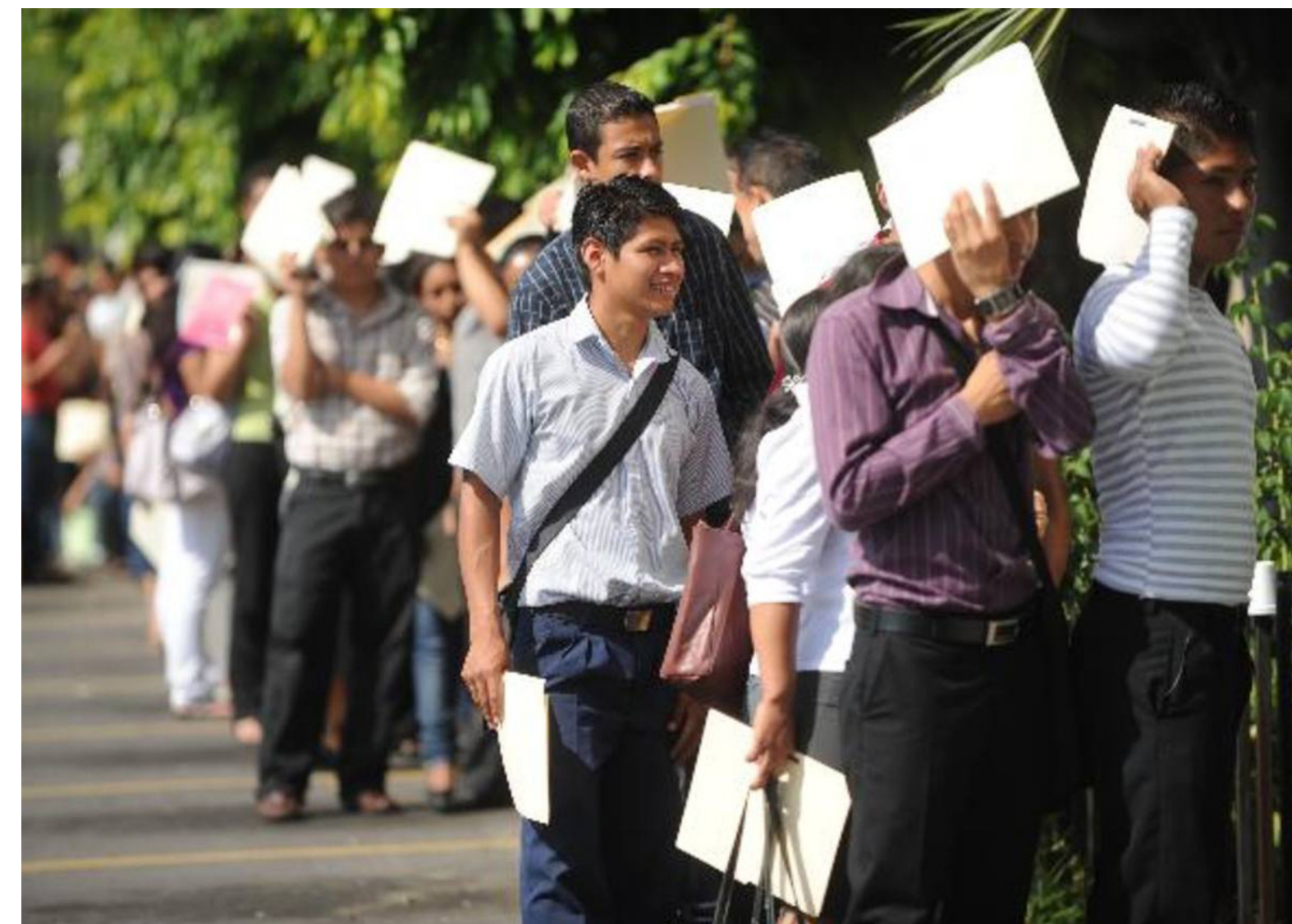
De acuerdo con Leonardo Trujillo, director del Dane, es usual que durante el primer mes del año se presente un pico de estacionalidad al alza en la tasa de desempleo del país.

El documento también vincula estas proyecciones labo-