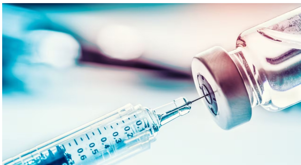
El sujeto puso en riesgo la vida de por lo menos tres personas.

“Nuestro llamado es a la toma de decisiones concretas que benefician a los pacientes de enfermedades raras, tanto de la sociedad como del Gobierno nacional, para que todos entendamos que las condiciones de vida no son las mismas para todos. El sistema de salud debe estar más preparado para dar diagnósticos acertados y asegurar el acceso a atención integral y tratamientos en tiempos oportunos”, finaliza Gil.