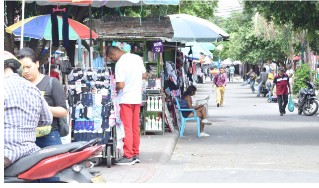
En enero el desempleo fue del 12,7%