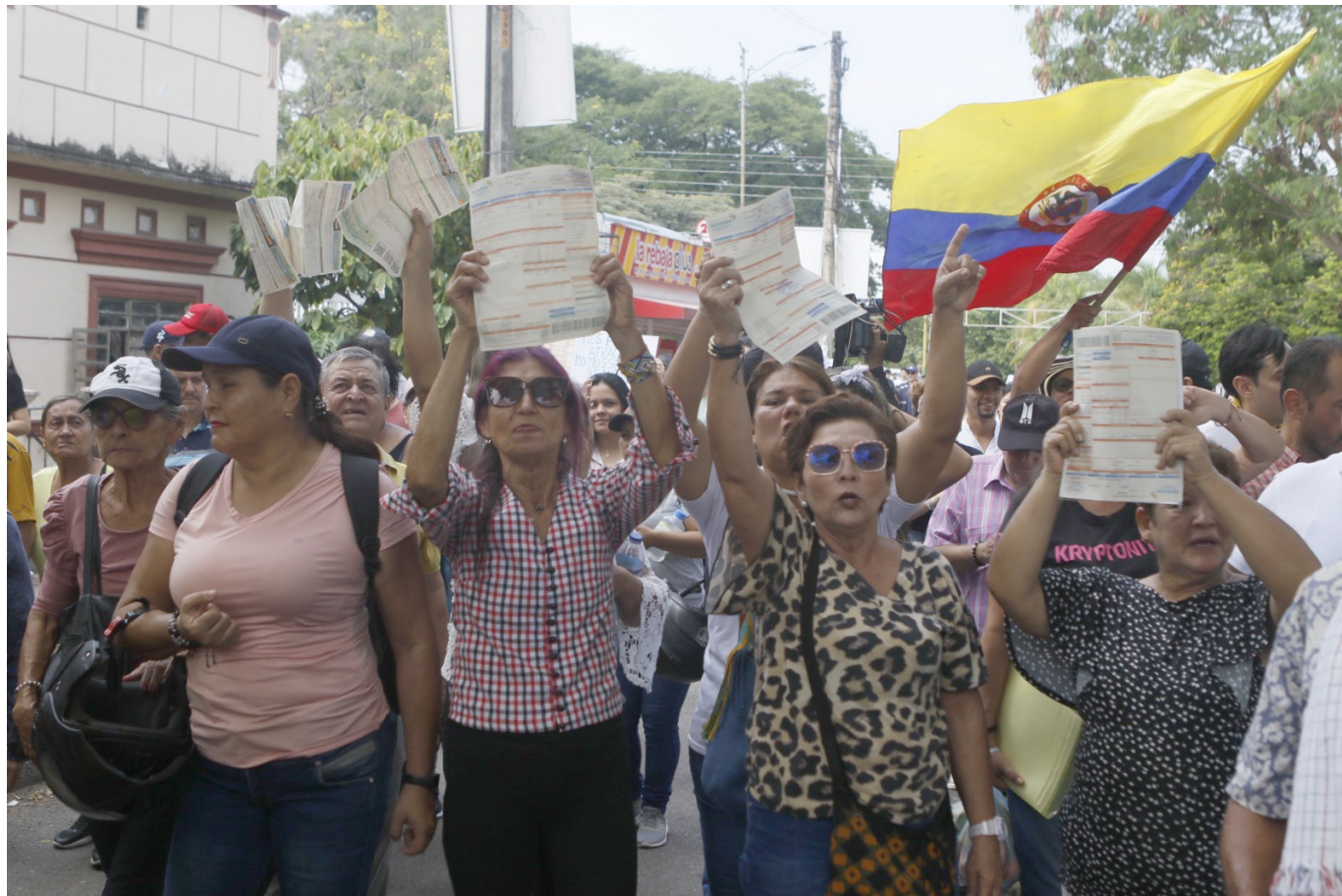
Manifestación realizada por la ciudadanía, el pasado 20 de febrero.