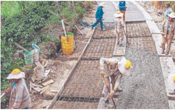
“Qué no se pierda la plata de las vías”