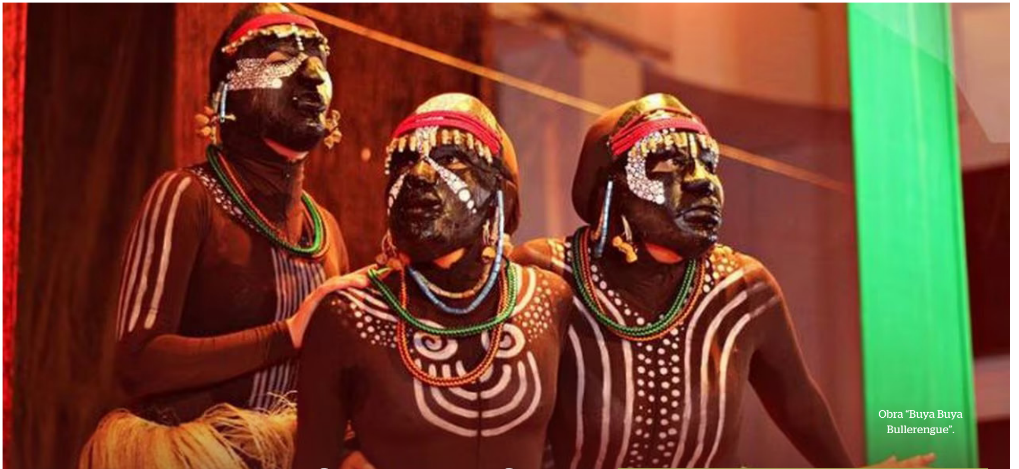
Obra "Buya Buya Bullerengue".