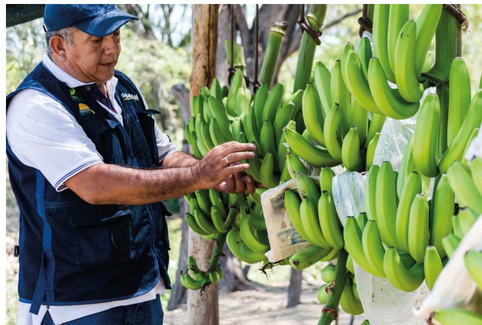
Dado que el banano es un cultivo importante para la seguridad alimentaria y los medios de vida de muchas comunidades en Colombia.