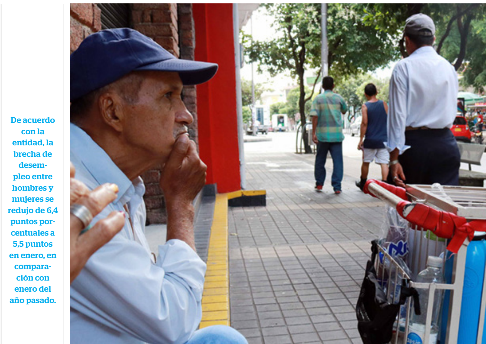
No obstante, el sector de Información y comunicaciones tuvo una disminución en el número de personas ocupadas.

De acuerdo con la entidad, la brecha de desempleo entre hombres y mujeres se redujo de 6,4 puntos porcentuales a 5,5 puntos en enero, en comparación con enero del año pasado.