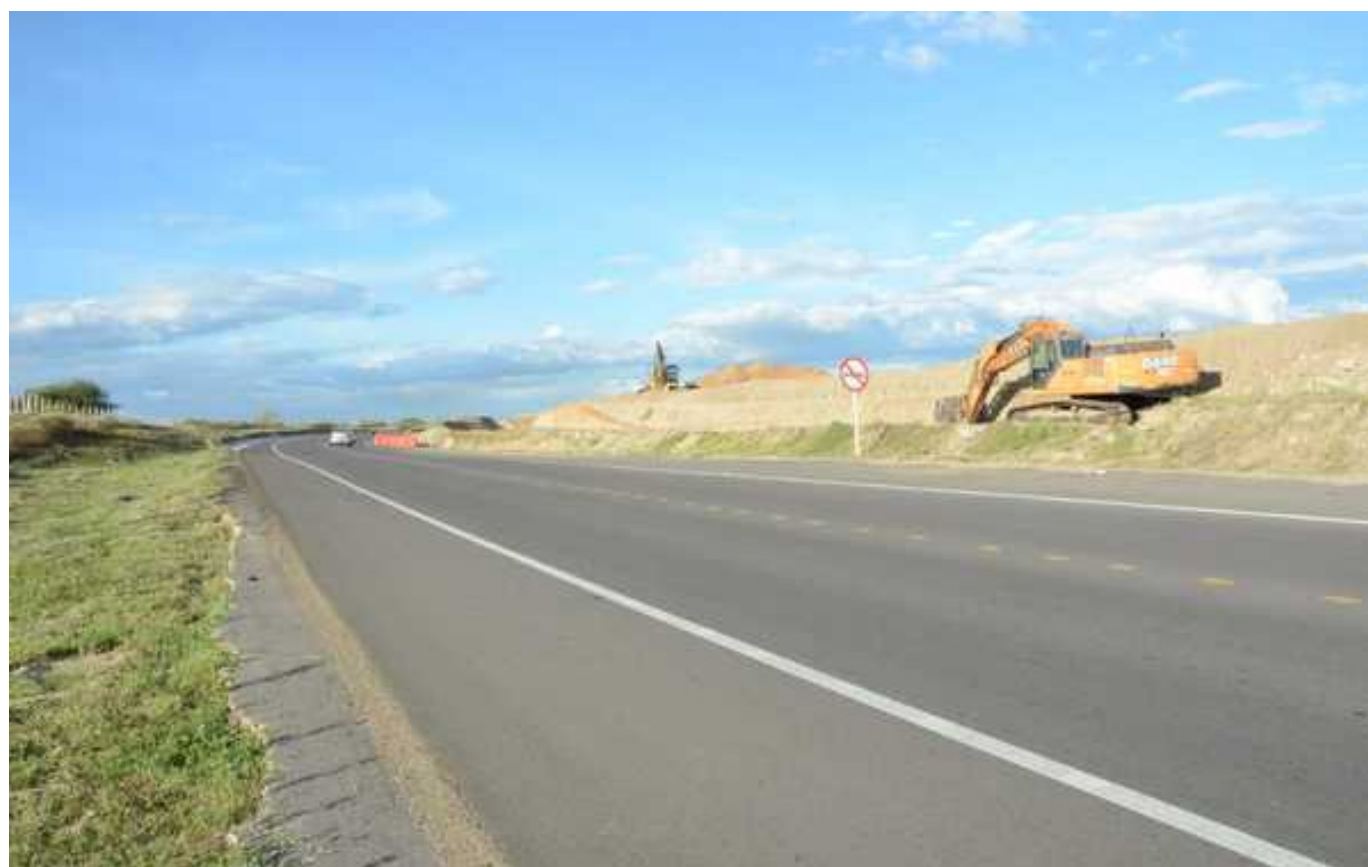
Una de las críticas es que no se hacen seguimiento a las obras y se desembolsa dinero adicional para culminarlas.