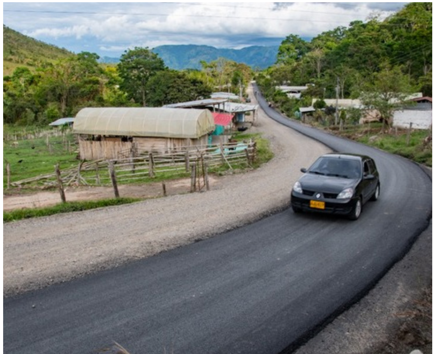
Del Anillo Turístico del Sur, aún faltan tres tramos por hacer y fue un proyecto que inició en el año 2013.