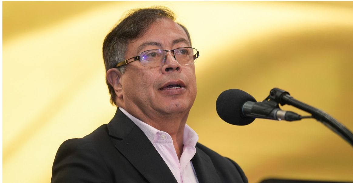
Dirigentes políticos planean reunirse con el presidente, Gustavo Petro.