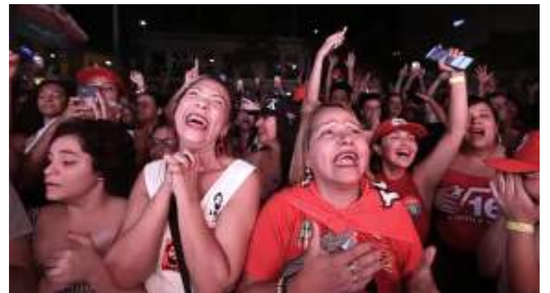
La emoción de algunas personas no se hizo esperar.

Pero al parecer estas palabras para algunos ciudadanos no son suficientes ya que durante la jornada se protagonizó un hecho violento en Belo Horizonte, capital de Minas Gerais, un hombre disparó a un grupo de seguidores de Lula da Silva y mató, según esta organización, a un hombre e hirió a otras cuatro personas.