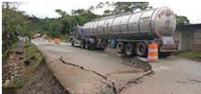
Timaná adopta nuevas medidas de movilidad