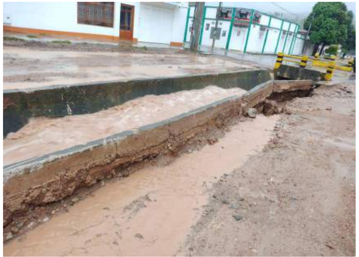
Estado actual del Zanjón.

El mandatario local aseguró que no es una medida de un día para otro, puesto que; hace aproximadamente 15 días atrás manifestó su preocupación a las autoridades pertinentes y pidió la ayuda regional y nacional a la Unidad Nacional de la Gestión de Riesgos de Desastres.