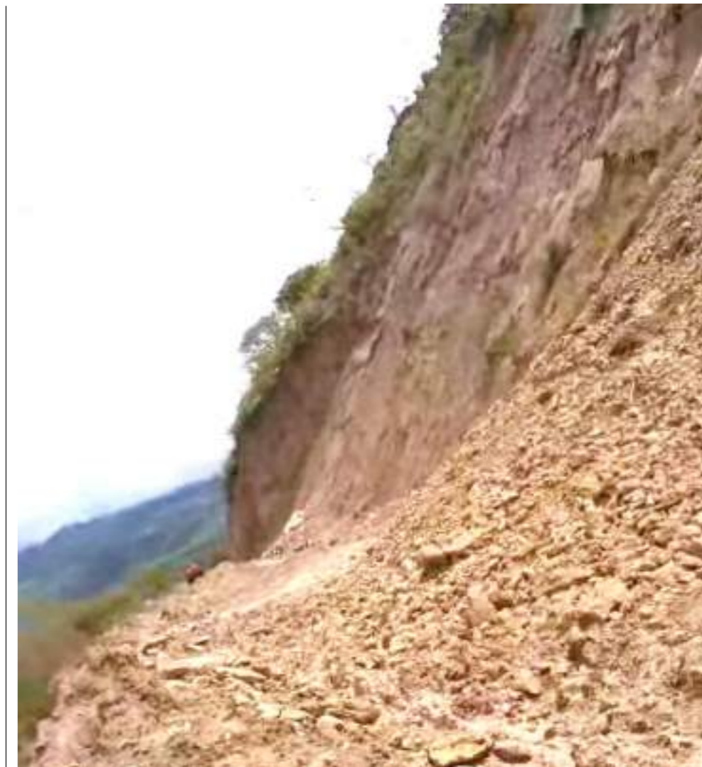
También se suma el riesgo permanente de derrumbes.

“Es una afectación de río Cabrera sobre la banca de la vía que de Colombia conduce a Santa Ana ubicado sobre el sector Las Palmas, donde se perdió la banca por socavación del río”, se indicó.