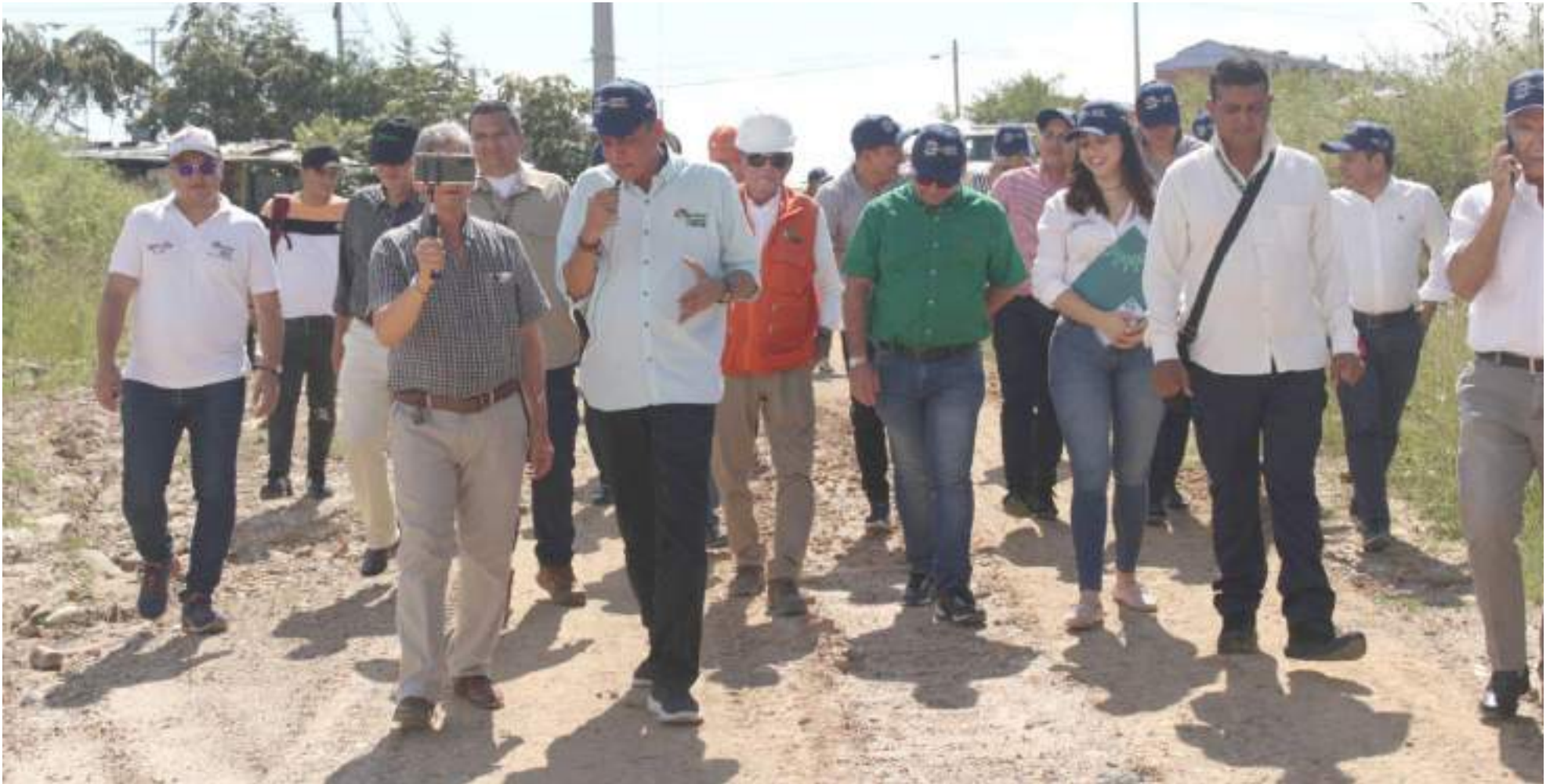
Al recorrido de seis obras fueron invitados los concejales, medios de comunicación y ciudadanos.