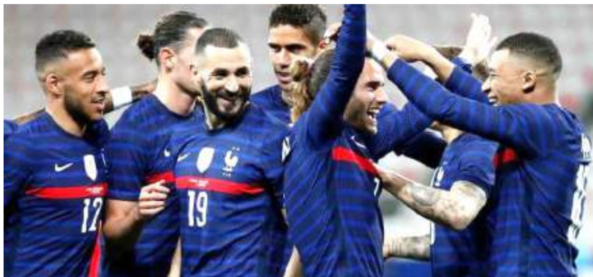
El campeón Francia sigue sufriendo bajas de cara al Mundial.

Vale decir que las federaciones miembros de la FIFA deben es-