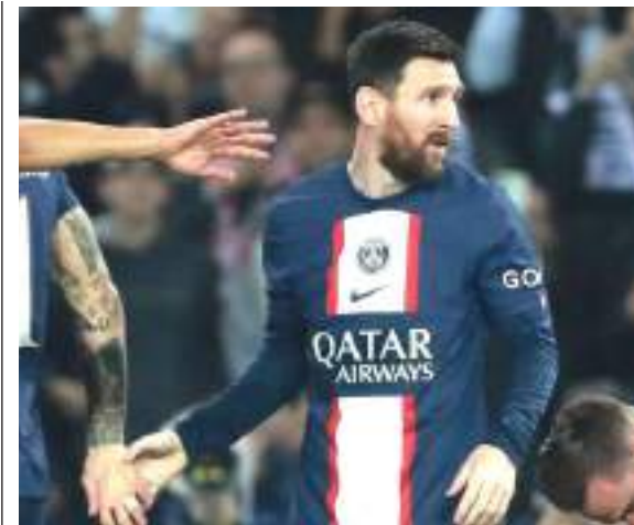
Lionel Messi una de las cartas de Suramérica en el Mundial con Argentina

Pogba, de 29 años, luchó con una lesión en el menisco derecho que le impidió estar disponible para Juventus y también para Francia. Y justo cuando se pensaba que se recuperaría, vino un nuevo problema físico.