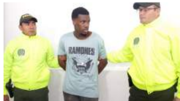
¡A la cárcel!