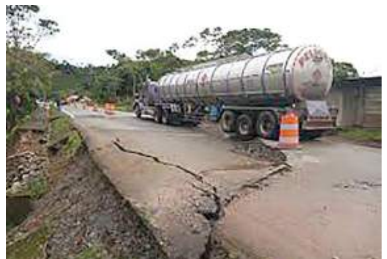
No podrán circular los carros pesados para evitar mayores daños en la vía.

De igual manera, habitantes del municipio de Timaná como