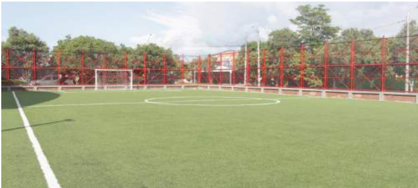
"No nos estamos robando la plata, las obras si están en ejecución": Gorky Muñoz

talación de redes de acueducto, alcantarillado y aguas lluvias; con un avance del 95%, y $2.900 millones en la proyección de la vía, con un avance del 50%.