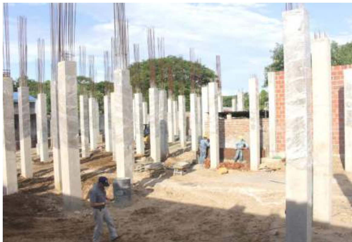
Fueron los seis puntos que se visitaron con el propósito de conceder el panorama de aquellas obras.

Esta institución que actualmente no es funcionales dadas sus precarias condiciones es una de las