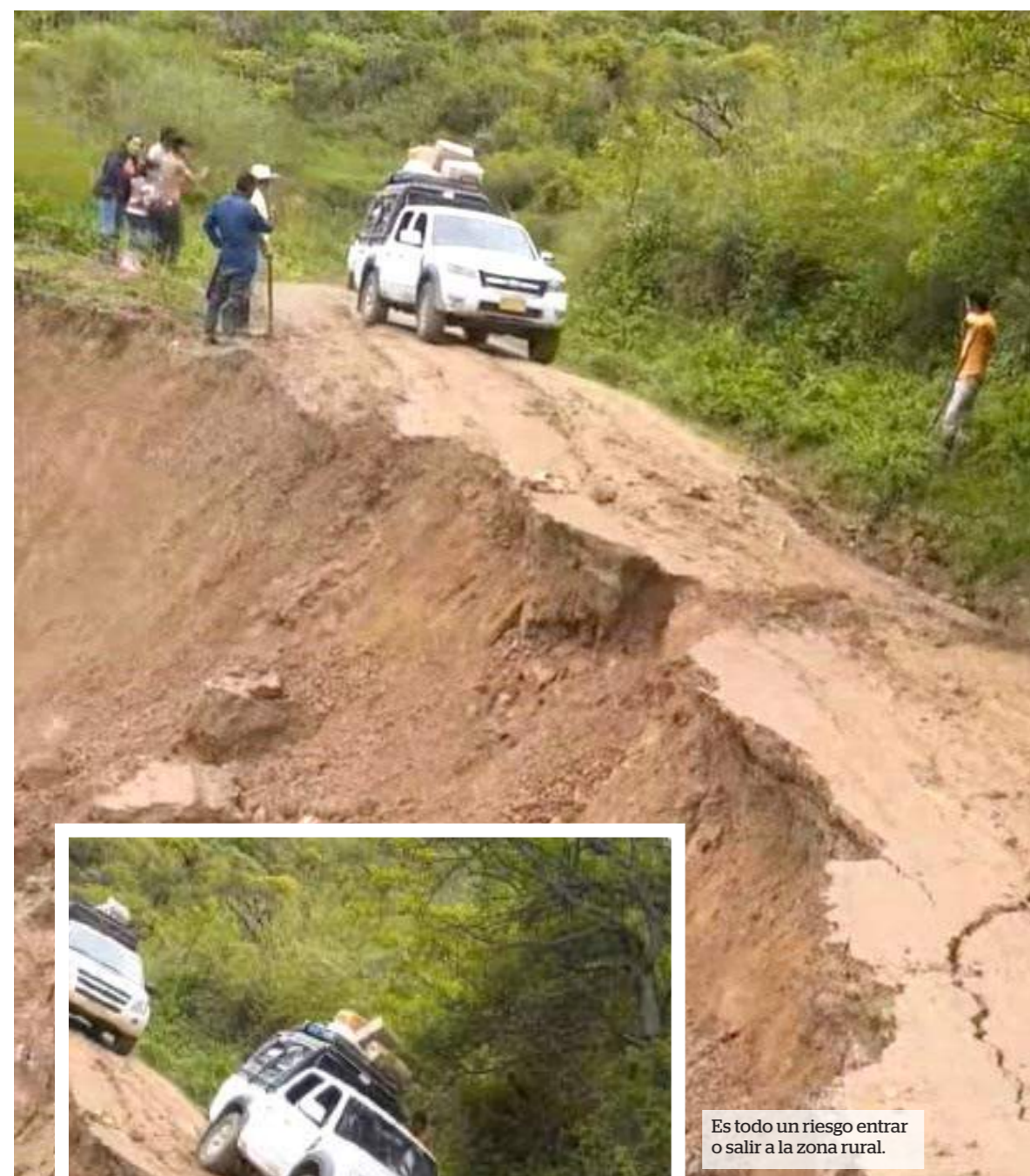
Es todo un riesgo entrar o salir a la zona rural.

DIARIO DEL HUILA, HUILA Por: Hernán Guillermo Galindo M