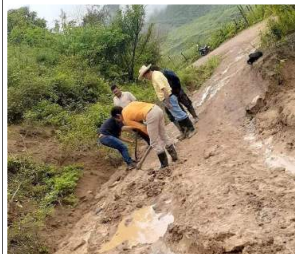
Para poder garantizar el paso los propios campesinos y habitantes hacen arreglos parciales

Sobre la emergencia generada por la pérdida de la banca también se indicó qué conocimiento se tiene sobre el particular; “Eso sucedió el día de ayer, la entidad se encuentra planeando la logística para atender de manera prioritaria y solucionar el tránsito vehículos que se encuentra suspendido. El problema que se tiene en el momento son las fuertes lluvias que impiden atender de manera inmediata la reparación del tramo vial”, manifestó el vocero.