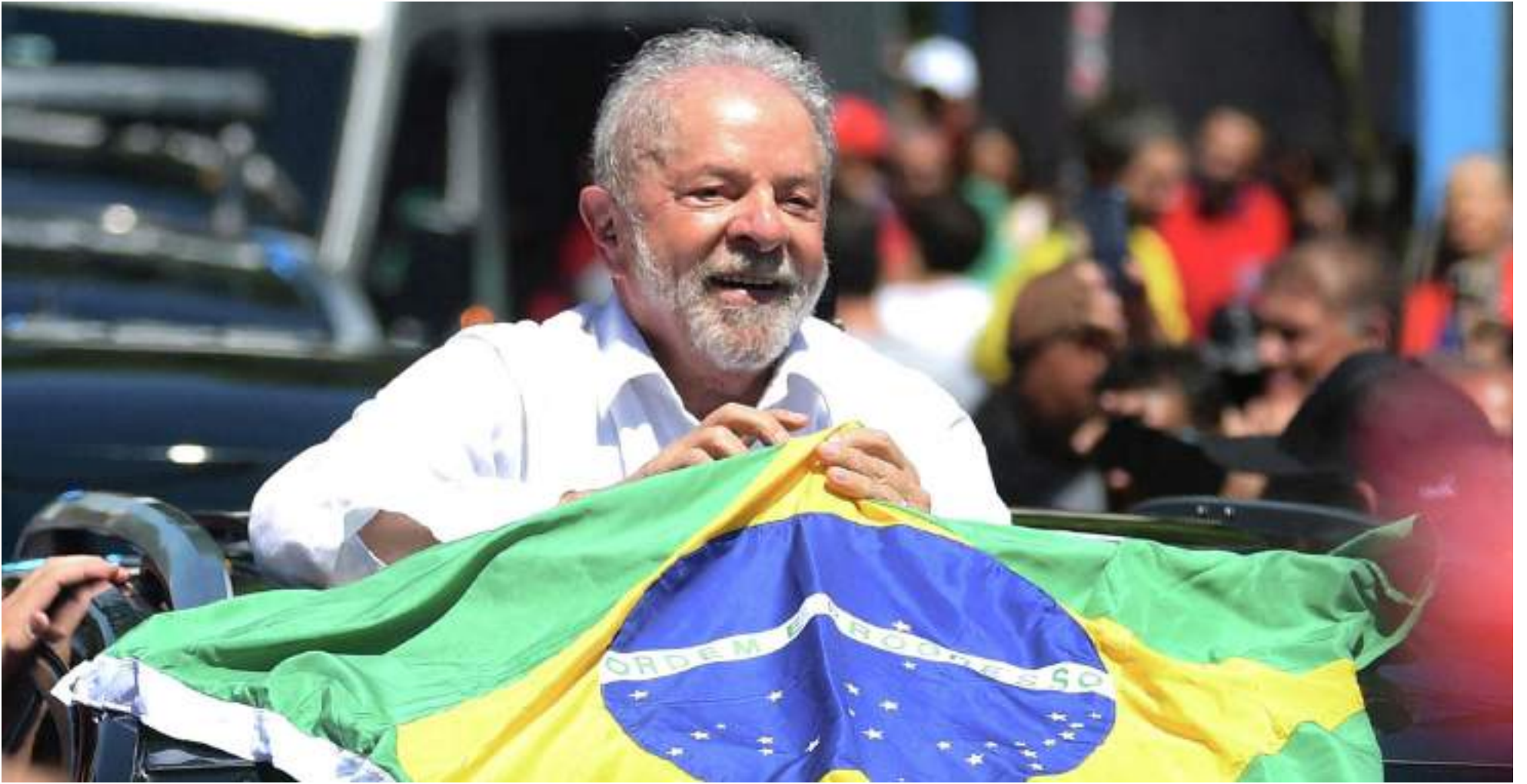
Brasil con Lula se volcará "hacia la integración regional".