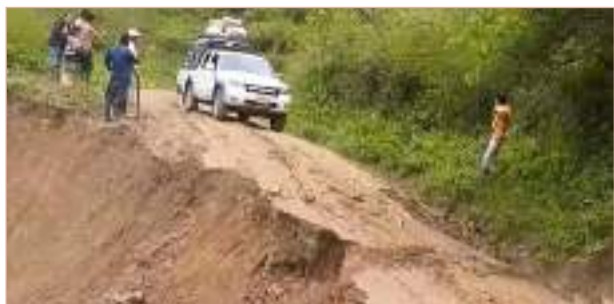
Colombia- Huila a punto de quedar incomunicada