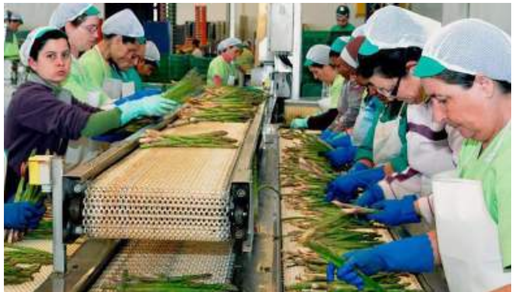
Las mujeres se inclinan por la ocupación en oficios varios.