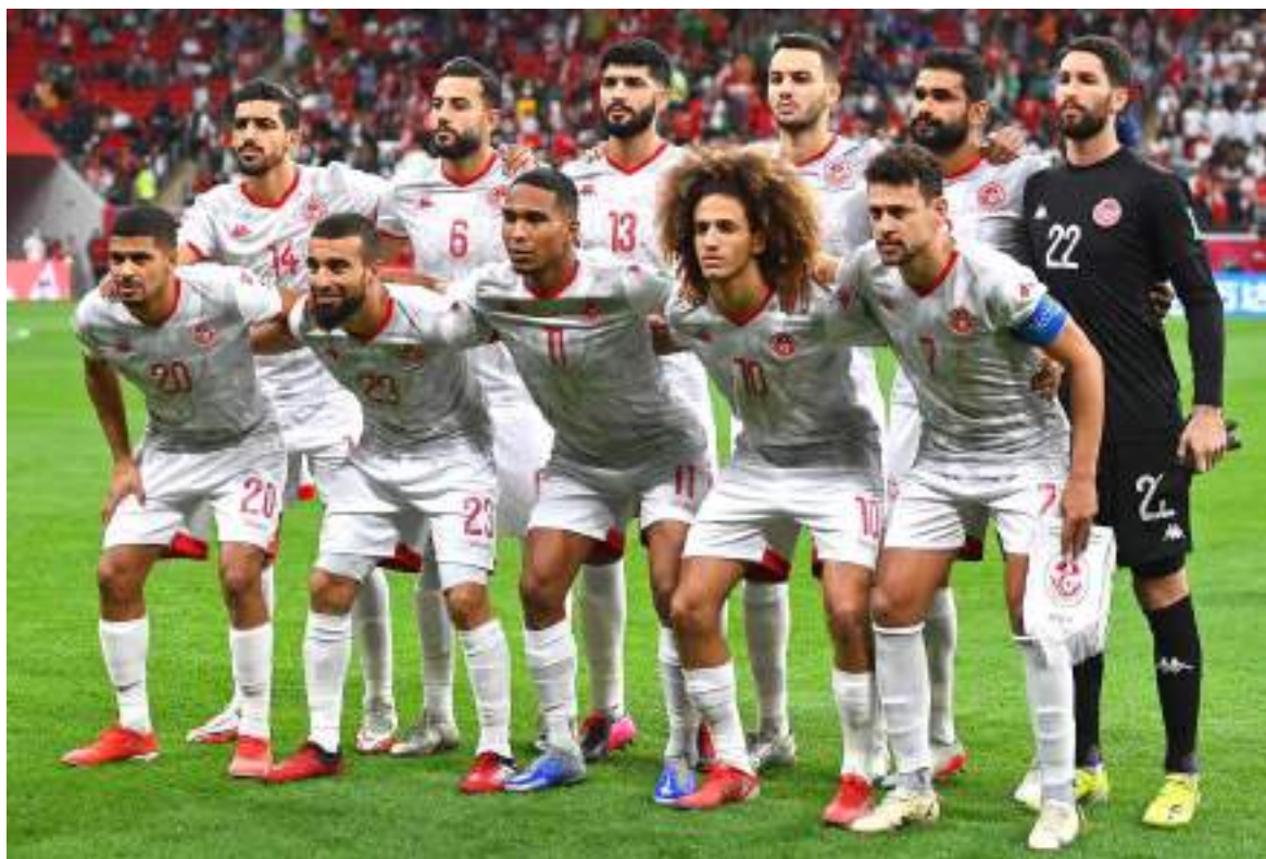
Túnez se podría perder el Mundial por intervención del Estado en asuntos de la Federación

Estos son solo tres momentos difíciles para los protagonistas del Mundial de Catar que se pondrá en marcha el 20 de noviembre con la ausencia de Colombia que se quedó en el camino clasificatorio