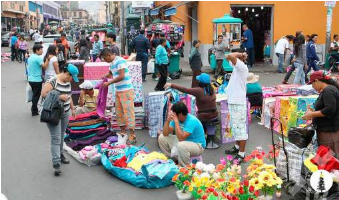
La informalidad en Colombia sigue siendo alta.

Las ciudades que registraron las mayores tasas de desempleo fueron Quibdó e Ibagué, con 25,0% y 18,1%, respectivamente.