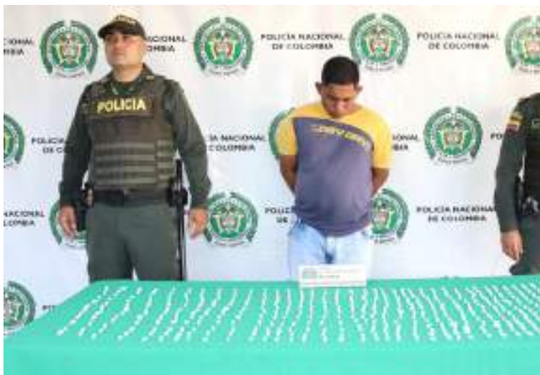
Capturado reconocido expendedor de estupefacientes.