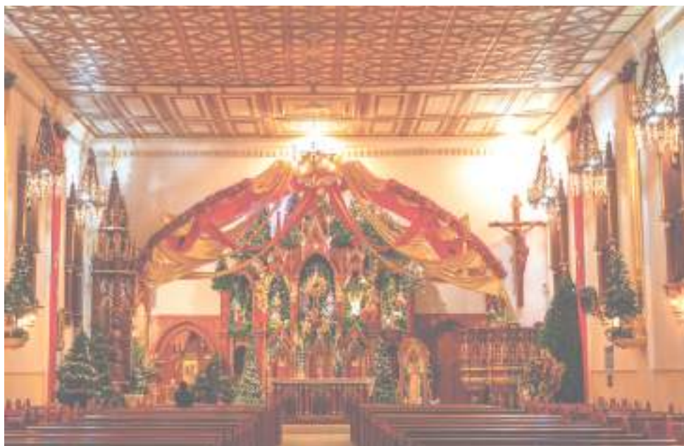
El pasado 7 de diciembre; día de velitas, se prendió la navidad oficialmente.

En otras palabras, es un pesebre con animales y personajes vivos, quienes le dan más realismo a la propuesta. Anudado a eso, en el pesebre del templo es al estilo napolitano que se ha elaborado con puros pinos. Con el mismo se busca el rescate de la vegetación y de la riqueza natural del macizo colombiano. “En el pesebre tenemos animales de corral y realmente lo que se quiere es retomar esas escenas con personajes y animales vivos. Esto es un trabajo articulado con comerciantes y gremios del municipio”, concluyó.