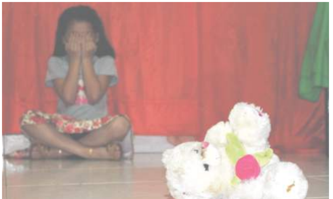
Aunque sea difícil de creer los asesinatos y agresiones dentro de las familias es el 'pan' de todos los días en muchos contextos del país.

"Lo que se tiene en cuenta para investigar bajo estas líneas, el concepto es la afiliación sanguínea y