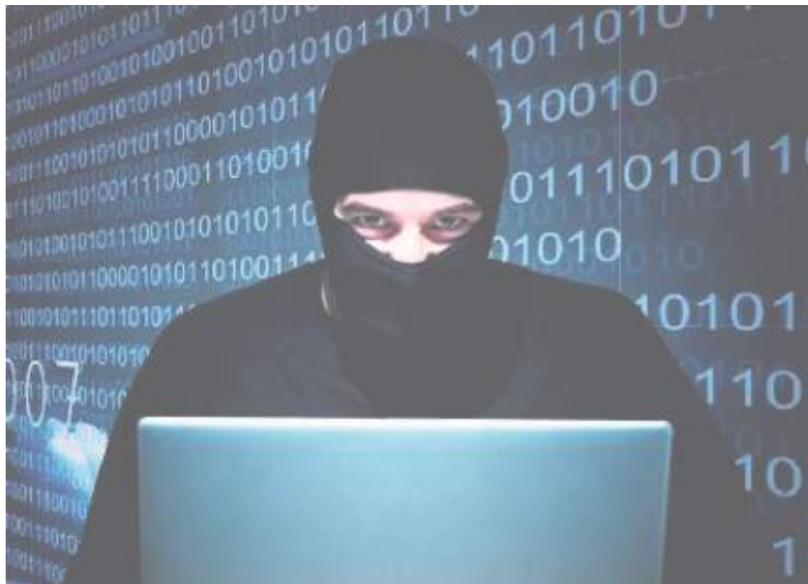
La ciberextorsión está en aumento en el Huila, las autoridades alertan a los ciudadanos.

Actualmente han sido detectadas dos páginas web utilizadas por los opitas para solicitar servicios sexuales, estas son mile-