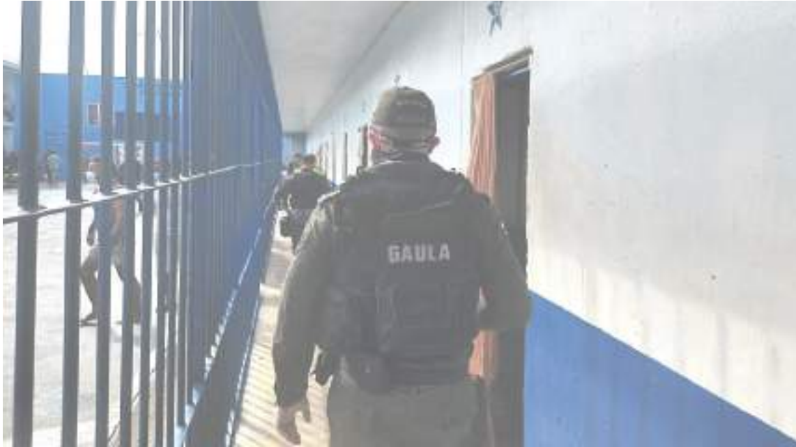
Las autoridades colombianas también han detectado esta práctica en pymes; empresas pequeñas que no cuentan con un debido soporte de seguridad y que son blanco fácil de los delincuentes.