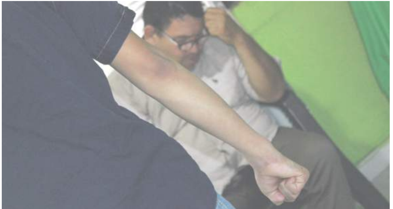
En 18 de los 37 municipios han existido este tipo de hechos.

Frente a la importancia que se le da a este tipo de denunciar, el