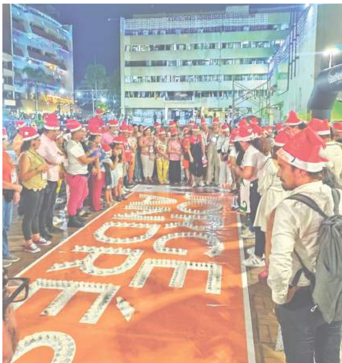
Cientos de personas participaron en el evento.

A parte de aportar a la reactivación económica, el festival se convirtió en un espacio seguro para compartir con la familia.