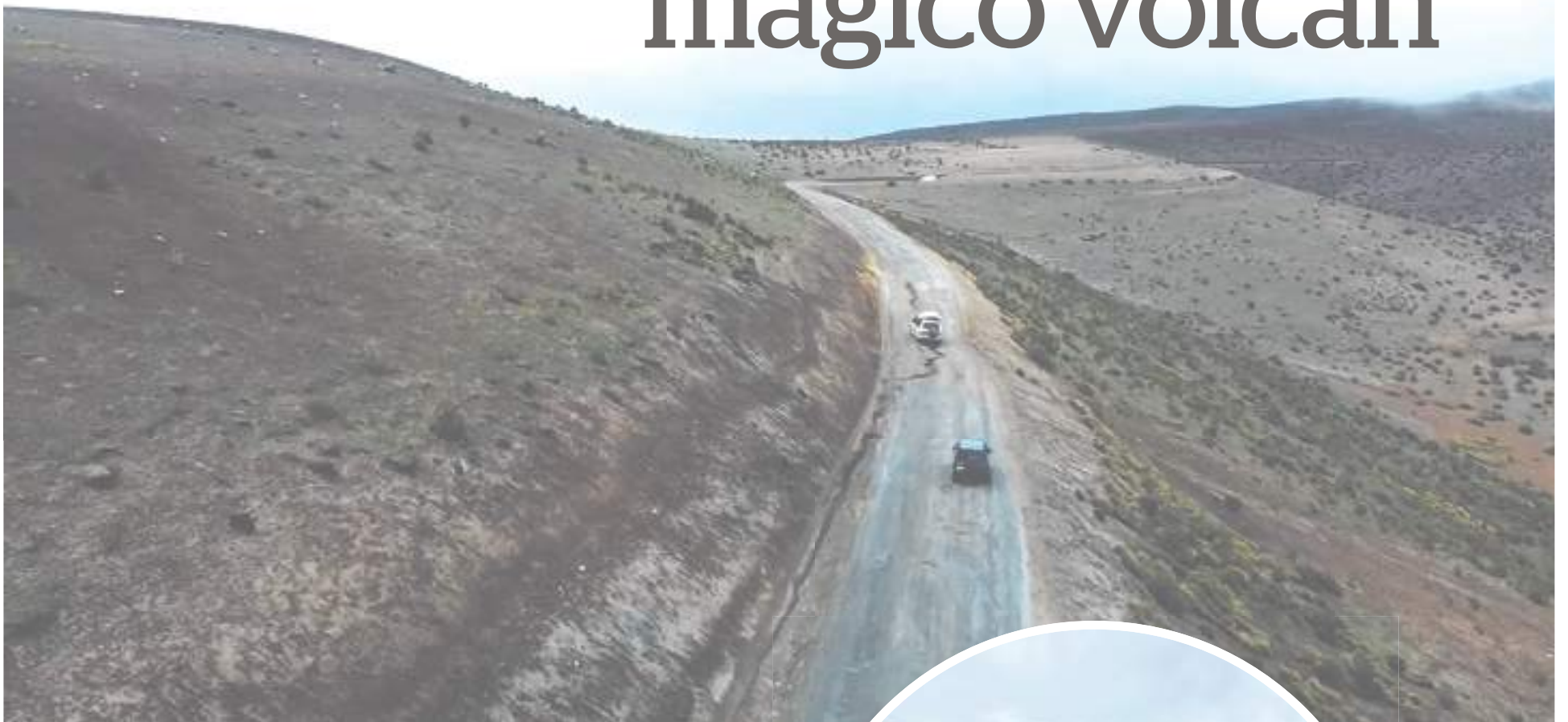
Camino al que sería nuestro destino.