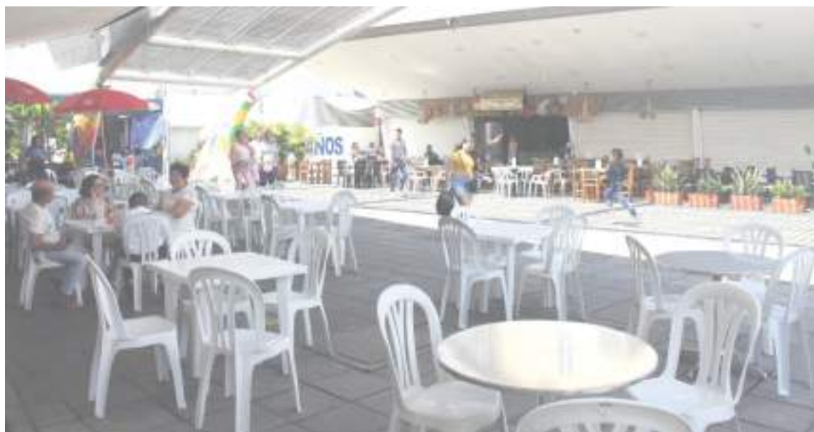
Plazoleta de comidas con tan solo seis negocios abiertos.

Se ha buscado la manera de tocar puertas, de hacer contactos, pero respetando a quienes están en las dependencias de la administración municipal, estas han sido muy negligentes con ellos como comerciantes y como clientes, “no nos escuchan, no nos ponen cuidado para nada, tienen una oficina aquí que nunca abre, está casi cayéndose, no aparece alguien