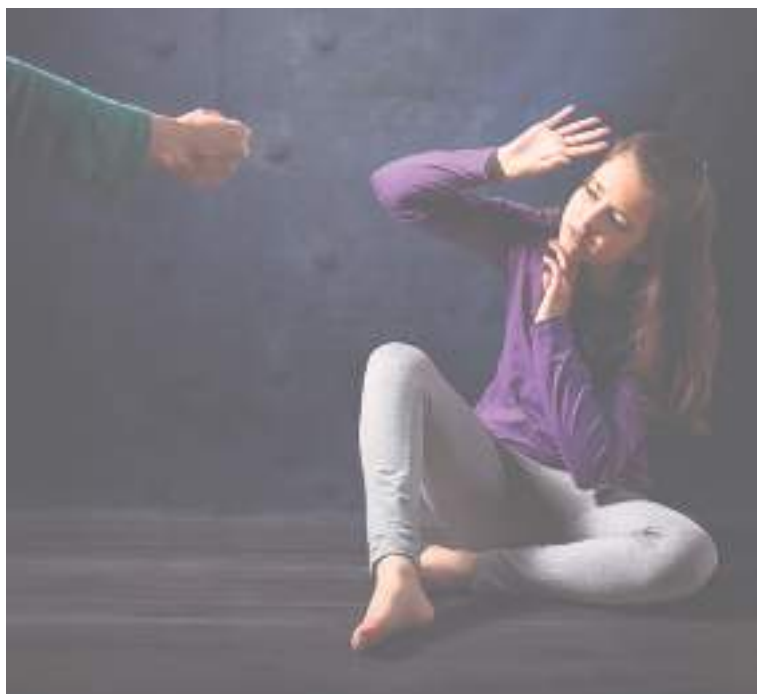
En el departamento del Huila registramos un total de 1.724 casos de violencia intrafamiliar.

Finalmente, aunque de estos delitos poco se habla técnicamente, lo cierto es que, la información para este tipo de casos es limitada dada la impresión que genera en la sociedad y, por ahora, se espera que el Huila logre mitigar las agresiones entre familiares (violencia intrafamiliar) en aras de continuar libre de parricidios y filicidios.