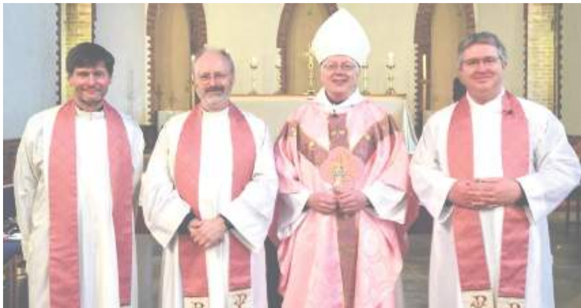
El llamado es a vivir con alegría.

El Introito o Introitus de la Misa es el fragmento de un salmo con su antífo-