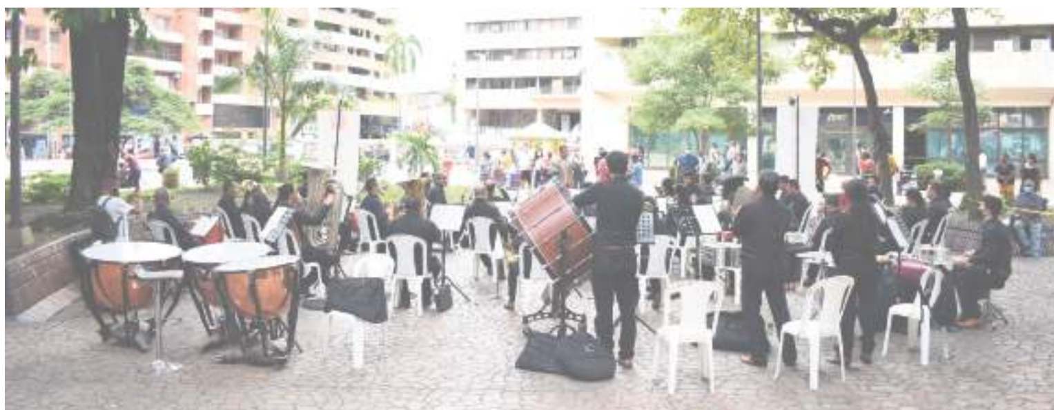
Actualmente están terminando una gira de 11 conciertos.

A ustedes por acordarse de la Banda Sinfónica del Huila y permitir contar todos los proyectos y lo que venimos haciendo en el Huila.