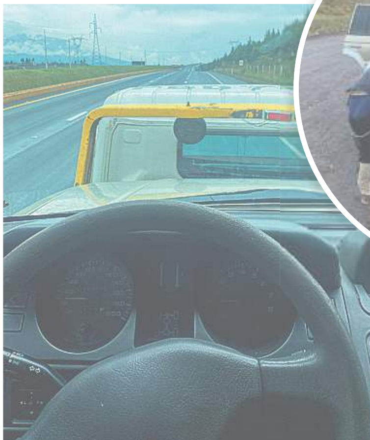
Nuestro carro en la grúa.

Se nos hizo un poco tarde para entrar al parque, tiene un horario estricto que los guardaparques procuran cuidar, pero no nos íbamos a rendir. Nos hicimos un espacio debajo de un árbol al lado de la puerta y pusimos nuestras carpas en medio de la fría noche que estaba haciendo. Cuando terminamos, alguno detectó un olor as-