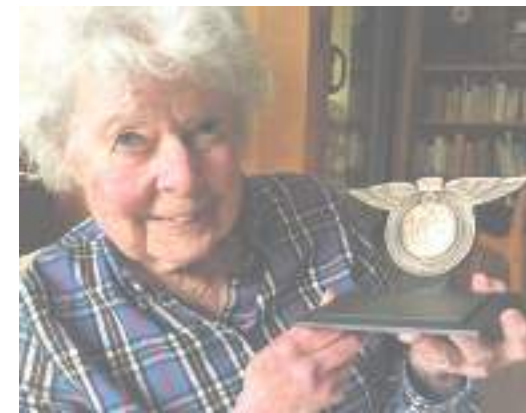
Virginia T. Norwood

Hoy con 95 años, desafió barreras y prejuicios para convertirse en una ingeniera visionaria, respetada por sus diseños innovadores y su capacidad para resolver problemas. Una de sus creaciones más célebres es el instrumento que posibilitó en 1972 el lanzamiento del primer Landsat, el programa de satélites que observa en forma continua la Tierra.