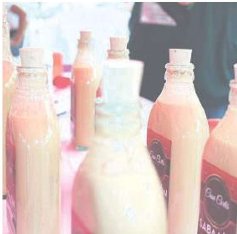
Sabajón empacado en botellas de media con tapa de corcho.

En cambio, el sabajón se está preparando y de una vez se está vendiendo y si se añeja es mejor su sabor. Nosotros los jóvenes tenemos muchos proyectos que podemos sacar adelante y uno de ellos es no dejar perder las tradiciones, se puede ir innovando, pero sin dejar perder lo tradicional.