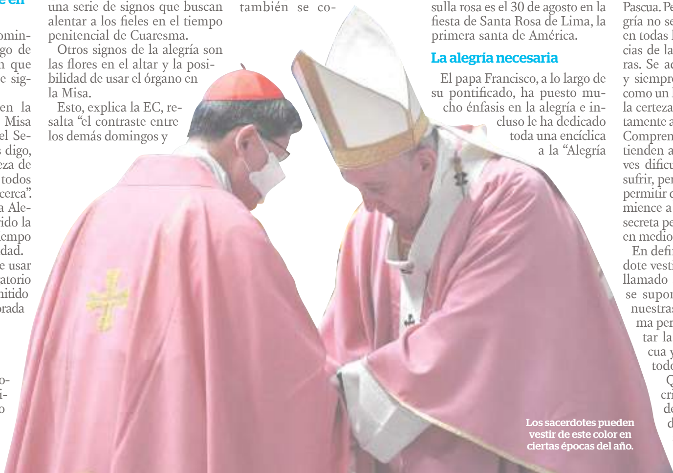
Los sacerdotes pueden vestir de este color en ciertas épocas del año.

Que nuestra práctica del cristianismo sea un faro de alegría en este mundo tan frecuentemente abatido por los múltiples sufrimientos de nuestra vida mortal.