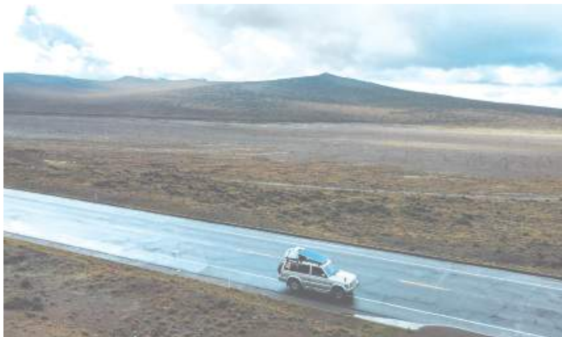
El volcán, lo sentíamos tan cerca.

Aun nos faltaba algo de trayecto y lo disfrutamos con las vistas al volcán, que se veía desde casi todos lados. La subida se ponía cada vez más dispendiosa y el carro se hacía cada vez más sonso, pensamos que sería por la altura, no contábamos con que el clutch estaba un poco largo y no estaba dando el poder que tenía que dar. Faltando una curva y unos 200 metros para llegar a la meta el carro dejó de andar empezó a sacar humo por debajo del capó. Jalé el freno de