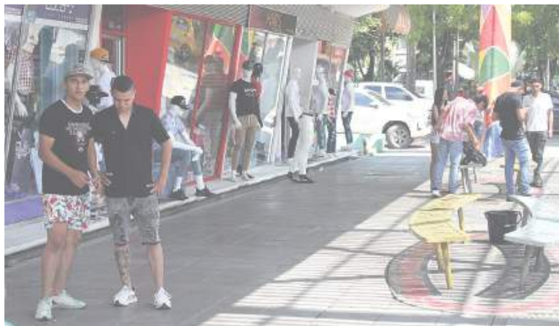
El lugar ofrece venta de ropa.

Una reflexión desde la perspectiva de comerciantes que tienen una trayectoria y que están acostumbrados a las crisis, levantarse de las mismas y salir adelante. Pero con un panorama no tan optimista de cara al próximo año debido a la crisis mundial que nos cobija con su coletazo bastante avasallador.