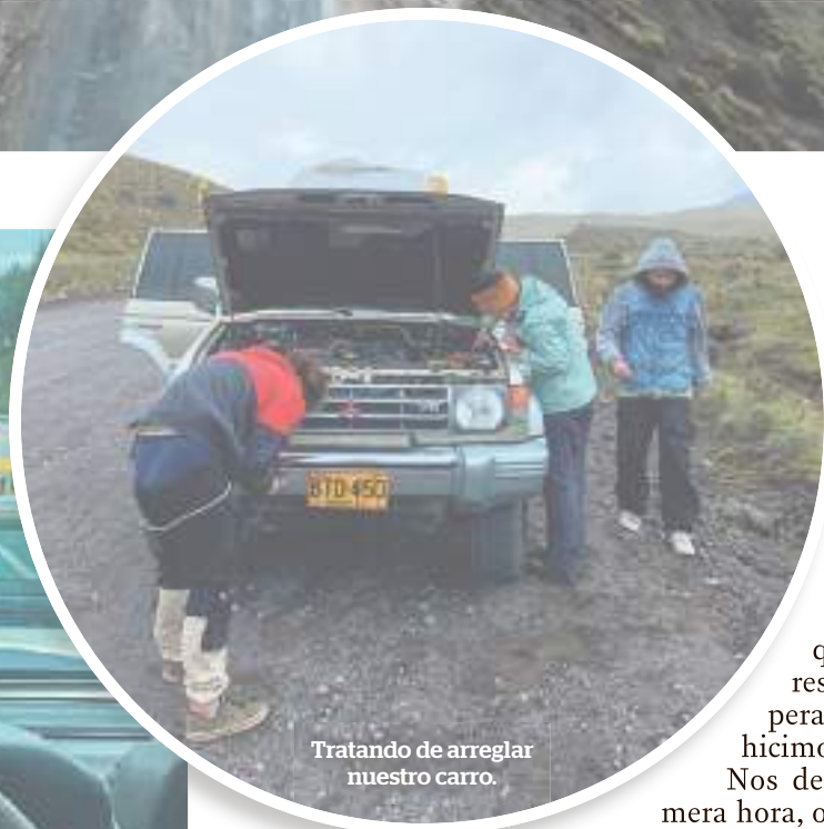
Tratando de arreglar nuestro carro.

le un duchazo a la perra, esto le traería una pequeña gripe perruna por los próximos días. Al terminar de secar a Habana, empezó a caer una leve lluvia que nos avisaba que era hora de resguardarnos y esperar al día siguiente, hicimos caso.