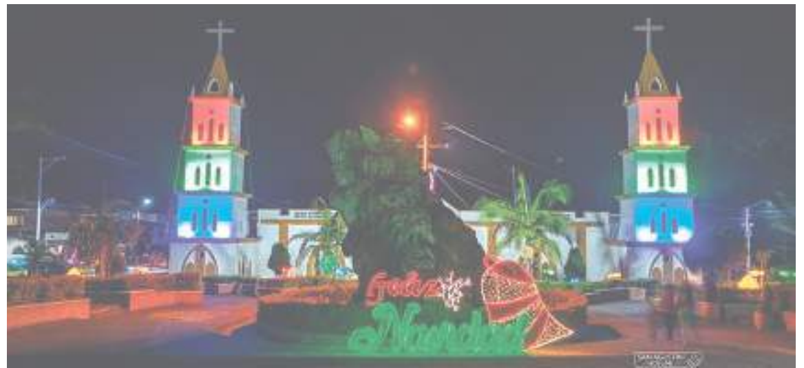
Básicamente en San Agustín todo es articulado para brindar una mágica experiencia a propios y turistas.

El pasado 7 de diciembre; día de velitas, se prendió la navidad oficialmente. San Agustín, desde luego, a partir de esa fecha arrancó con la programación que tiene preparada para este fin de año dado que, como es costumbre, busca seguir destacándose como uno de los sitios más ‘mágicos’ del departamento.