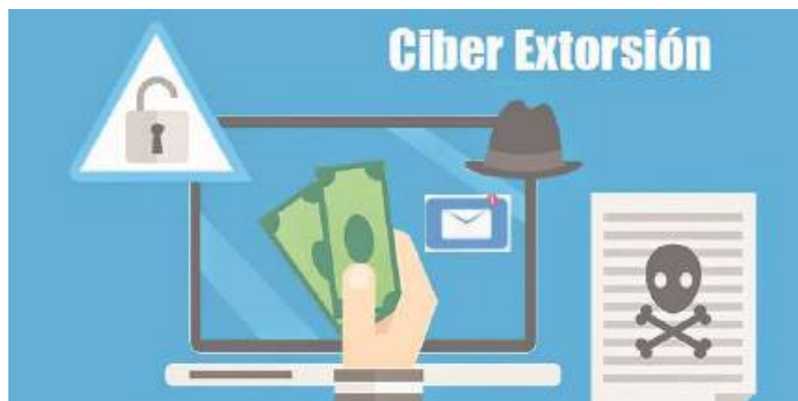
Ser extorsionado vía internet, es más usual de lo que parece, según indicaron las autoridades.