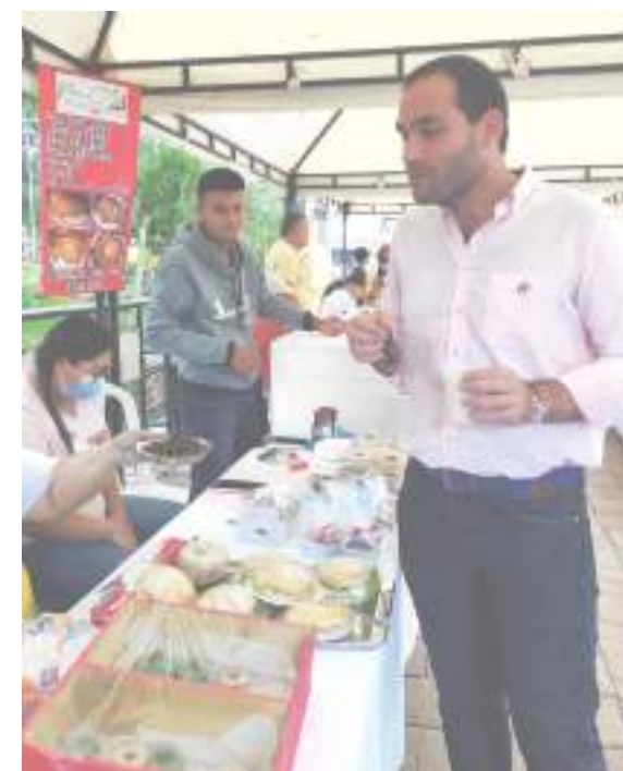
Todo tipo de emprendimientos hicieron parte del festival

E ntre el 6 y el 7 de diciembre en el Parque Santander los neivanos y visitantes pudieron disfrutar del Festival del Pan y la Comida Navideña, un espacio para que los emprendedores de la ciudad pudieran exhibir sus productos, y a la vez prepararse para recibir pedidos en esta época decembrina.