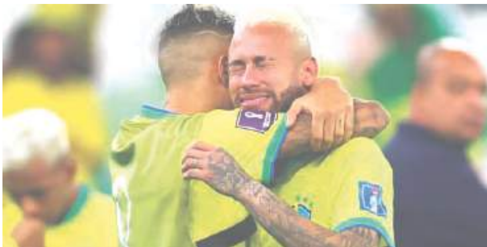
Imagen del día

En un partido trabado e intenso, Brasil quedó eliminado de la Copa del Mundo que se disputa en Qatar al caer en la tanda de penales de los cuartos de final frente a Croacia. Fue un partido rocoso para los sudamericanos, que parecieron encontrar la luz en el minuto 15 de la prórroga, cuando Neymar armó un par de pases con sus compañeros y logró filtrarse hasta el área que protegía Dominik Livakovic y marcar el primer gol del partido.