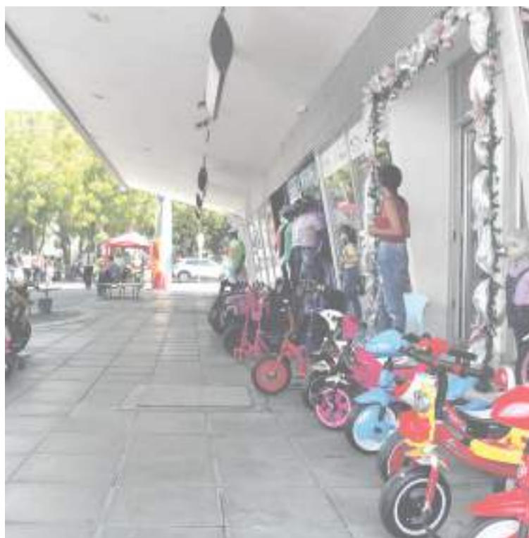
Zona de juguetes y otras mercancías en la parte alta.

A este diciembre lo llamó un diciembre bastante complicado para no decir que no se vislumbra para nada bueno, “vamos por el noveno día y las ventas siguen muy por debajo para poder cumplir con las obligaciones como el pago de personal que tocó contratar para la temporada, pagar los compromisos y las otras obligaciones, no están dando un margen mínimo para poder uno decir por lo menos podemos cumplir”.