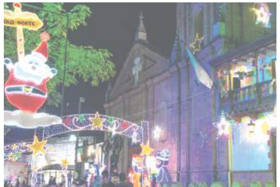
Un pesebre con animales y personajes vivos, quienes le dan más realismo a la propuesta.