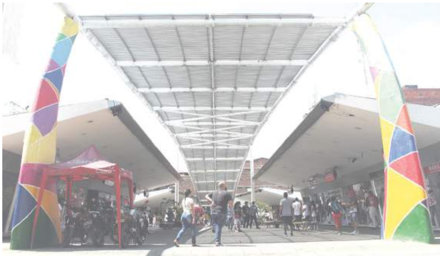
El Nuevo Pasaje Camacho un año no tan bueno.

Esta mujer acostumbrada como comerciante a las altas y las bajas, habló con un tono de