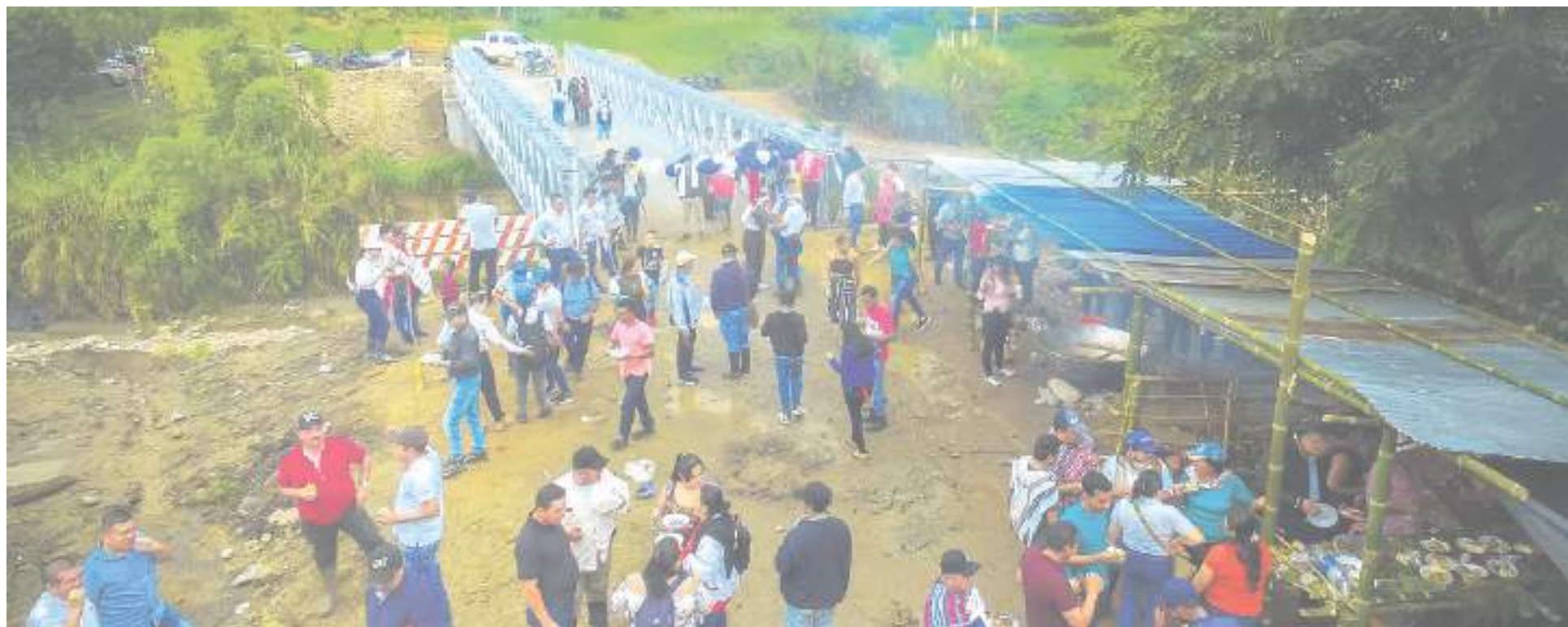
Se busca mejorar la calidad de vida de las personas.