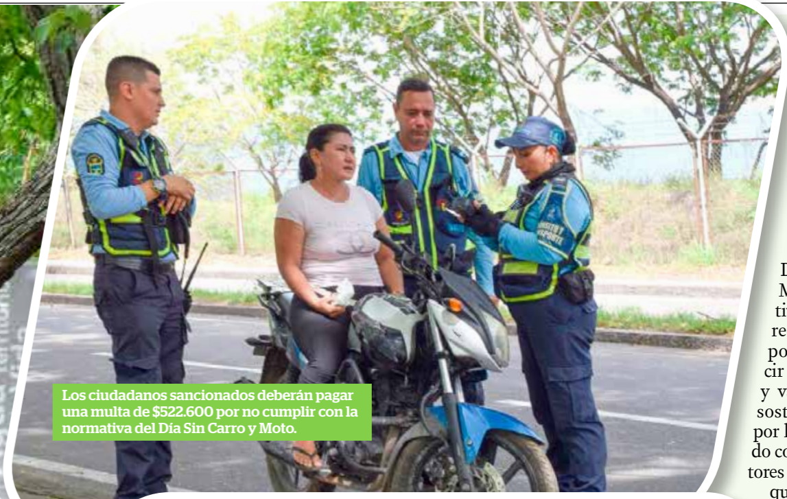
Los ciudadanos sancionados deberán pagar una multa de $522.600 por no cumplir con la normativa del Día Sin Carro y Moto.