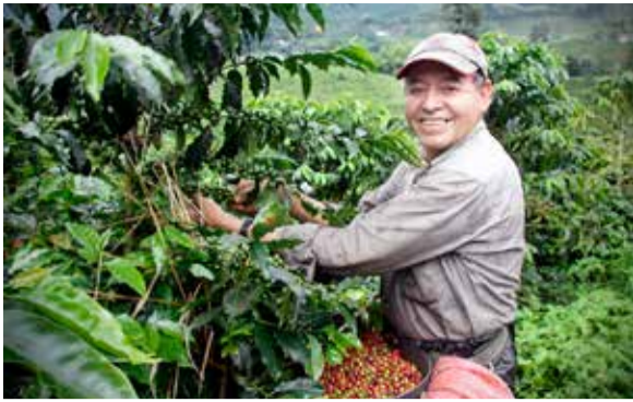
Recolectores de café sin garantías