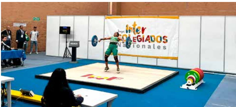
Según García Cardozo, los sub zonales y zonales de los deportes de conjunto están previstos para finales del mes de noviembre.

será una competencia deportiva, sino un caleidoscopio de emociones y talento que resonará en toda la comunidad. Desde los primeros compases de la fase inicial hasta la culminación con las finales de deportes de conjunto, los Juegos Intercolegiados prometen ser un hito en el calendario deportivo del Huila. La invitación está hecha: únase a la celebración, apoye a los talentosos participantes y sea parte de un evento que dejará una huella duradera en la historia deportiva de la región.