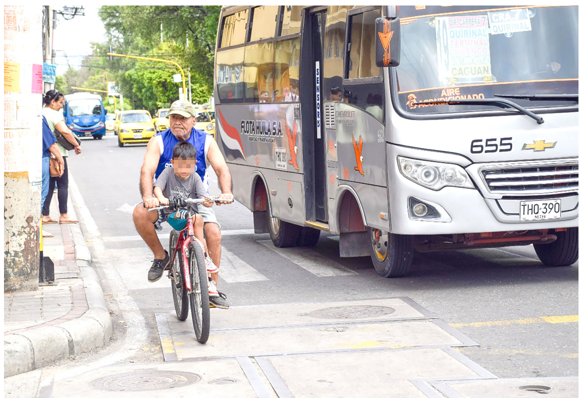
Con tranquilidad transcurrió el día sin Carro y Moto en la ciudad de Neiva, una iniciativa que busca reducir los índices de contaminación. Los neivanos se las ingeniaron para cumplir sus rutinas.