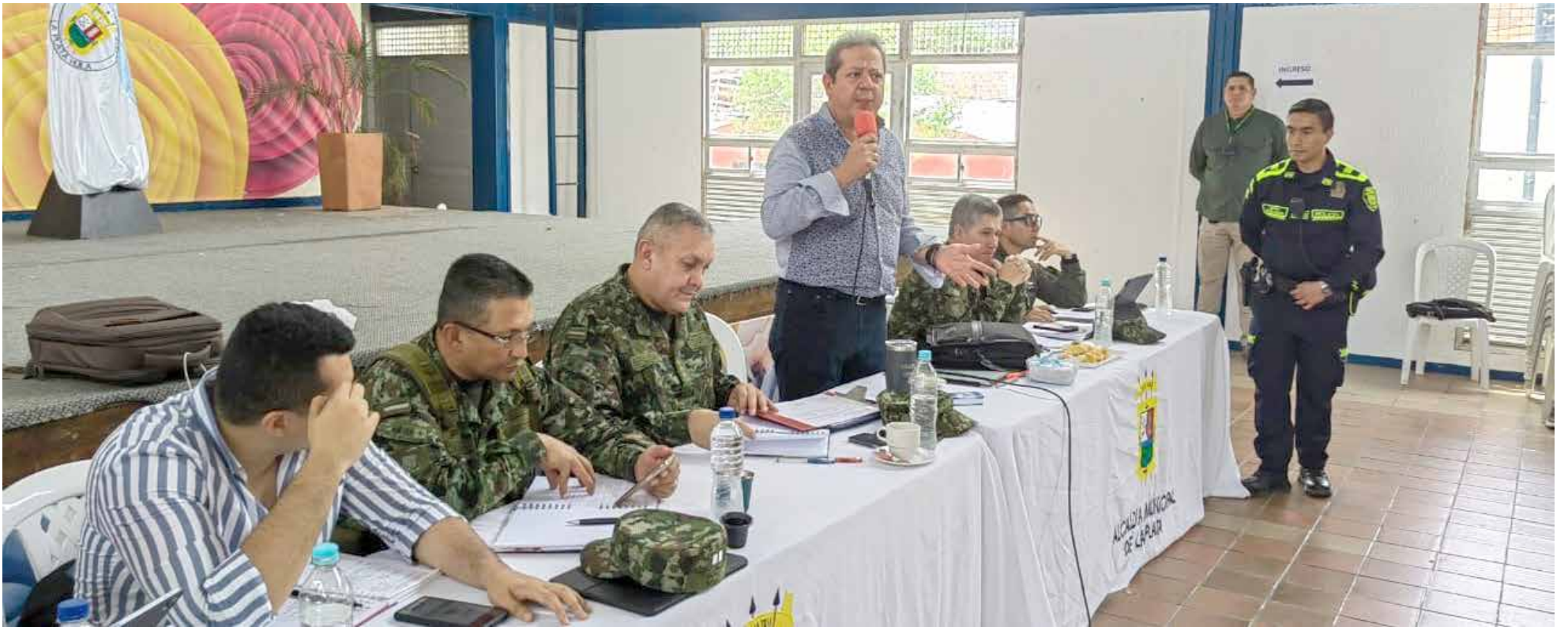
El Gobernador del Huila en el consejo de seguridad realizado en La Plata.