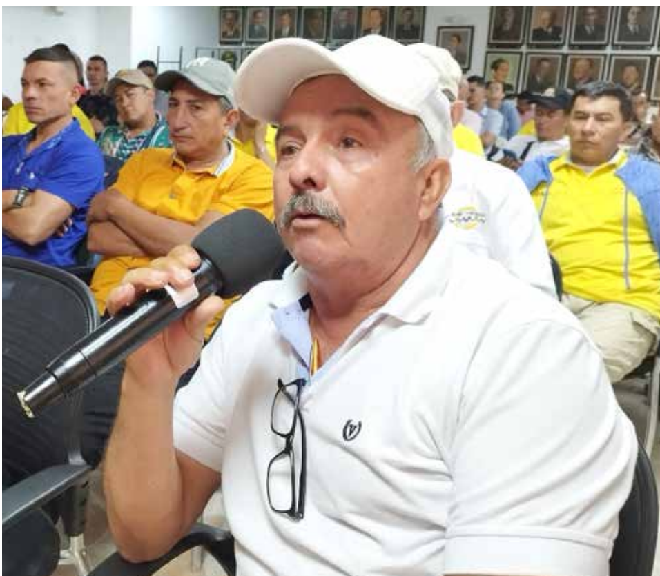
En los talleres se conocen problemáticas del sector.

res de servicios e insumos y con la participación del Gobierno Nacional y/o los gobiernos locales y regionales, serán inscritas como organizaciones de cadena por el Ministerio de Agricultura y Desarrollo Rural”, señala el artículo.