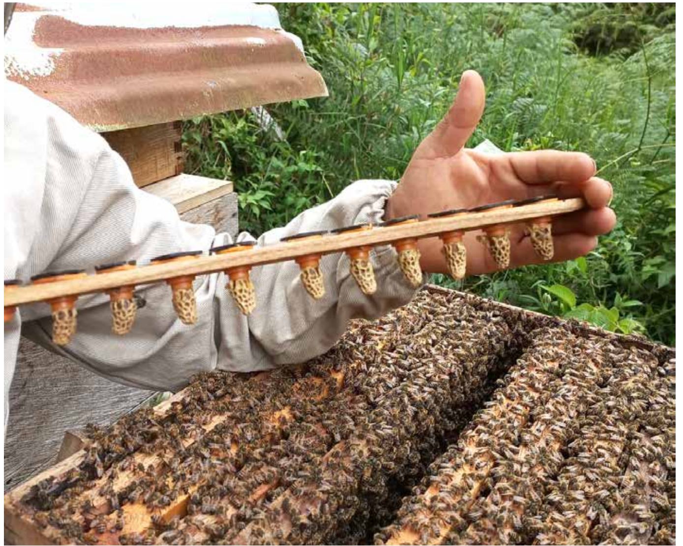
400 asociados, pertenecen a la Cooperativa Coopi.

En relación a los talleres y espacios que se tienen con los apicultores, la funcionaria agregó: “lo más importante que nos dejan los talleres los diálogos propositivos con los apicultores, nos permite conocer de primera mano toda la problemática en el sector también sus potencialidades en el departamento del Huila”.