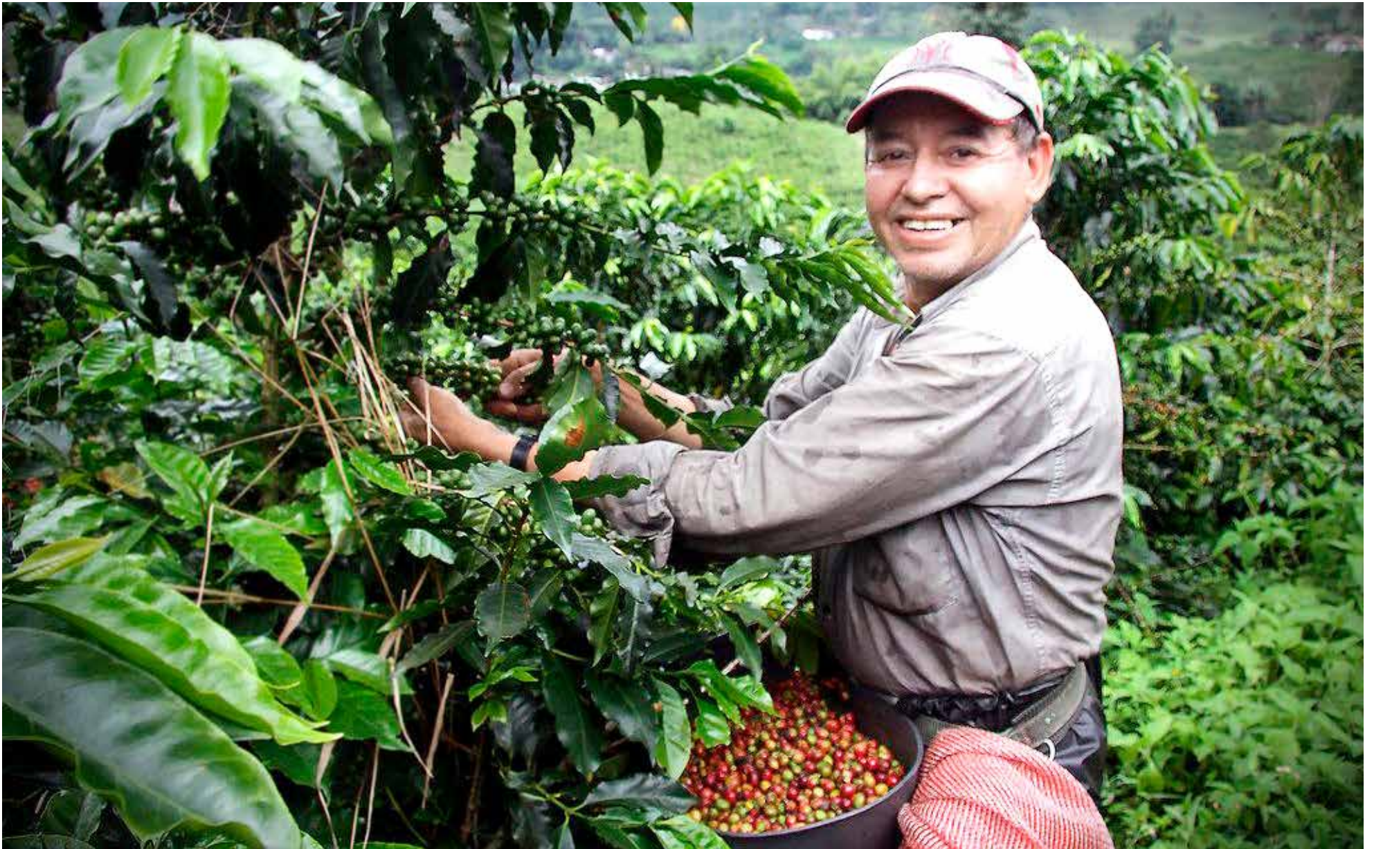
Se requieren cerca de 20.000 trabajadores para atender las dos cosechas del Huila.

■ Una de las problemáticas existentes que tiene los recolectores de café, es la falta de afiliación a seguridad social, ya que cuando se enferman, no cuentan con otros ingresos económicos para sortear estas dolencias. Y son cerca de 20.000 operarios que necesita el Huila, para atender las dos cosechas que se dan anualmente.