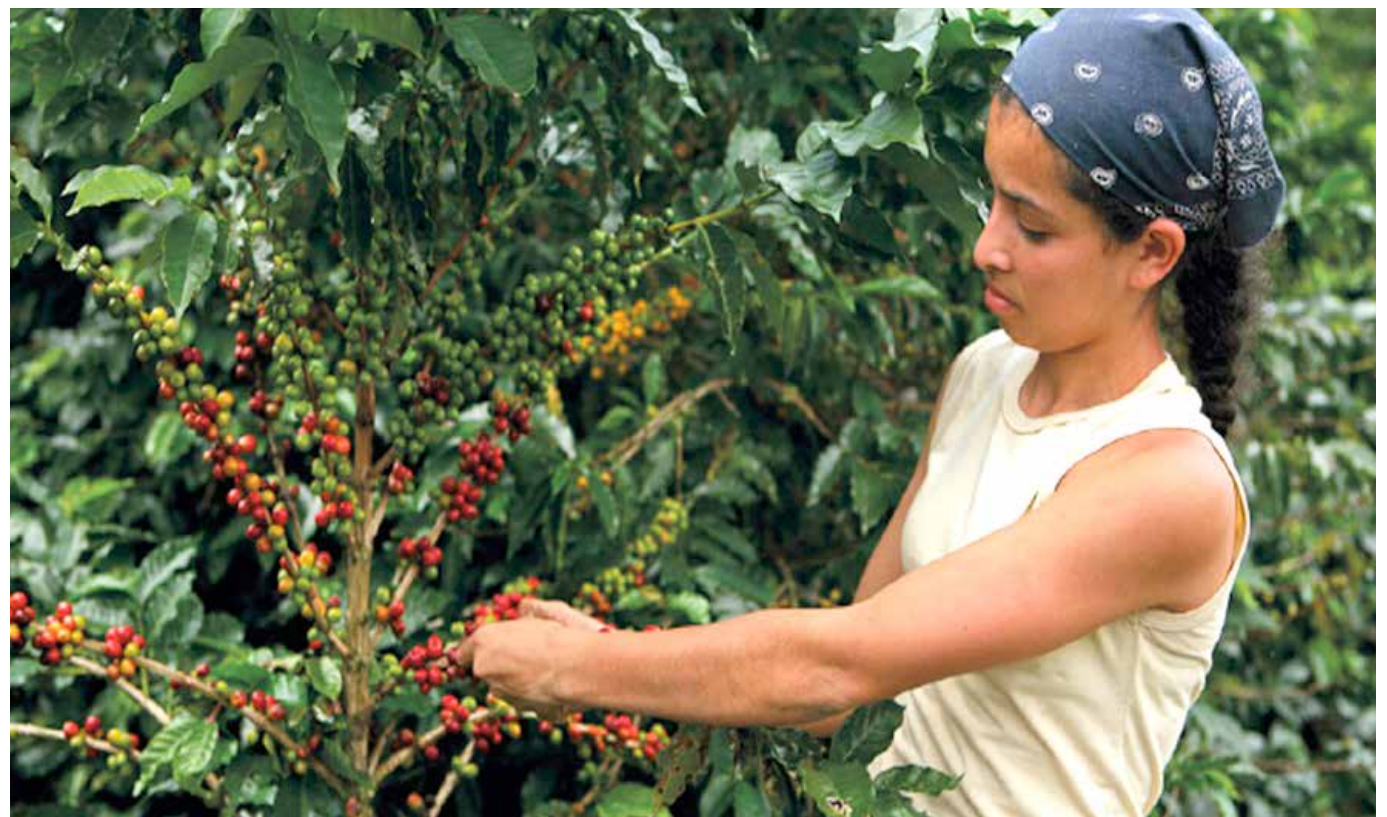
Las condiciones de trabajo para las mujeres son más difíciles.

En la distribución por género, los hombres representan más del 85% del empleo en la recolección, pero la mayor ocupación de hombres está en las fincas medianas y grandes, en las que el trabajo es remunerado, mientras que las mujeres trabajan más en fincas pequeñas, donde predomina el trabajo familiar.