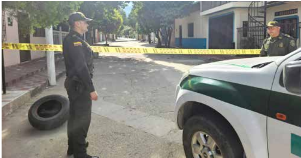
Las autoridades detonaron de manera controlada el artefacto explosivo.