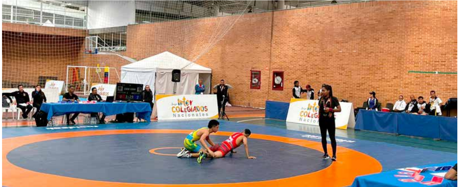
Son varias las modalidades que estarán presentes en este evento deportivo.

“La comunidad está invitada a unirse a la celebración en los diferentes escenarios deportivos del Huila”, afirmó García Cardozo. Estos escenarios se convertirán en testigos de momentos inolvidables, donde la pasión y el talento se fusionarán para crear un ambiente único. Los Juegos Intercolegiados no solo son una competencia deportiva; son una