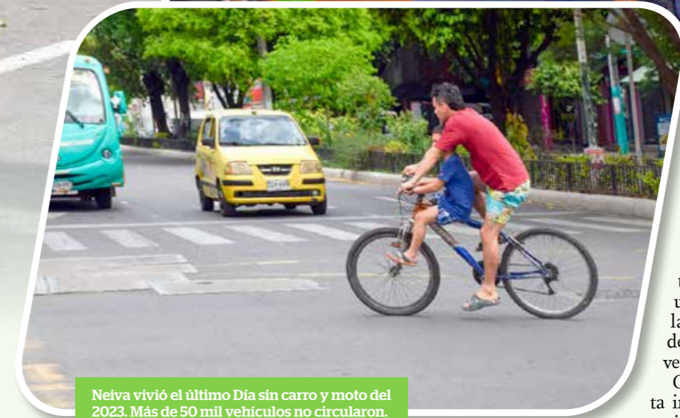
Neiva vivió el último Día sin carro y moto del 2023. Más de 50 mil vehículos no circularon.

zadas para realizar estas mediciones, una previsión de reducción de 380 toneladas de dióxido de carbono basada en registros históricos. "Es imperativo transformar nuestra mentalidad sobre el uso indiscriminado del vehículo para cualquier actividad. Debemos comenzar a adoptar la bicicleta para contribuir al cuidado del medio ambiente. En la actualidad, la prioridad recae en el aspecto ambiental. La vida es un equilibrio: sacrificar un día no debería llevarnos a la quiebra. La idea es motivar a las familias para que, durante días sin carro o moto, implementen estrategias que fomenten la caminata y, por ende, el consumo responsable."