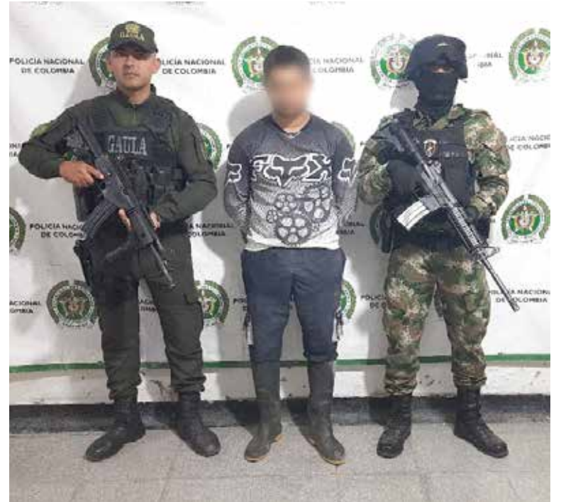
Uno de los presuntos delincuentes fue abatido en el procedimiento.

“El Gaula Policía y Militar agradece a la ciudadanía la confianza en las instituciones para evitar estas extorsiones de delincuencia común”, concluyó el Coronel Muñoz.