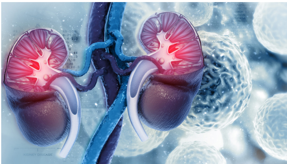
La hipertensión puede causar serios inconvenientes a distintos órganos, entre ellos, los riñones.