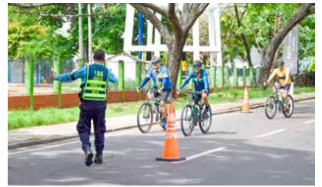
Neiva 'respiró' en el día sin carro y moto