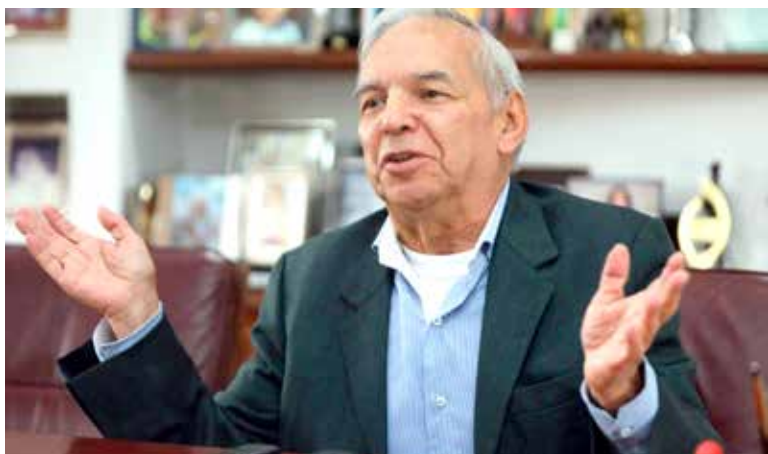
Ricardo Bonilla, ministro de Hacienda.

Sin embargo, y con todas las amenazas que hay para que se sigan incrementando los precios en el país, el ministro Bonilla estará en la disyuntiva, pues el incremento en las tarifas de los peajes no tiene vuelta de hoja.