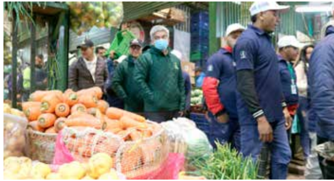
Neiva resalta con variación negativa del IPC