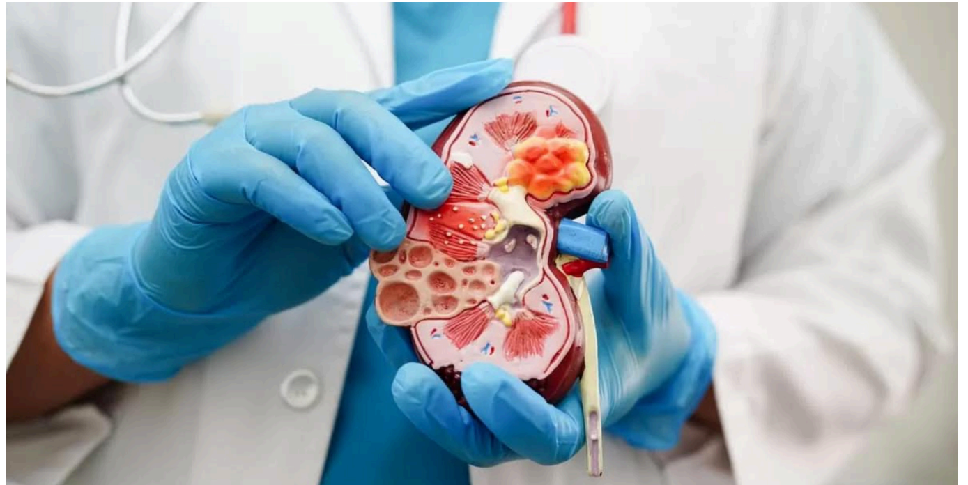
La presión arterial elevada es un factor de riesgo para el cáncer de pulmón.

Es importante tener en cuenta que la investigación en este campo continúa, y los mecanismos precisos aún pueden no estar completamente claros.