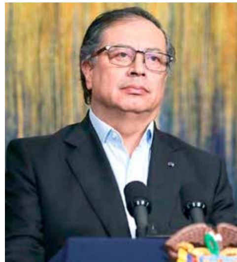
Gobierno Petro tiene listo el decreto con el que subirá los peajes.