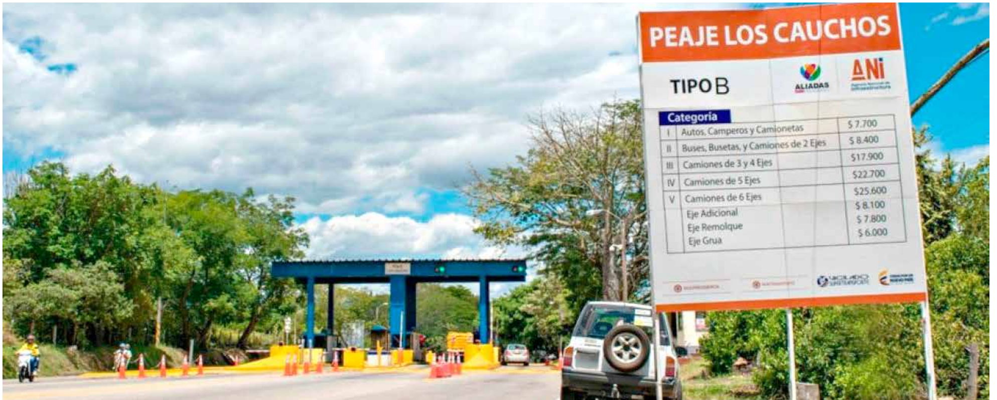
Peajes más caros, regalo de Navidad y Año Nuevo.

■ Aunque aún falta el veredicto final del Ministerio de Hacienda, entre el decreto y la resolución para levantar la medida de congelamiento están las señales. En diciembre se subirá el costo con la inflación de ese año. En enero, con el IPC de 2023, y queda pendiente la subida de 2024.