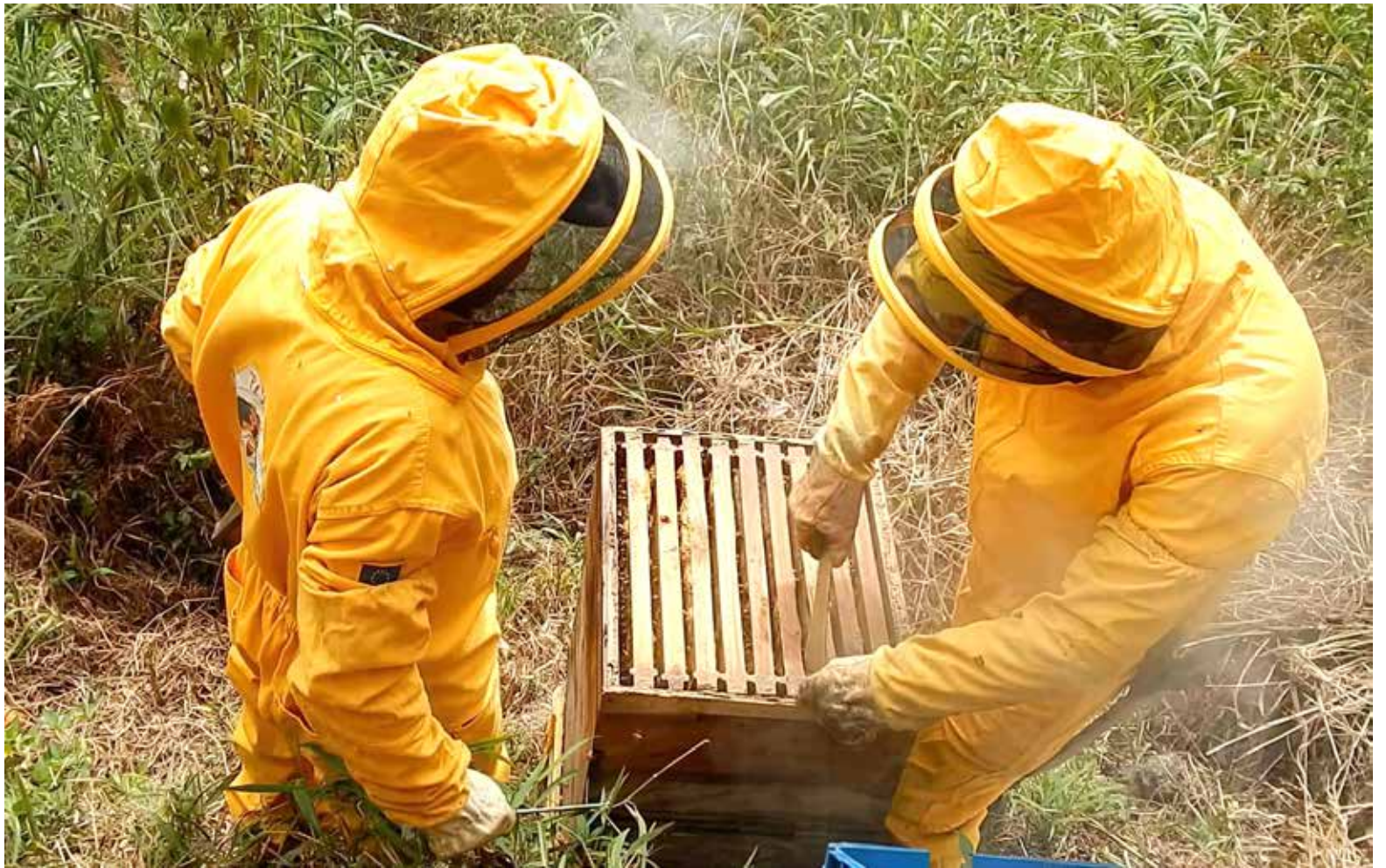
En el Huila hay aproximadamente 1.200 apicultores.

y organizaciones más representativas tanto de la producción agrícola, pecuaria, forestal, acuícola, pesquera, como de la transformación, la comercialización, la distribución, y de los proveedo-