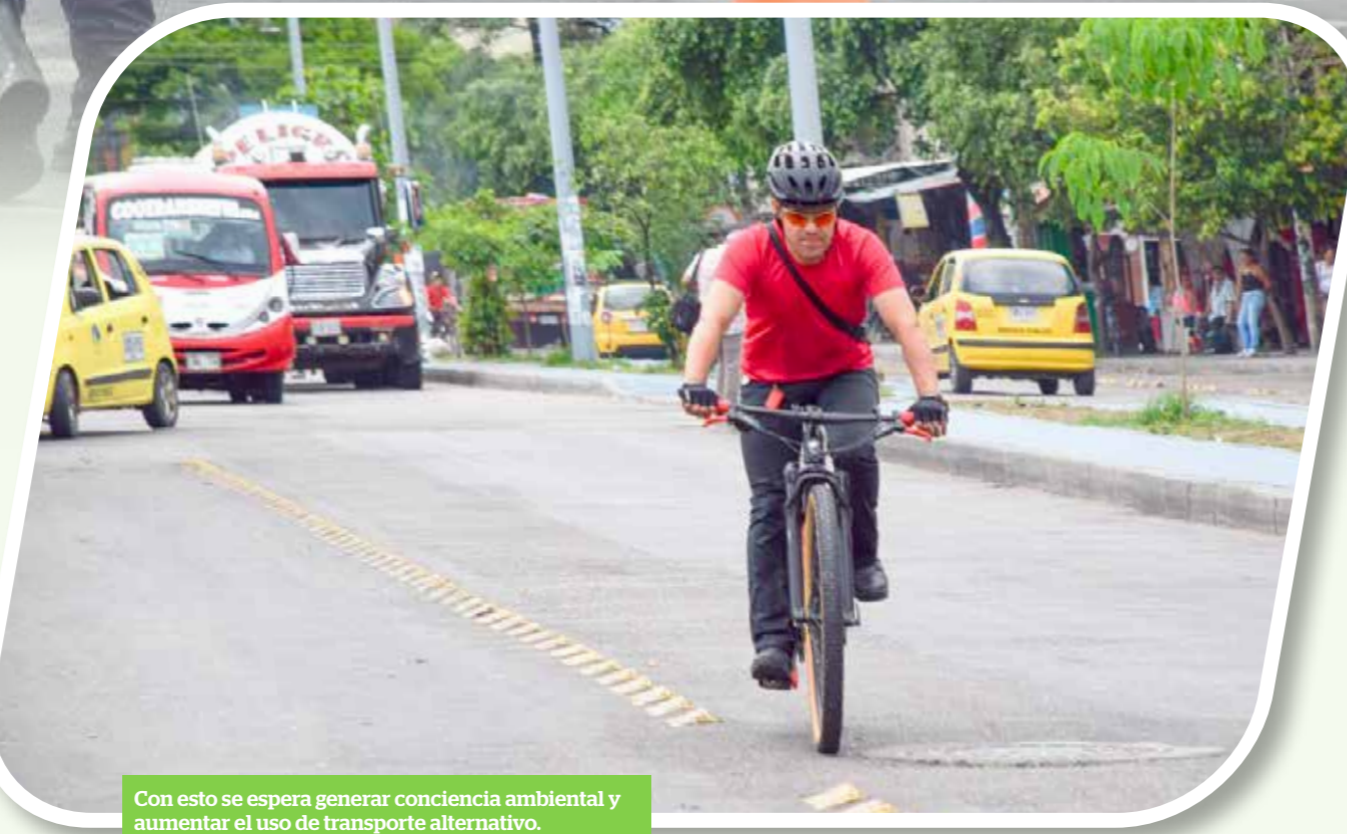
Con esto se espera generar conciencia ambiental y aumentar el uso de transporte alternativo.