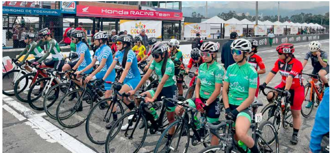
Los deportistas opitas vienen preparándose.

Este evento no solo busca promover la actividad física entre la juventud, sino también fomentar la camaradería y el espíritu deportivo.