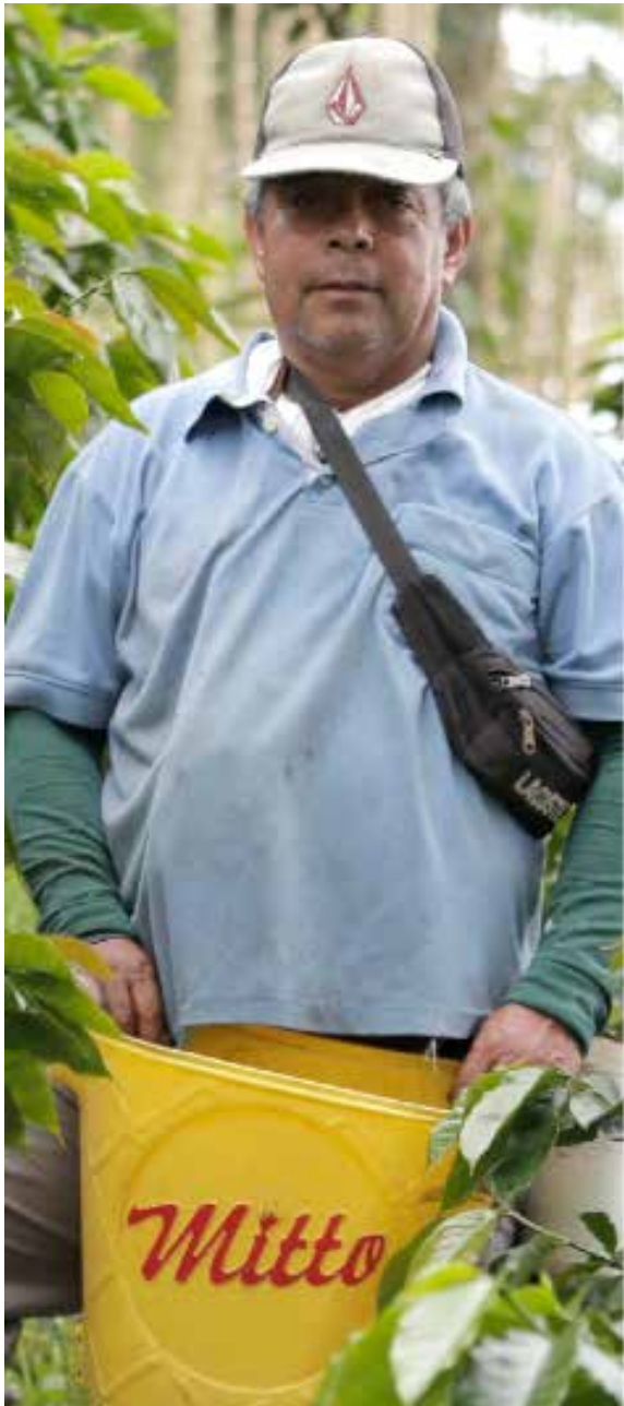
Han encontrado operarios de más de 60 años de edad, también a menores de edad, recogiendo café.

zación del Trabajo (OIT), la Federación Nacional de Cafeteros, Comité Departamental, Ministerio de Desarrollo Rural, ha empezado una formación y formalización de los recolectores. A través del Sena, reconocieron competencias a algunos agricultores, que empezaron a hacer capacitados en recolección de cafés especiales.