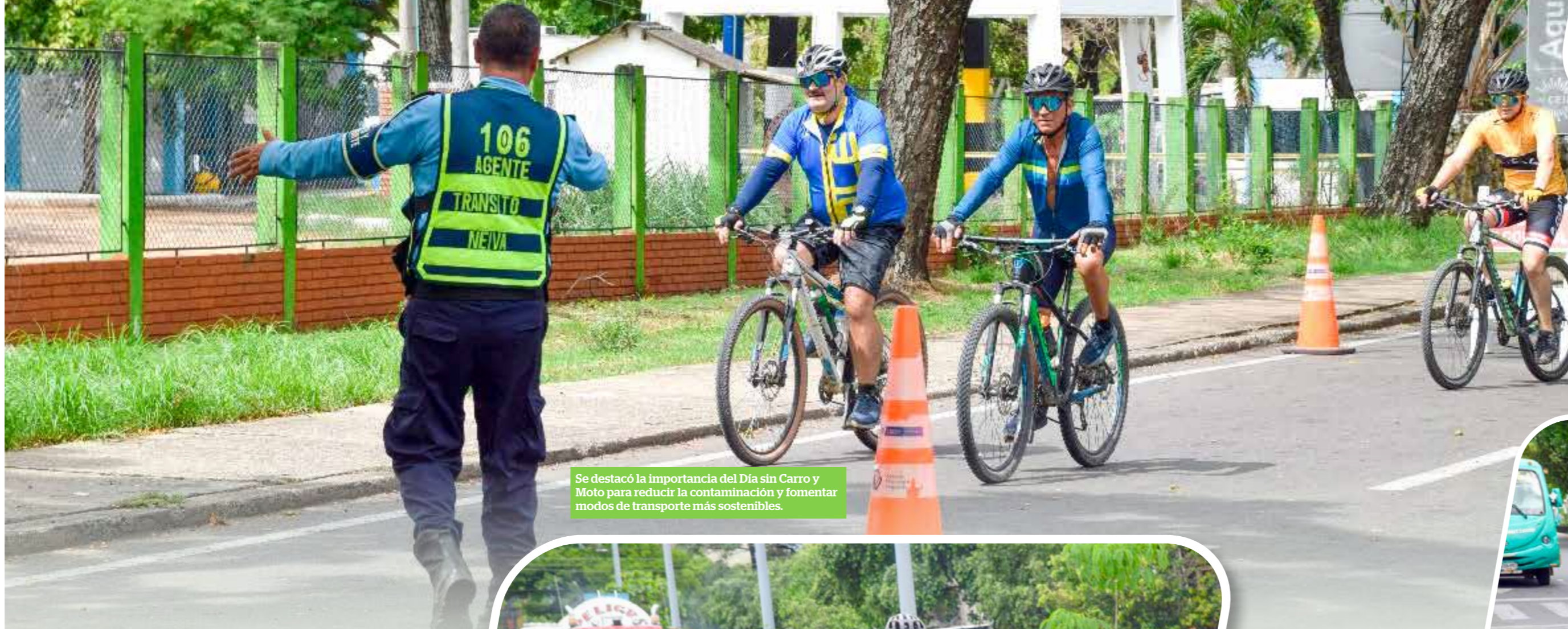
Se destacó la importancia del Día sin Carro y Moto para reducir la contaminación y fomentar modos de transporte más sostenibles.

Más de 50 mil carros y motocicletas dejaron de circular por las vías de Neiva, aportando a la reducción de emisiones de carbono que producen los combustibles fósiles. Las autoridades realizaron más de 281 comparendos a ciudadanos infractores.