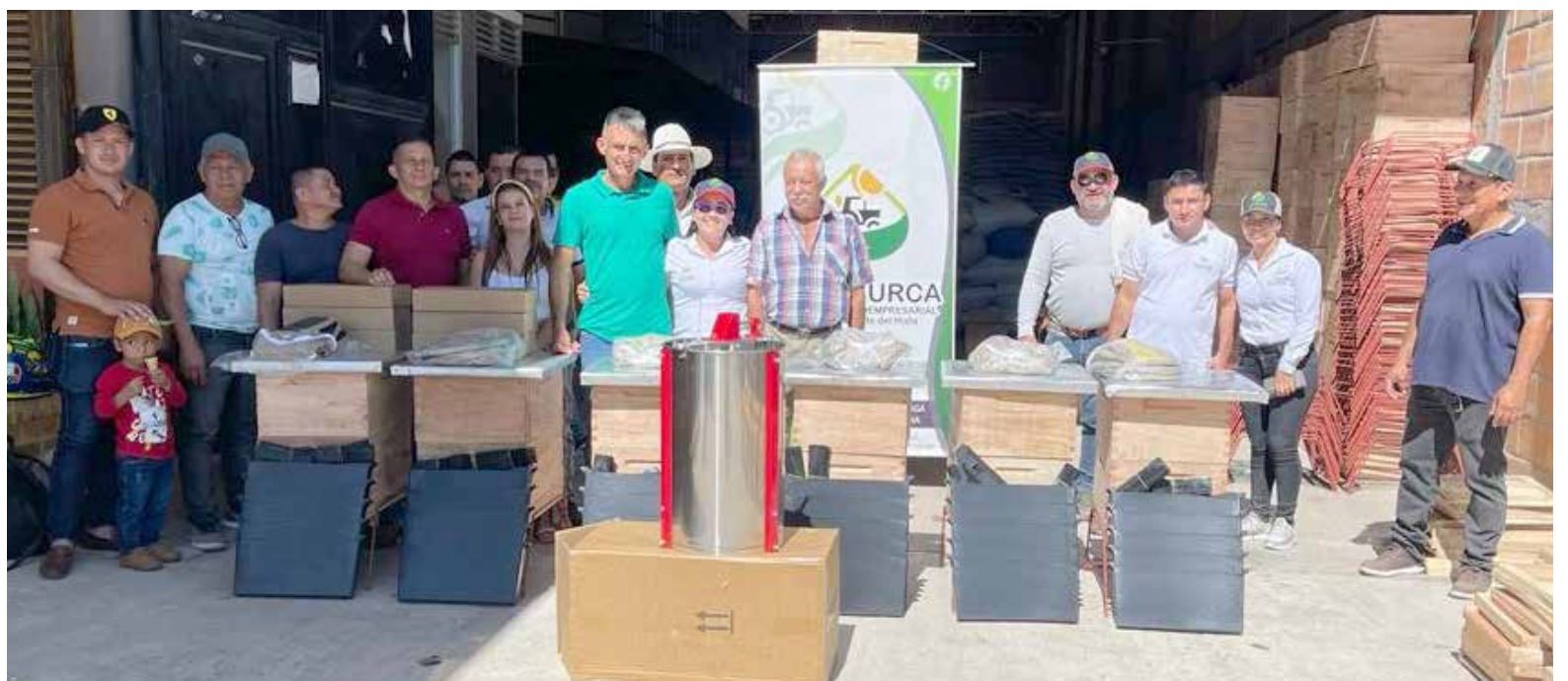
Este sector ha sido fortalecido por la Gobernación del Huila.

“El papel fundamental de las abejas, es que son agentes polinizadores de todos los cultivos como el café, pasifloras, y demás frutales, entre ellos, cítricos y aguacate; por esto es importante que el caficultor tenga conciencia sobre la necesidad de reducir el uso de pesticidas, lo que permite tener una caficultura más sana ampliando a su vez los ingresos, pues las abejas al polinizar aumentan los rendimientos en la producción de café, y permiten nuevas entradas económicas por la producción de miel”.