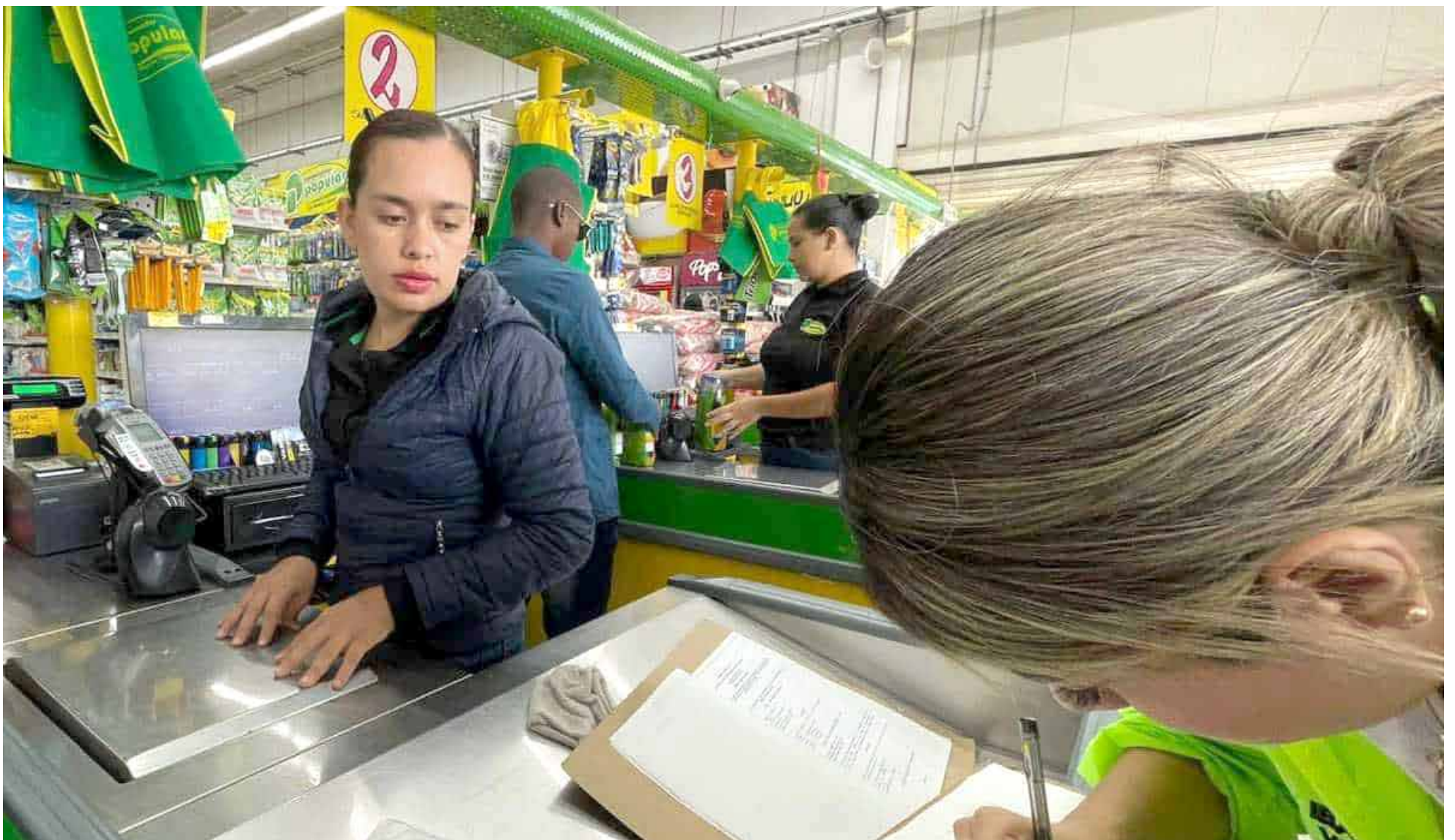
A nivel nacional, la inflación muestra un descenso, con el IPC situado en 0,25% en octubre.

En un cambio significativo, Neiva se destaca con la variación mensual más baja a nivel nacional, marcando una disminución de precios de -0,12% en octubre en comparación con septiembre.