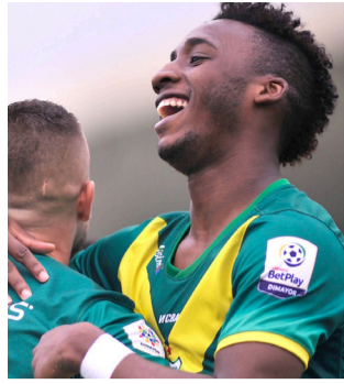
El Huila volvió a ser campeón