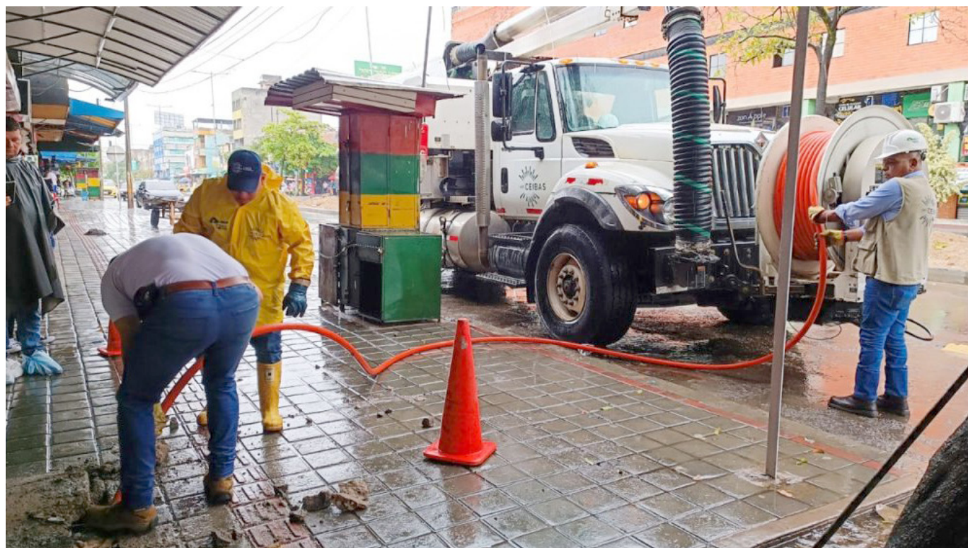
Retiro de basura por el vactor en la carrera segunda.

La basura que se acumula en las alcantarillas es un problema de grandes dimensiones. Se ha visto que puede causar graves inundaciones y daños a la infraestructura de la ciudad.