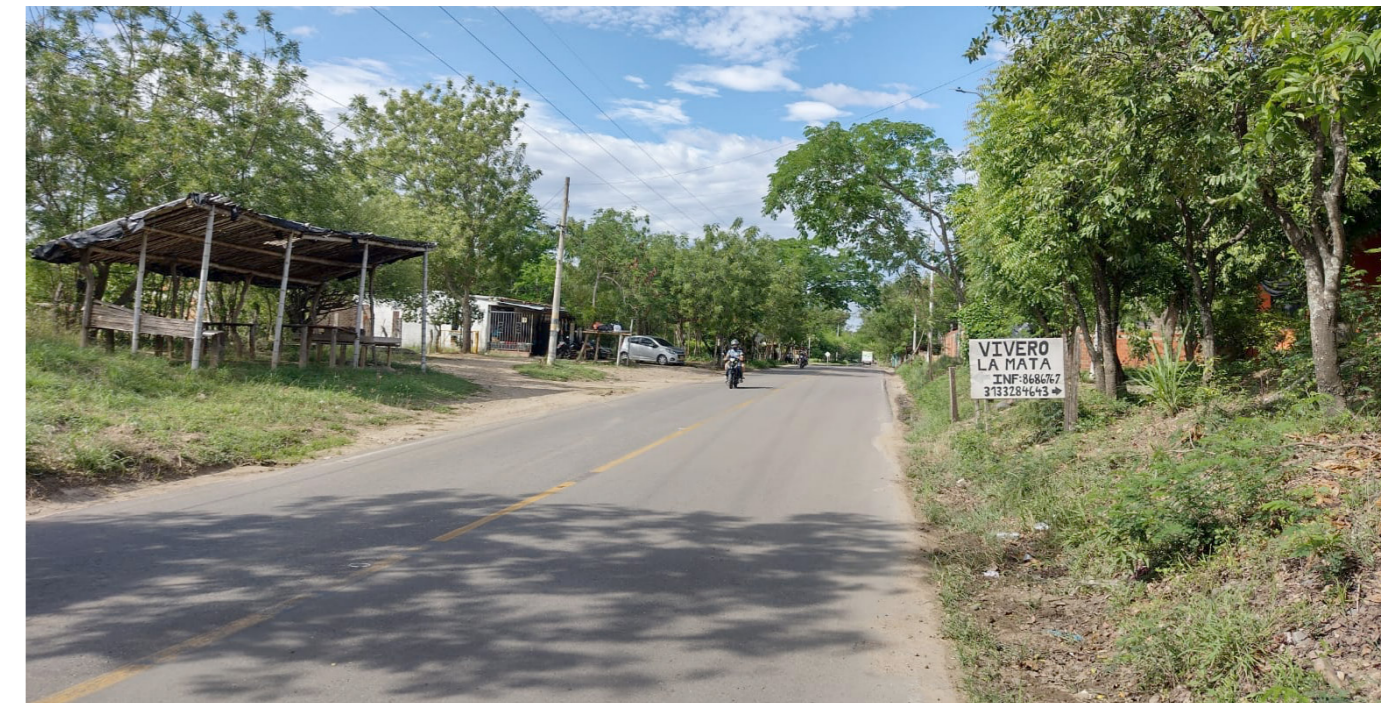
La sorpresa es encontrar un tramo en buen estado.

momento Fortalecillas no cuenta con la seguridad que necesita por parte de la policía, es una situación bien difícil para quienes a diario tenemos que desplazarnos hasta Neiva”, dijo.