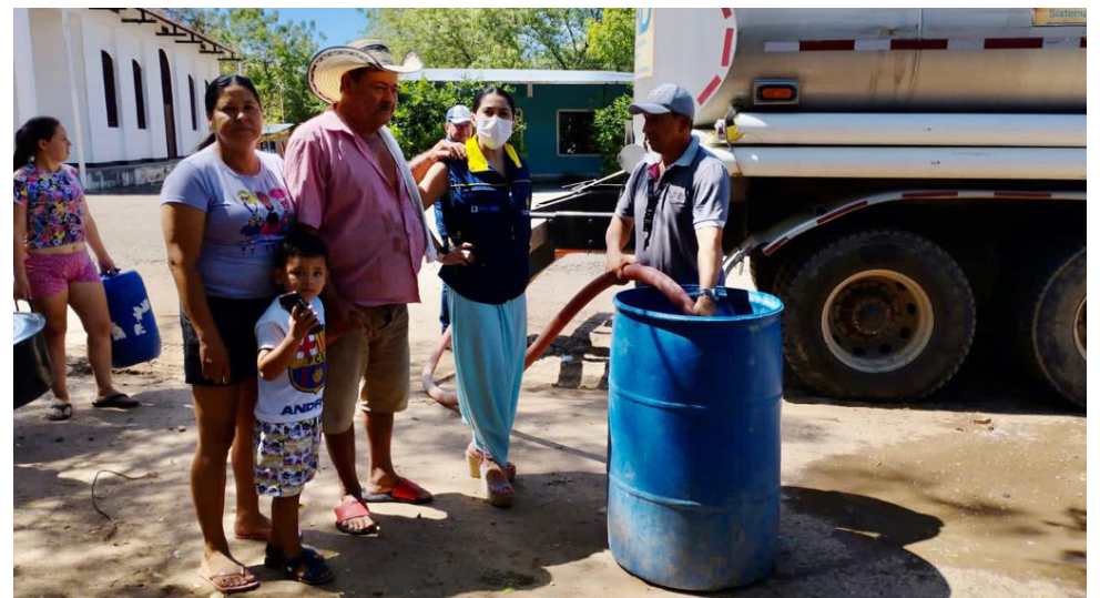
Mejoramiento de la calidad de vida.

“Un total de 303 iniciativas fueron presentadas por las Juntas de Acción Comunal y Juntas de Vivienda Comunitaria dentro de la convocatoria que adelantó la Gobernación del Huila a través del programa Banco de Oportunidades ‘Huila Crece’”.