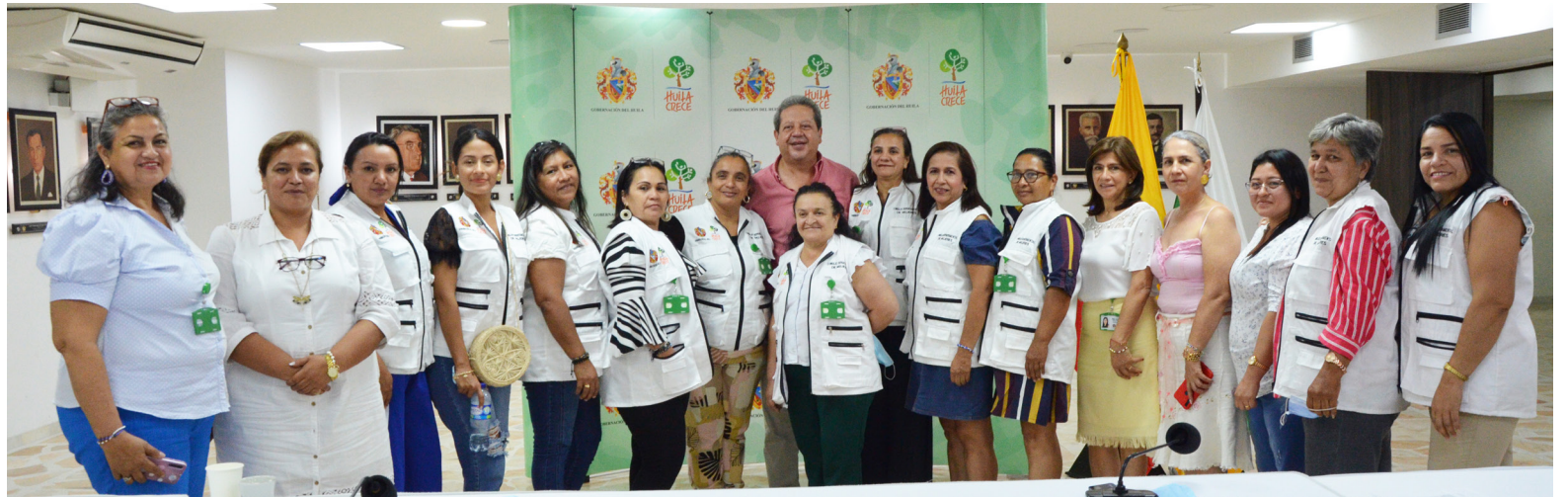
Representación de las JAC del Huila.

“Un total de 303 iniciativas fueron presentadas por las Juntas de Acción Comunal y Juntas de Vivienda Comunitaria dentro de