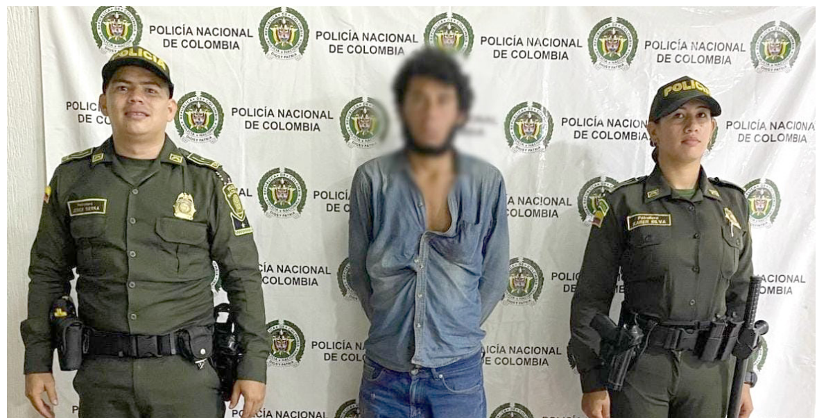
Capturado en Palermo.

El capturado, fue dejado a disposición de autoridad competente por el delito de tráfico, fabricación o porte de sustancia estupefaciente donde un juez control de garantía decidirá su situación jurídica.