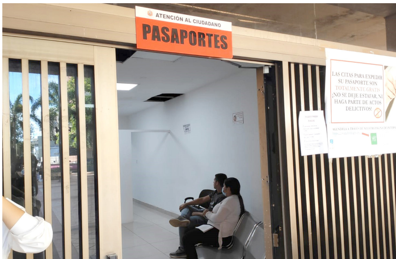
Durante este mes hay aproximadamente 520 pasaportes en riesgo de vencerse, es decir, tendrían que ser devueltos.

Finalmente, invitan a las personas a que reclamen los pasaportes que podrían vencerse dentro de poco y que no caigan en las estafas. El documento solo será entregado al dueño con la huella digital y es importante revisar los requisitos con detenimiento para no perder tiempo.