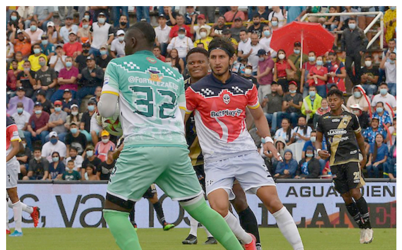
Fortaleza será uno de los equipos que insiste en llegar a la A del fútbol colombiano.

Fortaleza CEIF vs Llaneros Boyacá Chicó vs Barranquilla Atlético Huila vs Deportes Quindío Real Santander vs Tigres