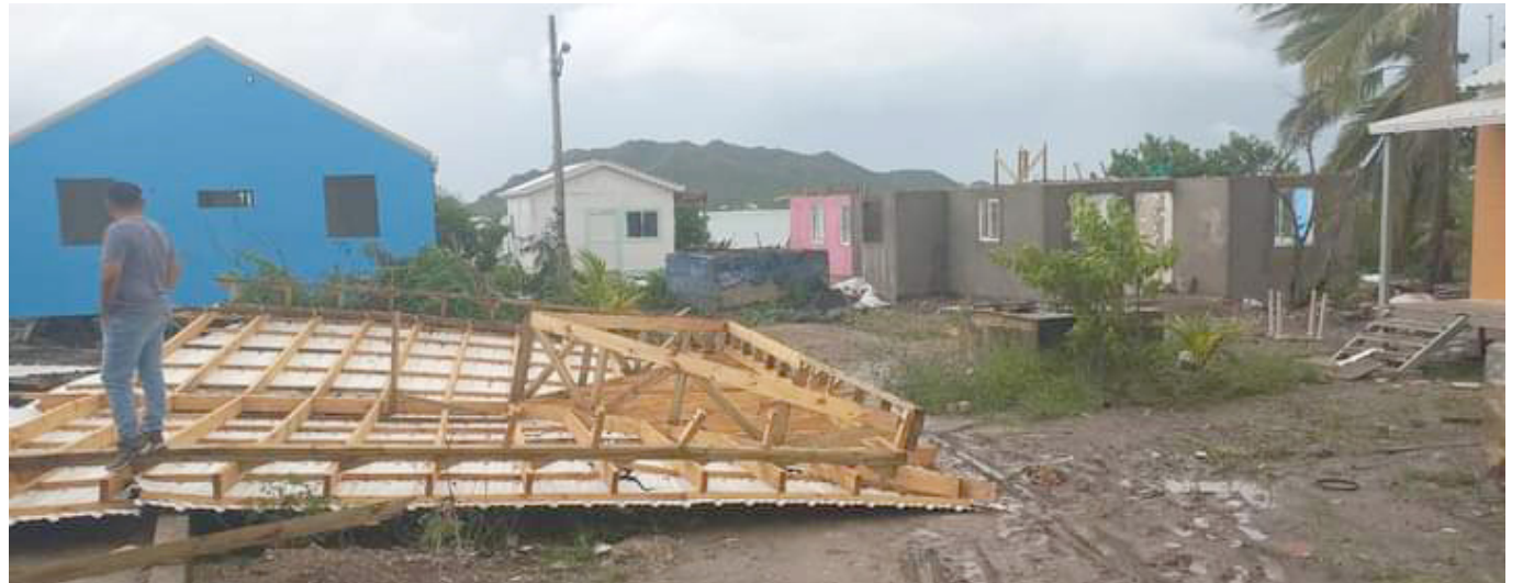
Las viviendas que fueron afectadas en otro huracán y reconstruidas fueron las más afectadas.

“El paso del huracán por San Andrés dejó daños leves. Dos lesionados, dos viviendas destruidas, 101 averiadas. Su paso por Providencia fue más leve”, escribió el mandatario en Twitter.