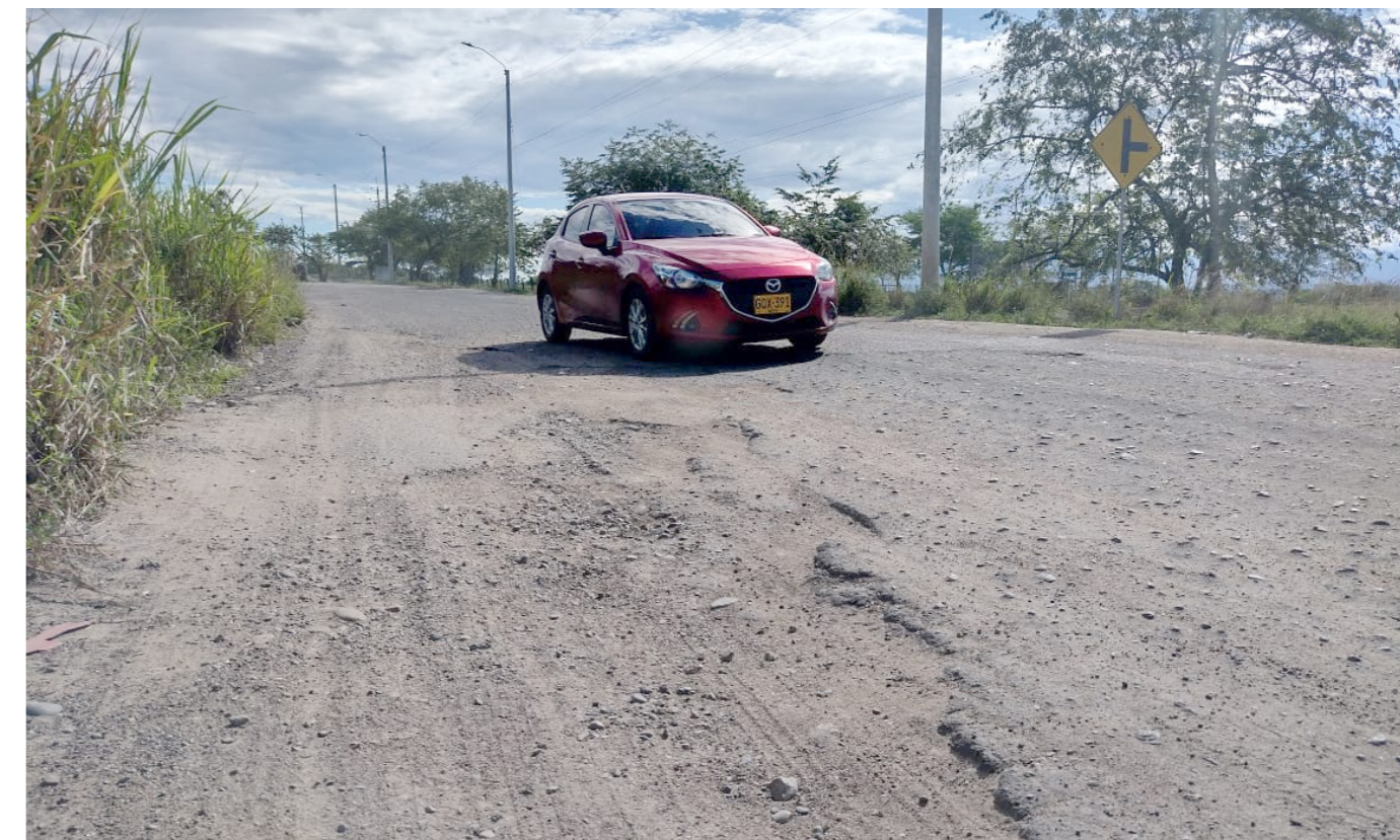
Cráteres como este se encuentran en el camino.

“La necesidad de una pronta recuperación es prioritaria ya que no solo se beneficiarían los que viven en la zona o que a diario transitan por la vía, sino todos los turistas, aprovechemos que es un comercio extendido, es un comercio, local, nacional e internacional, para que estos sectores se luzcan todo el tiempo y lo hagan a beneficio de quienes transitan a diario por estos sectores”, concluyó