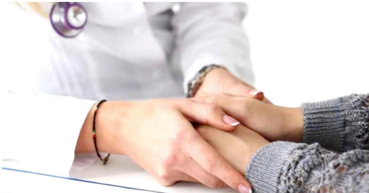
Las personas pueden pasar por alto los síntomas de la depresión, asumiendo que sentirse deprimido es normal para alguien que lucha con una enfermedad grave.

Finalmente, el rol de los cuidadores y familiares de los pacientes crónicos es fundamental para brindar un soporte y acompañar a quien está pasando por una situación de riesgo. El círculo cercano debe abrir espacios para hablar sobre la situación #SinEstigmas, creando una red de apoyo que ayude al paciente a generar nuevamente una conexión con su entorno.