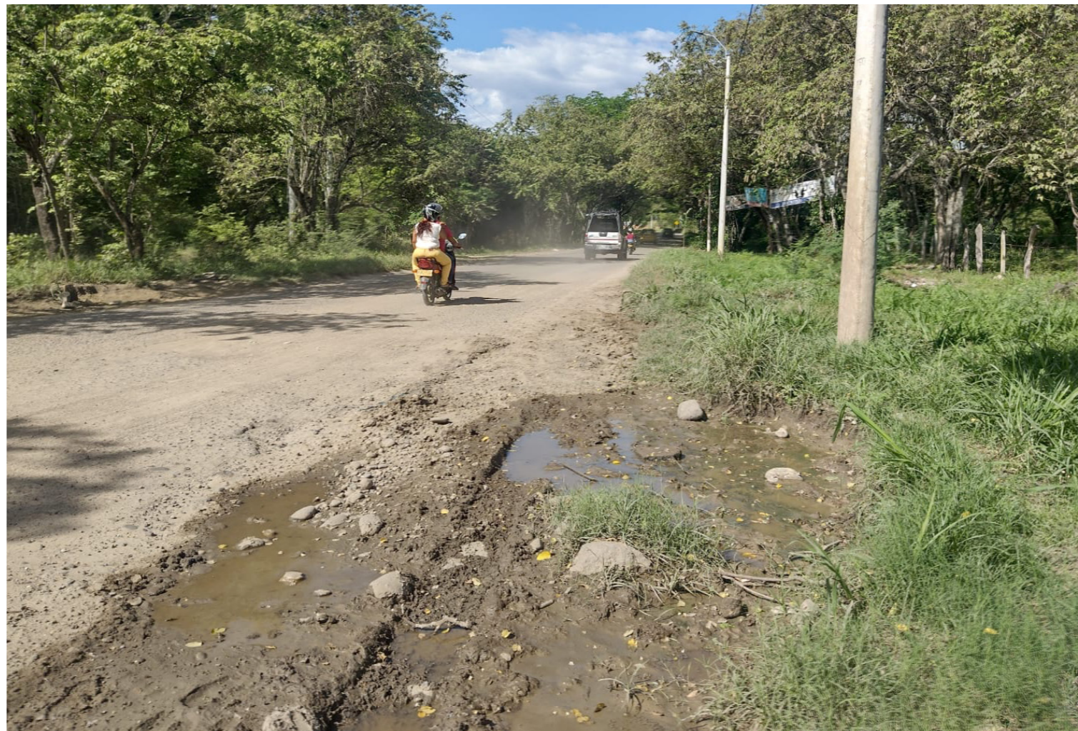
Son siete kilómetros desde la salida en Alberto Galindo hasta el Corregimiento.