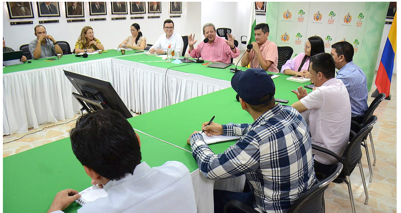
Gobernador presidiendo el encuentro regional.

En los encuentros de diálogos regionales, tanto el gobernador, funcionarios y ciudadanía, buscarán darles solución a las problemáticas del departamento, entre esos a la Ruta 45.