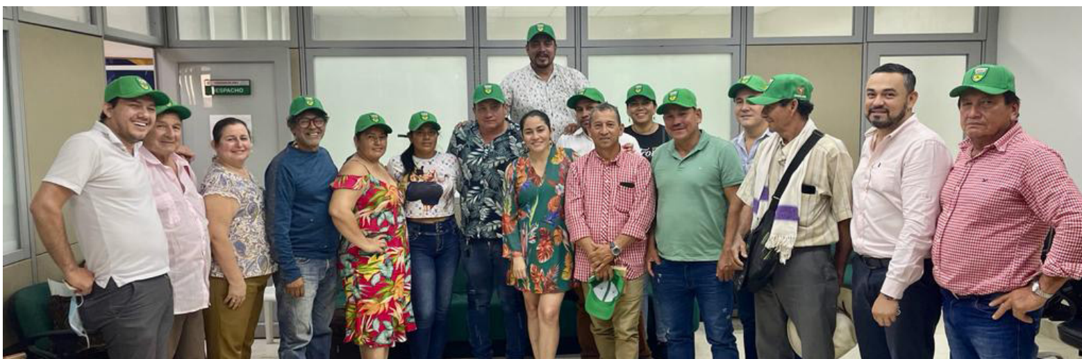
Fortalecimiento de las iniciativas de la Gobernación del Huila