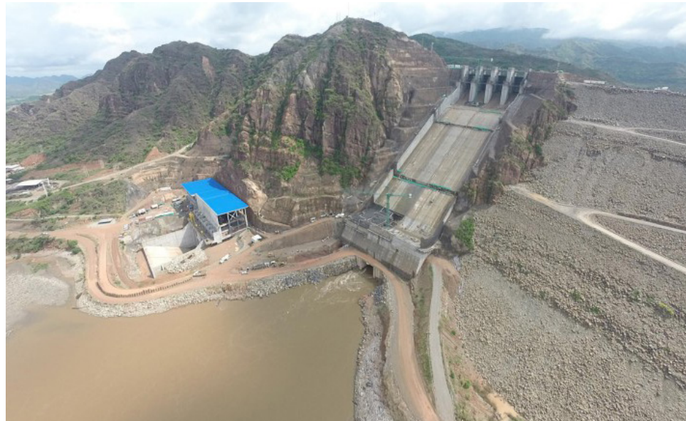
Familias afectadas por la hidroeléctrica reciben respaldo de la ANLA

"Igualmente ha planteado el Gobierno Departamental que las 427 familias deben ser compensadas por ser afectadas en las 2.500 hectáreas que anteriormente Emgesa ahora Enel no ha comprado en su totalidad".