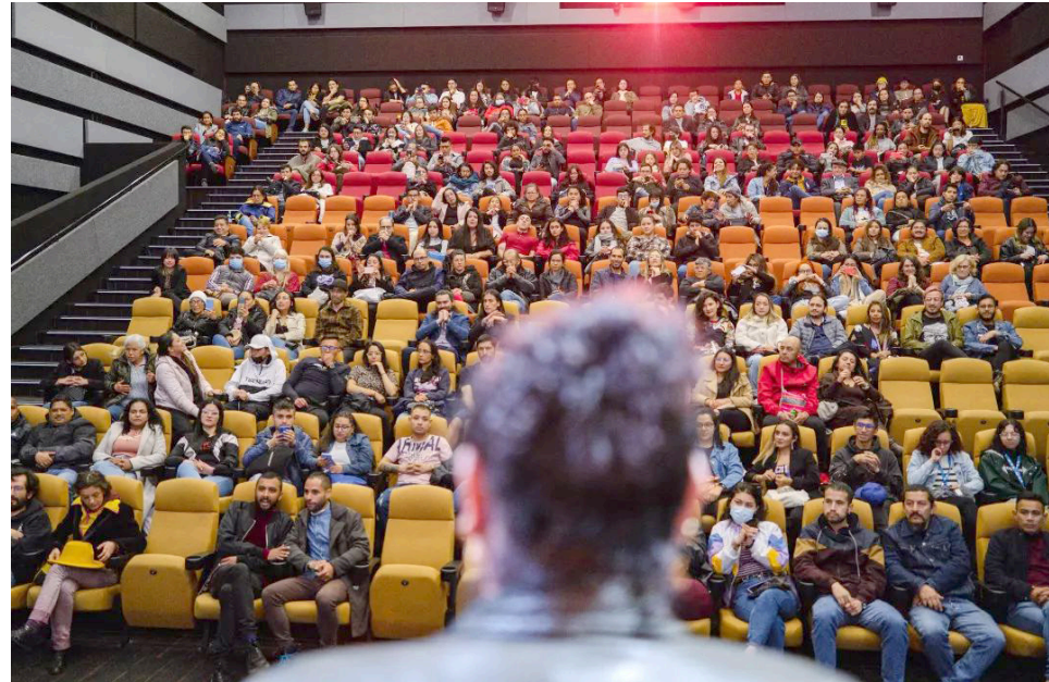
Desde el pasado 6 hasta el próximo 15 de octubre se está disfrutando de 48 largometrajes de más de 30 países.

Dentro de sus objetivos también está conectar a los diferentes agentes de la industria audiovisual en un espacio en el cual se debate y se reflexiona sobre el avance y la producción de la industria local de contenidos.