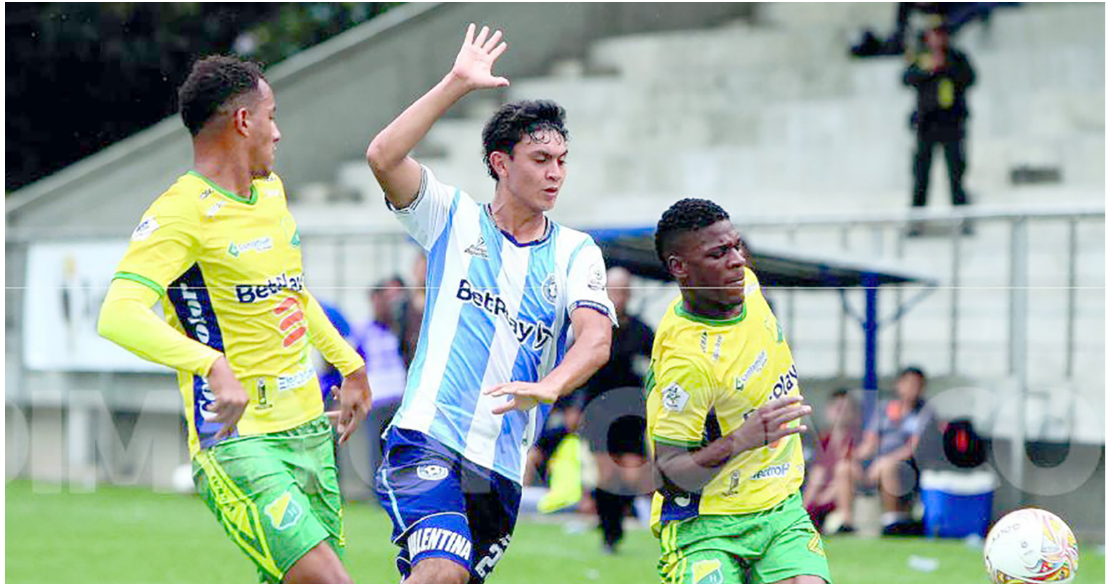
Atlético Huila sigue en camino hacia la primera división

Igualmente, Dimayor dio a conocer las fechas en las que se disputará la fase semifinal del Torneo Bet-Play 2022-2, que comenzará en la fecha 1 el 15 y 16 de octubre, fase de grupos que irá hasta el 5 y 6 de noviembre. Igualmente, la gran final entre los dos equipos que dis-