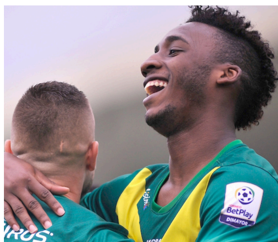
Deportes Quindío será el primer rival en los cuadrangulares.

La primera fecha se jugará los días 14 y 15 de octubre. Los partidos quedaron así: Fortaleza CEIF vs Llaneros, Boyacá Chicó vs Barranquilla. Atlético Huila vs Deportes Quindío y Real Santander vs Tigres.