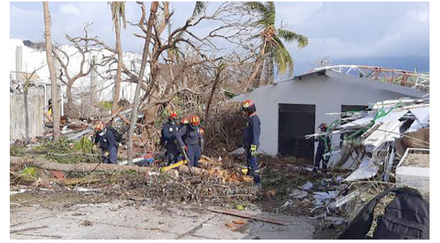
Los estragos de 'Julia'