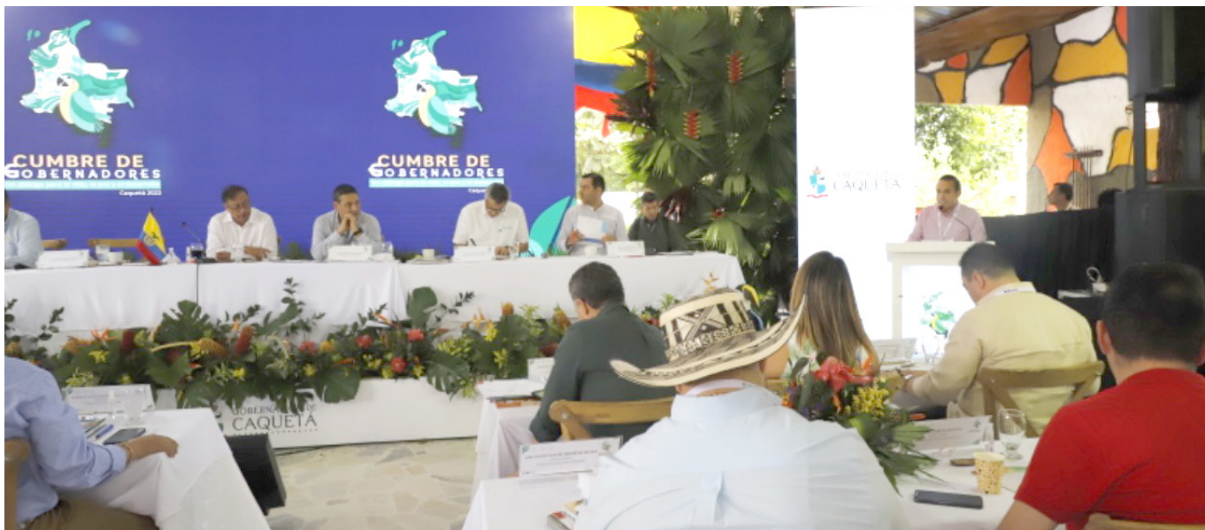
Los gobernadores de los diferentes departamentos, asistentes a la cumbre