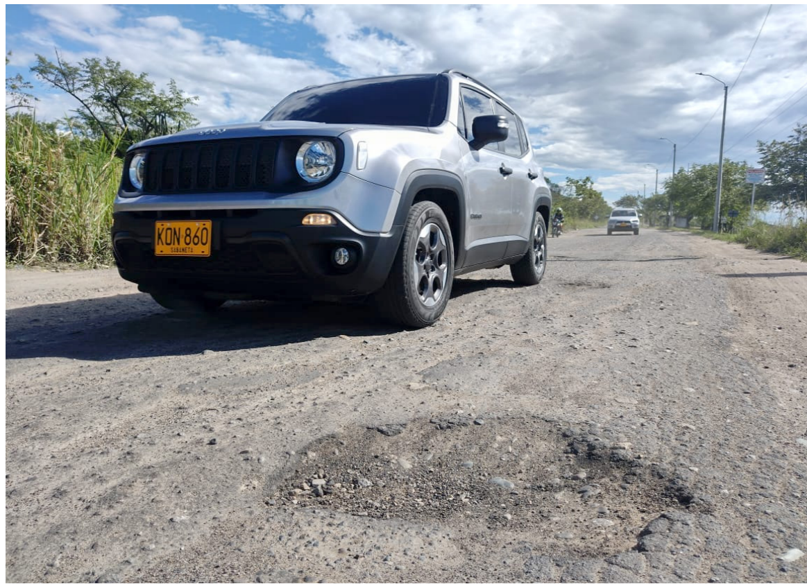
Sigue en mal estado vía al Corregimiento de Fortalecillas.

■ Una vez más los habitantes y quienes a diario transitan la vía que de Neiva conduce al Corregimiento de Fortalecillas piden que les arreglen la carretera que se mantiene en mal estado. Son siete kilómetros desde el Barrio Alberto Galindo hasta el corregimiento, el mal estado se presta para la inseguridad, los accidentes y hasta el sicariato. Insisten que si no hay soluciones vuelven a taponar. Diario del Huila visitó la zona.