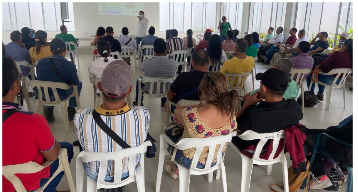
Mesa de trabajo

"Este es un ejercicio de presentación y validación, pero tenemos ya avanzado todo el documento estratégico que tiene los tres componentes principales que son: ordenamiento productivo social de