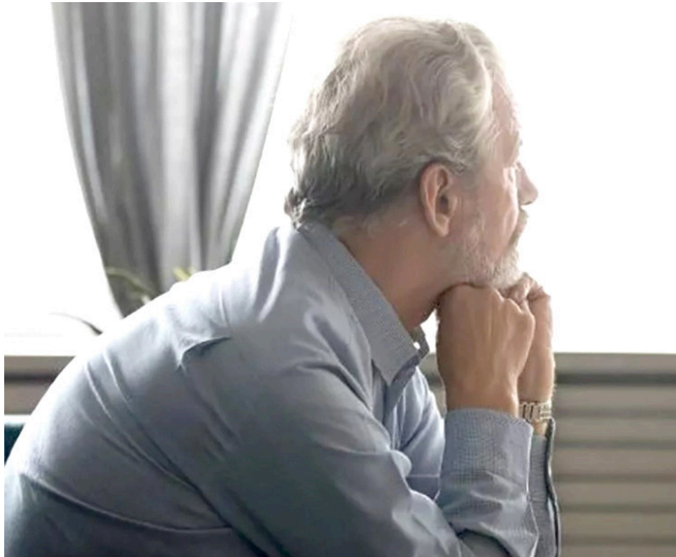
Los síntomas de la depresión pueden incluir pérdida o aumento del peso, trastorno del sueño y problemas de concentración.

■ Las enfermedades crónicas, como la EPOC y la diabetes, pueden generar en los pacientes incertidumbre, desesperanza, y disminuir la confianza en sí mismos de acuerdo con datos de la Organización Panamericana de la Salud.