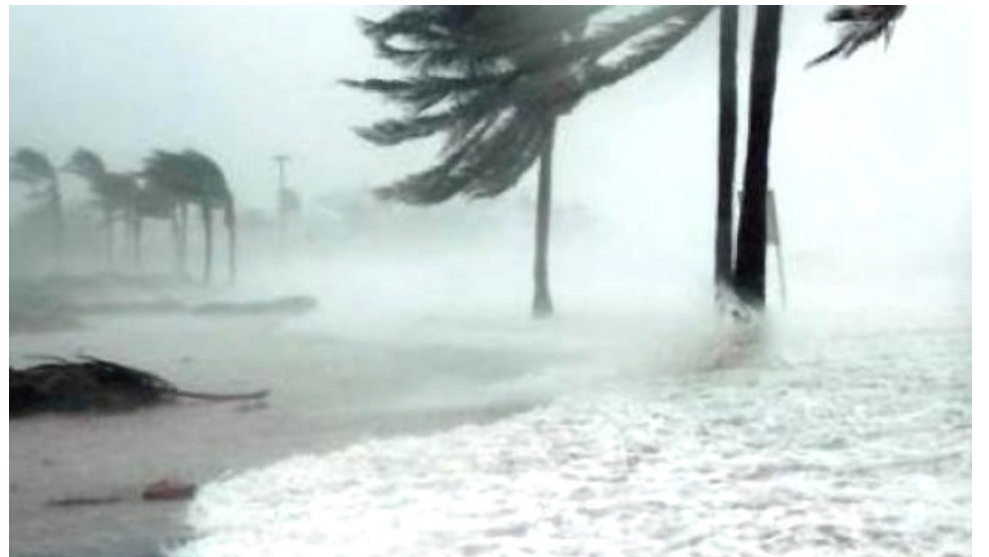
Siguen las alertas en varios territorios.

El departamento se declaró este sábado en calamidad pública por