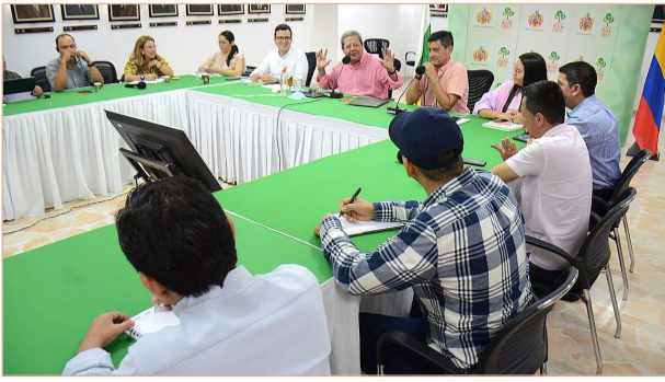
El Huila expuso sus necesidades