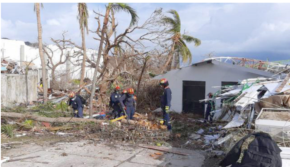
Unidades de Control del Riesgo de Desastres tratan de controlar la situación.

Por otro lado, en el sector de Magdalena-Cauca, hay posibles crecientes súbitas en el río Sumapaz, Lebrija y San Jorge, también hay niveles altos del río Magdalena en el tramo entre los municipios de Gamarra y Tamalameque, entre El Plato y su desembocadura al Caribe. Además, el instituto recomienda poner especial atención al corregimiento de La Peña en el Atlántico, y desde Suán hasta Repelón, también en el Atlántico.