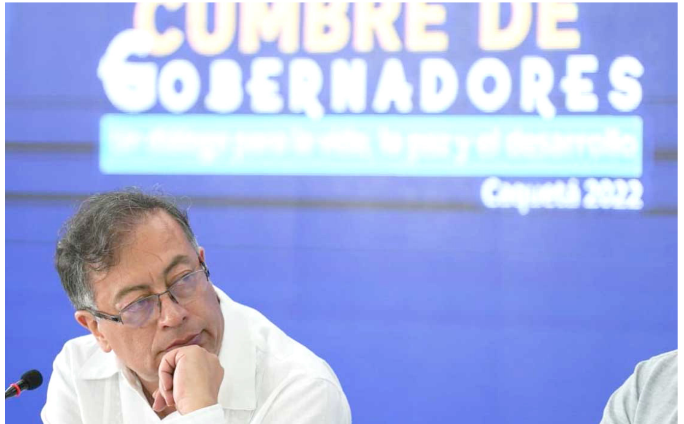
Presidente Petro en diálogo con los gobernadores.

Para el presidente Petro, los acuerdos y los diálogos entre la ciudadanía son fundamentales para saber cómo se construye el país, desde las bases, y como potenciarlos con proyectos de beneficio económico