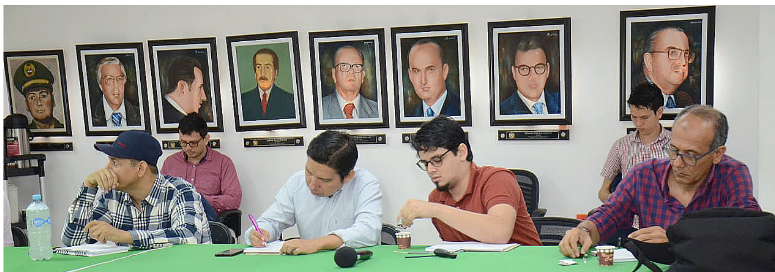
Diálogos Vinculantes con diferentes actores de la región.

Asimismo, se realizarán encuentros sectoriales con las cadenas productivas del departamento.