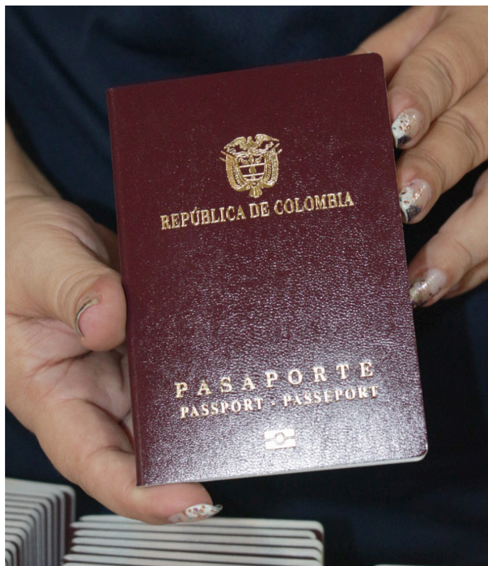
Actualmente para agendar la cita la plataforma continúa habilitándose los domingos a las 12:00 de la noche, es decir, a partir de las primeras horas del lunes.

Durante los últimos tres meses uno de los términos de búsqueda en internet es el ‘Pasaporte’. Esto no sería coincidencia pues de la misma manera han venido incrementando las solicitudes y expedición del documento en el país y el departamento.