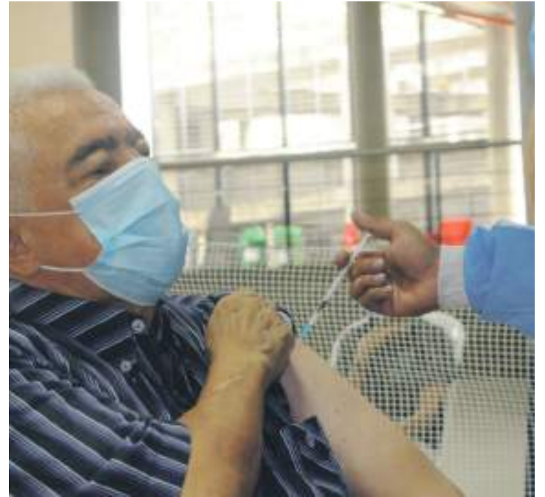
Actualmente 420.000 huilenses, que representan el 37% de la población total objetivo, tiene el esquema completo de vacunación.