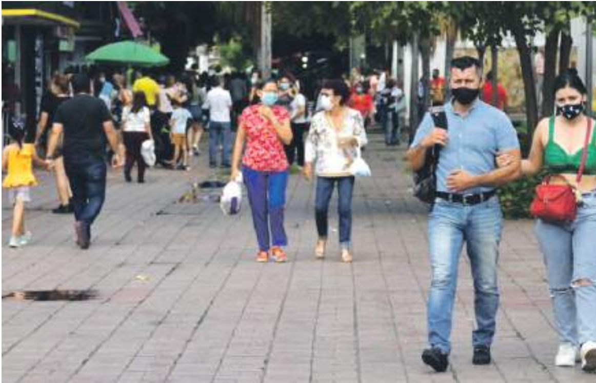
El Secretario de Salud del Huila indica que probablemente estemos en el inicio del cuarto pico en el departamento.