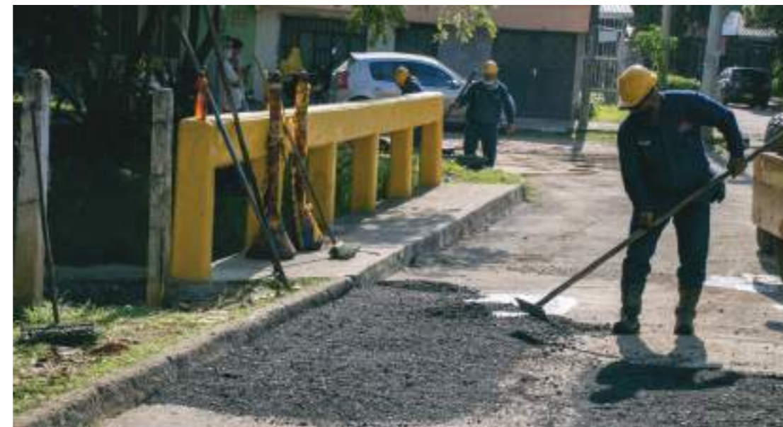
Parcheo con asfalto en la vía del puente.

De igual forma, se realizó el parcheo y reposición de capa asfáltica en la vía aledaña a este puente para que sea una obra totalmente transitable.