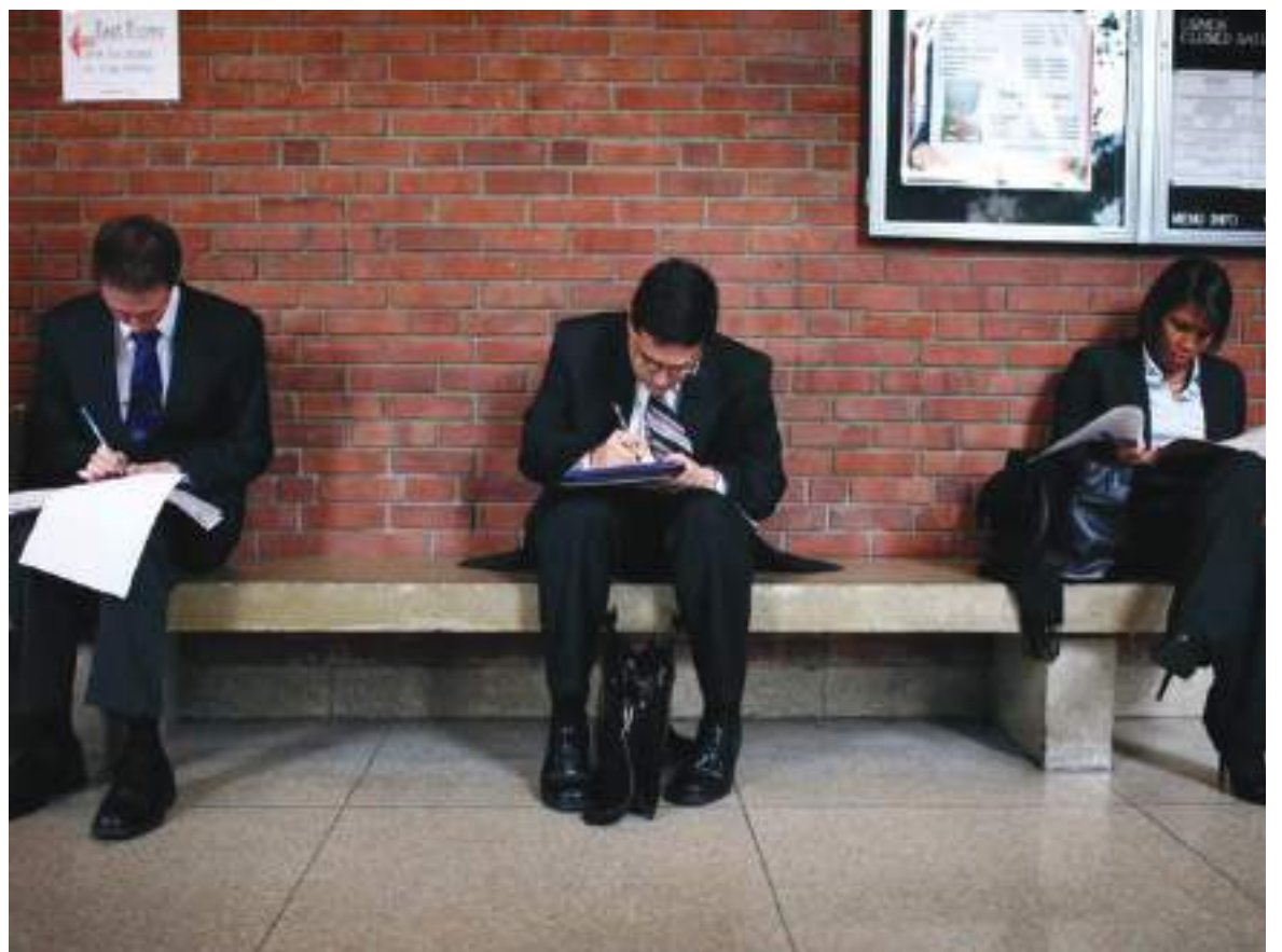
Entre los puestos que se van a ofertar en la feria virtual resaltan los de analistas administrativos y financieros.

Algunas de las compañías que harán parte de este evento que busca emplear jóvenes colombianos están Adecco, Accenture, Acción Plus, Cargill, Enel Codensa, Ernst & Young, Grupo Éxito S.A, Firmenich, Icetex, Mediabrands y SODEXO.