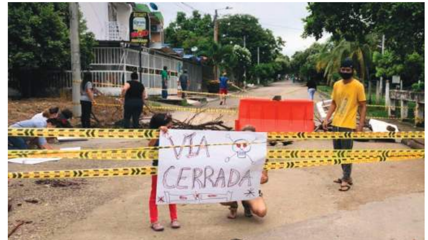
Momento de taponamiento en marzo de este año.

"Nosotros teníamos ese problema desde el año 2019. Desde esa fecha veníamos haciendo solicitudes a la administración municipal para que lo arreglaran. Hoy, por fin es una realidad y estamos agradecidos y contentos".