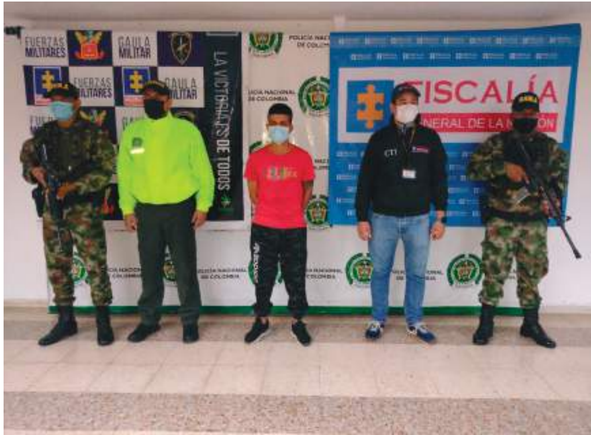
La persona capturada quien registra anotaciones judiciales por los delitos de hurto, tráfico de estupefacientes y porte ilegal de armas de fuego.

Este individuo sería el presunto responsable del asesinato de José Silvestre Alfonso Vaca en el barrio Caracoli.