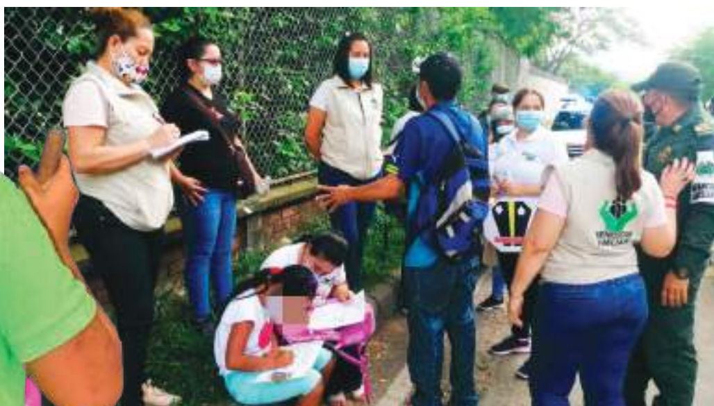
El Icbf ha adelantado diversas jornadas de identificación y caracterización de niñas, niños y adolescentes, establecidas en el plan de acción para este tipo de problemática.