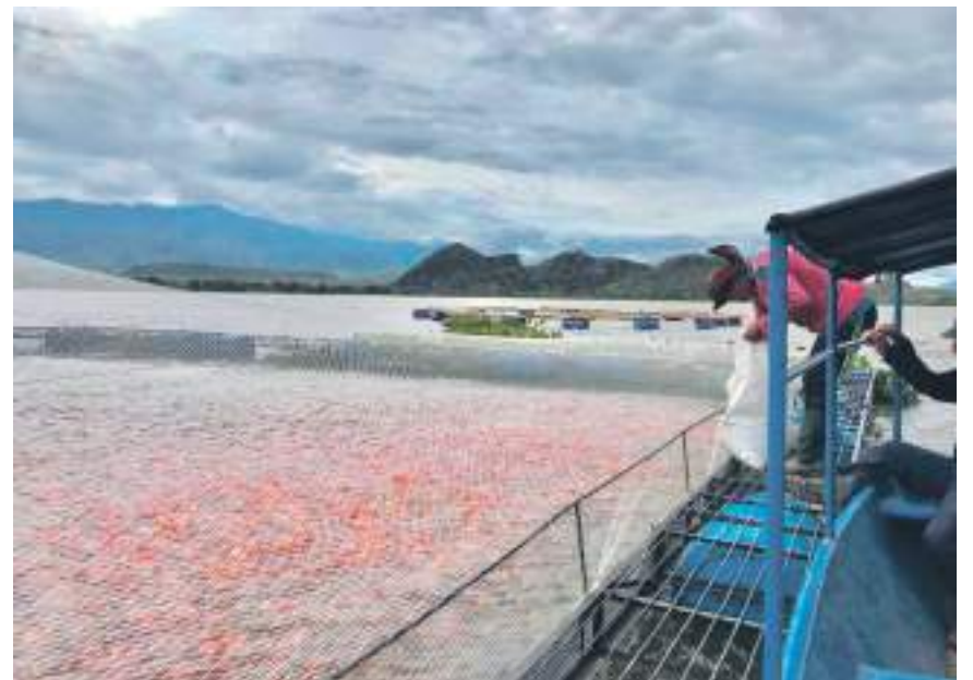
Las autoridades hacen una llamada a las piscícolas para tener todo en orden.