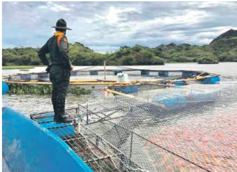
Las autoridades ambientales suspenden siete proyectos piscícolas en el Huila.

Sostuvo además, que en el sector piscícola del departamento