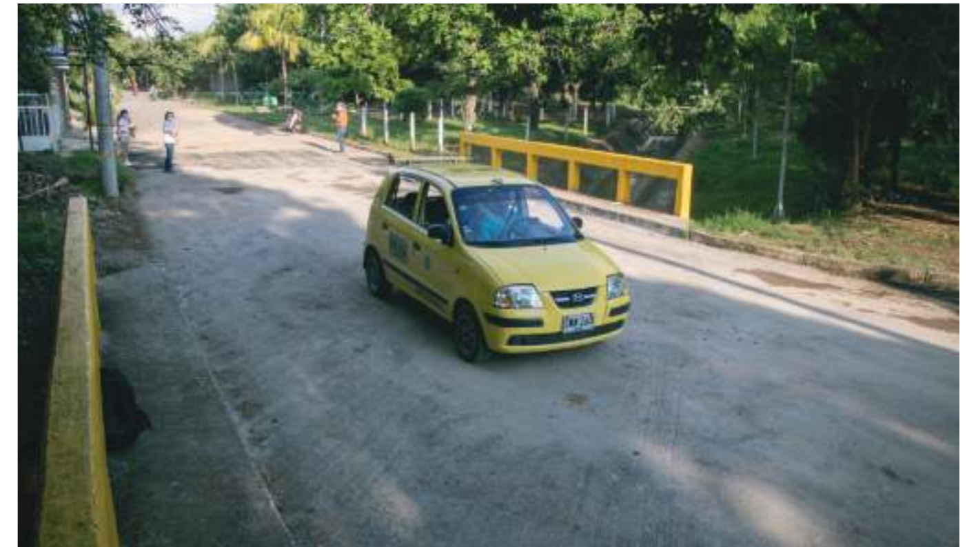
Los vehículos pueden transitar por un puente en buen estado.