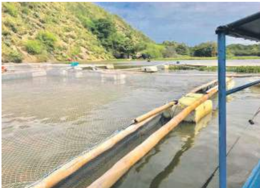
La informalidad en el sector piscícola es bastante.

Las autoridades ambientales del Huila, impusieron en el embalse de Betania, una medida preventiva de suspensión a la actividad piscícola que se desarrollaba en siete proyectos pesqueros instalados en dicho lugar.