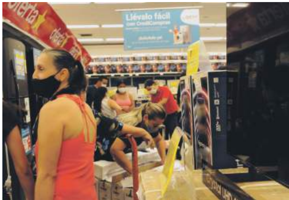
Pese a la reactivación con los protocolos de bioseguridad, la población casi no tuvo en cuenta este último.

El funcionario indicó que se espera a que sea de menor intensidad a los tres picos anteriores, y con menos casos de Covid-19 grave y menor mortalidad, “la población más vulnerable, de mayor riesgo y susceptible a complicaciones, indudablemente es