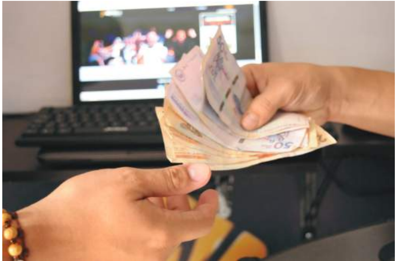
El 70 % del trabajo generado en Colombia proviene de las pequeñas y medianas empresas directamente.

El conjunto de las nuevas empresas creadas en todo el país está conformado principalmente por microempresas 99,5%, seguido por las pequeñas empresas 0,4% y el restante se encuentra en las medianas y grandes empresas 0,03%. Según la Cámara de Comercio del Huila, la tendencia nacional por tamaño se mantiene en el departamento con el 99,98% de