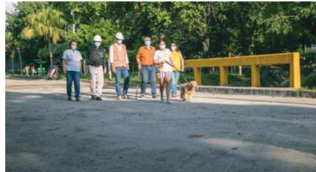
La comunidad se muestra complacida por la obra.