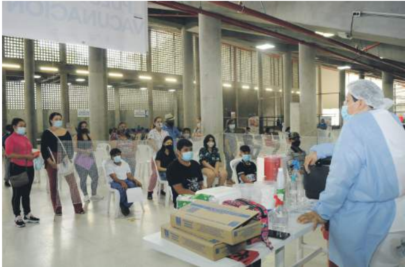
Se espera mayor participación de la población huilense a las jornadas de vacunación.

Frente a lo anterior, se adelantan jornadas de intensificación en colaboración con las empresas, con las instituciones educativas, para que se convoque a la comunidad a acceder con prontitud a