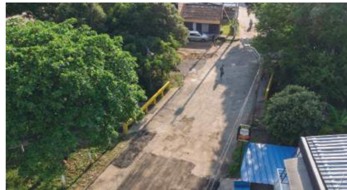
Vista aérea del puente de Ciudad Salitre en el oriente de Neiva.

■ Después de dos años de lucha, los habitantes del oriente de Neiva se volvieron a movilizar por el pasadero ubicado en la calle 22 entre carreras 50 y Carrera 51 A, que permite el acceso a Las Palmas y Pastrana.