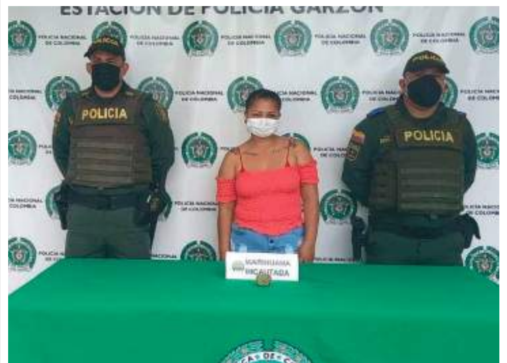
En el registro a la femenina con el sistema electrónico Garrett, dio positivo para que llevara algo oculto.

En los planes de registro y control que se realizan junto con el personal del INPEC para el ingreso de las visitas al centro penitenciario y carcelario de la capital diocesana del Huila, fue capturada una mujer pretendiendo el ingreso de varias dosis de marihuana adheridas a su cuerpo.