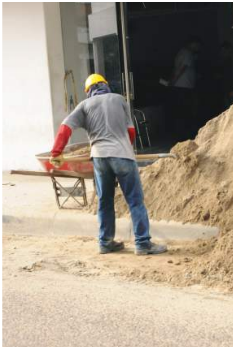
Una de las propuestas que ha surgido por parte del empresariado es crear un 'salario mínimo empresarial', con el objetivo de apoyar a la población de menores ingresos.

A la hora de concertar el salario mínimo mensual legal para el próximo año, un factor clave es la inflación causada, que ha venido en aumento desde abril, luego del choque del paro nacional y tras las alzas en los precios de los alimentos y de las materias primas, debido a factores internos y externos, como los problemas en las cadenas de logística inter-