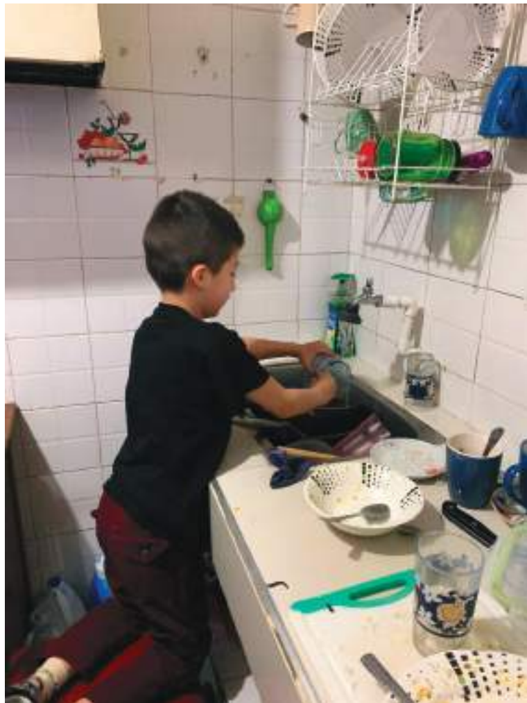
La tasa de trabajo infantil se ha venido reduciendo año a año.

El Dane también estima una medida de trabajo infantil ampliado por oficios del hogar. Bajo estas estimaciones se tienen tasas de trabajo infantil menos alentadoras comparativamente y en términos absolutos. Se estima que 9,1% de los niños y jóvenes trabaja mientras el 11,5% de las niñas y jóvenes lo hacen, en contraste al 6,3% y el 3,2% estimado respectivamente para cada grupo sin tener en cuenta la corrección por oficios del hogar.