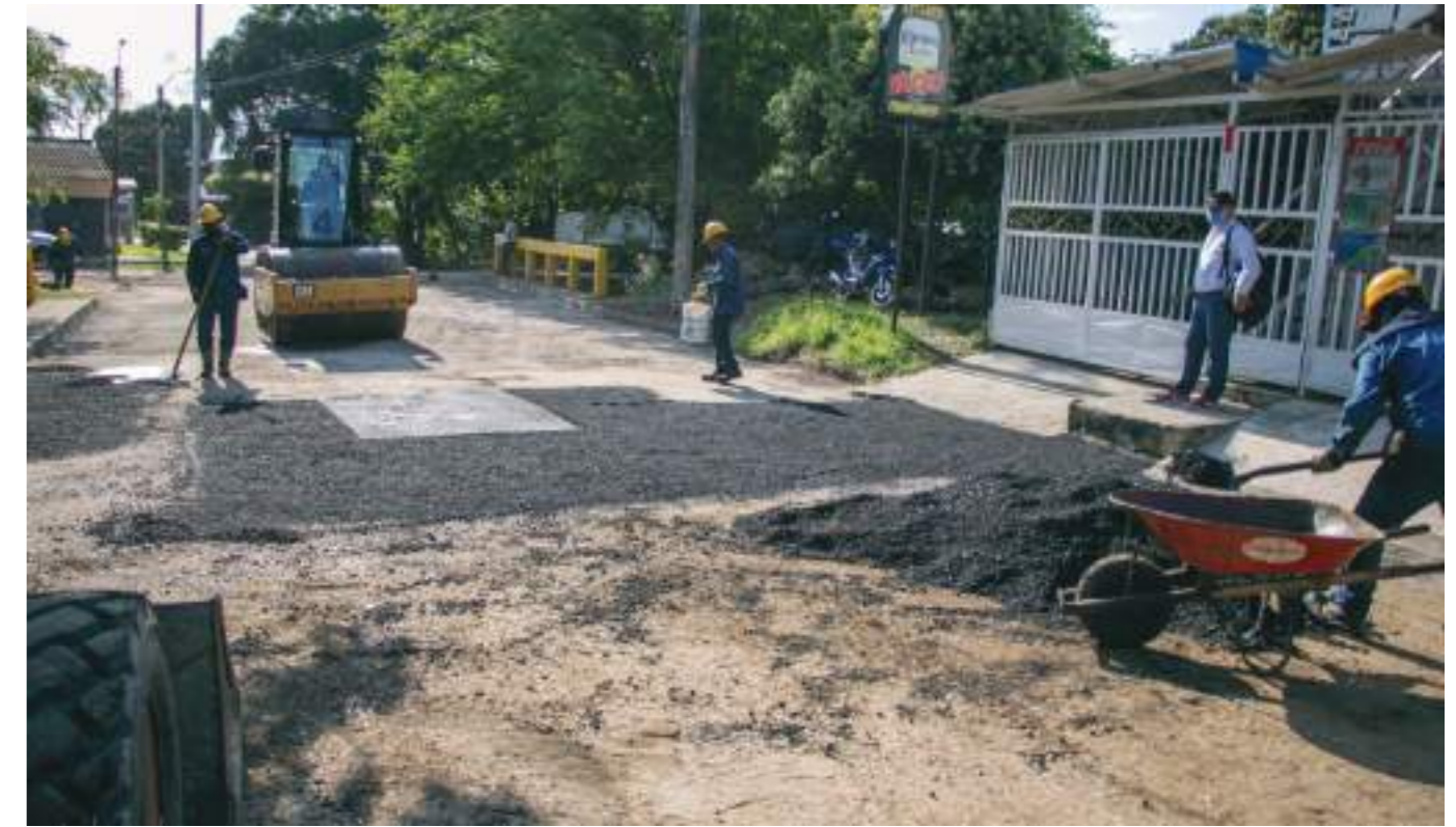
La vía aledaña también fue objeto de arreglo y pavimentación.

En general, ese es el sentimiento de quienes por años y por meses debieron esperar por un puente en buen estado y ahora pueden entrar y salir de su sector con tranquilidad por una vía con una obra que no amenaza peligro ni riesgos para los peatones y automotores.