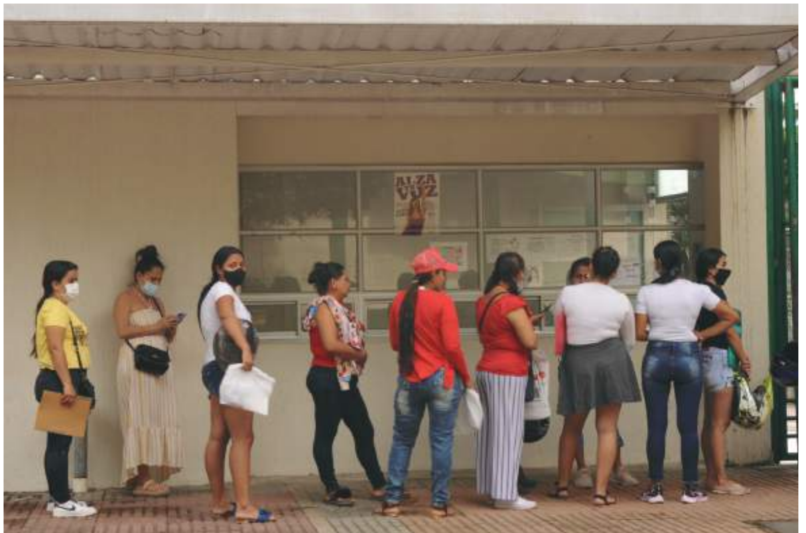
El norte de México vivió con ilusión la apertura de la frontera con Estados Unidos tras 20 meses de cierre por la pandemia de coronavirus.

■ La Fundación Howard G. Buffett anunció la donación US$12,5 millones para lanzar el Programa de Empleabilidad para Jóvenes en asociación con la Agencia Presidencial de la Cooperación Internacional y AmCham Colombia.