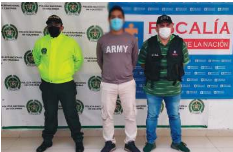
Es de resaltar que según información de algunos habitantes del sector, este sujeto sería el presunto expendedor de este tipo de sustancias en la zona.

Luego de conocer la denuncia interpuesta por la víctima el pasado mes de enero, los investigadores iniciaron con la recolección de evidencias que le permitieran a la Fiscalía General de la Nación, tener las razones fundadas para hacer la solicitud de la orden de captura ante un Juez de la República, por los delitos de acceso carnal abusivo con incapaz de resistir.