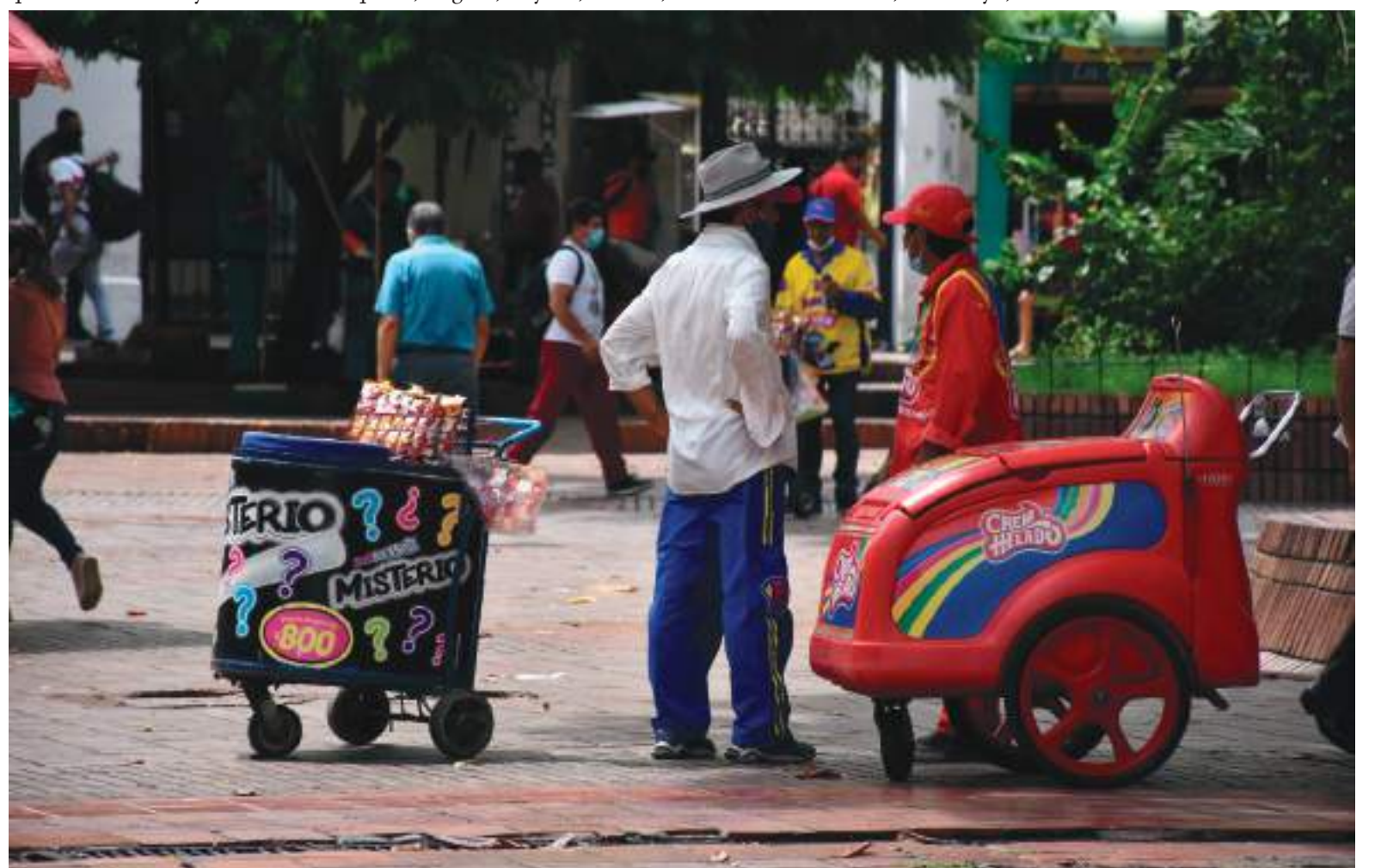
La Sala de Análisis del Riesgo para la vigilancia epidemiológica del evento Covid-19 reportó 38 contagios nuevos en 7 municipios.

De igual manera, se detectó una alza importante en el ritmo de vacunación, ya que para el día se aplicaron un total de 366.200 dosis, de las cuales 81.835 corresponden a la segunda inyección mientras que otras 27.561 fueron monodosis.