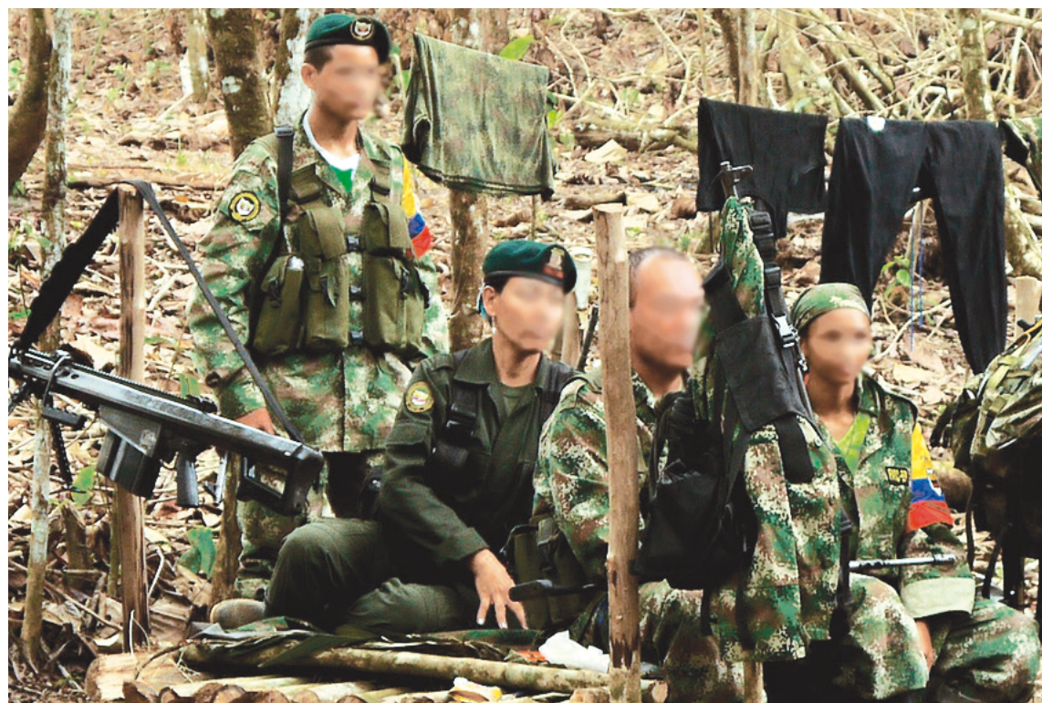
Los victimarios muestran videos de otros niños, ya en sus ‘filas’.

Ya para finalizar, el declarante, hizo un llamado para que las instituciones gubernamentales, estén pendiente y brinden ayuda a las víctimas, quienes se encuentran solas en los territorios y a merced de los ‘armados’. La Fiscalía, investiga seis denuncias de esta problemática.