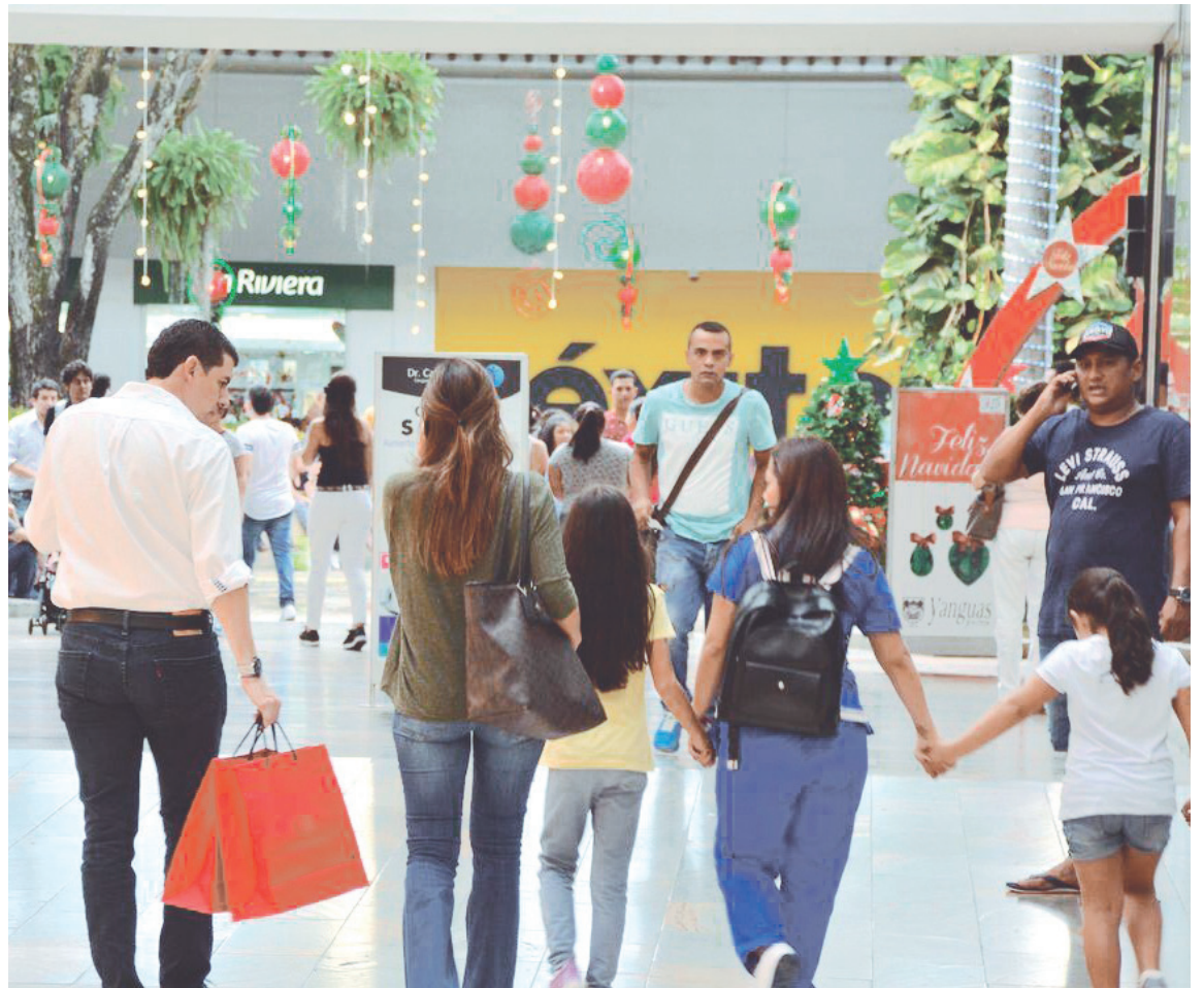
Centros comerciales registran disminución de visitas y compras con tarjetas de crédito en octubre.

Mayores impuestos, sumados a los síntomas de recesión, a la inflación de dos dígitos que afecta con mayor dureza a los informales y a los desempleados, y la perspectiva de un proyecto de reforma laboral del gobierno que destruye empleos, darán como resultado un 2024 marcado por la incertidumbre y desconfianza de consumidores y empresarios.