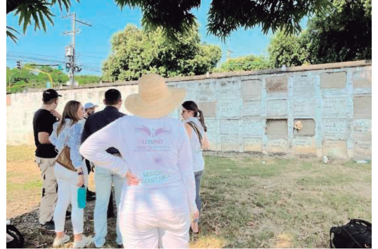
Son cientos de familiares que aún esperan respuestas ante sus desaparecidos.

posibles ubicaciones de los restos humanos, no solo el Monumento 14, sino de todo lo que encontremos en el cementerio central”.