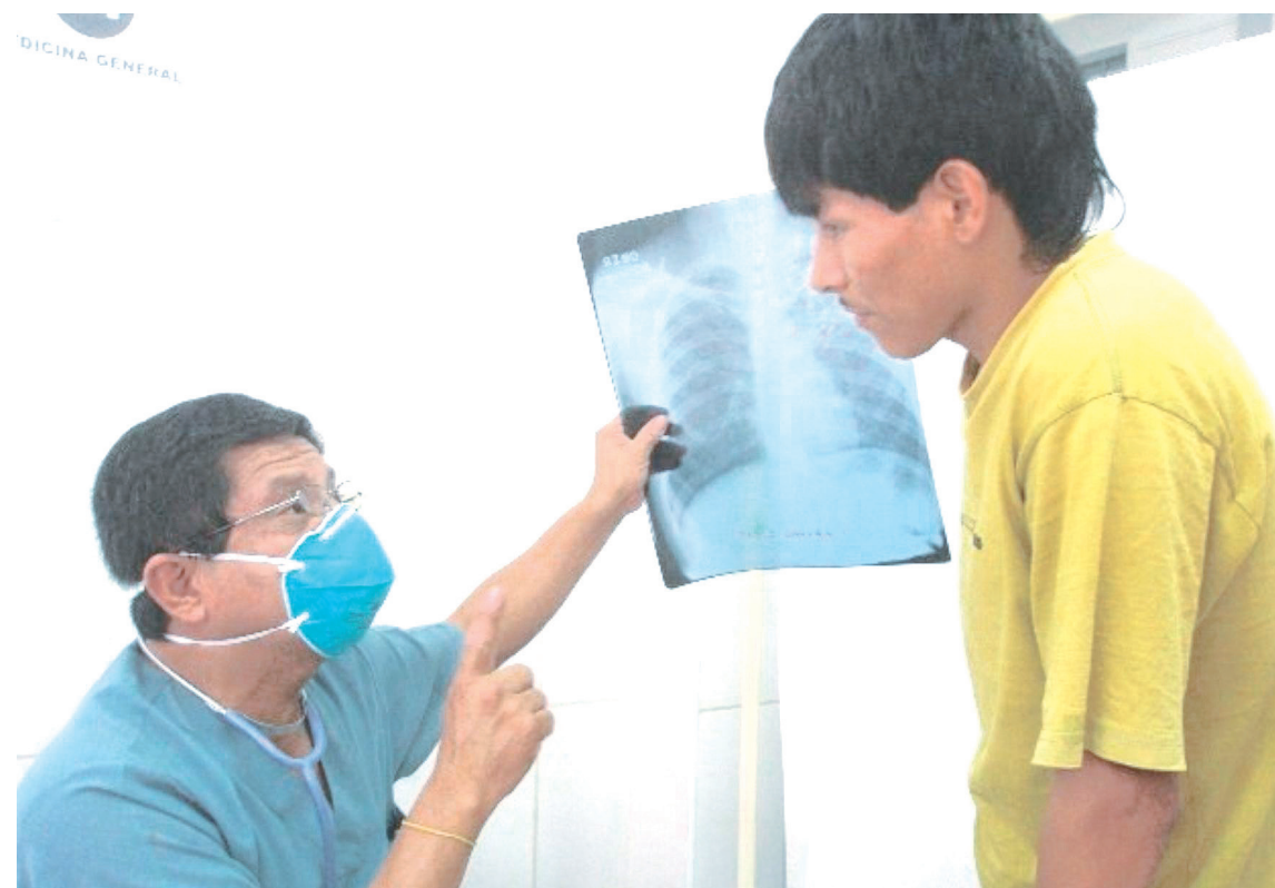
Cuatro detenidos fueron trasladados al Hospital Universitario.

Asimismo, el Comité Internacional de la Cruz Roja, agrega que entre las personas actualmente detenidas, algunos sectores como los adultos mayores, las personas con discapacidades o con afectaciones de salud mental ven su situación de vulnerabilidad agravada por falta de un enfoque diferencial. Para las mujeres cabeza de familia detenidas, la prisión genera la desintegración de vínculos afectivos con efectos profundamente negativos en los hijos menores de edad a causa de la alteración de su formación educativa y la multiplicación de los factores de exclusión.