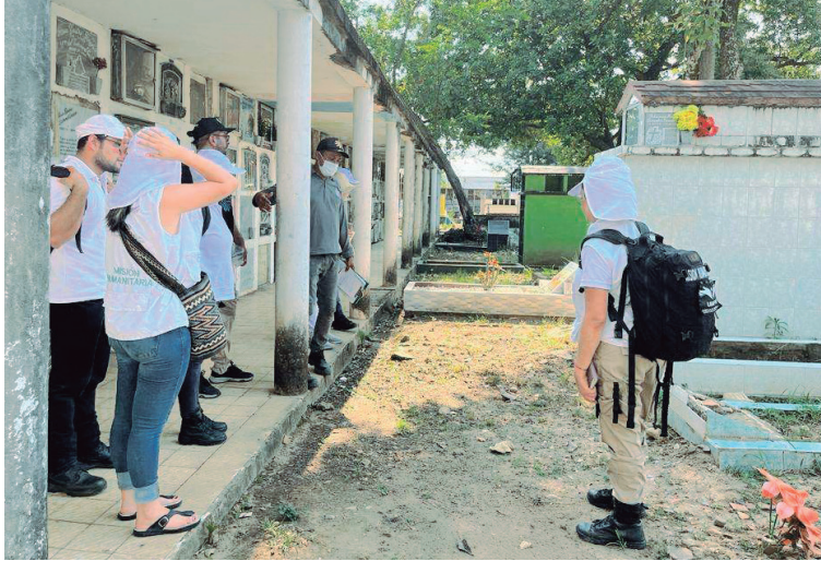
El cementerio central de Neiva, viene siendo intervenido.

La intención visibilizar este flagelo, es que nunca más se vuelva a repetir en ningún rincón del país y el mundo. Aseguró que, “Este trabajo de la Unidad de Búsqueda de Personas Dadas por Desaparecidas, está en la primera fase que es la de la caracterización y aquí lo que ellos están haciendo con todo un equipo especializado, básicamente es identificar las