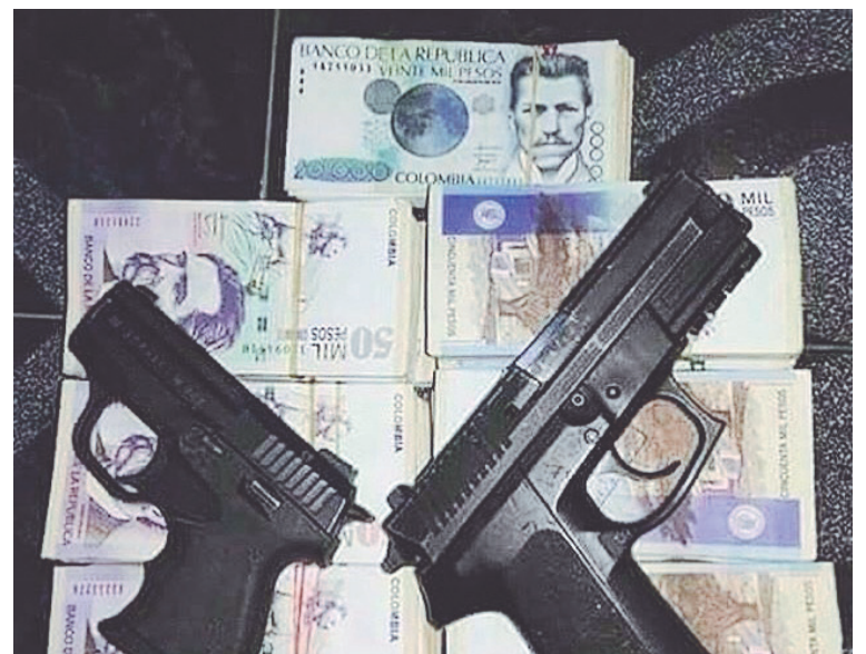
Los reclutadores los ‘seducen’ mostrándoles armas de fuego y dinero.

Cuando el infante, le indica que se encuentra estudiando: “el reclutador, le dijo que la escuela no servía para nada y si él quería podría llegar a comprarle dos o tres casas