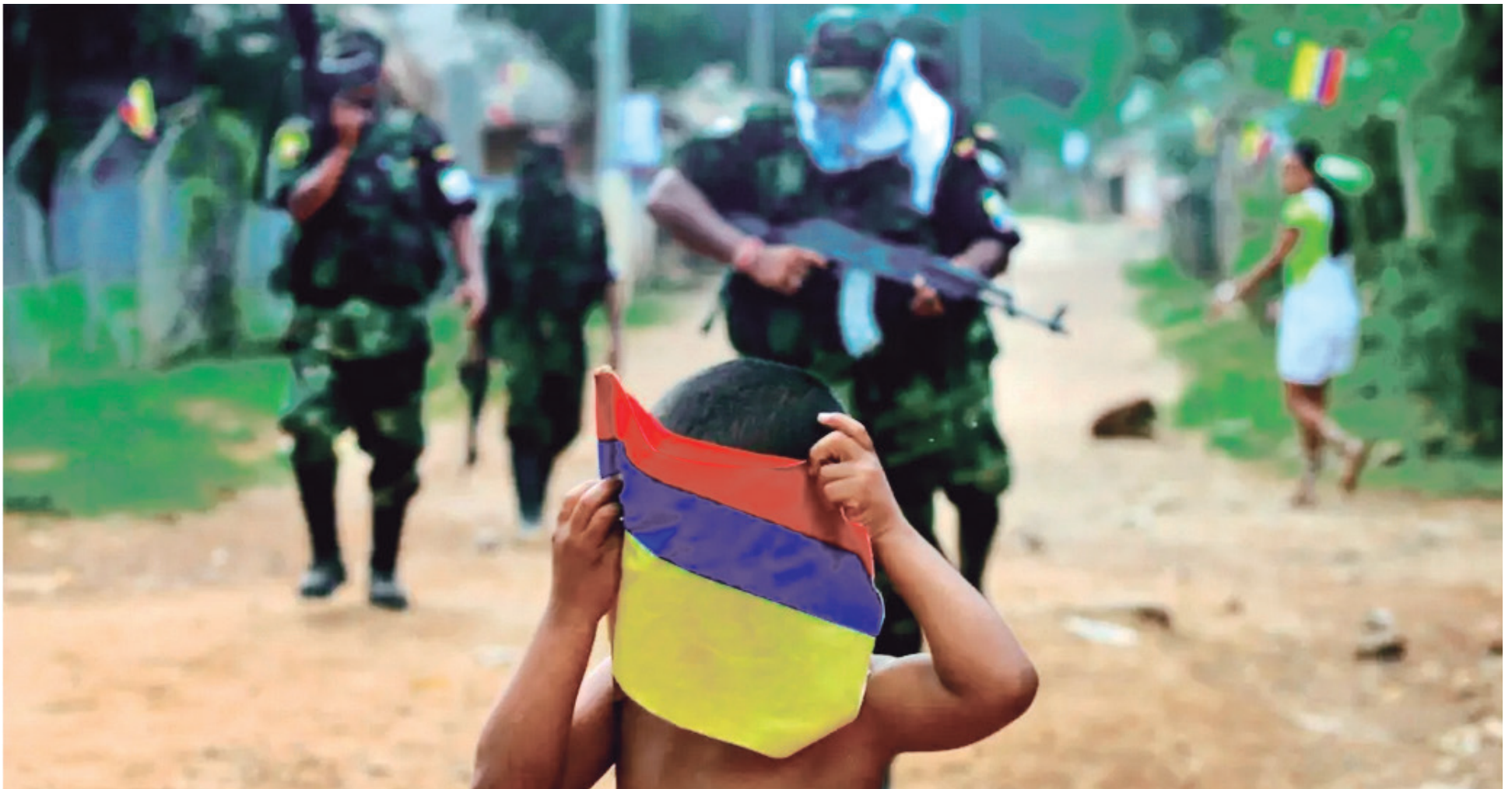
Hay seis investigaciones por reclutamiento forzado en el Huila.

Un niño de 12 años de edad, al que llamaremos ‘Diego’ para no revictimizarlo, ni ponerlo en riesgo, fue abordado por un reclutador perteneciente a un grupo armado y a causa de los ofrecimientos (dinero y armas) dados por el sujeto, el niño ha perdido el interés en el estudio. Y manifiesta que se quiere ir para la guerrilla, porque va a ganar mucho dinero.