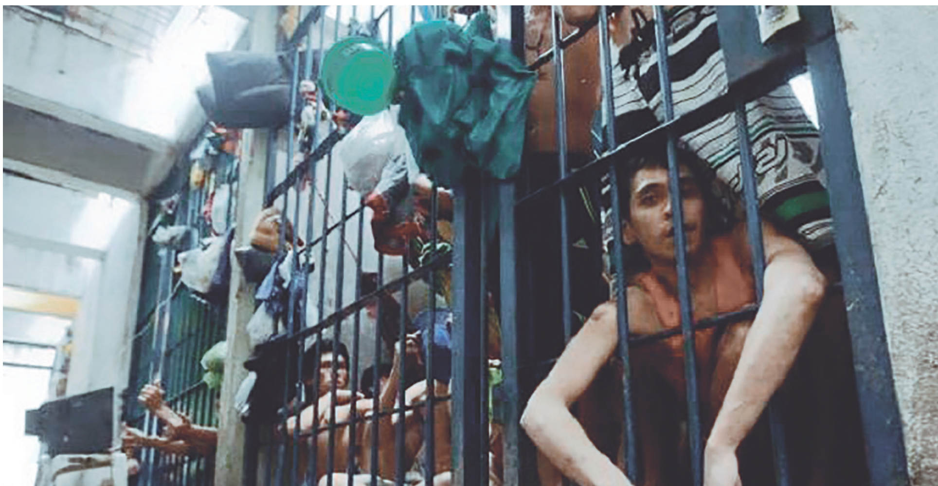
Alarma por crecimiento de reclusos con tuberculosis.

Desde la Personería de Neiva, muestran su preocupación por el aumento de casos de detenidos con tuberculosis en la Cárcel de Neiva, e indican que si es necesario hacer restricciones para evitar el contagio, pues se deben realizar. Cuatro de los reclusos más graves, fueron trasladados al Hospital Universitario Hernando Moncaleano.