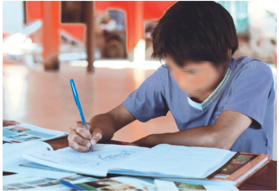
El niño ya perdido su interés en el estudio.

a los familiares. El sujeto le dijo que es mejor dejar la Institución Educativa y que se fuera con ellos, quienes lo van a estar esperando y que va a ganar suficiente dinero?”