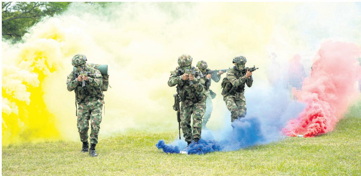
Imagen del día

La convocatoria de incorporación que realiza el Ejército a jóvenes. Ejército invita a los jóvenes huilenses a definir su situación militar del 1 al 17 de noviembre un total de 420 hombres y 36 mujeres, prestarán su servicio a la Patria.