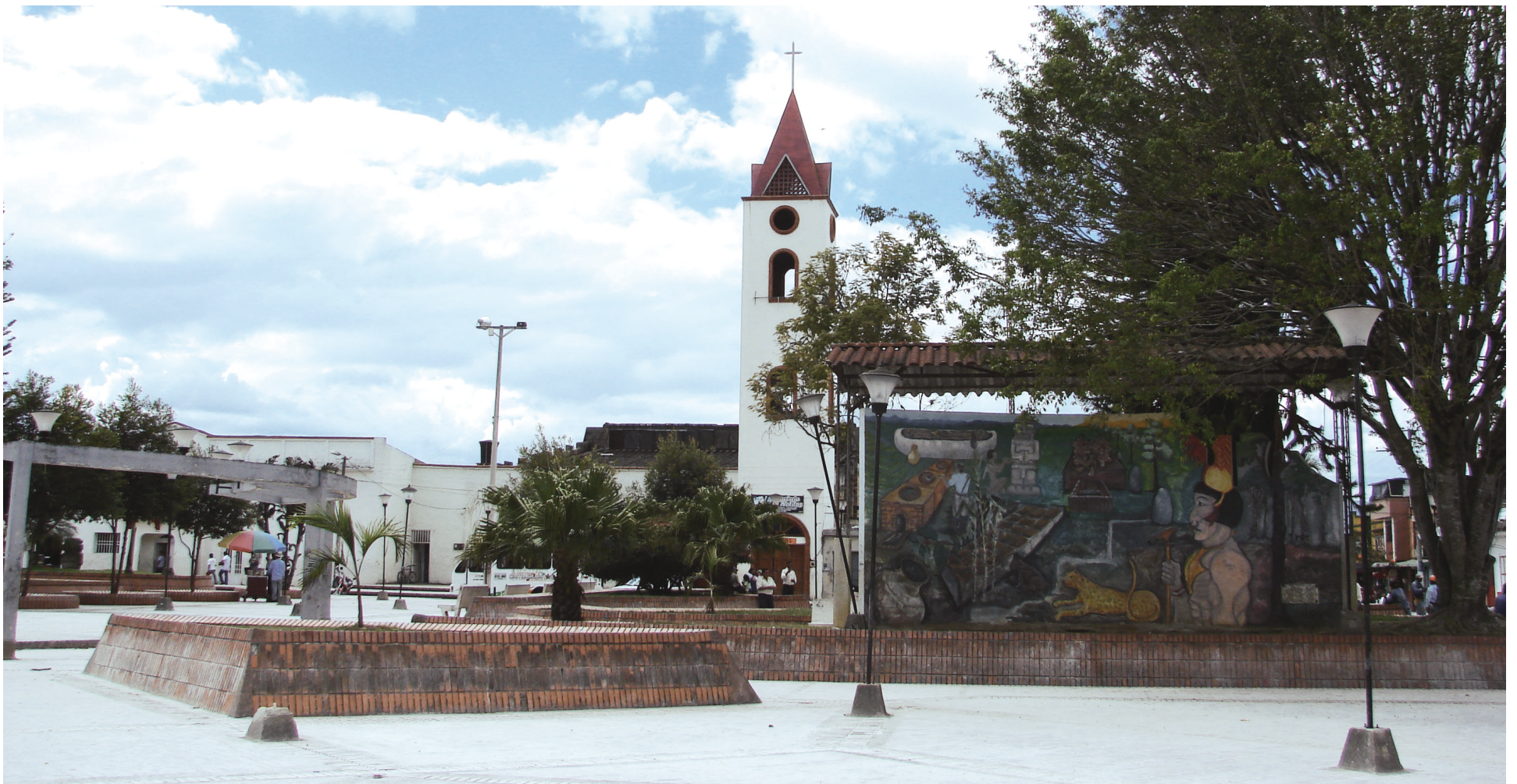
El informe destaca las irregularidades financieras en el Municipio de Isnos y la E.S.E. San José.

La Contraloría halló responsable fiscal y disciplinariamente al municipio de Isnos por no ejercer función de fiscalización en cuanto al recaudo de las estampillas Pro-cultura, adulto mayor y Pro-deportes, de los contratos entre la E.S.E. San José y proveedores de bienes y servicios.