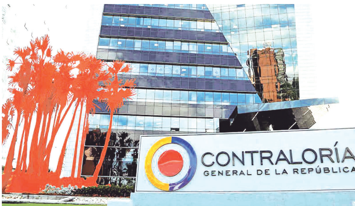
El órgano de control confirmó un hallazgo administrativo con connotación fiscal y disciplinaria para el Municipio de Isnos.