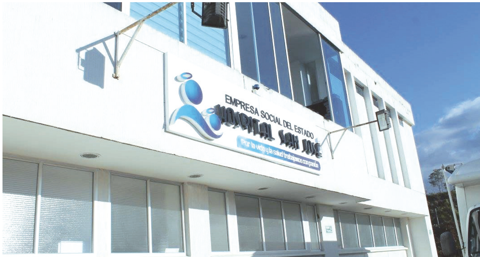
La denuncia presentada ante la Contraloría en febrero de 2023 condujo a una auditoría especial, revelando presuntas omisiones en el recaudo de impuestos por parte de la E.S.E. San José.

gro, enfrenta un hallazgo administrativo con incidencia disciplinaria, ya que se le atribuye el incumplimiento de los deberes de recaudo de las estampillas Pro-cultura, estampillas para el Bienestar del Adulto Mayor y la estampilla tasa Pro-Deportes.