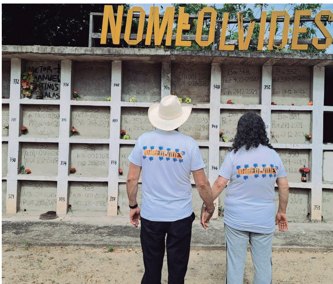
La intervención de viene realizando desde el mes de febrero.

La Unidad de Búsqueda de Personas dadas por Desaparecidas presentó un histórico de los hallazgos que ha revelado la investigación sobre el Cementerio, los mecanismos para aportar información y contribuir en la identificación de cuerpos a partir de pruebas genéticas y entrevistas con fines forenses.