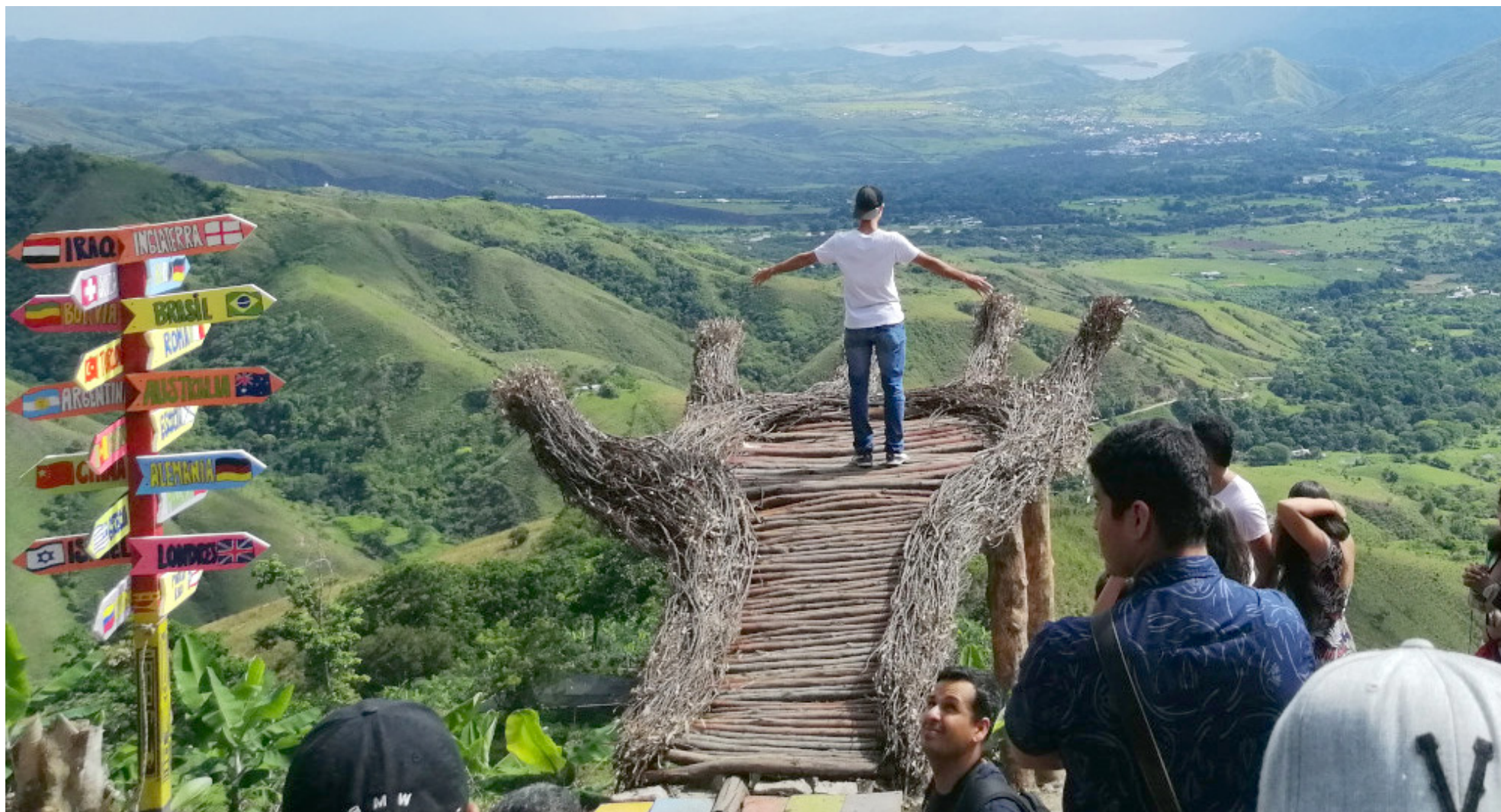
El IX Encuentro Iberoamericano de Turismo Rural se llevará a cabo del 27 de octubre al 1 de noviembre en el Huila.

■ El departamento del Huila se encuentra en la antesala de un acontecimiento trascendental en la historia del turismo rural y sostenible en Iberoamérica: el IX Encuentro Iberoamericano de Turismo Rural. Este evento, bajo el lema “Turismo y Paz”, se llevará a cabo del 27 de octubre al 1 de noviembre y promete redefinir la forma en que se vive y se comprende el turismo rural en la región.