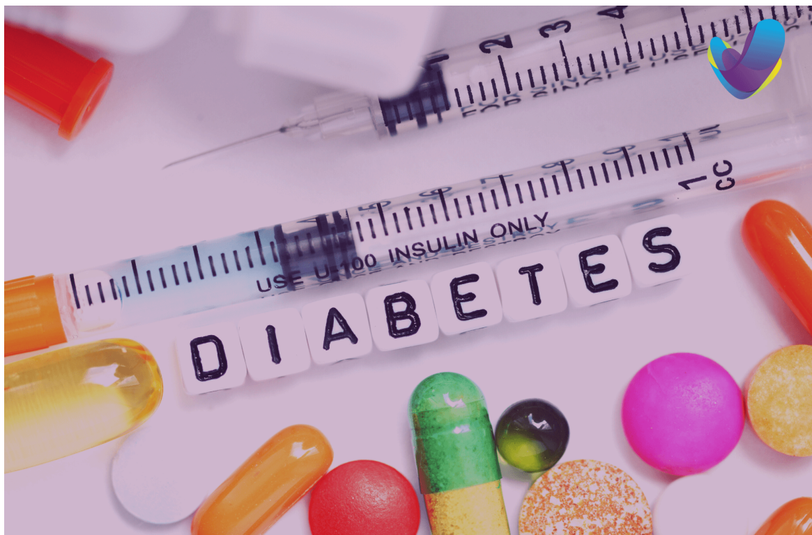
La diabetes es una enfermedad muy grave.

profesionales en el control y seguimiento de las complicaciones renales de la diabetes; la necesidad de protocolizar el abordaje clínico; y fomentar el papel activo del paciente.