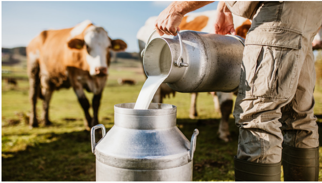
El mal momento de los lecheros en el Huila