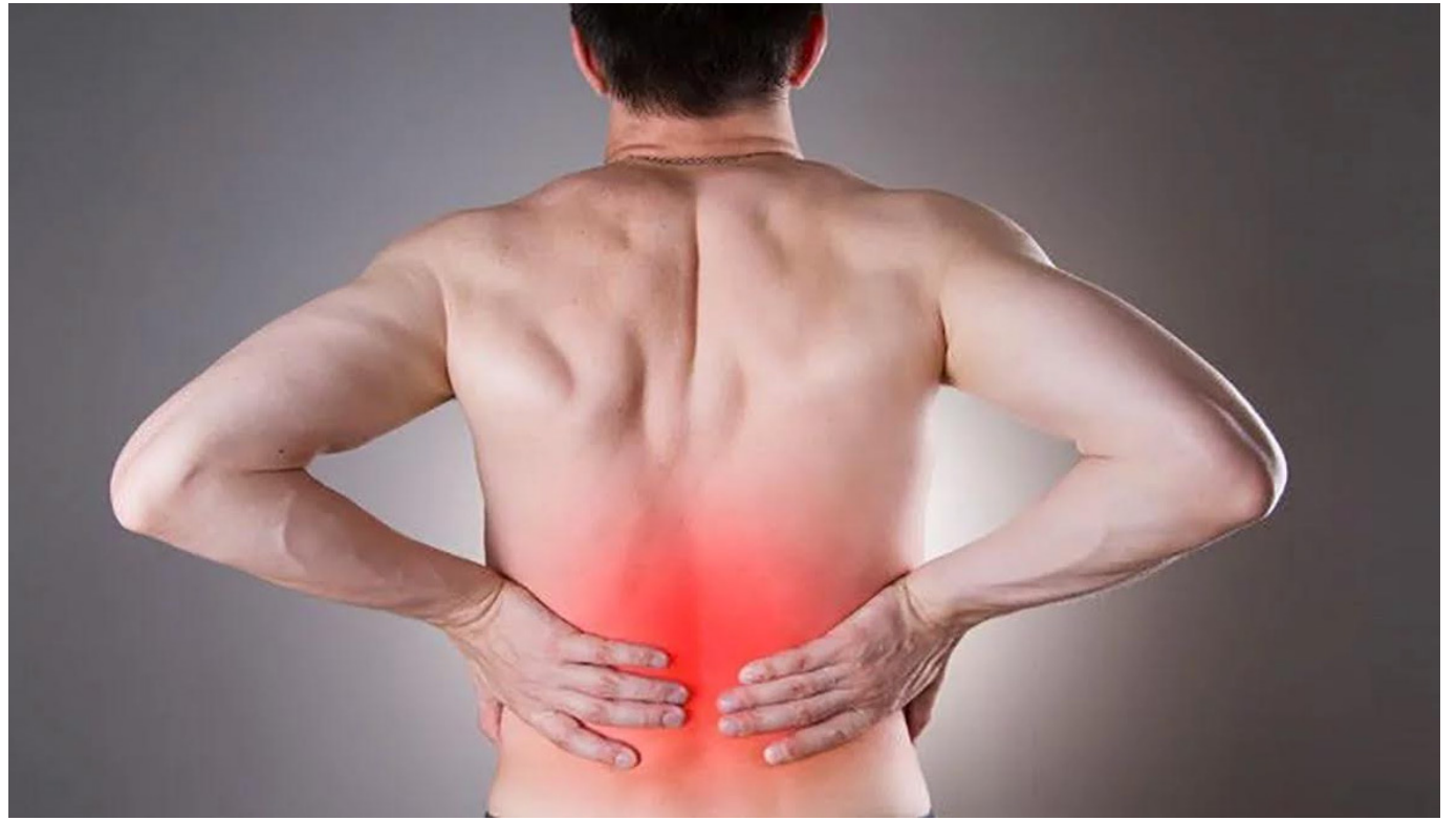
Uno de los síntomas del cáncer de riñón es el dolor abdominal.

Los expertos han señalado que la detección precoz de la ERC es una prioridad sanitaria de primer orden para establecer estrategias de prevención de la progresión a estadios más avanzados de la enfermedad y de sus complicaciones.