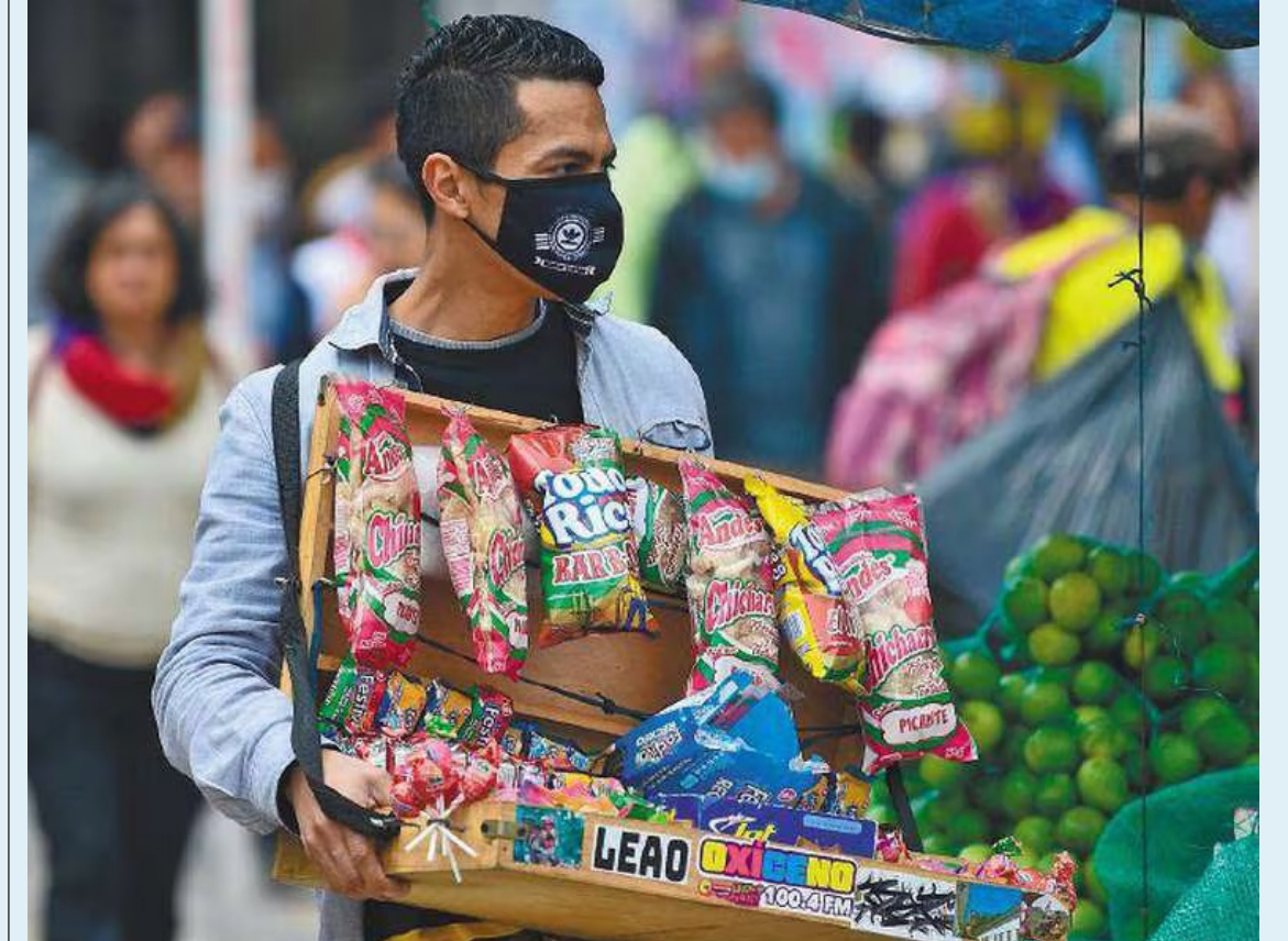
La mayoría de los trabajadores informales en Colombia son hombres.

En el informe, la entidad dio a conocer lo que pasa en dos grupos de ciudades. Para las 13 ciudades y áreas metropolitanas, esta proporción fue 41,2%, lo que representó una disminución de 0,8 puntos porcentuales.