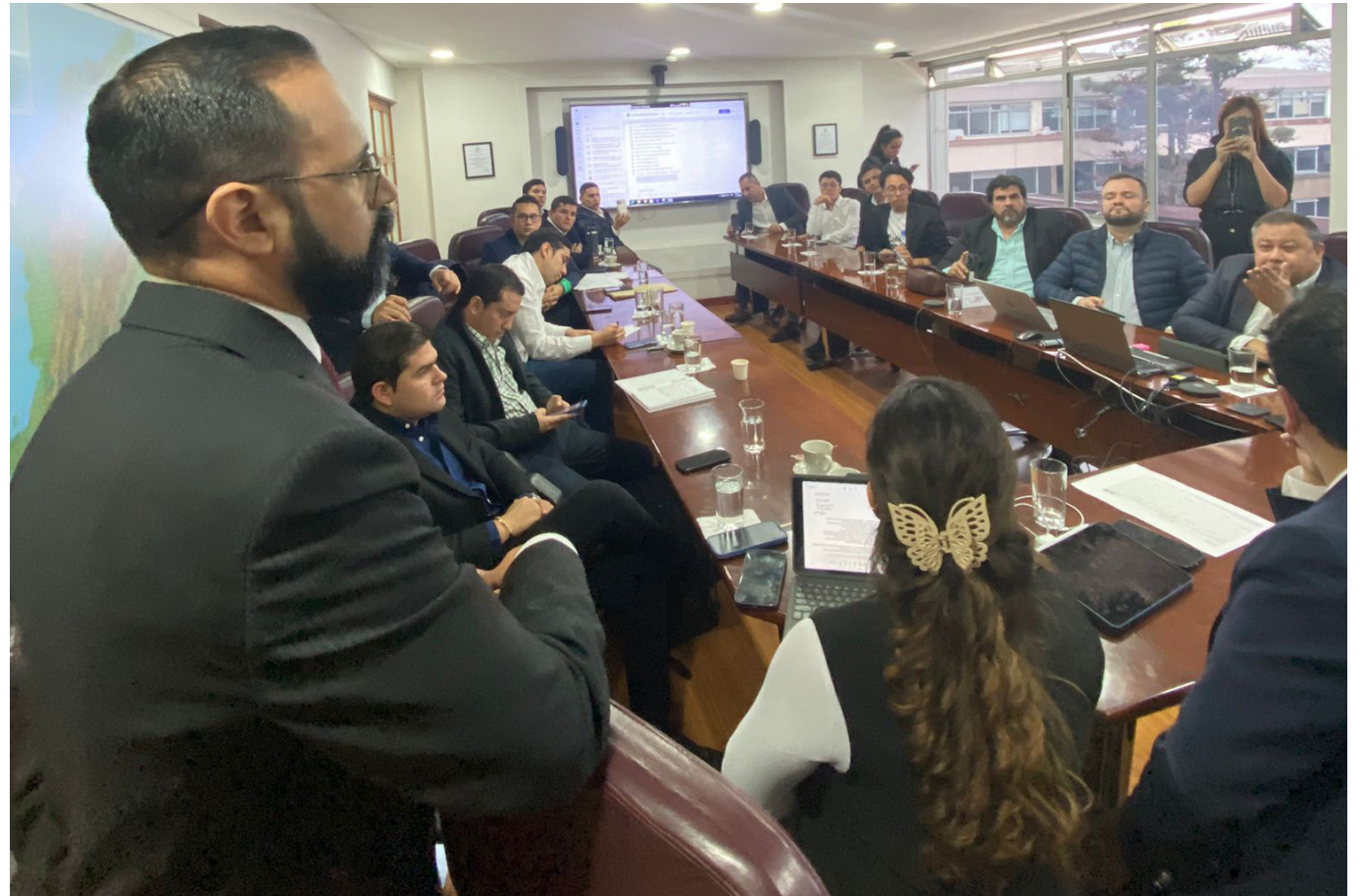
Se reunieron con el ministro de Minas y Energía, Andrés Camacho.

El colectivo propuso como objetivo principal: “que en la próxima junta directiva de Electrohuila, se reconsidere la opción tarifaria y de modulación conforme a la Resolución 101028 del 2023, para modificar los meses de recuperación del saldo acumulado de opción tarifaria. Sin olvidar, que ésta podrá ser ajustada hasta por 120 meses”.