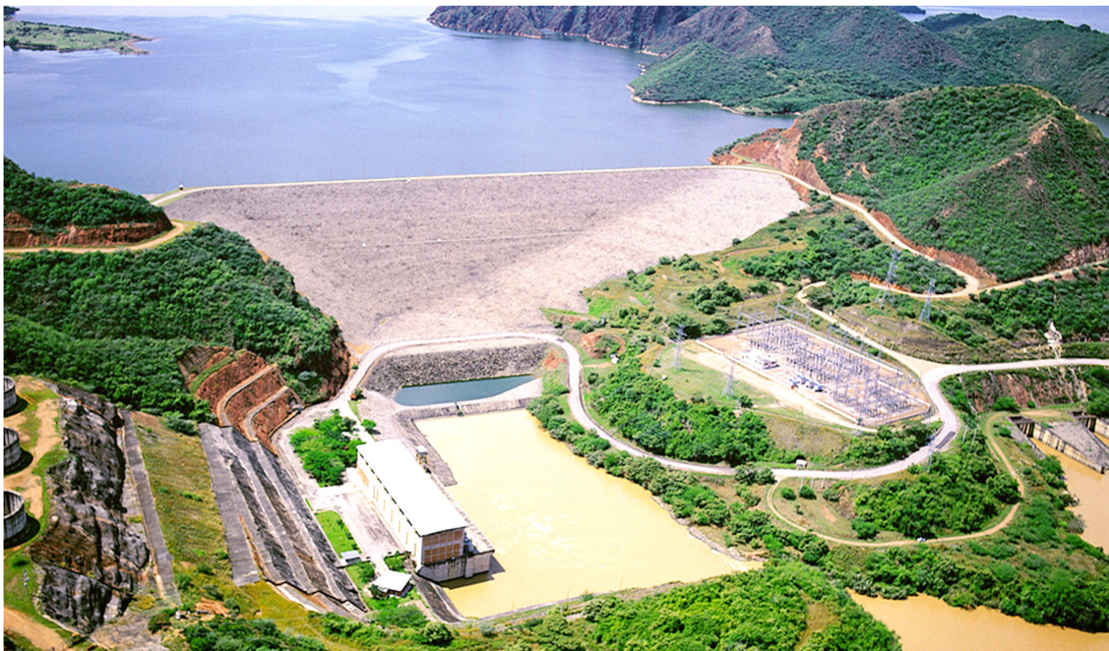
Según Acolgen, sería oportuno que el gobierno considerara el tema con urgencia.

Los embalses de Antioquia estuvieron en un nivel de 46,22 % de su volumen útil y representan alrededor del 38,1 % de las reservas del sistema, seguido por Caldas con 46,42 %; Caribe con 65,14 %; Oriente con 26,93 % con cerca del 12,56 % de las reservas del sistema; Centro con 49,86 % con cerca del 41,73 % de las reservas del sistema, y Valle con 46,40 %.