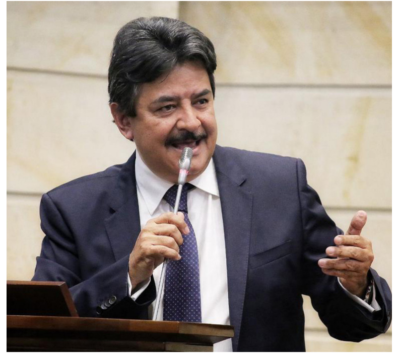
Los senadores enviaron una carta dirigida al Gobierno Nacional con unas propuestas.

se pueda desarrollar una audiencia pública especial para el Huila, donde puedan participar los alcaldes, el gobernador, así como miembros de las corporaciones públicas y comunidad en general.