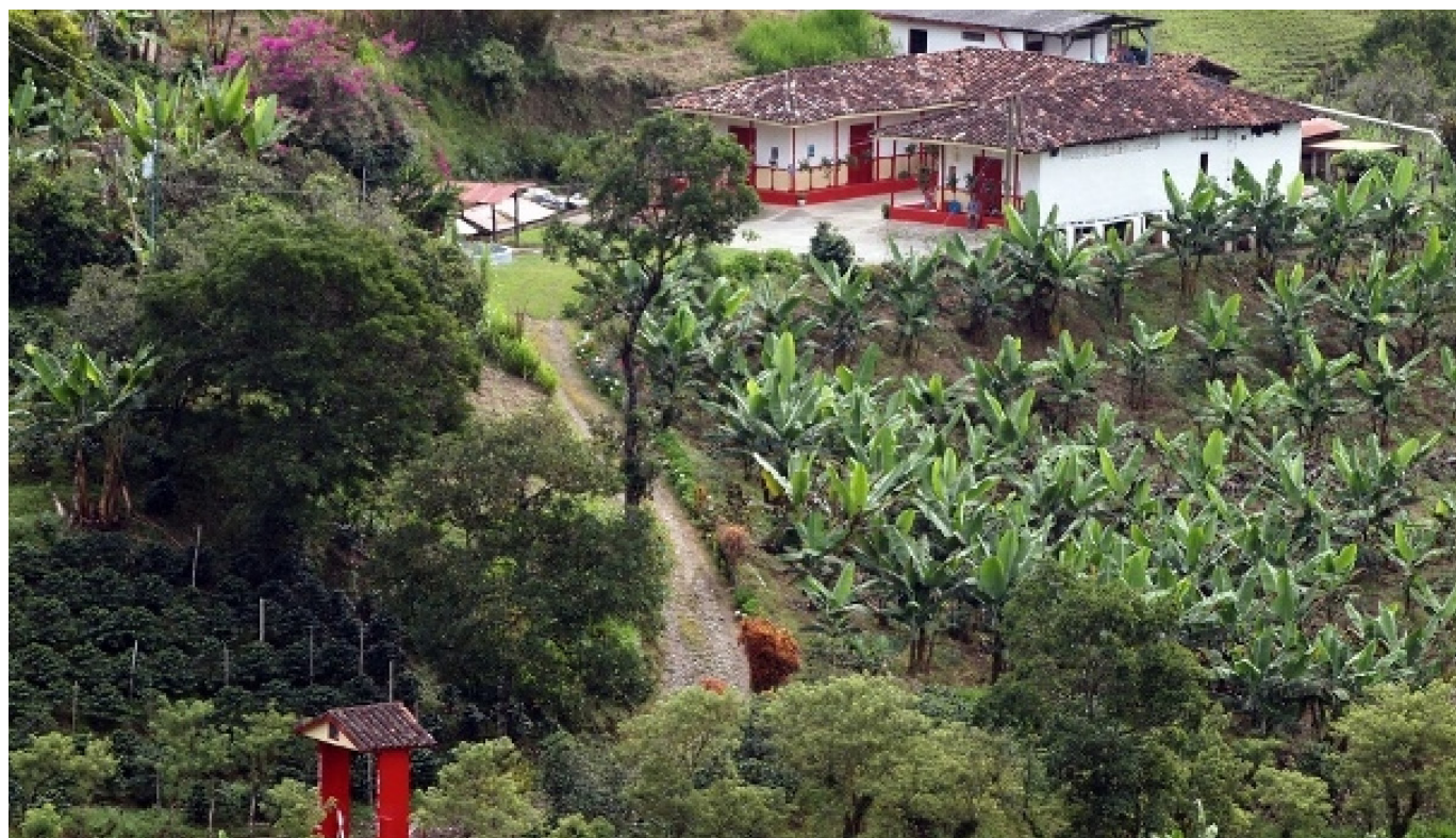
Bajo el lema “Turismo y Paz”, este acontecimiento, programado del 27 de octubre al 1 de noviembre, se propone redefinir la forma en que se vive y comprende el turismo rural en la región.

Liderado por la Corporación de Empresarios Turísticos del Huila y FUNDACOV, el departamento se prepara para recibir el IX Encuentro Iberoamericano de Turismo Rural.