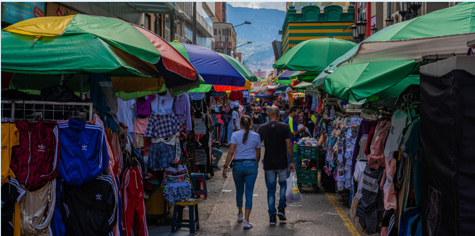
En igual sentido, anotó que la reforma se convierte en una fórmula de incentivo para despedir personal.

En igual sentido, anotó que la reforma se convierte en una fórmula de incentivo para despedir personal, siempre que aumenta el cálculo para determinar la indemnización por despido sin justa causa respecto de aquellos trabajadores que cumplan diez años de trabajo en la compañía.