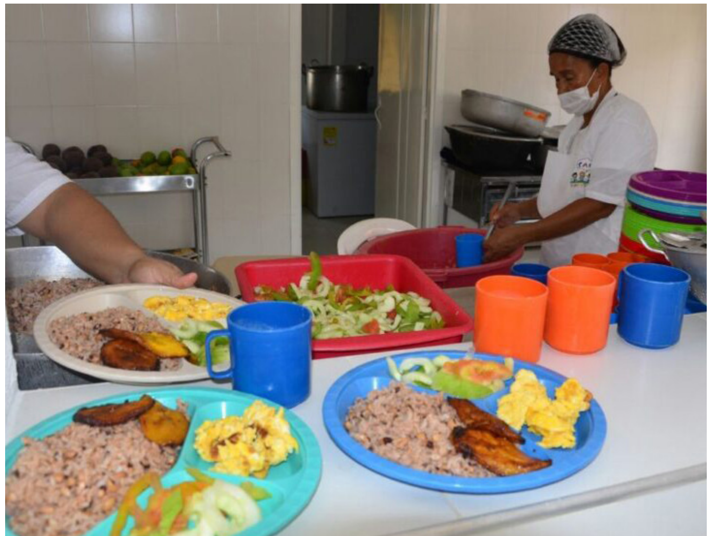
Una estrategia es que la Alcaldía de Neiva, se compre la leche a los productores locales para el PAE, que les ayudaría mucho.

"Producir un litro de leche para el ganadero, tiene un costo entre $1.200 y $1.300, es alto, para que lo paguen a $1.500, y el margen de ganancia es bien ajustado, más hacerlo con el fuerte clima que tenemos, lo que necesitamos es que nos mantengan el precio de $2.000, esperamos que la baja, no dure mucho y no se vean afectados nuestros productores".