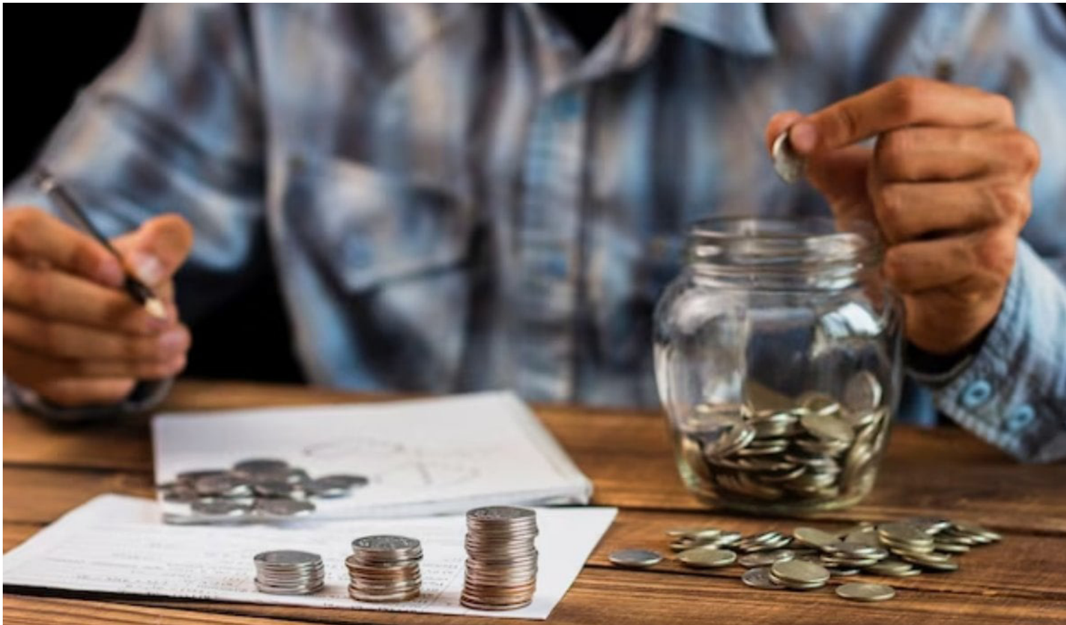
El bono pensional o una pensión ayudarían a las amas de casa que no se pensionaron a salir de la pobreza.

nal actual, incluyendo un régimen de transición que resguarda los derechos adquiridos de los cotizantes bajo ciertas condiciones. Esta situación se destaca por su relevancia en el ámbito laboral y legislativo del país.