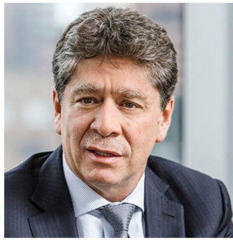
Bruce Mac Master

Cuando cumple 10 años al frente de la ANDI, el gremio empresarial más importante de Colombia, Bruce Mac Master se ha convertido en el principal contrapeso frente a las propuestas socioeconómicas de izquierda del Gobierno del presidente Gustavo Petro. Unos 1.600 afiliados que representan entre el 52 y el 53% del Producto Interno Bruto del país y el 70% del Producto Interno Bruto privado; 35 sectores económicos, 12 regiones y un poder e influencia descomunales. Por algo la Asociación Nacional de Empresarios de Colombia (ANDI) es el gremio empresarial más importante de Colombia, un actor fundamental en el engranaje socioeconómico y en cuya presidencia se sienta Bruce Mac Master (1963), un cartagenero que salió de su ciudad apenas terminó el bachillerato, pero que conserva cierto aire caribe en su acento y en sus formas.