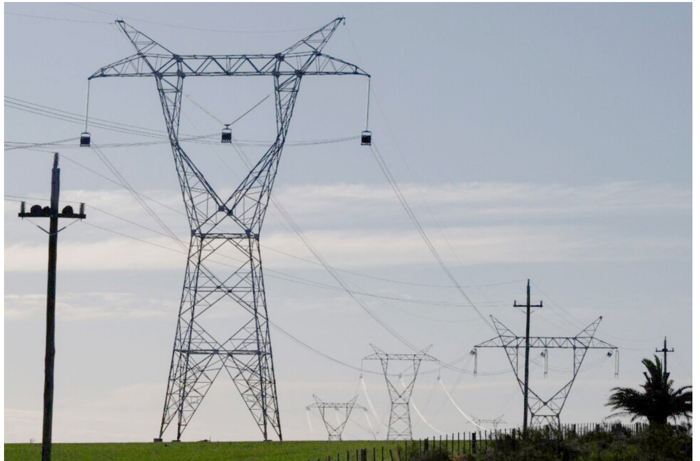
Ya hubo una subasta de cargo por confiabilidad, cuyo objetivo es incrementar la capacidad de energía.

La combinación de estos factores plantea retos importantes para garantizar la suficiencia de oferta energética y mantener la estabilidad del sistema interconectado de energía en el país.