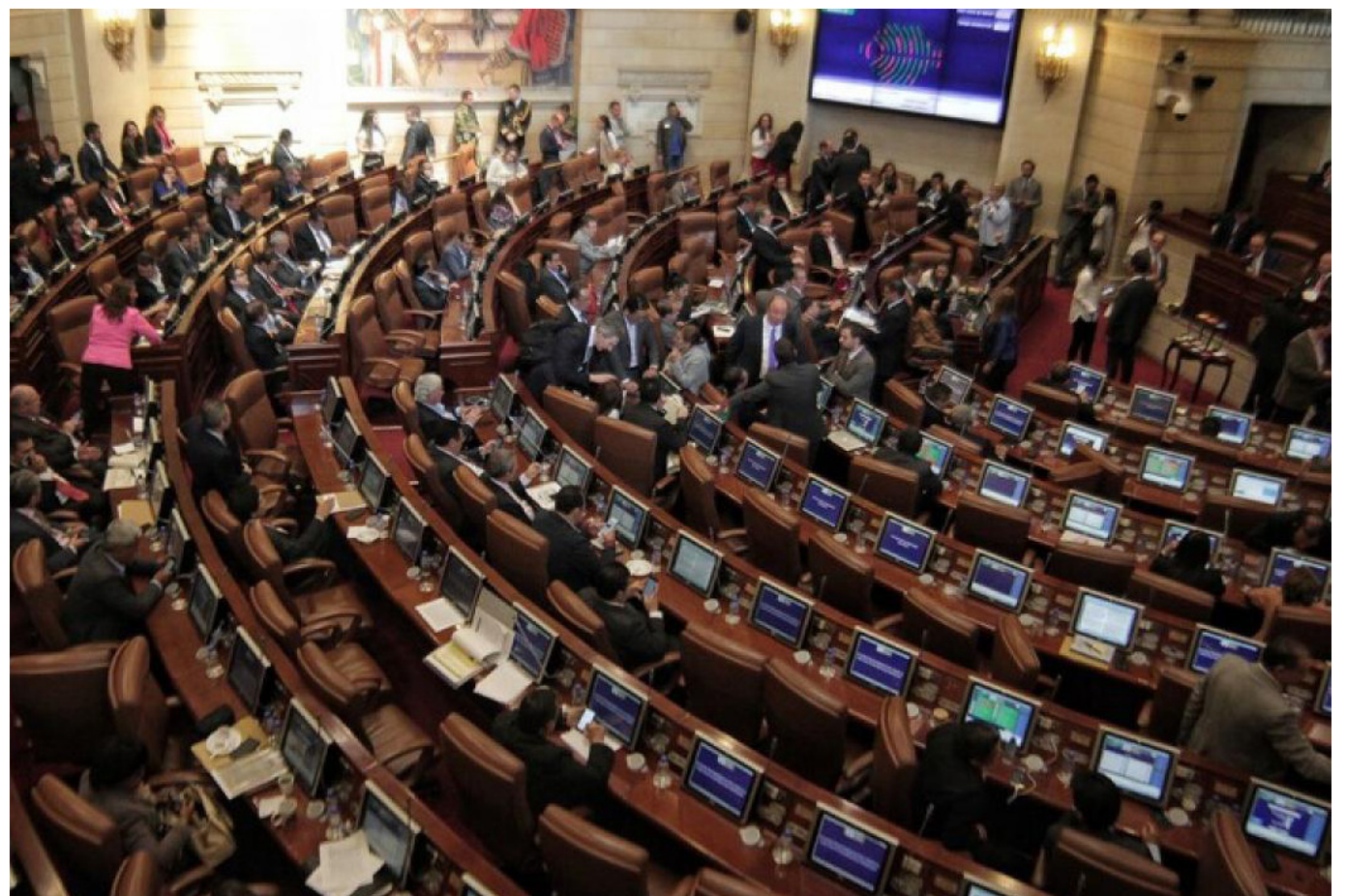
Las reformas del Gobierno Petro están en manos del Congreso de la República.

Entre los puntos a favor, según el Ministerio de Hacienda, está la factibilidad fiscal y la sostenibilidad a largo plazo del proyecto, lo cual fue un factor determinante para obtener el aval fiscal en la Cámara de Representantes. A pesar de este panorama optimista propuesto, la advertencia de S&P sobre el posible efecto negativo en el crecimiento económico debido al aumento de la deuda y el gasto en pensiones resalta los desafíos que el Gobierno colombiano deberá enfrentar para mantener un balance entre los objetivos a largo plazo de la reforma y las implicaciones económicas inmediatas.