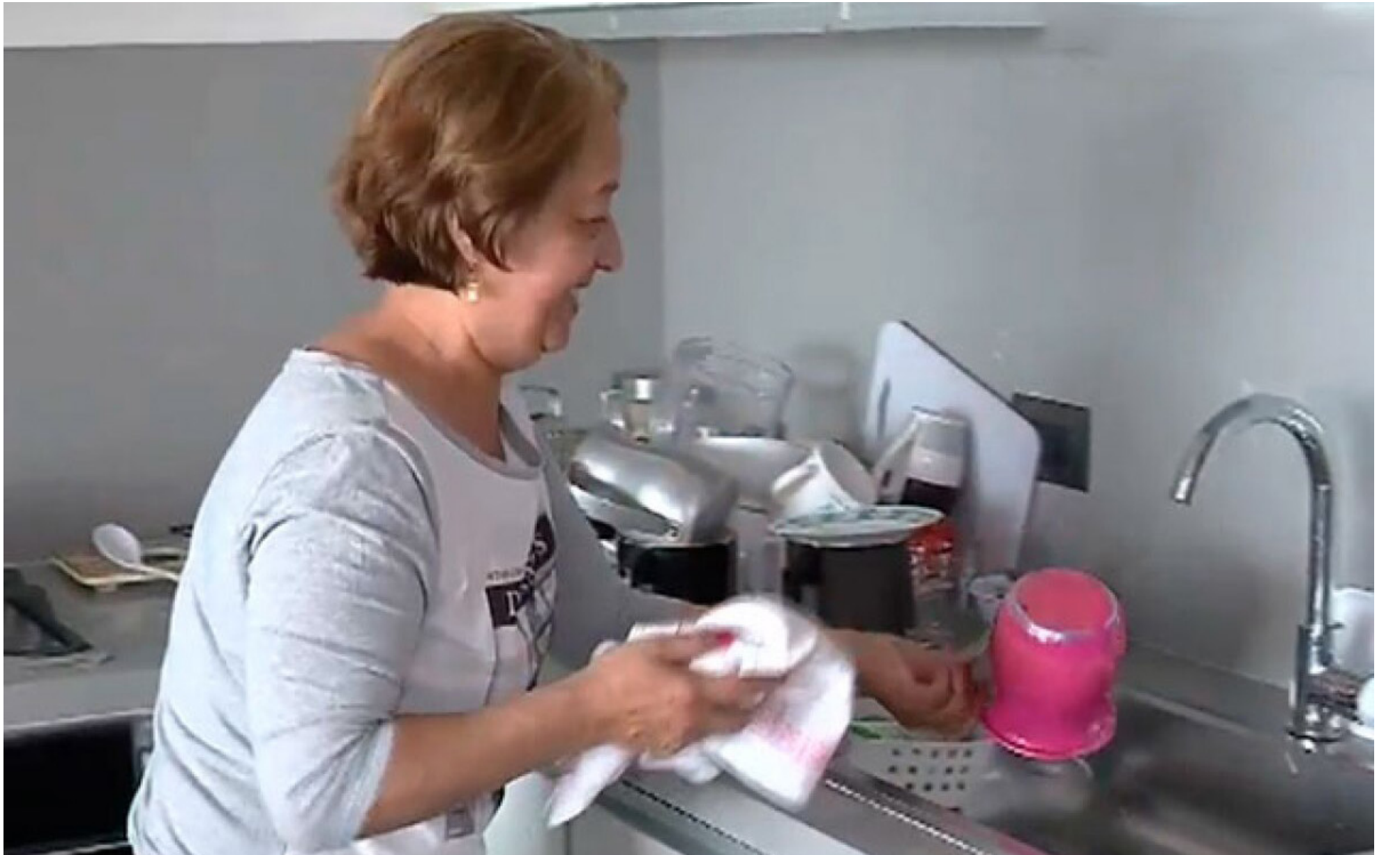
Las mujeres viven con miedo por estar en una sociedad que las señala.

■ El proyecto de reforma pensional no se ha podido debatir en la plenaria del Senado de la República por falta de cuórum.