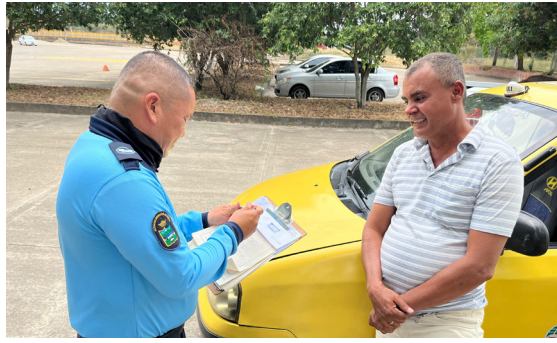
Así quedaron las tarifas del servicio de taxi en Neiva