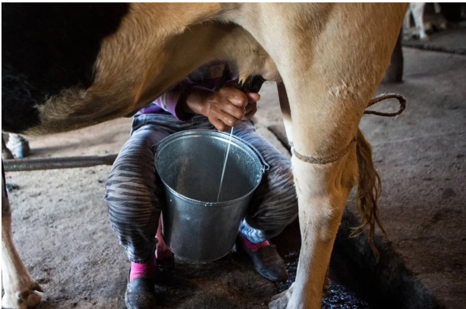
Entre $1.500 y $1.600 le pagan al productor por litro de leche.

Los productores, son conscientes de que las reses, son su flujo