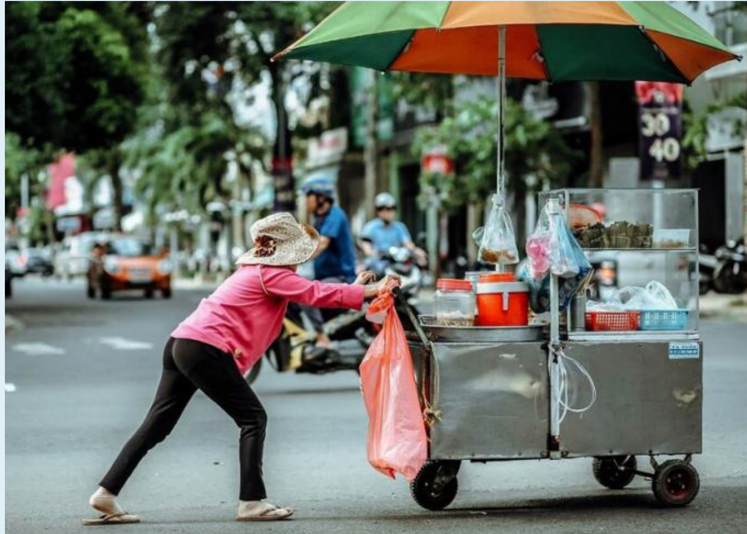
Los trabajadores informales son aquellos que no pagan seguridad social ni cotizan pensión

Frente a los centros poblados y rural disperso, la proporción de informalidad para