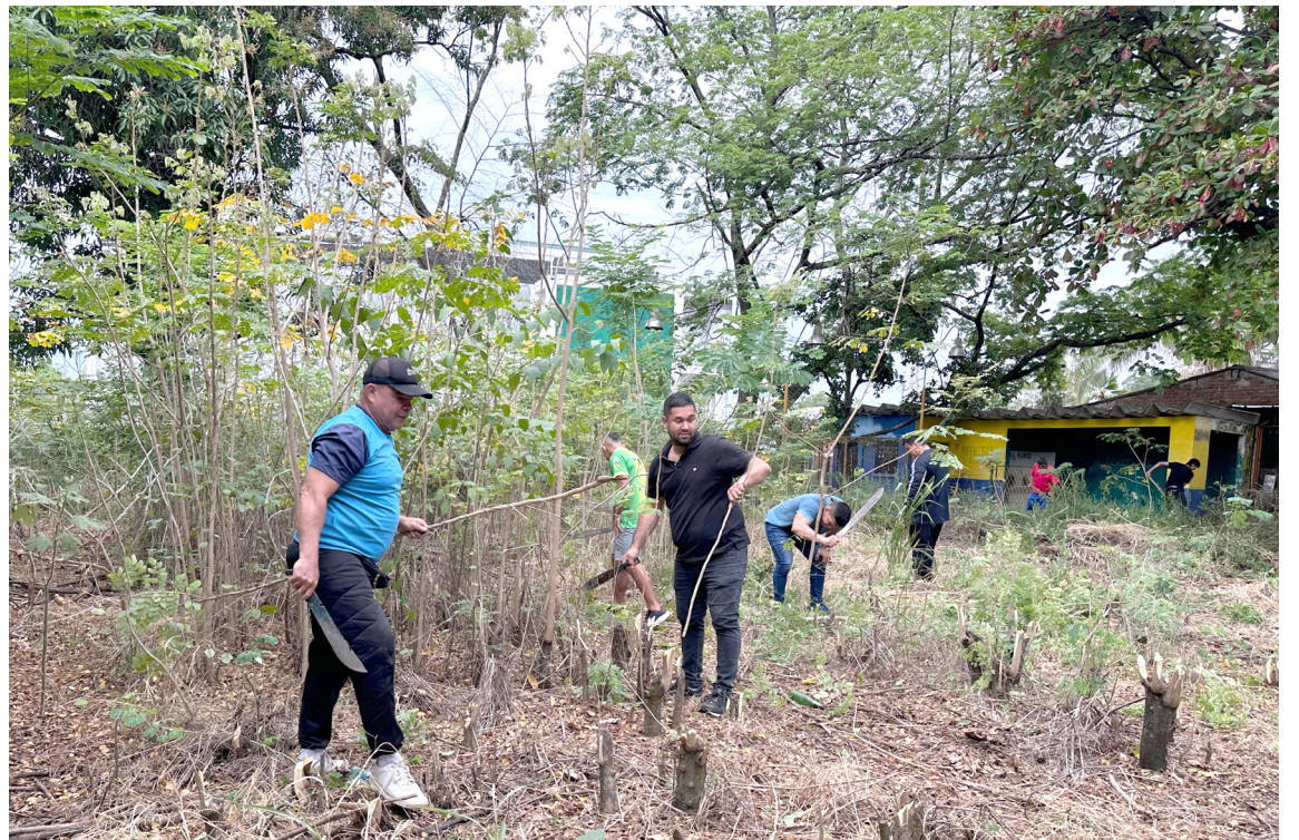
Escenario deportivo del oriente de Neiva fue recuperado. Cerca de 20 deportistas trabajaron de la mano de la secretaria de Deporte para recuperar este espacio para el disfrute de los neivanos.