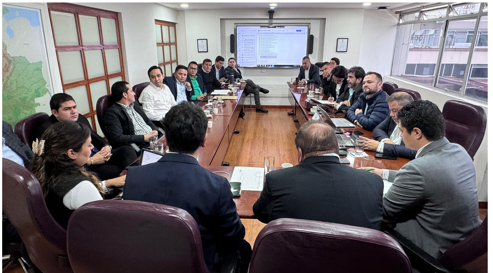
Parlamentarios huilenses, plantearon las propuestas para disminuir precios de energía.

tudes realizadas, es que ante el proyecto de ley de iniciativa del Gobierno Nacional y de tramitarse en el Congreso de la República, que tiene como objeto revisar la fórmula tarifaria a nivel nacional,