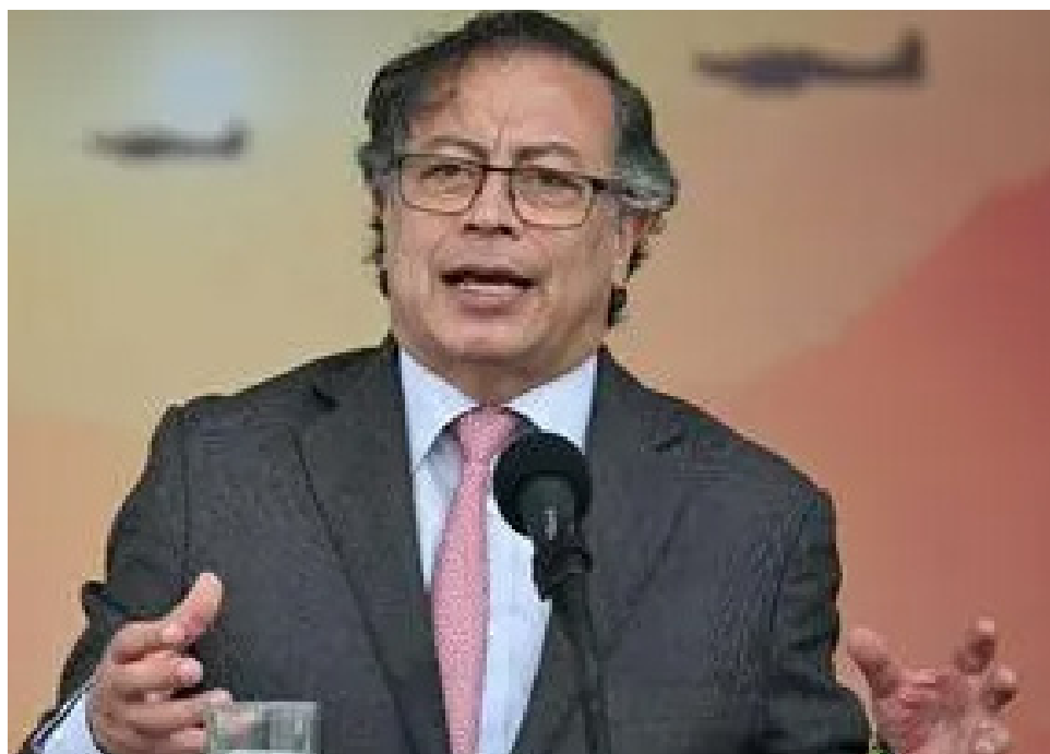
Gustavo Petro, presidente de Colombia, informó que la reforma pensional que cursa en el Congreso de la República trae beneficios para quienes cuidan el hogar.

Mientras siguen las discusiones, el presidente Gustavo Petro dio un mensaje favorable a las amas de casa del país. Esto, al asegurar que se necesita reconocer el trabajo y el valor de las trabajadoras del hogar, quienes sostienen con su labor a la sociedad entera.