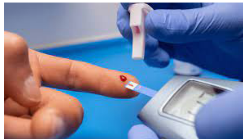
Prueba casera para la diabetes.

Durante el encuentro, los distintos ponentes han querido poner en valor la importancia de la concienciación sobre la salud renal en la población, así como la identificación activa; la formación de los