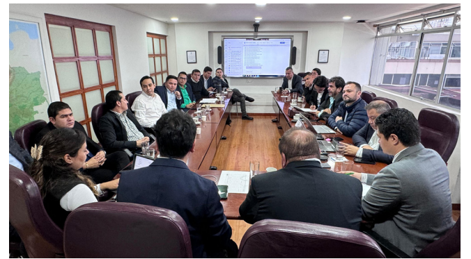
Así le fue a la bancada opita