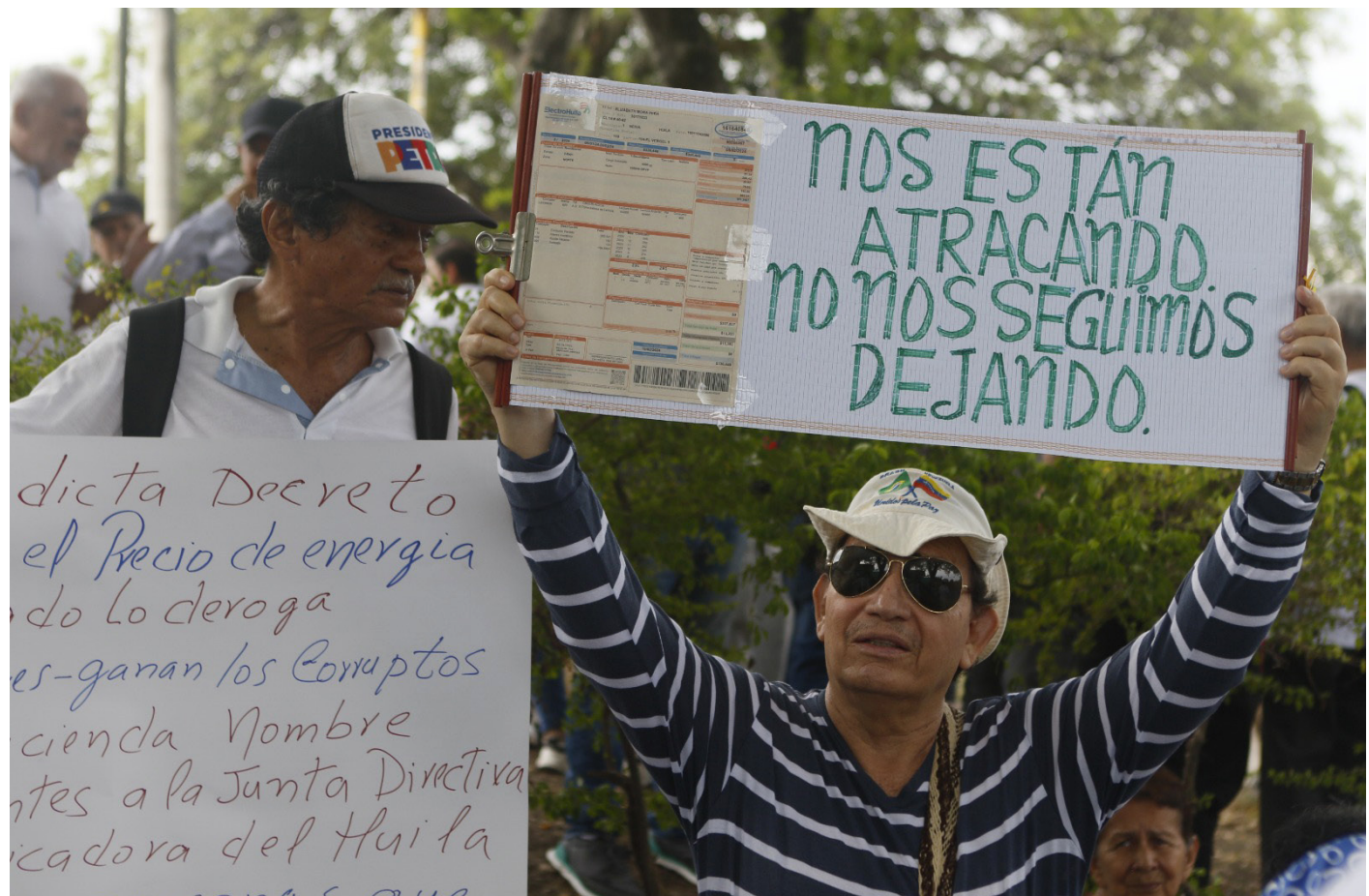
Los neivanos, ya mostraron su inconformidad.

Otra de las importantes solicitudes realizadas, es que ante el proyecto de ley de iniciativa del Gobierno Nacional y de tramitarse en el Congreso de la República, que tiene como objeto revisar la fórmula tarifaria a nivel nacional, se pueda desarrollar una audiencia pública especial para el Huila.