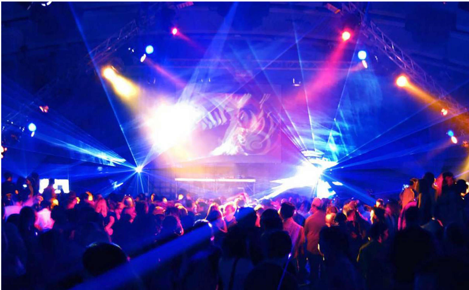
Esto evidencia la necesidad del Plan Básico de Ordenamiento Territorial que está vencido.

ridades para que brinden control permanente en aras de garantizar el derecho a una vida digna y la no irrupción a la tranquilidad. Se sabe que hay quejas en diversas entidades o instituciones, para que intervengan en estas labores. Todo esto va en busca de mejorar las condiciones de convivencia de este centro”, dijo el Personero Municipal