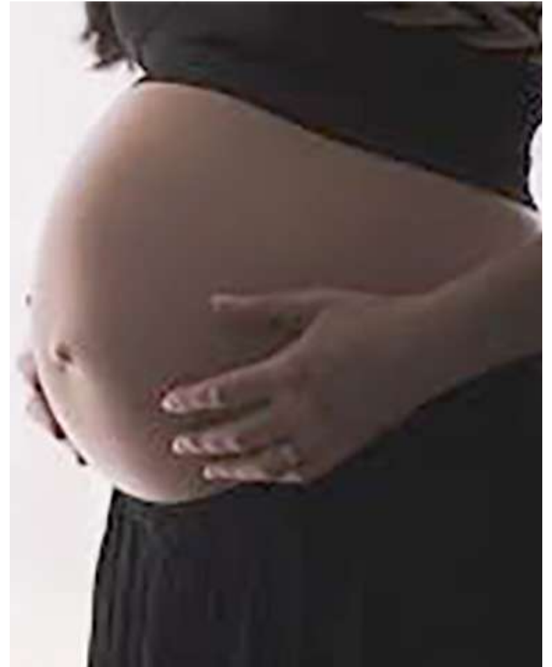
Mujer embarazada pierde su bebé por varios impactos de bala.

Presuntamente, en medio del procedimiento estas personas habrían tratado de agredir y despojar de sus armas a los uniformados.