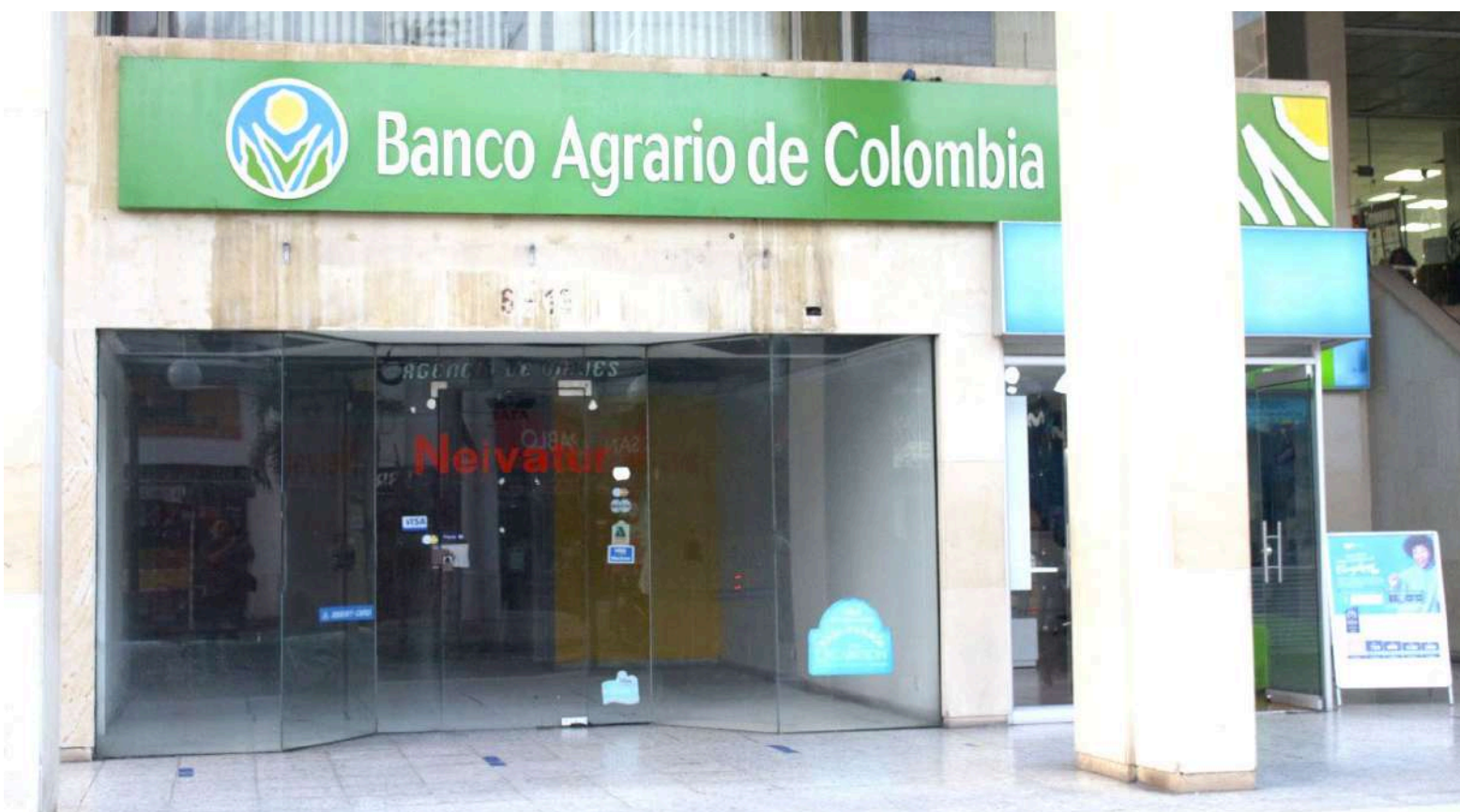
Esto en razón a una auditoría realizada por parte de la Contraloría General de la República efectuada al Banco Agrario de Colombia dentro de los proyectos VIS.

Finalmente, independientemente a la decisión de la etapa de juzgamiento se emitirá lo correspondiente en derecho. Actualmente, por la investigación penal que se adelanta la información es reservada y se desconoce si dentro la misma serán vinculados funcionarios del Banco Agrario de Colombia o no.