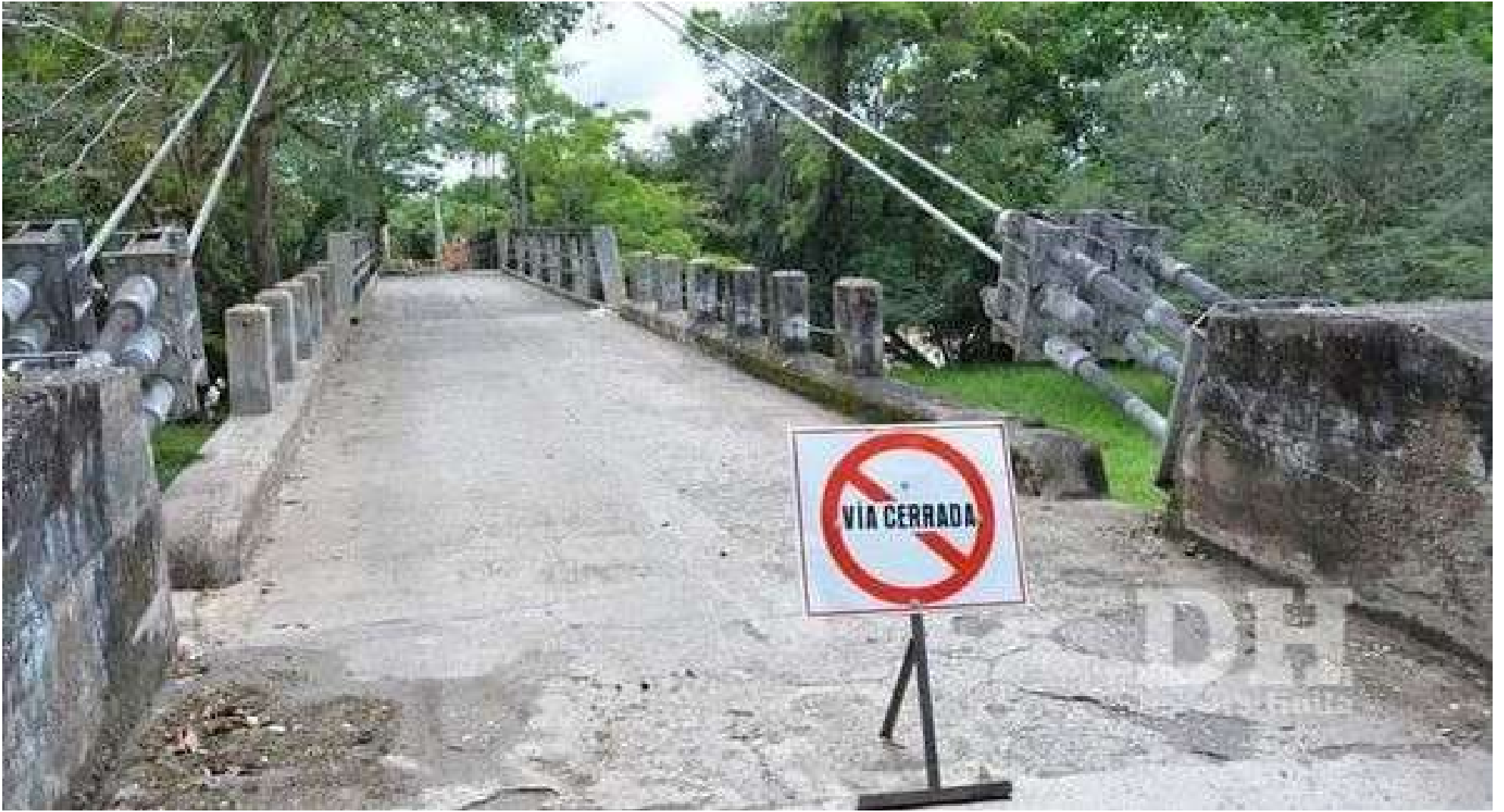
Ingreso al puente de Guacas cerrado por obras de rehabilitación.