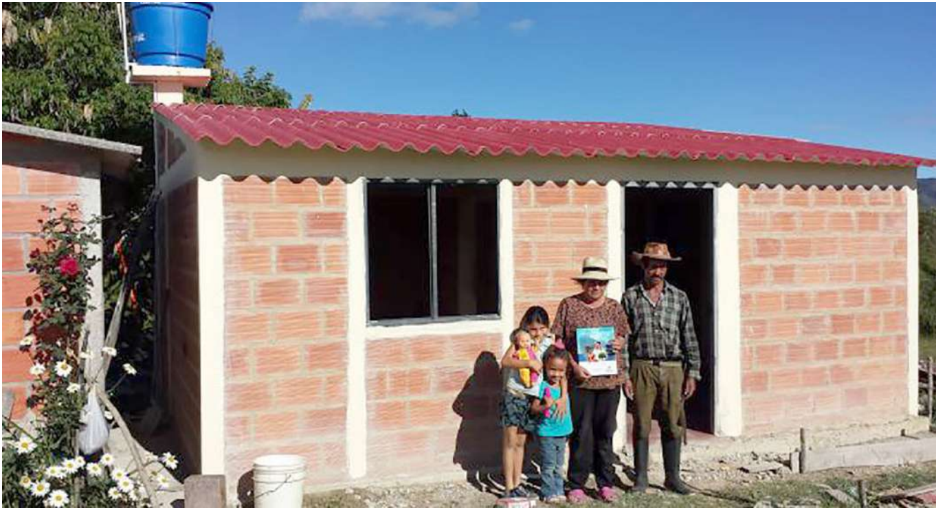
Eran 289 viviendas las que debían construir.

“Ellos tenían dentro del objeto del trabajo adelantar con el banco todas las funciones de la gerencia integral para el desarrollo de proyectos de viviendas y, en ese sentido, administrar los recursos de esos subsidios asignados a los hogares beneficiados, es decir, de muy bajos recursos tratándose de Vivienda de Interés Social Rural, donde efectivamente, se tenía el compromiso de adelantar la construcción de vivienda nueva y en otros casos el mejoramiento de algunas de las viviendas de los municipios de Tarqui y Suaza en el Huila”, manifestó Tello Esquivel.