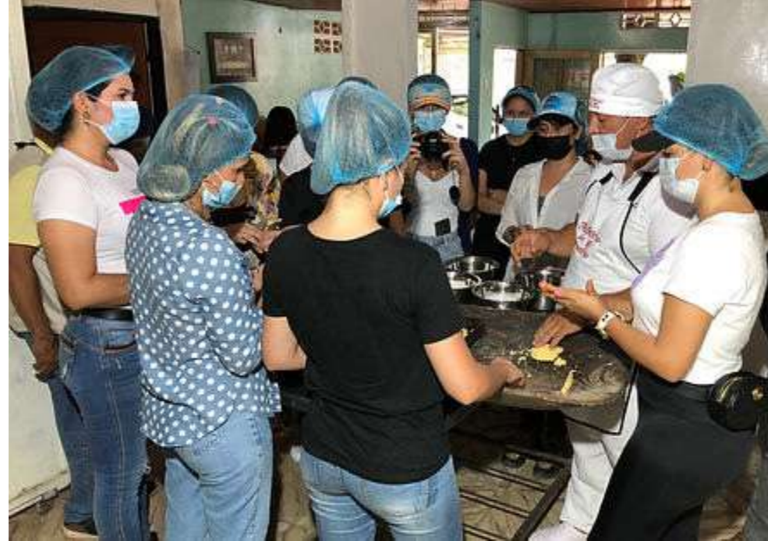
Turistas pueden hacer taller de bizcocho en la Ruta de la Achira

certificamos a operadores turísticos quienes son los que organizan los paquetes.