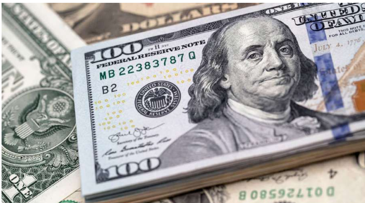
El análisis del crecimiento del precio del dólar tiene varias aristas.

El comportamiento de la divisa estadounidense en Colombia dependerá de varios factores que están relacionados con la incertidumbre de la economía nacional y global. Y en las próximas semanas hay varias noticias y eventos que podrían llevar a la tasa de cambio a dar su último salto a los $5.000