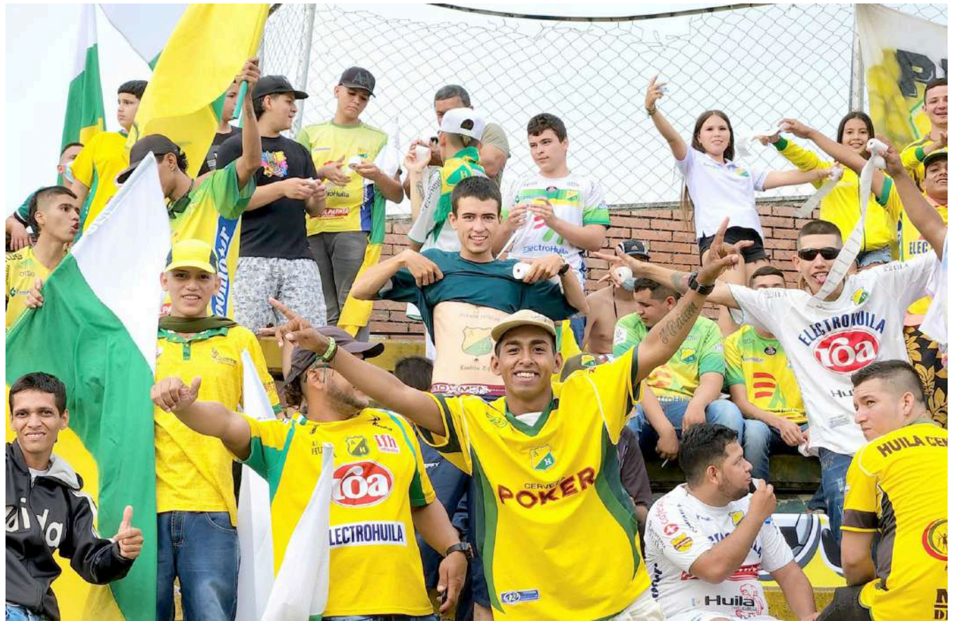
La clasificación a esta final ha despertado de nuevo la denominada mancha amarilla.

El estratega argentino tiene claro que solo sirve ser campeón; “nosotros sabemos que no nos sirve de nada si no ganamos esta final”.