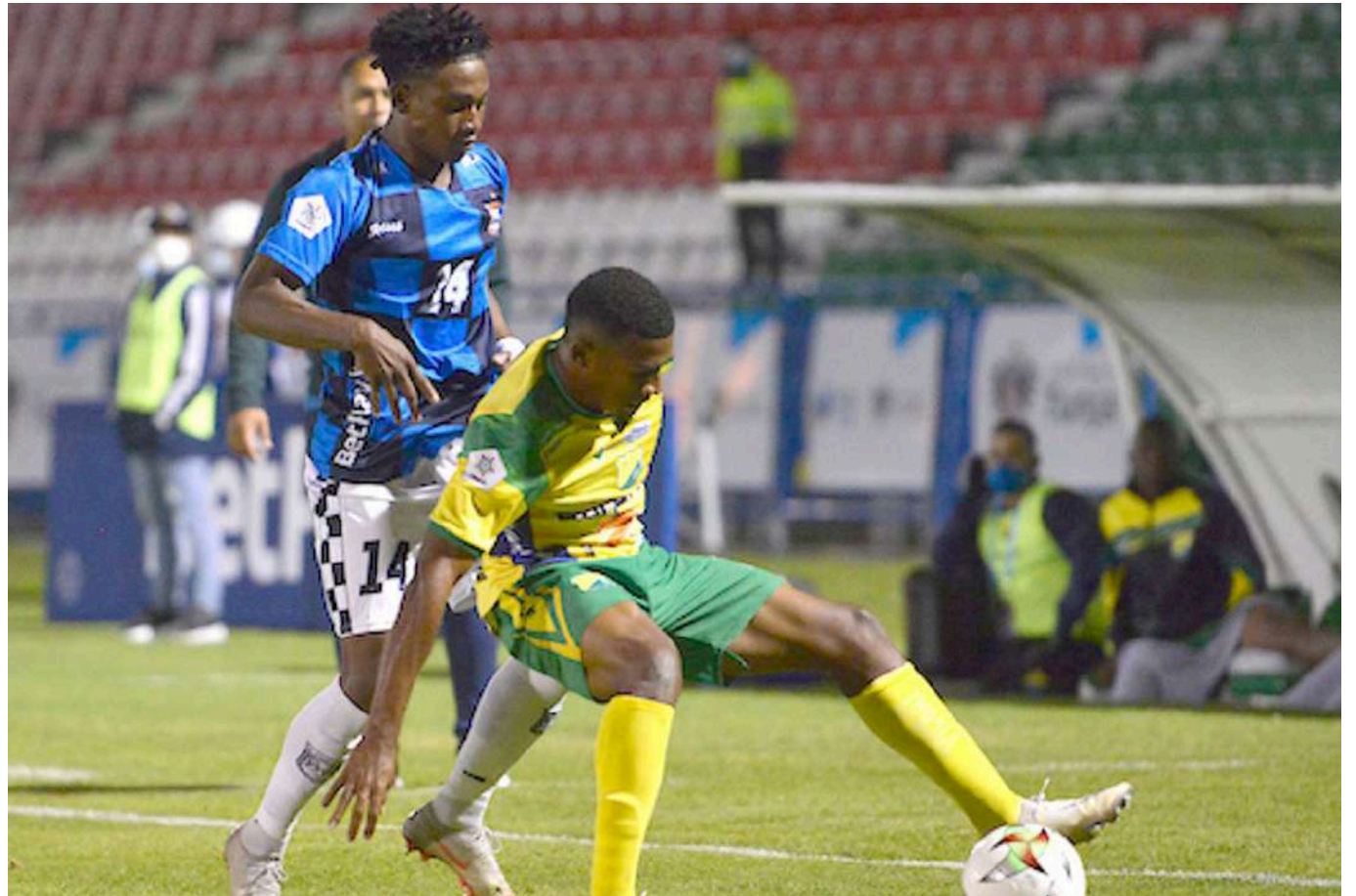
Boyacá Chicó y Atlético Huila se miden en la final del Torneo Betplay II

Atlético Huila y Boyacá Chicó Fútbol Club, siguen en carrera en búsqueda de volver a la primera categoría y ese camino se miden esta noche a partir de las ocho en la Independencia de Tunja.