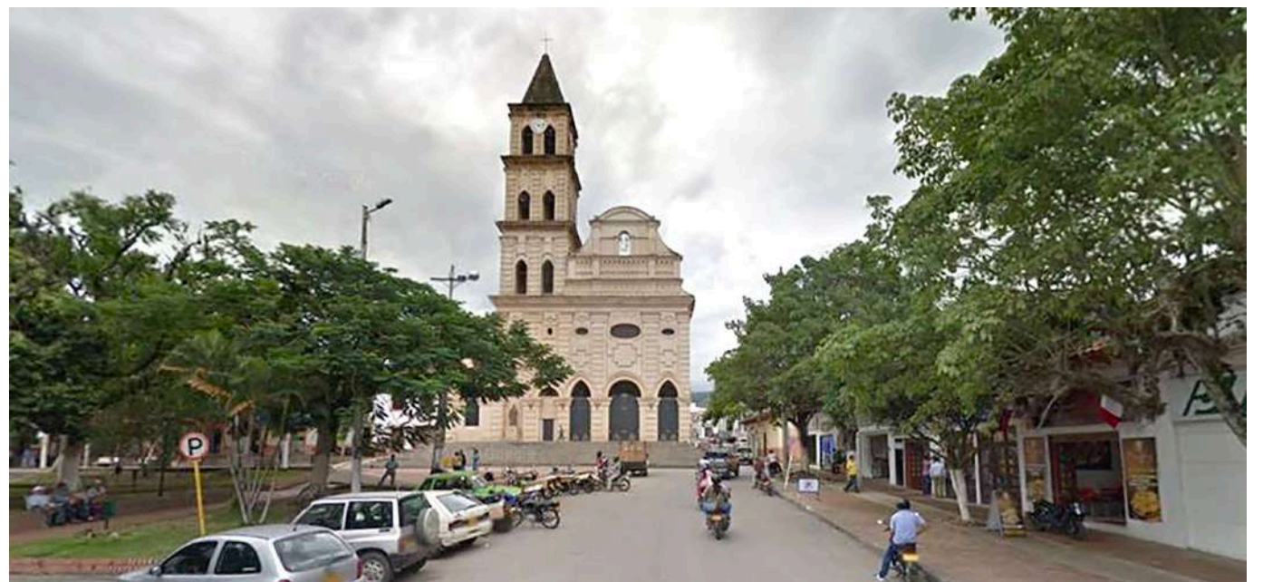
Se debe buscar una mediación congruente para solucionar la problemática.

“Se ha tratado de reunir al comercio, incluso, hace 15 días se citó a una reunión y solamente fue un comerciante de esta zona, entonces los notificaremos individualmente para ordenar la insonorización de cada uno de estos negocios. Ese trabajo es un poco dispendioso porque cada uno alega sus razones. Es tratar de acomodar la situación para que no se genere conflicto y se busque solución a este problema”, concluyó.