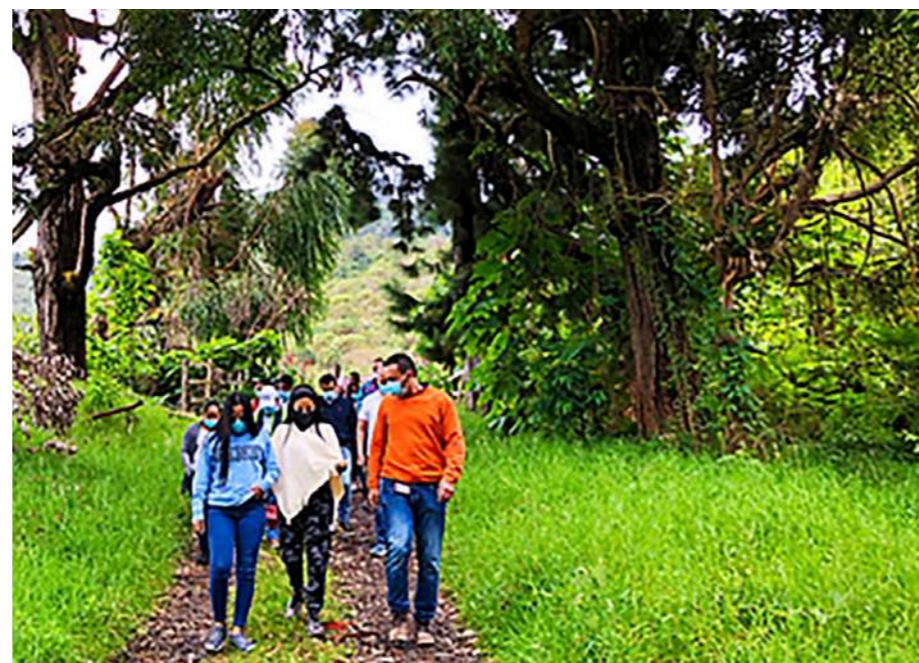
Sendero ecológico de Río Ceibas

ricas, pues creen que es lo que les puede ayudar a mejorar su calidad de vida, pero sobre es la manera de recuperar el corregimiento de Vegalarga y San Antonio. Nosotros entonces tenemos un guion turístico, el cual es apoyado por la secretaría de Competitividad, donde