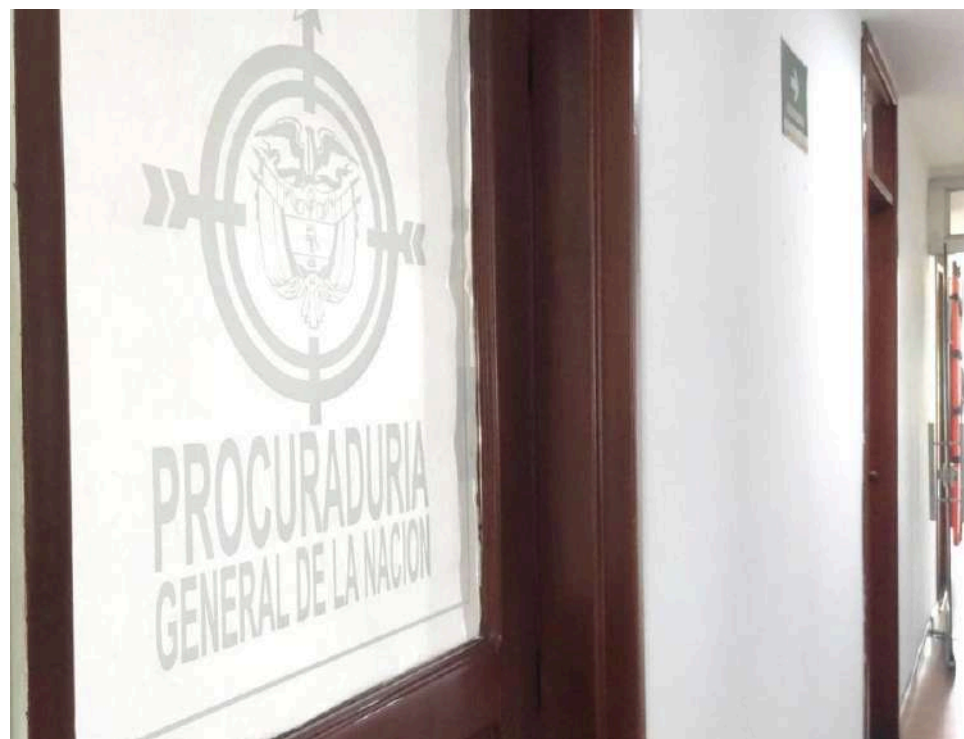
La Procuraduría Regional de Instrucción del Huila profirió pliego de cargos contra los representantes legales de una Fundación y Cooperativa que integran el consorcio 'G.I.V.I.S HUILAS'

En total se suponía que debían entregar 289 viviendas, de las cuales, únicamente se construyeron 35 unidades nuevas.