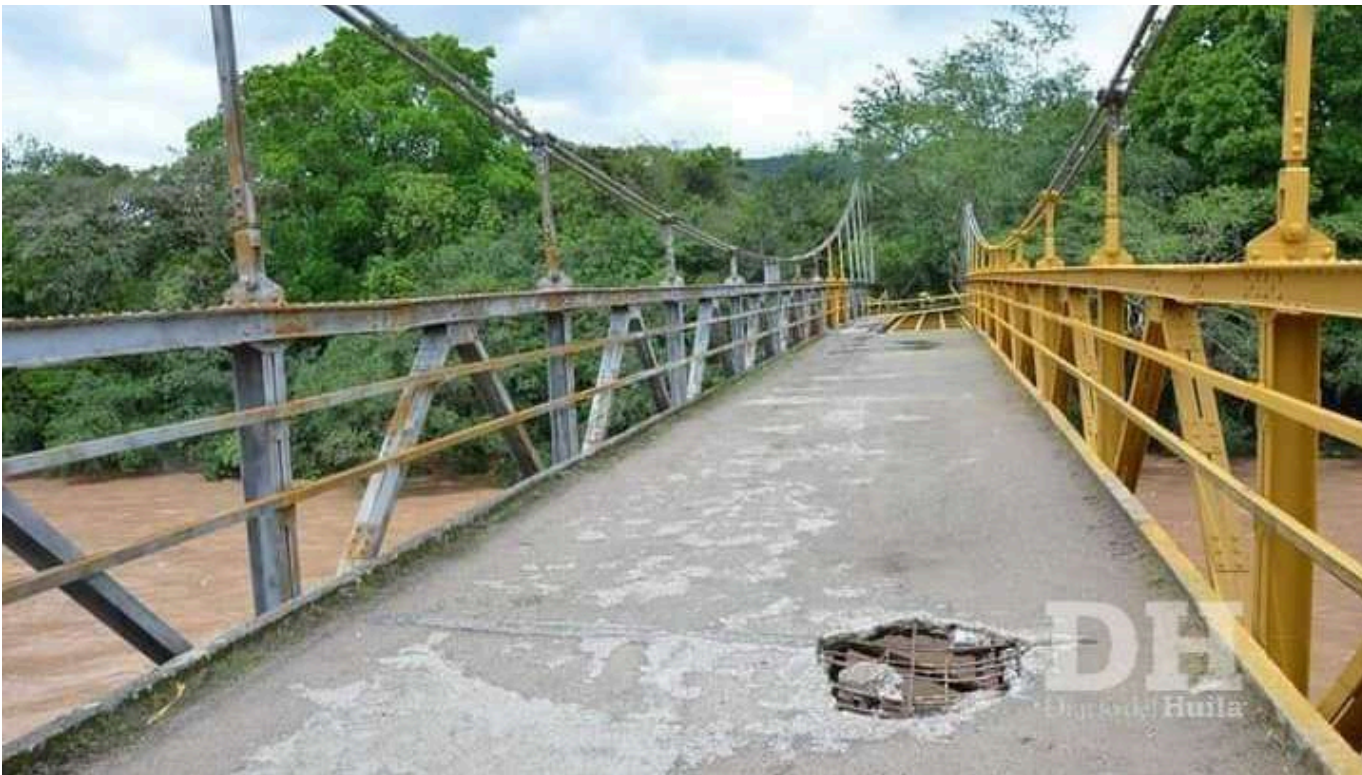
Así se veían antes de iniciar los trabajos el piso del puente de Guacas

presentada ante la Gobernación del Huila y el estudio previo en la zona, determinó que el puente presentaba rodadura en la loza o placa, pérdida de agregados del acero así como de sus refuerzos y la colmatación a lo largo de los costados del puente, que han ocasionado filtraciones de agua, descaramiento del concreto y contaminación de plagas y hongos en la estructura, lo cual representa peligro para quienes circulan por el sector.