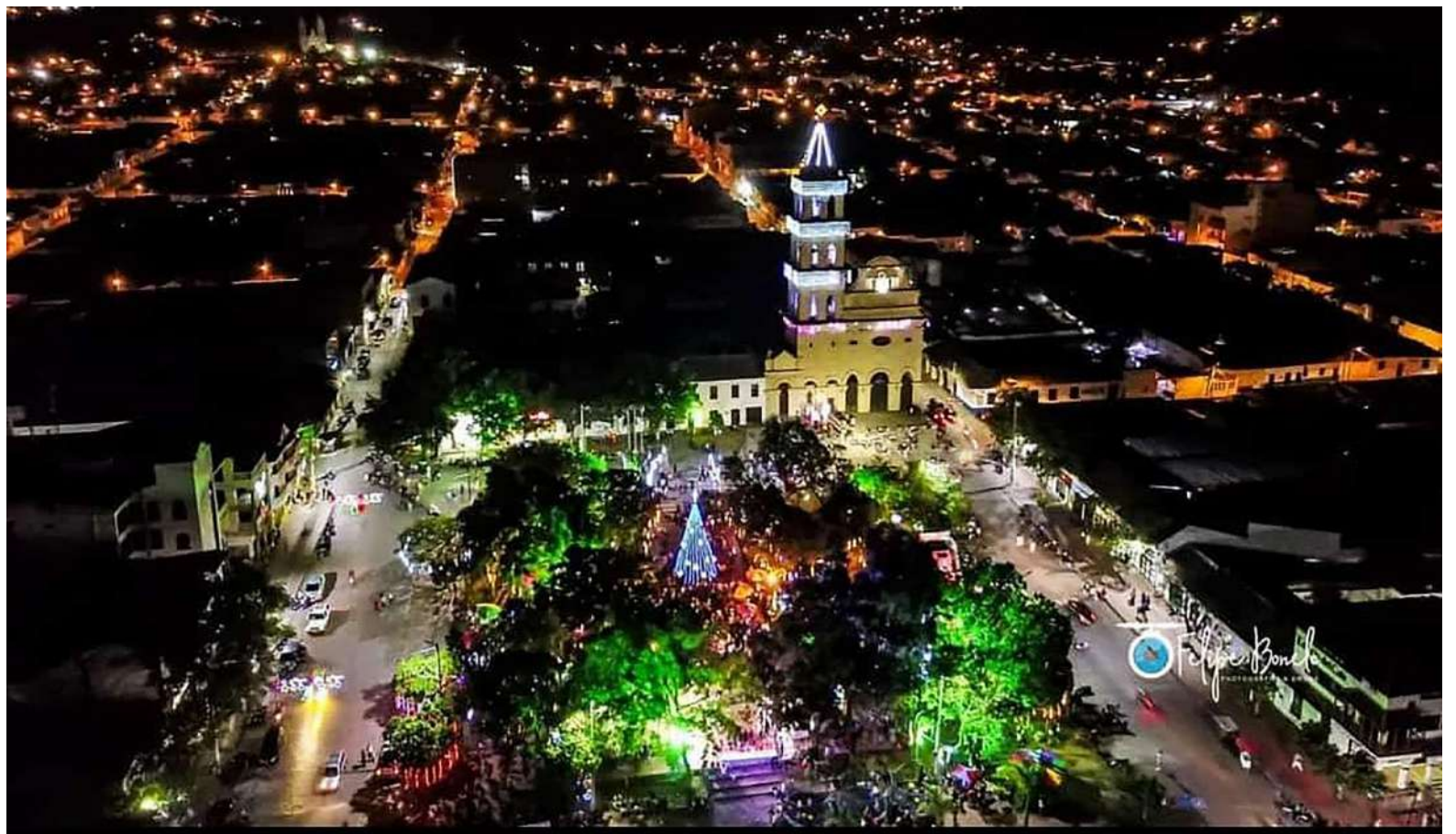
Varias quejas, requerimientos y denuncias, por diversos ciudadanos se han registrado durante muchos años por la zona rosa

Bajo esa lógica, el sector está determinado para otro tipo de comercio y no para la actividad