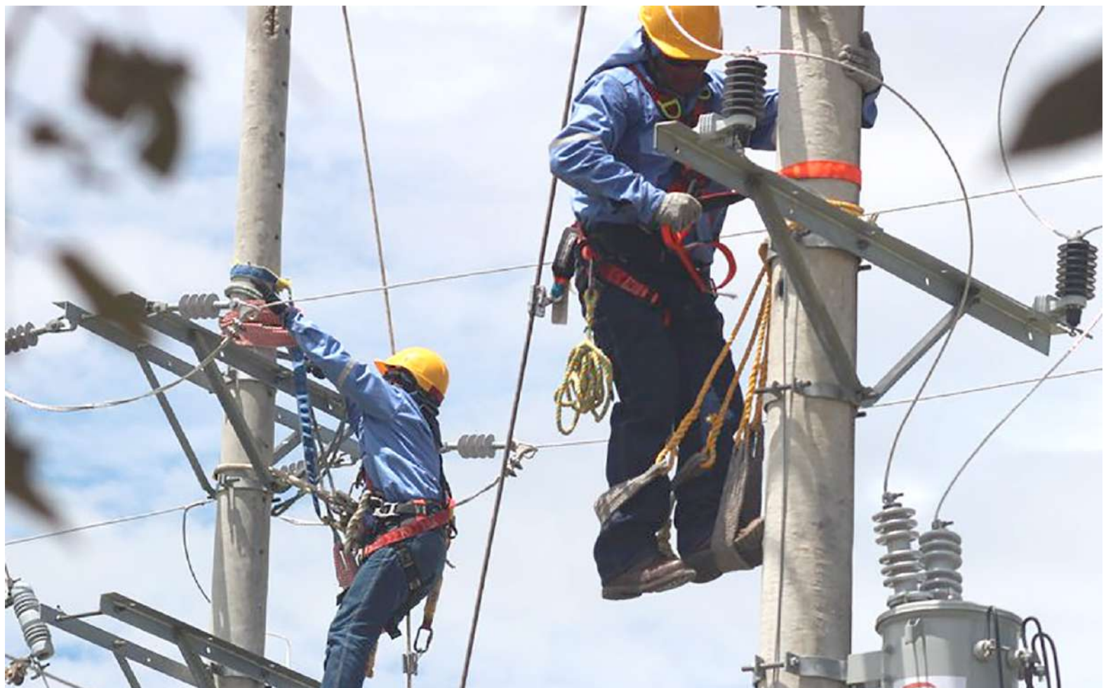
Disminuyó la pérdida de energía en el Huila.

“Hemos llegado a cuatro acuerdos fundamentales: se expedieron una serie de regulaciones que permitirán bajar los precios de la luz de inmediato; contamos con la voluntad de las generadoras y comercializadoras para renegociar sus contratos y de esta manera ellas también puedan llegar a precios más bajos; la Superinten-