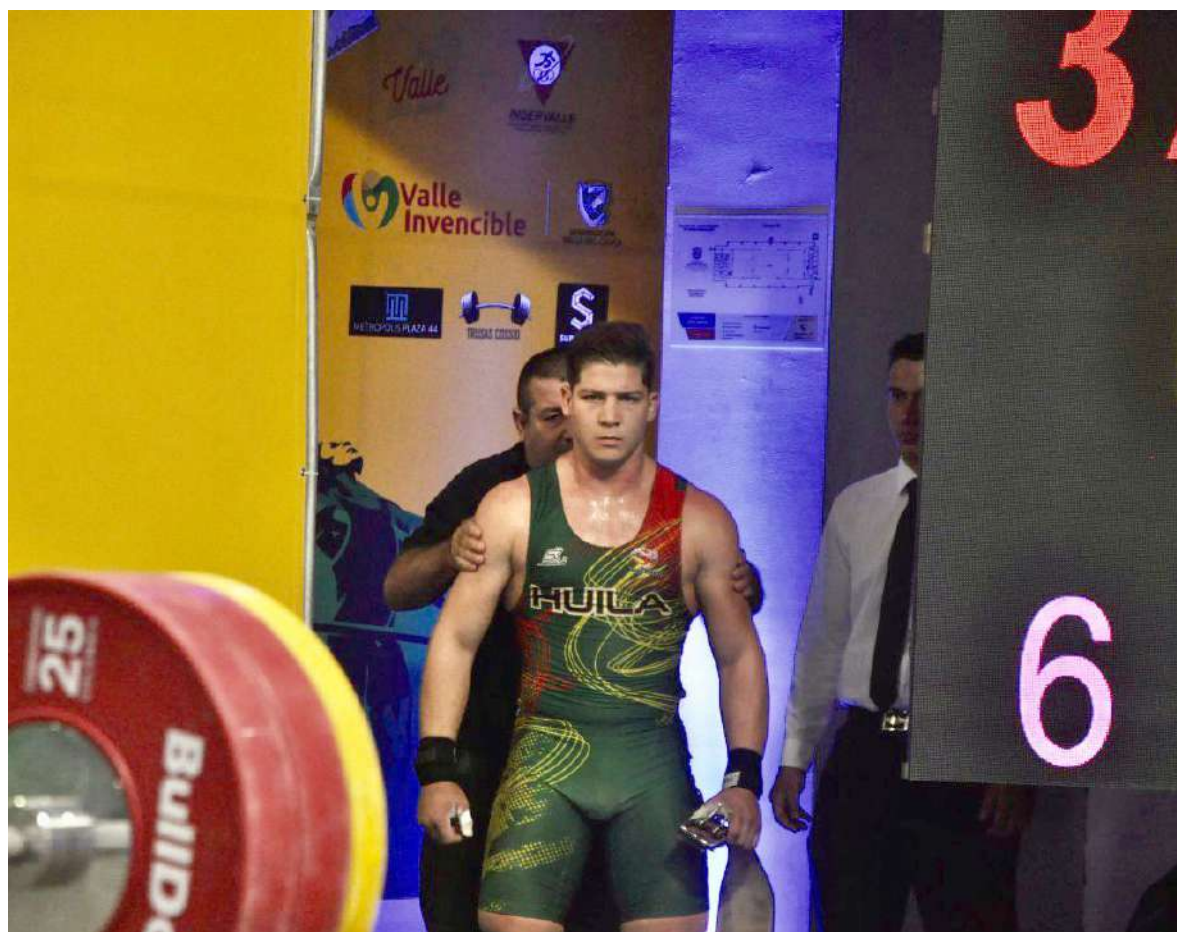
En el certamen nacional que se cumplió en la capital vallecaucana, donde participaron cerca de 300 pesistas de más de 20 ligas del país.

El nacional de Cali contó entre otros, con la presencia de deportistas de las Ligas de Valle, Bogotá, Antioquia, Risaralda, fuerzas Armadas y Bolívar.