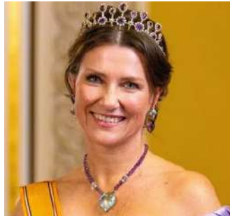
Princesa Marta Luisa de Noruega

Aunque mantendrá su título, la cuarta en la línea de sucesión al trono del país europeo deja a un lado sus deberes oficiales para "crear una línea divisoria más clara" entre su rol privado y público. Se centrará en el negocio de medicina alternativa que regenta con su prometido, un autoproclamado chamán.