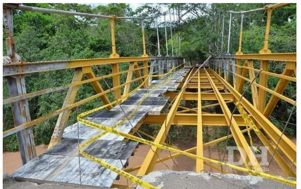
Placas que están siendo reemplazadas, se encontraban en muy mal estado.

La obra de rehabilitación del puente Guacas sobre el Río Magdalena, localizado sobre la vía que conduce del corregimiento de La Jagua del municipio de Garzón al municipio de Tarqui y Pital.