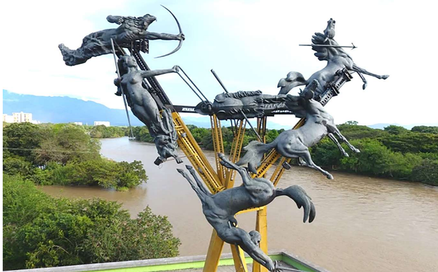
A través del turismo Neiva se quiere consolidar como una de las ciudades preferidas por las personas.

El sector del turismo en la ciudad de Neiva se empieza a consolidar como una de las apuestas más grandes. Reconocer y aprovechar todos los 'tesoros locales' es el mayor reto. Seis productos turísticos son los que cuenta la capital del departamento que dejan ver todas las bondades que tiene la capital bambuquera de América.