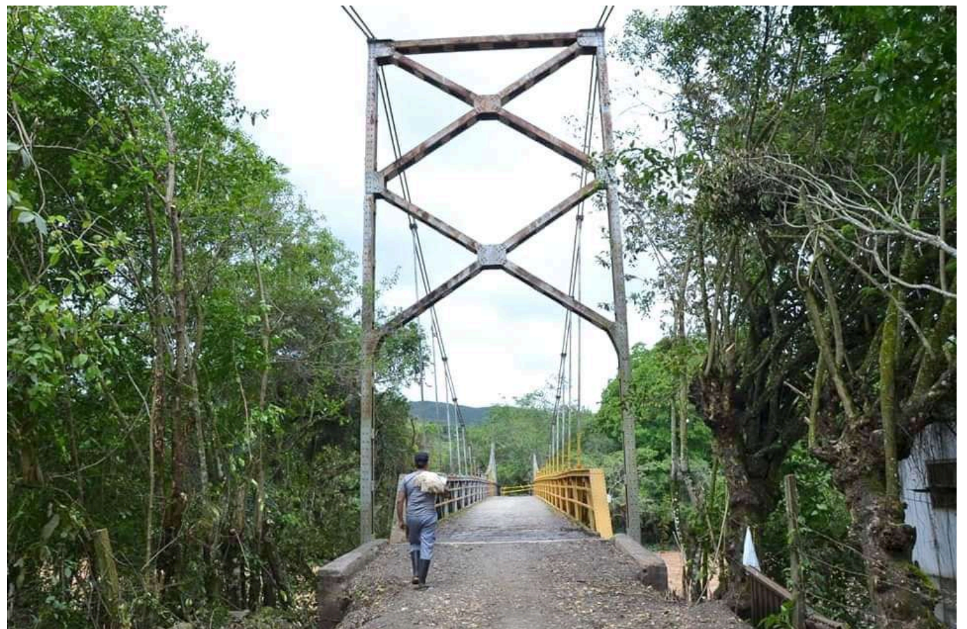
Paso obligado de campesinos y sus productos en la zona.

Es una amplia zona del centro del departamento especialmente de la zona rural de los municipios de Garzón, Altamira, Tarquí, El Pital y el Agrado entre otros los que se van a beneficiar con la rehabilitación del puente de Guacas en el centro del departamento.