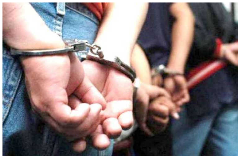
Los capturados fueron puestos a disposición de las autoridades competentes.