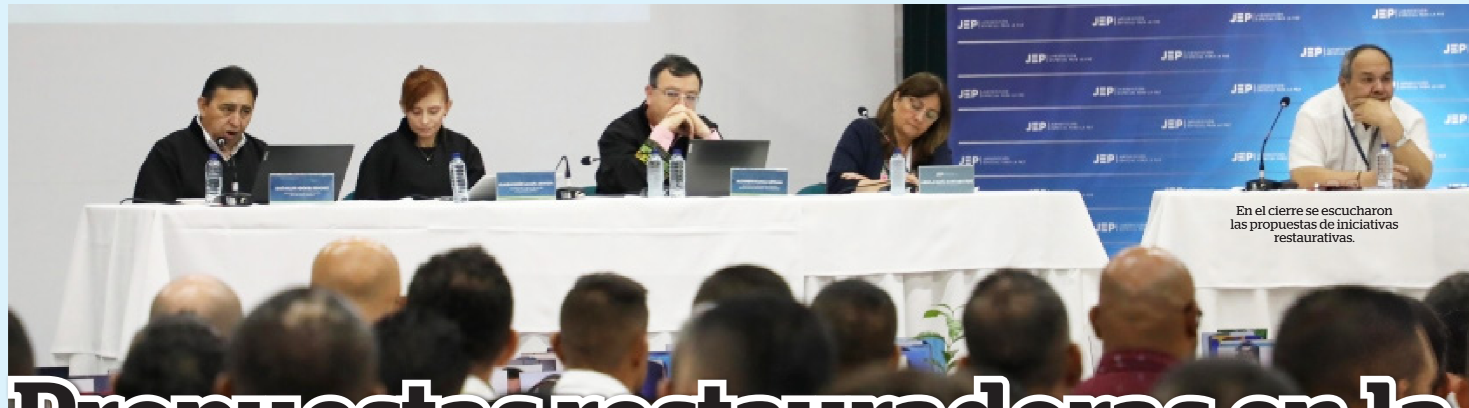
En el cierre se escucharon las propuestas de iniciativas restaurativas.

Desde la creación de un centro de memoria para el departamento del Huila, hasta la construcción de parques y la priorización de proyectos de vivienda, fueron las propuestas hechas en el cierre de la audiencia de reconocimiento de responsabilidad. La JEP continuará investigando a comparecientes que no aceptaron y compulsará copias para los civiles involucrados.