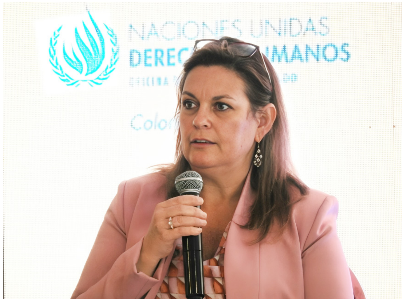
Juliette de Rivero, representante en Colombia del Alto Comisionado de la ONU para los Derechos Humanos.

El aumento de grupos armados y la crisis humanitaria: Juliette de Rivero destaca el creciente poder de los actores armados no estatales en Colombia y su impacto devastador en las comunidades. Según De Rivero, el fortalecimiento de estos grupos y su capacidad para suplantar la autoridad estatal están generando graves problemas de gobernabilidad y violaciones a los derechos humanos, especialmente en regiones con alta presencia de pueblos afros e indígenas.