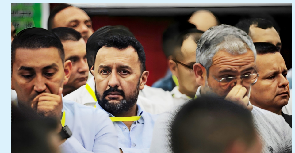
Los comparecientes propusieron su colaboración en la búsqueda de los desaparecidos.

"Varios de los que fueron mencionados ya están siendo investigados, incluso por la Unidad de Investigación de la JEP, ellos no aceptaron su responsabilidad y como ustedes vieron a todos ellos los mencionaron en esta audiencia y pues será tomado en consideración por la Unidad de Investigación. De igual manera para aquellos que no son sometidos a la jurisdicción, pues haremos la compulsión de copias y los que sí tendremos que revisar su situación jurídica", señaló el magistrado Ramelli.