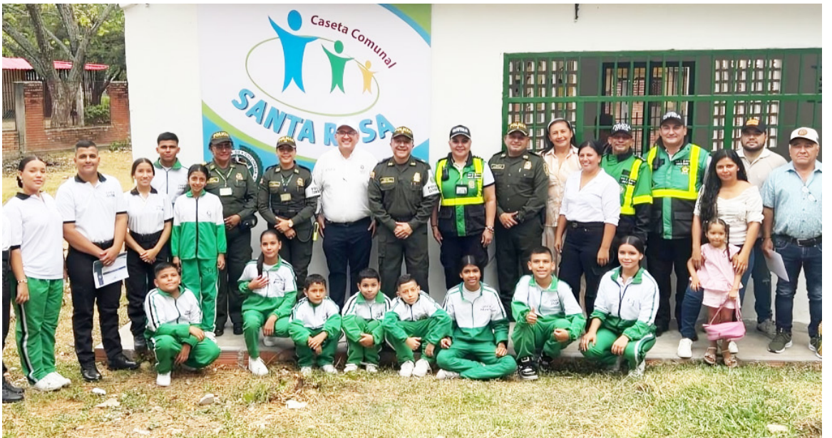
La Policía Metropolitana de Neiva, de acuerdo al modelo de servicio de policía orientado a las personas y los territorios, hace el lanzamiento de la Policía Comunitaria mediante un importante evento que se realizó en la comuna 9 de la capital Opita.