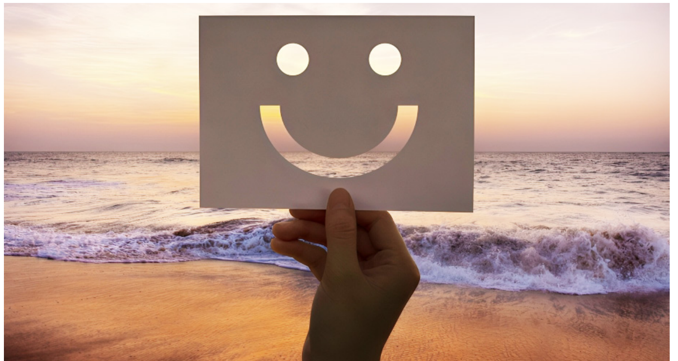
La investigación "¿Cómo pueden las personas ser más felices?" encontró que incluso las interacciones breves con extraños pueden ofrecer beneficios emocionales.

La felicidad no es un destino final, sino una construcción diaria. Esta afirmación subraya la importancia de enfocarse en hábitos y esfuerzos constantes que promuevan el bienestar, en lugar de perseguir la felicidad como un objetivo único e inalcanzable.