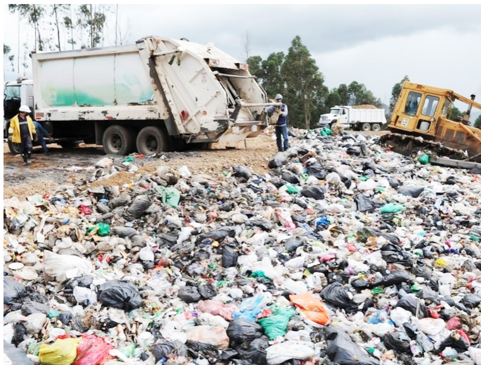
El 4.23% del total de las toneladas, es depositada en sitios con vida útil vencida.