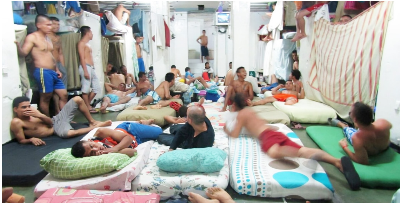
Otra de las problemáticas es el hacinamiento carcelario.

CPAMS Santa Marta y La Terrena en Cartagena, entre otros.