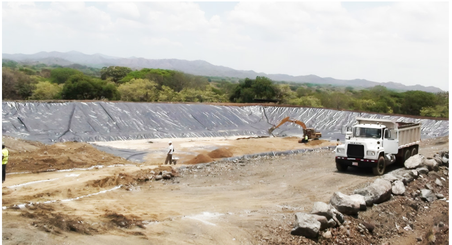
De los 262 sitios de disposición final existentes en Colombia, 24 tienen vida útil vencida.

Adicionalmente, hay pocos avances en materia de aprovechamiento en el marco del servicio público de aseo, pues de acuerdo con datos reportados