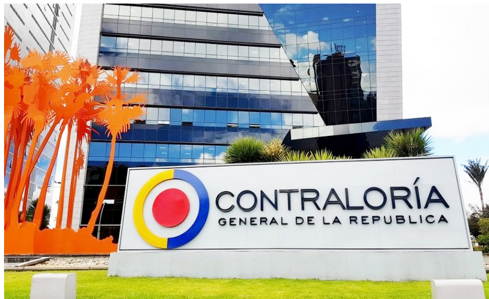
La Contraloría General, supervisará la entrega de recursos manejados por el Uspec e Inpec.

El objetivo es verificar las condiciones y servicios que prestan los establecimientos penitenciarios y carcelarios del país, con énfasis en algunos centros como Epams Girón Palogordo, EMPMSC El Bosque de Barranquilla, Modelo Bogotá, CPAMSCAS La Paz de Itagüí, CPAMS Valledupar,