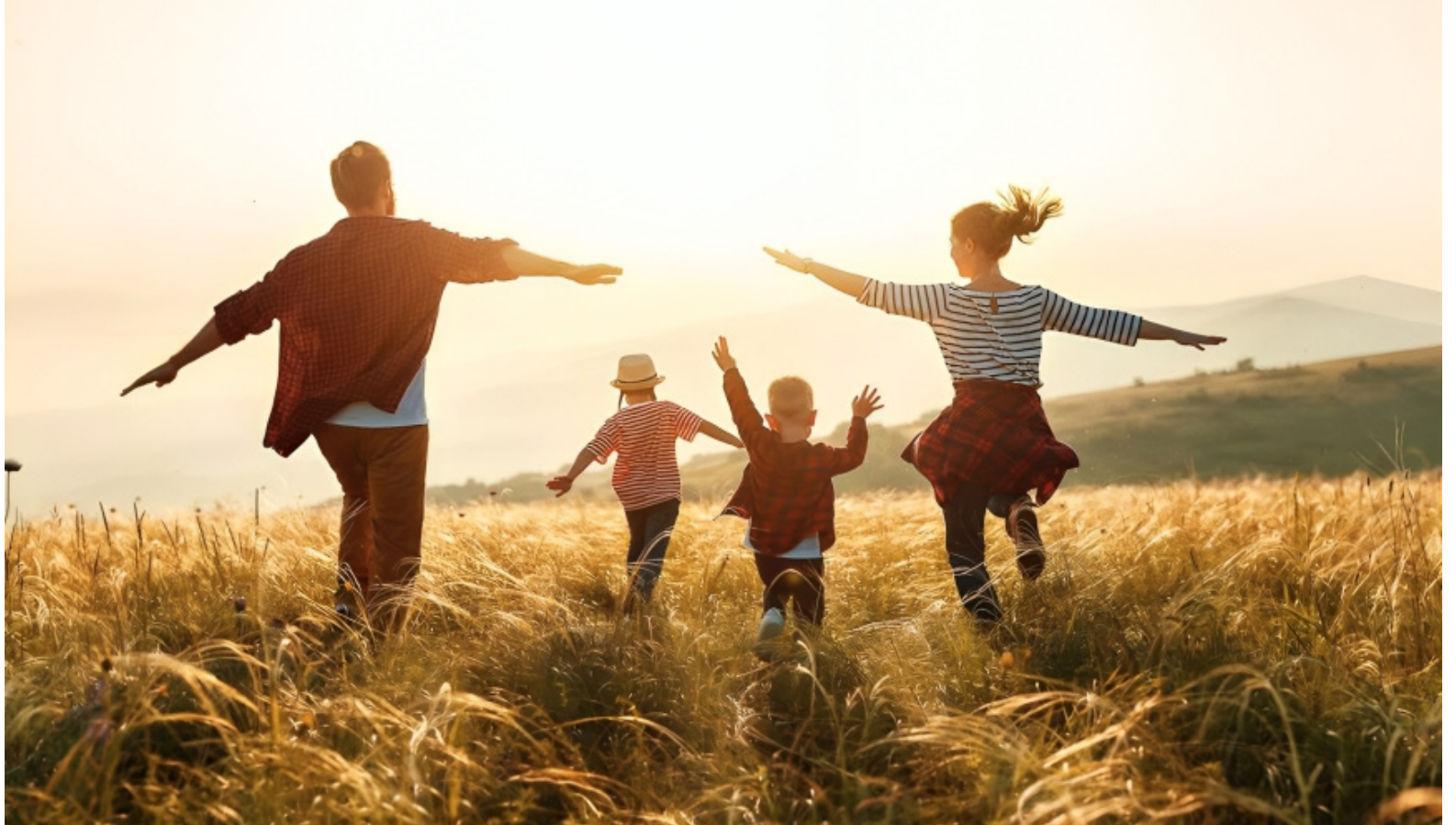
La medición de la felicidad en el Informe Mundial de la Felicidad se basa en seis variables clave, entre ellas la esperanza de vida saludable, la generosidad y la falta de corrupción.