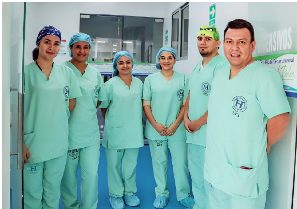
Se espera, con estos servicios, avanzar en la humanización de la prestación de salud en el occidente huilense.

Igualmente, como lo hizo saber el gobernador del Huila durante el recorrido, se espera ampliar el servicio para poder desarrollar operaciones por medio de laparoscopia, “el señor Gobernador nos dijo vamos a apoyar al hospital de La Plata y hoy por hoy, con este anuncio, nos hace ese convenio por 1.200 millones de pesos de parte de la Gobernación del Huila y 130 millones de pesos por parte del Hospital San Antonio de Padua, eso nos alegra, los cirujanos, todos ellos tres son laparoscopistas, los me decían doctor llevamos mucho tiempo esperando, y es que cuando se hace una vesícula hoy en día se hace por laparoscopia, a nadie le gusta tener la herida de 8 de 10 centímetros, quiere que se haga con toda la tecnología y eso es un avance muy importante para el servicio de cirugía y ahí está totalmente demostrado el apoyo que hoy viene (...) yo pienso que la próxima semana se va a hacer el convenio, una vez hecho el convenio hay que seguir todos los elementos normativos y legales para hacer la apertura de licitación pública con todas las demás condiciones que dictamine la norma para la compra dentro de todos los conceptos de la transparencia y la legalidad y se compran estos equipos, en alrededor de un mes y yo calculo que en dos meses nuestros cirujanos ya está haciendo cirugía laparoscópica”, señaló Muñoz Paz.