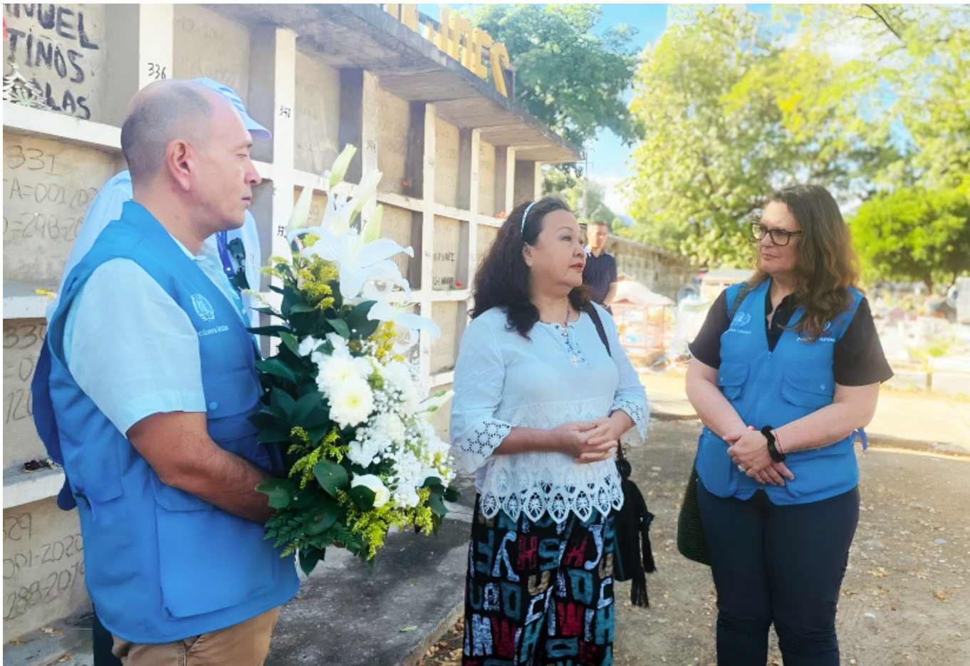
Grupos armados en Cauca.

rechos humanos en 2023, la situación sigue siendo extremadamente grave. Colombia continúa siendo el país con el mayor número de asesinatos de defensores de derechos humanos en el mundo. Esta realidad es alarmante y pone de manifiesto la persistente amenaza que enfrentan las personas que se dedican a proteger los derechos de sus comunidades. Además, nuestras oficinas en los territorios siguen reportando el recrudecimiento de prácticas como el reclutamiento forzado de menores, la extorsión generalizada y las amenazas de muerte, todas ellas prácticas que están devastando las economías locales y destruyendo el tejido social de las comunidades indígenas, afrodescendientes y rurales.