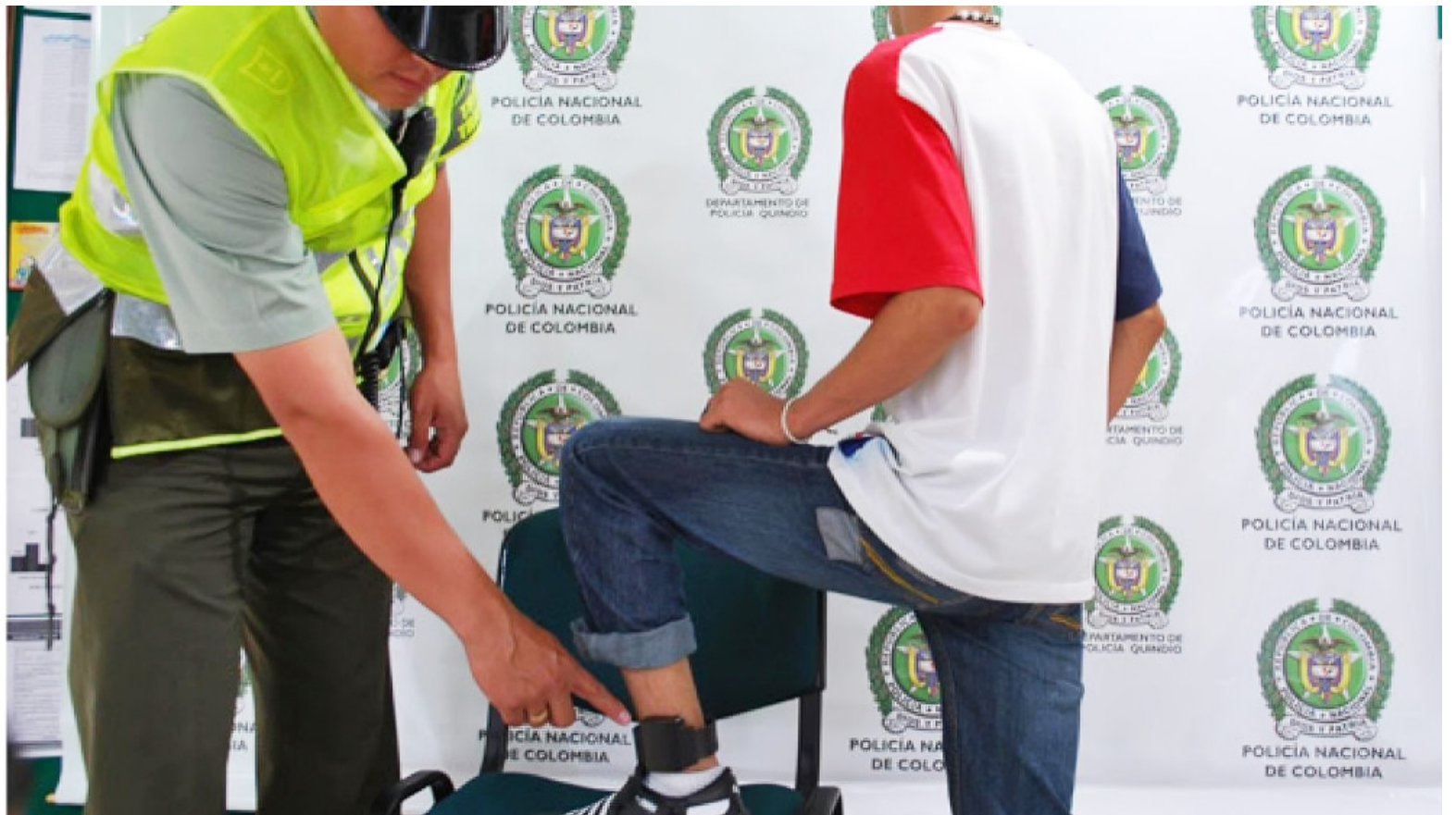
No hay control sobre detenidos con detención domiciliaria que tienen brazalete electrónico.

Y es que las acciones que las autoridades deben emprender como consecuencia del monitoreo del servicio de vigilancia electrónica para privados de la liber-