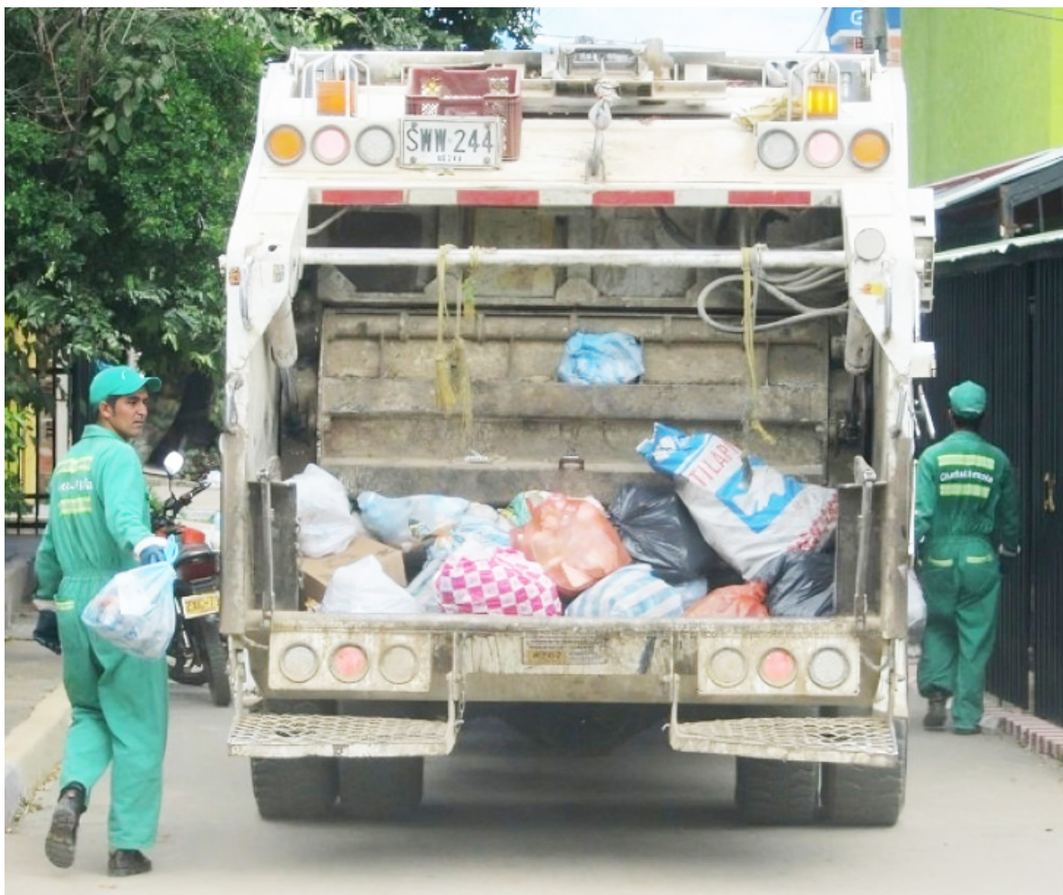
Neiva produce diariamente, 350 toneladas de residuos sólidos.

De los 262 sitios de disposición final en Colombia, 24 tienen vida útil vencida; 46, una vida útil de 0 a 3 años, y 22, una vida útil de 3 a 5 años. De no tomarse las medidas apropiadas, lo que está ocurriendo puede amenazar el derecho a un ambiente sano.