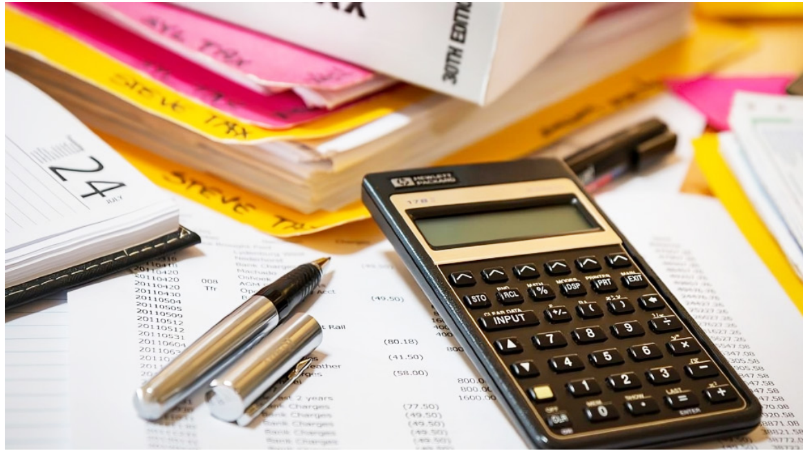
"Recuerde, que es deducible los pagos de intereses sobre prestamos del ICETEX y para adquisición de vivienda".

Y la Dian, mediante Resolución No. 000120 del 31 de julio de 2024 modifica el instructivo del Formulario No. 210 -declaración del impuesto a la renta personas naturales residentes, en el sentido, dado que el numeral 1 del artículo 336 del Estatuto Tributario considera los ingresos por todo concepto para la determinación de la renta líquida, se ajustó el instructivo para indicar, que los ingresos provenientes de las rentas pasivas de capital y no laborales hacen parte del cálculo para determinar el límite del 40% de la renta exenta y deducciones especiales imputables.