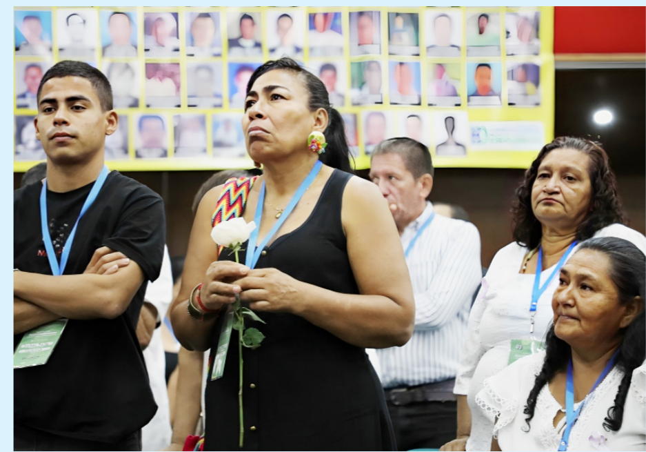
Las víctimas propusieron la construcción de un centro de memoria para el Huila.

municipios de Garzón, de Pitalito y Neiva. Ya aquí en Neiva, se tiene identificada una problemática donde está el Monumento Número 14, donde hay unas bóvedas que históricamente han sido abandonadas, mal mantenidas, donde hay cuerpos combinados de todo tipo, desde cuerpos de personas no identificadas, cuerpos de personas que han sido ya identificadas, pero no han sido reclamadas o que incluso habiendo sido reclamadas no han habido recursos para poder trasladar esos cuerpos a otros lados, creemos que eso es un drama donde nosotros podemos de manera in-