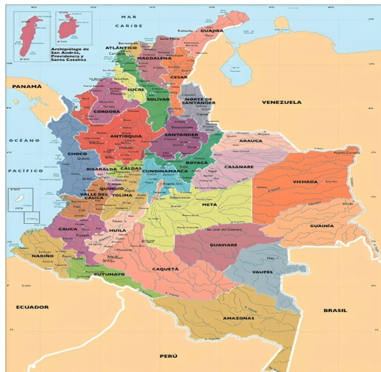
La situación es crítica en los departamentos de Antioquia, Bolívar, Cauca, Cesar, Norte de Santander, Putumayo, Tolima, Arauca, Valle del Cauca y Vichada.

Y es que la gravedad del actual panorama se intensifica al analizar las cifras de las toneladas anuales de residuos dispuestas en los sitios de disposición final. El 4.23% del total de las toneladas es dejada en lugares con vida útil vencida.