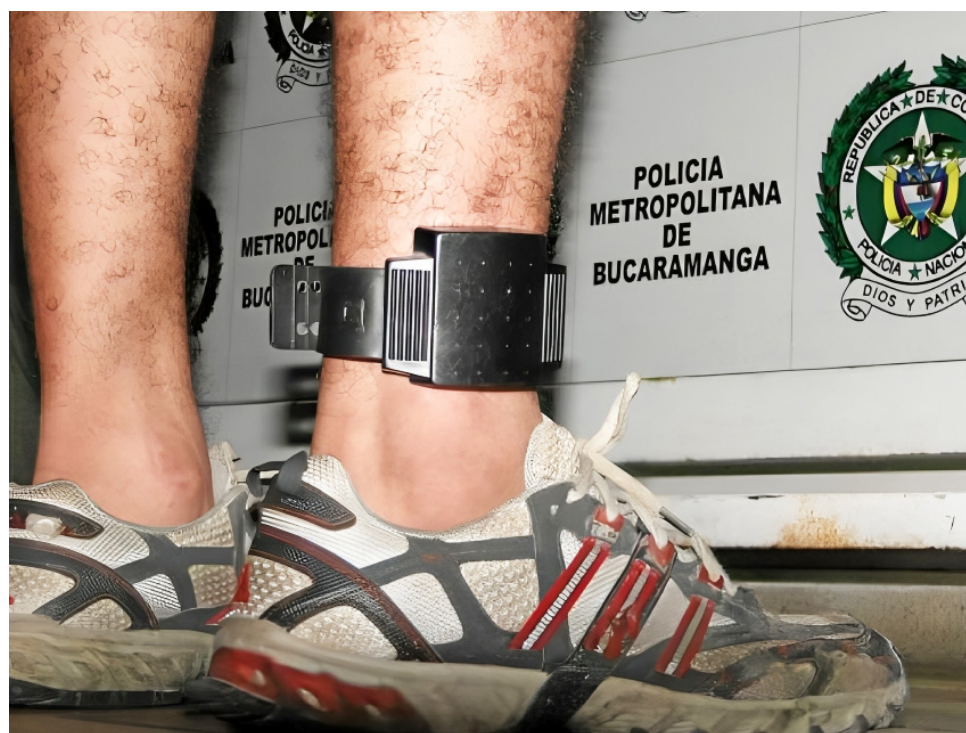
En julio se reportaron 292 dispositivos intermitentes y otros 90 estaban totalmente apagados.

Evidencia de lo anterior lo constata la plataforma Chronos que el pasado 2 de julio del año en curso, reportó 292 dispositivos intermitentes y otros 90 totalmente apagados, desconociéndose las acciones tomadas por el competente para solucionar esta situación, ni el trámite surtido ante las autoridades judiciales.