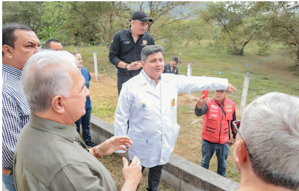
Igualmente, se está avanzando en la ampliación de la planta física.

la atención en los servicios de complejidad cardiológica, de gastroenterología y tomografía sean realizados en el Hospital de La Plata, “con el propósito de que los pacientes y sus familiares tengan más comodidades, a las EPS quizá les resulte menos costoso por el volumen de exámenes que se realizan en Neiva el contratar con otras IPS, pero son los pacientes y sus familias los que tienen que irse más lejos, entonces deben pensar en que es por humanización del ser-