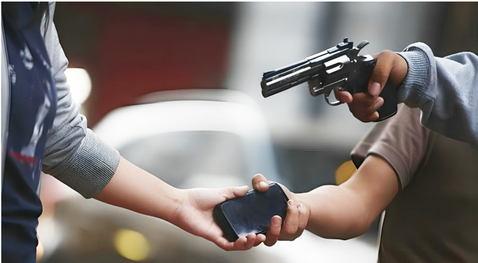
La seguridad ciudadana, se ve afectada por detenidos con este dispositivo que salen a delinquir.