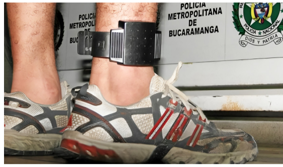
Brazaletes de vigilancia: la ineficiencia que aumenta la inseguridad