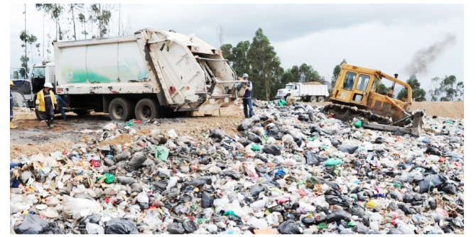
Preocupante panorama con las 'basuras' en Colombia