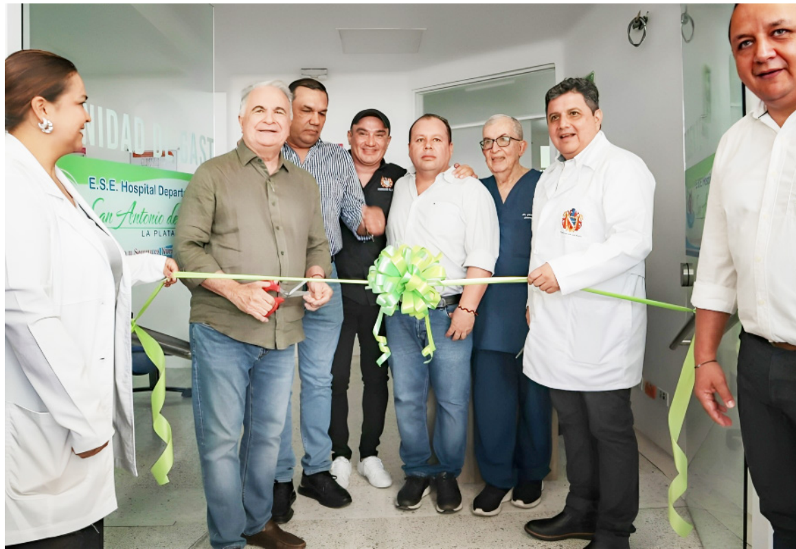
El gobernador del Huila hizo presencia en la inauguración de los servicios.