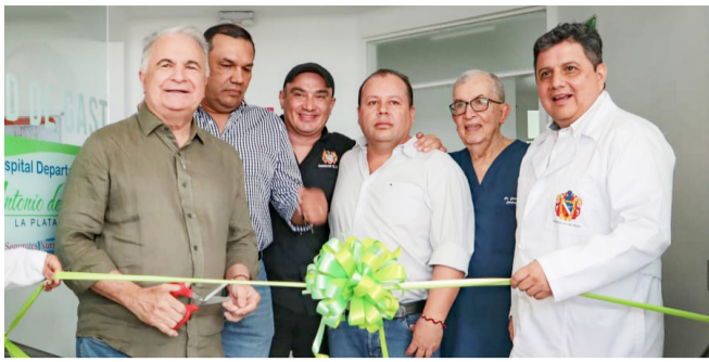
Mejora en la prestación de salud en el occidente del Huila