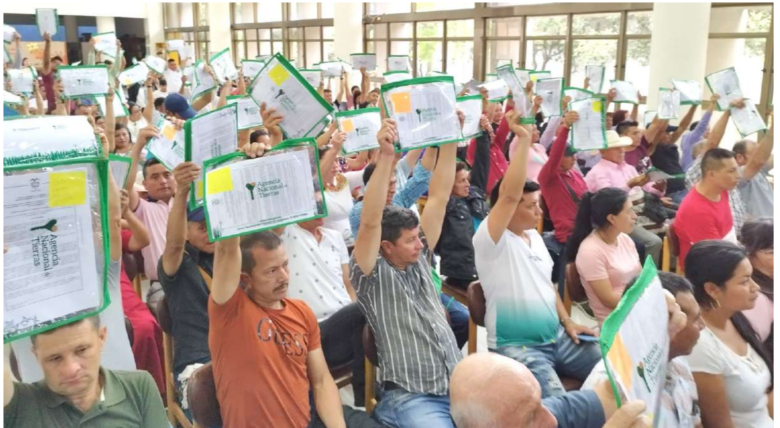
Los títulos expedidos, en efecto, benefician a 286 campesinos (133 mujeres y 153 hombres)

“Hay una manifestación pública de Fedegan de ayudar al Gobier-