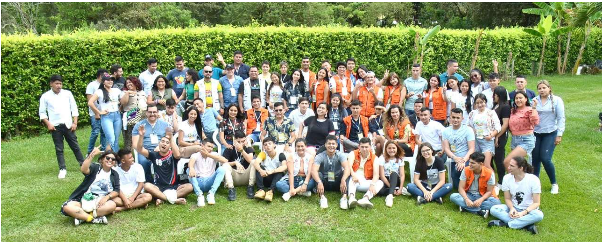
Piden ser escuchados y tenidos en cuenta para la consolidación del plan de desarrollo nacional.

Según indican, durante estos cuatro meses de trabajo, la comunión ha sido casi nula y se percibe mucha improvisación. Piden ser escuchados y tenidos en cuenta para la consolidación del plan de desarrollo nacional.