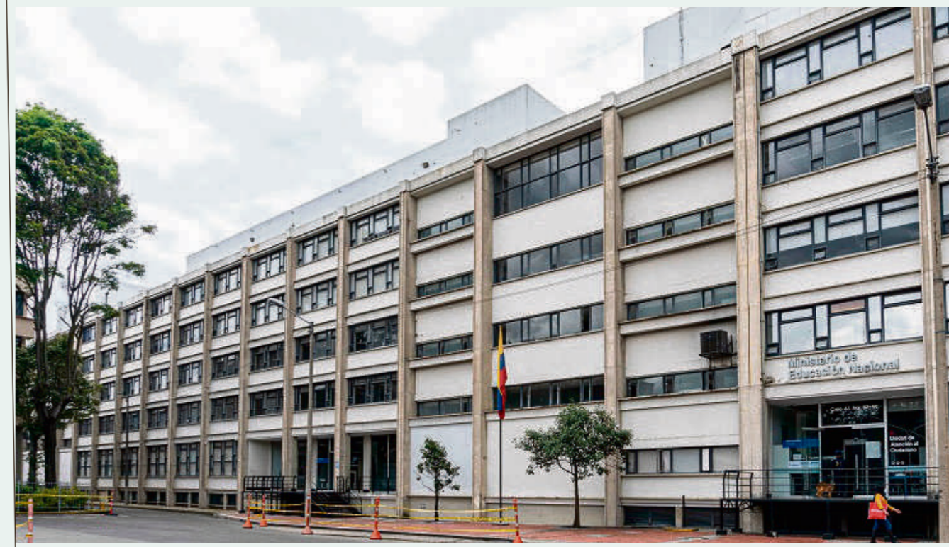
Hoy una comisión de 60 profesores de todo el país llegará a Bogotá a buscar una ayuda ante el Ministerio de Educación y el Congreso.

Desde entonces se han realizado al menos 8 pruebas de ingreso al sector. La última fue en 2016, en la que se ofertaron 21 342 plazas; cifra que subió a más de 37 000 este año, convocatoria a la que se presentaron más de 378 mil personas en todo el país.