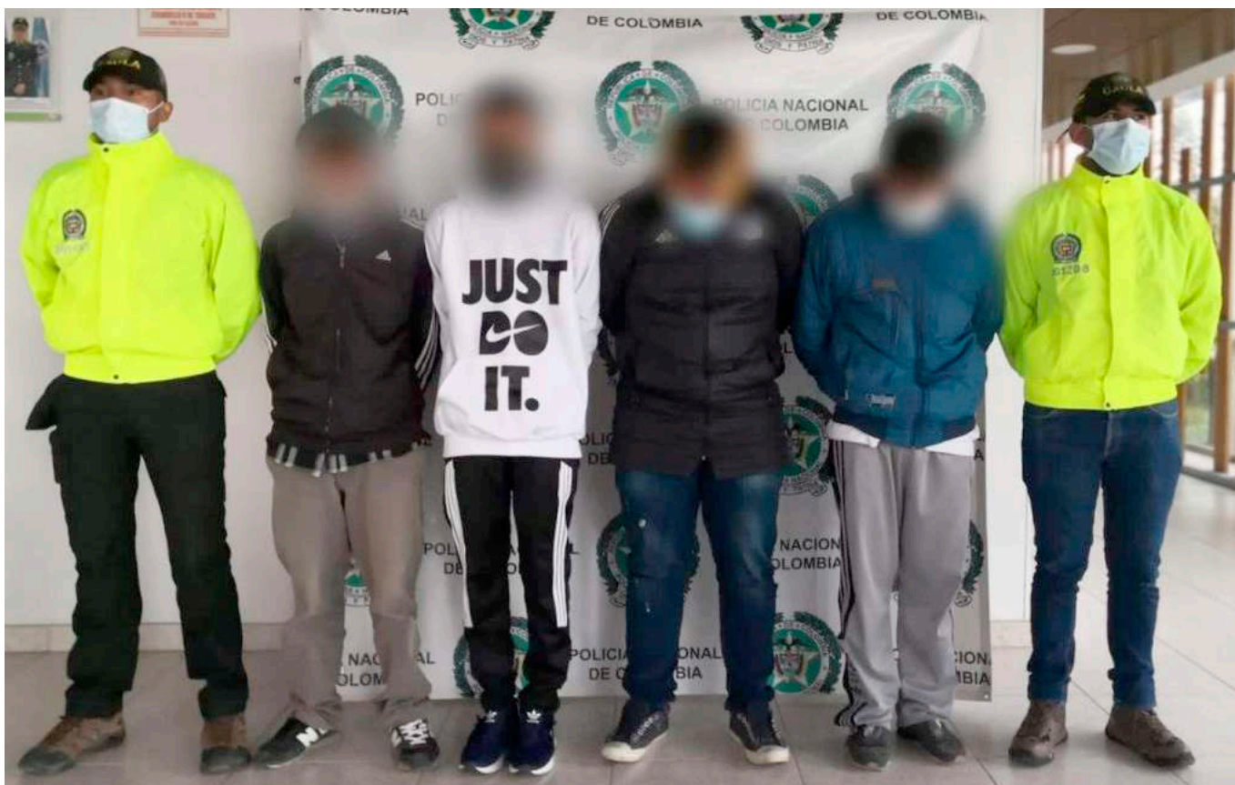
Van cerca de 170 capturados de la Primera Línea