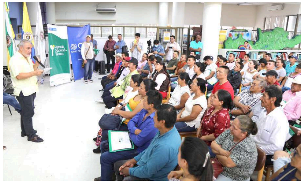
La Agencia Nacional de Tierras entregó titulación de tierras en 12 municipios del Huila.

La Gobernación del Huila en articulación con la Organización Internacional para las Migraciones OIM y la Agencia Nacional de Tierras ANT vienen adelantando socializaciones a cerca de 5000 actores rurales en temas de formalización de predios rurales.