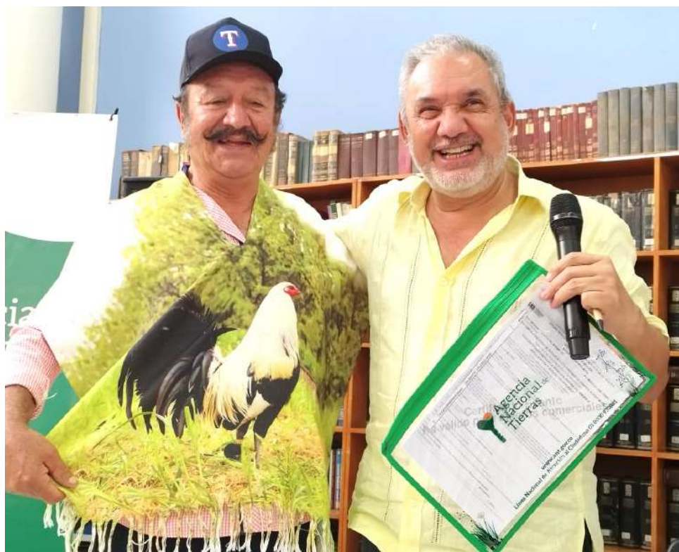
En su visita a la capital huilense, se planteó precisamente trabajar en conjunto con la secretaría de Agricultura y los alcaldes de todos los municipios del departamento del Huila

no Nacional en la entrega de títulos, liberando tierras fértiles que ellos tienen y nosotros agradecemos ese gesto porque nos parece que una organización que en el anterior se había opuesto a estos temas de reforma agraria y redistribución de la tierra, y que tenga hoy la decisión de apoyar al gobierno para que cumpla las metas en el tema de reforma agraria, nos parece muy bien. Con ellos lo que se busca es comprar unas tierras para entregarle a gente que no tiene”, concluyó.