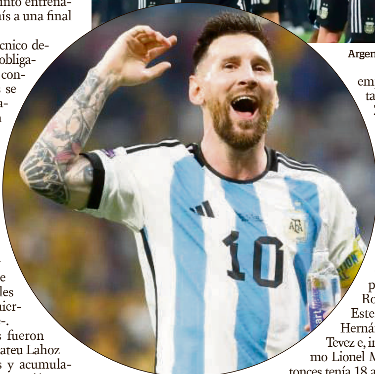
Lionel Messi referente de Argentina.

Mundial de Qatar 2022. El equipo de Lionel Scaloni se medirá con un viejo conocido como Croacia, que cuenta como principal emblema a Luka Modric, para quien también siempre es especial enfrentar a la Albiceleste: debutó hace 16 años en su selección justamente contra el conjunto argentino.