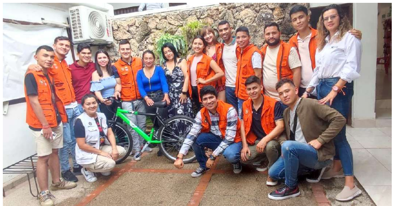
No se ha tenido información directa con los territorios y, además, están dejando la participación de muchos jóvenes en manos de los gobiernos departamentales.

Y es que, desde luego, un evento de este tipo debería contar con una agenda muy clara, toda vez que, los insumos que se esperan recoger se direccionan hacia la hoja de ruta para las juventudes del país. Es por esta razón que ven con preocupación que para