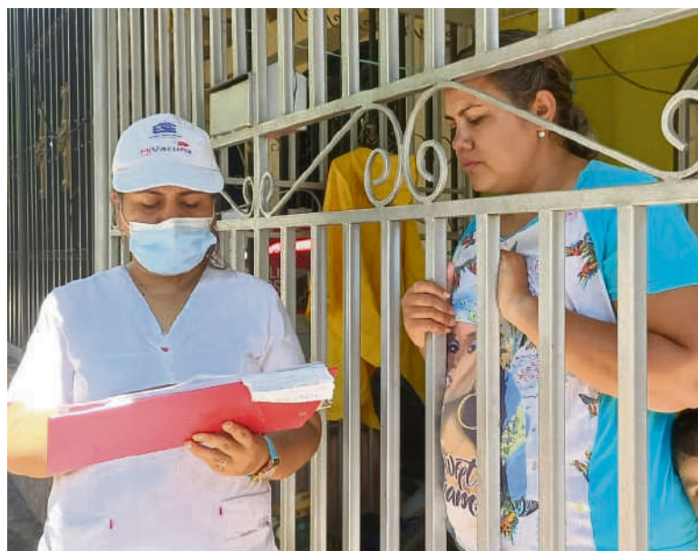
Siete equipos interdisciplinarios están dispuestos en los municipios donde opera el PIC de la ESE CEO.

"En esta primera fase se está implementando la estrategia 'Vivienda Saludable' en la zona urbana y rural de cada municipio. Para la segunda fase, que sería en la vigencia 2023, se estaría implementando el tema de caracterización familiar", precisó la coordinadora.