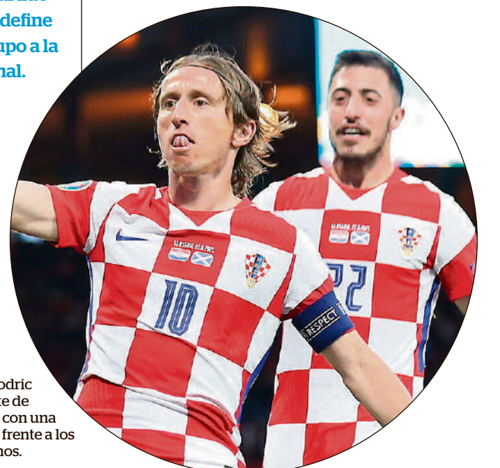
Luca Modric referente de Croacia con una historia frente a los argentinos.

En Rusia 2018, el mediocampista del Real Madrid encabezó, con gol incluido, la victoria de Croacia ante Argentina, por un contundente 3-0, en partido de la primera fase disputado en Nizhni Novgorod. Fue el inicio de un Mundial soñado para los balcánicos que -al igual que la Albiceleste- sueña con seguir haciendo historia en Qatar 2022.