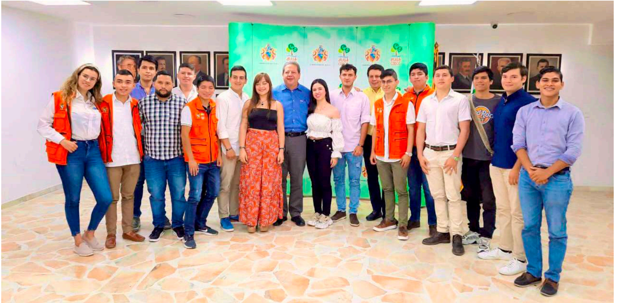
Líderes de juventud en el Huila expresan su inconformismo.