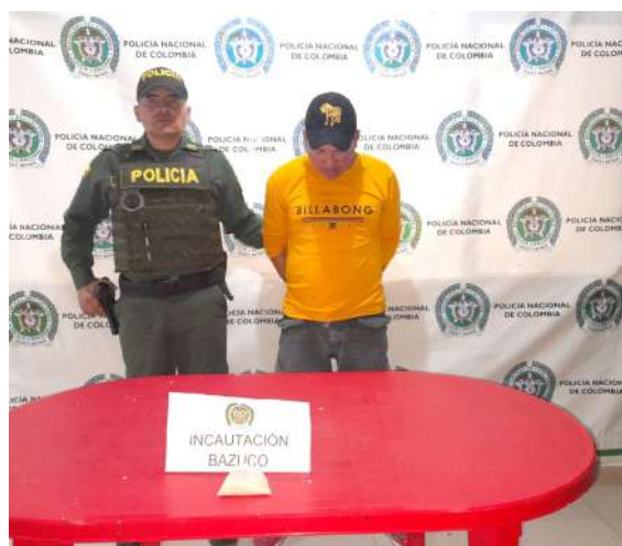
Uno de los capturados.

En cuanto a la aplicación del Código de Convivencia y Seguridad Ciudadana, fueron impuestos 78 órdenes de comparendos por comportamientos contrarios a la convivencia, teniendo como faltas más recurrentes aquellas que ponen en riesgo la vida e integridad (59): portar armas blancas, traumáticas y participación en riñas y 2 suspensiones a la actividad económica o cierre de establecimientos por incumplimiento de horarios y no contar con la documentación exigida.