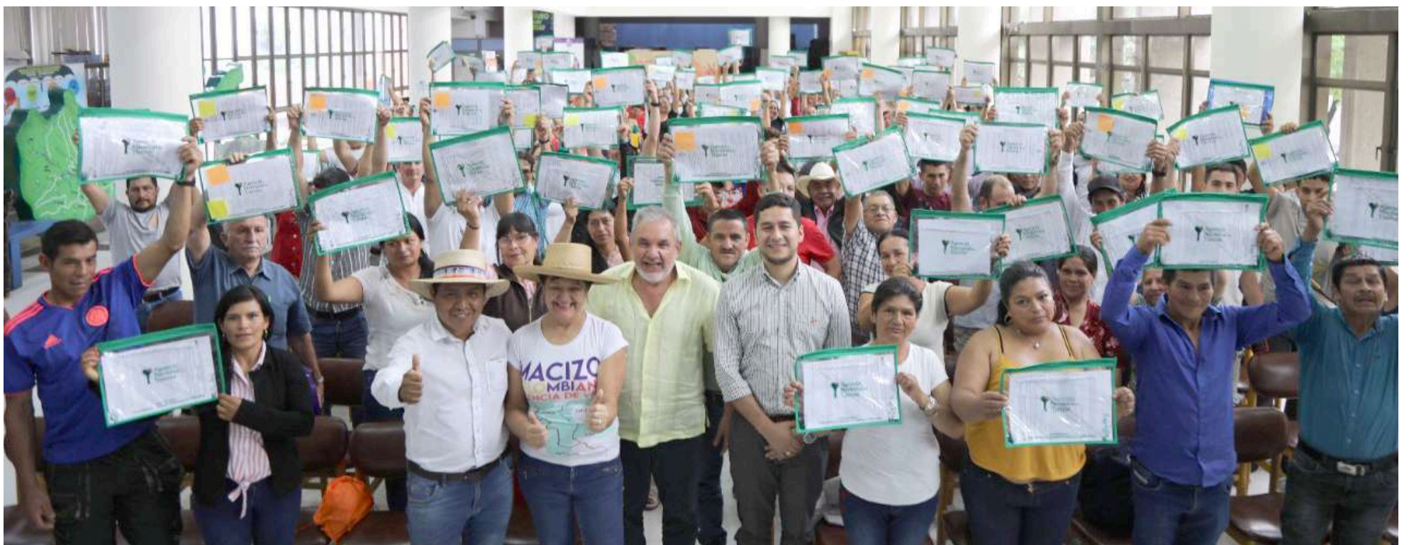
Positivamente avanza la Reforma Agraria en el país.

Esto significa el inicio con proyección de la Reforma Agraria dando cumplimiento a los acuerdos de paz, específicamente, en el punto 1 que dista de la entrega de tierras por tres millones de hectáreas a familias que no lo tie-