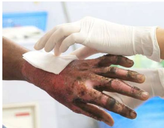
Son 4 los quemados con pólvora en el Huila.

En cuanto al tipo de lesión de han presentado quemaduras, laceraciones y daño auditivo, y los artefactos causantes han sido totes, volcanes y luces de bengala.