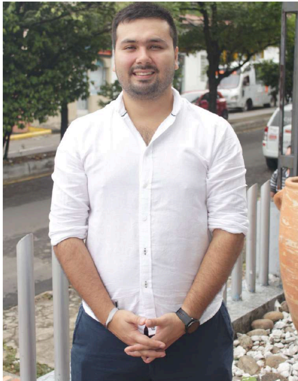
Masificar el deporte y profundizar en los programas que han sido exitosos es una de las metas.

Ya hay una experiencia y un terreno abonado, sin duda alguna la fortaleza del instituto es su talento humano, hay gente que tiene mucha experiencia y ha venido cultivándola, sin embargo, hay unos ajustes que se hace necesario hacer, hay que profundizar mucho en la formación, del ser que es uno de los mandatos del actual gobierno,