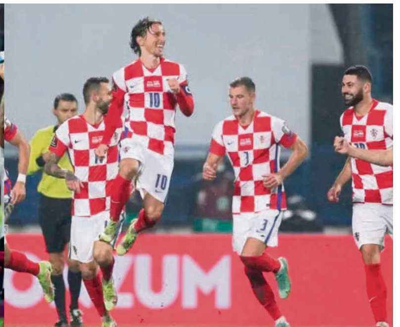
Argentina y Croacia se enfrentan en una de las semifinales.