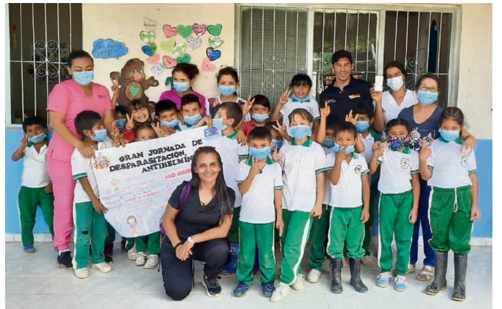
Diferentes actividades se realizan en pro de la población norte del Huila.

Las jornadas extramurales están enfocadas a mejorar y optimizar las condiciones de vida de niños, niñas, adolescentes y adultos.