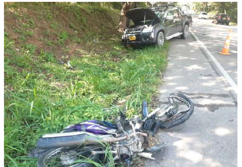
La ruta 45 es la que más accidentes en la vía ha dejado.