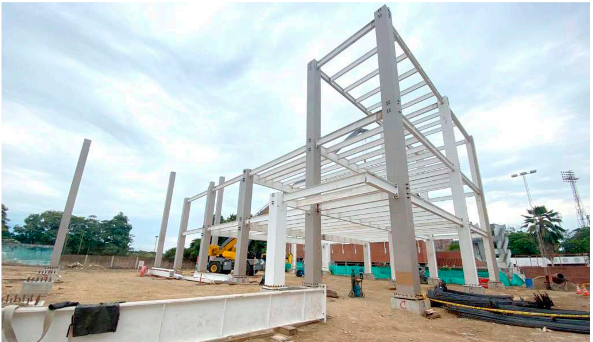
Centro de alto rendimiento la felicidad en construcción

Hemos encontrado fortalezas en algunas disciplinas, más que en otras, la lucha olímpica, el taekwondo, los deportes individuales han tenido una serie de resultados positivos, que nos han creado una expectativa y nos permiten ilusionarnos con unas medallas de oro