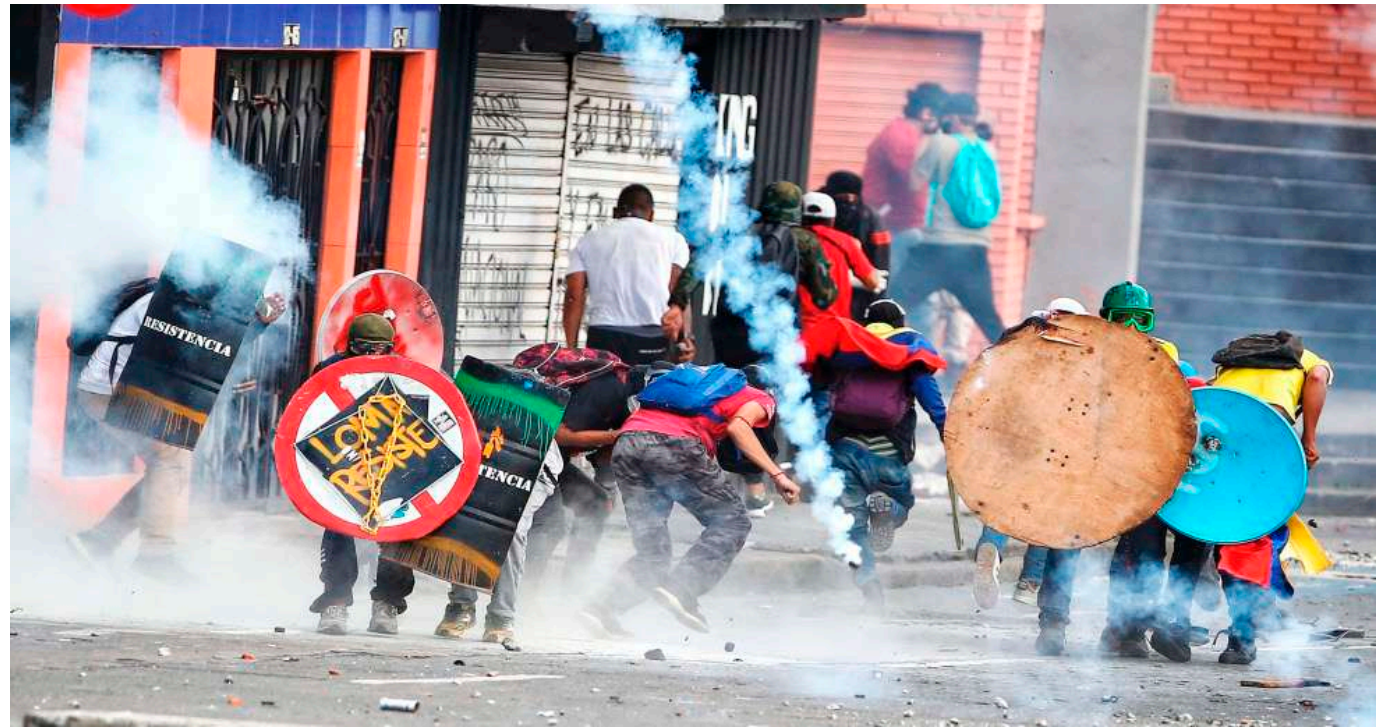
Se catalogó como catastrófica la idea del jefe de Estado de querer excarcelar miembros de la Primera Línea.

La excarcelación masiva aplica la ley 2272 de 2020, conocida como la búsqueda de convivencia y paz, que le permite al presidente pedir las libertades de las personas a las que él considere.