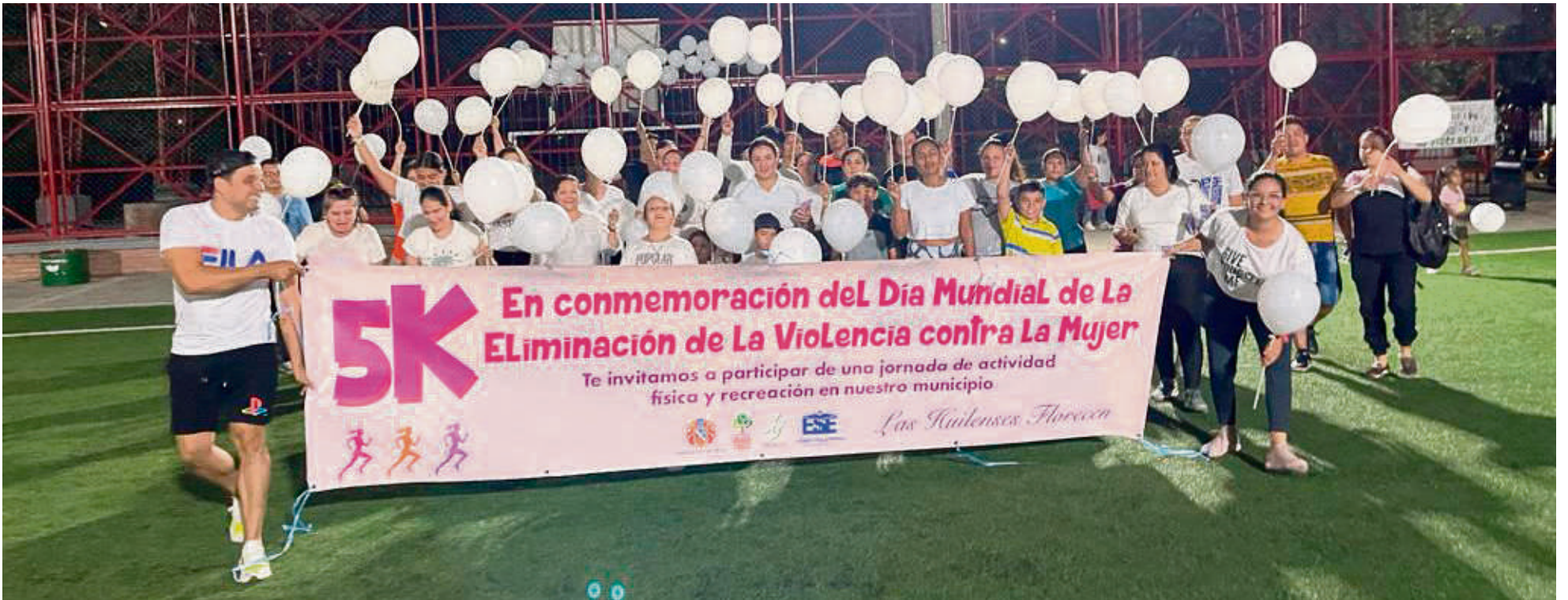
La ESE Carmen Emilia Ospina a través del PIC desarrolla la estrategia 'Salud en Casa, Huila Crece Contigo'.