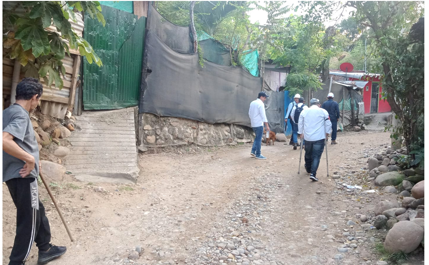
La comunidad manifestó que no está de acuerdo con la tecnología que Electrohuila pretende instalar.

Comunidad de Brisas del Venado obtuvo la asignación de $899.231.326 para la “Normalización de redes eléctricas en el barrio Brisas del Venado del municipio de Neiva - Contrato PRONE GGC 503 de 2022 suscrito entre Electrohuila S.A. E.S.P. y La Nación (MME).