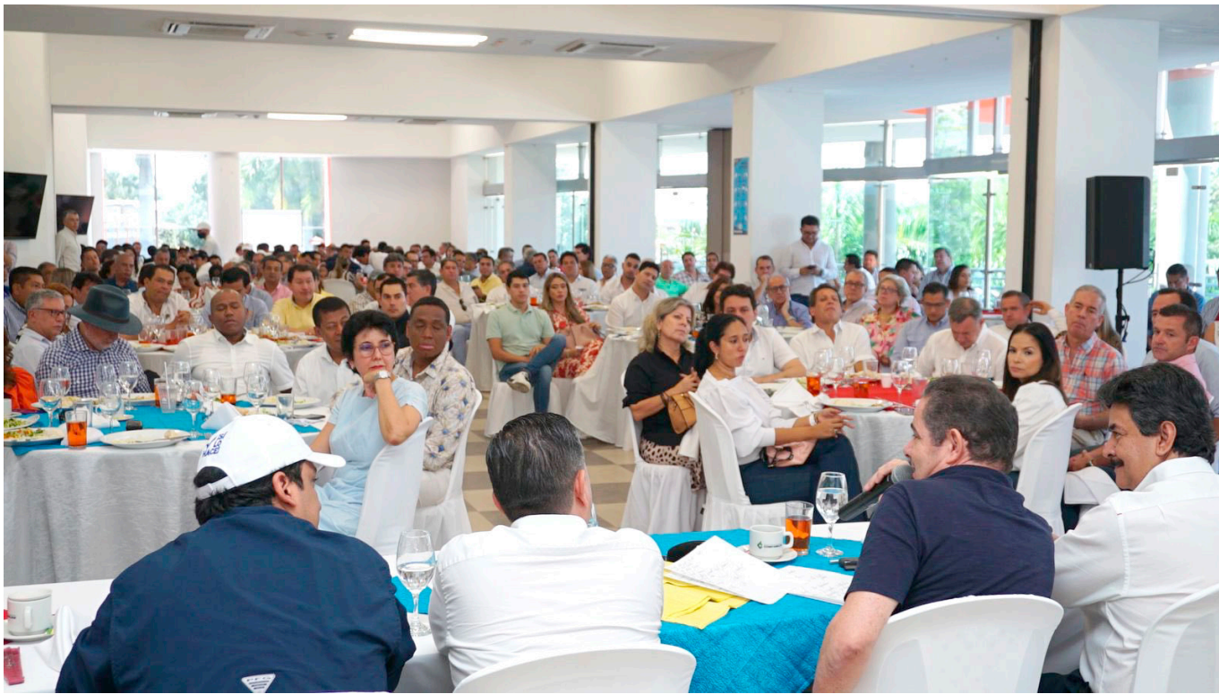
Este jueves 11 de mayo, más de 300 empresarios expusieron ante Vargas Lleras su sentir.

ley, miles y miles de empleos se van a perder y pocas soluciones habrá para el desempleo y para la informalidad. También expresamos cuál es nuestra posición sobre la reforma a la salud: no creemos en un modelo estandarizado, no creemos en que haya que acabar el aseguramiento. Nos preocupa mucho que se acaben las redes de prestación de servicios, ningún colombiano va a estar satisfecho cuando le restrinjan su derecho a elegir. Es muy grave también que se convierta en ley, el proyecto pensional.