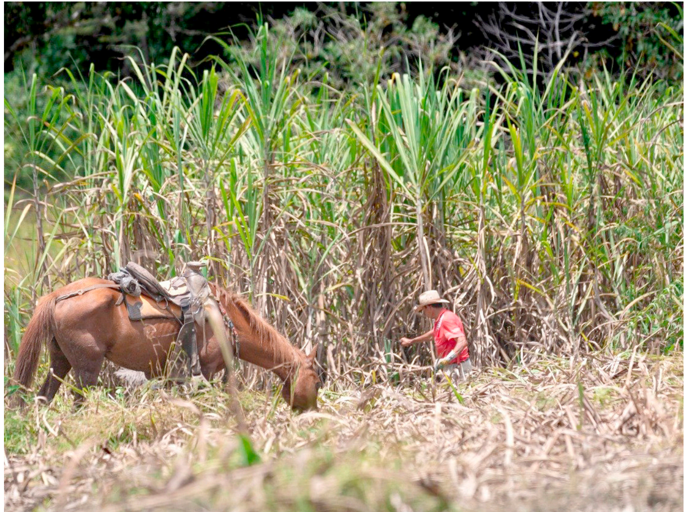
El costo del sostenimiento de los cultivos de caña, sumado a los fertilizantes, también están afectando la rentabilidad del sector panelero.

Cabe recordar que Paneleros de San Agustín protestan por el alto precio de los insumos, la presencia de panela de contrabando y los costos de producción. La manifestación ha durado casi una semana.