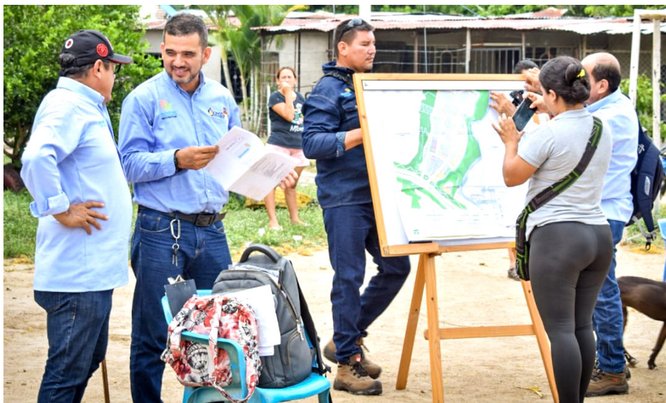
Electrohuila emitió respuesta a las inquietudes que se plantearon desde Diario del Huila.

Puntualmente, con la comunidad de Villa Colombia se va a realizar una mesa técnico social para darle solución a los inconvenientes que se presentan y que son asociados a dinámicas de consumo y condiciones socioeconómicas complejas.