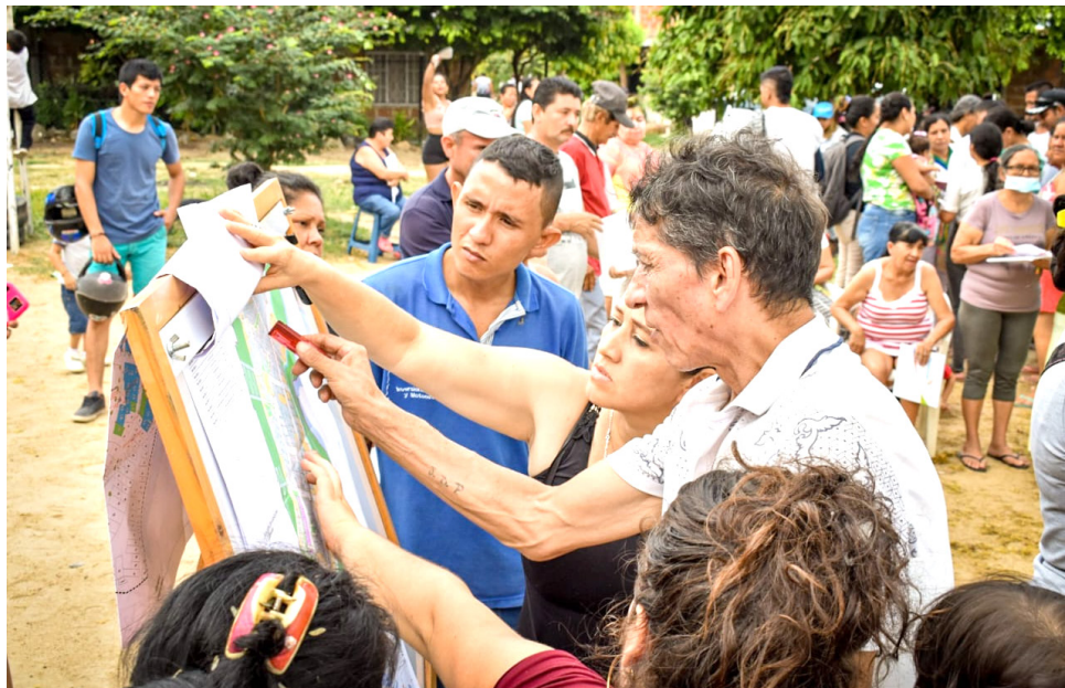
El contrato firmado es de $899.231.326.

A través de la presidenta de la Junta de Acción Comunal, los habitantes del barrio Brisas del Venado exigen garantías frente a la prestación de los servicios.