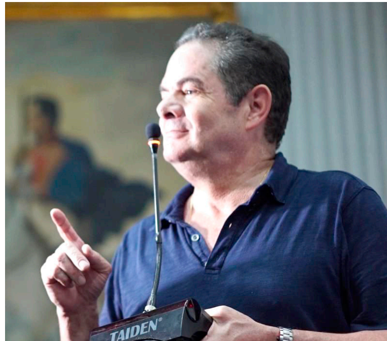
El vicepresidente, Germán Vargas Lleras, fue vehemente en sus críticas contra el Gobierno Nacional.

Delegaciones de todos los municipios del Huila, acompañaron a Vargas Lleras durante su intervención en la Asamblea Departamental.