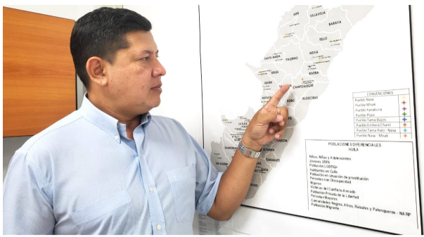
Huila, tercero en consumo de licor