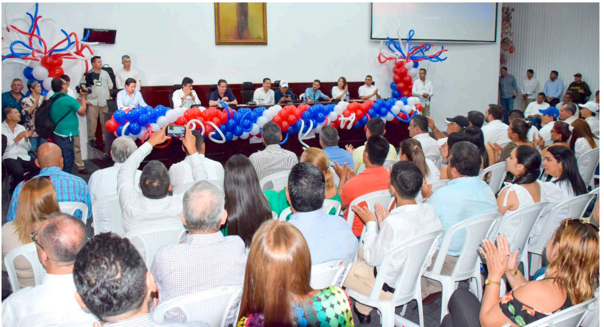
En el encuentro cumplido en Neiva, también estuvieron presentes Senadores y Representes del partido.

Por ejemplo, si esa reforma laboral se convierte en