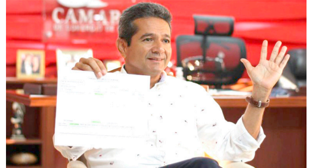
El primer encontrón judicial en la CCH