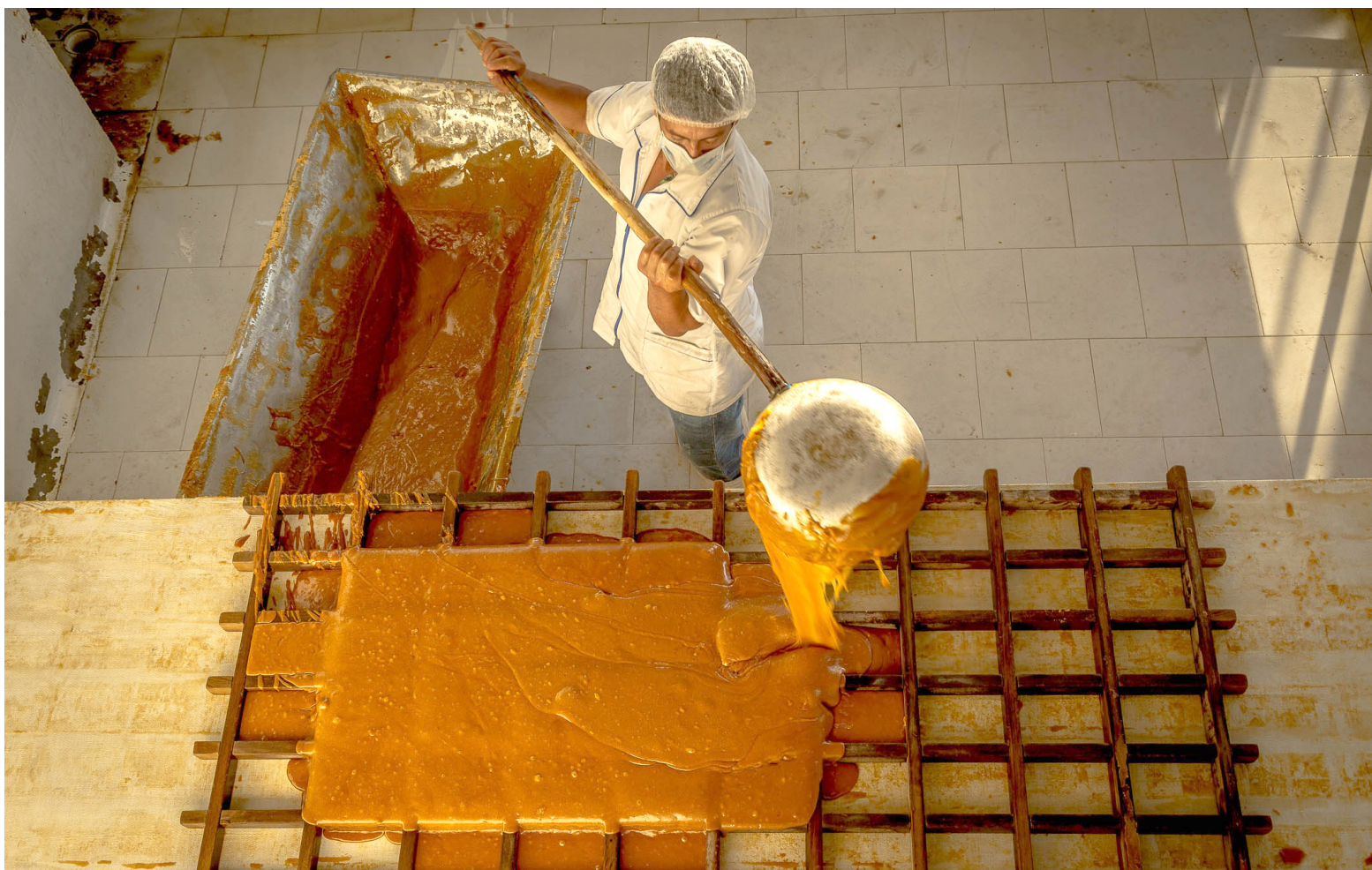
Mano de obra, sobre oferta, bajos precios e intermediación, tienen en jaque a los productores del sur del departamento.

Además de ello, los productores de panela pulverizada, que