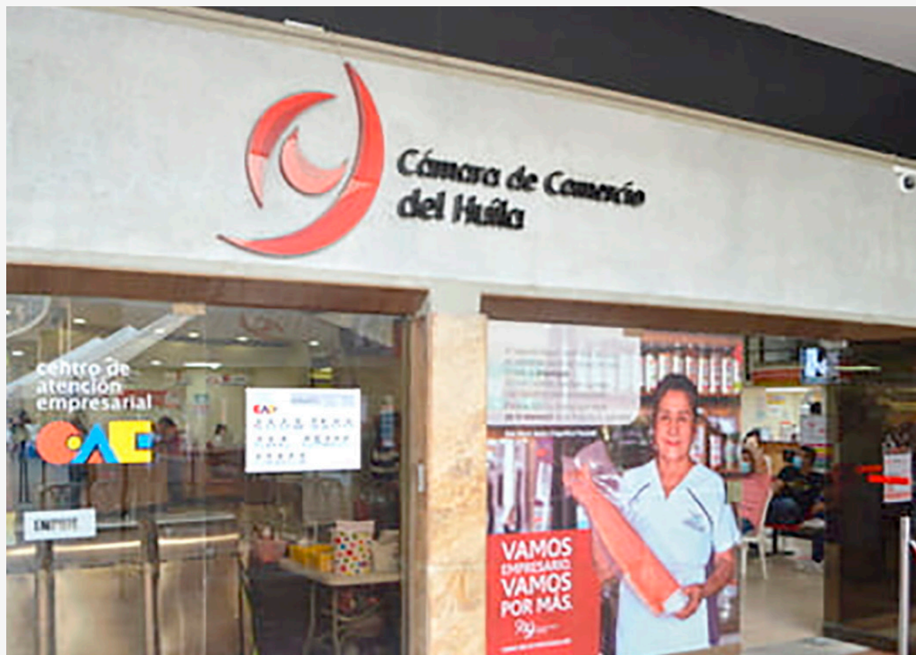
A la Cámara le solicitaron copia de los contratos correspondiente a la remodelación y modernización de los espacios físicos (ANCLA 1, ANCLA2, ANCLA3, LOCAL 53 Y LOCAL 54). Por un valor en el año 2021 de $ 3.332.660.848 y del 2022 por un valor de $ 4.278.409.803.

La decisión de primera instancia fue impugnada por la CCH.