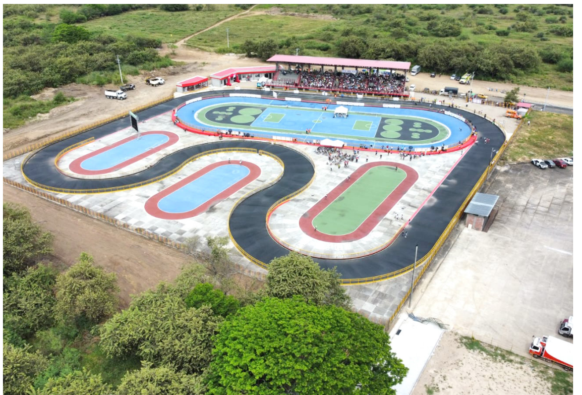
Neiva ya cuenta con patinódromo, la Alcaldía Municipal hizo entrega del proyecto en medio de un evento público. La apuesta beneficiará a un centenar de deportistas.