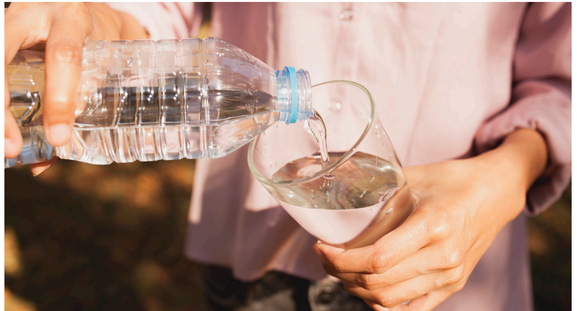
“La política de no consumo de tabaco y cigarrillo está funcionando y lo mismo deberían desarrollar con el licor para que sea una práctica moderada y así evitar los problemas de salud y sociales que estamos presenciando”, López.

Calidad, Cantidad, Consistencia, Comida, Compañía, Acompañamiento, Comportamiento y Conducción.