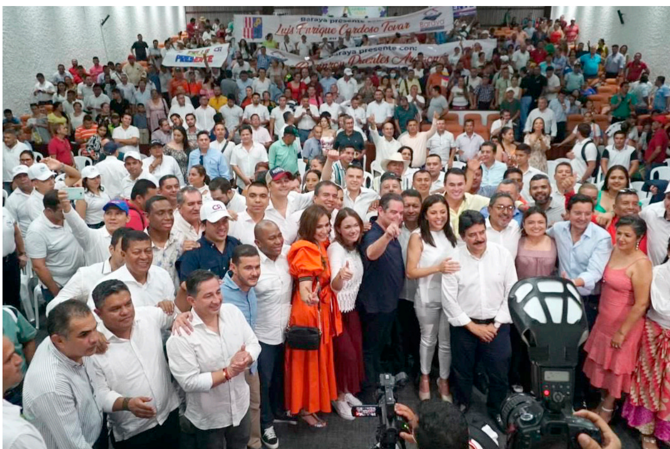
Desde diferentes municipios del Huila, llegaron partidarios del partido Cambio Radical