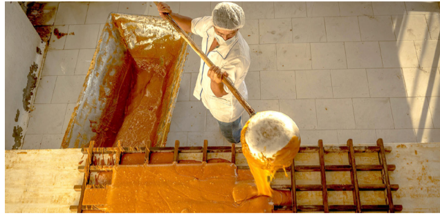
Paneleros estarían abandonando sus cultivos