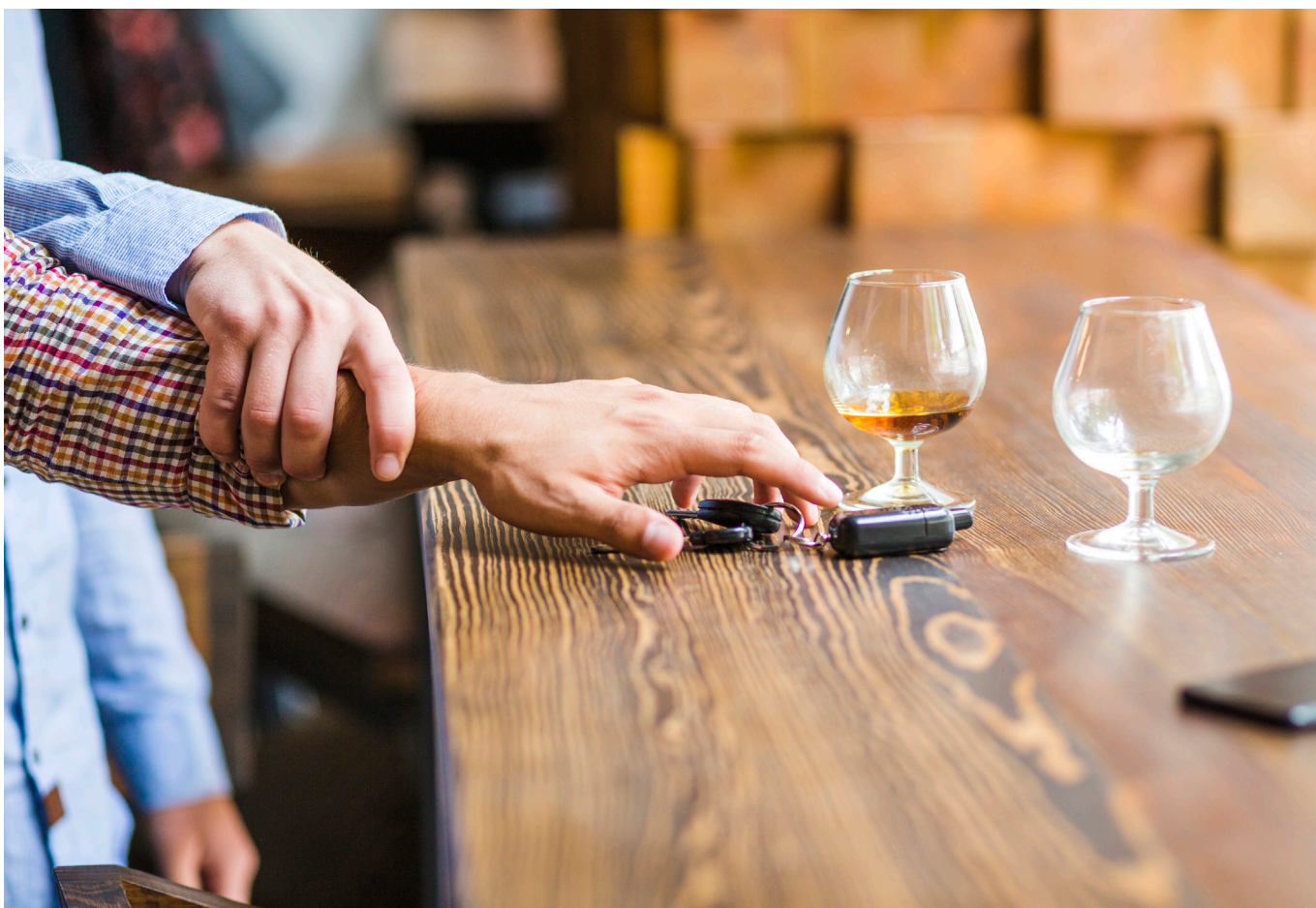
Según la OMS, más de 3 millones de personas mueren cada año por consecuencias asociadas al consumo excesivo de licor.

nes del año 2021 al 2022, se han incrementado las ventas de cerveza, por ejemplo, a septiembre de 2021 tenemos el registro de una venta de 13.805.802 docenas de cerveza, evidenciando un aumento en ventas de 1.069.946 docenas de cerveza, relación de la que hemos analizado que actualmente es más fácil adquirir cerveza importada que la nacional, toda vez que los supermercados continuamente hacen promociones que incitan al consumo puesto que se han dado cuenta que el departamento del Huila es hoy uno de los grandes consumidores. Otro asunto es la falta de control para la venta de vino, como nos damos cuenta, en el Huila tenemos una ruta turística alrededor de esto, pero todos los vinos no cuentan con ningún tipo de control sanitario, aún no hemos tenido registros de intoxicaciones, pero es un riesgo. Estas alertas están claras en el departamento y lo que necesitamos es el cumplimiento conjunto de la estrategia, actividad que ha resultado difícil en una región como la nuestra”, agregó López.