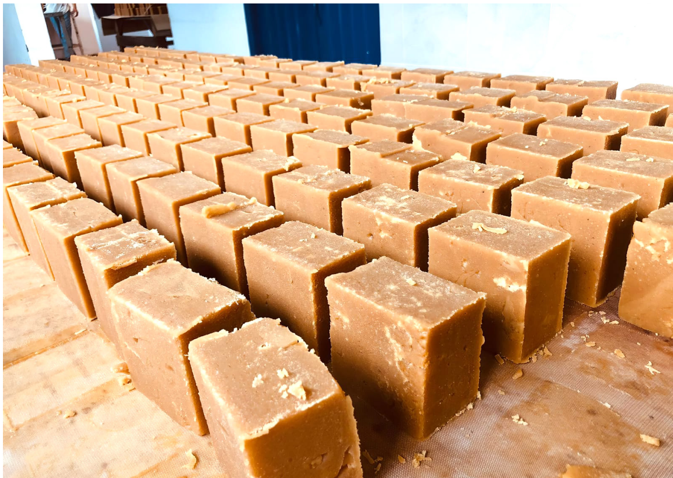
Desde los departamentos de Cauca y Nariño, estaría ingresando panela de contrabando al departamento del Huila.

Así mismo, el municipio de San Agustín tiene una participación entre 2.500 y 3.000 toneladas anuales del total departamental. Mientras que el municipio de Isnos tiene una participación entre las 5.000 6.000 toneladas anuales con respecto al 100% de la producción Huila.