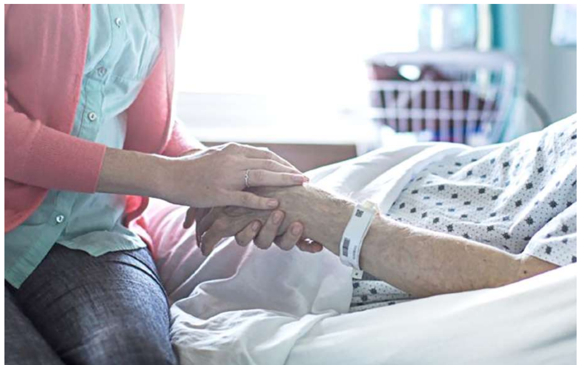
Procuraduría exigió la continuidad de la atención a pacientes crónicos.

En la misma acción preventiva, la Procuraduría pidió especificar las acciones para evitar las prácticas fraudulentas en el manejo de los recursos en las EPS, IPS de carácter público y privado y los gestores farmacéuticos.