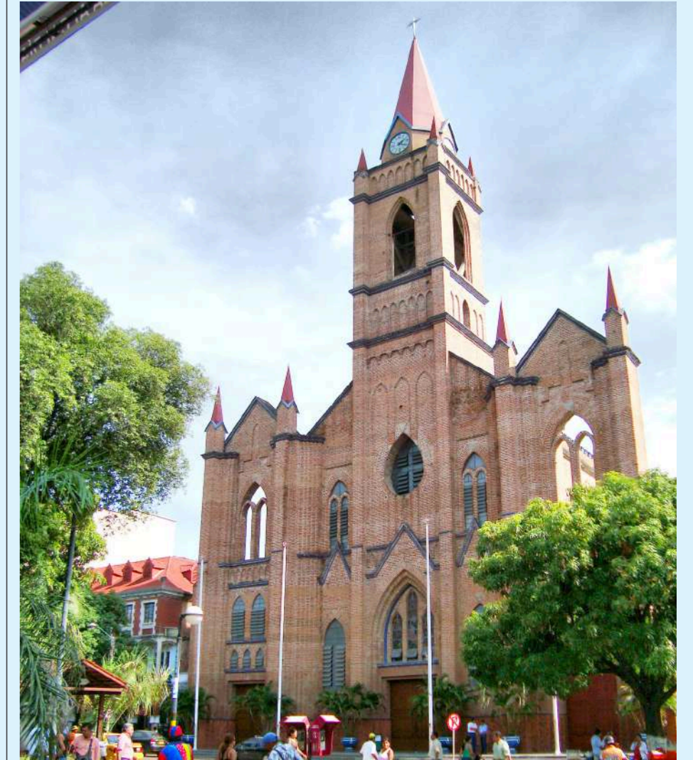
El templo de la Inmaculada servirá para el oficio religioso de mañana 13 de octubre en la celebración de los 50 años de la parroquia.