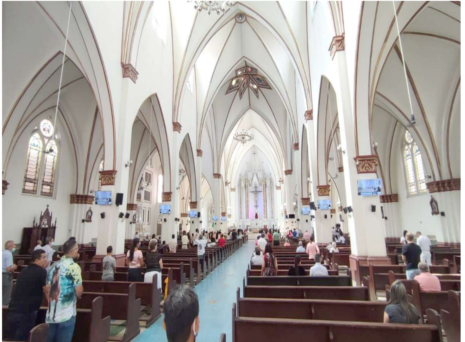
Las 10.000 iglesias que existen en Colombia se verían obligadas a pagar este impuesto del 20% sobre la renta.

A esta discusión de varios gobiernos que solo hasta ahora se logró incluir en un proyecto, todavía le falta camino, pues hay que esperar que la reforma tributaria supere sus últimos debates en las plenarios de Senado y Cámara, y, en caso de ser necesario, la conciliación de los textos avalados en ambas corporaciones.