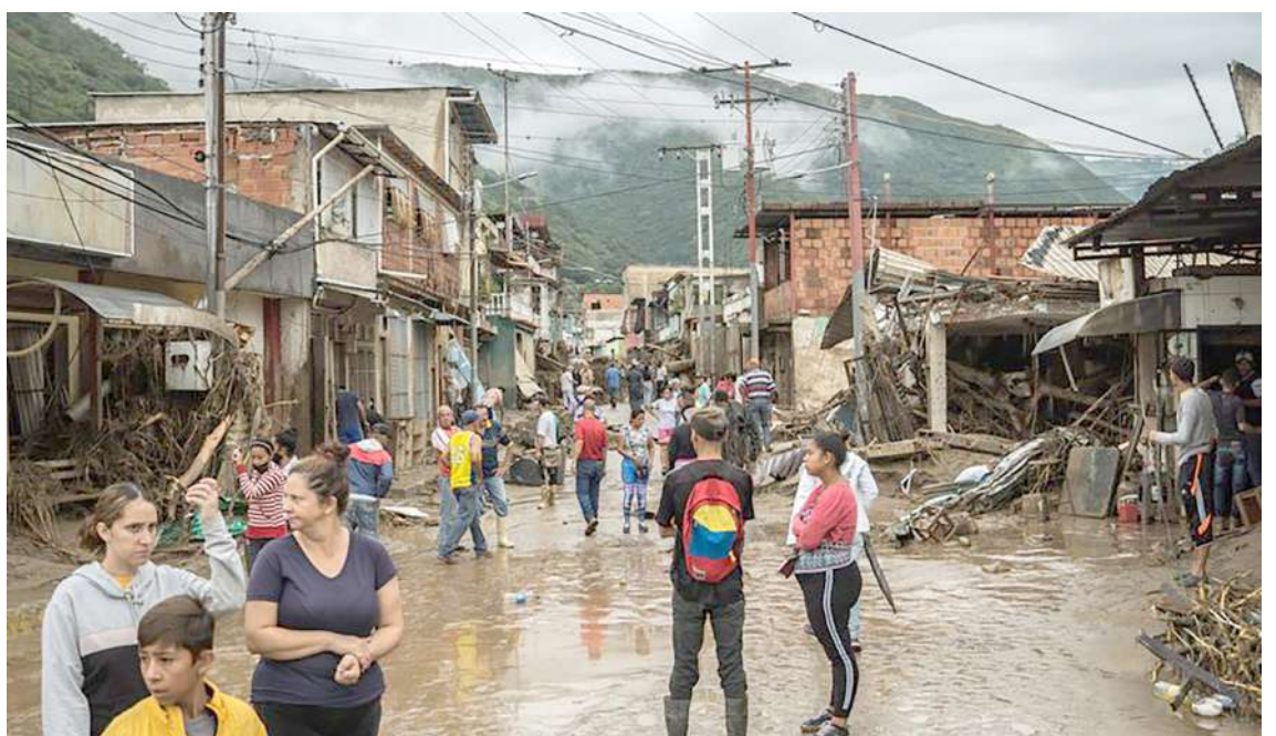
Continúan la búsqueda de sobrevivientes en Venezuela donde al menos 25 personas murieron y 52 continúan desaparecidas a consecuencia de las intensas lluvias en la localidad de Las Tejerías, localizada en el estado Aragua, en la zona central de Venezuela.