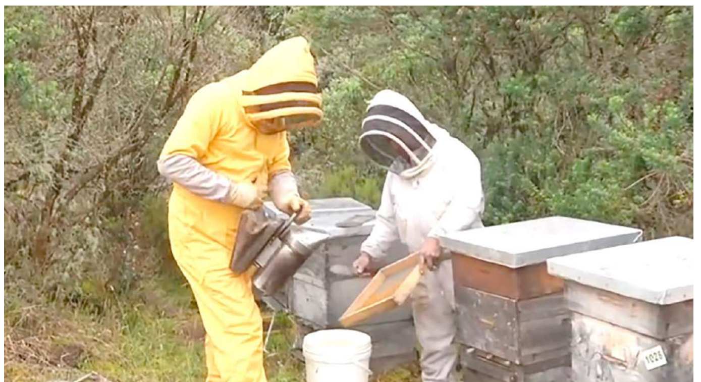
La ley 2193 de 2022 protege a las abejas y a sus agremiaciones.

El sector satisface solo 30% de la demanda nacional anual, entendiéndose que el consumo per cápita del producto es de 87 gramos. Con estas cifras, el sector se proyecta como uno de los de mayor proyección en el agro nacional, pues crece a un ritmo promedio de 5% año a año y los subsectores de la miel y la polinización crecieron 30% y 40% respectivamente.