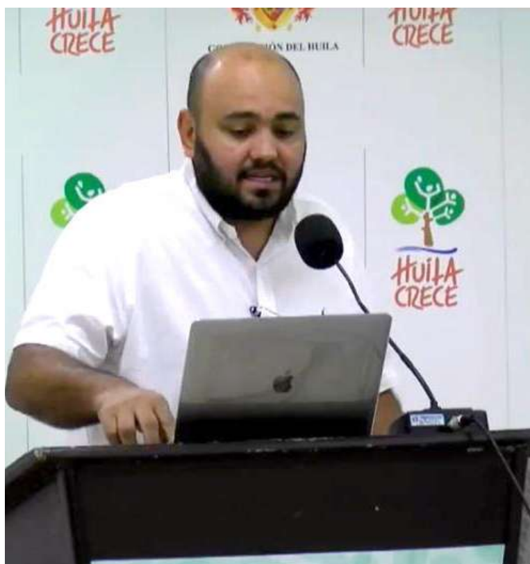
Secretario de Hacienda exponiendo los proyectos ante la Asamblea.

La inversión de estos recursos, junto a un presupuesto del Go-