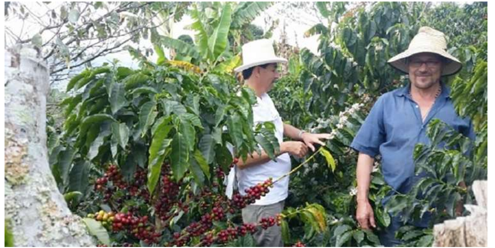
La agricultura del Huila se ha visto seriamente afectada.