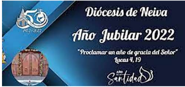
50 años de la diócesis de Neiva ■ Ciudad 10-11