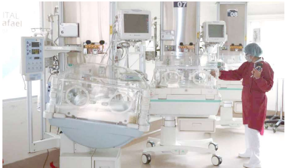
Se pretende fortalecer la atención de Cuidados Intensivos neonatales en el Huila.

Hasta la fecha, el proyecto cuenta con aprobación de la capacidad instalada y viabilidad financiera y la estructuración del programa médico arquitectónico aprobado por el Ministerio de Salud y Protección Social el pasado mes de septiembre.