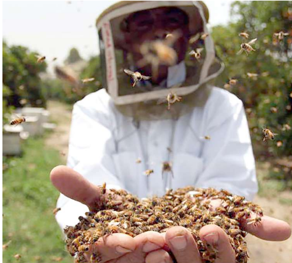
Las abejas son las principales afectadas por los herbicidas.

La norma establece que el ministerio de Ambiente será el encargado de liderar la protección ecosistémica de las especies polinizadoras, mediante el desarrollo de proyectos de pago por servicios ambientales.