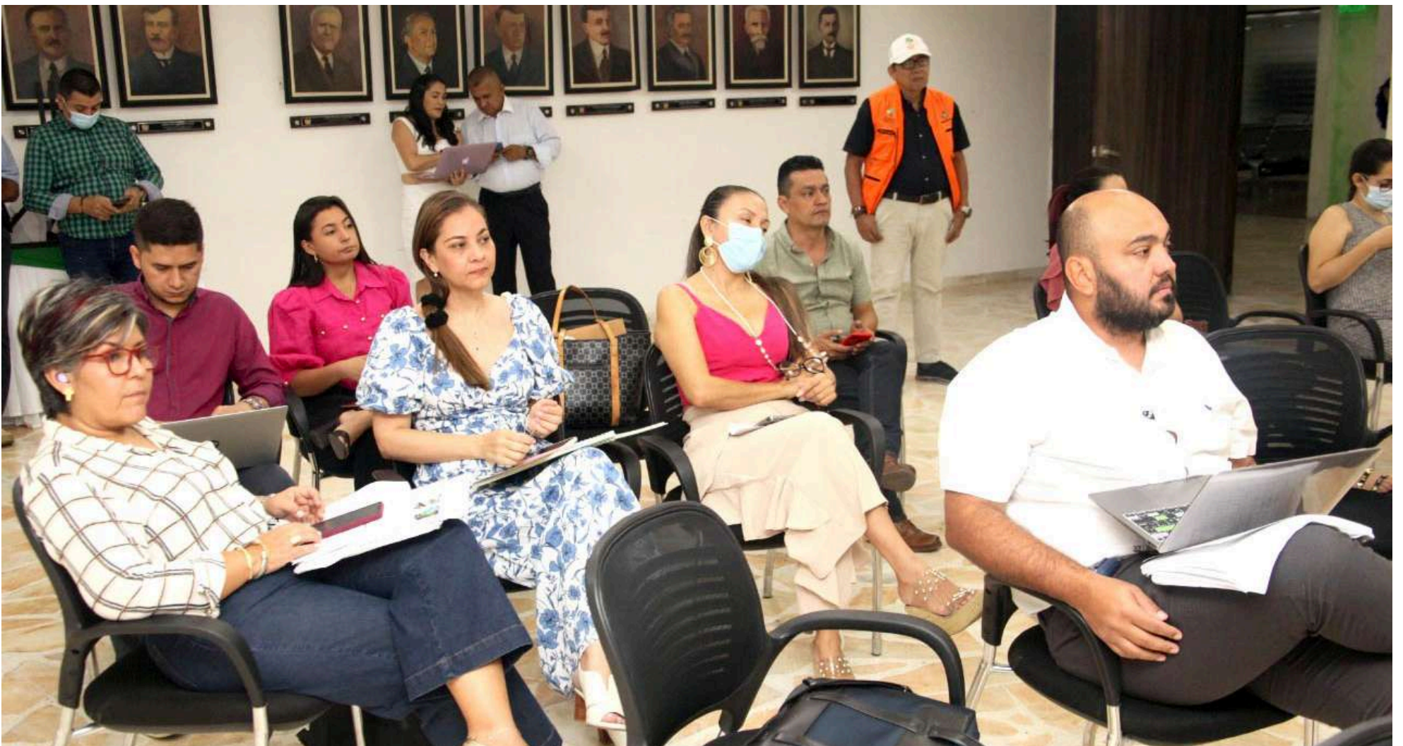
Secretarios expusieron los proyectos.

Cada una de las secretarías están realizando sus procesos contractuales para poder celebrar cada uno de estos contratos resaltar la terminación del Anillo Turístico del Sur, en el cual la Gobernación del Huila está destinando más de $27.000 millones