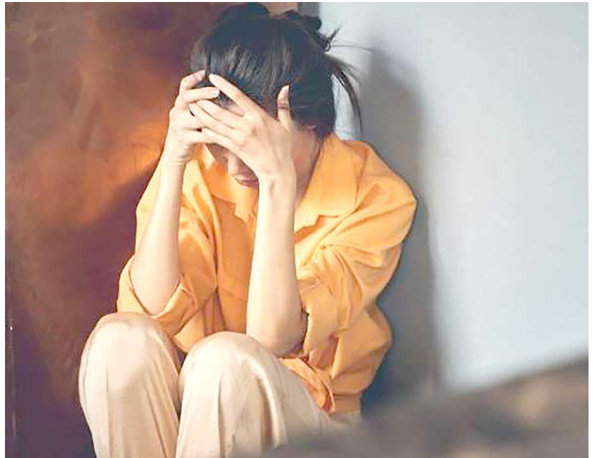
Rivera es el municipio que más casos de intento de suicidio tiene.

Es así como desde el Instituto Nacional de Salud reveló que en lo corrido de este año se han documentado 633 casos de intento de suicidio además de 64 casos consumados, lo cual hace que siga en alerta esta problemática que se presenta a nivel Nacional.