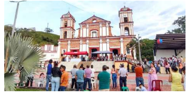
A pagar impuestos ■ Primer plano 2-3