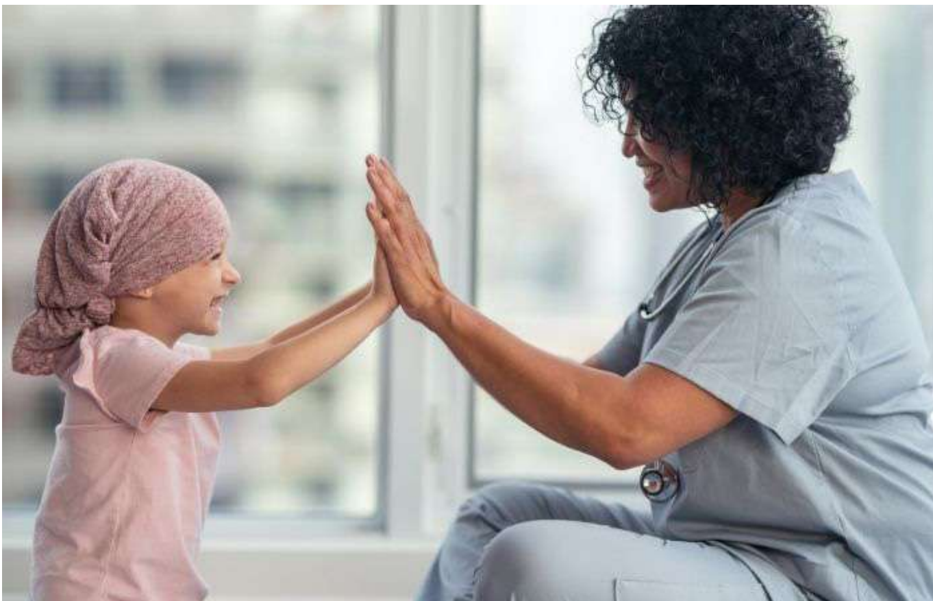
Una atención integral ayuda a que los niños puedan tener una mejor recuperación.

Todo esto ha aumentado la tasa de sobrevivencia de los pacientes del 40 al 61%, también ha impactado este indicador el aumento en las coberturas de aseguramiento, así como la incorporación de nuevas tecnologías y tratamientos, atención de centros especializados de alta calidad, las capacidades y entrenamiento del talento humano en salud y la implementación del Plan Decenal del Control del Cáncer.