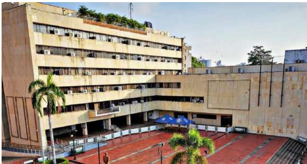
Por más de un billón de pesos fue presentado el pasado lunes 10 de octubre el proyecto de ordenanza de presupuesto para la vigencia 2023

En este sentido, hay comportamientos que se viene registrando de manera positiva, tal es el caso, del ingreso por impuesto vehicular que vienen avanzando muy bien debido a las acciones que se han tomado para ese fin. “Inicialmen-