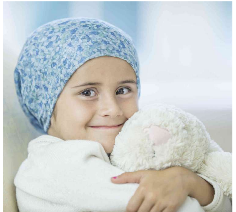
En Colombia 2.200 niños y adolescentes padecen cáncer

Es ahí donde el servicio de salud mental juega un papel muy importante pues, aunque todos los pacientes oncológicos necesitan un tratamiento que incluya sesiones con el psicólogo, para los casos más extremos, se tiene trazada una ruta distinta que permita la atención oportuna e integral para el paciente.