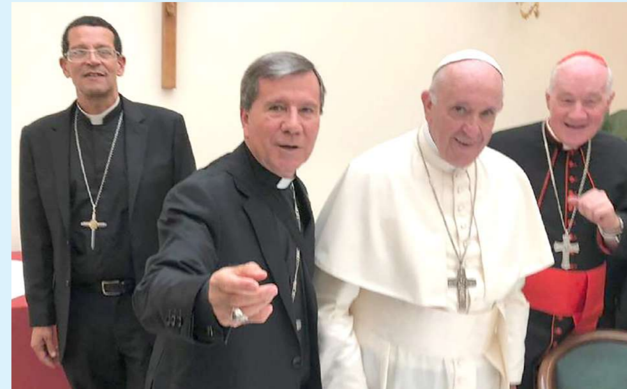
El obispo de Neiva en compañía de su santidad el papa Francisco.

La feliz coincidencia; los 50 años de su vida pastoral “mi familia cristiana hogar constituido todos o con la parte sacramental en un ambiente exigencia colección de amor, papás trabajadores y ahí nace mi idea de ser ministro del señor yo deseaba predicar la palabra de Dios desde niño hacía incluso misas didácticas imitando al párroco, de manera que desde niño estoy al servicio del señor y felizmente lo he hecho y felizmente estoy culminando mi vida y ahora el 9 de diciembre cumpla 50 años de vida al servicio de Dios, tentaciones ha habido, a