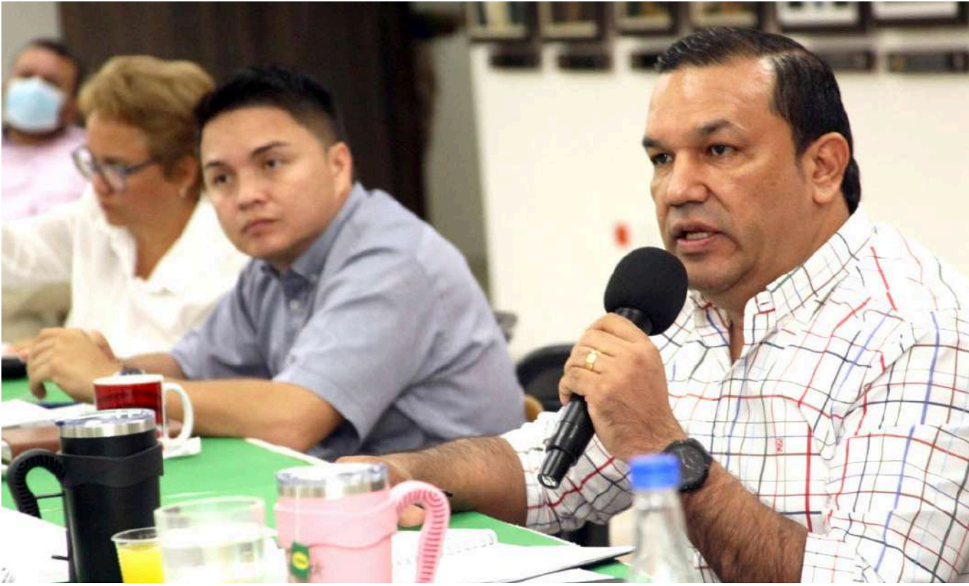
Diputados analizaron los proyectos.

preguntado a la Administración Departamental, sobre unas facultades que dio la Asamblea Departamental para adquirir un crédito por 91 mil millones de pesos. Después de año y medio, todavía siguen colgados, en los proyectos que debe ejecutares con vía crédito. En su momento, nosotros hicimos un análisis, a conciencia, y por la afectación de la pandemia, el plan de desarrollo quedaba desfinanciado". Agregó así que "consideramos que muchos proyectos, tenían que financiarse vía crédito. Y ahora, resulta que después año y medio que dimos las facultades,