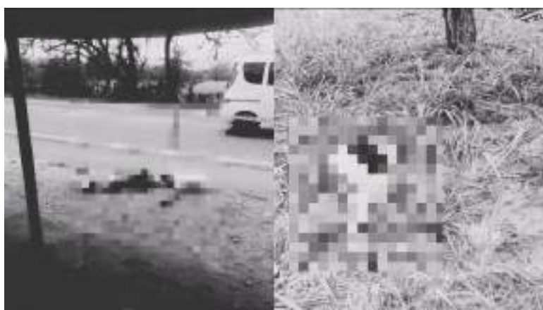
Presunto ajuste de cuentas rodea asesinato en Campoalegre.

tre la Fiscalía y la defensa, los procesados aceptaron su responsabilidad en el delito de acceso carnal violento agravado, por el que fueron condenados.