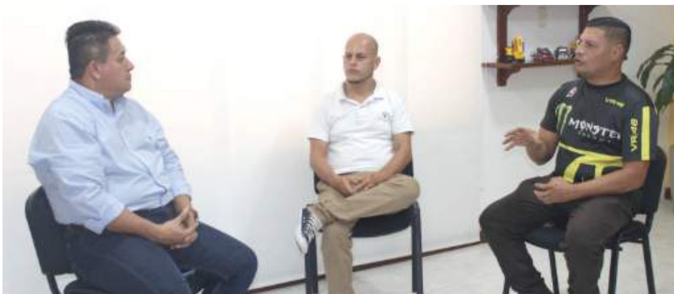
Reunión donde se acordó resolver la venta de SOAT.

“El Gobierno nacional no ha tomado decisión alguna sobre tarifas del Soat y esta no se tomará sin el presidente”, dice el mensaje del presidente Petro