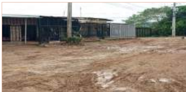
Claman por una solución ■ Comunidad 10-11