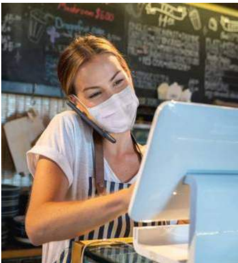
Los más afectados serían los pequeños empresarios.

El análisis se apoya en el concepto de “costo de cumplimiento” —CC—, el cual está asociado con el encarecimiento de la nómina, como consecuencia de los incrementos del salario mínimo. Destaca también que este fenómeno afecta especialmente a las pequeñas empresas, y de ese total de empleos que se estima se ven afectados, se calcula la destrucción promedio de 20.000 puestos de trabajo y una reducción en la creación cercana a 26.000 empleos, o sea, se verían afectados 46.000 empleos en total.