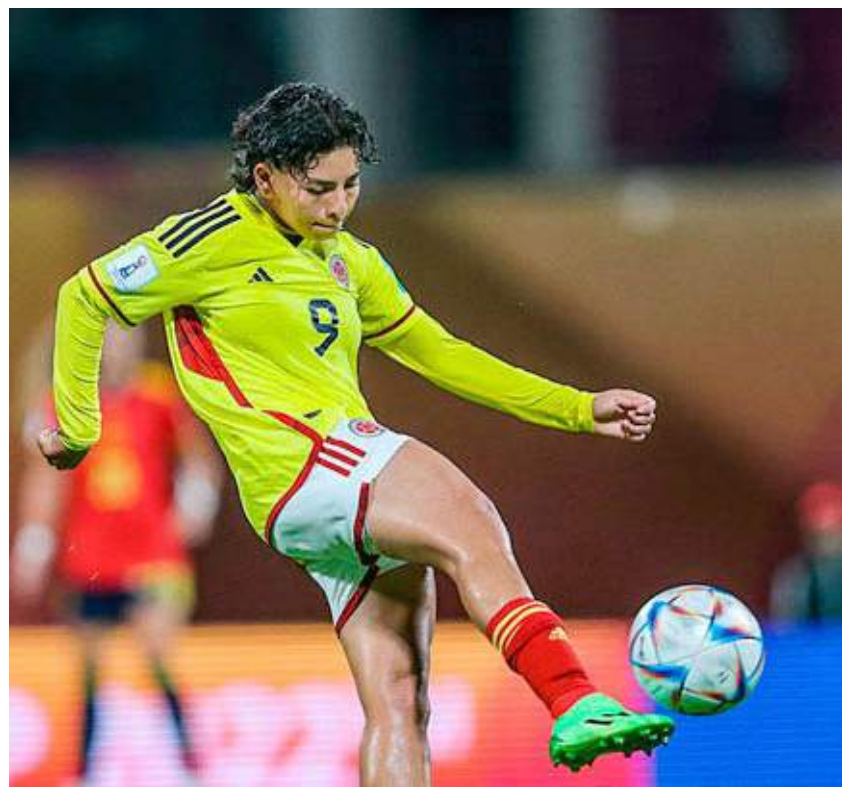
Colombia aguantó el cero hasta el minuto 85 del partido.