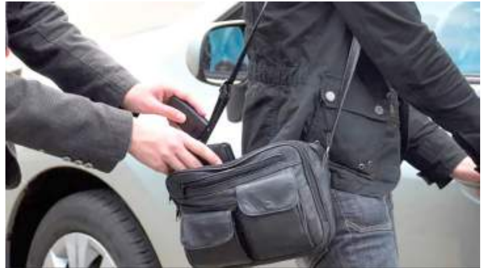
La posición más baja está en tasa de hurtos con 2,68 puntos en el puesto 30.

Lo que indicó la medida es que Neiva se encuentra en el