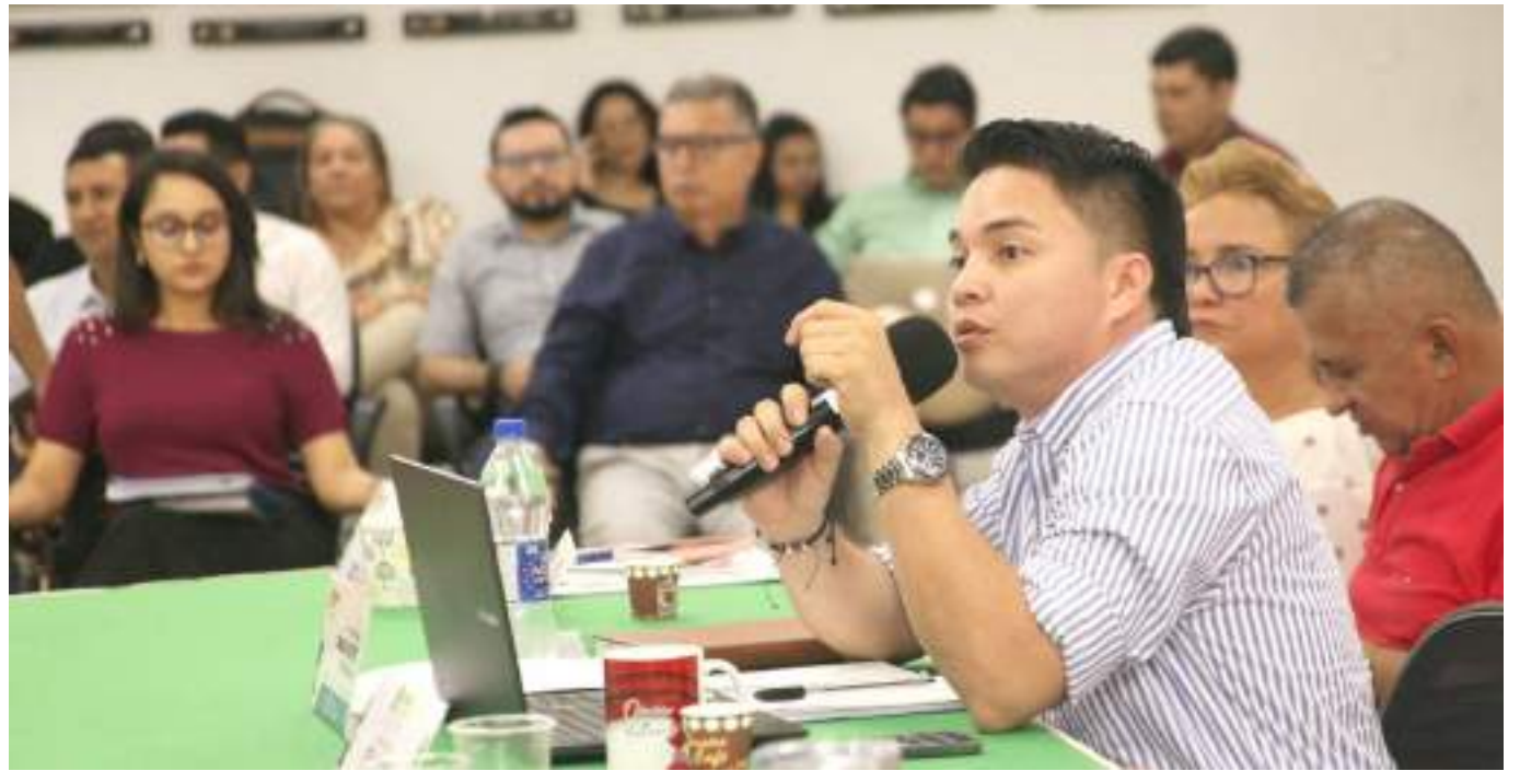
Diputado Omar Alexis Díaz

“También hay unos aspectos por revisar que son cuatro viviendas que presentan problemas de humedad y así no se pueden entregar”