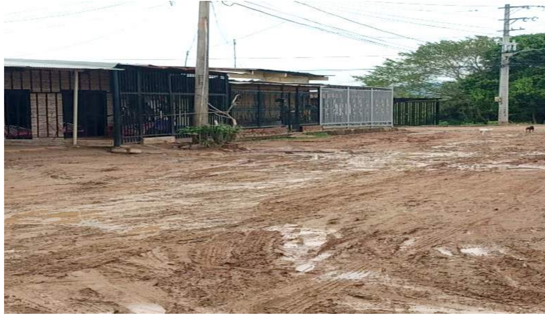
El desnivel hizo que con la lluvia el afirmado se hundiera convirtiéndose la carretera en un lodazal.

“Estamos haciendo referencia a los trabajos de restitución de la red de alcantarillado de la calle 25 entre carreras 52 y 55, son más de 300 familias las afectadas”.