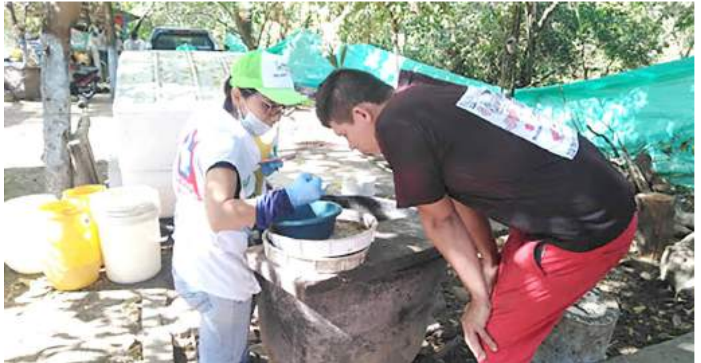
Funcionarios de la secretaria de salud, inspeccionando tanques de agua

La ciudad de Neiva se caracteriza por ser uno de los lugares más cálidos de la región sur de Colombia, lo que posibilita la reproducción de insectos de clima tropical que afecta la salud de la ciudadanía.