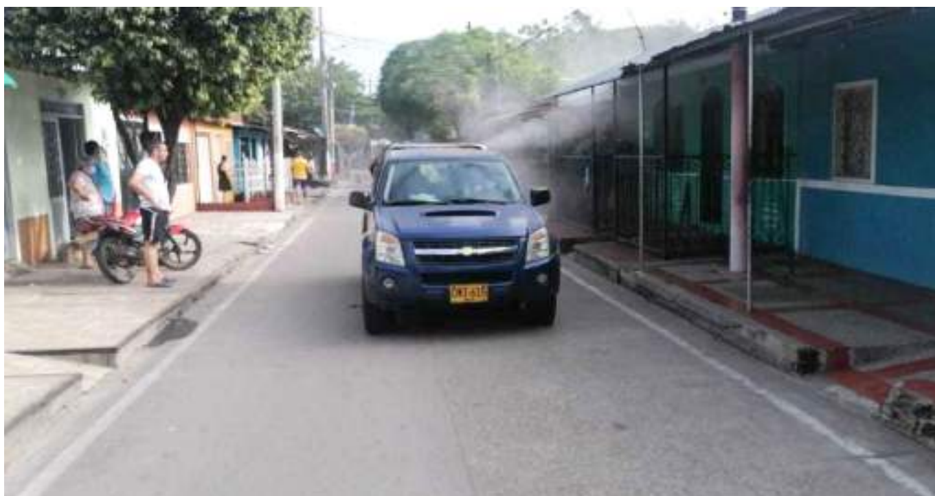
Vehículo fumigando barrios afectados de Neiva

Realizar vigilancia entomológica, intensificar acciones de control vectorial teniendo en cuenta la guía de gestión para la vigilancia entomológica y control de la transmisión del dengue e informar a la comunidad riesgos y medidas de prevención de la enfermedad.