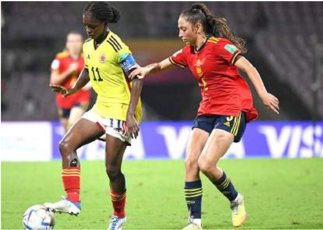
Colombia cayó por 1-0 ante España en su debut en el mundial sub-17 Femenino.