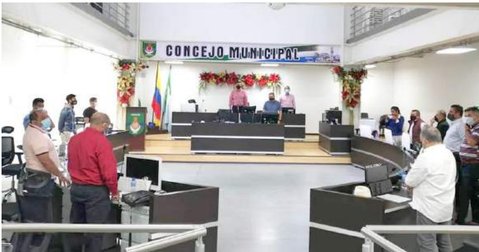
Sesiones Concejo de Pitalito.

Este proyecto fue duramente cuestionado, porque para los veedores de la Administración, era pagar favores políticos, con recursos, en lo que mejor serían invertidos en proyectos sociales para el municipio.