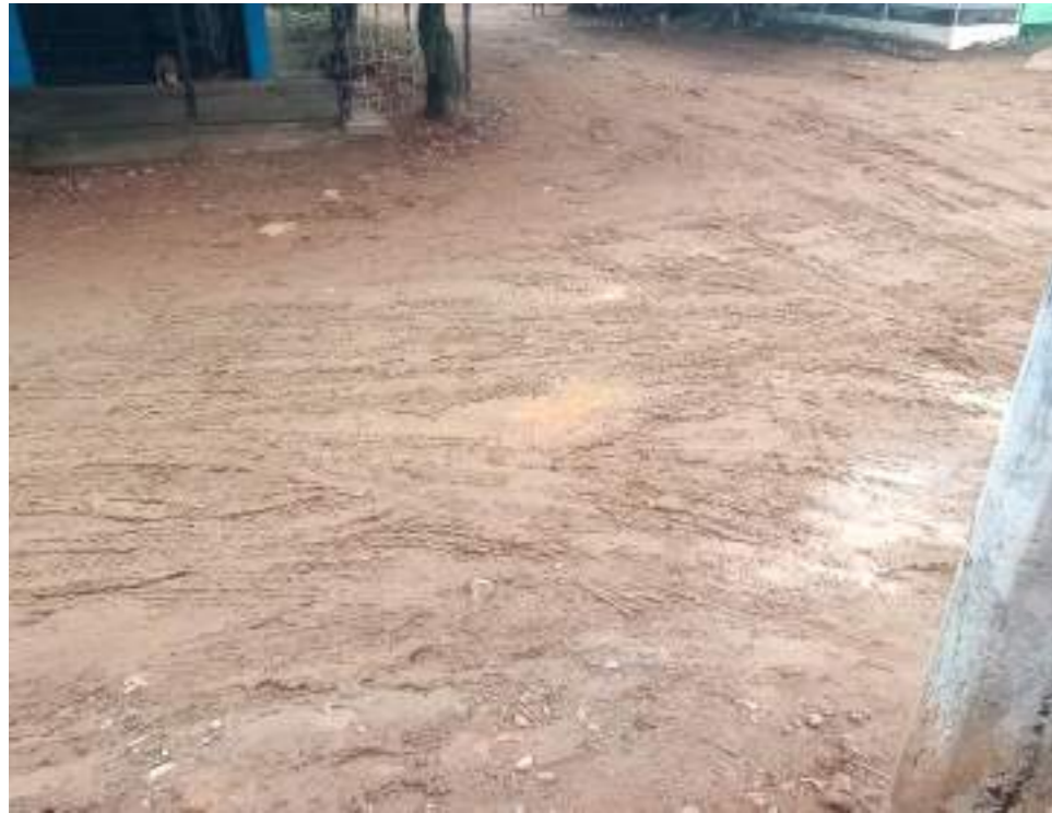
Estado en que se observó la semana pasada la calle 25 entre carreras 52 a 55 en Las Palmas.