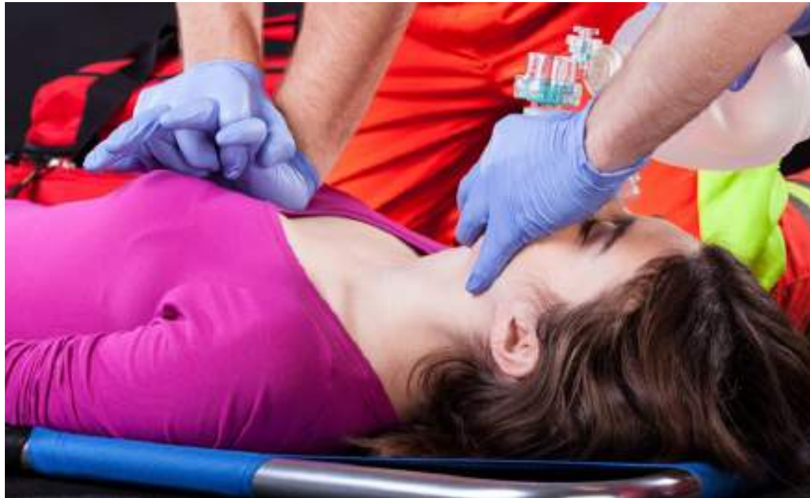
La presencia de la enfermedad en las mujeres se puede dar después de los 65 años.

En Colombia la enfermedad cardiovascular es la primera causa de mortalidad, especialmente