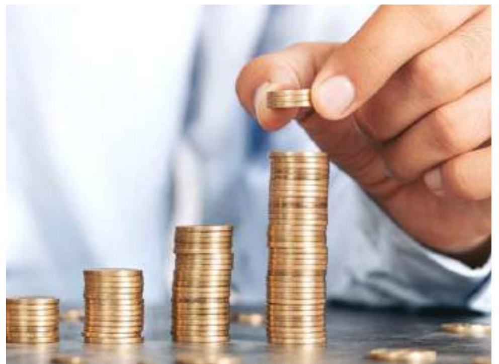
La reforma tributaria y la inflación serán factores a considerar en el aumento del salario