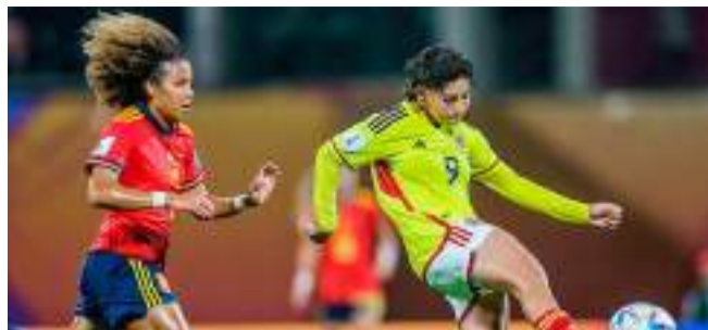
Sub-17 femenina derrotada en el Mundial ■ Deportes 16