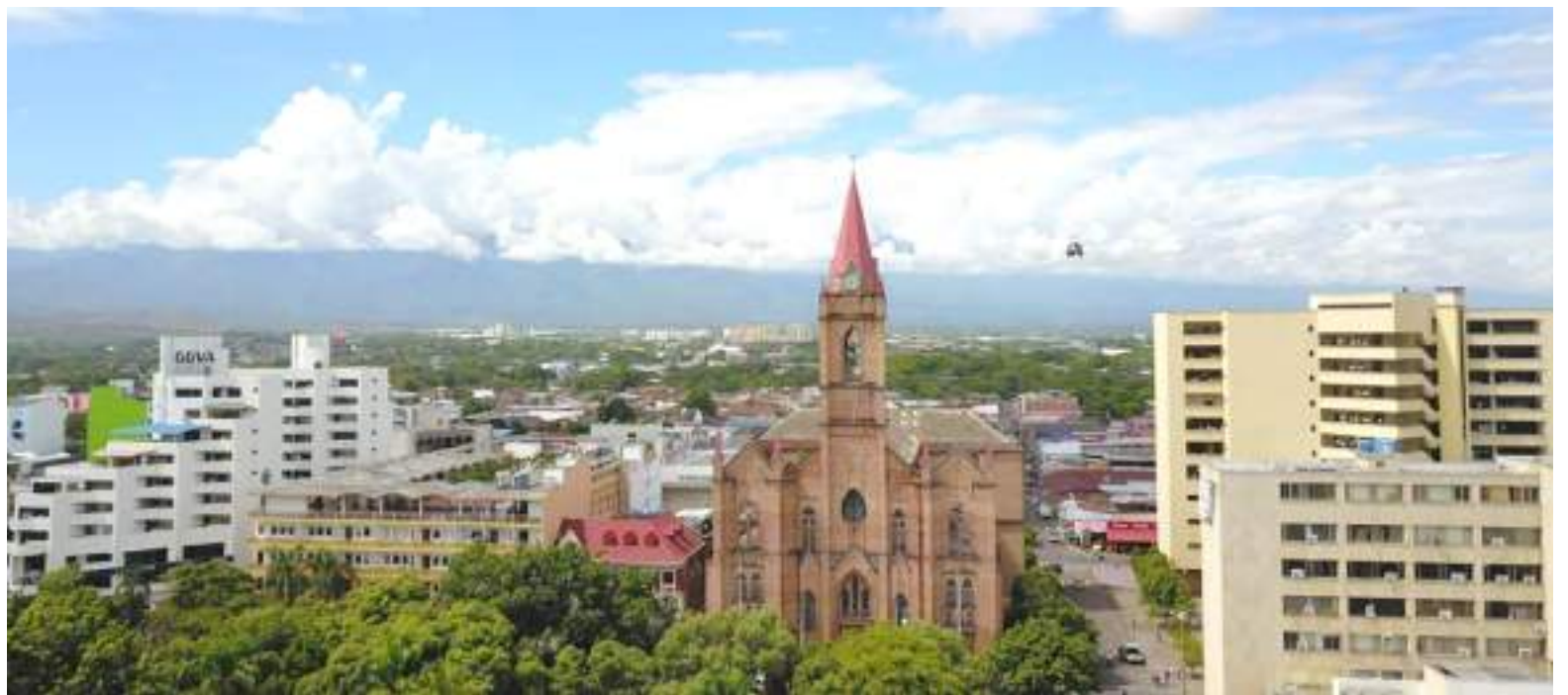
Neiva obtienen la misma posición en términos generales.

Ante este panorama, lo primero que arrojó el informe fue una mejora en las brechas de desempeño entre ciudades en los pilares que guardan una fuerte relación con la reactivación económica. Entre estos, el pilar de mercado laboral, en el que la diferencia en puntaje entre el mejor y el peor de la medición aumentó a 5,1 puntos. Algo