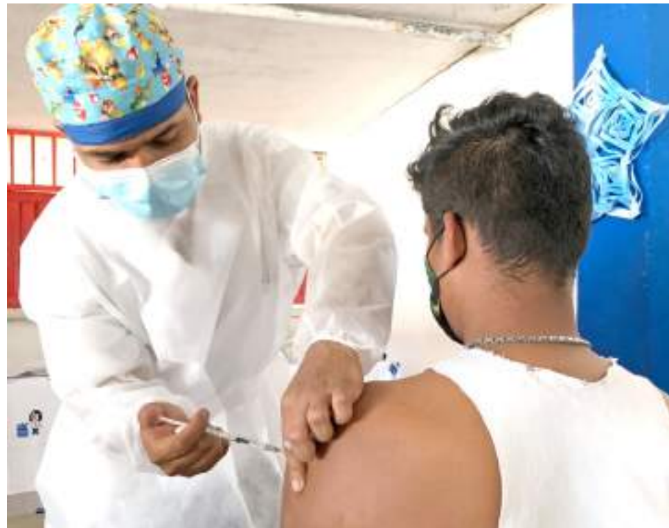
El comportamiento del programa ampliado de inmunización en el departamento del Huila ha venido avanzado.

Frente a esto, la secretaría de Salud Departamental ha observado una disminución de la cobertura de Covid-19, lo que los lleva a insistir en la importancia de mantener la inmunidad que ha permitido controlar la pandemia.