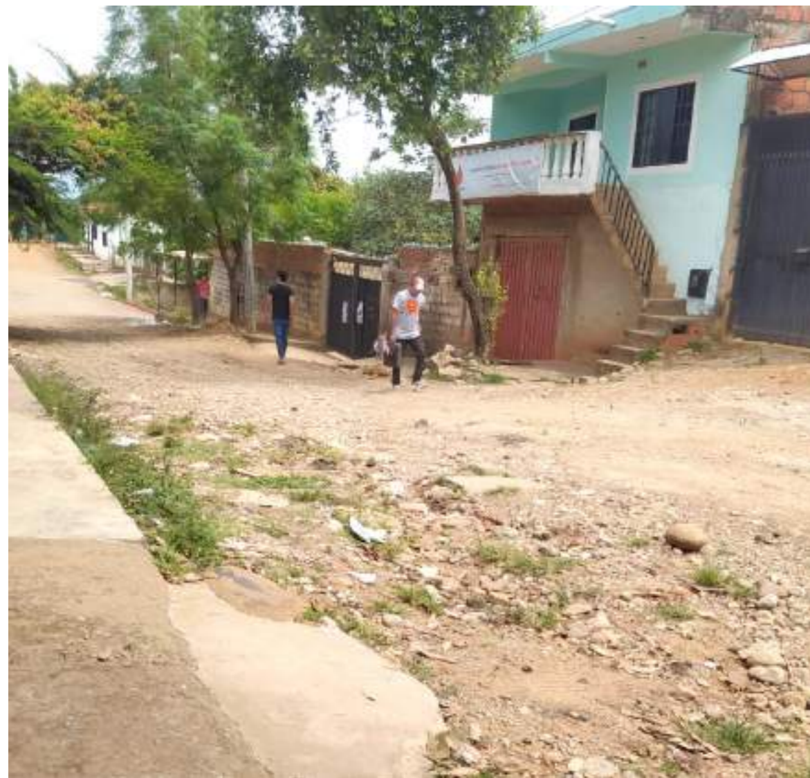
Llevan 20 años esperando el arreglo de las vías