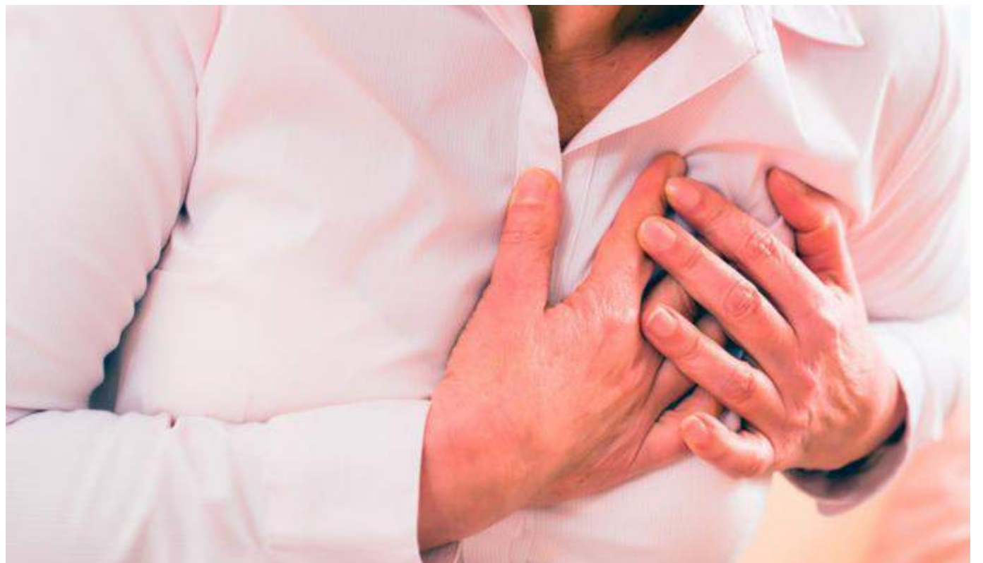
Estudio reveló que el Covid-19 puede estar directamente relacionado con la muerte súbita cardíaca.