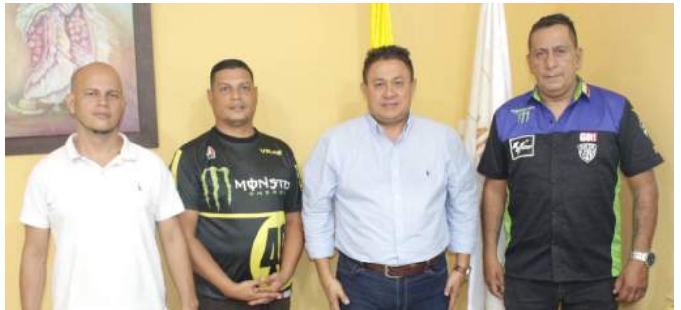
Gremio de los motociclistas en el Huila, reunidos con el delegado del ministerio de transporte.

Piden que el SOAT tenga planes de financiación para que los motociclistas puedan pagarlo, debido a que muchos de ellos ganan el salario mínimo.