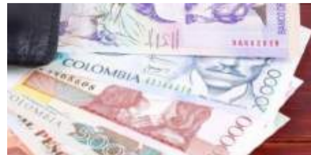
Empieza el debate ■ Actualidad 13