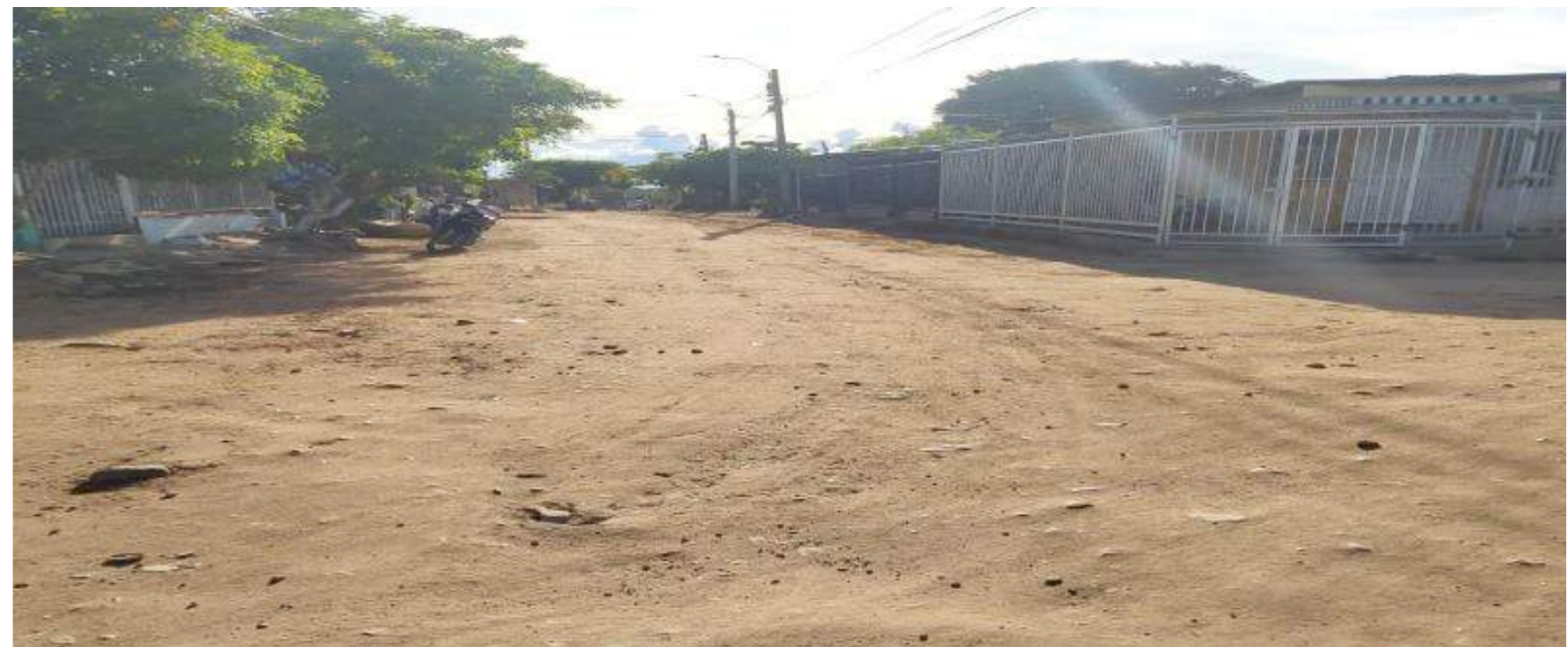
Aunque ha dejado de llover, la vía sigue siendo intransitable.

empalme, porque no había libros, además la anterior junta no administraba ni tenía a cargo algún