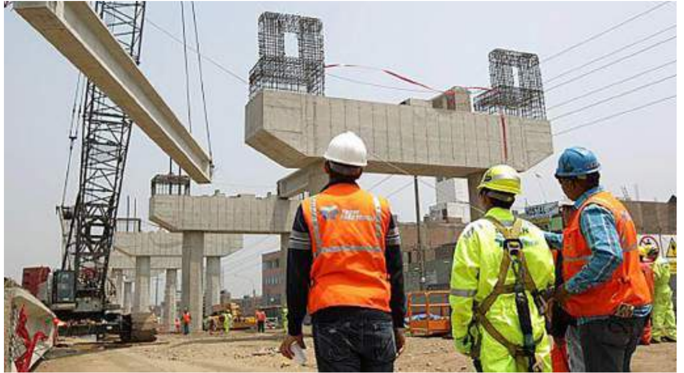
Dentro de los puntos que se resaltan es el pilar de infraestructura.

Los desafíos más grandes los tiene en el pilar de innovación en el que registra su puntaje más bajo (3.2 sobre 10), esto como resultado de su débil desempeño en los indicadores de revistas indexadas en publindex e inversión en ACTI.