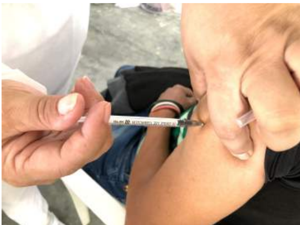
Son conscientes de que constantemente hay que mejorar el porcentaje de personas vacunadas en la región.