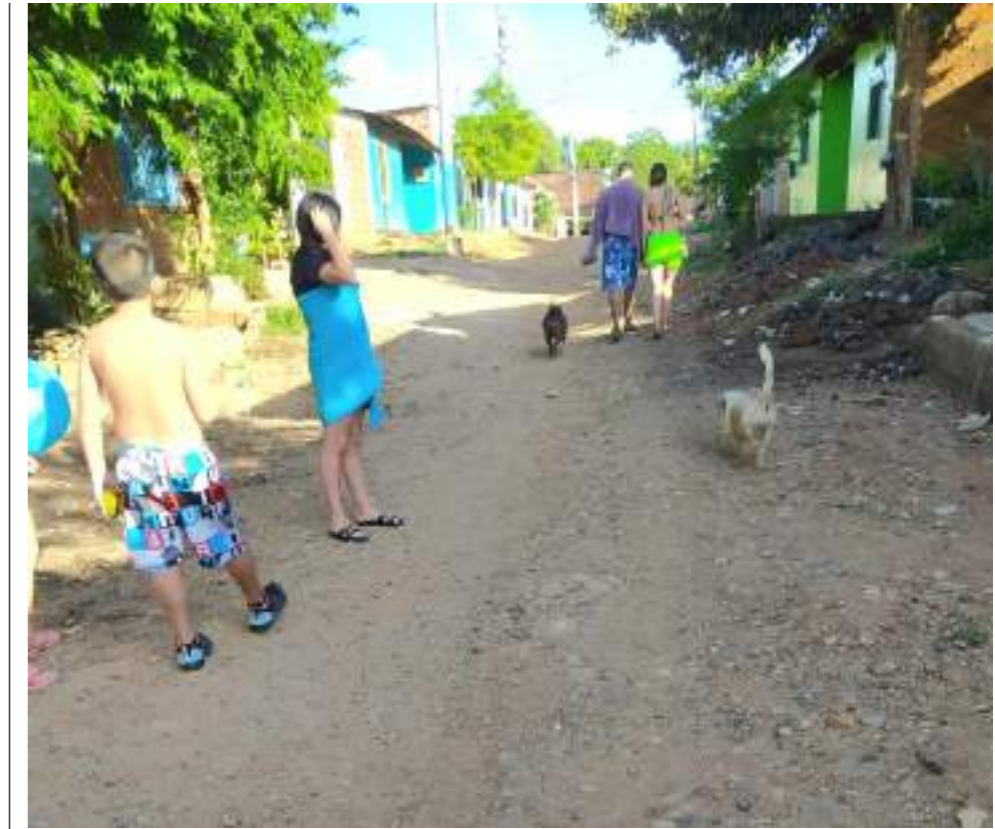
Estado actual de la vía que sigue siendo malo.

“En los diferentes comités de obras que adelantamos entre la gerencia y la subgerencia Operativa y Técnica, se ha pedido expresamente hacer un estricto seguimiento a las diferentes obras que se adelantan en la ciudad”.