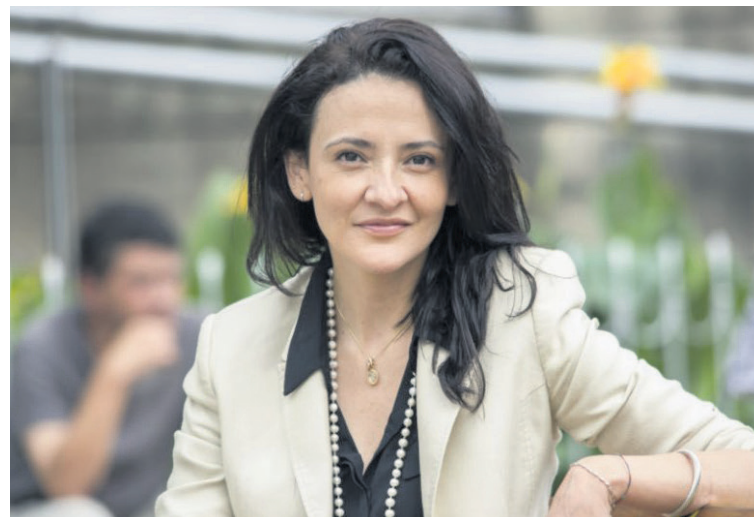
Figura de la semana

Vea columna completa en www.diariodelhuila.com