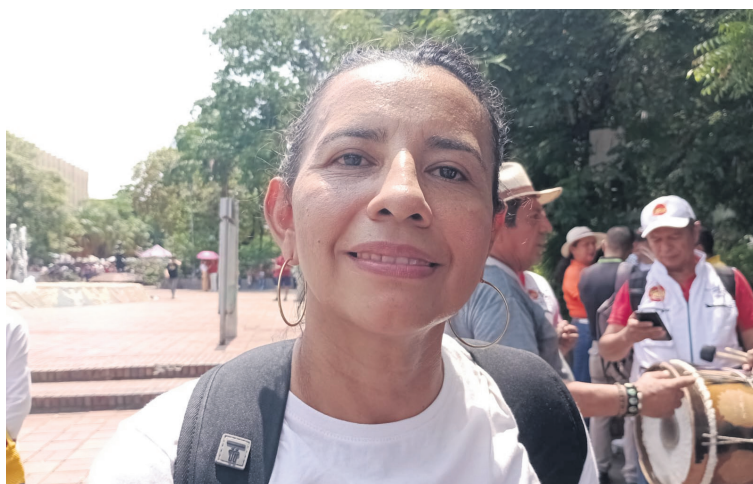
respaldo y apoyo a las organizaciones de los trabajadores, a pesar de haberle presentado solicitudes de diversas maneras, nunca quiso atender con propósito resolutivo, reza el escrito.

“Las reformas sociales que avanzan en el Congreso de la República, buscan mejorar la inequidad, fortalecer los derechos laborales y garantizar una vejez digna para cerca de 3 millones de adultos mayores que hoy viven en pobreza extrema. Con estas iniciativas queremos dejarle a las y los colombianos herramientas para el mejoramiento en la calidad de vida”, explicó el embajador.