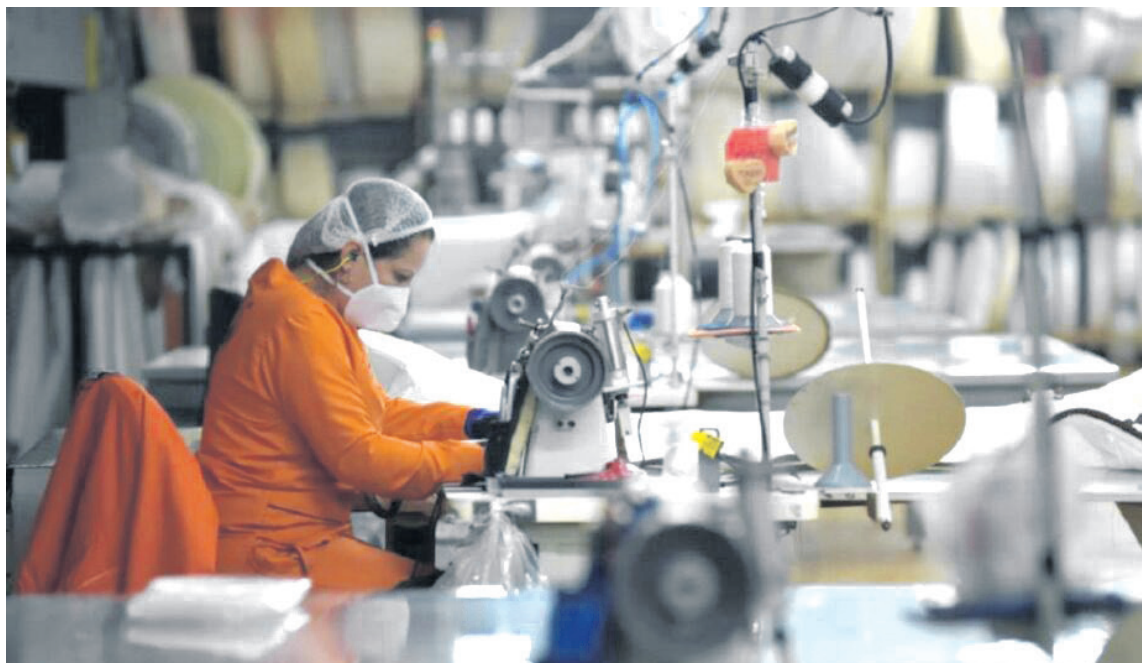
La falta de confianza y estabilidad empresarial en el Huila se refleja en una reducción preocupante en la creación y renovación de empresas, evidenciando los desafíos económicos y de seguridad que enfrenta la región.

Según los datos proporcionados por la Cámara de Comercio del Huila, la renovación de empresas en el departamento registró una disminución del 8,37% en comparación con el mismo período del año anterior. Este descenso se reflejó principalmente en las zonas de Occidente y Norte, donde se observaron reducciones del 15,21% y 8,58%, respectivamente.