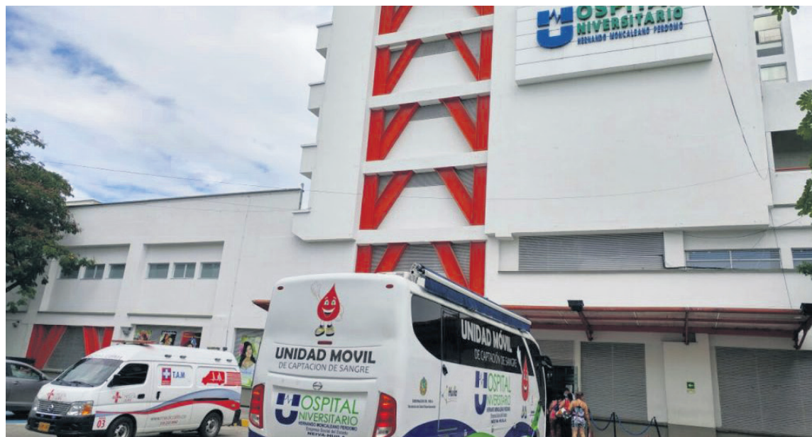
Este modelo de contratación se vive en el Hospital Universitario Hernando Moncaleano.

La problemática laboral de los trabajadores de la salud en el Huila, es paupérrima, entre el 70 u 80%, son contratados mediante cooperativas, igual situación viven los funcionarios vinculados con la Ese Carmen Emilia y a pesar, que después de la Pandemia del Covid-19, uno políticos que estaban en campaña, prometieron normalización laboral, esto a la fecha no ha ocurrido.