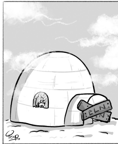
LA PAZ, CONGELADA (DE NUEVO)

www.diariodelhuila.com e-mail: correoelector@diariodelhuila.com