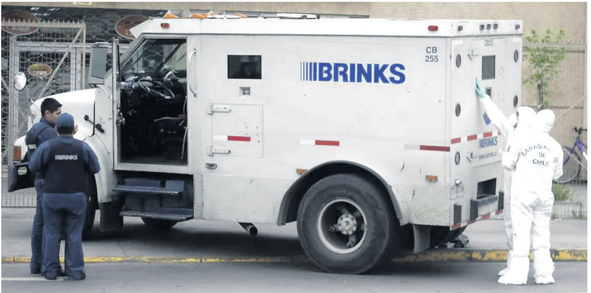
La empresa de seguridad Brinks S.A. fue excluida de responsabilidad en el hurto del carro de valores.