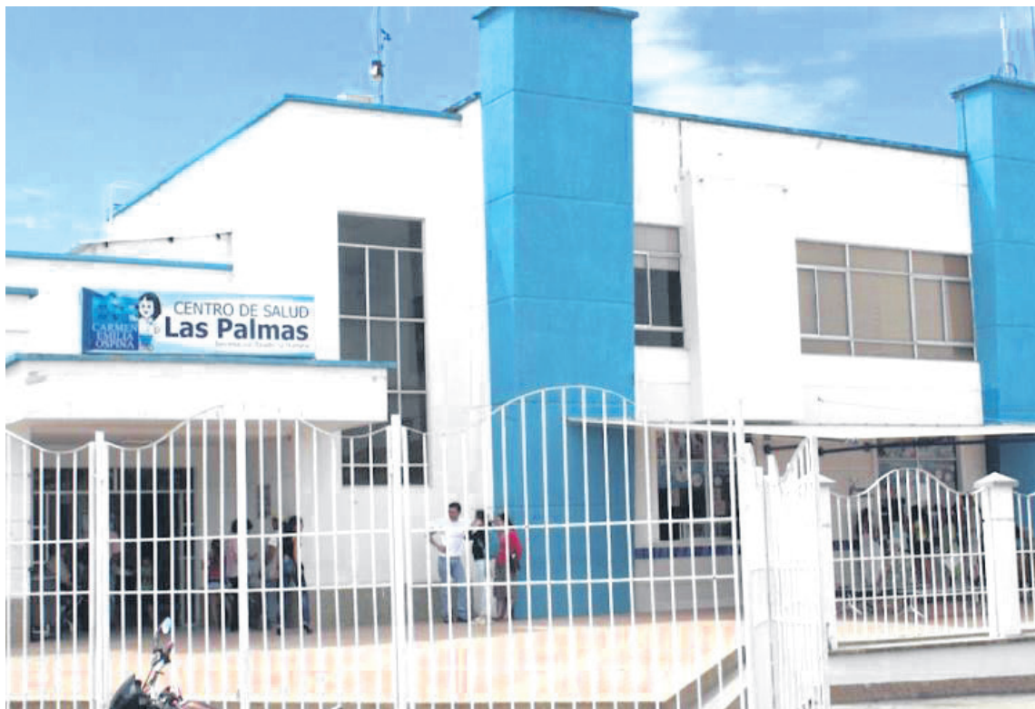
La ESE Carmen Emilia, habría perdido demandas laborales.