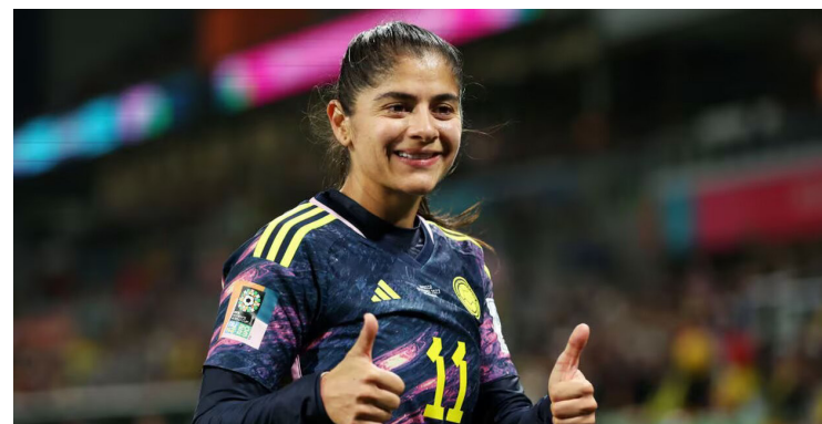
Figura de la semana

Vea columna completa en www.diariodelhuila.com