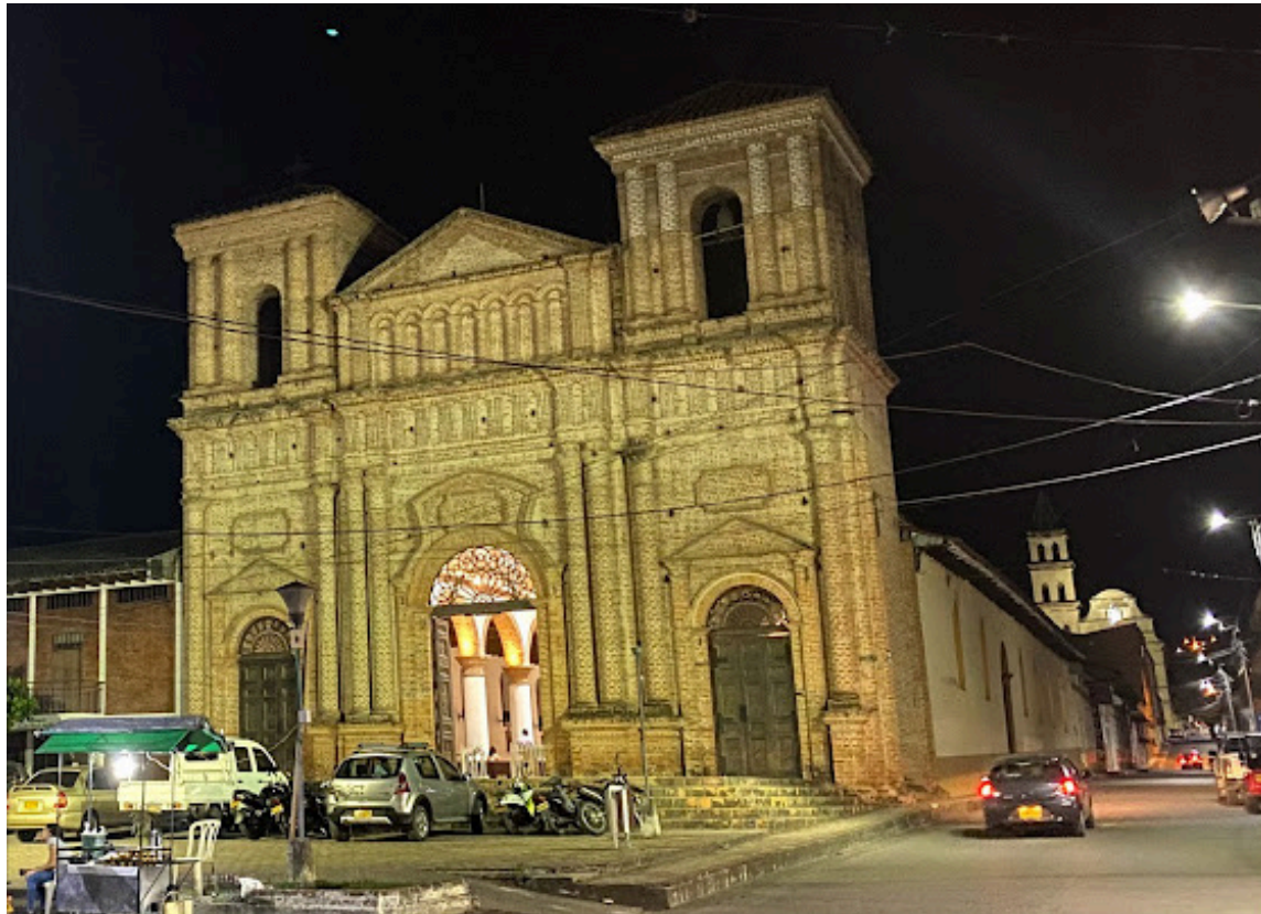
La idea es embellecer las más de 12 iglesias que tiene.

boriosidad de sus pobladores y el encanto de sus tradiciones.