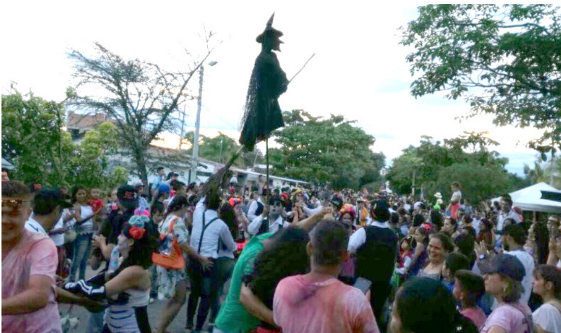
En La Jagua se celebra el Festival de Brujas.

La Jagua, es uno de los pueblos más antiguos y encantadores del Huila; con más de 480 años de historia, originalmente era una comunidad indígena situada al borde de la desembocadura del río Suaza en el Magdalena. Es cuna de artesanos y por sus calles se puede encontrar, además de tejedoras de fique, talladores de madera, pintores, escultores, diseñadoras de bisutería. Todo un territorio de arte que refleja la la-