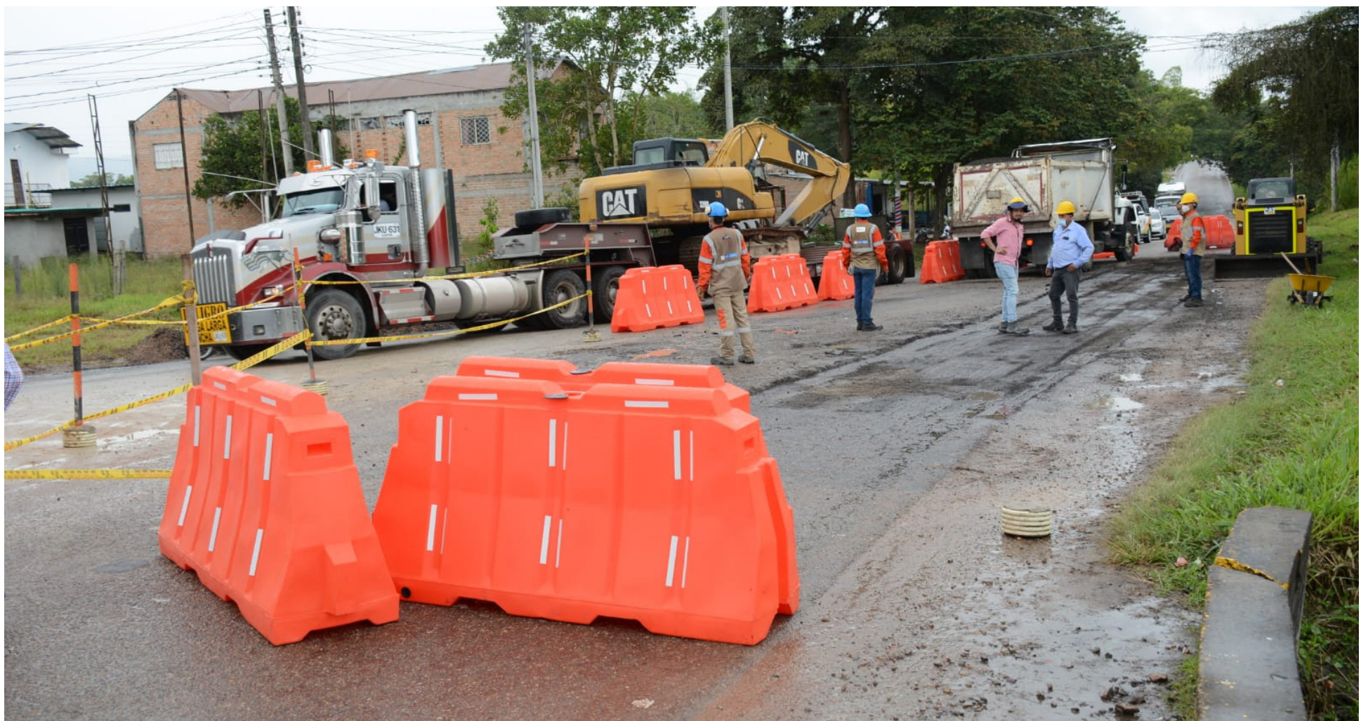
La Concesionaria Ruta al Sur S.A.S., responsable de la construcción y operación del proyecto vial Santana-Mocoa-Neiva.

“El pasquín inicialmente habla de disidencias, pero vuelvo a decirlo, hay que generar una investigación muy juiciosa para poder confirmar o poder desvirtuarlo”, enfatizó el oficial.