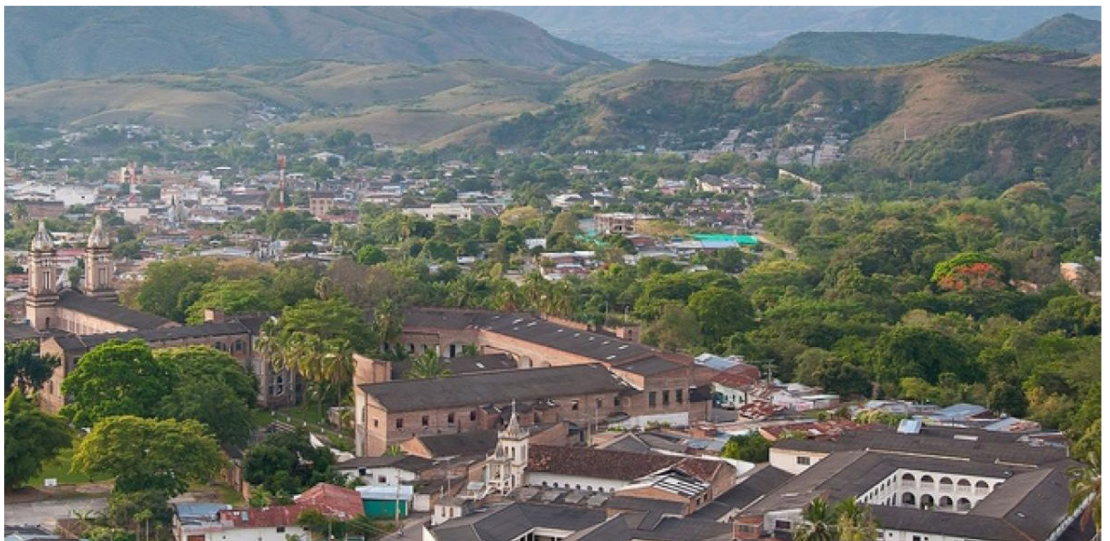
Garzón busca ser el municipio 'blanco' del Huila.

Buscará que las más de 12 iglesias que tiene esta localidad, sean embellecidas y que haya una conectividad entre todas estas instituciones religiosas. Esta apuesta, espera estar lista para la Semana Santa.