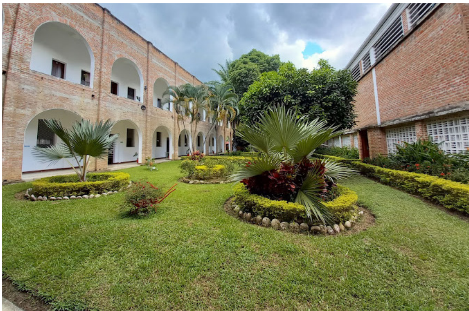
Seminario Conciliar, otro atractivo para los creyentes.

"Obras de importancia como la planta de fertilizantes, la torrefactora, el centro de acopio, de la extensión agropecuaria, son cuatro plantas que esperamos dejar financiadas, una en el sur en ejecución, la del centro con Coocentral que ya tiene acta de inicio, ya arranca el proyecto, en el norte está en ejecución una con Corpoagromil, y estamos terminando de ajustar detalles con Fosfatos del Huila para hacer otra planta con ellos ya que es una empresa huilense con un buen nivel de avance", mencionó el gobernador.