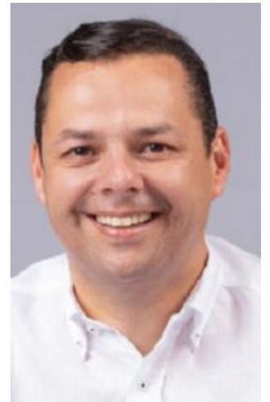
Francisco Calderón, alcalde.

el funcionario, visitó el corregimiento de Zuluaga, para cerrar con broche de oro el Programa de Fortalecimiento de la Competitividad Turística de la Ruta Mágica del Café, un sueño hecho realidad que también contó con el apoyo de la Cooperación Internacional.