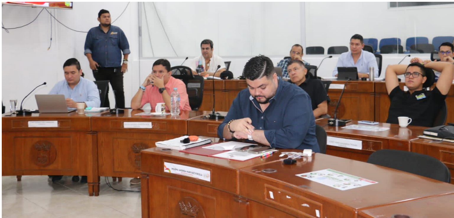
Concejo de Neiva, es encargado de elegir al contralor municipal.