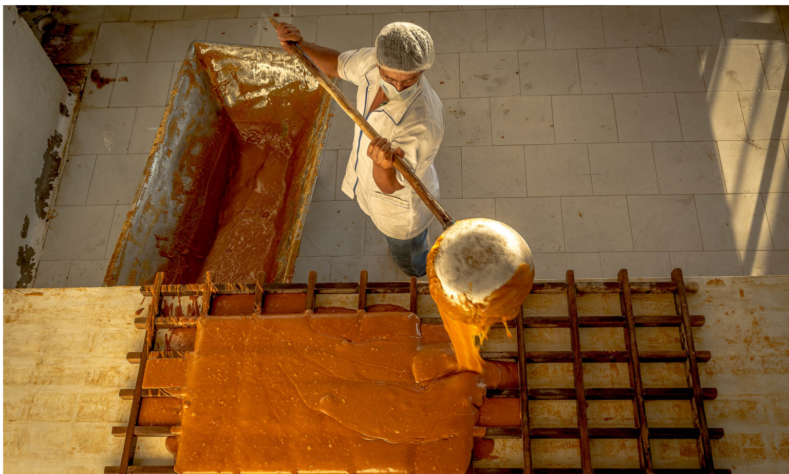
Los paneleros del sur del Huila expresaron su alivio al conocer la decisión de la Superintendencia de Industria y Comercio (SIC) de rechazar la patente de la panela, considerándola una victoria para la tradición artesanal y la producción local.