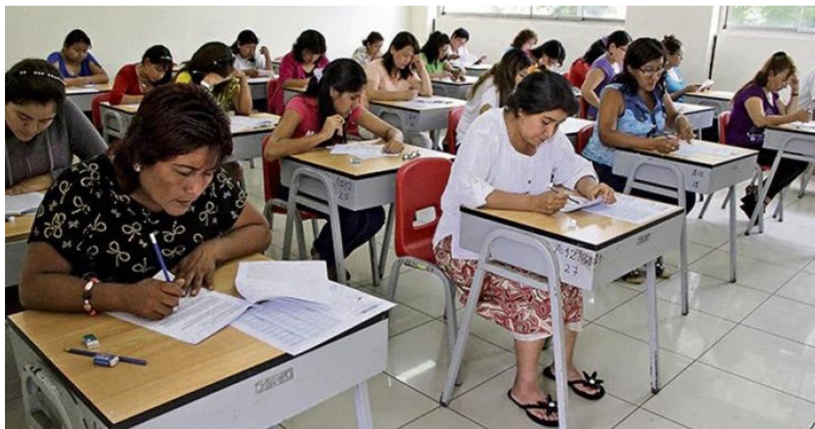
En octubre de 2022 más de 378 mil personas de todo el país se presentaron al concurso docente que ofertaba 37 mil plazas.

Lo que ha sido una dificultad para avanzar en el proceso es la inoportuna en los exámenes médicos. Por ejemplo, los profesores de matemáticas les entregaron plazas el 16 de noviembre, y según el cronograma, cinco días después debieron tener el acto administrativo de nombramiento, que tras 10 días se debía aceptar, y luego de este proceso realizar de manera inmediata los exámenes médicos, con el propósito de que se posesionaran en diciembre. Sin embargo, esto no ocurrió. Solo hasta el jueves de esta semana algunos docen-