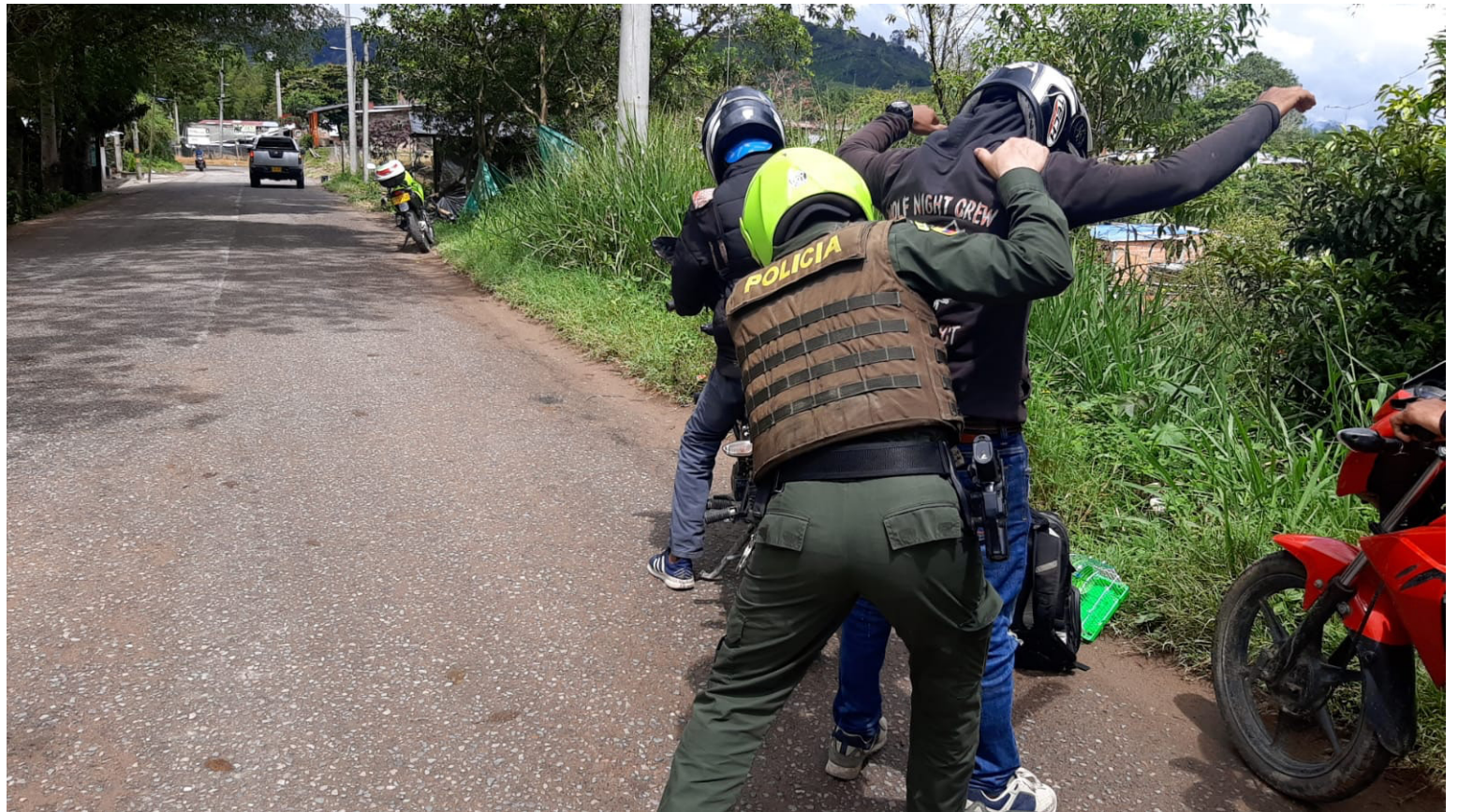
Las autoridades en el Huila, adelantan las investigaciones pertinentes para esclarecer este hecho que ha alterado la tranquilidad de los huilenses.

Frente a esta situación, es crucial que las autoridades refuercen las medidas de seguridad en la región y trabajen en conjunto con la comunidad para prevenir futuros actos violentos. El llama-