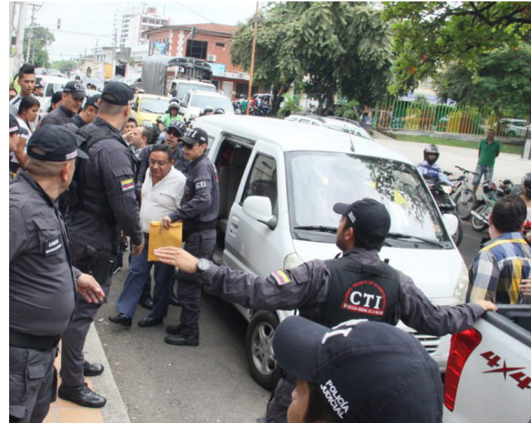
En 2018, nueve concejales fueron detenidos por presuntos hechos de corrupción.

En el Huila, la Contraloría General de la Nación, identificó 17 proyectos críticos y 36 ‘elefantes blancos’ u obras Inconclusas, por un total de $5,3 billones. Se declaró de impacto nacional la ejecución del contrato para mejorar el auditorio de la Facultad de Economía de la Universidad Surcolombiana de Neiva y el objetivo, es determinar si hubo detrimento en los recursos por $5 mil millones.