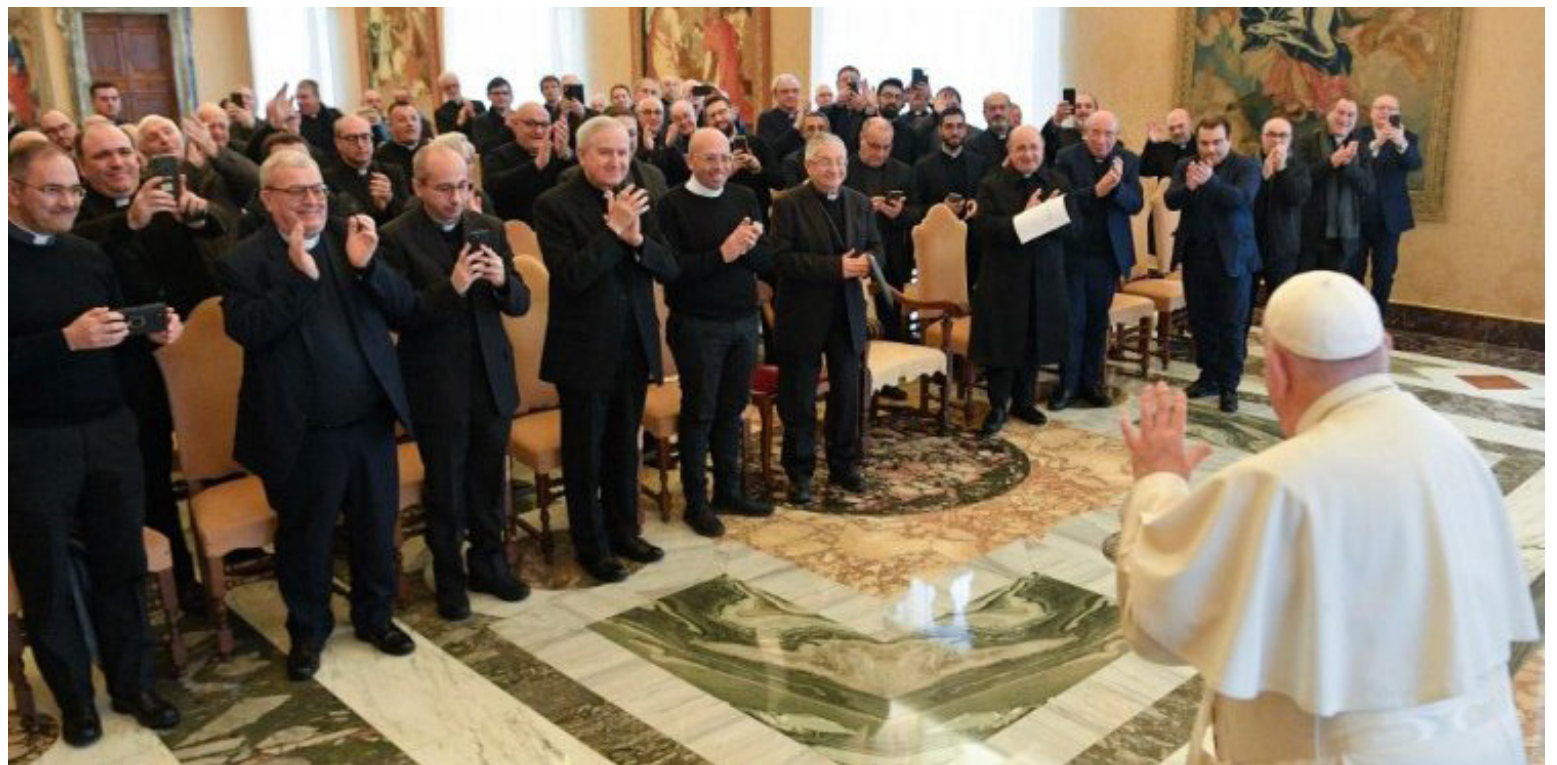
Audiencia del Papa a los Miembros del Instituto Secular Sacerdotes Misioneros de la Realeza de Cristo.

El carisma franciscano, encarnado en el trabajo de los miembros del Instituto, es el de la minoridad: "Así los forma para el servicio humilde, disponible, fraterno -observó el Papa-, y lo hace según el modelo de la realeza de