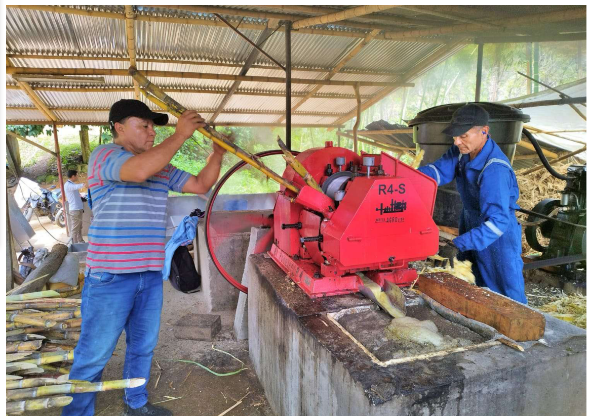
En el Huila, más de 6000 familias dependen de la producción de panela, lo que equivale a 1350 centros productivos, generando alrededor de dos millones de jornales anuales.

Fedepanela, aplaudió la decisión de la SIC, resaltando la gestión gremial que permitió que el fallo saliera a favor de las familias paneleras de Colombia.