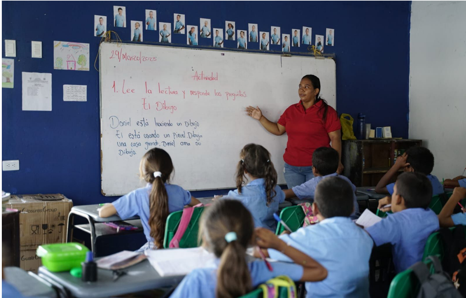
Los profesores de primaria rural, estarían protocolizando su posesión en febrero próximo, si el proceso sigue así de lento.