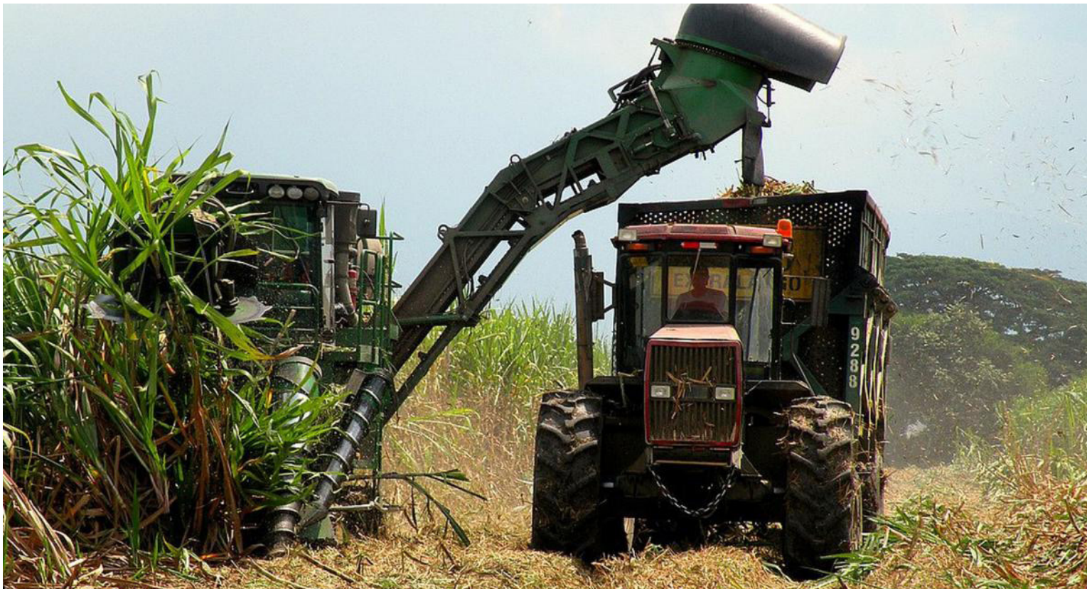
La SIC analizó los requisitos como que fuera novedoso, respecto a que no exista todavía el producto, así como el nivel inventivo y que tuviera aplicación industrial. Tras esto, refutó la solicitud.

principal socio comercial; sin embargo, en el periodo 2017-2018, España incrementó sus importaciones, aproximándose a los niveles de Estados Unidos, evidenciando también la preferencia de otros países europeos por el distintivo sabor y aroma de nuestra panela.