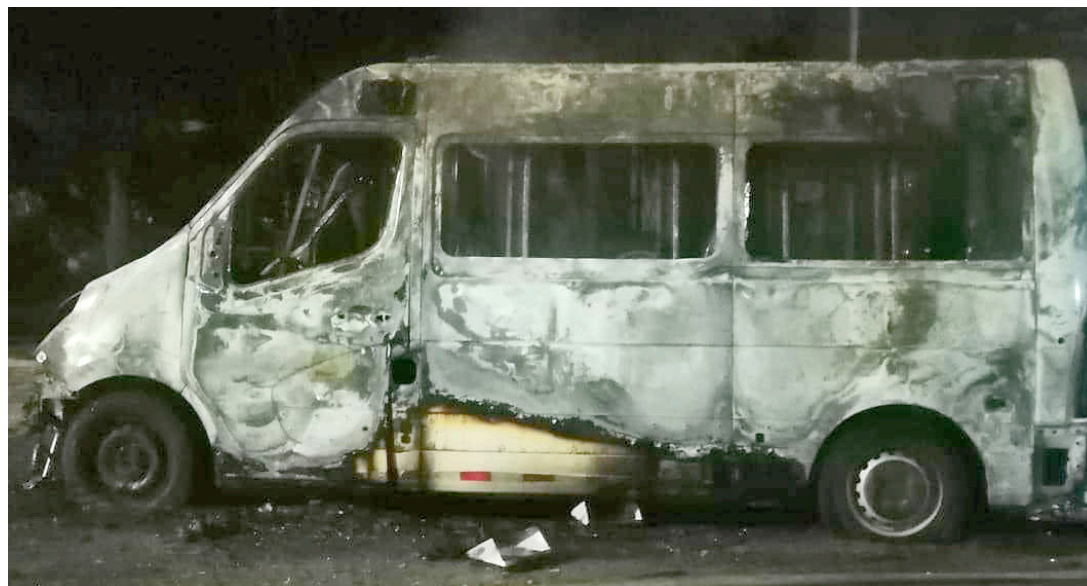
En un hecho criminal, hombres en una motocicleta le prendieron fuego a una ambulancia de la concesionaria Ruta al Sur en Hobo.