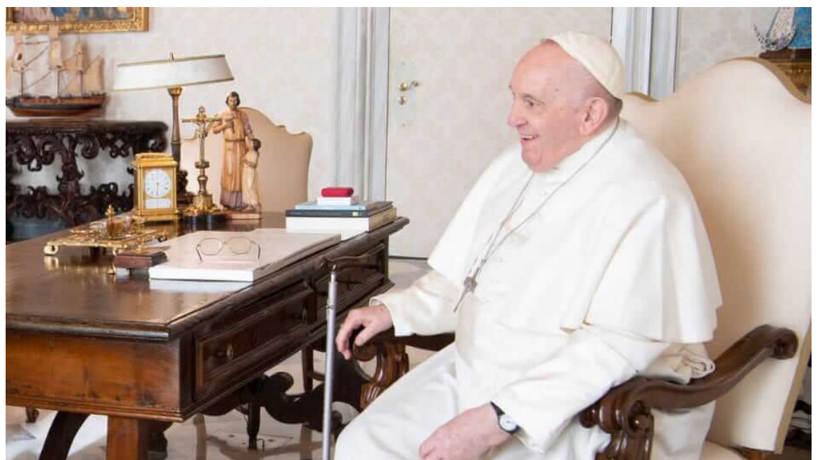
El Papa Francisco.

Francisco se alegró también de la presencia, en la audiencia de hoy, de un cohermano del Instituto procedente de ese continente, en línea con la tendencia de esta realidad misionera que en los úl-