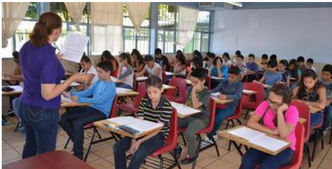
Este concurso se inició en 2022. A finales del año pasado se dieron las audiencias de adjudicación de plazas.

“Si no se vincularon a los docentes desde el primero de enero de 2024, pues probablemente el 30 de junio de este año no alcancen los seis meses que exige esta segunda hipótesis que está regulada en el inciso segundo del Artículo 3. En principio, haciendo una revisión preliminar no tendrían causado el derecho a recibir prima de servicios para el año 2024, les tocaría esperar