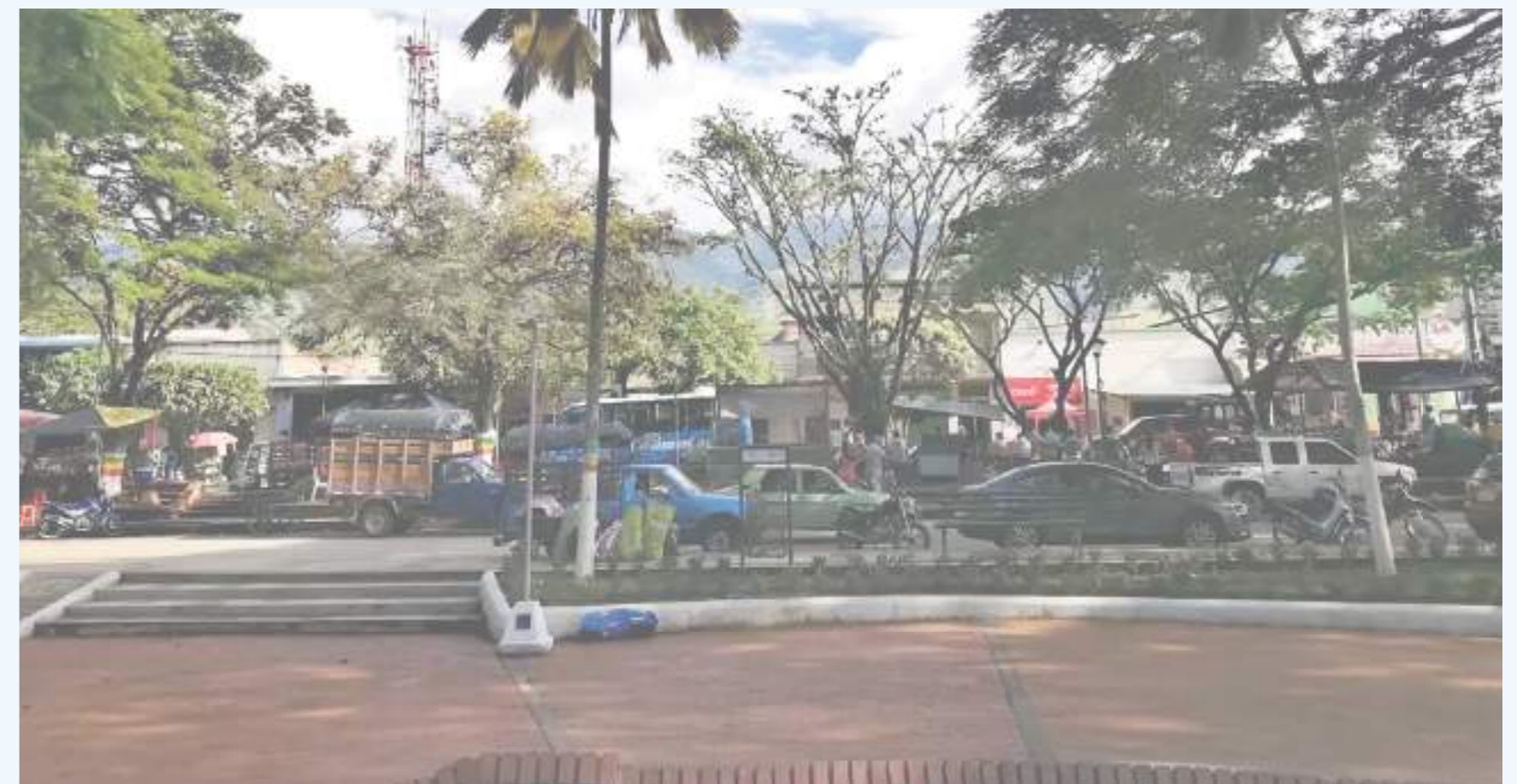
Por ahora, en el municipio se desconocen las causas de este doble homicidio y se pudo establecer que contra las víctimas no existían denuncias por amenazas contra sus vidas.