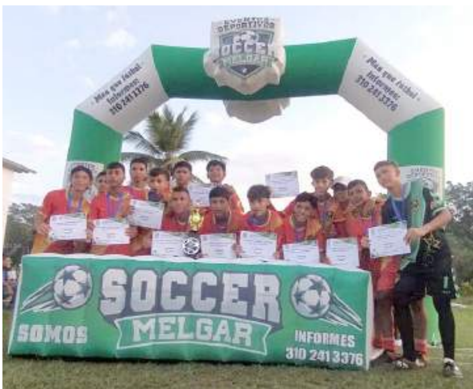
Menciones recibidas por los campeones.