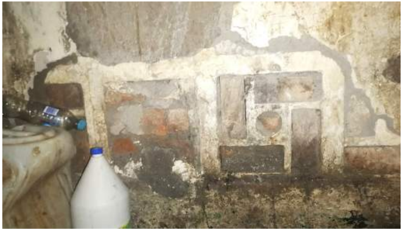
Policía Huila sin registro de plan de fuga

Las autoridades desmintieron las versiones de fuga.