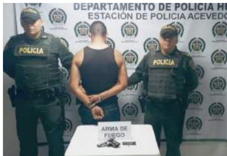
El capturado con el arma incautada.

Gracias a estos planes de control ejecutados el fin de semana, se incautaron 3 armas de fuego y 3 traumáticas, proviniendo hechos de intolerancia y violencia en toda la jurisdicción del Departamento de Policía Huila.