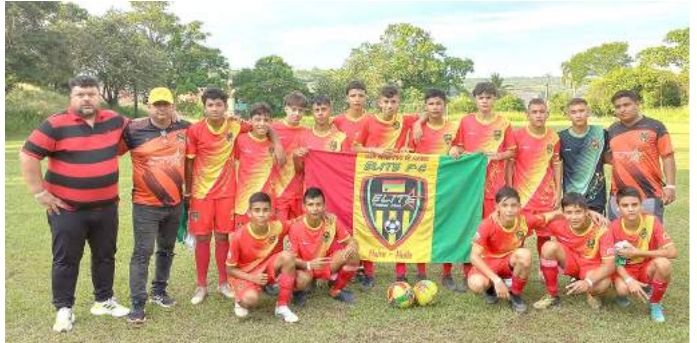
Integrantes del Élite fútbol Club de Neiva campeones en categoría infantil en Melgar.

Ya en la final el rival fue Cafeteros Fútbol Club que fue un duro rival, pero que cayó por 1-0 ante los chicos del Élite a la postre campeón en la categoría infantil.