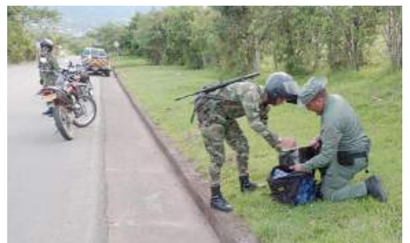
Las operaciones contra el narcotráfico se registraron en los municipios de La Plata y Paicol, Huila.

A su vez, en la vereda Santa Inés del municipio de Paicol, soldados del Batallón Especial Energético y Vial n.º 12 y policías, neutralizaron los planes de un motociclista de continuar su tránsito llevando