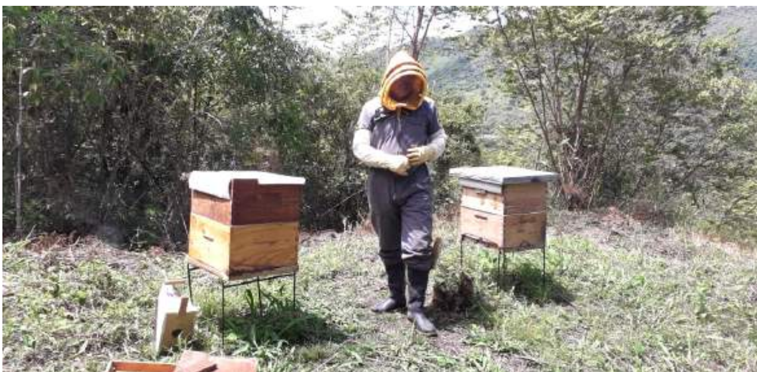
Se acciona contra la miel adulterada

"Nos respalda una ordenanza que estamos buscando que sea efectiva y no de papel, por eso, si hemos podido sentir que hace