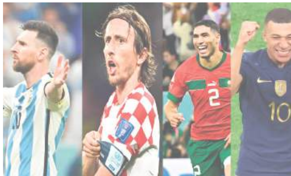
El ganador de la llave se medirá al ganador entre Francia y Marruecos.

“Es un placer ver jugar a Modric, es un ejemplo para muchos. No solo por cómo juega, sino por cómo es. El que quiere al fútbol quiere jugadores así adentro de la cancha”.