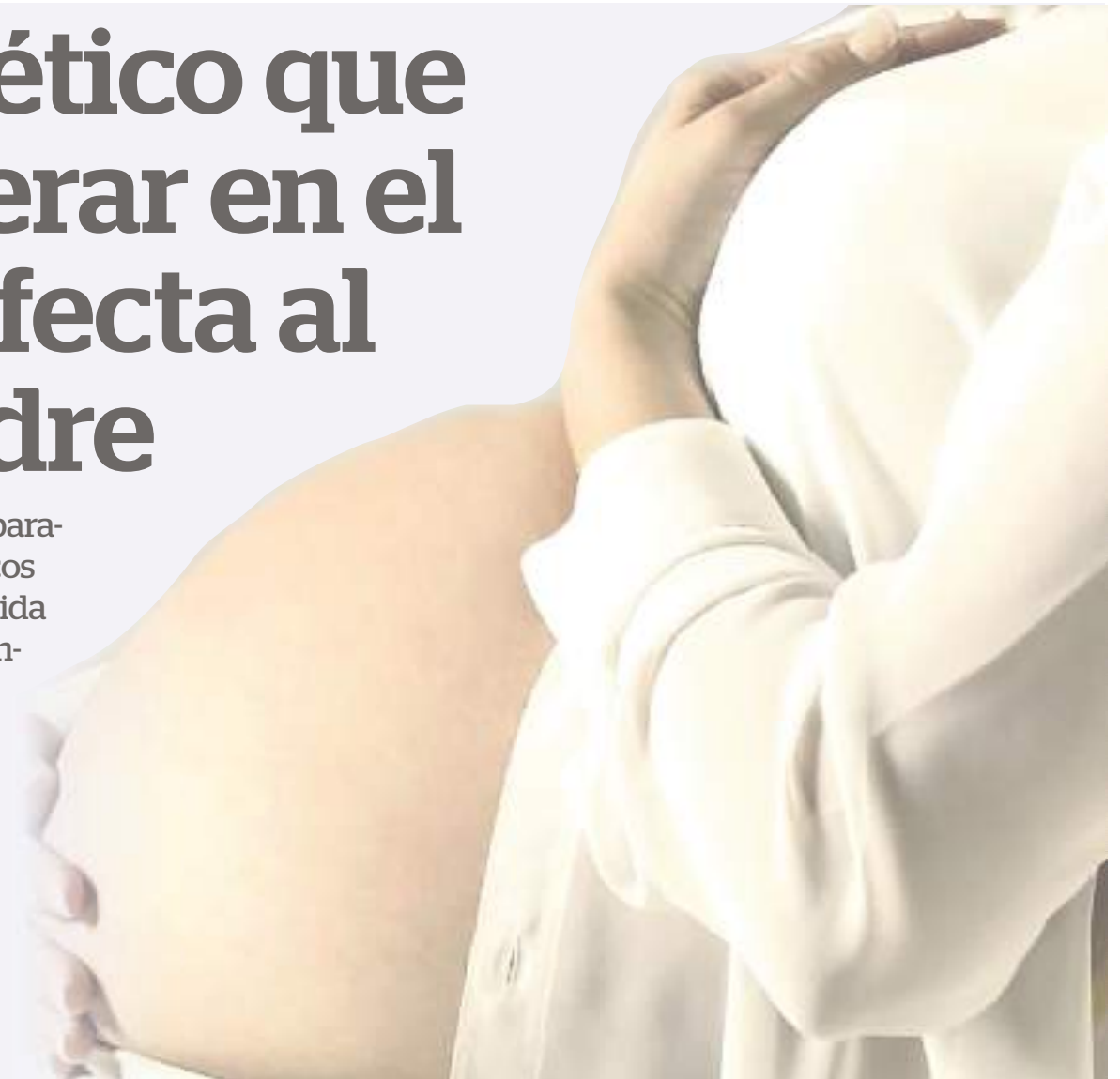
El inconveniente se da cuando a la mamá no le queda nada más para aportarle genéticamente a su bebé.

Los genes paternos, por otro lado, no tienen tal garantía de representación en los otros hijos de esta madre: el padre del hijo actual puede no ser el padre de los futuros hijos potenciales de la madre.