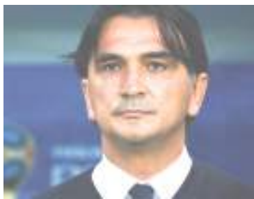
Zlatko Dalic, técnico de Croacia.