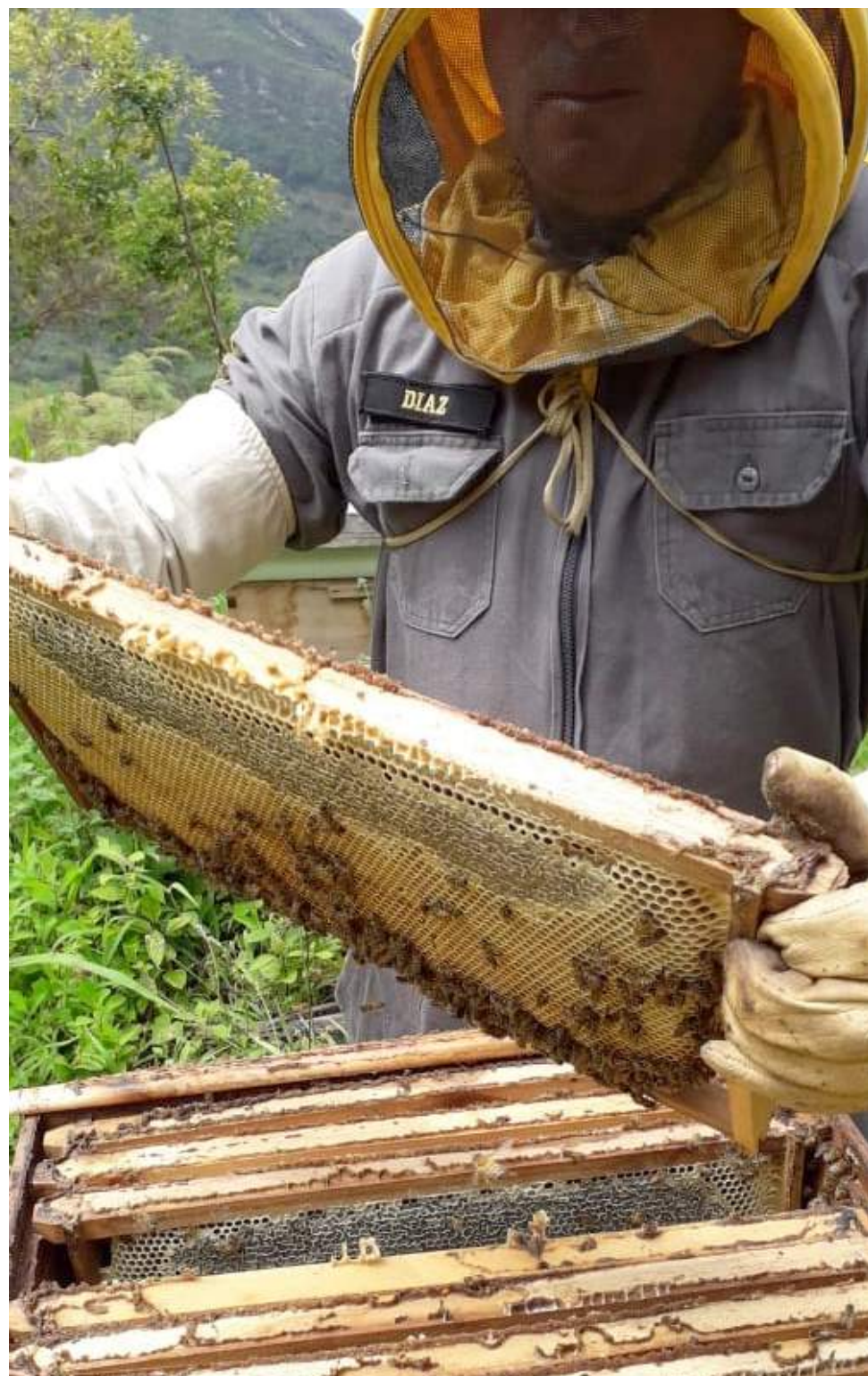
Esperan en la próxima vigencia consolidar la cadena apícola

En la actualidad, aunque no están caracterizados y, desde luego, formalizados, reconocen la importancia del fortalecimiento del sector. En la región se vienen desarrollando importantes proyectos con inversiones de más de $1.000 millones, por lo que, se muestran muy positivos y con amplias expectativas.