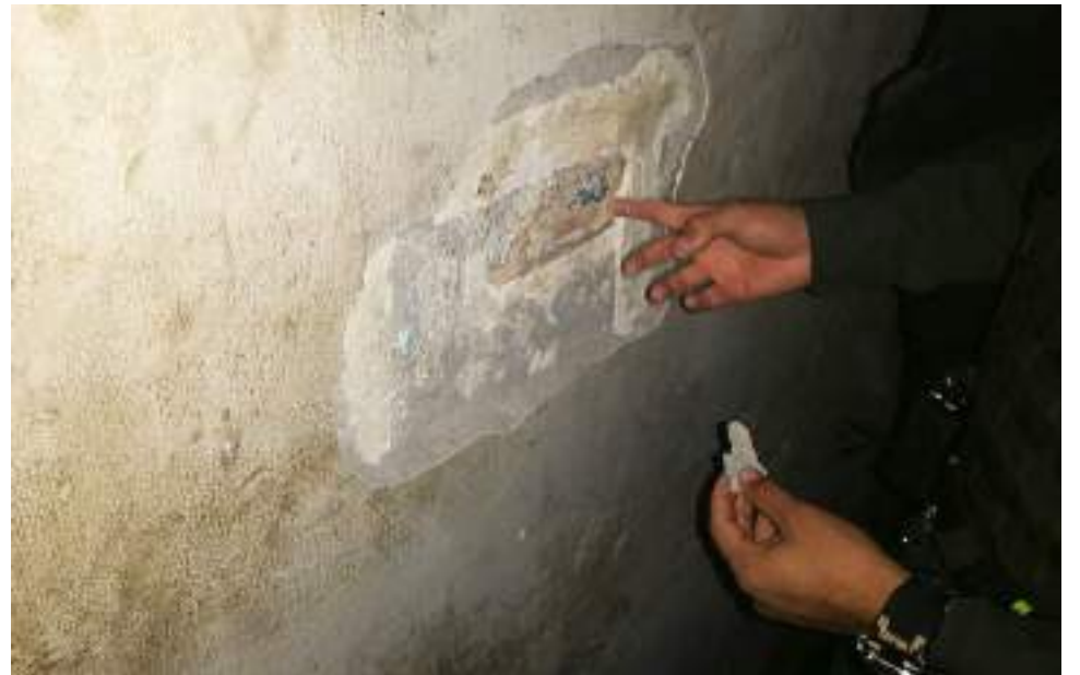
Varios privados de la libertad del centro transitorio de Pitalito planearon su fuga aprovechando el inicio de la agenda navideña.