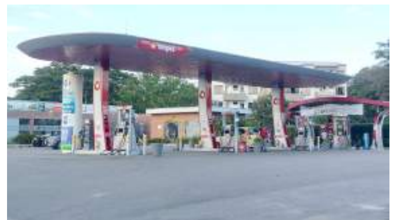
También existen estaciones de servicio cercanas al conjunto.

En la asamblea de copropietarios, se dio a conocer por parte de la administración una queja formal que fue la que tuvo una