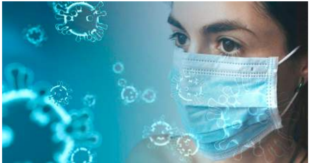
Del 2 al 7 de diciembre había en Colombia 5.887 casos activos de covid-19.

Hay que resaltar que solo hace unos días la funcionaria habría dicho que el uso del tapaboca sería nuevamente obligatorio en el país dado el aumento en el número de casos y la época decembrina que genera aglomeración de personas.