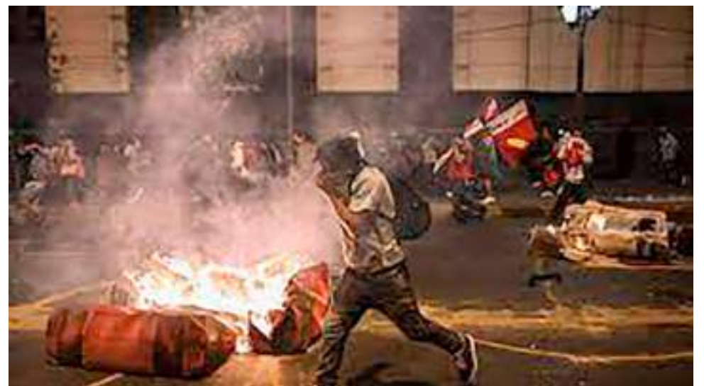
Graves enfrentamientos en Perú.

Los gobiernos de los cuatro países hicieron un llamado “a todos los actores involucrados en el anterior proceso para que prioricen la voluntad ciudadana