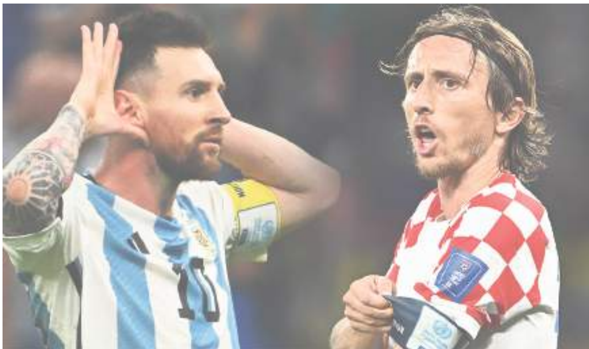
Argentina - Croacia primera semifinal en Qatar 2022.

■ Ya no hay vuelta atrás, Argentina y Croacia se verán las caras en la primera de las semifinales del Mundial de Qatar 2022. Es una nueva confrontación que para los argentinos es una revancha a la derrota que los dejó fuera de la final hace cuatro años en Rusia 2018. El cotejo está previsto para las dos de la tarde de hoy martes hora colombiana.