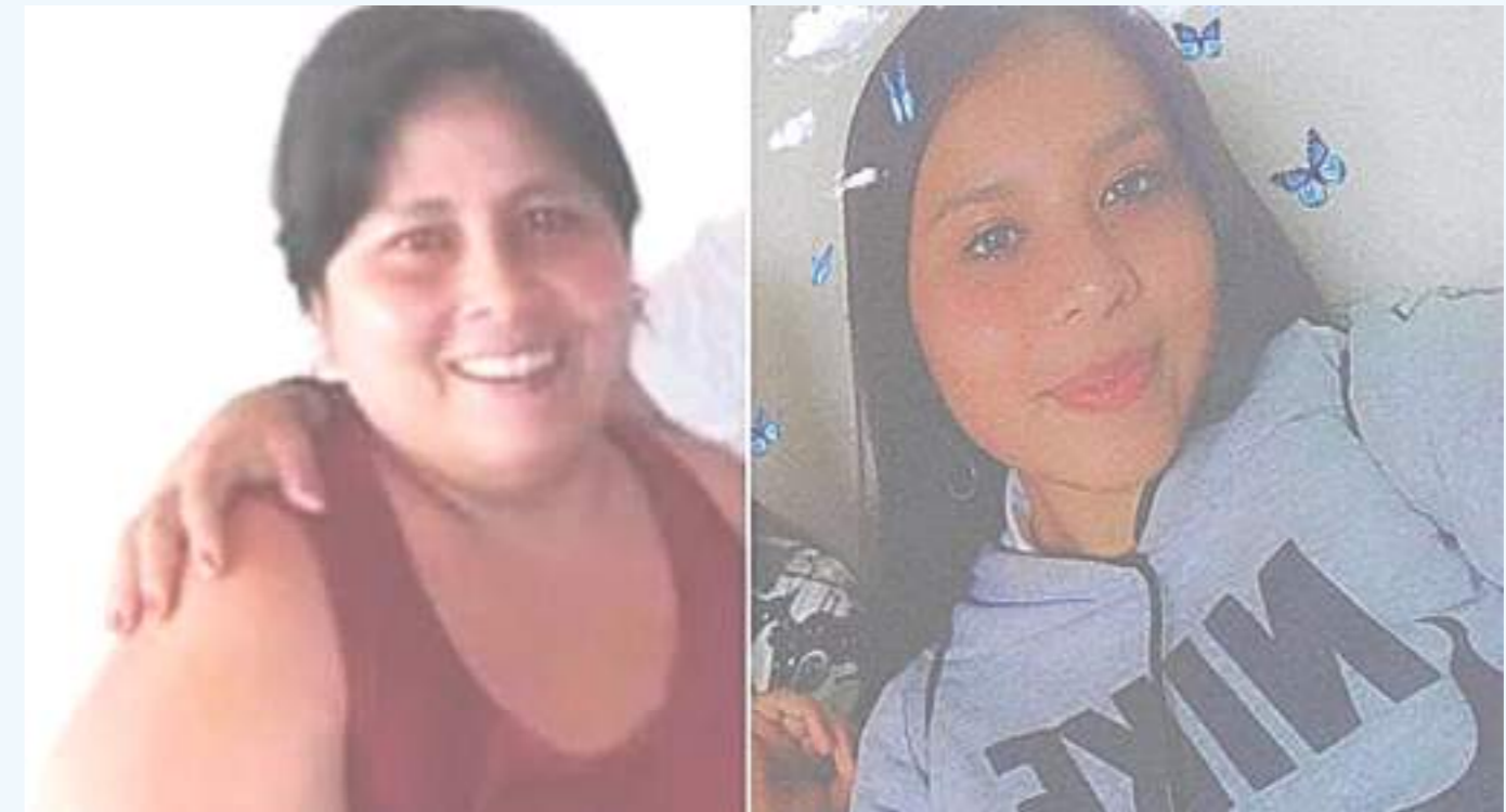
En esta vivienda ocurrió el doble homicidio, en mayo del presente año.

Las dos mujeres fueron halladas con disparos en su cabeza, las chapas no fueron forzadas y aún no hay capturas.