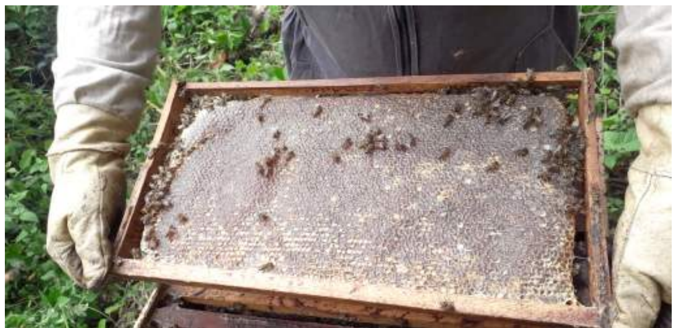
Un panorama positivo tienen los apicultores del Huila

Resaltó la importancia de apoyar la comercialización por que la que se realiza ahora es muy 'primaria' y esto sucede porque no hay una red de comercialización definida en el departamento como una actividad economía de la secretaría de Agricultura.