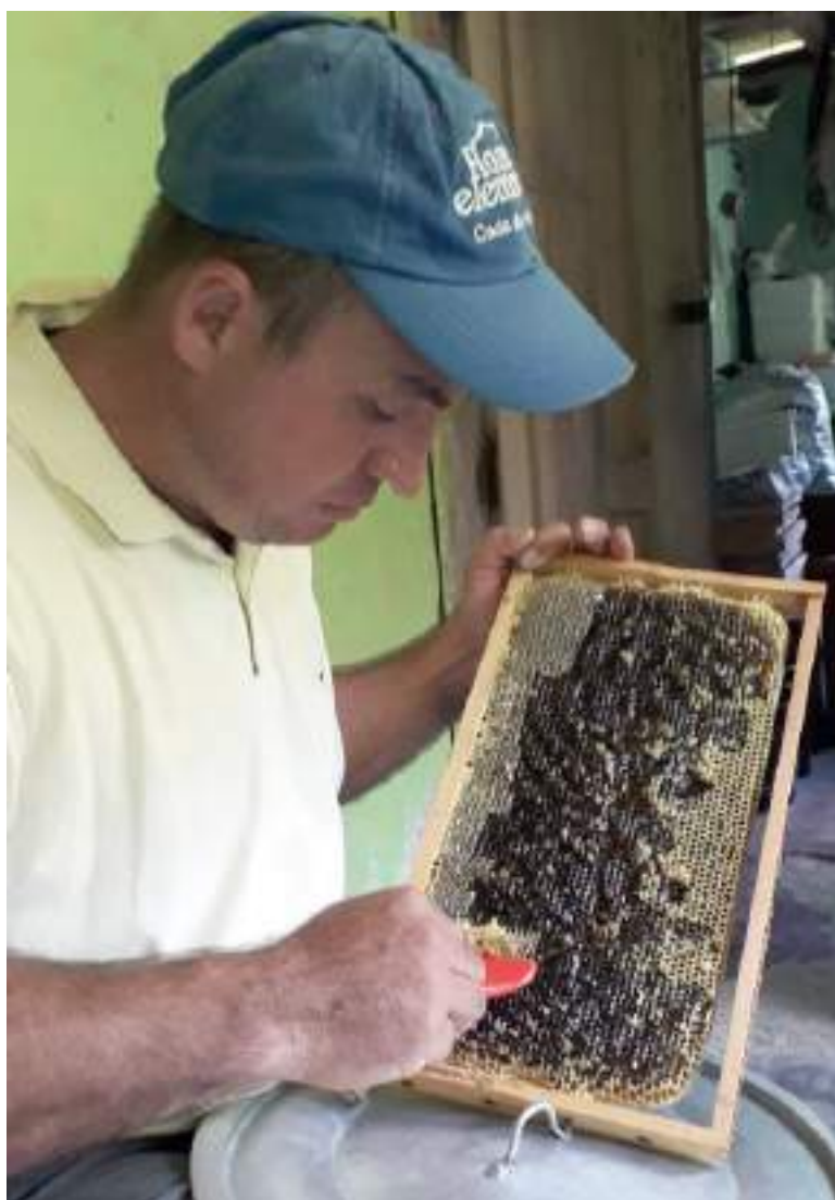
Se ha venido fortaleciendo en sector con proyectos de alianzas en varios municipios del departamento.

falta mucho más, pero si se ha priorizado en los planes de desarrollo del ente territorial. Este es un sector productivo que puede generar recursos para el departamento porque recordemos que nosotros figurábamos como el segundo departamento más productor de miel para el país y ahora estamos dos o tres puestos abajo. Entonces necesitamos que se siga apoyando para aumentar la productividad”, concluyó.