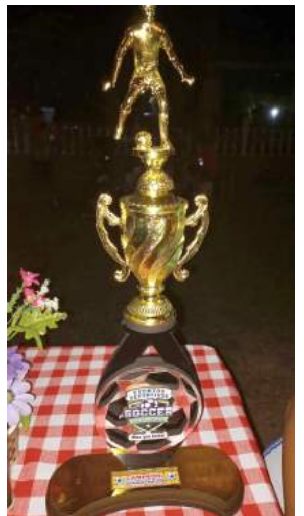
Trofeo a los ganadores en el certamen.