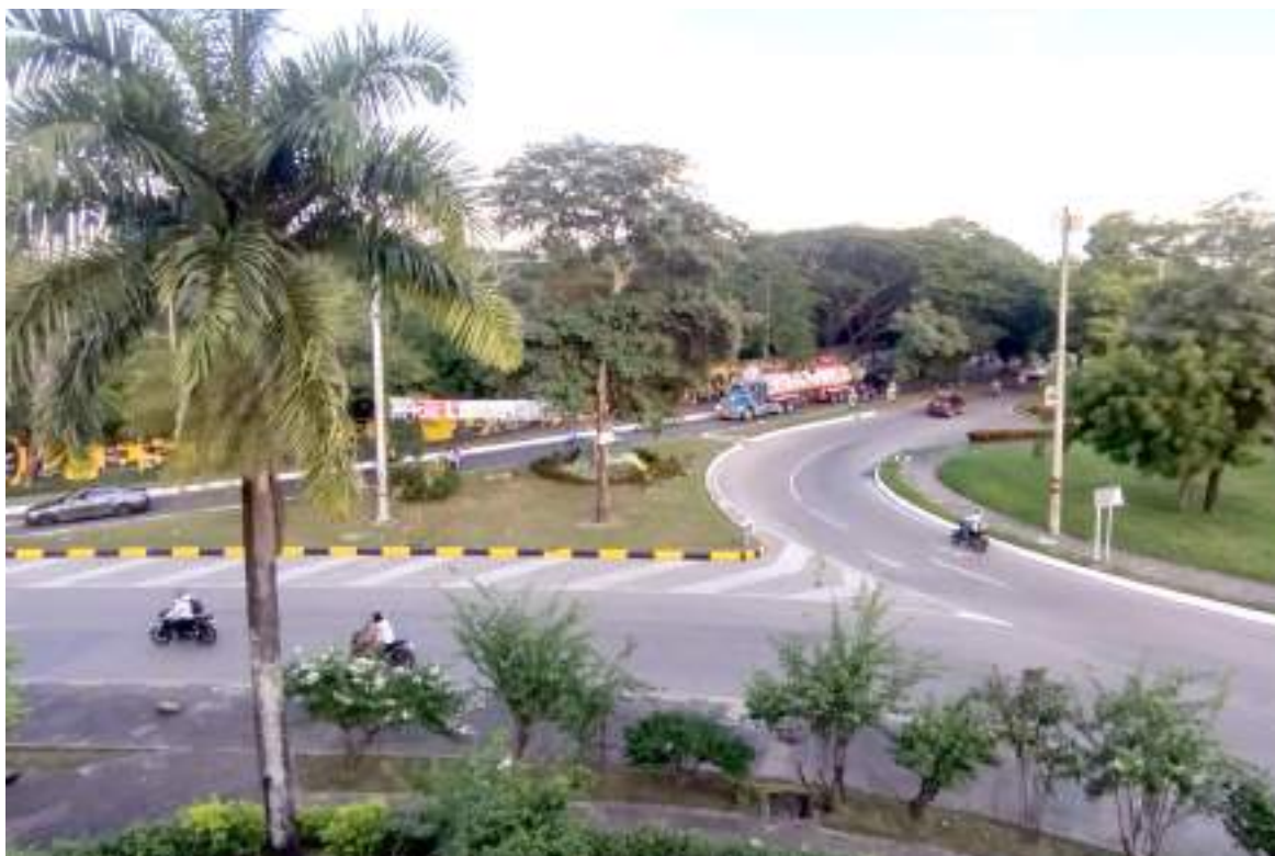
El sector es zona de convergencia de varias vías principales.

El llamado desesperado es para que les presten atención, porque al parecer las campañas y los operativos que hacen las autoridades para controlar los niveles de contaminación por ruido en la ciudad no tocan este sector.