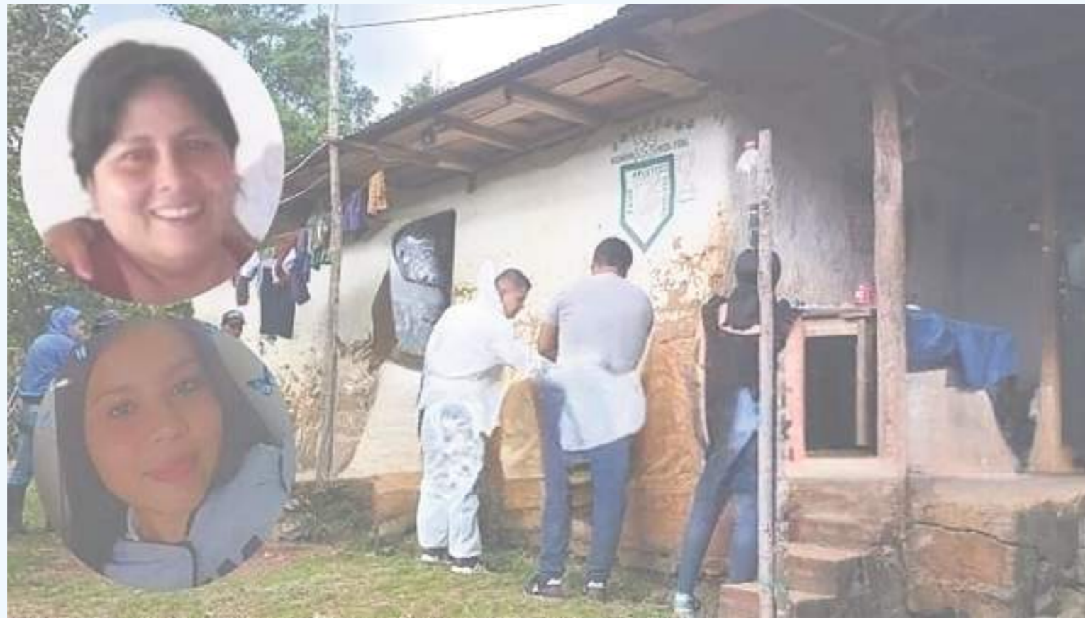
La racha de homicidios en Algeciras parece no dar tregua, y las autoridades no avanzan en las investigaciones.

El doble homicidio de madre e hija fue el primer hecho violento ocurrido en Algeciras en el presente año.