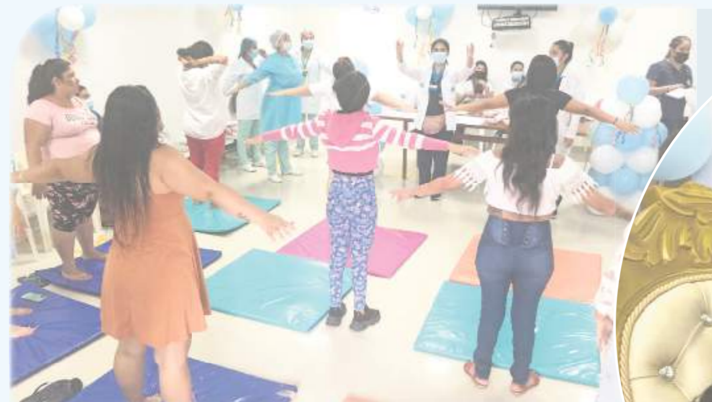
A través de la estrategia IAMII, se capacita y forma a la población materna y gestante sobre la importancia del cuidado del recién nacido y la leche materna.

Cabe mencionar que, durante el primer semestre del año, la entidad dio apertura al curso de Estimulación del Desarrollo Psicomotor a la Primera Infancia, favoreciendo la atención a