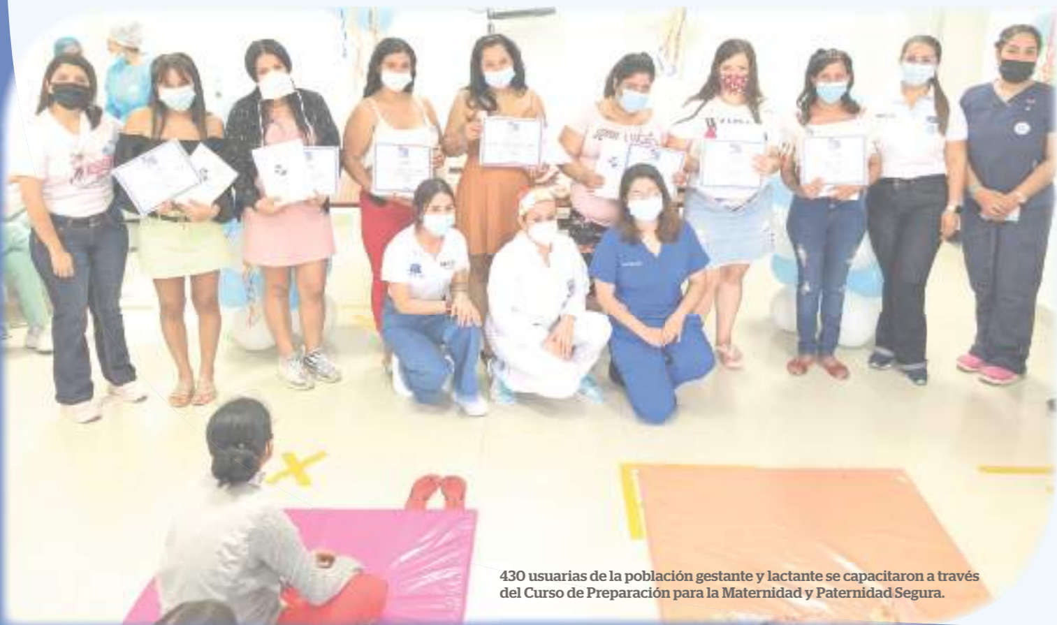
430 usuarias de la población gestante y lactante se capacitaron a través del Curso de Preparación para la Maternidad y Paternidad Segura.

la conformación de grupos de apoyo internos y externos.