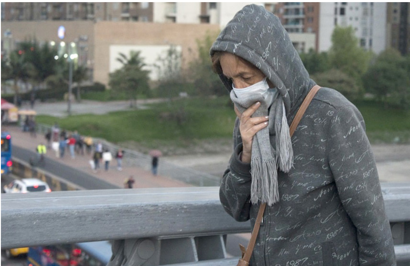
Uno de los sectores que más contamina es la construcción.

La información científica sobre los efectos de la contaminación del aire en la salud es concluyente. Para el Banco Mundial y la Comisión Lancet sobre contaminación y salud, la polución del aire genera casi 9 millones de muertes prematuras al año, lo que representa alrededor del 16 % de todos los fallecimientos en el mundo.