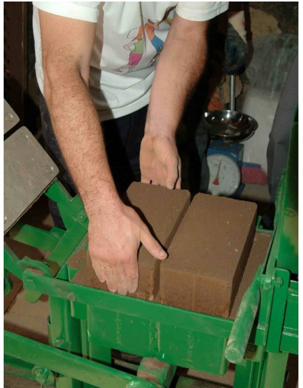
Asolapih, fue una de las empresas pioneras en producción con baja contaminación.

Un horno con este tipo de tecnología, puede llegar a tener un costo entre $400 y $500 millones. “Muchos empresarios no se atreven a realizar estas inversiones, prefieren utilizar estas herramientas artesanales, así les consume el triple de carbón, y los márgenes de utilidad son muy bajos”, agregó el funcionario.