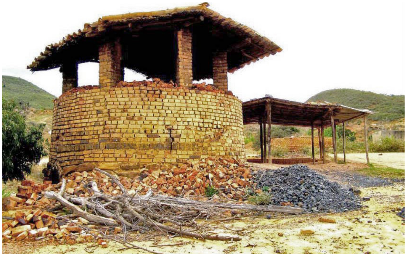
Ladrilleras artesanales utilizadas en algunos municipios.