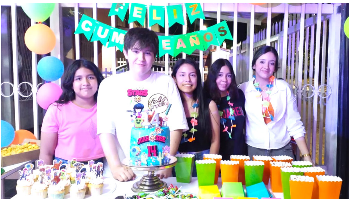
El cumpleaños junto algunas de sus amigas.