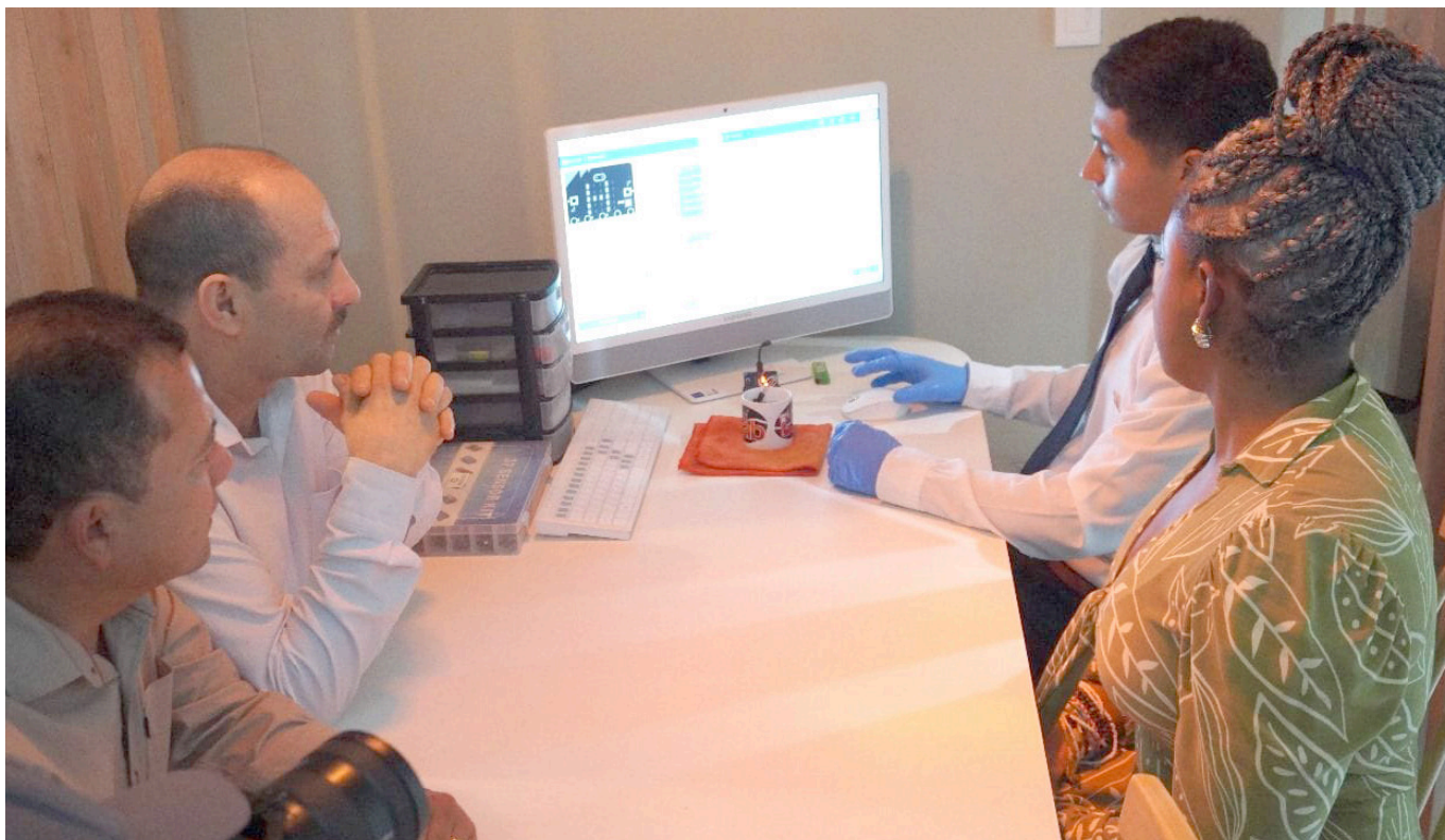
Los docentes se alzaron con el premio de Mejor Escuela del Mundo en Acción Ambiental 2023.

La historia de Cafelab demuestra que la educación puede ser un agente transformador cuando se adapta a la realidad local y se integra con las necesidades y desafíos de la comunidad.