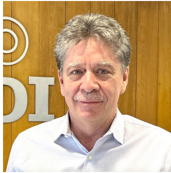
Bruce Mac Master

Cuando cumple 10 años al frente de la ANDI, el gremio empresarial más importante de Colombia, Bruce Mac Master se ha convertido en el principal contrapeso frente a las propuestas socioeconómicas de izquierda del Gobierno del presidente Gustavo Petro. Unos 1.600 afiliados que representan entre el 52 y el 53% del Producto Interno Bruto del país y el 70% del Producto Interno Bruto privado; 35 sectores económicos, 12 regiones y un poder e influencia desco-