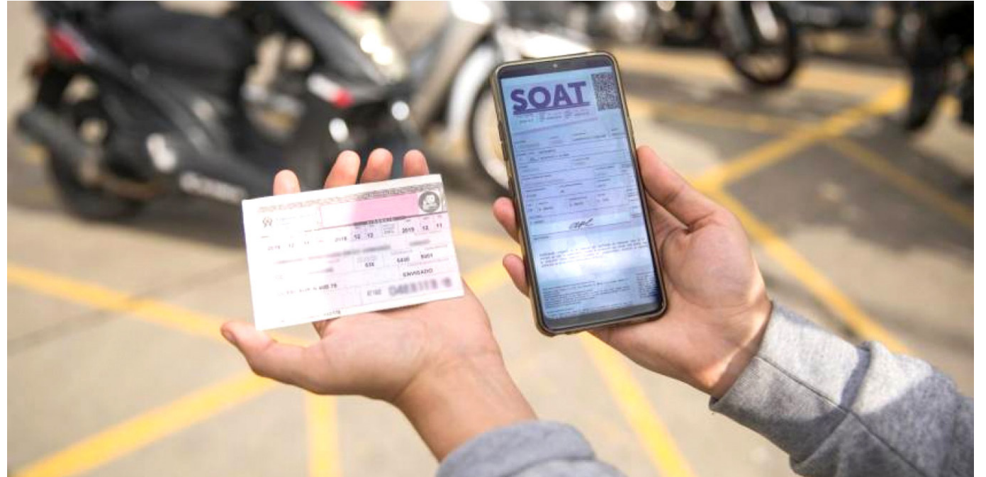
El Ministerio de Hacienda reveló el borrador con el que se busca ampliar el descuento del 50% del Soat para los conductores para 2024.

mente para vehículos con ciertas características de capacidad, motor y uso. Estos serán los beneficiados con la medida: