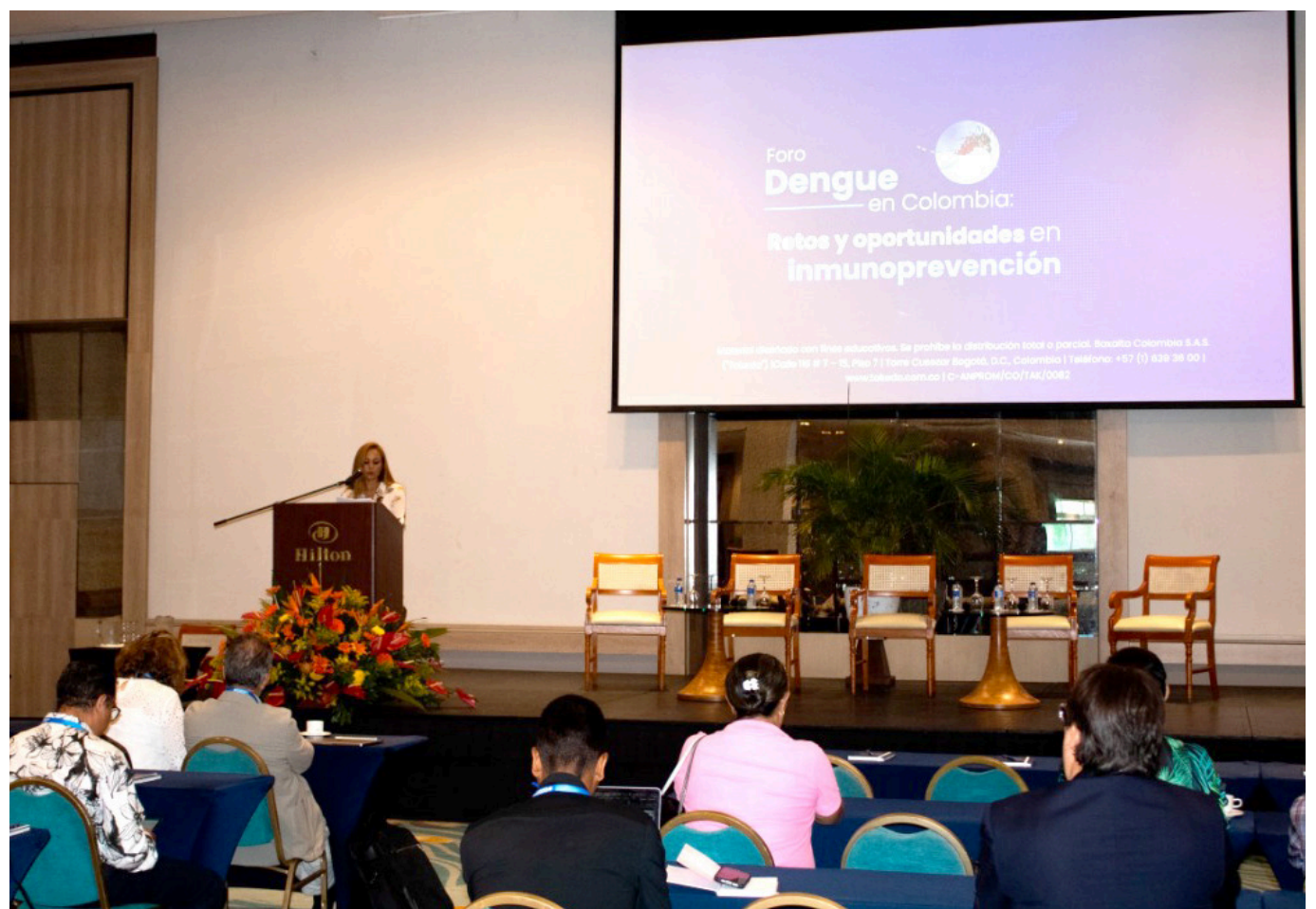
'Dengue en Colombia: retos y oportunidades en inmunoprevención'.

El llamado a la acción resonó alto en este foro, donde se subrayó que abordar la crisis del dengue requerirá un esfuerzo conjunto de todos los sectores. La salud tropical fue presentada como un ecosistema interconectado, y se insistió en que solo a través de la comprensión colectiva y la colaboración se podría mitigar la amenaza seria que representa el dengue en cualquier contexto.