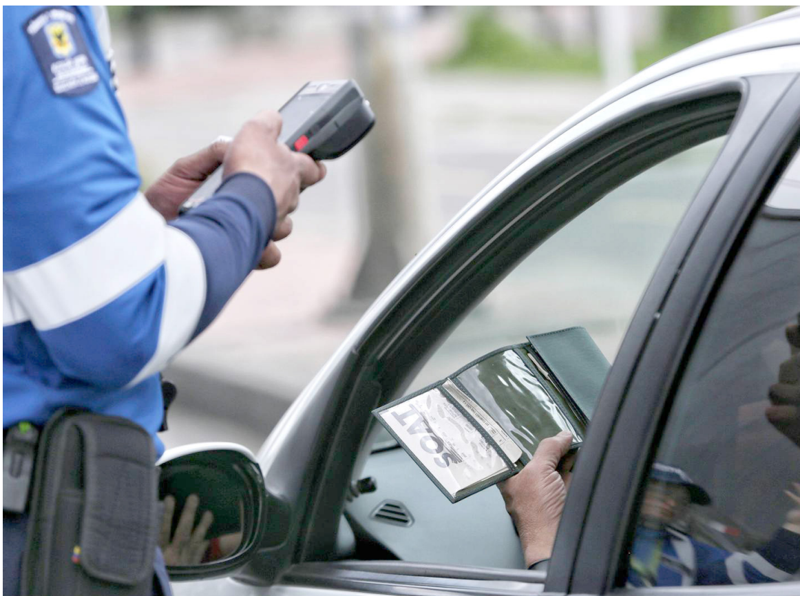
Proposición radicada para llevar a cabo el debate de control político a todas las entidades del orden nacional sobre el seguro obligatorio de accidente de tránsito del Soat.

tado anualmente por la variación anual de la UVT correspondiente al respectivo año".