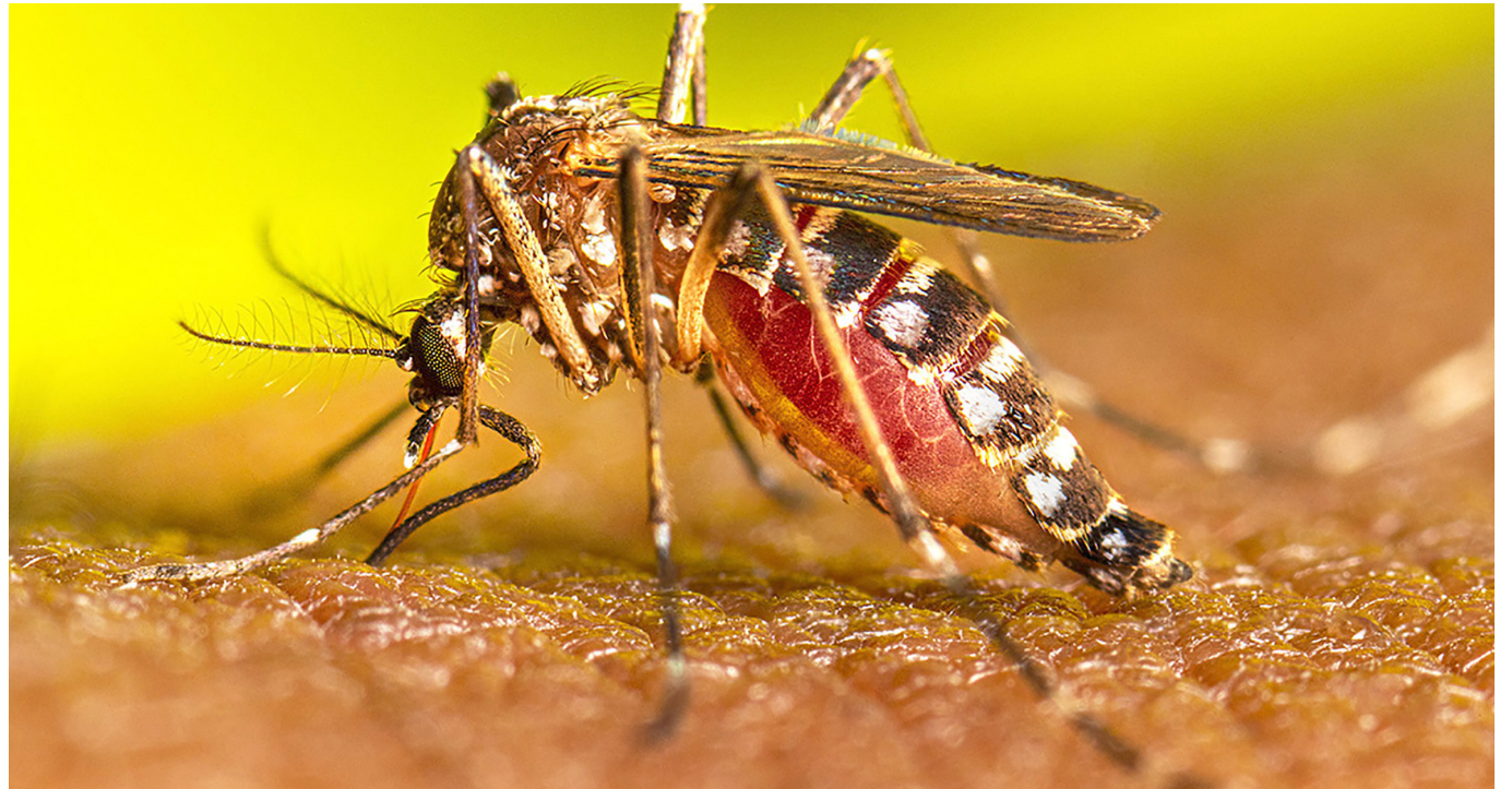
El ECDC notifica más de 3,7 millones de casos y más de 2.000 muertes por dengue en todo el mundo en lo que va de año.

La organización mundial de la Salud (OMS) añadieron un matiz global a la situación, al señalar que los casos de dengue podrían alcanzar máximos históricos debido al cambio climático.