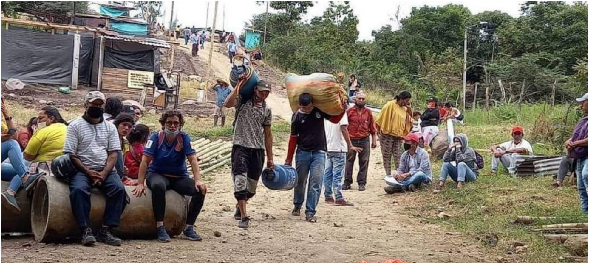
La Oficina de las Naciones Unidas confirma un desplazamiento masivo o confinamiento cada dos días en Colombia hasta septiembre de 2023, cuadruplicando las cifras de 2017.