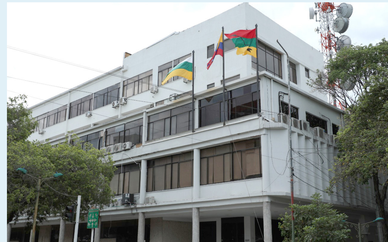
El recaudo que realiza el Municipio de Neiva sí es acorde a la ley, según ratificó el Consejo de Estado.

Además, señaló que "La Sala precisa que la nulidad que se decreta no da lugar al reconocimiento de perjuicio alguno, porque como se analizó con anterioridad, el acto demandado en este proceso es de carácter general y, en todo caso, la pretensión indemnizatoria está estructurada en los supuestos perjuicios causados a la actora a causa de la diferencia arrojada entre el valor promedio pagado por concepto del impuesto de alumbrado público antes de la entrada en vigencia del Acuerdo 020 de 2004, con lo pagado como consecuencia de la aplicación de las tarifas del acto enjuiciado, cuya presunción de legalidad, en cuanto a ese elemento del tributo, no fue desvirtuada".