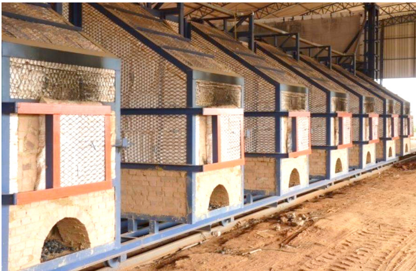
Modelo brasileño implementado.

Un horno con este tipo de tecnología, puede llegar a tener un costo entre $400 y $500 millones.