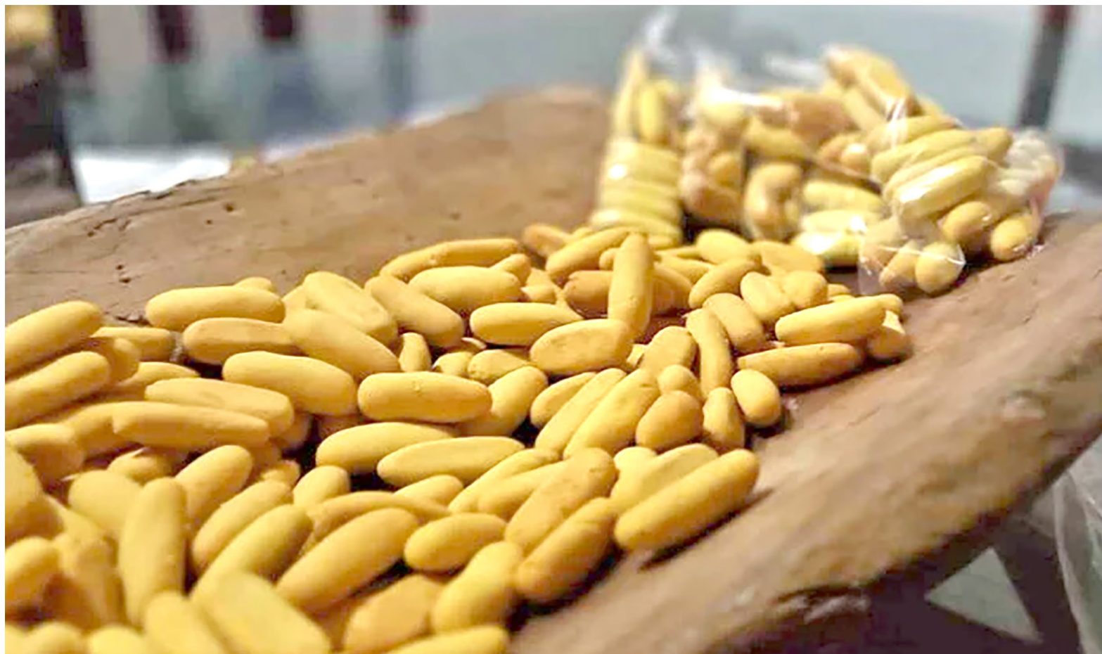
Habrará en Neiva un Centro de Reindustrialización para la achira.

Según la funcionaria, para el Ministerio de Comercio y la entidad que representa, es un ejercicio que permite aunar esfuerzos con entidades públicas, privadas, locales, con gobierno local y con mixtos, donde iNNpulsa, coloca la asistencia técnica y los demás aliados, la infraestructura y el tema de maquinaria para este proyecto (achira), que sería de agroindustria.