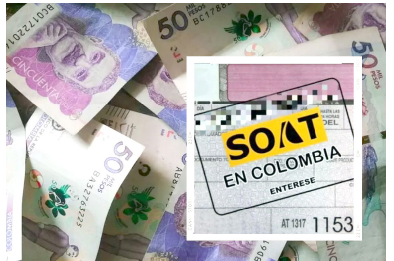
Foto de referencia del Seguro Obligatorio de Accidentes de Tránsito Soat.

Según el proyecto de decreto que está actualmente publicado en la página del Ministerio de Hacienda, desde el lunes primero de enero del 2024, "el valor a pagar equivaldrá aproximadamente al 50% del precio final vigente al 14% de diciembre de 2022, ajustado