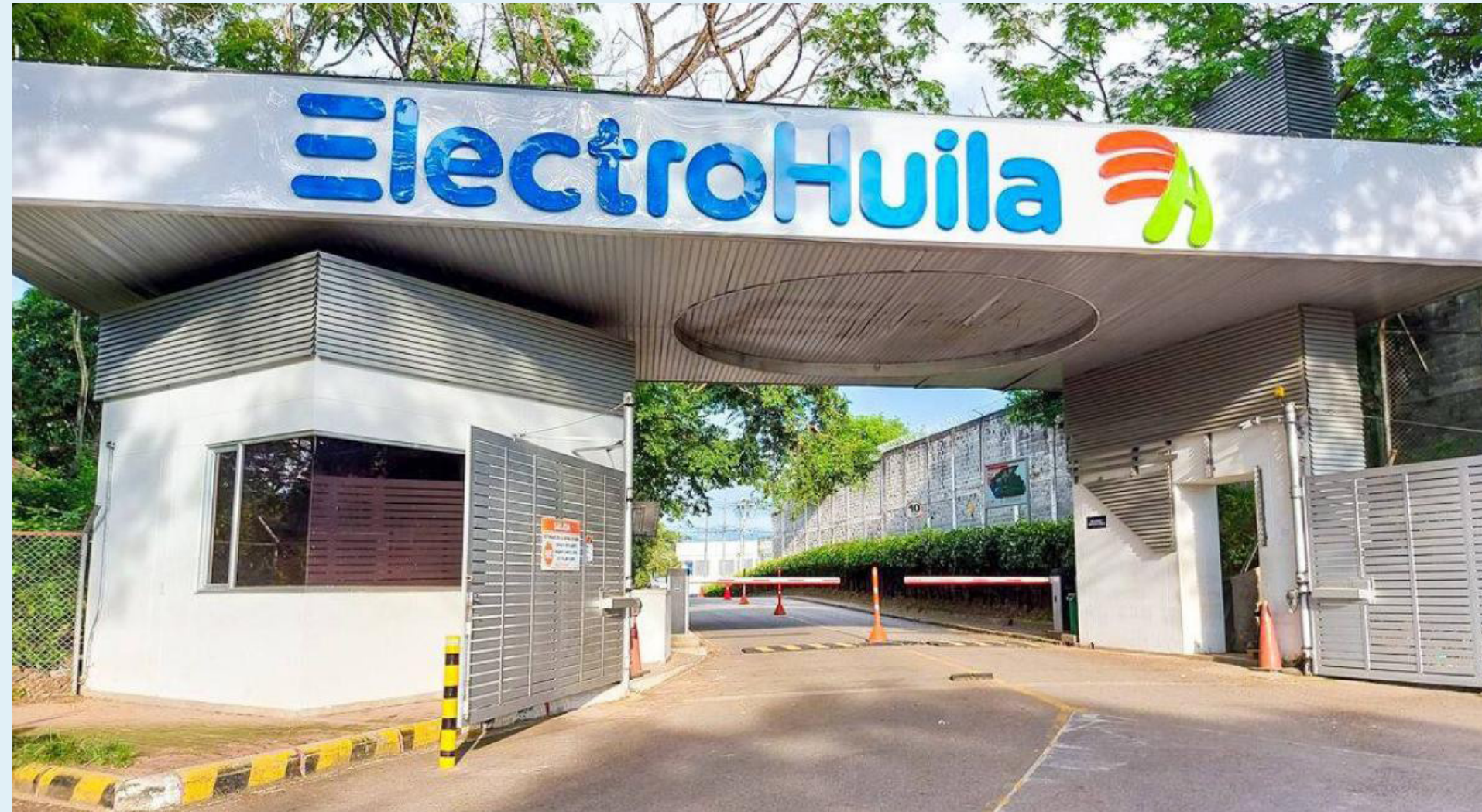
El 27 de julio de 2017 la Electrificadora del Huila SA ESP, demandó al municipio de Neiva.

Advierte el Consejo de Estado: "En cuanto al presunto desconocimiento de los límites establecidos en el Decreto 2424 de 2006 y en la Resolución CREG 043 de 1995, se precisa que esta última fue derogada por el artículo 30 de la Resolución 123 de 2011 de la citada comisión".