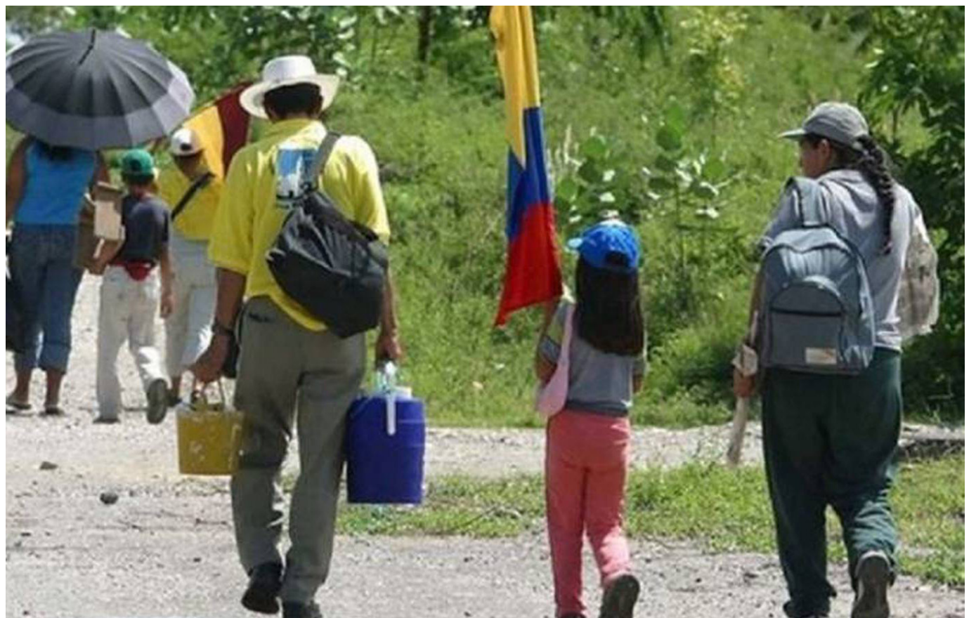
Entre el 1 de enero de 2016 y el 31 de agosto de 2023, este instituto compila 1.324.964 de eventos de este tipo.

Este fenómeno, proveniente de municipios huilenses y departamentos limítrofes, complica la situación de orden público en la ciudad.