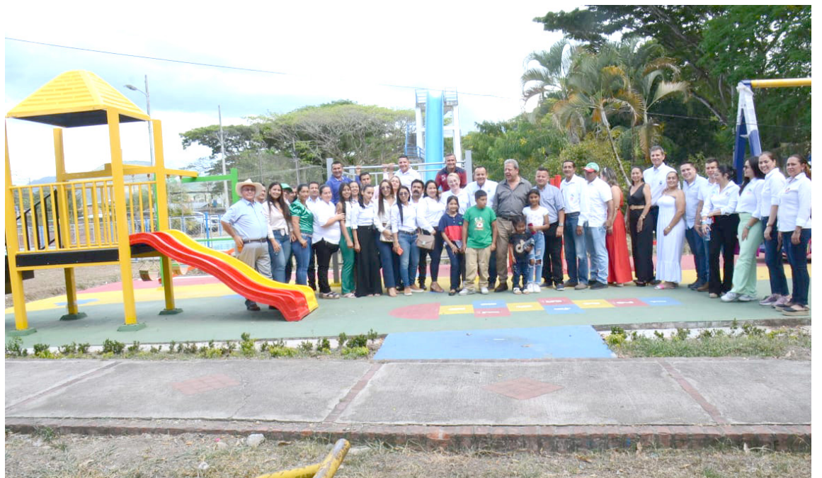
El gobernador del Huila, Luis Enrique Dussán López llegó al municipio de Guadalupe para socializar y visitar obras que se adelantan en el hospital de la localidad, en placas huellas, villa deportiva, mejoramientos y vivienda nueva, gasificación, cementaciones urbanas y rurales, baterías sanitarias.