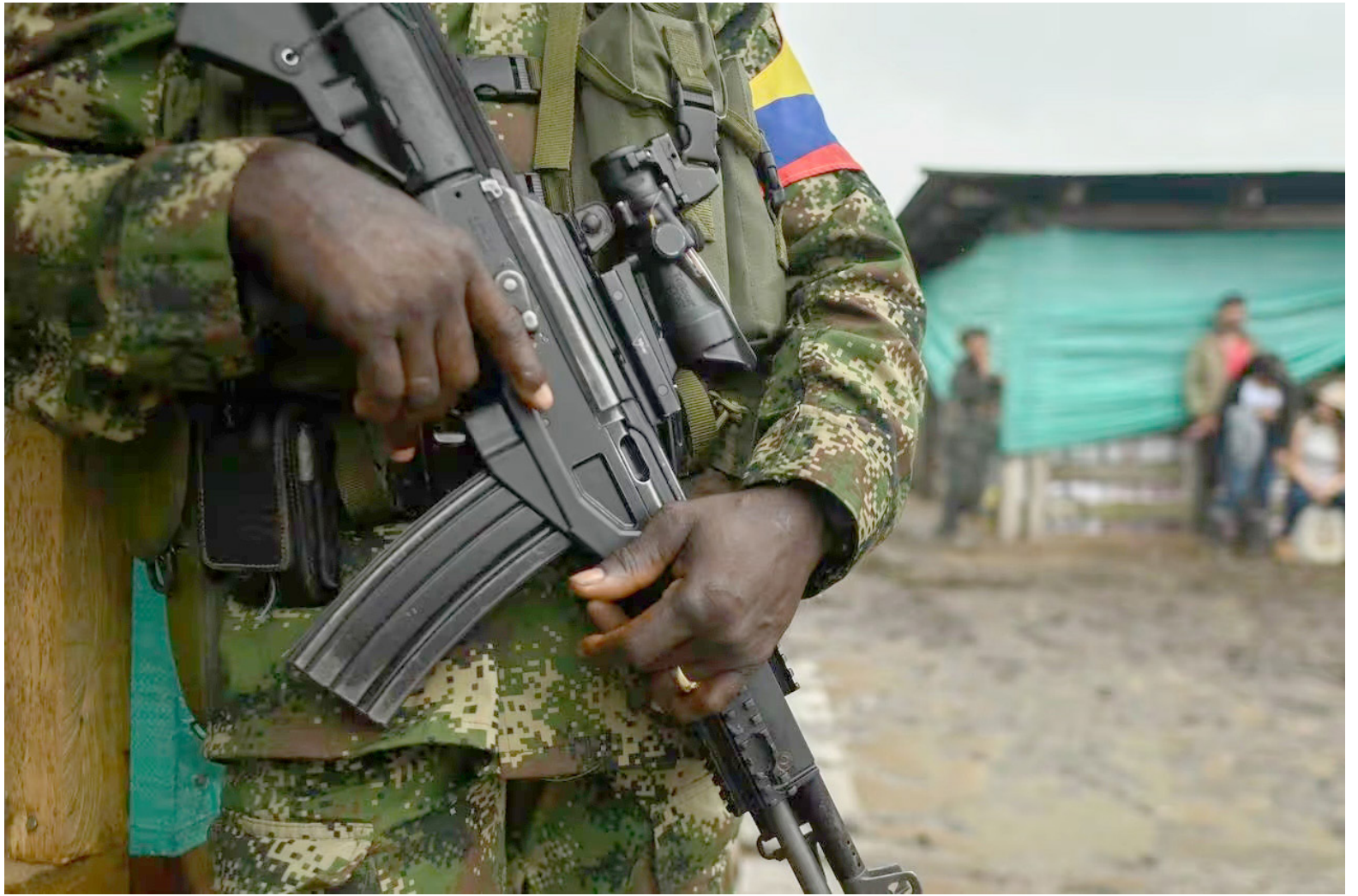
Creciente presencia de disidencias en el Huila: El gobierno local alerta sobre la falta de respuesta del Gobierno Nacional.