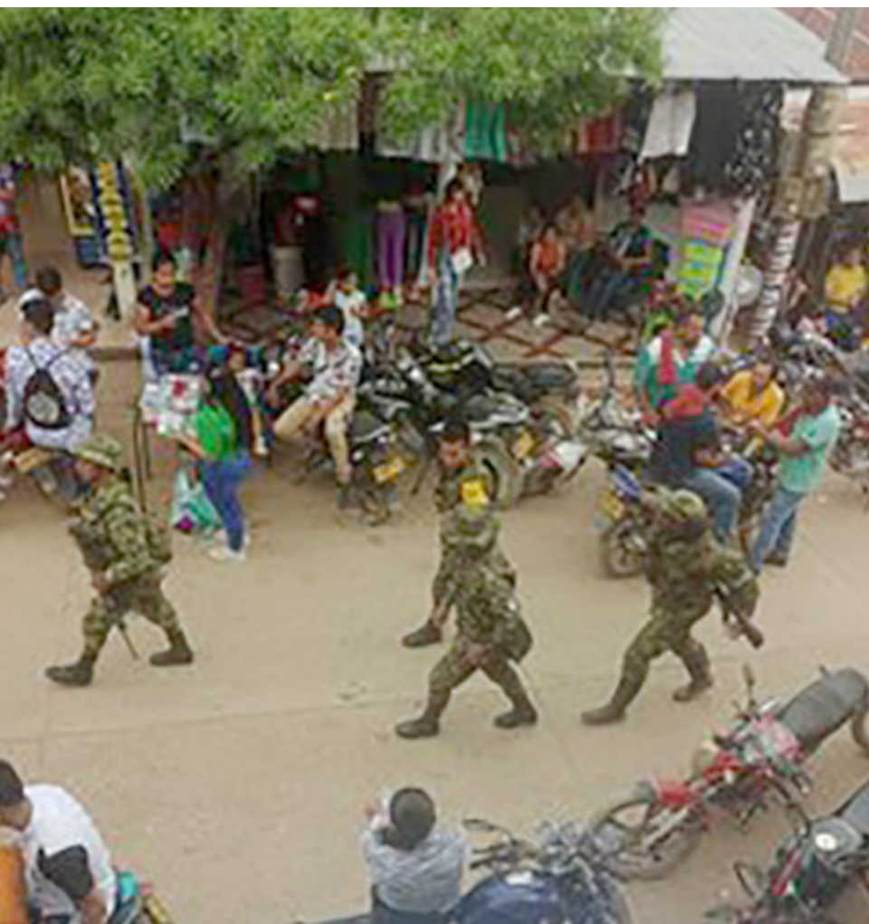
Hombres armados en Valencia de la Paz: Ejemplo reciente que demuestra la creciente influencia de las disidencias en el Huila.