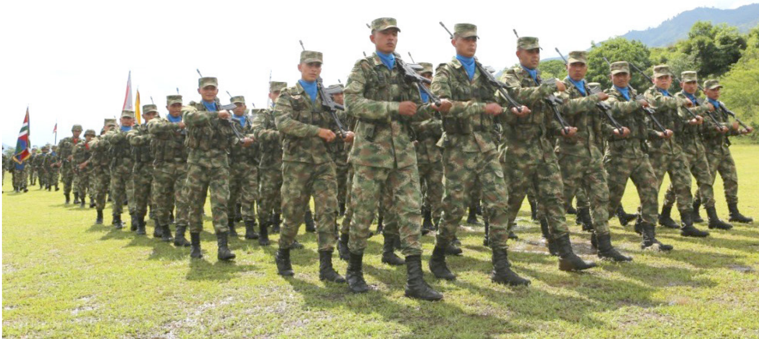
Persistencia de desafíos para la paz en Colombia: Gobernador Dussán resalta la necesidad de acciones operativas eficaces.

El tema de las disidencias adquirió otra dimensión cuando Iván Márquez, quien fuera jefe negociador en los diálogos con el Gobierno, anunció en agosto de 2019 que retomaba las armas junto a otros jefes de las otrora Fuerzas Armadas Revolucionarias de Colombia que se habían apartado de sus compromisos con el sistema de justicia transicional. Sus intentos para unirse con Gentil Duarte e Iván Mordisco se estrellaron con la resistencia de esas estructuras, que ya tenían una importante influencia en el suroriente de Colombia y al otro lado de la frontera con Venezuela. Aunque no hubo una desbandada de firmantes de paz, como se temió en un primer momento, el fuego de las disidencias ha estado alimentado por nuevas dinámicas de reclutamiento forzado, a menudo de menores de edad.