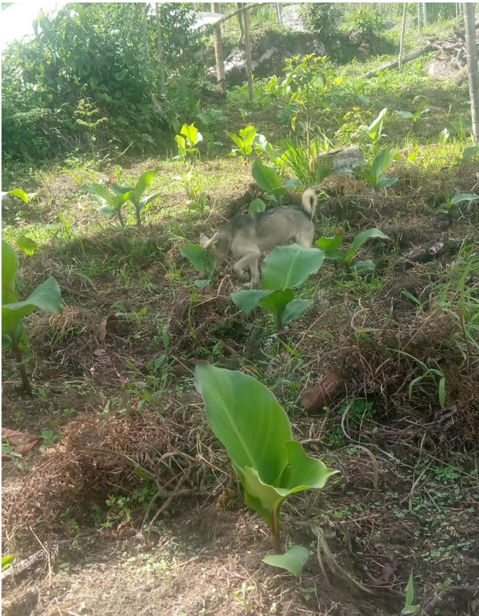
En el Huila, se produce poco la planta de achira.