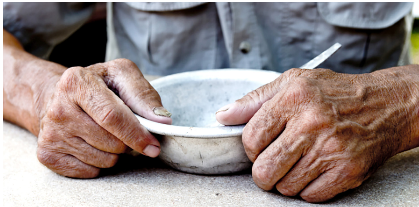
El informe dicta que en 2022 cerca de 247,8 millones de personas en la región experimentaron inseguridad alimentaria moderada o grave.

el ámbito de la seguridad alimentaria, pero persisten desafíos importantes. La colaboración continua entre el gobierno, la sociedad civil y el sector privado es esencial para abordar estos problemas de manera integral. La inversión en tecnologías sostenibles, la capacitación agrícola y la promoción de la equidad en la distribución de recursos son elementos clave para garantizar una seguridad alimentaria sostenible y justa en todo el país.