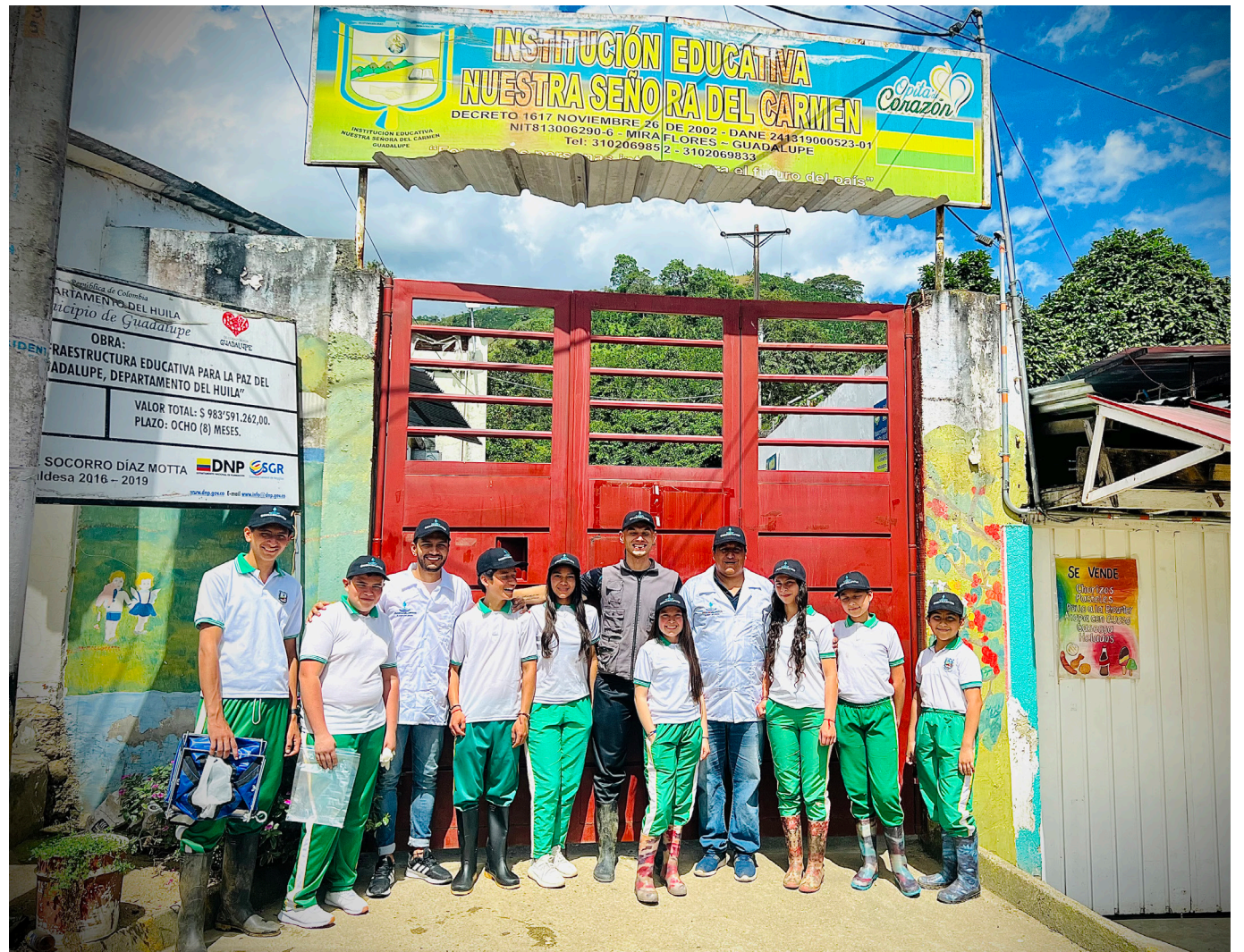
Los estudiantes de la institución educativa Nuestra Señora del Carmen de Guadalupe, son los protagonistas de la mejor experiencia educativa del país, con enfoque STEM.

Después de superar rigurosas etapas de selección a nivel nacional, la experiencia educativa de Guadalupe se consagra como campeona en la categoría de Experiencias Pedagógicas con Enfoque STEM.