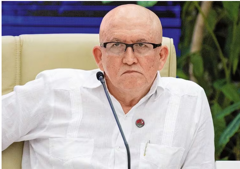
Antonio García, máximo comandante del ELN, justificó el secuestro del padre de Luis Díaz, aunque reconoció que fue un error

■ El máximo comandante de la guerrilla aseguró que todo se debió a una misión económica, pero que no sabía que entre los objetivos estaba el padre del futbolista del Liverpool.