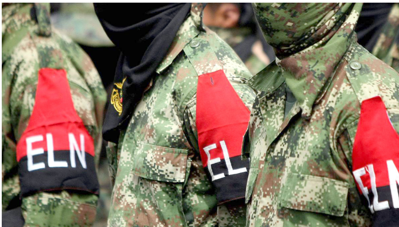
El frente de Guerra Norte del ELN sería el responsable de varios secuestros en los departamentos de Cesar y La Guajira.

“Cumpliendo dicha orientación los Frentes de Guerra han enviado varios comandos a realizar operaciones de finanzas. Los mandos del Frente de Guerra Norte no informaron al Comando Central que entre sus objetivos estaba un familiar de Luis Díaz”, escribió en su red social Antonio García.