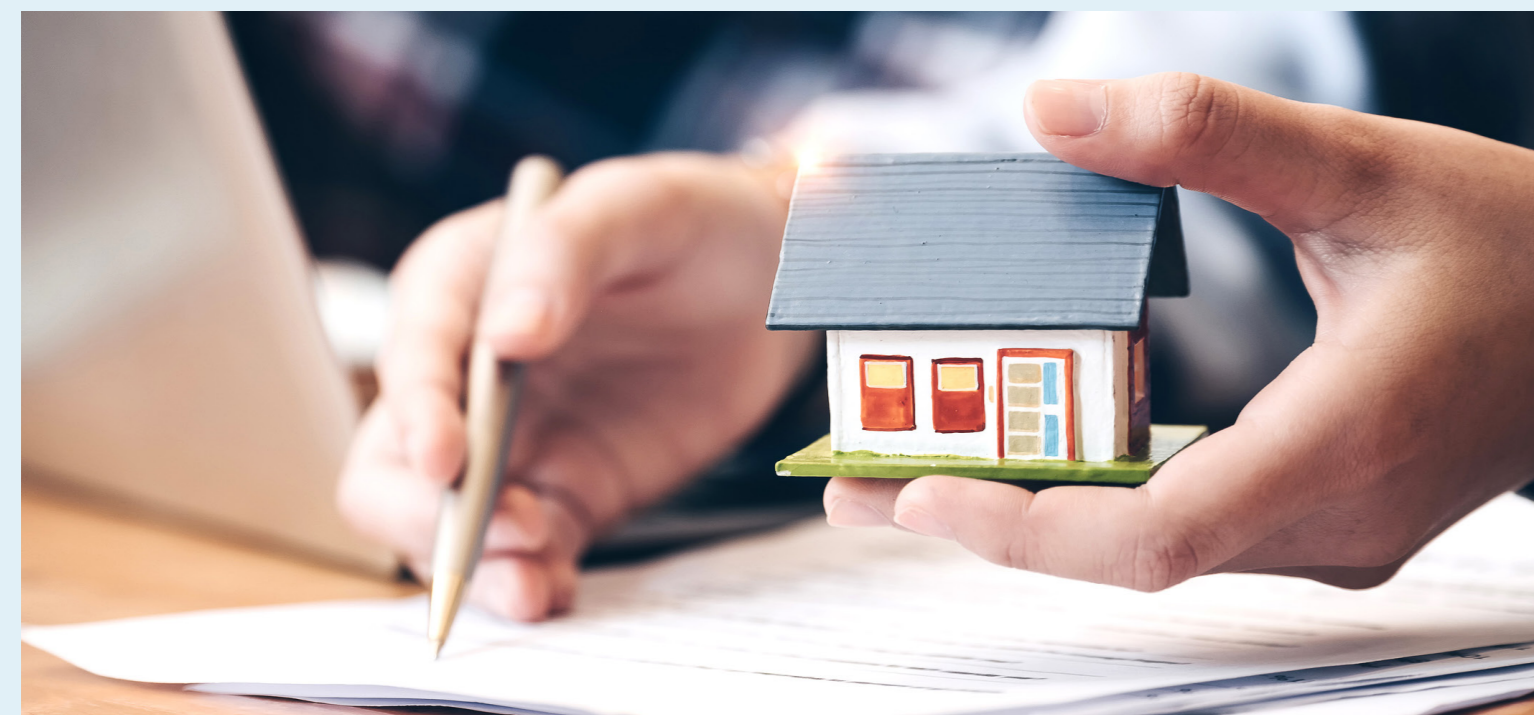
El proyecto, que busca modificar el artículo 6 de la Ley 44 de 1990, advierte que los incrementos máximos del IPU.

"En la mayoría de los municipios del país el valor catastral de los predios es inferior a una quinta parte del valor real", dijo.