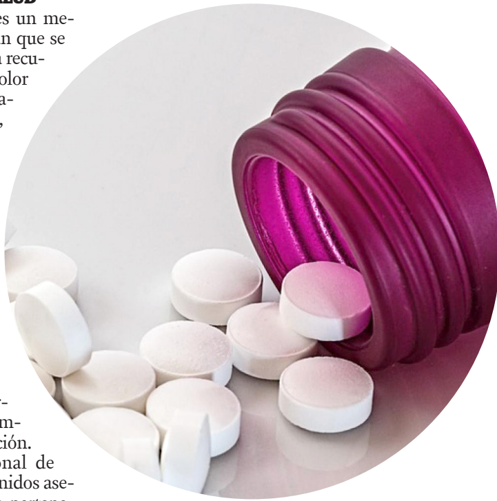
El acetaminofén sirve para aliviar el dolor.

Sin embargo, se debe tener mucha precaución porque su exceso puede generar diversas complicaciones de salud. Los expertos aseguran que tomar demasiado acetaminofén es posible que provoque daños en el hígado, a veces lo suficientemente graves como para requerir un trasplante o causar la muerte.