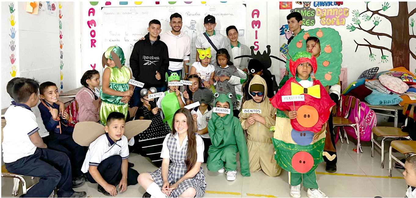
Guadalupe, tierra de saberes ancestrales y educación STEM, se destaca por su enfoque integral que abarca desde la tradición hasta la vanguardia tecnológica.