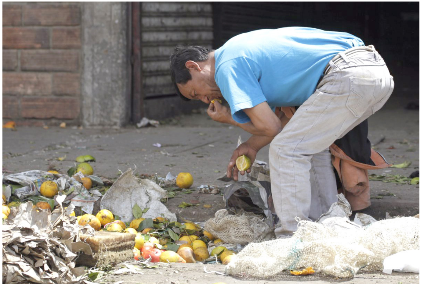
Así está el panorama del hambre y la inseguridad alimentaria en Colombia.

En Latinoamérica, esta problemática se ha recrudecido durante los últimos años, tanto así que unos 43,2 millones de personas pasan hambre en toda la región.