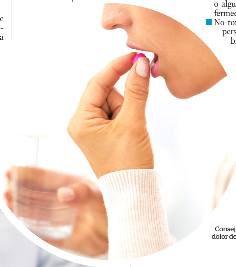
Consejos para liberar el dolor de cabeza.

■ Dejar de tomar la medicación y llamar al médico inmediatamente si se cree que ha tomado demasiado acetaminofén, aunque el paciente se sienta bien.