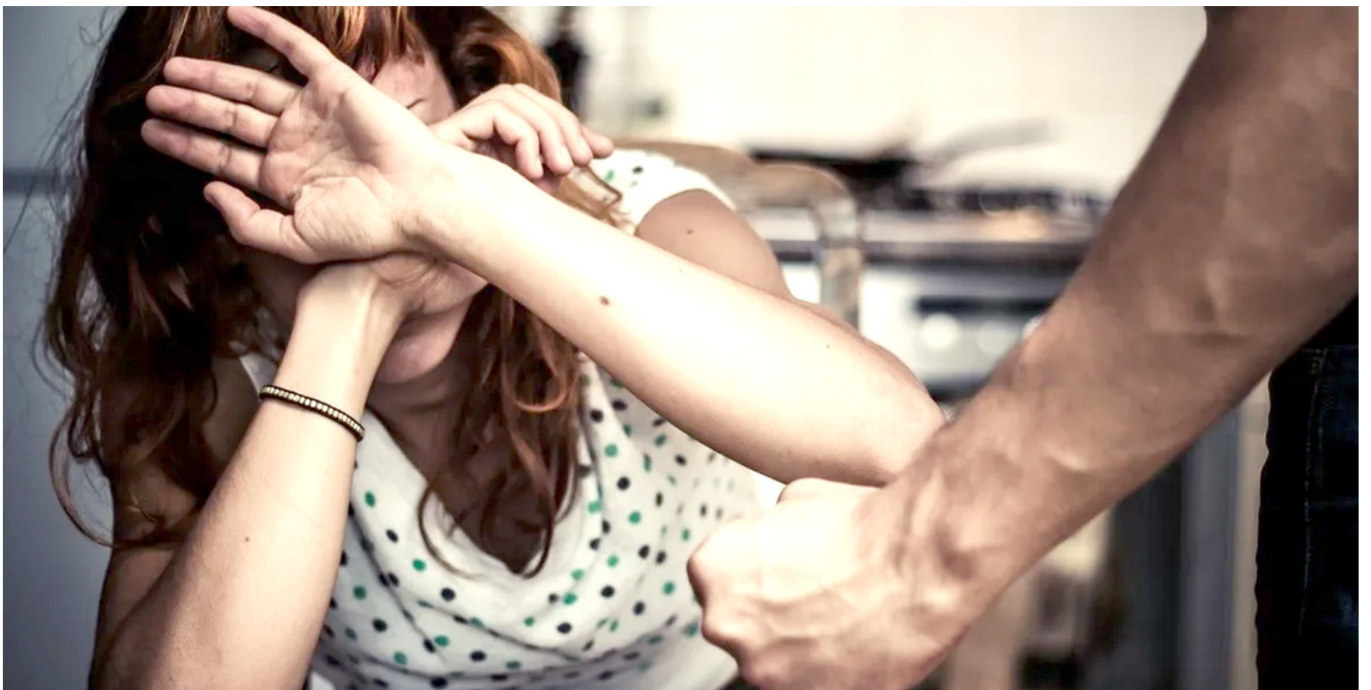
La dependencia económica hacia la pareja, está muy ligada a los maltratos.

Ante el preocupante panorama, el Ministerio Público ha constituido 238 agencias especiales, 114 alertas de priorización y 4.142 alertas que se derivan de los casos de mujeres que son valoradas por Medicina Legal a la Procuraduría, mecanismo que permite generar una alerta al procurador o agente de la personería competente para que intervenga en el caso de forma prioritaria