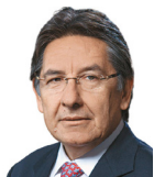
Néstor Humberto Martínez Neira

Colombia ha sufrido con rigor el más infame delito contra la libertad humana: el secuestro. Según el Centro de Memoria Histórica, el conflicto armado ha dejado más de 40.000 víctimas de este crimen atroz, campesinos en su mayor parte. Y no valió el Acuerdo de Paz, ni su condena universal como un delito de lesa humanidad, para que cesara este macabro crimen.