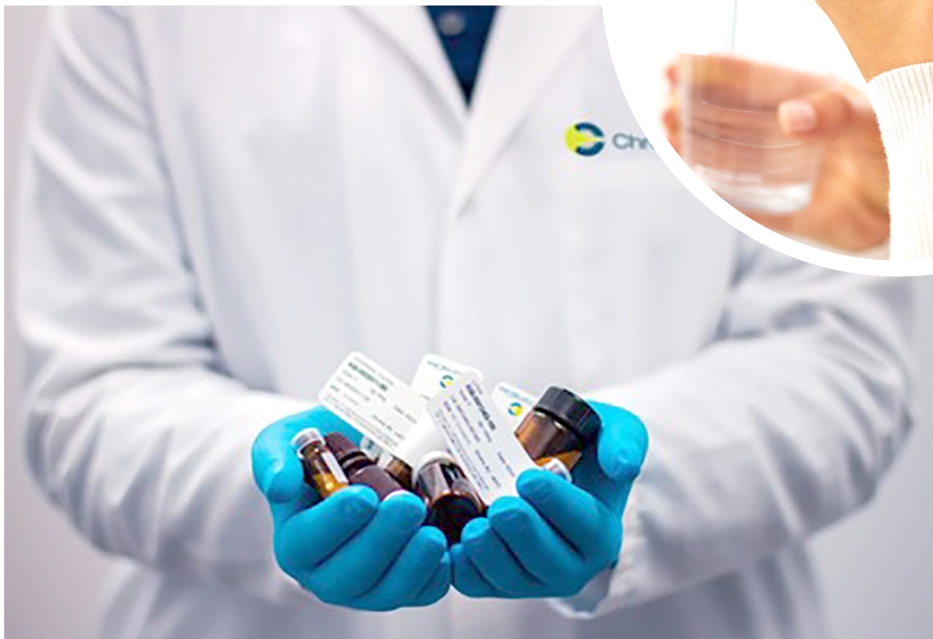
El acetaminofén se utiliza para bajar la fiebre.