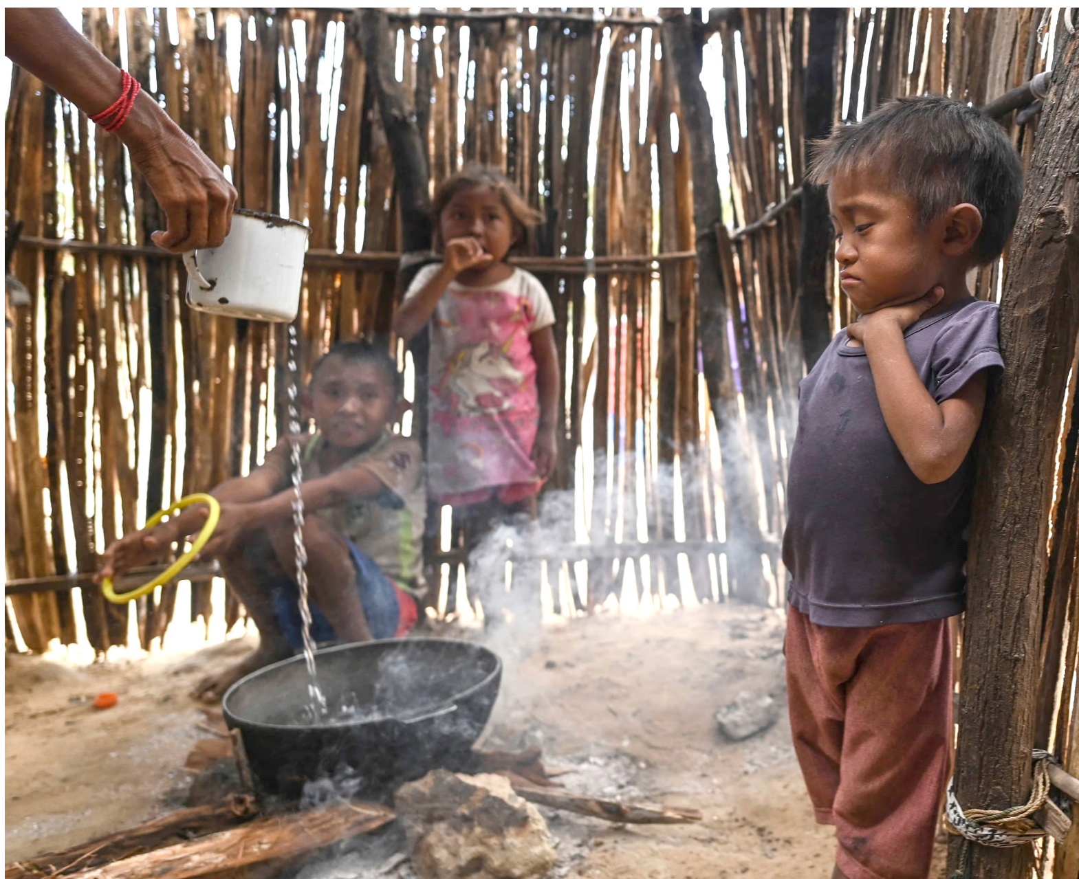
La situación también ha sido motivada por diferentes factores como la desigualdad, la pobreza y el cambio climático, que han revertido al menos en 13 años el progreso en la lucha contra el hambre.

El cambio climático ha generado fenómenos climáticos extre-