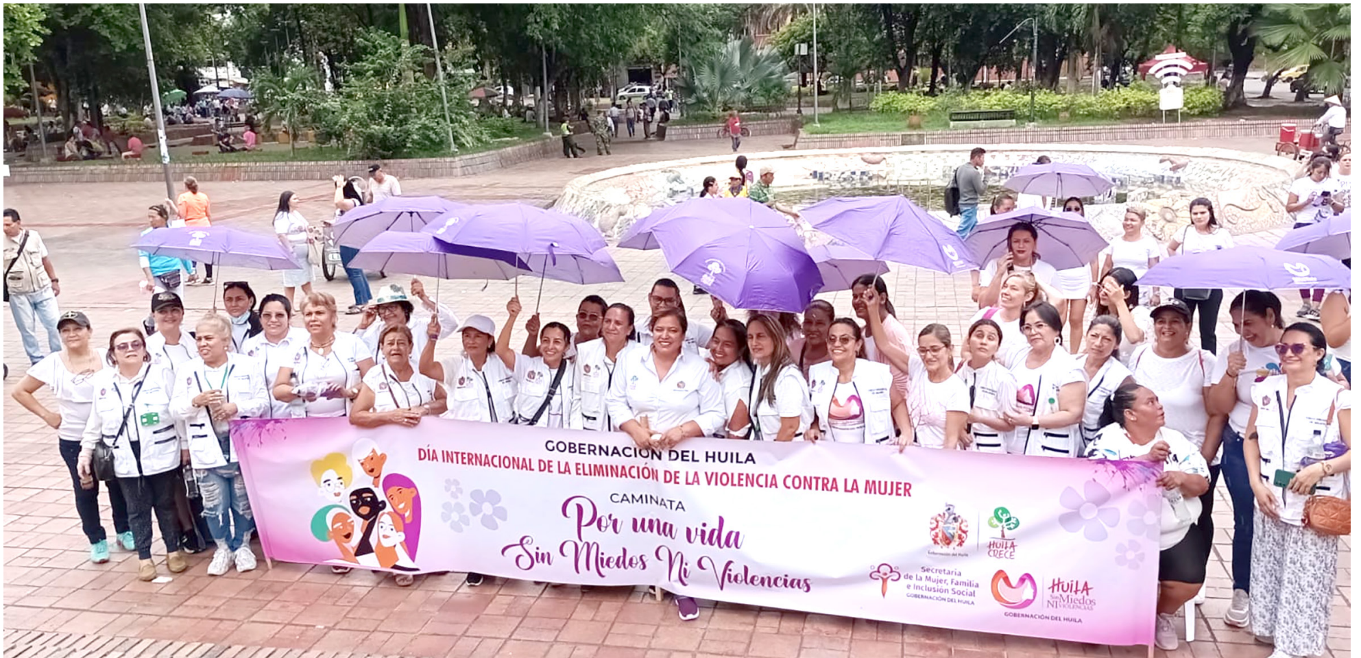
Las mujeres caminaron por una vida sin violencias.