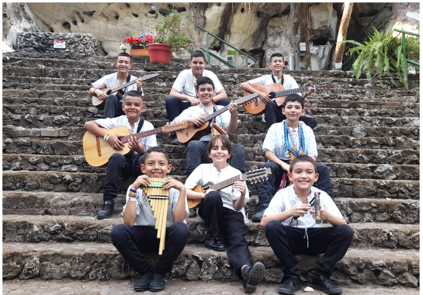
Los menores esperan poder viajar a San Agustín.

Finalmente, después de haber pasado un tiempo en esa pre banda, llegan a la Sinfónica Santa Rosalía.