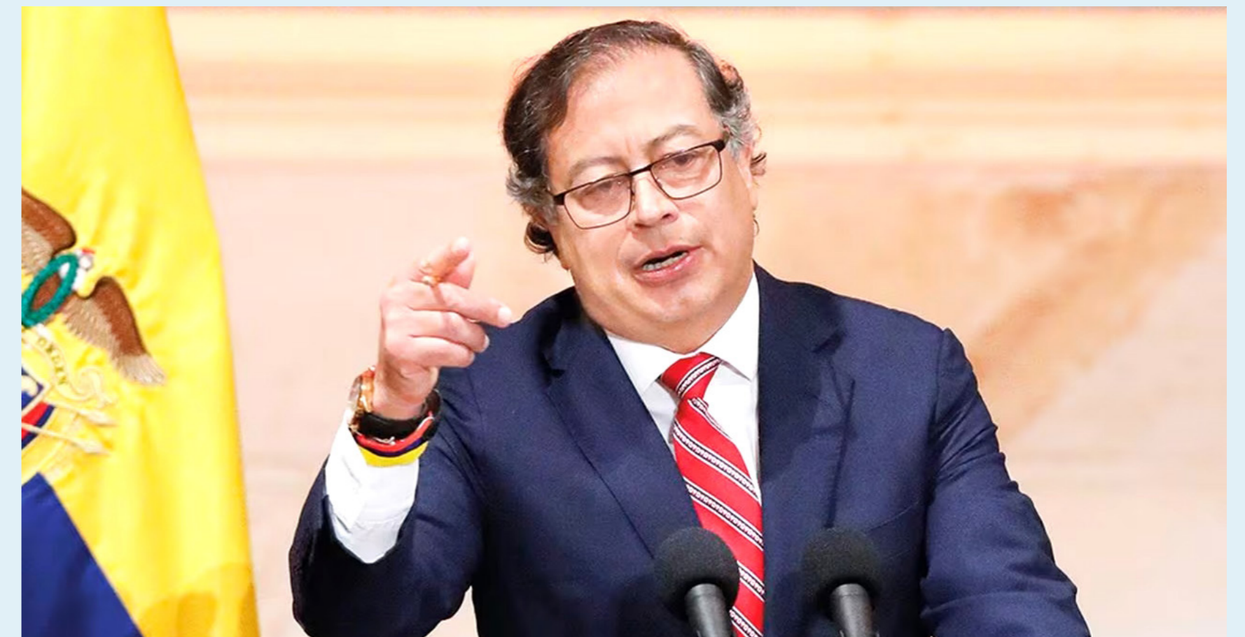
El presidente Gustavo Petro salió a defender el proyecto y le pidió a un medio de comunicación que no mienta más.