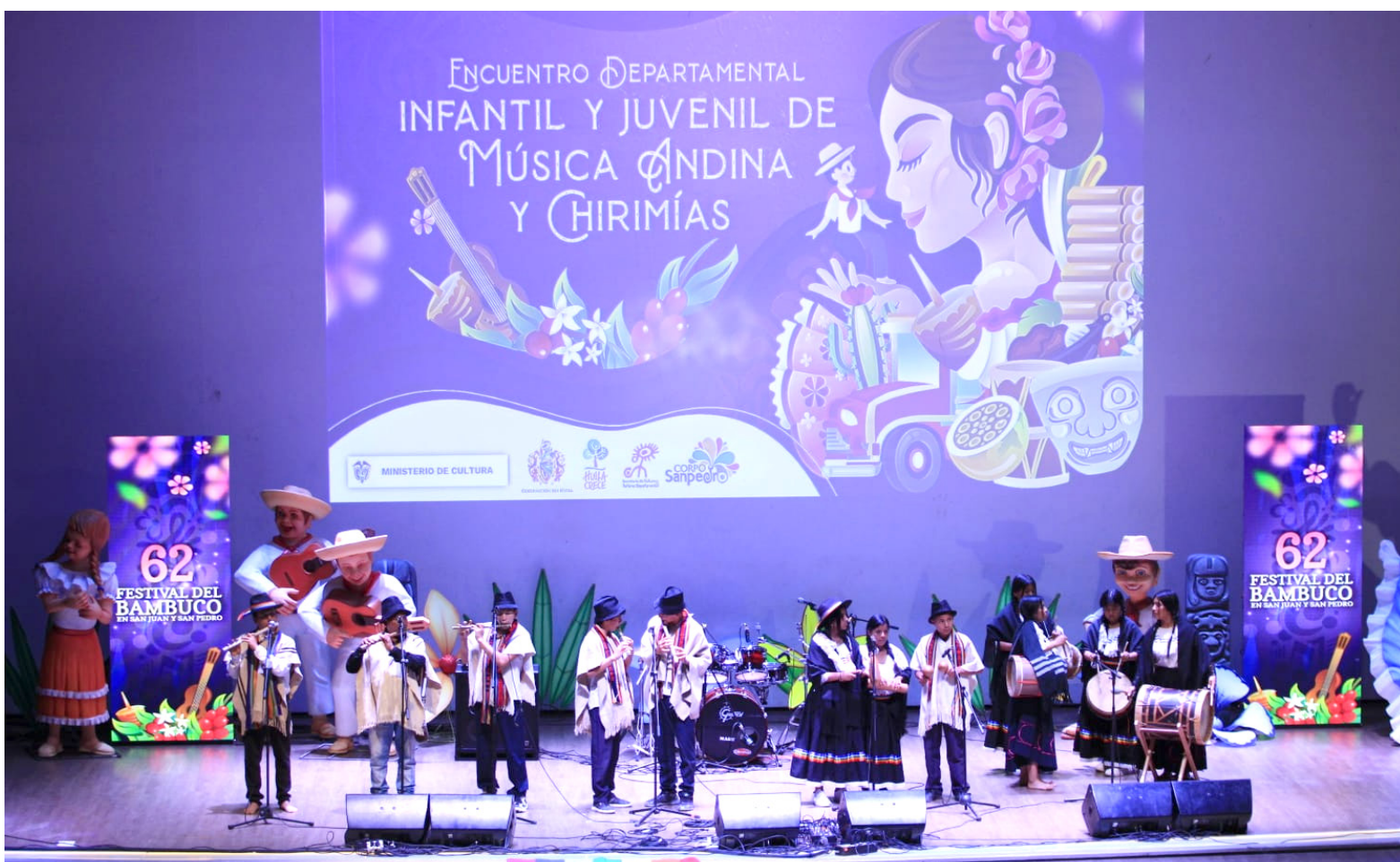
Los niños ocuparon el segundo lugar del Encuentro Departamental de Chirimías y Música Andina Infantil y Juvenil en Neiva.

En la invitación indican: “la finalidad de la presente es, invitarles a participar tanto en el desfile inaugural, como dentro de la programación contemplada para el certamen. Lo anterior con el ánimo de integrar a toda la comunidad alrededor de esta celebración, por lo tanto, deseamos que su agrupación danza folclórica, baile moderno y su comparsa nos acompañen