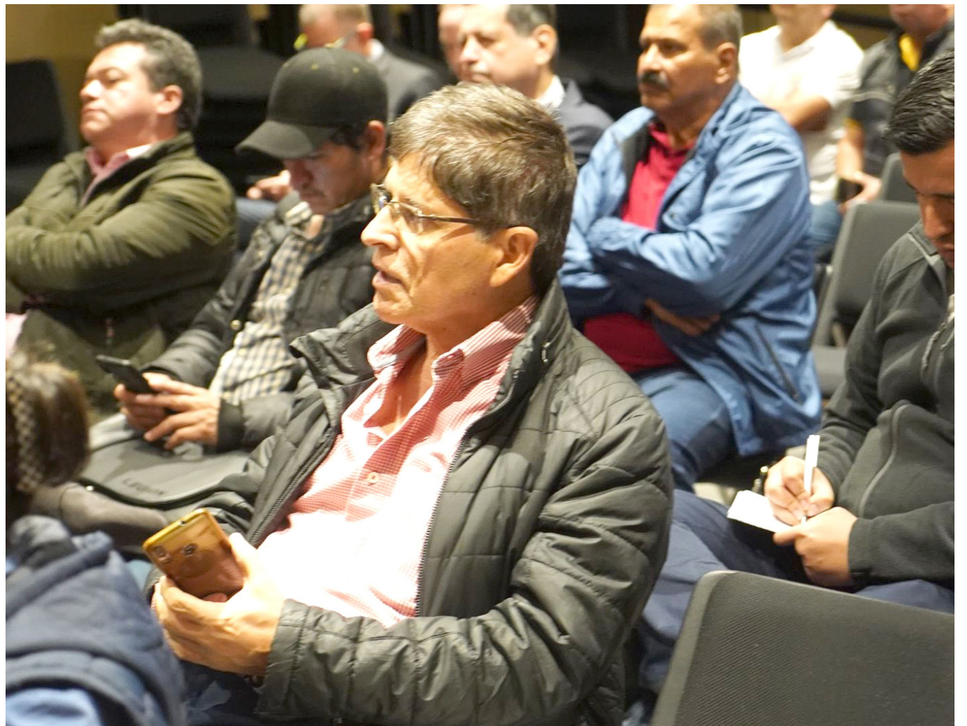
El Ministerio de Agricultura y los caficultores trabajan en una mesa técnica para establecer los costos medios de producción, esenciales para el Fondo de Estabilización de Precios del Café.

A pesar de los esfuerzos, persisten desafíos fundamentales como los créditos exprés y un acuerdo latinoamericano, que se espera sean abordados en futuros encuentros.