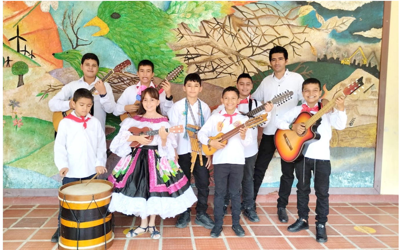
Banda musical Ensamble Andino.