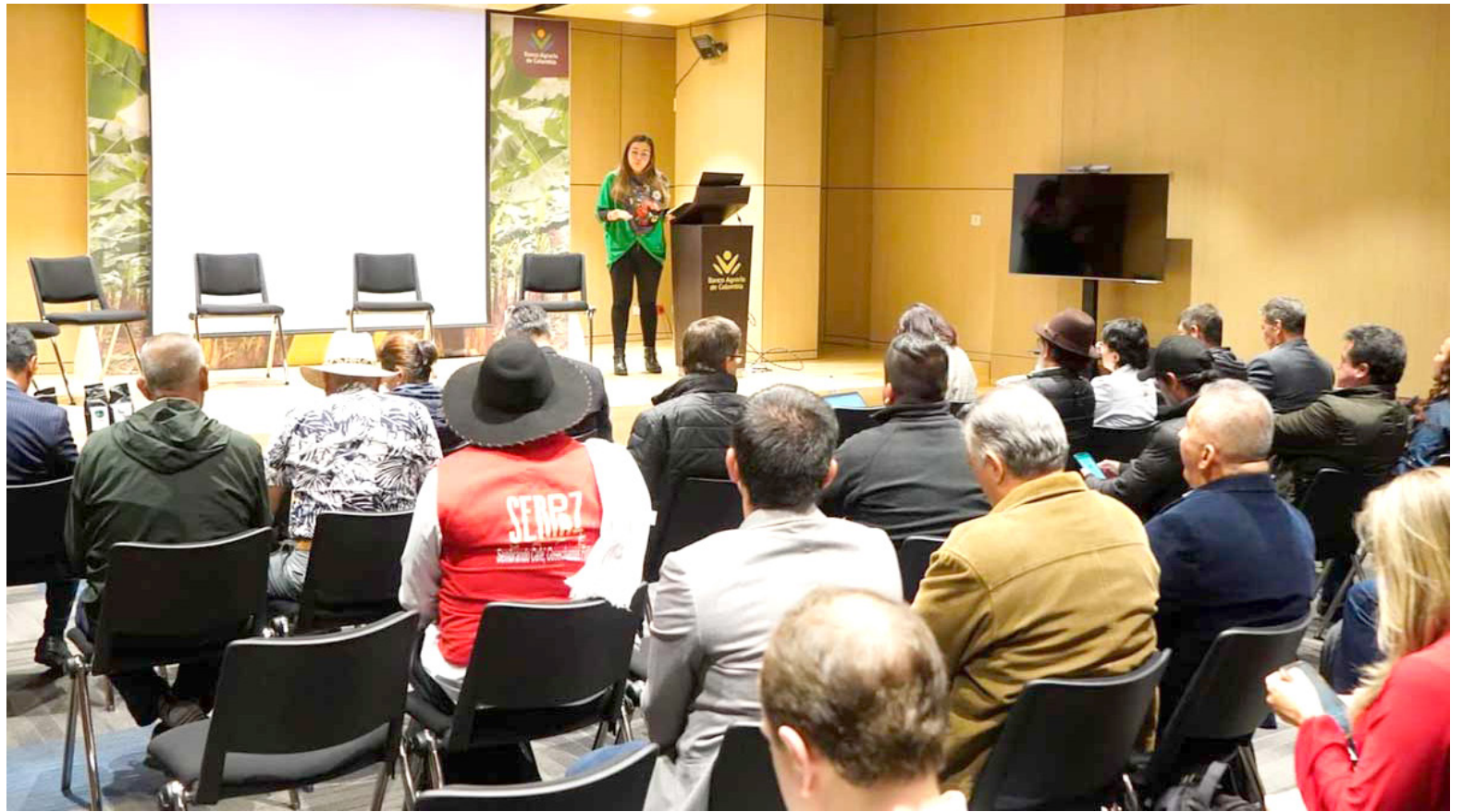
Representantes de caficultores y el Ministerio de Agricultura se reunieron para buscar soluciones ante la crisis del precio interno del café en Colombia.

En respuesta a esta crisis, se llevó a cabo una reunión convocada por los Ministerios de Agricultura y Comercio para abordar la situación crítica que enfrentan los caficultores en el país. La reunión se centró en dos propuestas clave: la activación del Fondo de Estabilización de Precios del Café y la