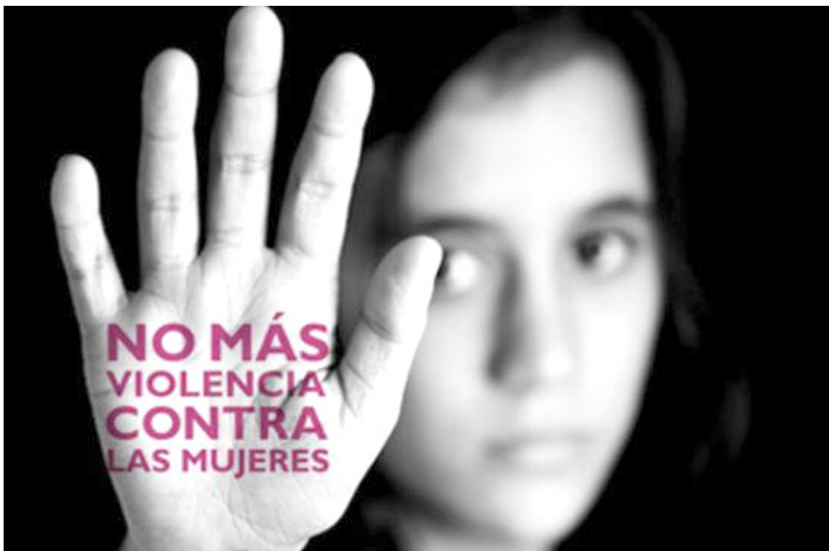
4.100 mujeres (entre adultas y jóvenes) denunciaron haber sido víctimas de maltratos.

También, el Huila cuenta con la Casa Refugio de la Mujer, adonde puede acudir una persona que ha sido violentada, para poder acceder a ella, debe lle-