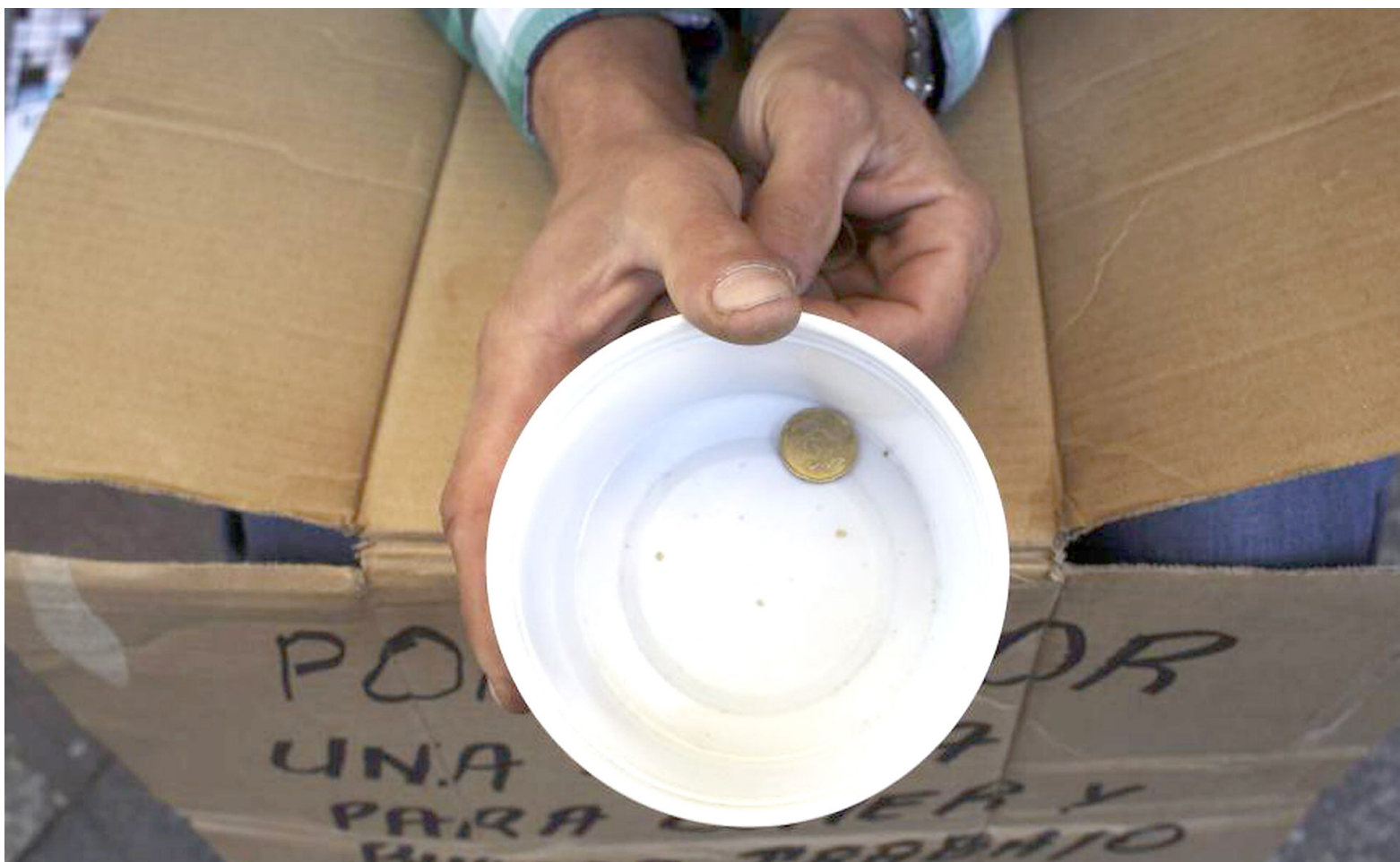
Cerca del 6,6 % de la población colombiana no se alimenta suficientemente o pasa hambre.

El informe revela que Latinoamérica y el Caribe tiene los precios más altos en todo el mundo