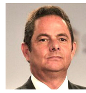
Germán Vargas Lleras.

Ya tuve oportunidad la semana pasada de comentar la paliza política que recibieron el Pacto Histórico y el presidente Petro el 29 de octubre. De allí para acá, solo errores y provocaciones, como la publicación de un desconcertante mapa electoral en donde se muestra triunfador en buena parte del territorio nacional.