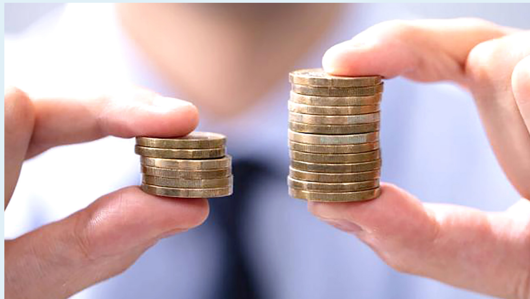
El proyecto de ley dice que cuando se actualice el avalúo catastral se le ponga un tope a la posterior subida del impuesto predial que hacen los municipios.

El ministro de Hacienda, Ricardo Bolilla, también defendió la iniciativa señalando las ventajas que tendría el definir los límites máximos para el incremento del predial, diciendo que es "un alivio a los contribuyentes cuando los municipios le liquiden el impuesto predial".