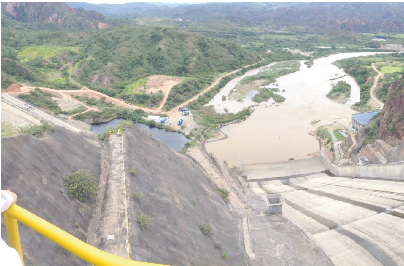
Las altas temperaturas, combinadas con las adversas condiciones de pesca en las aguas abajo de la represa El Quimbo, están afectando gradualmente las actividades de los pescadores.

La escasez de agua en el embalse de Betania pone en peligro la subsistencia de más de 300 pescadores artesanales en Yaguará, quienes claman por ayuda urgente de las autoridades locales y departamentales.