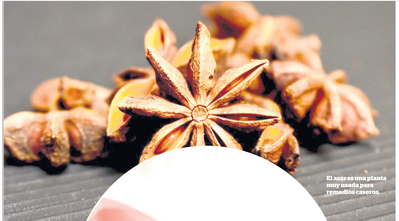
El anís es una planta muy usada para remedios caseros.

Con propiedades antibacterianas y anti-fúngicas, el anís estrellado alivia la congestión y limpia las vías respiratorias. Y el té de anís estrellado es muy recomendado para personas gripadas o resfriadas, inclusive, diversos jarabes y remedios se hacen a partir de esta planta, como el Tamiflu.