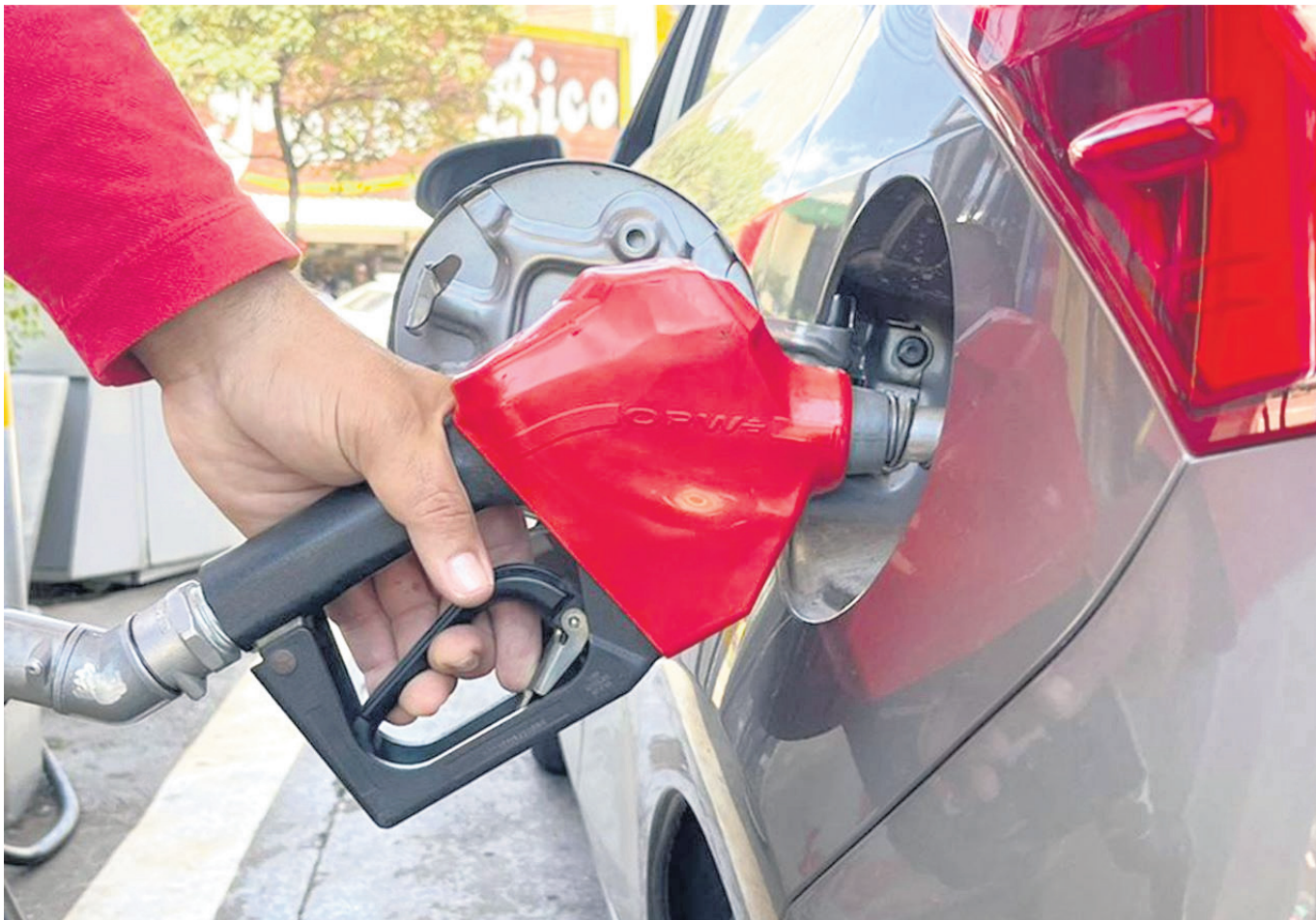
A lo largo de su historia le ha costado a la nación aproximadamente $100 billones.