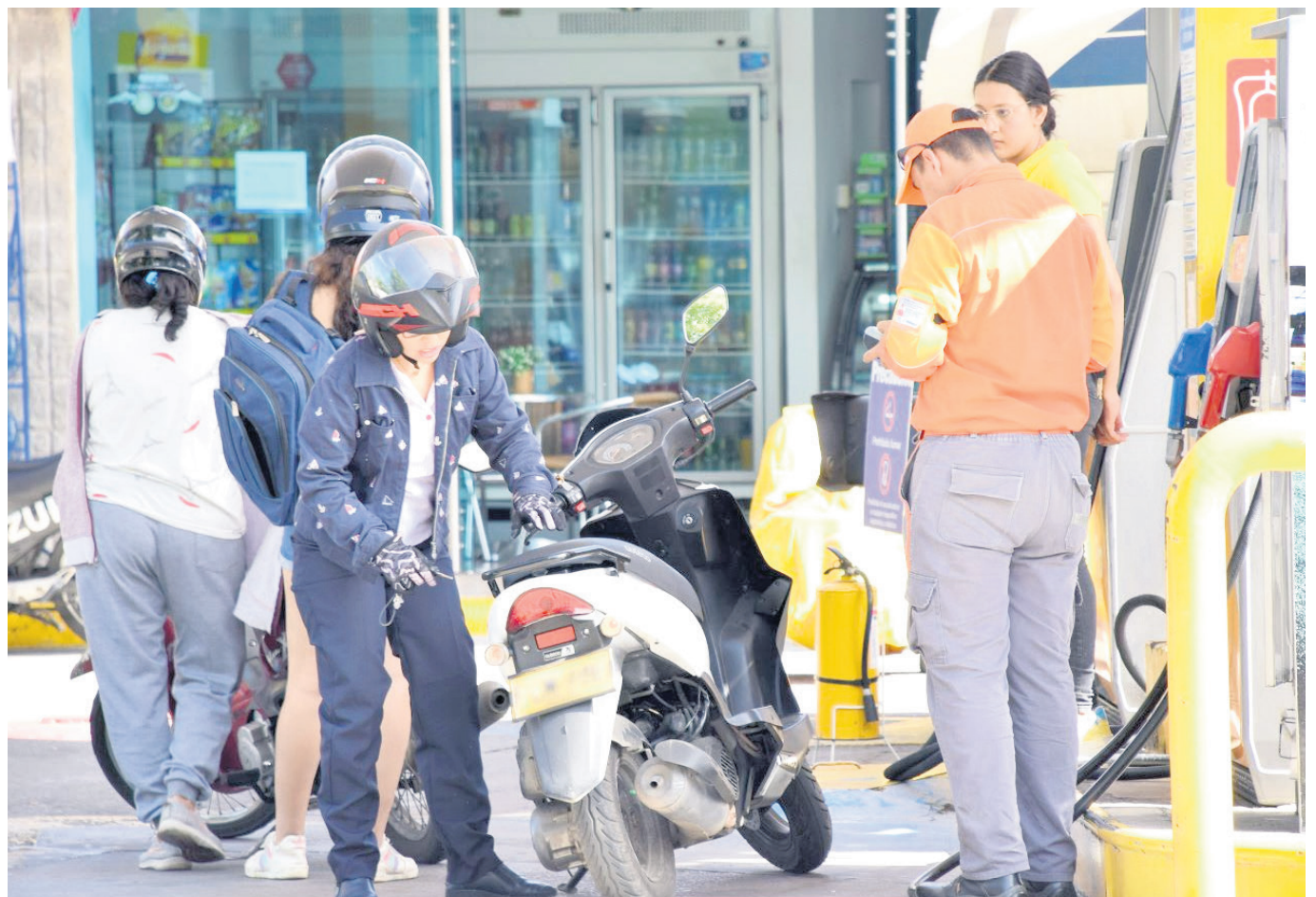
La Contraloría General de la República advirtió sobre los déficits que ha presentado.

El mal funcionamiento del FEPC impacta directamente en la estabilidad financiera, la calificación y la deuda de Ecopetrol.