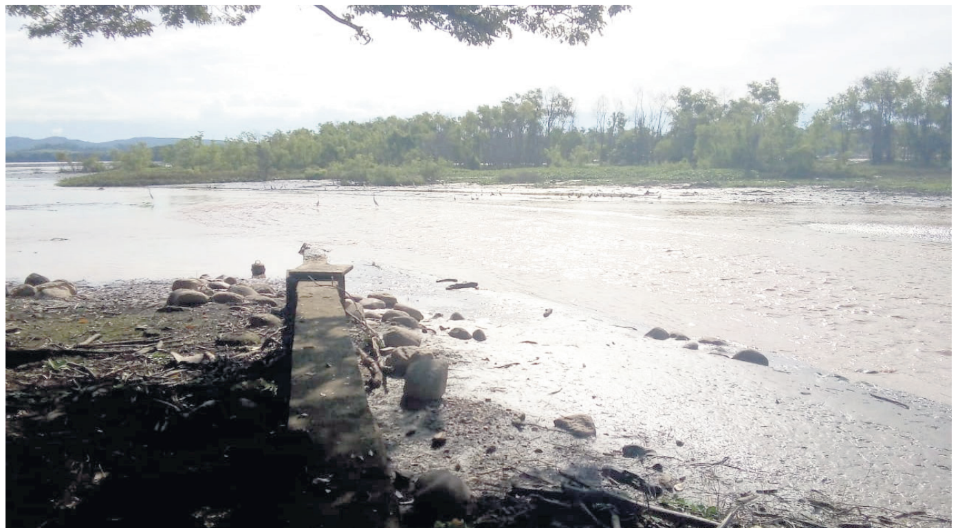
El alcalde de Yaguará, Juan Carlos Casallas, hizo llamado a la institucionalidad para abordar la crisis alimentaria que enfrentan los pescadores artesanales debido a la falta de agua en el embalse de Betania.

La construcción de la represa El Quimbo y la disminución del caudal del río Magdalena han reducido drásticamente las capturas de pescadores en Puerto Seco, generando preocupaciones sobre la seguridad alimentaria y la falta de apoyo gubernamental.