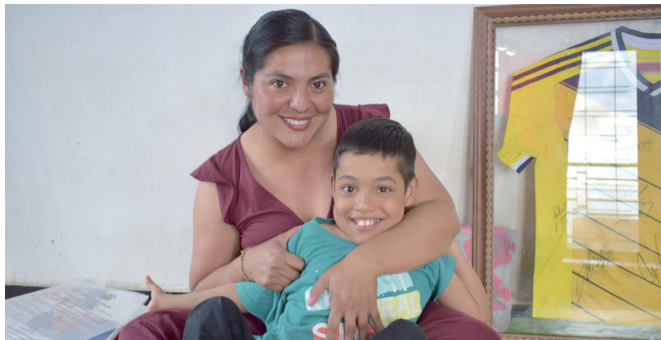
¡Todos podemos ayudar al pequeño Nicolás!