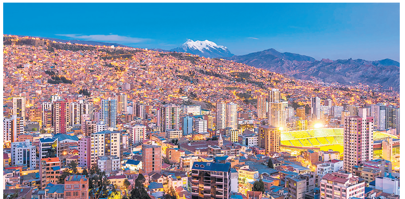
La cirugía se hará en Bolivia.

De igual manera, se espera que las personas de buen corazón, que deseen colaborar para que el pequeño Nicolás y su progenitora, puedan viajar a Bolivia, se pueden comunicar con ella al número de celular: 317 377 65 13.