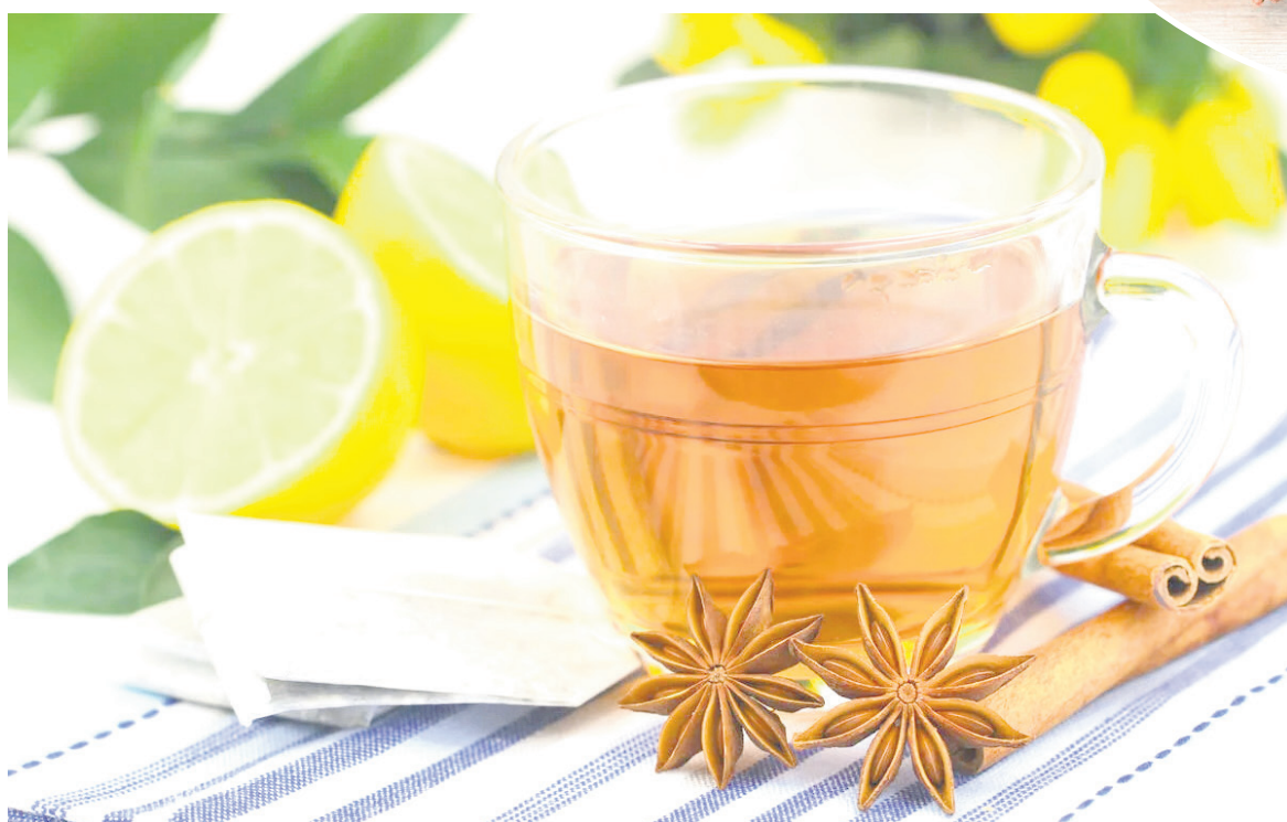
A la infusión de anís también se le puede agregar limón.