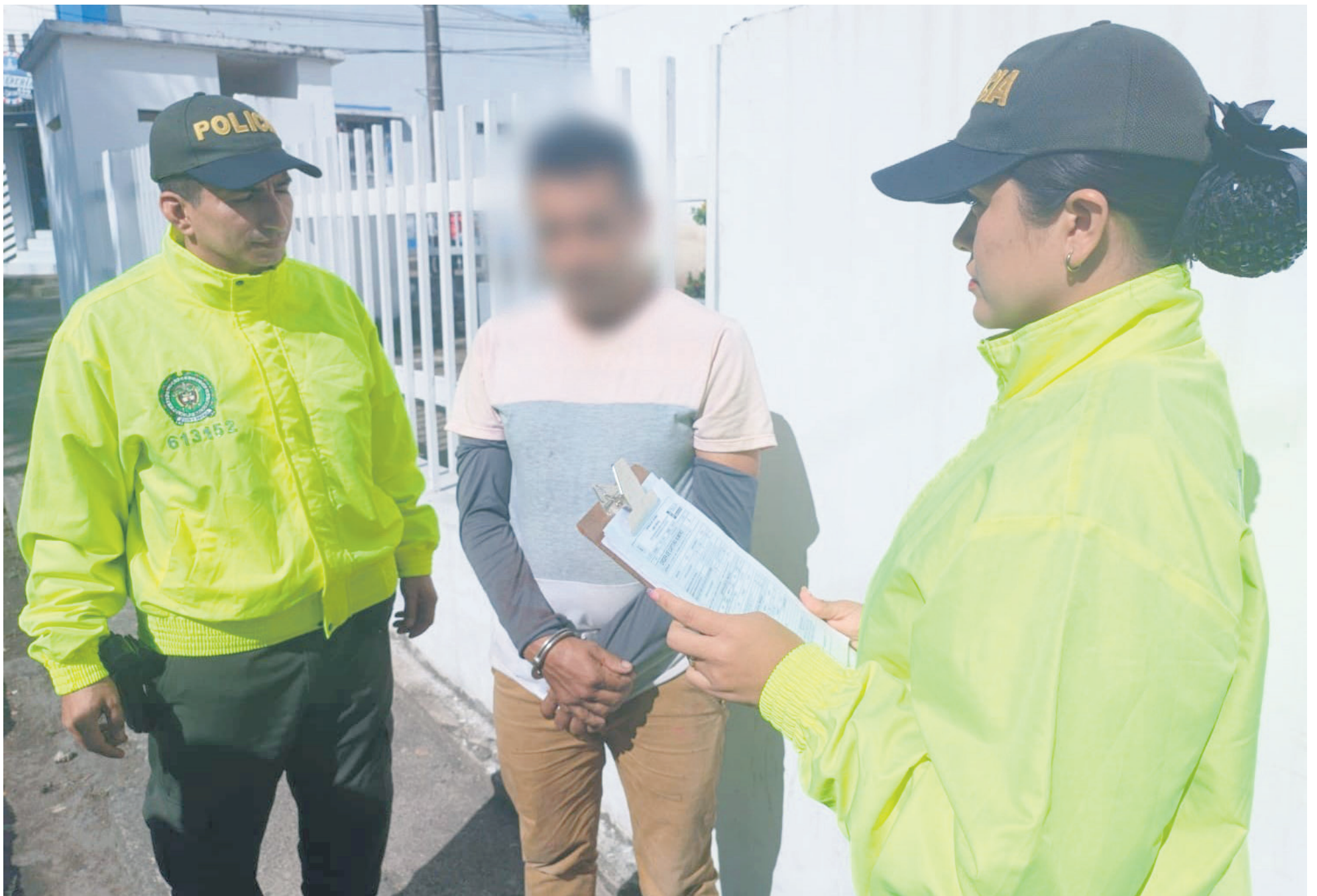
Detenido en Gigante por abuso sexual.

■ Unidades de la Policía-Huila, denunciaron un aberrante hecho, donde una mujer de 20 años de edad, tuvo la fuerza necesaria para denunciar a su propio padre por abusarla sexualmente, desde la edad de ocho años de edad. Las autoridades judiciales, iniciaron la respectiva investigación que dio con la captura de la persona en mención, que fue presentado ante un juez de control de garantías.