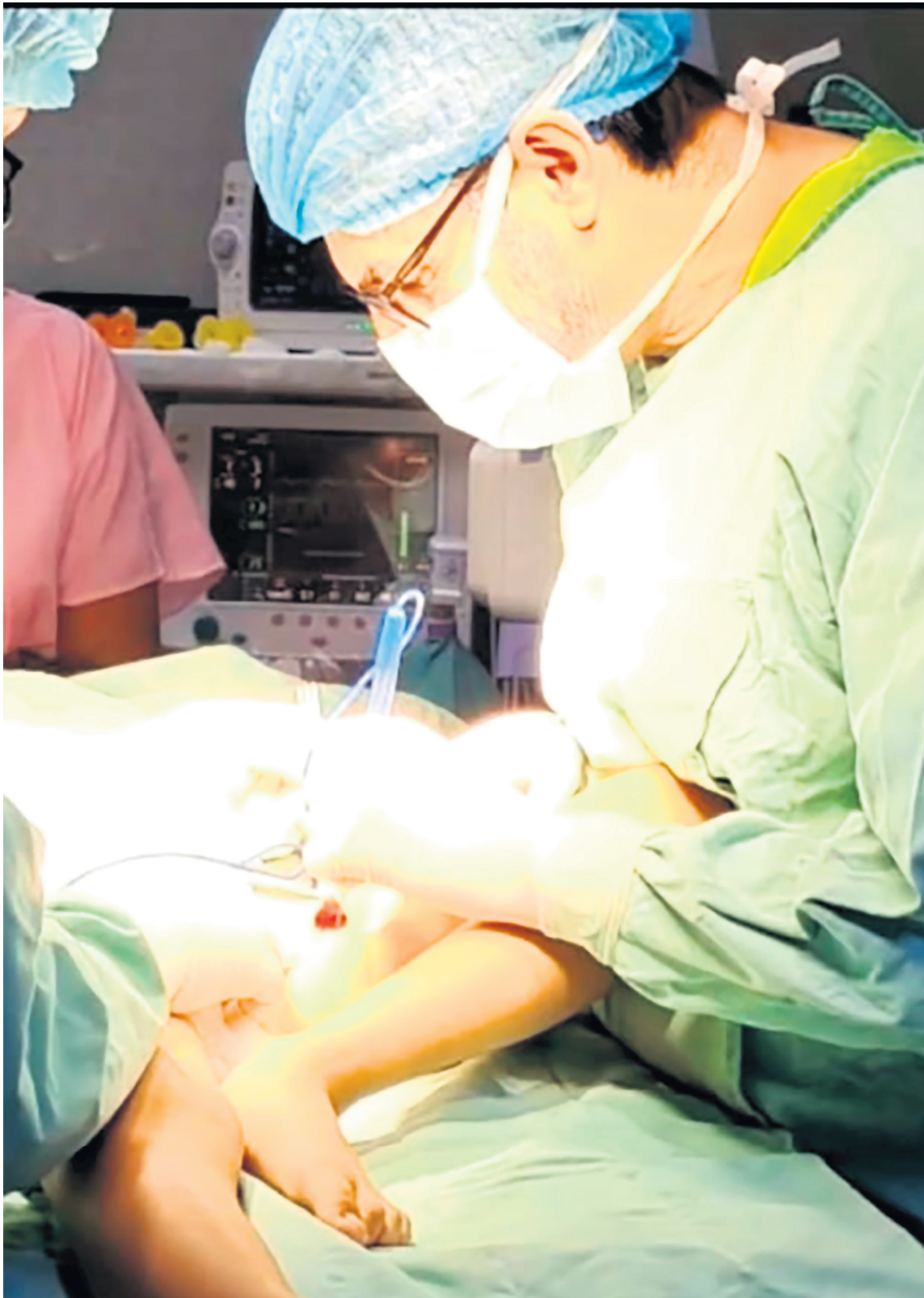
Al menor le van a operar los brazos y piernas.