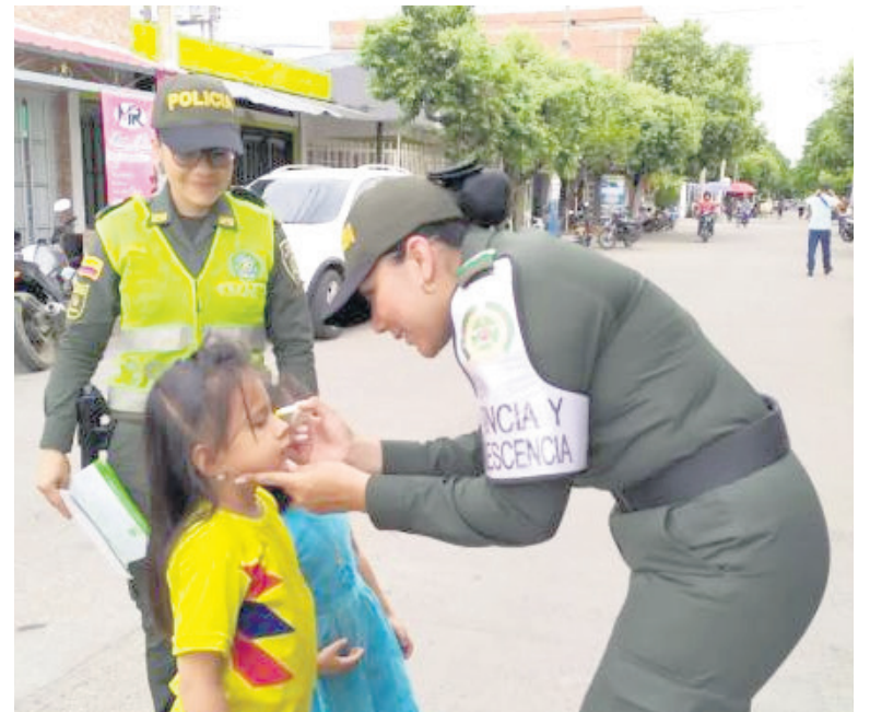
La realización de campañas, permite sensibilizar a los niños.

Para la muestra un ‘botón’, como dicen las ‘abuelas’. Unidades de la Policía-Huila en atención a una llamada telefónica al dispositivo PDA del cuadrante 4 sobre un caso de violencia intrafamiliar en el barrio Villa Consuelo, se logró la captura de un hombre de 51 años de edad, el cual, fue señalado por su pareja sentimental de agredirla verbal, física y psicológicamente.