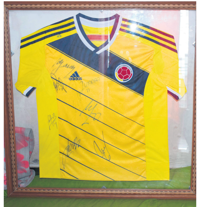
Uniforme de la Selección Colombia, autografiado.

grama Cirugía Mínima Invasiva Multinivel Parálisis Cerebral Infantil Espástica, quien tras conocer los pormenores del caso, le solicitó unos videos con la finalidad de ver el estado de salud del paciente y la movilidad que tiene. “Nos dijo (el galeno) que el niño tenía mucha probabilidad que mejore, porque trata de hacer las cosas por sí mismo”, agregó la madre.