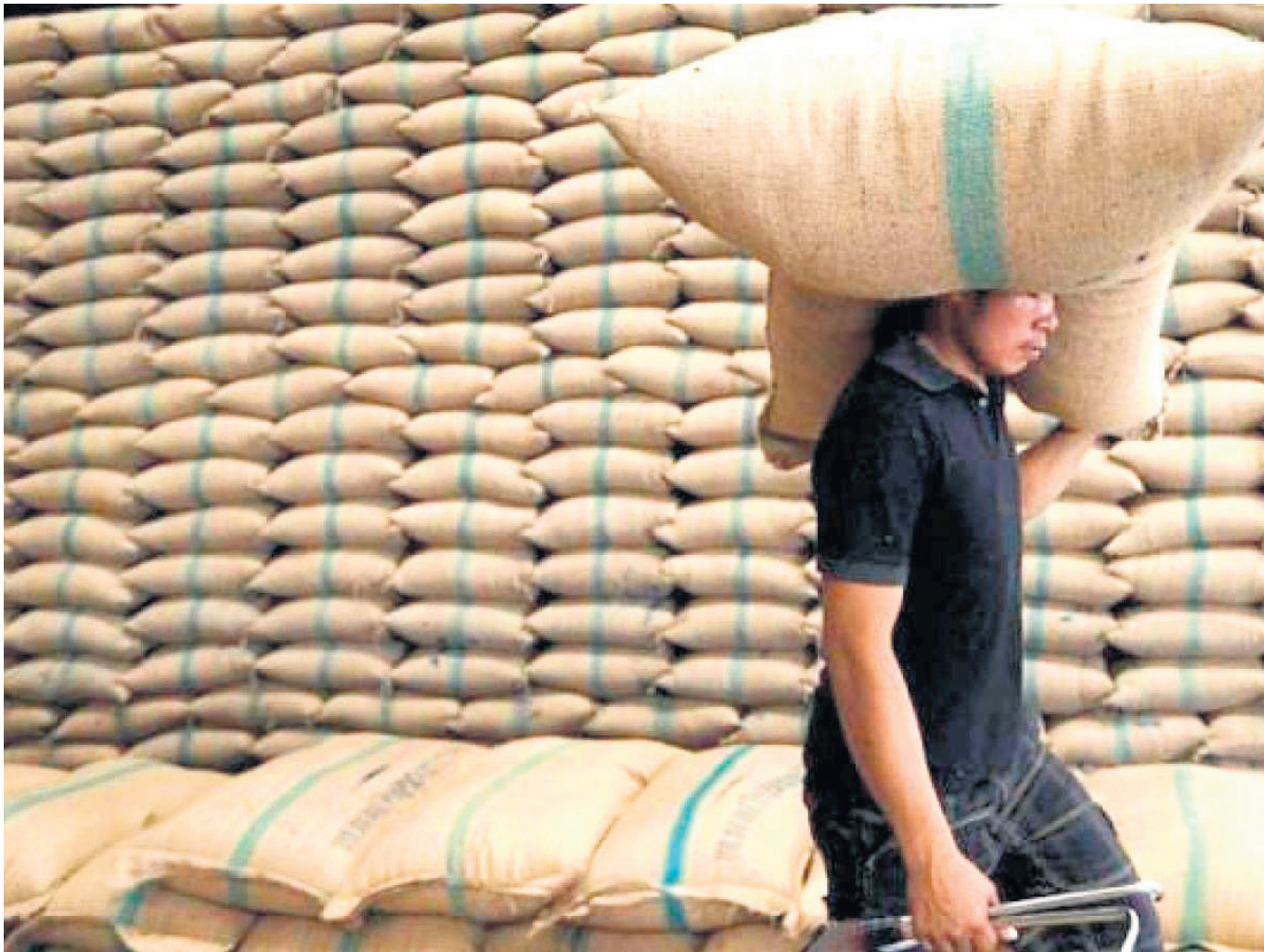
Los arroceros hacen un llamado a las autoridades para encontrar soluciones que protejan la producción de arroz en la región.