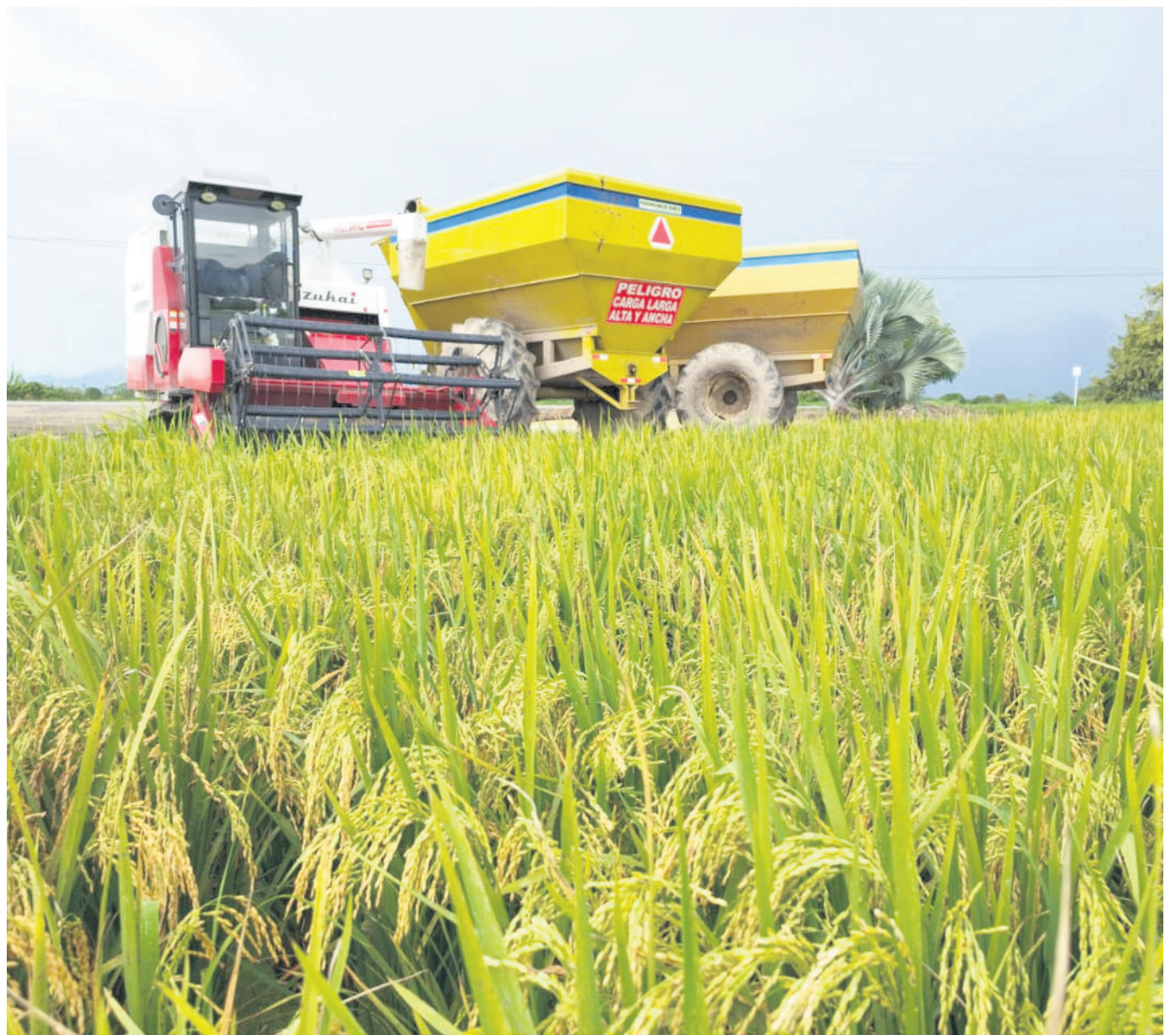
La venta de tierras agrícolas para proyectos de construcción amenaza la disponibilidad de tierras para la agricultura en el departamento del Huila.

Los agricultores de arroz en el Huila se ven afectados por la disminución del caudal de ríos, el aumento de los costos de producción y la amenaza del Fenómeno del Niño.