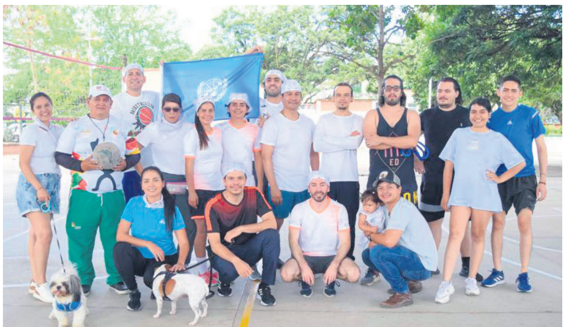
Música, danza y juegos clásicos en el Encuentro Juntanzas en familia por la paz. Alrededor de 150 personas, entre familias y organizaciones se dieron cita este sábado para disfrutar de una jornada deportiva y cultural con motivo de la conmemoración del Día Nacional de los Derechos Humanos.