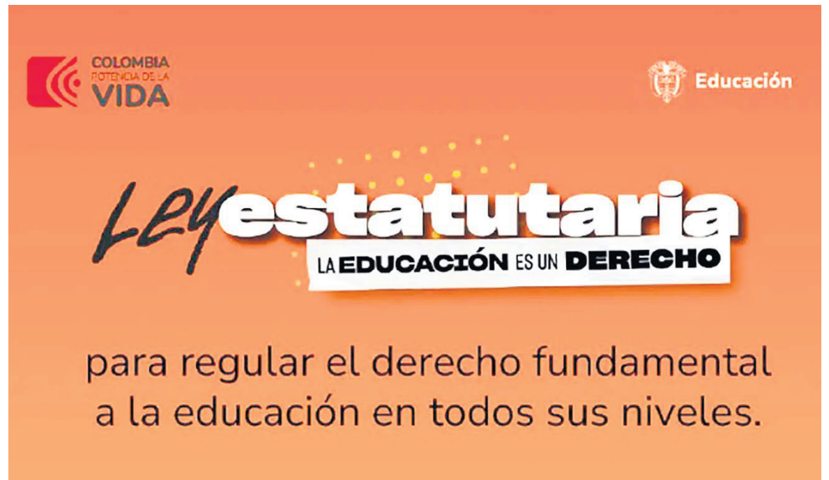
La ministra Aurora Vergara y su reforma a la educación.

La iniciativa busca regular el derecho fundamental en todos sus niveles y que el sistema educativo sea abierto, dinámico, incluyente, solidario, cooperativo y participativo