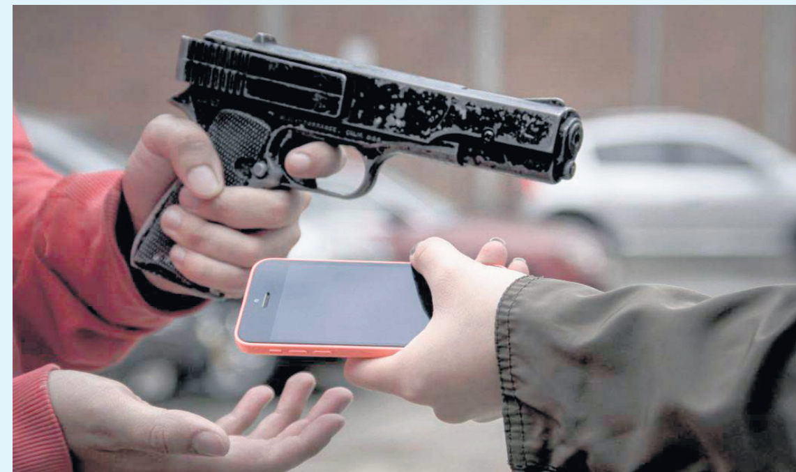
De cuatro hasta nueve años puede pagar una persona por cometer este tipo de hurto.

Este año el común denominador es que el arma que utilizaron los victimarios fue la corto punzante, mientras que el año anterior predominó el arma de fuego. El mes de enero representó 104