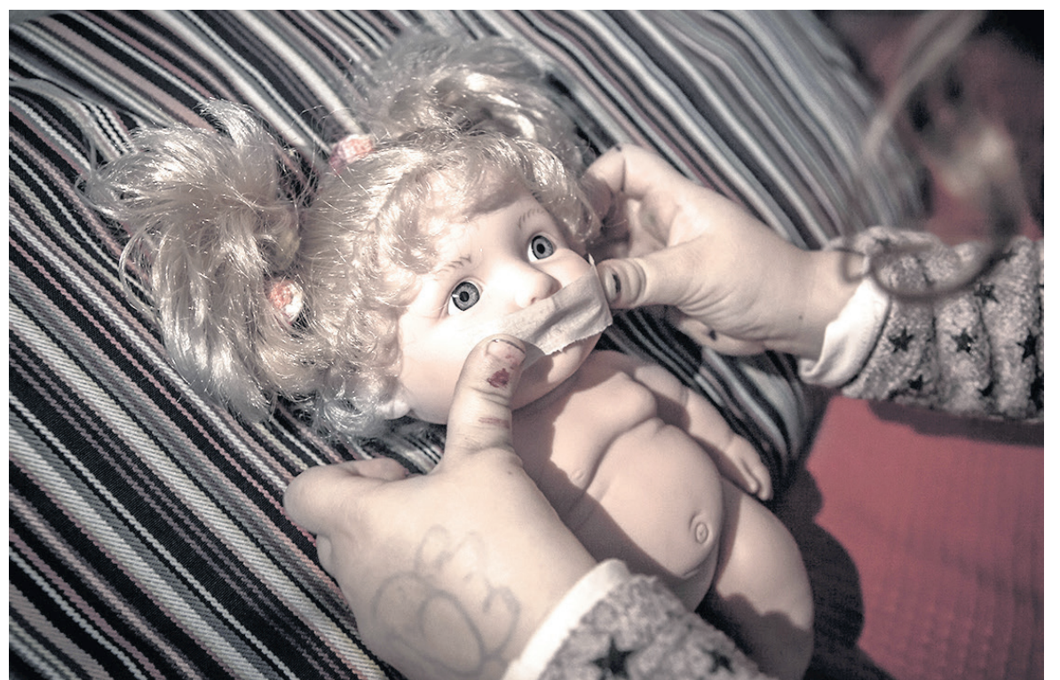
Una niña fue abusada desde los 8 años de edad.