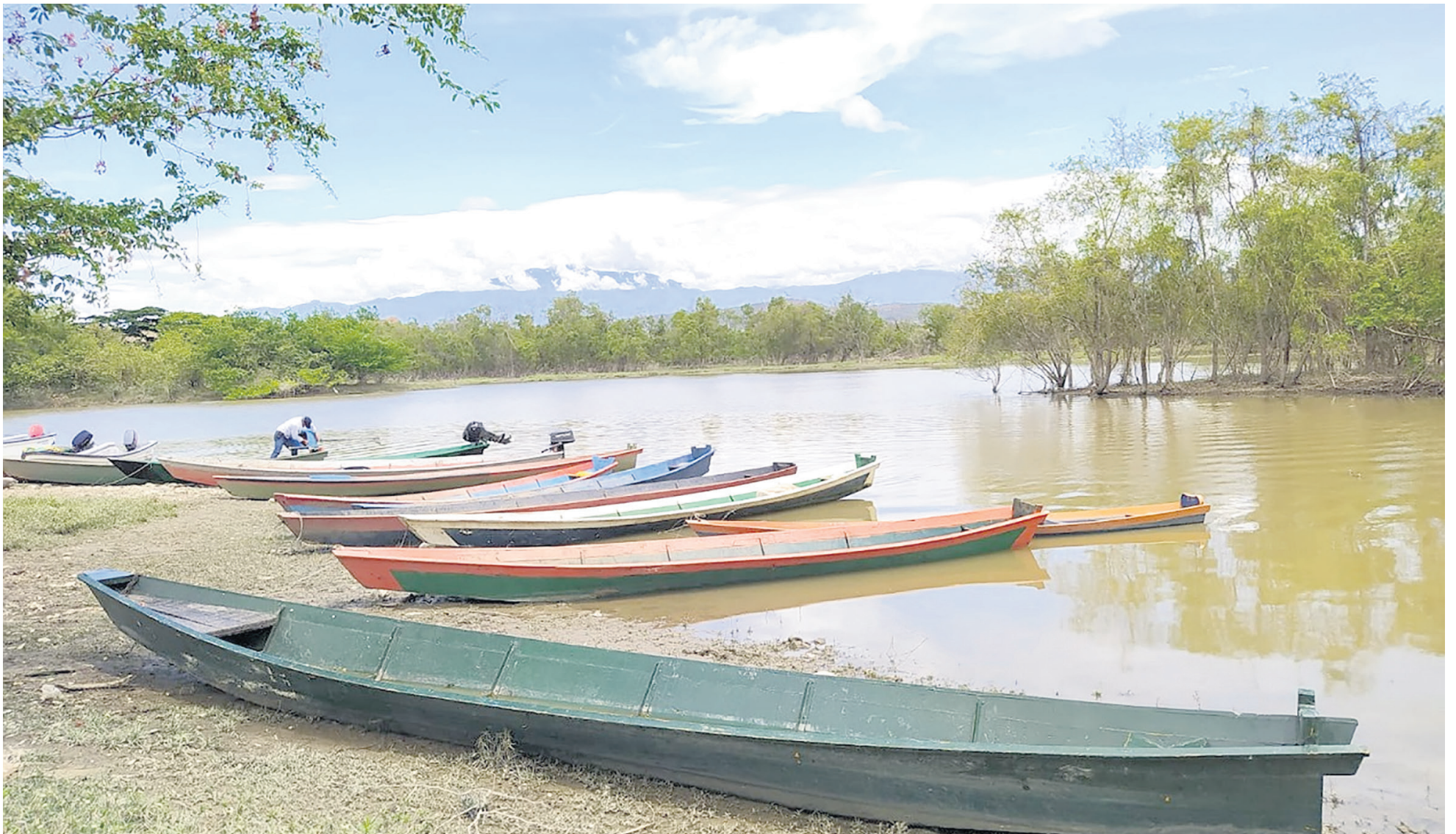
En Yaguará los pescadores artesanales, tienen que caminar más de un kilómetro para llegar a sus embarcaciones en Yaguará.