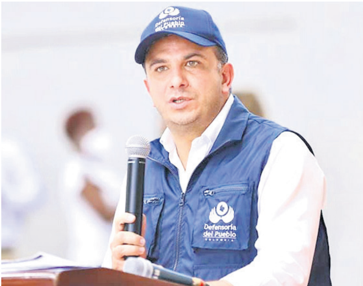
Carlos Camargo, defensor del Pueblo.

las últimas horas, se detuvo a un sujeto de 43 años de edad de profesión ebanista, quién habría abusado de su hija biológica desde que tenía 8 años de edad. No nos enorgullece capturar personas, por estos delitos y lo digo, porque debía ser cero capturas por este tipo de eventos, sin embargo, corresponde a nuestro actuar”.