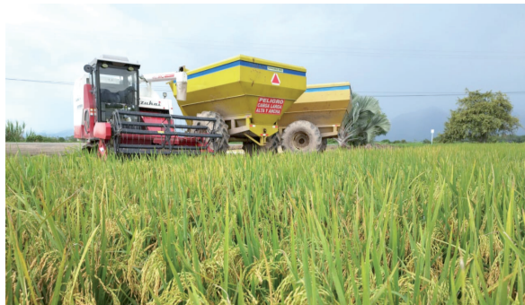
Preocupación en el sector arrocero