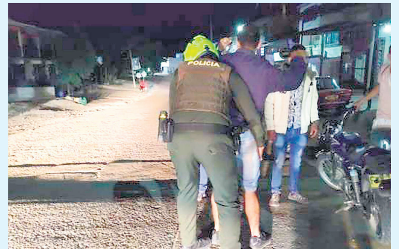
Hay gran zozobra entre los neivanos por este delito de hurto.

“En este tema que nos encontramos ocupados las 24 horas, hemos encontrado lo siguiente