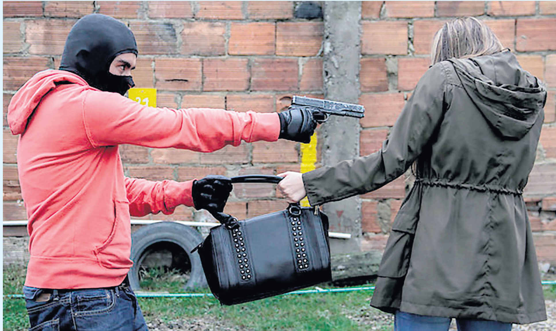
Los casos registrados de hurto a personas fue de 2 622 en 2022; mientras que para 2023, van solo 1002 registros.

■ Aunque las cifras muestran una reducción leve, la sensación de inseguridad crece. 1 200 hombres protegen la ciudad de 400 mil habitantes. Faltan CAI en la capital.