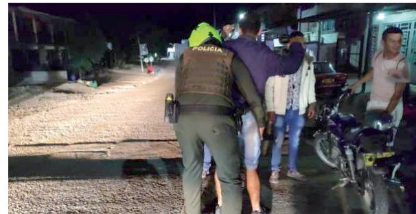
Hurtos en Neiva: sensación de inseguridad y descontrol