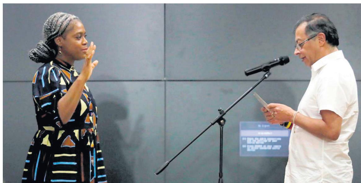
Gustavo Petro y Aurora Vergara

El Estado —según el documento— “garantizará en forma progresiva el derecho fundamental a la educación superior de acuerdo con la regulación para este nivel, reconociendo además las cualificaciones y saberes. Las escuelas normales superiores tendrán un régimen especial que se expedirá con posterioridad a la entrada en vigencia de la presente ley”.