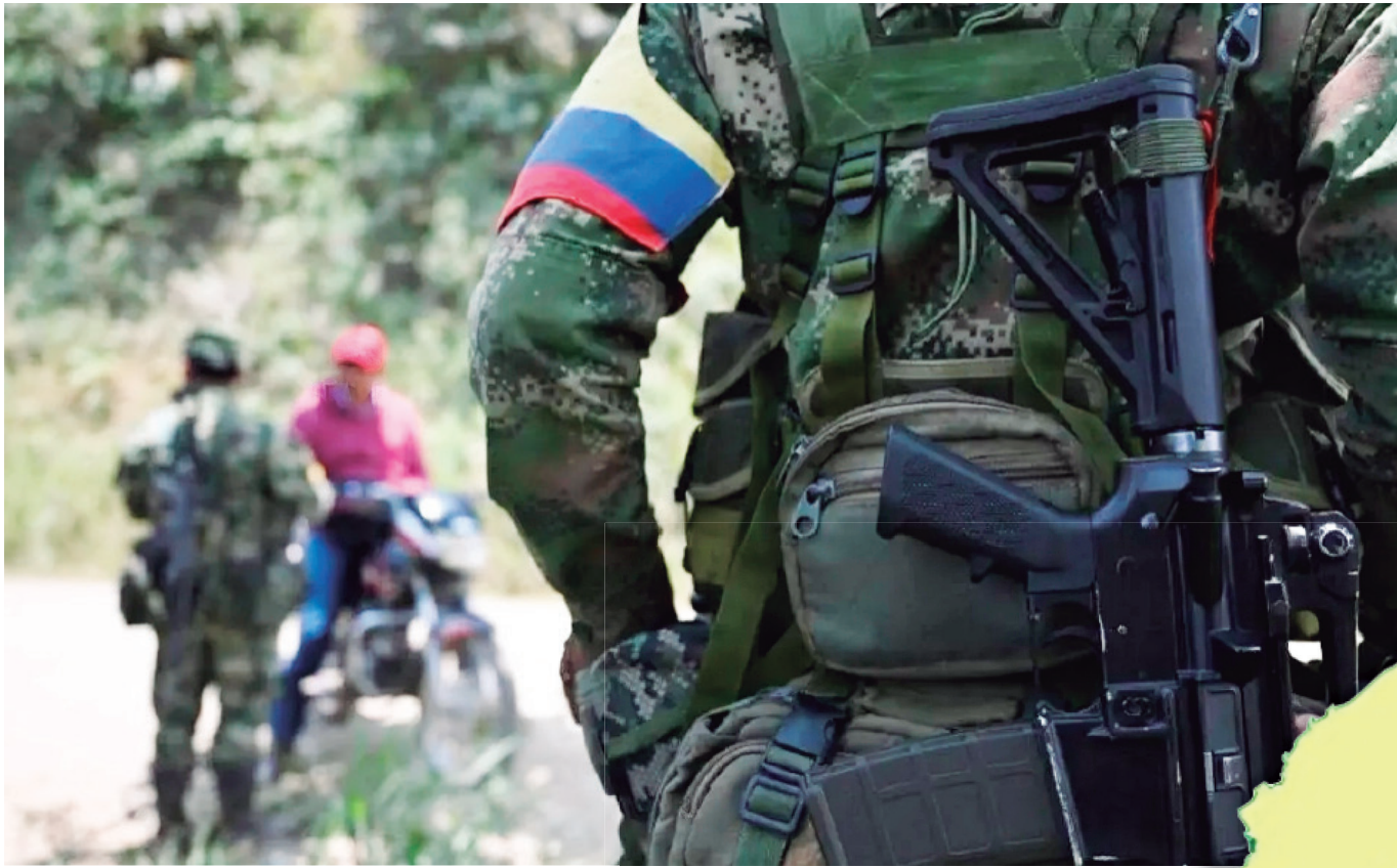
Los 'armados' hacen control social.

entonces la georreferenciación de estos grupos, dificulta el actuar de las Fuerzas Militares para salvaguardar a los huilenses”, denunció la abogada.