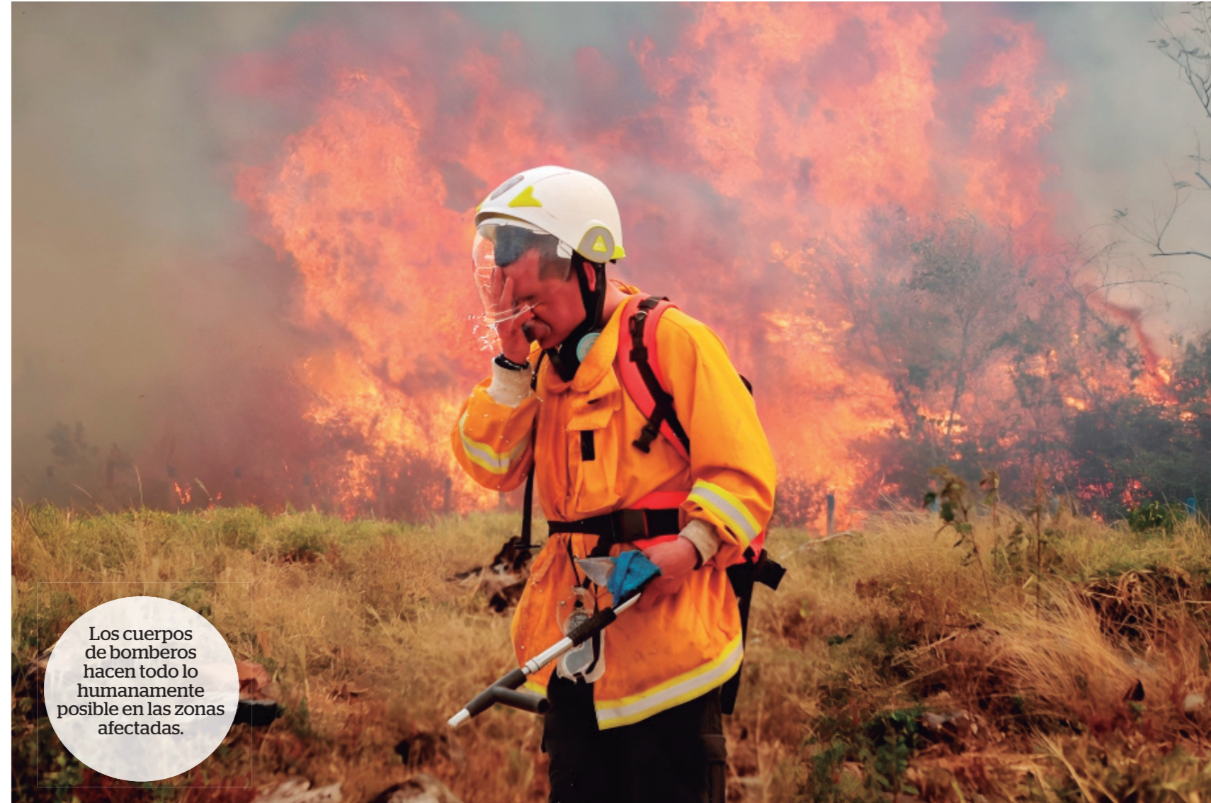
Los cuerpos de bomberos hacen todo lo humanamente posible en las zonas afectadas.

Desde la noche del miércoles, la alcaldía de Palermo hizo el llamado urgente a los habitantes de Villa Juncal para que abandonaran sus viviendas ante la inminencia que el fuego llegara a sus hogares, sin embargo muchos de ellos decidieron quedarse y enfrentar las llamas con bombas de espalda que llenaban con el agua del pequeño lago, "entendemos que se hayan ido, pero nosotros decidimos hacerle frente al fuego para evitar en lo más que podamos que nuestras parcelas y casas terminen hechas cenizas", asegura uno de los habitantes del sector, "afortunadamente ya hay bomberos acá, porque anoche estábamos solos nosotros tratando de evitar que el incendio nos llegara hasta acá, por eso ni siquiera hemos podido dormir", señala otro.