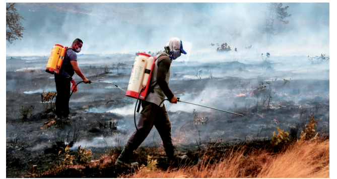
La lucha de Villa Juncal contra el fuego