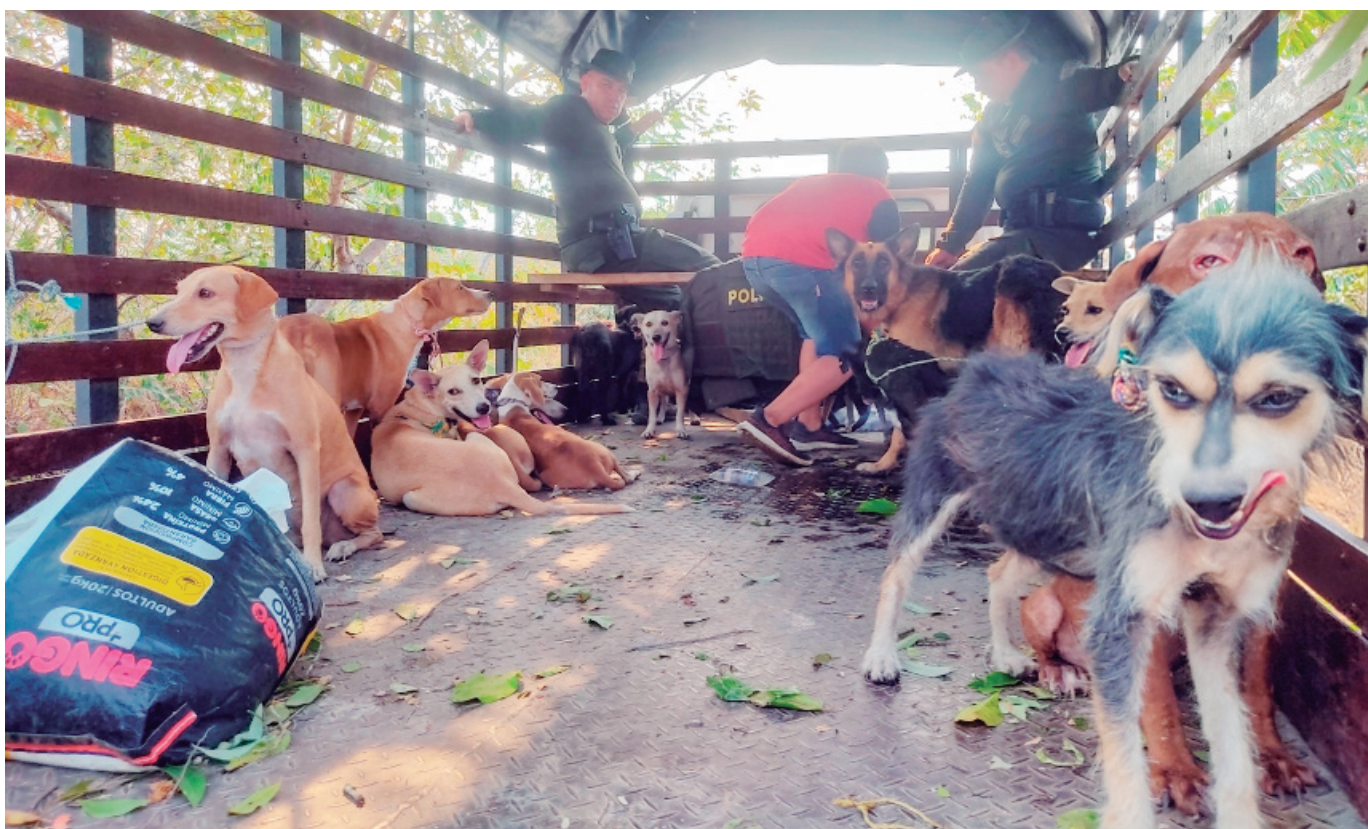
Los perritos de la Fundación Huellitas de Amor tuvieron que ser trasladados a Neiva.

para que se abstenga de realizar quemas agrícolas, una de las principales causas de estos incendios. “Es importante que la gente se abstenga de hacer quemas, de hacer el cambio de pastos para cultivos, de expandir el área agrícola. Eso definitivamente