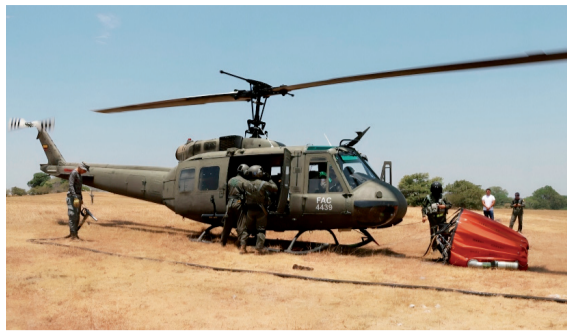
“Hasta le hemos pedido a Dios que llueva”