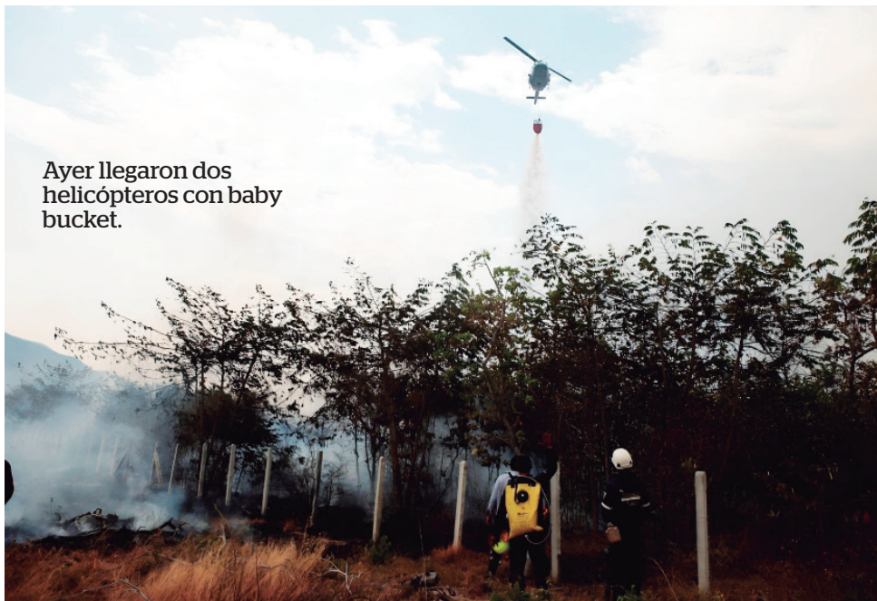
Ayer llegaron dos helicópteros con baby bucket.

zonas más afectadas y apoyar en la evacuación de personas y animales en riesgo.