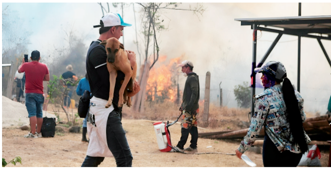
Animales afectados en Palermo: cómo ayudar