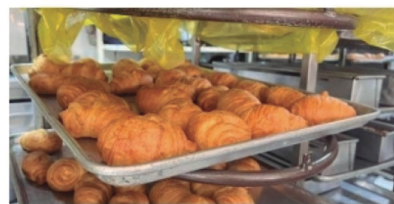
Panaderos del Huila, afectados por bajo consumo ■ ECONOMÍA 6-7