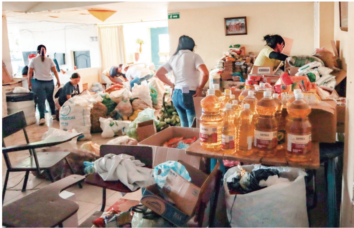
La solidaridad de los palermunos se hace presente en la colecta de víveres.

Para hacer frente a esta emergencia, el Ejército ha desplegado 26 unidades del Batallón de Desastres 80, especializadas en operaciones de rescate y control de emergencias, además de 70 unidades del Batallón Tenerife. Estas tropas están comprometidas en contener el fuego en las