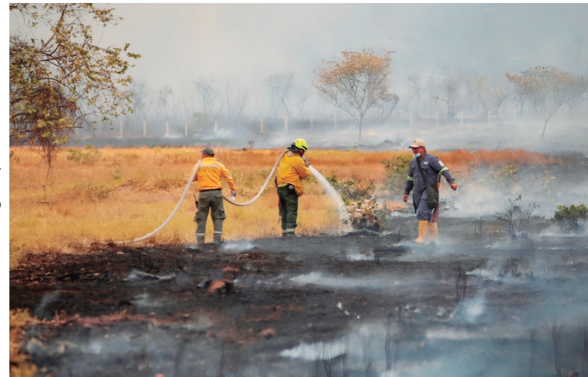
Las unidades de bomberos lograron ayer construir contrafuegos para evitar que el incendio avance.