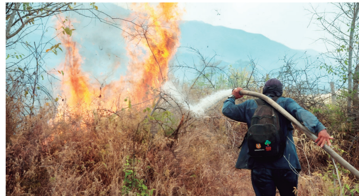
Con una motobomba, los bomberos trasladan el agua desde un lago para atacar la conflagración.

da, van mojando lo mejor posible el terreno, los arbustos y árboles para que el fuego se encuentre con una barrera que le impida seguir avanzando. "estos incendios pasan acá cada año en estas temporadas secas. Las personas no tienen conciencia y no les im-