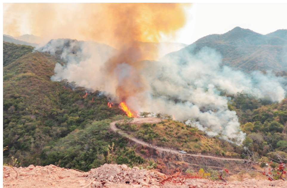
Una de las más graves conflagraciones se encuentra en Alto Sardinata.

Luego de siete días de haber estado solicitando, por fin llegó a Palermo el apoyo helicoportado con baby bucket. Se espera que estos instrumentos ayuden a acabar lo más pronto posible con los incendios.