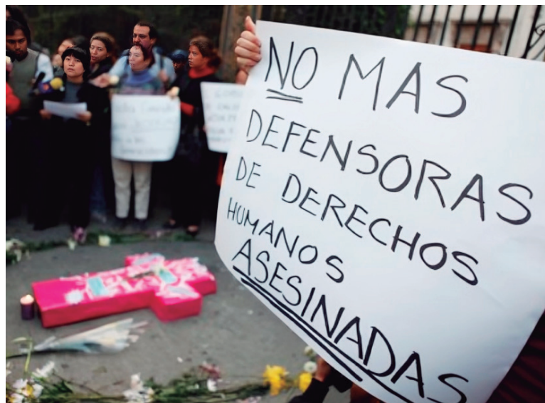
Son consideradas en riesgo diferencial, líderes y defensores de derechos humanos, sus organizaciones y colectivos.

La abogada indicó que esta situación preocupa a la entidad, “es decir muy importante se subsume la Alerta 010 del año anterior, que correspondía a los municipios de Tello, Baraya y Neiva, y en la 022 de corte estructural, se aumenta el municipio de Co-