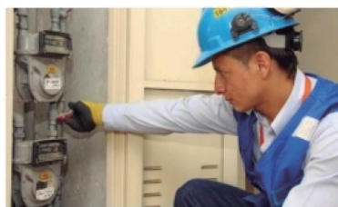
Quejas por el costo del servicio de reconexión de gas ■ INFORME 4-5