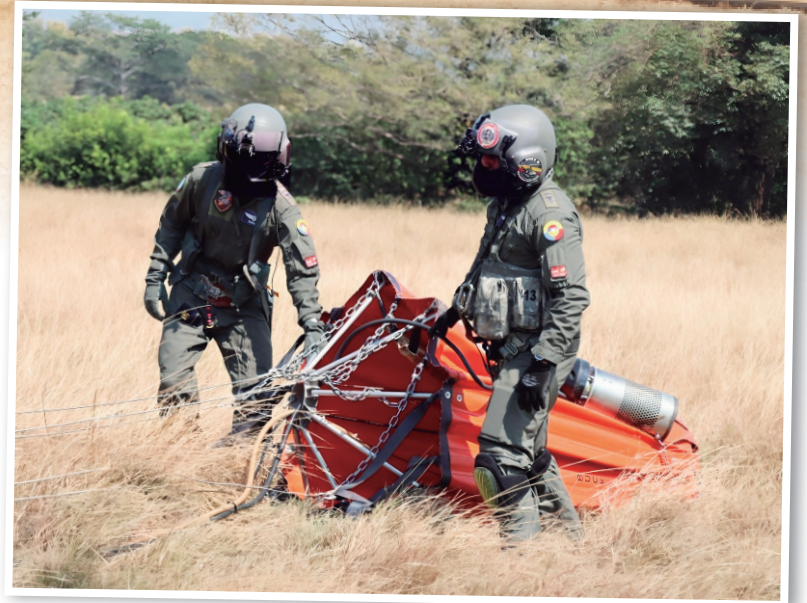
En el Bambi Bucket, se transporta el agua para la extinción de las llamas.

■ Ante la magnitud y el número de los incendios forestales registrados en el Huila, la Unidad Nacional de Gestión del Riesgo de Desastres coordina el Puesto de Mando Unificado en el Departamento, para enfrentar las emergencias por incendios forestales en la región. Y a la fecha, se reportan 16 incendios forestales en el país.