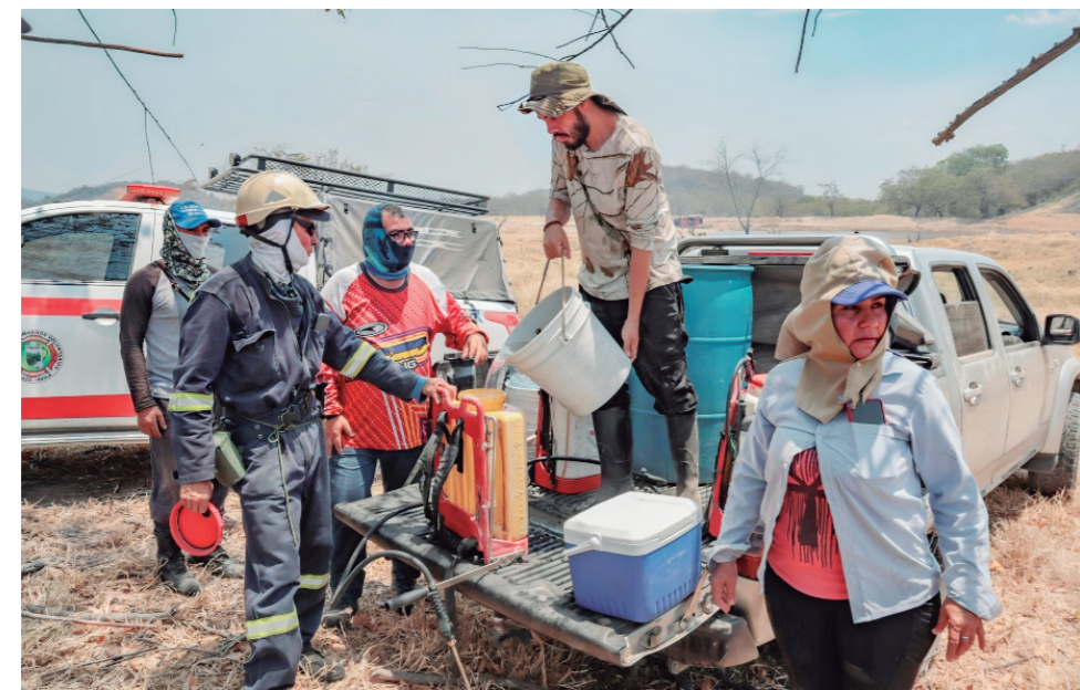
La comunidad, con bombas de espalda, sigue intentando controlar el fuego.