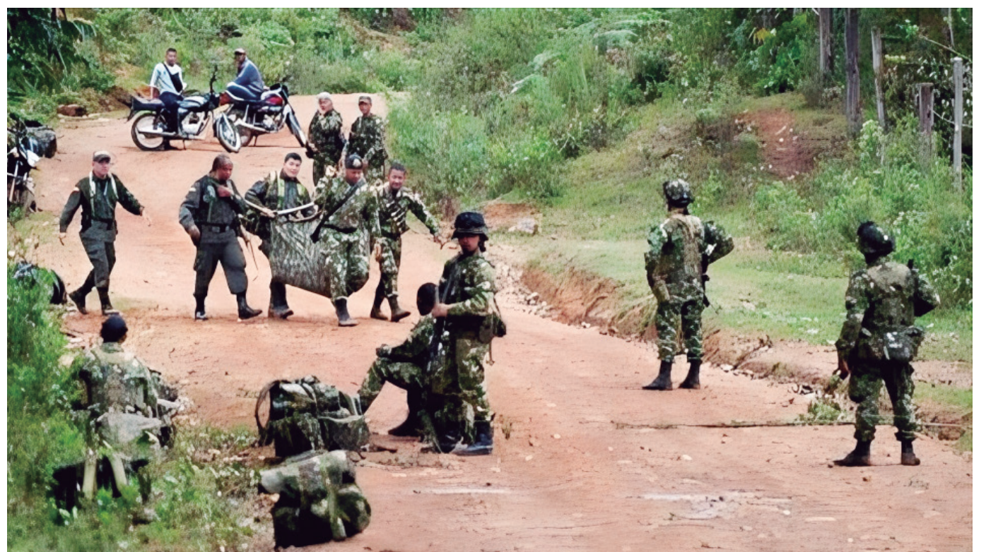
Preocupan los enfrentamientos entre disidencias y unidades militares, ya que la población queda en medio.