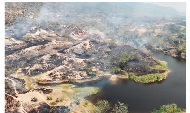
El devastador incendio es abrumador.

Encontrarse con un incendio forestal es abrumador, se siente el calor en la parte delantera del cuerpo, hay un murmullo difícil de describir que se va haciendo cada vez más cercano. Ese crujir de los árboles incinerándose hace que se tonga de gallina la piel. La magnitud del desastre solo se entiende cuando ves que lo que era un frondoso bosque ahora solo es ceniza y carbón, un cementerio de árboles incinerados que exhala humo gris. El olor a quemado entra por las fosas nasales y se instala en el alma, por lo que llega a comprender que un ecosistema que creció durante décadas, que era fundamental para el equilibrio climático que nos sostiene en la árida y calurosa área de Bosque seco Tropical, en el valle del Río Magdalena, ha muerto y que posiblemente nunca se vaya a recuperar pues, ante la incapacidad institucional por desarrollar acciones rápidas para recuperar el bosque, posiblemente termine siendo convertido en un cultivo extensivo de cualquier producto agrícola.