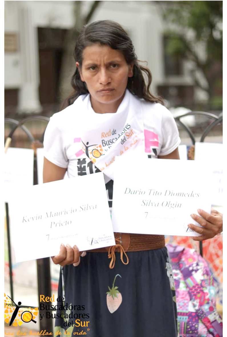
Comunidad en el Huila manifiesta que sí perdonará y que están en un proceso que les permite sanar las heridas que deja el conflicto armado.

“A través de todos estos talleres en los que hemos participado, lo único en lo que menos pensamos es en la venganza y el dolor, en estos talleres los pro-