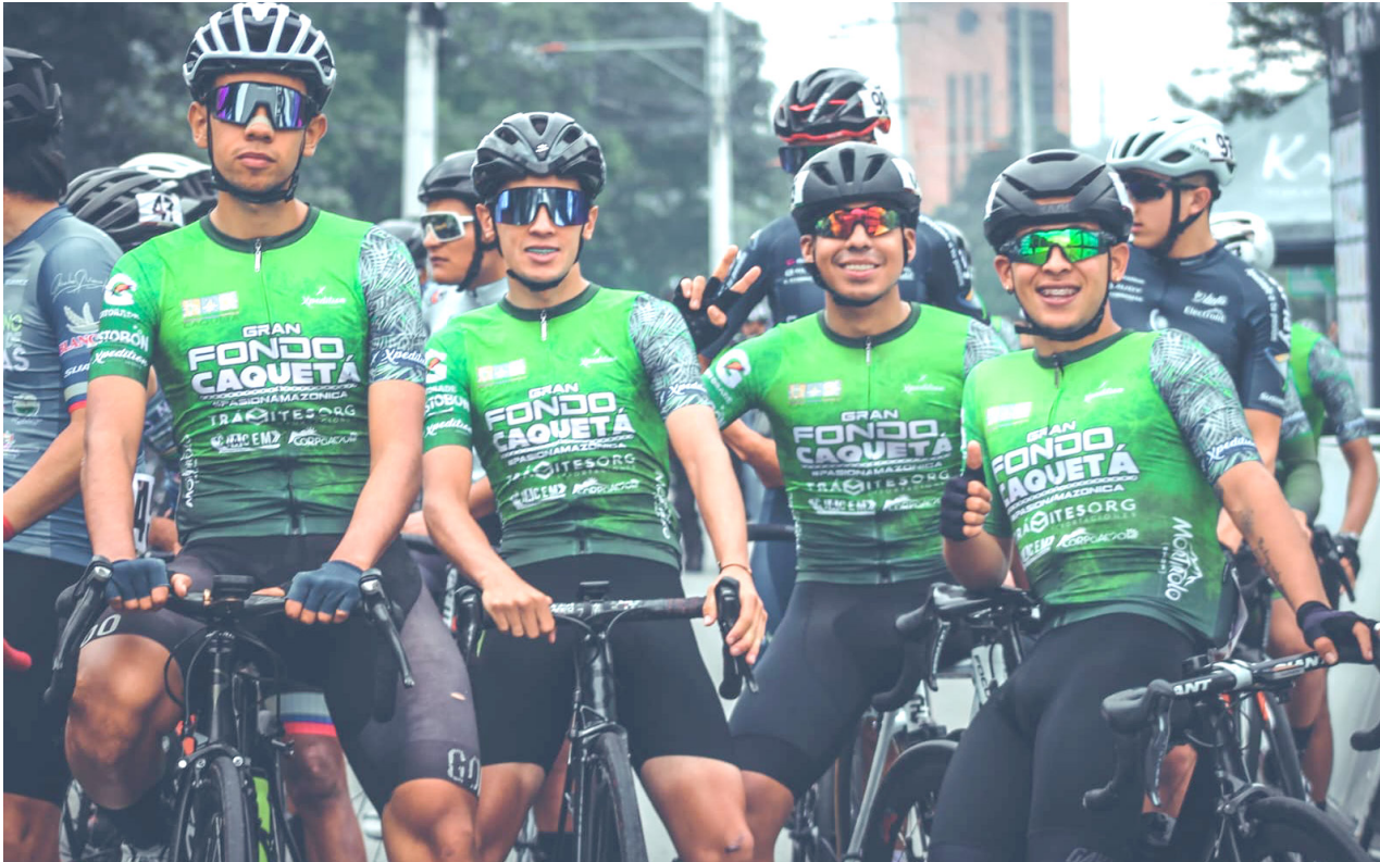
La primera etapa partió de Saldaña en el Tolima