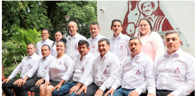
Candidatos a la Gerencia de la FNC se presentaron en el Huila