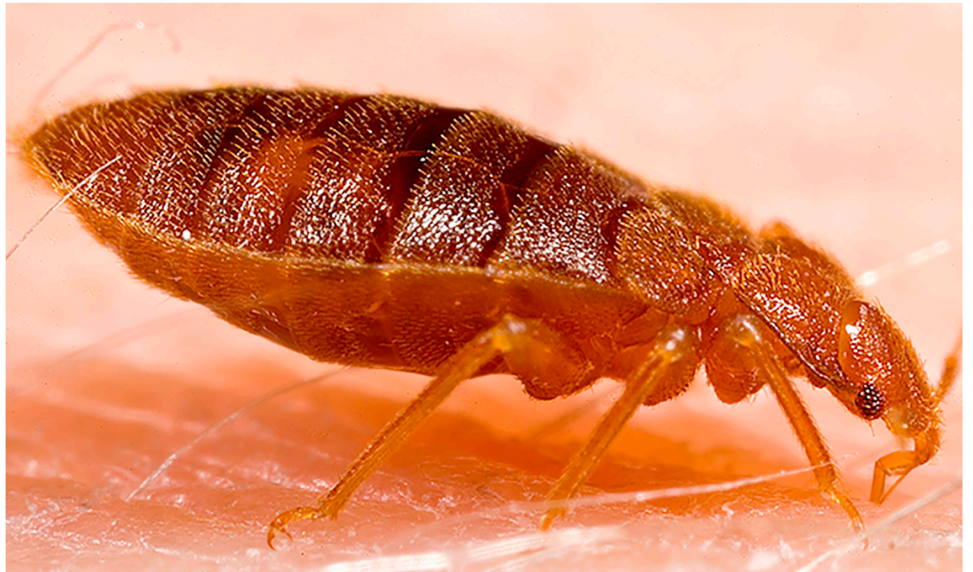
Se calcula que, anualmente, se presentan cerca de 9.000 casos nuevos de infección por Trypanosoma cruzi en el continente americano.

Pese a que el vector está en algunos municipios del Huila, no se han presentado casos durante los últimos años. Al respecto, desde la Secretaría de Salud Departamental se realiza monitoreo epidemiológico continuo para identificar posibles casos de manera oportuna.