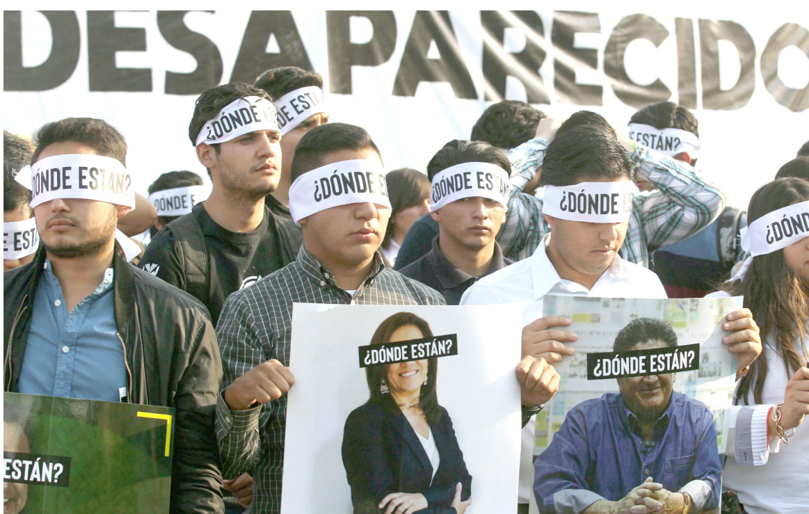
Según el Centro Nacional de Memoria Histórica, aproximadamente 80.000 personas han sido víctimas de desaparición forzada

Es la novia que sigue esperando a su novio con el cual ha de hacer realidad su felicidad y compañía. Es de verdad una sociedad que sigue creciendo en medio de la desilusión, la esperanza y el dolor. Por eso necesitamos como comunidad sanar esos dolores, encontrar la verdad de qué es lo que ha sucedido para poder restituir la confianza que se ha perdido y así construir un país en paz”.