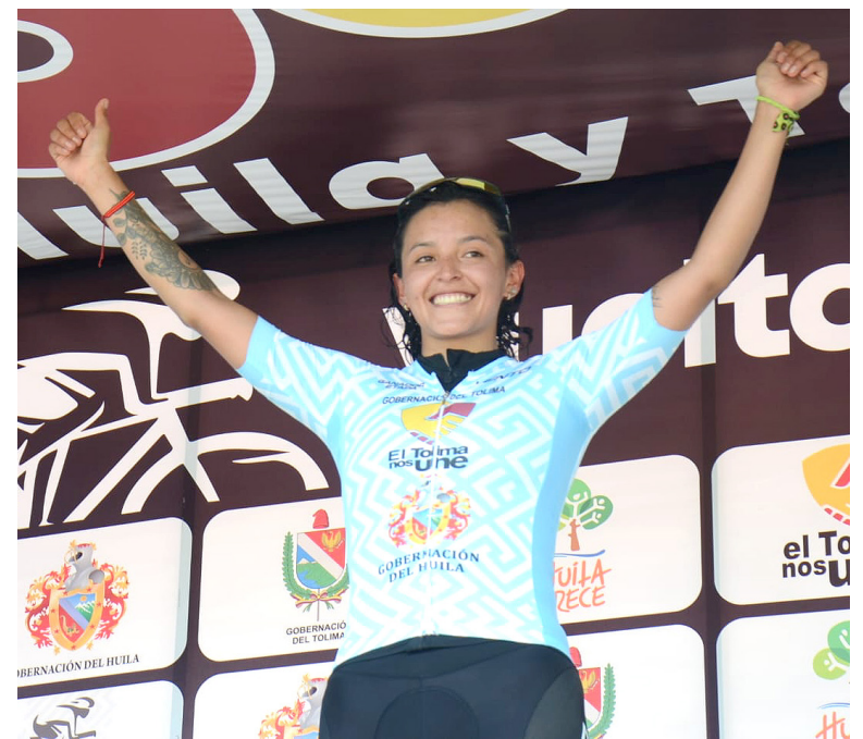
La joven se muestra como unas de las favoritas por el titulo

deco a la organización, vi carreteras muy bonitas gente alegre y municipios con público que nos acogía". Fe esperanza y trabajo en equipos fueron las palabras que destaco Dueñas para hacerse con la victoria.