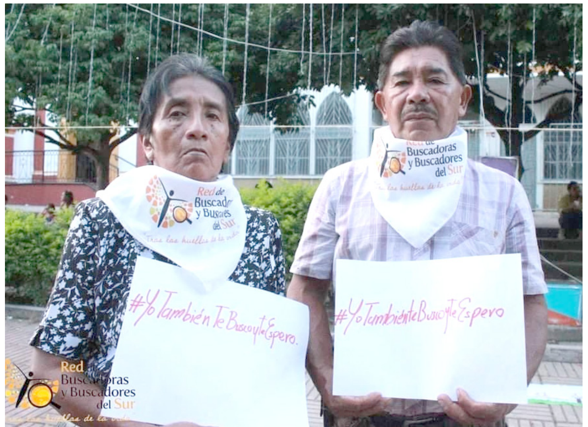
Según la Unidad de Búsqueda de Personas, en el departamento del Huila hay cerca de 1.200 personas dadas por desaparecidas.