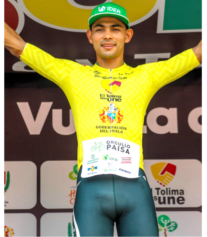
El joven del Sucre fue más rápido que todos