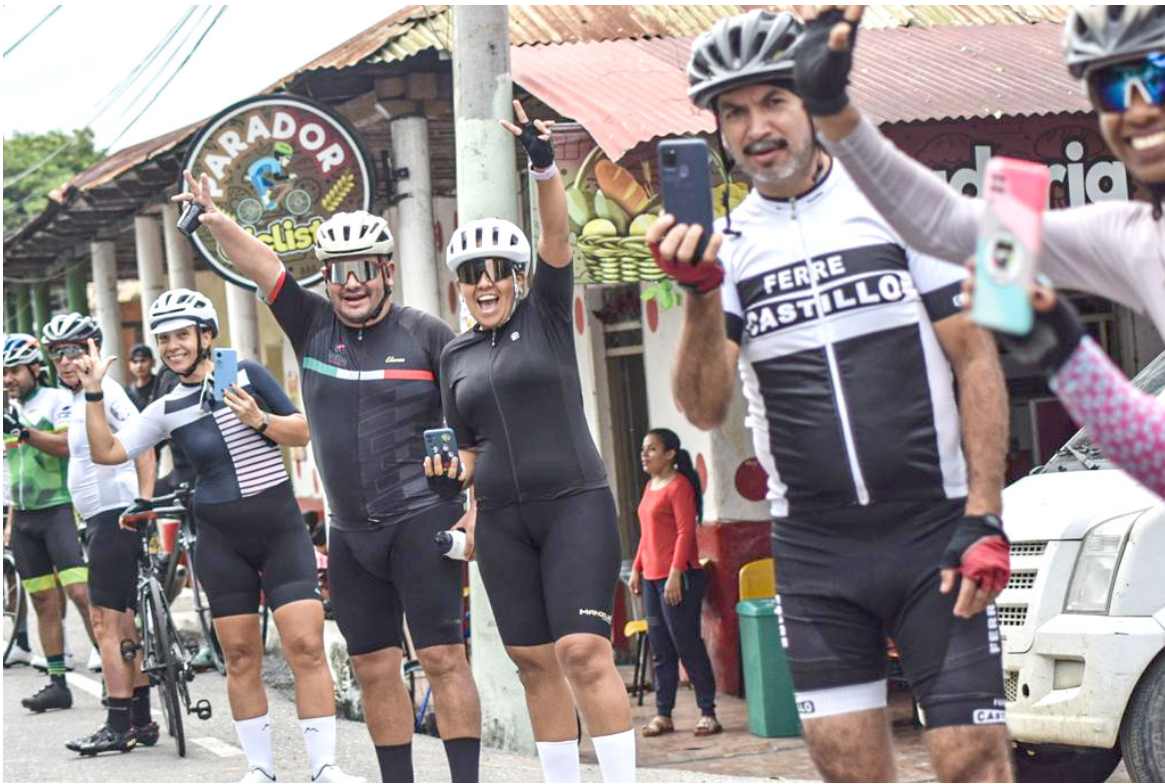
Todas las personas disfrutaron de esta fiesta ciclística