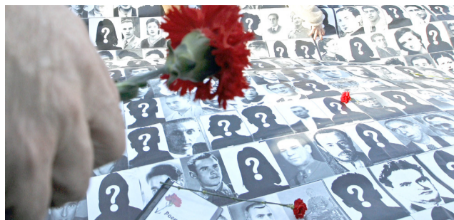
“¡Hasta encontrarlos!” El Huila busca sanar las heridas