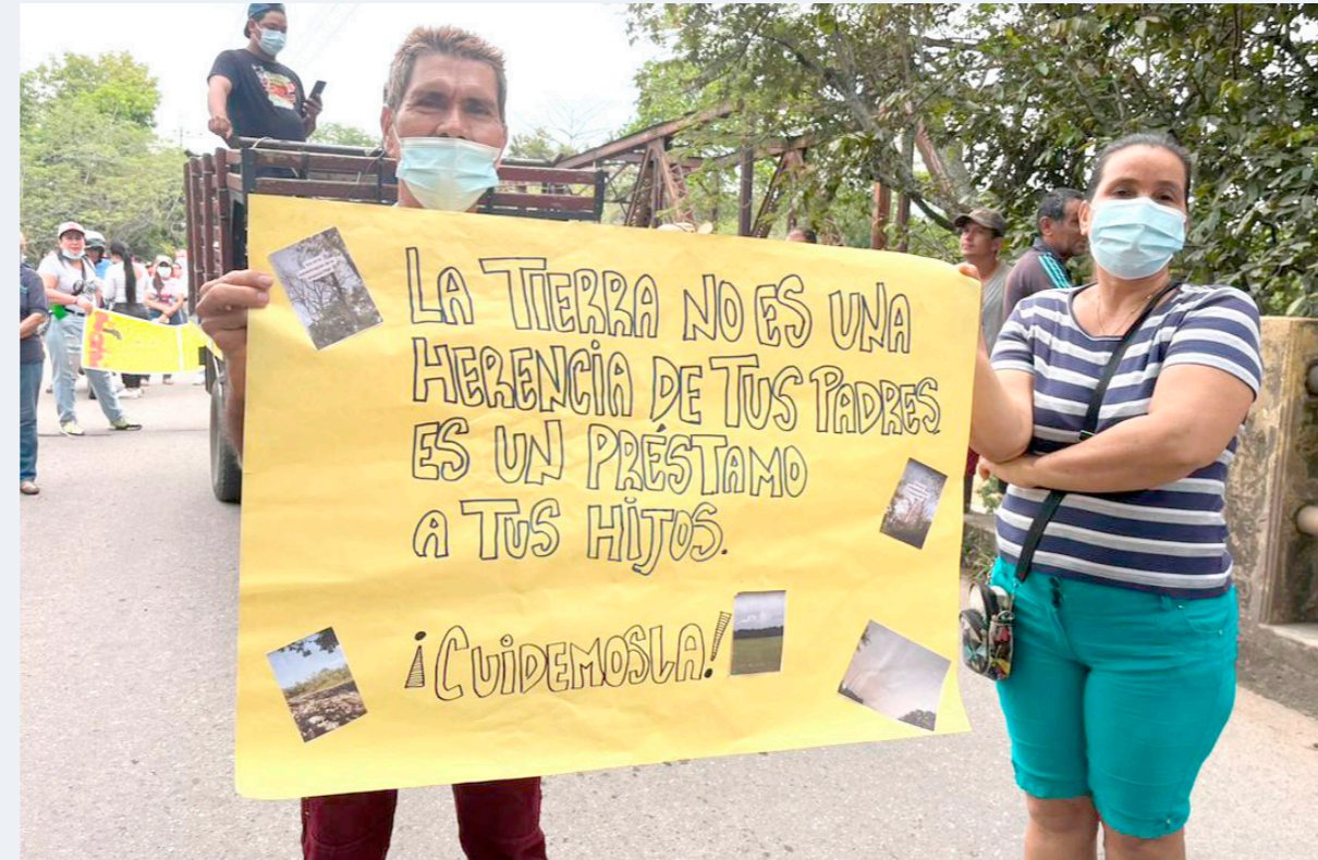
Durante la manifestación pacífica, la comunidad realizó recorrido desde el polideportivo hasta las afueras de la empresa PQP.