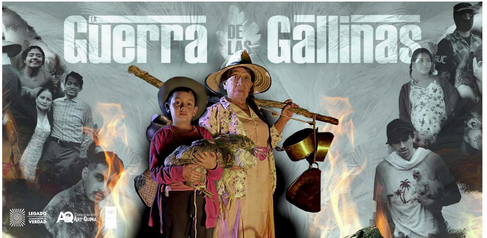
'La Guerra de las Gallinas', la cual tiene ocho capítulos fue grabada en el municipio de Tarqui.

Cabe recordar que la producción se dividió en dos partes. Primero, se socializó el informe de la Comisión de la Verdad a las comunidades de Chaparral, Ataco, Rioblanco y Planadas, para recoger sus apreciaciones y sentimientos. Luego, se construyó el guion de la serie, inspirado en el capítulo testimonial del informe.