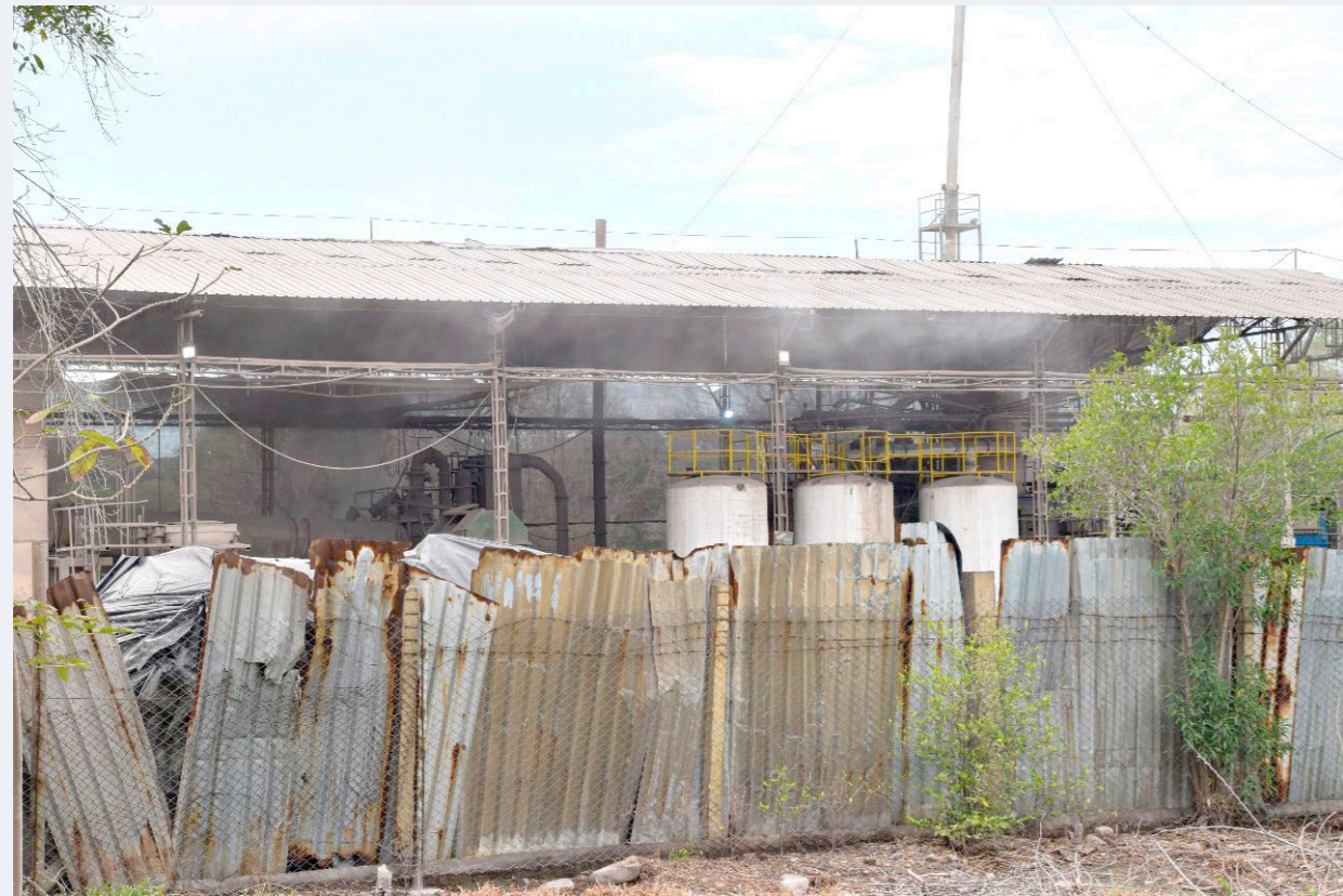
La comunidad se unió para protestar en contra de la posible producción de agentes contaminantes de la empresa que inició con el nombre Inter Ácidos, contratando habitantes del corregimiento y que, ahora solo emplea personas de Tello y Neiva.

"He estado acompañando a la comunidad de Fortalecillas porque conozco la parte ambiental, tengo conocimiento también del territorio y de la población porque tengo raíces. Mis padres y tíos, gran parte de mi familia es de acá y conozco la problemática que se viene presentando con la planta que vino hace 40 años con un objetivo, pero que se fue desvirtuando. La planta ahora está produciendo ácidos contaminantes y está a una distancia tan cerca al río Las