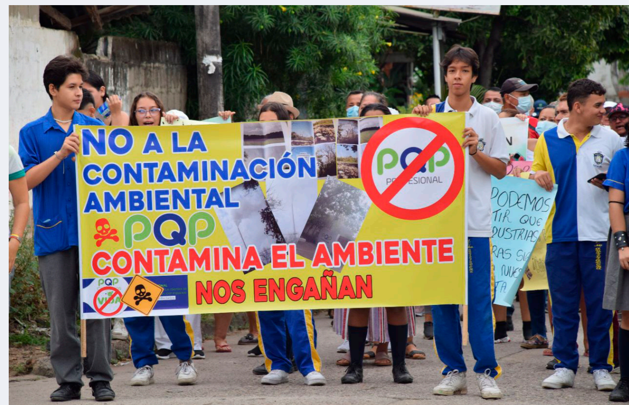
Con arengas y carteles, los habitantes de Fortalecillas denunciaron su inconformismo con la empresa PQP y su preocupación por el impacto ambiental que esta está generando.