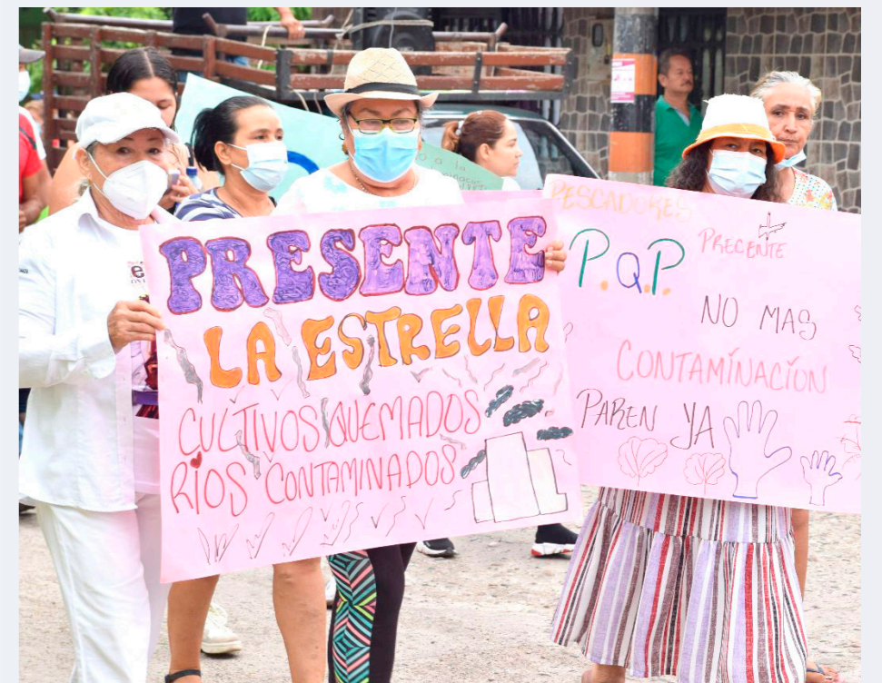
Uno de los primeros mecanismos abordados fue la acción de cumplimiento que la comunidad elevó sin lograr

allá fui y me dijeron que eso no tenía nada que ver con el trabajo, yo no volví a insistir con la empresa y puse varias tutelas para exigir que me indemnizaran y garantizaran el tratamiento, ahí pusieron a un ingeniero que antes me sacaron y tuve que conversar con el Sisbén para que me atendieran. Yo vivo con mi esposa a la que le dio esquizofrenia y tiene que ir con el psiquiatra para que le de tratamiento, a ella le dio eso porque mi situación fue muy dura. A mí me dio neumonía y epilepsia que también estoy en control, fuera de eso mi esposa también ha estado con cáncer y no tenemos ninguna forma de sustento, solo cuando voy a ayudar a preparar unos dulces".