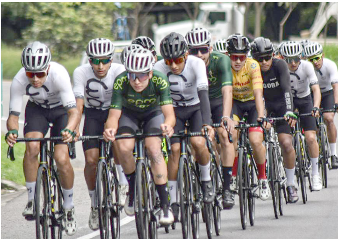
Una primera etapa que se guardo todo para el final

nos da correr más de 90 kilómetros para las damas, mucho calor y la altimetría bastante complicada por el viento, aprovecho y agrada