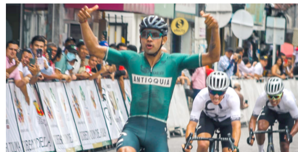
Duelo de sprinters en la primera etapa de la Vuelta al Sur