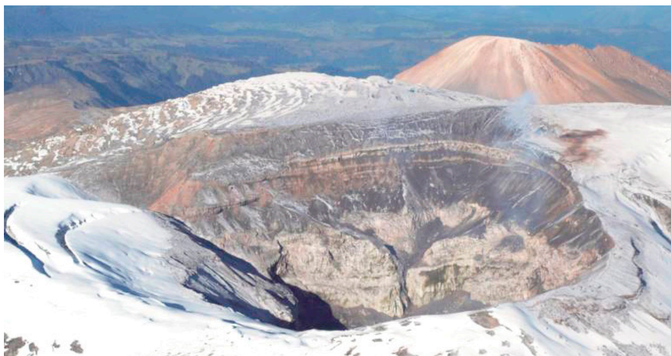
El volcán Nevado del Ruiz, en Colombia, cambió su comportamiento geológico en los últimos días.

En las últimas horas aumentó la actividad sísmica del volcán. Servicio Geológico explica las causas.