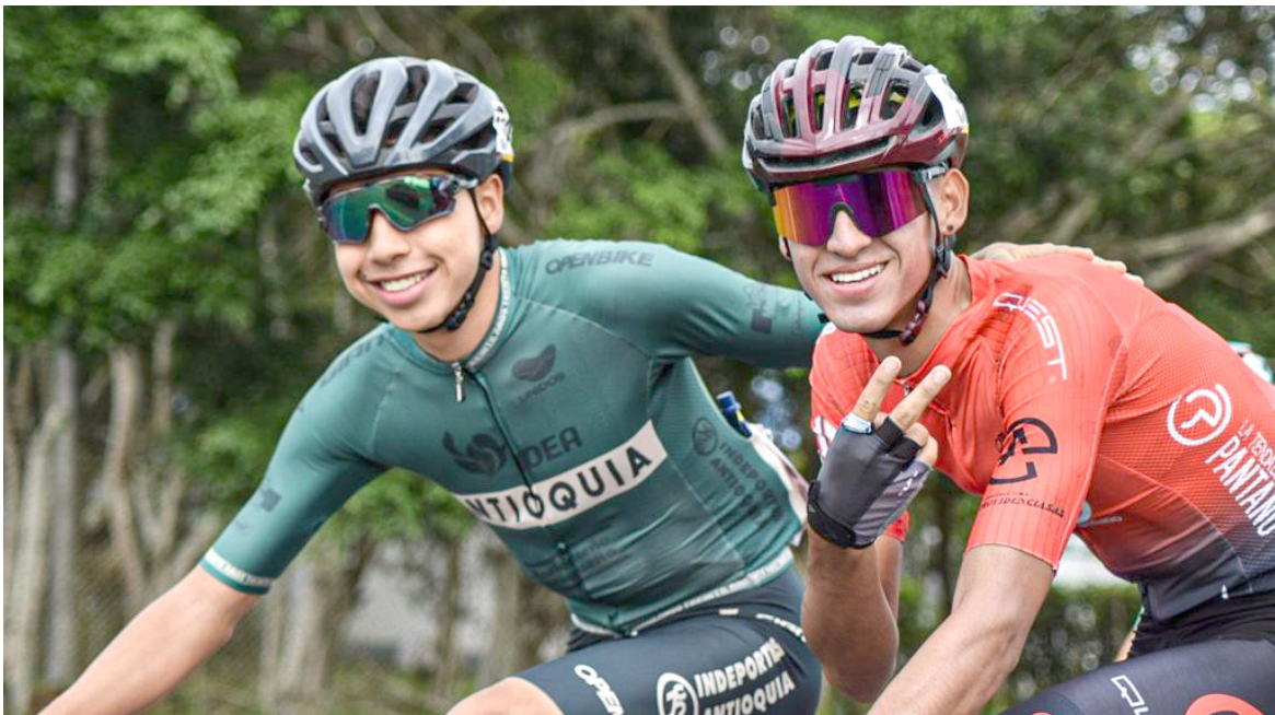
la hermandad ciclística debe primar en cada competición

vieron obligadas a conformarse con los siguientes podios.