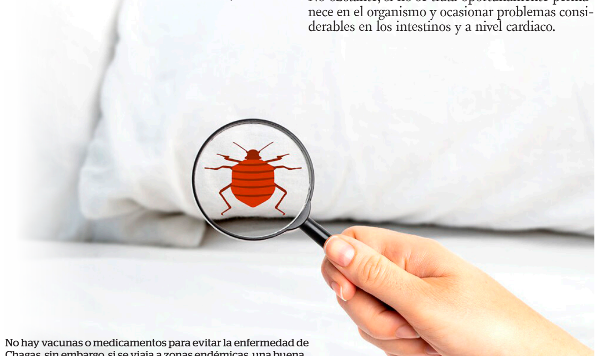
No hay vacunas o medicamentos para evitar la enfermedad de Chagas, sin embargo, si se viaja a zonas endémicas, una buena opción puede ser el uso de insecticidas para prevenir las picaduras.