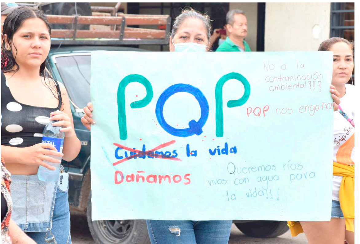
La marcha que realizaron los habitantes del corregimiento de Fortalecillas, por la presunta contaminación con químicos del agua y el aire en la población.