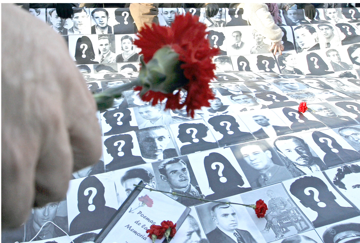
Las familias solo esperan conocer el paradero de sus seres queridos.

Entre los 20 municipios a los que pertenecen las 250 familias están Colombia, Tello, Baraya, Neiva rural, Algeciras, Campoalegre, La Plata, Palestina, Oporapa, San Agustín y Pitalito, en donde las desapariciones se han dado en el marco del conflicto armado y el patrón común, según explica Alarcón es: “la mayoría de las personas dadas por desaparecidas