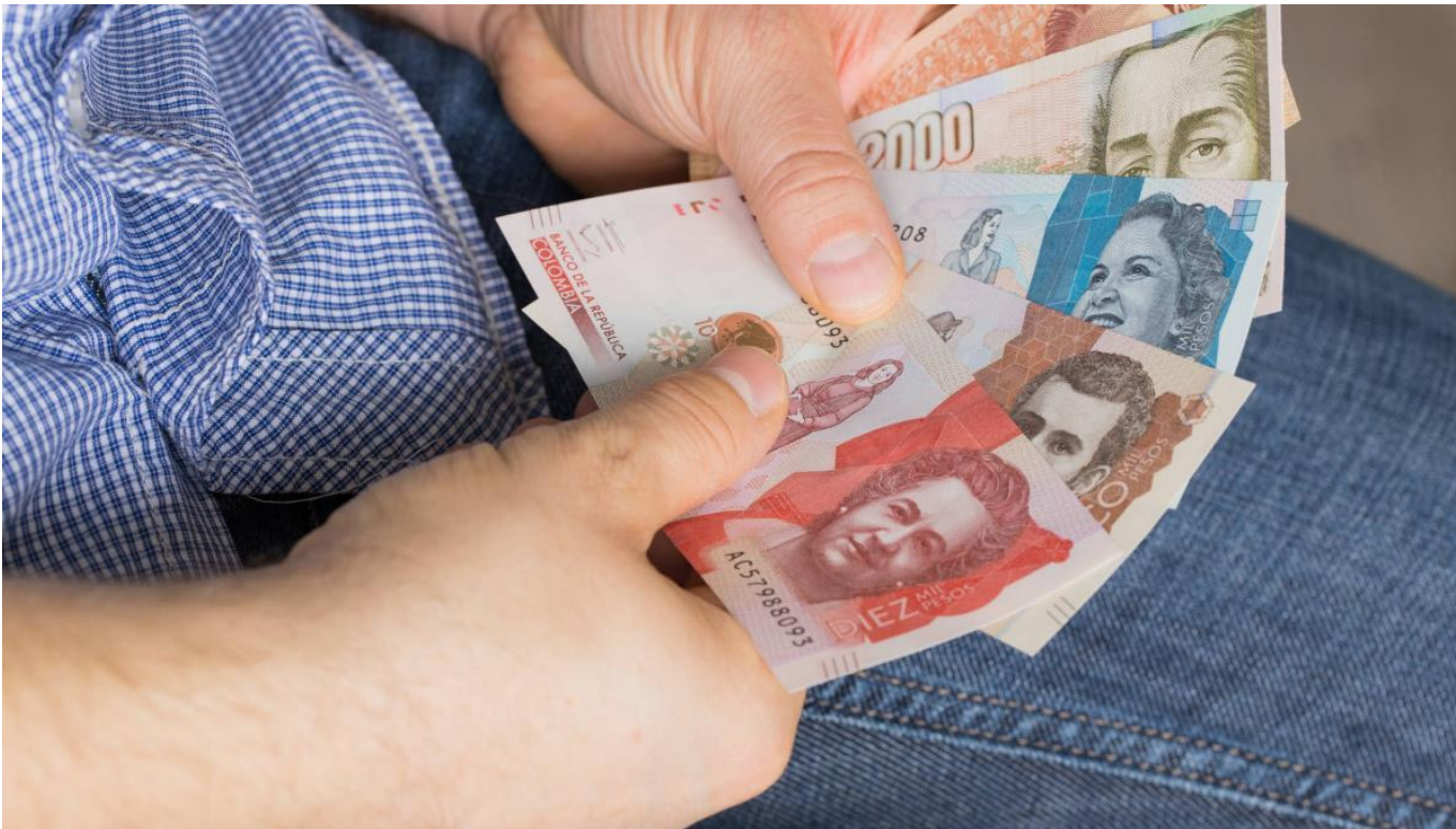
Poco se ha hecho para que Diselecsa le pague la deuda a los neivanos.

término de los cuales la alcaldía terminó el negocio. Había iniciado el primero de enero de 1998 y concluyó el 30 de diciembre de 2017. Pero el fin llegó sin que Diselecsa hubiera pagado las deudas señaladas por un tribunal de arbitramento y por el Consejo de Estado, por los cobros irregulares no justificados.