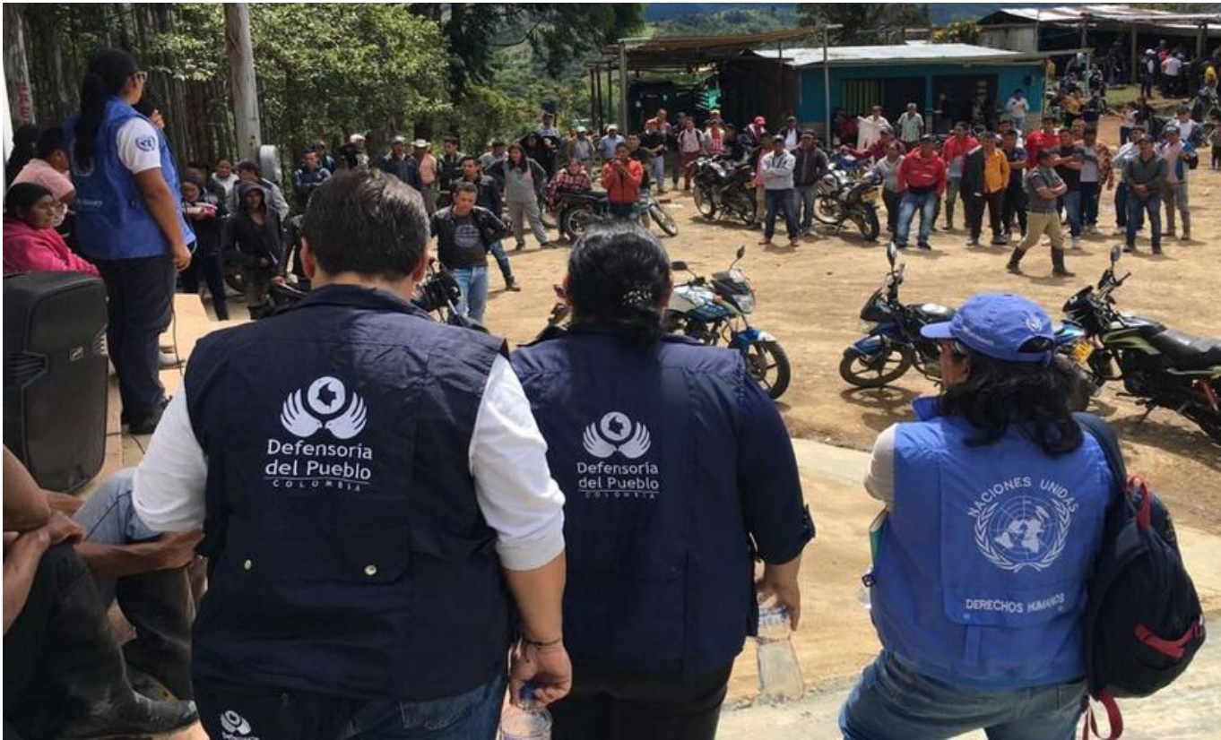
En el año 2023, 867 personas, fueron desplazadas en La Plata.