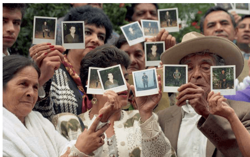
En el departamento del Huila, hay 1.149.000 mil habitantes, de los cuales el 20%, corresponde a víctimas del conflicto armado.

“En cuanto a las situaciones que más perjudican a las 220.000 víctimas, son: desplazamiento, homi-