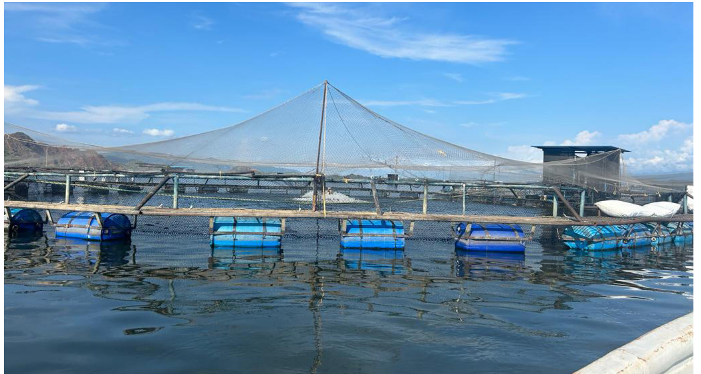
La CAM hace un llamado a los productores piscícolas a anticiparse a los efectos del Fenómeno de El Niño en el embalse de Betania, previniendo la mortandad de peces y asegurando la calidad del recurso hídrico.

Ajustar la densidad de siembra en los proyectos piscícolas.