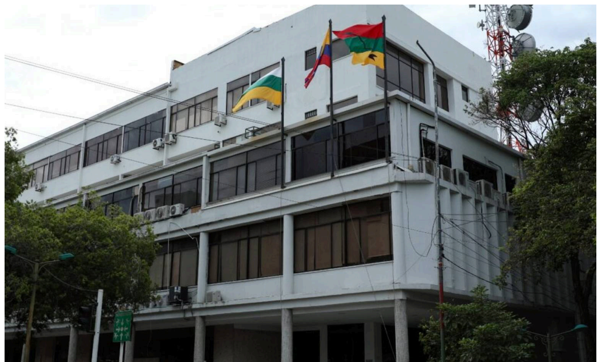
En el gobierno de Gorky Muñoz se presentó la defensa del Municipio.