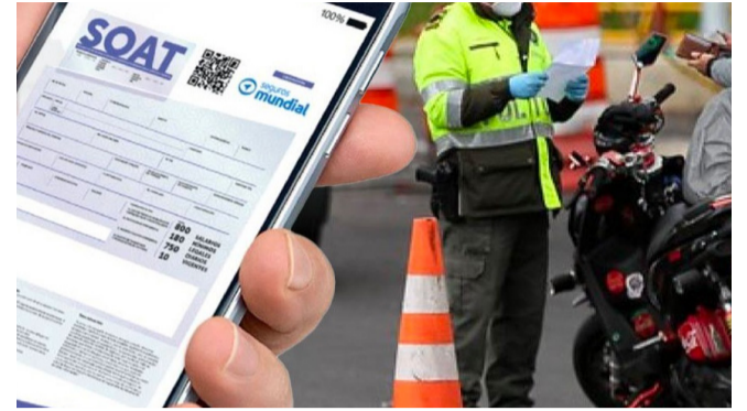
Los colombianos se están asegurando más