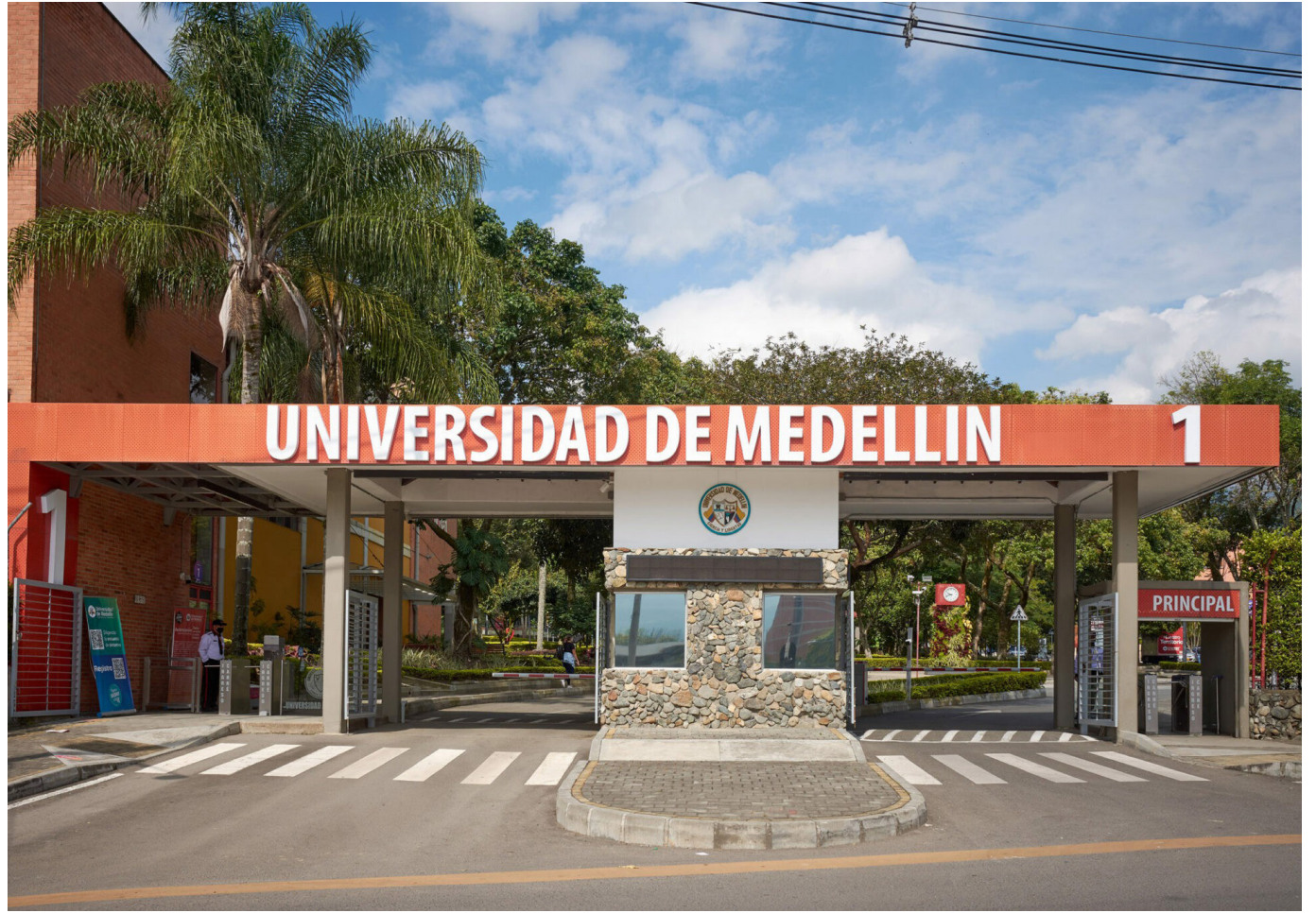
Buscan convenios con la Universidad de Madrid, España y la de Medellín para jóvenes víctimas.

“Parte de nuestro apoyo financiero a Colombia para el Acuerdo de Paz de 2016 fue para excombatientes. No tuvimos en ese momento apoyo a las víctimas. Pero ahora es la oportunidad para revisar ese tema y apoyar. Podríamos hacer algo en términos de presupuestos”, dijo Gilmore.