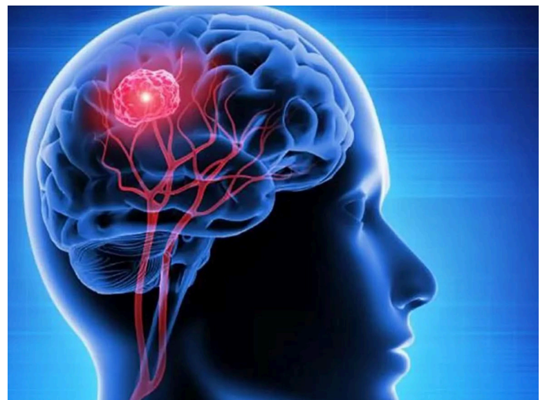
Niño en Francia se cura de tumor cerebral. (imagen de referencia.)

La evolución además suele ser muy rápida y muchas veces el desenlace fatal llega entre 9 y 12 meses después de la detección del tumor. De ahí la preocupación