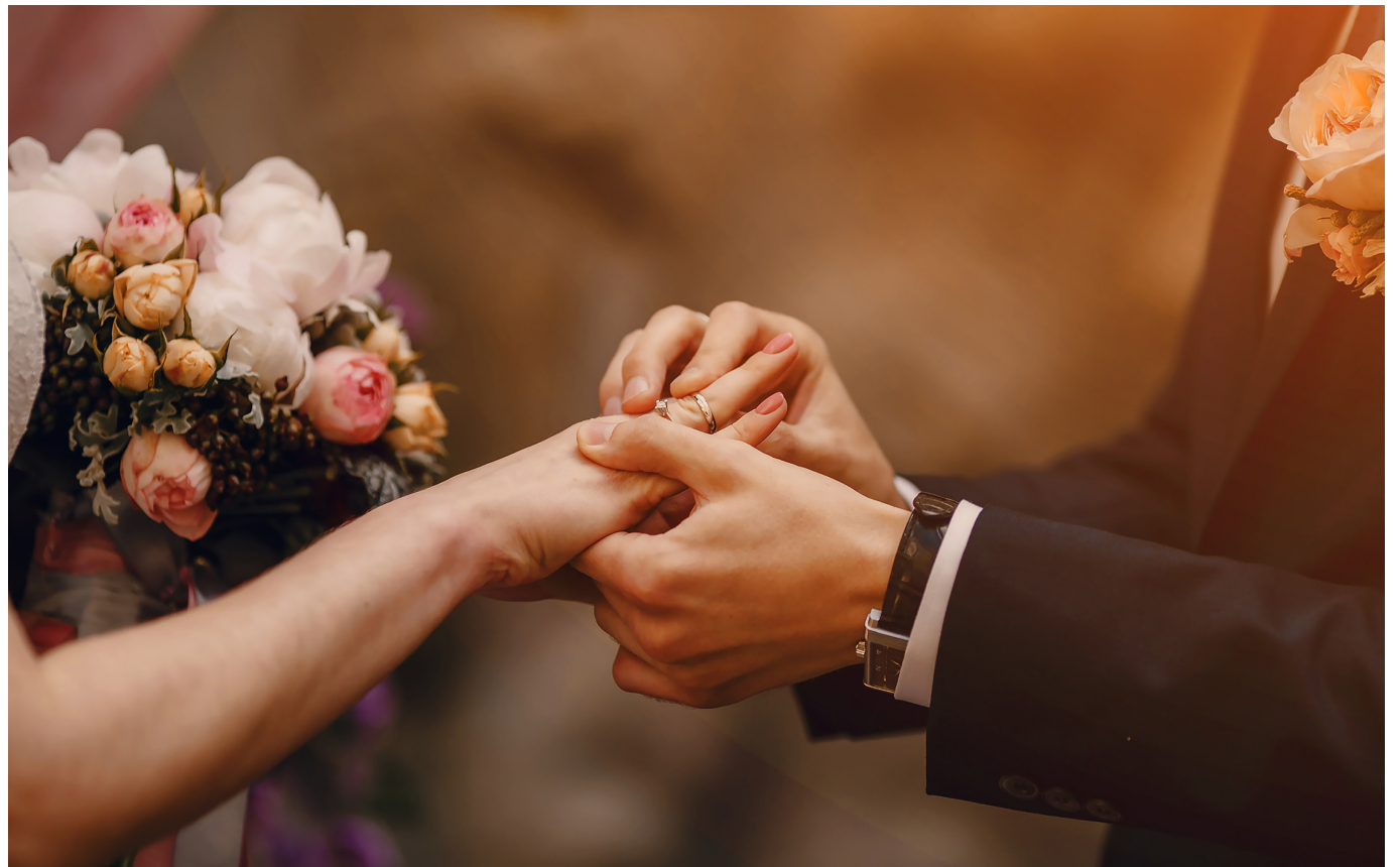
En Colombia, una locación puede costar desde $2,5 millones hasta $10 millones.

En cuanto a otros gastos detallados, un vestido de novia puede costar hasta $30 millones o más. Por esta razón, los planificadores de bodas recomiendan a las parejas tener muy claro el tipo de boda que desean y su presupuesto.