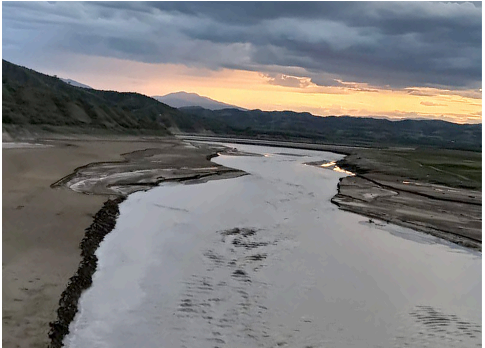
Ante la escasez de agua en El Quimbo, Enel Colombia hace un urgente llamado a la comunidad para adoptar medidas de uso racional de la energía y el agua.

Ante la escasez de agua, Enel Colombia hace un llamado urgente a la comunidad para que adopte medidas de uso racional de la energía y del agua. Recomienda reducir el uso de electrodomésticos como planchas, aires acondicionados y lavadoras, así como apagar luces y desconectar aparatos eléctricos cuando no se estén utilizando. Además, insta a aprovechar la iluminación natural como parte de las acciones necesarias para enfrentar la situación actual. La empresa enfatiza la importancia de la colaboración de la comunidad en esta coyuntura crítica.