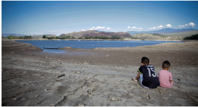
¡Alerta en El Quimbo por bajo embalse!