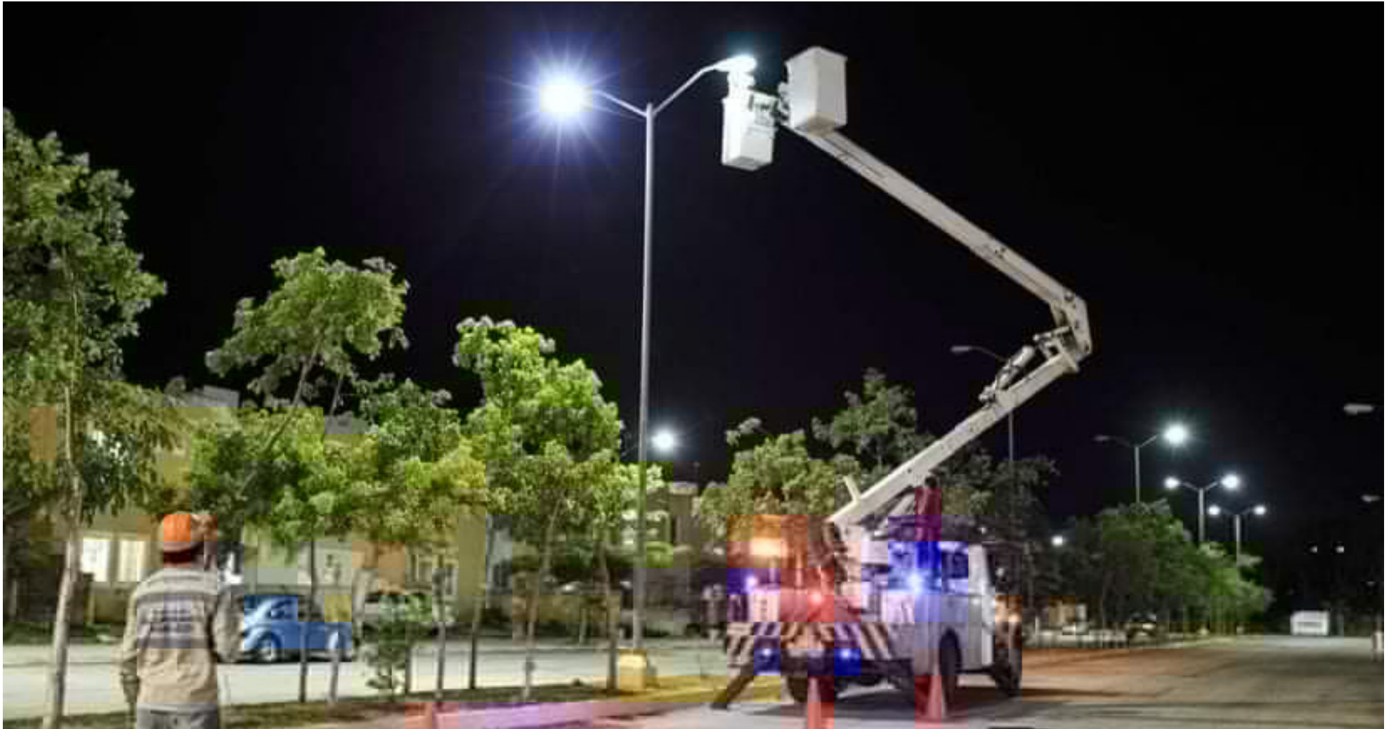
El contrato de concesión con Diselecsa duró 20 años.

■ Una contestación de la demandan vislumbra lo que podría ser un desastre para las finanzas del municipio. Un cuestionado contrato hoy pone en desventaja a la Administración de la ciudad: $72 mil millones están en juego.