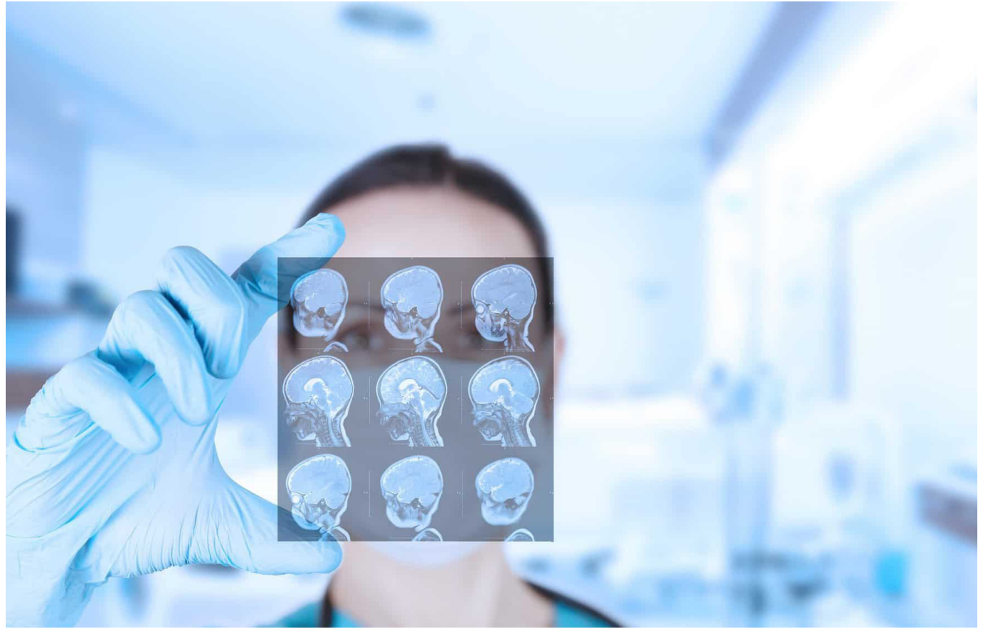
No conozco en el mundo ningún caso como el suyo", asegura el médico, cuyo equipo comenzó a investigar sobre este cáncer hace unos 15 años.

La mayor esperanza de vida se debe, sin duda, a las "particularidades biológicas de su tumor", afirma el doctor Grill, para explicar su mejor respuesta al tratamiento.