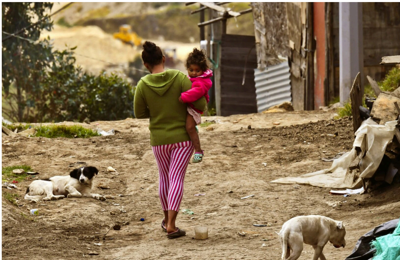
La capital opita, acoge a desplazados, pero recibiría poca ayuda para atenderlos.

Los PDET, éstos son instrumentos de gestión y planificación para priorizar la implementación de los planes sectoriales y programas dentro de la Reforma Rural Integral (RRI), y lo demás establecido