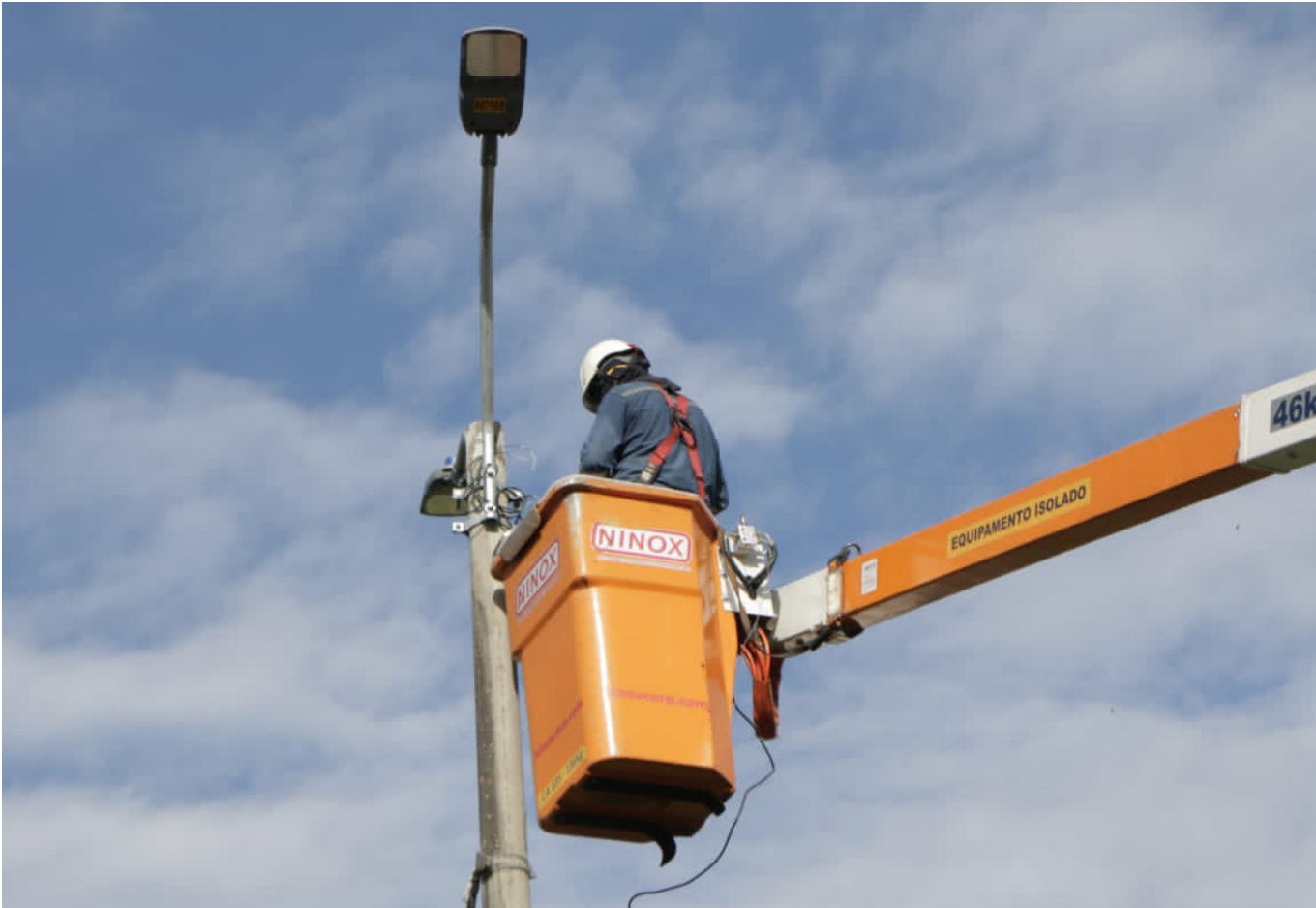
Las pretensiones de la demanda superan los 72 mil millones de pesos.