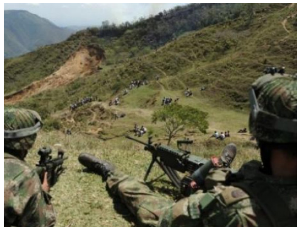
Los enfrentamientos entre grupos armados ilegales que buscan el control territorial, causa más del 50% de las movilizaciones.