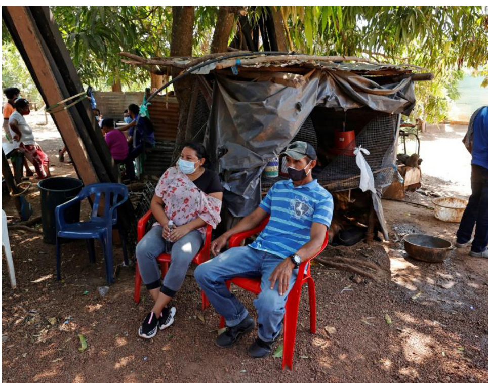
Foto 2. 1.500 personas manifestaron ser víctimas de desplazamiento forzado.

“El desplazamiento forzado masivo es una realidad que en Colombia sigue aumentando y no tiene el impacto mediático como en otros países. Hoy quiero llamar la atención del país porque en el 2023 fueron 54.665 personas debieron abandonar sus hogares.”