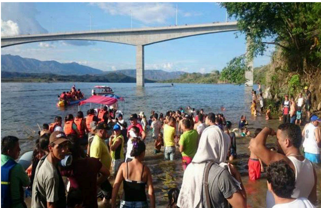
Las primeras afectaciones se han registrado para los pescadores artesanales y comunidad que vive del turismo en el área de influencia de El Quimbo.

Con proyecciones que indican un descenso histórico del nivel de llenado, la CAM hace un llamado a los piscicultores para evaluar planes de contingencia ante la disminución del recurso hídrico.