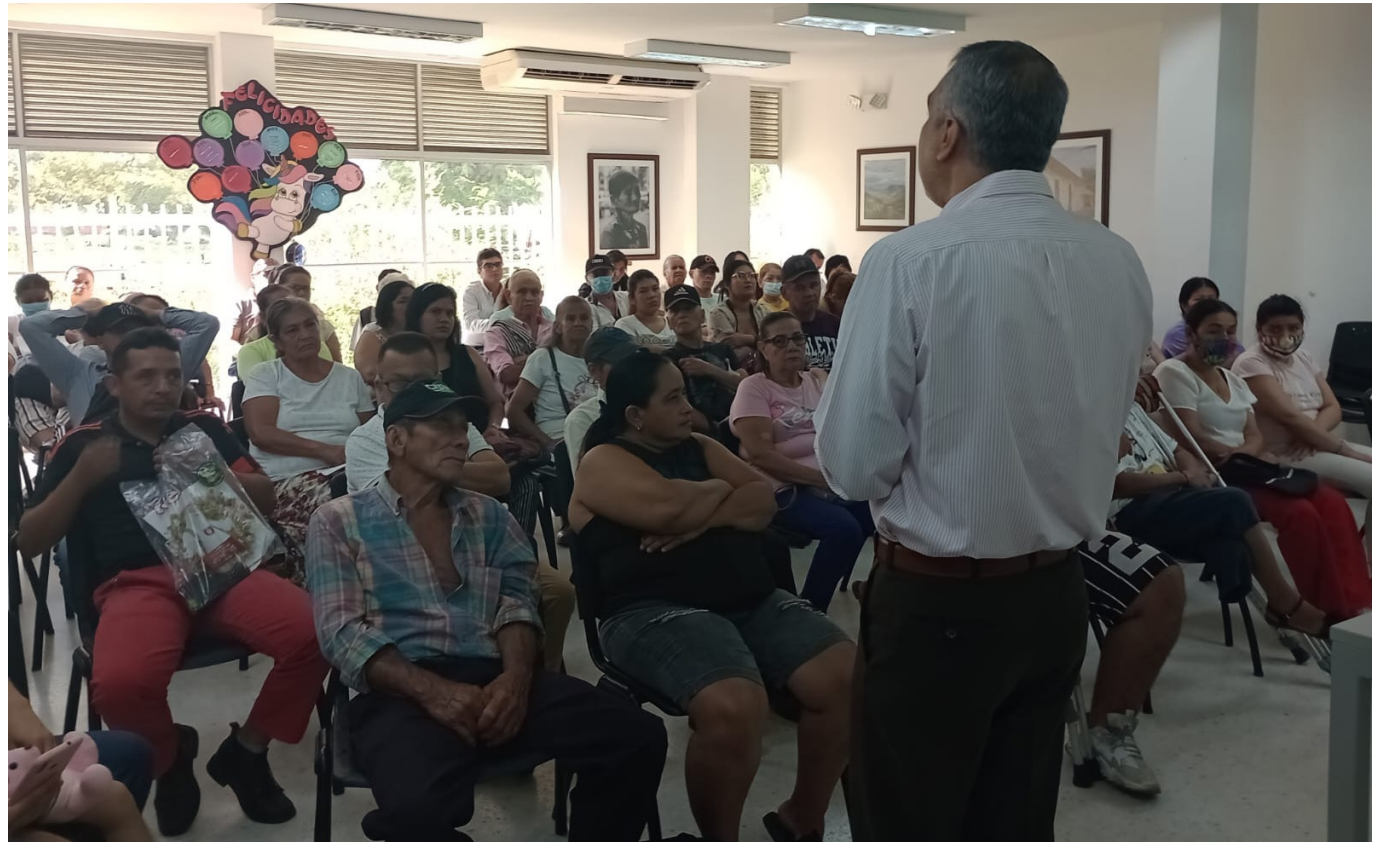
94 cartas de compensación por un valor cercano a los $770 millones, entregaron a población víctima en el Huila.