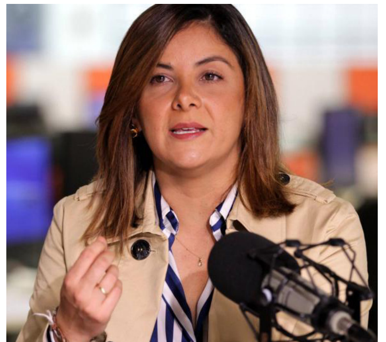
La ministra de Agricultura, Jhenifer Mojica, y la senadora Andrea Padilla.

En ese sentido la senadora Padilla, quien apoyó en la campaña presidencial a Gustavo Petro por el trabajo animalista que haría en su mandato, dijo que las palabras de la ministra son de un discurso de odio, resentimiento y falacias.