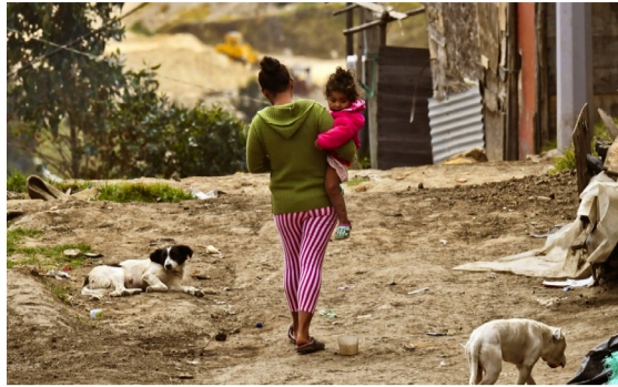
Neiva la ciudad que más recepciona desplazados