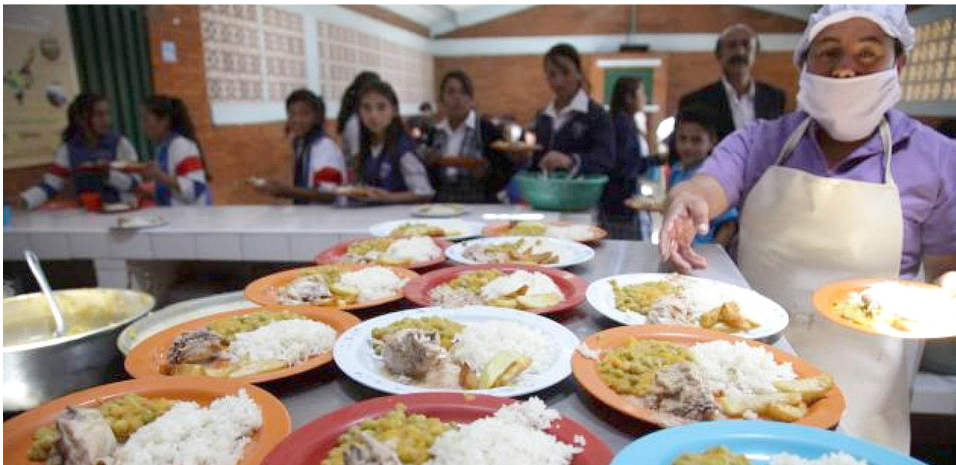
77 mujeres que trabajaban como manipuladoras de alimentos afectadas por la suspensión del PAE en Algeciras.

interrupción del acceso a la alimentación escolar, sino también por el impacto en la seguridad alimentaria de la población estudiantil.