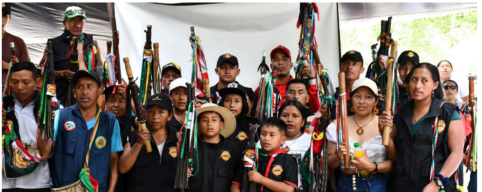
Los cuidanderos del territorio mantuvieron el orden y control territorial durante los días de concentración en el punto de resistencia.

“La minga de resistencia retorna a los territorios ancestrales para seguir fortaleciendo las bases del proceso político organizativo, pero deja claro que, siguiendo las orientaciones de nuestros sabedores espirituales, las autoridades tradicionales y la asamblea, la minga se trasladará a la ciudad de Bogotá para visitar las entidades y ministerios que no