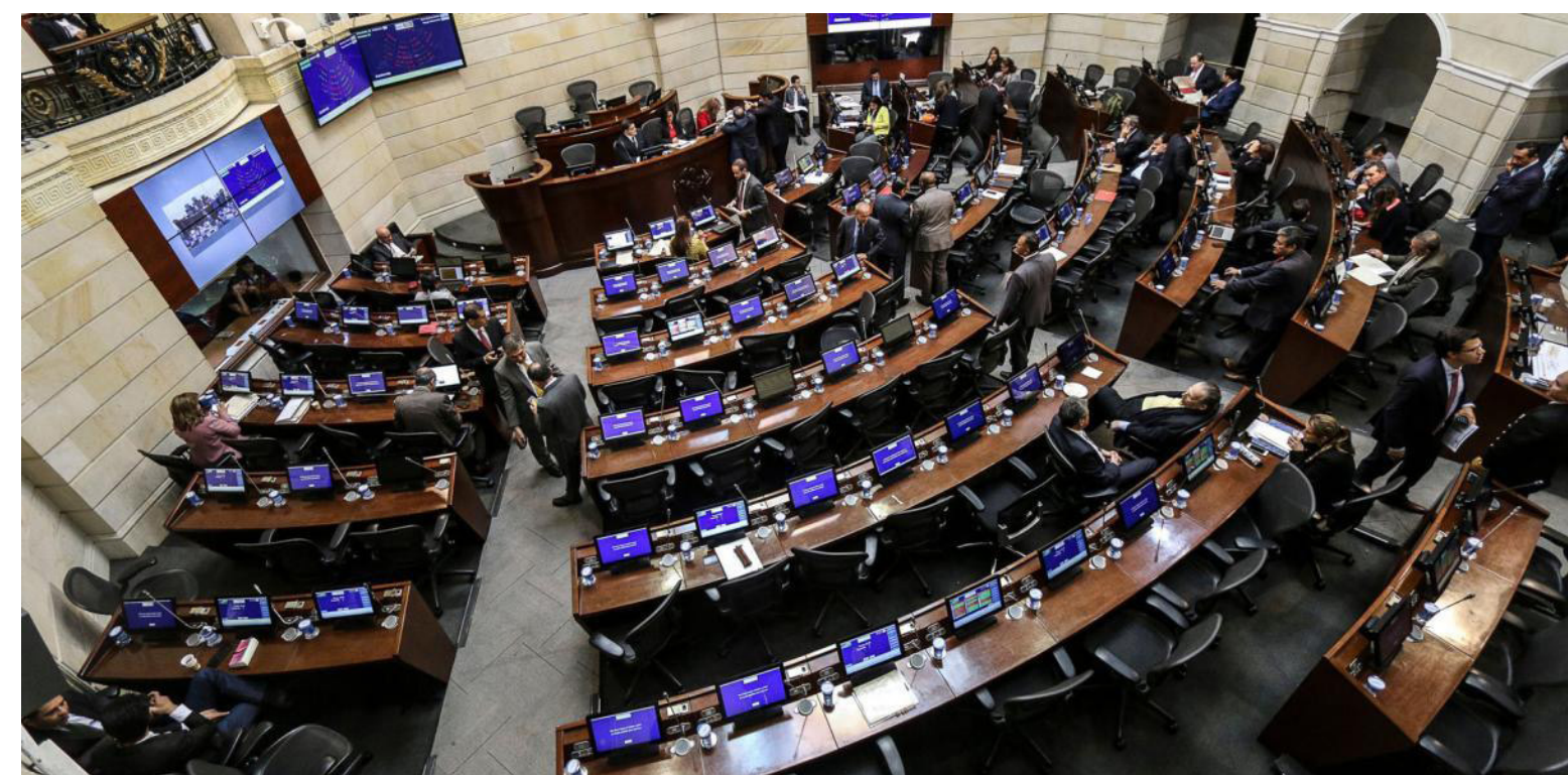
Dos demandas más están a la espera de que sean resueltas para saber si definitivamente Pastrana se queda con esta curul.

La lista de Cambio Radical a la Cámara de Representantes ha estado marcada por las inhabilita-