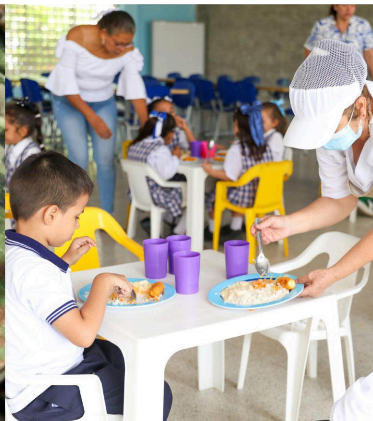
Autoridades locales y regionales coordinan esfuerzos para resolver la crisis educativa y alimentaria en Algeciras durante el receso escolar.