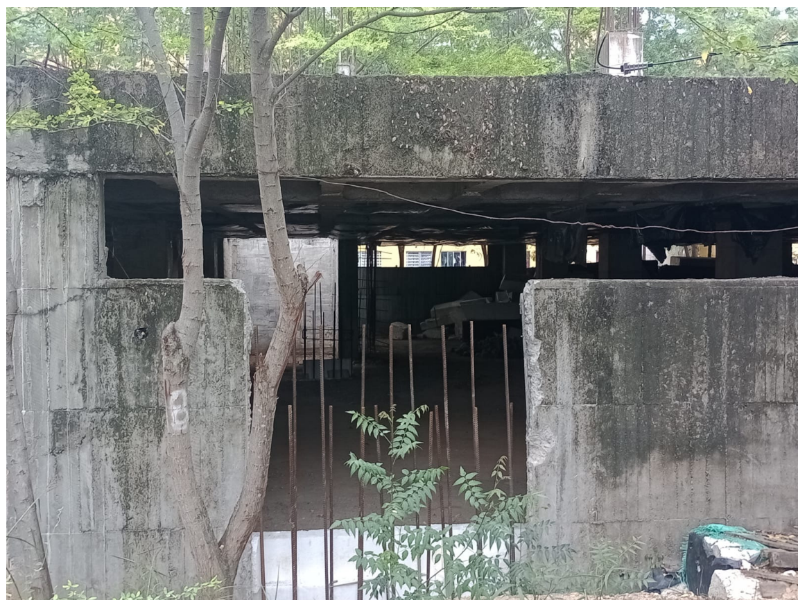
En este lugar, realizaron unas 'pequeñas' obras y todo quedó ahí.

Los estudiantes, se interrogan, ¿el edificio sí va estar listo para junio de 2025?