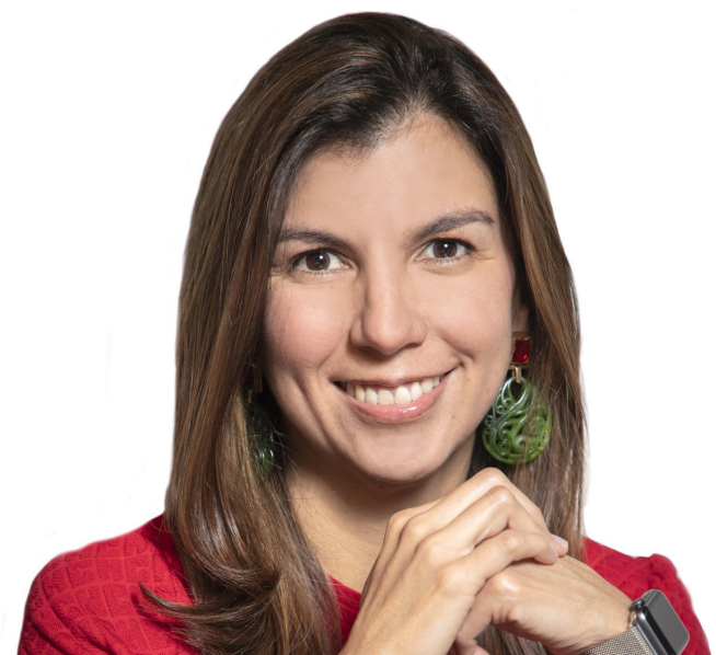
Figura de la semana

Vea columna completa en www.diariodelhuila.com