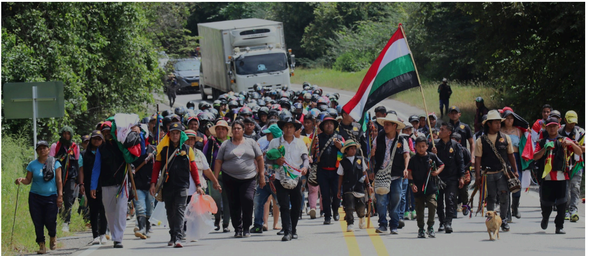
Indígenas del Huila durante las manifestaciones pacíficas en la Ruta 45, a la altura del puente El Pescador.

La Minga retorna a sus territorios tras ocho días de manifestaciones pacíficas en Hobo, logrando importantes acuerdos con entidades gubernamentales para la protección y pervivencia de los pueblos originarios del Huila.