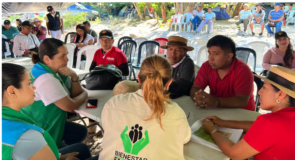
Representantes de la Minga y del Instituto Colombiano de Bienestar Familiar (ICBF) durante las negociaciones para proteger a niños, niñas y adolescentes de los territorios indígenas.