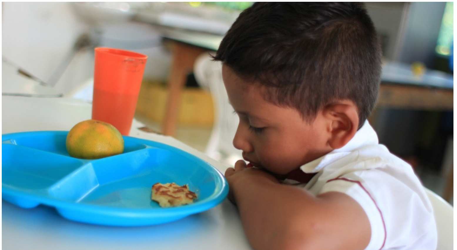
Estudiantes afectados por la suspensión del PAE enfrentan riesgo de deserción escolar debido a la falta de alimentación escolar.

Durante el mes y medio de suspensión del programa, diversas reuniones a nivel local y nacional no han logrado restablecer