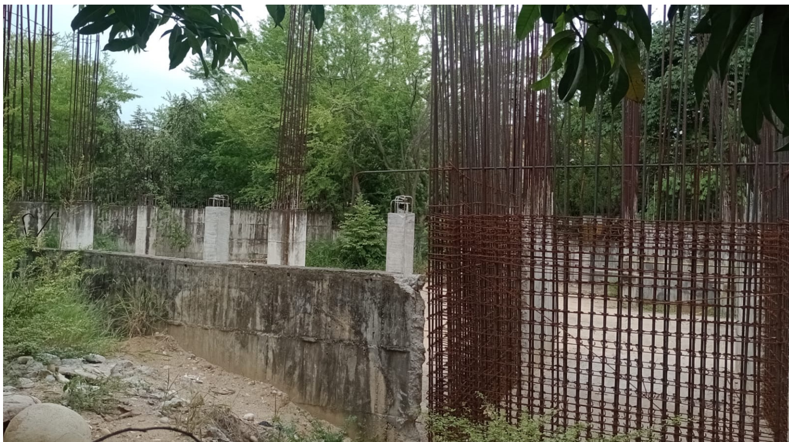
Así se encuentra la obra que inició en el año de 2011.

En este entendido, y preocupados porque como se dice coloquialmente la construcción no ‘arranca’, los estudiantes, confor-