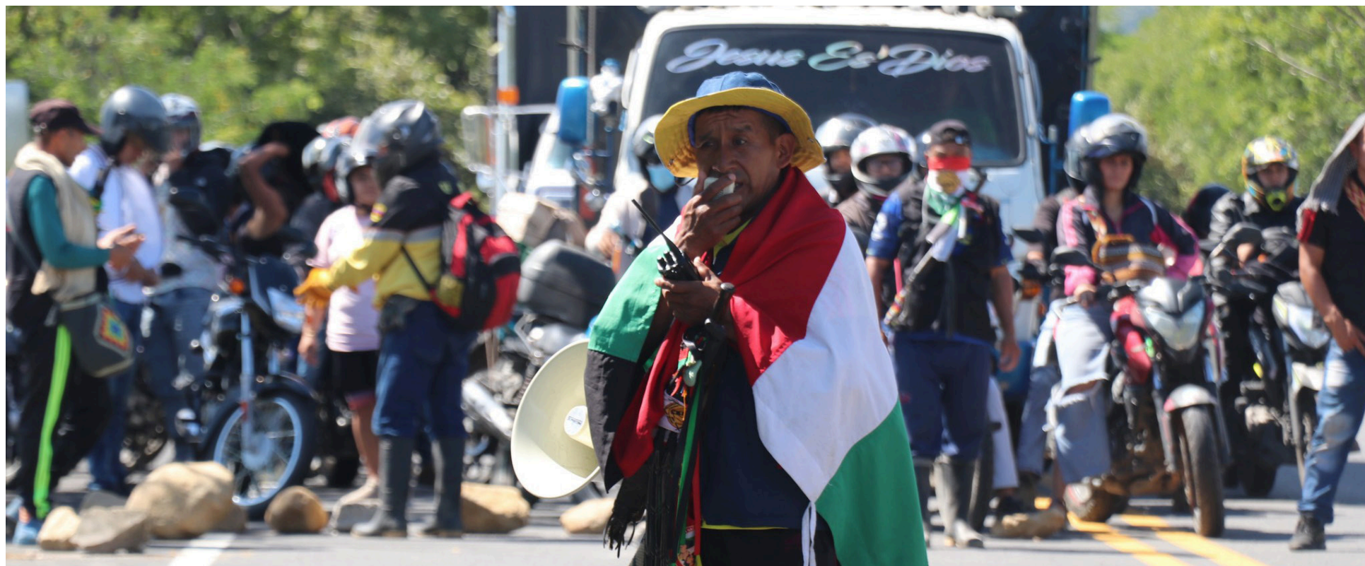
A pesar del retorno, la minga se trasladará a Bogotá para seguir presionando a las entidades gubernamentales y asegurar el cumplimiento de los compromisos adquiridos.

El objetivo principal de la Minga fue proponer acciones concretas que promovieran la recuperación del tejido social en los territorios desde la base. Esto implicó respaldar y proponer alternativas de solución a través de diálogos humanitarios y el fortalecimiento de los pueblos originarios.