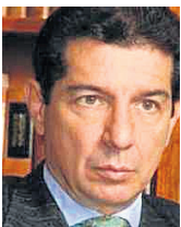
JOSÉ FÉLIX LAFAURIE RIVERA