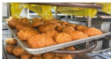
Panaderos del Huila, afectados por bajo consumo ■ ECONOMÍA 6-7