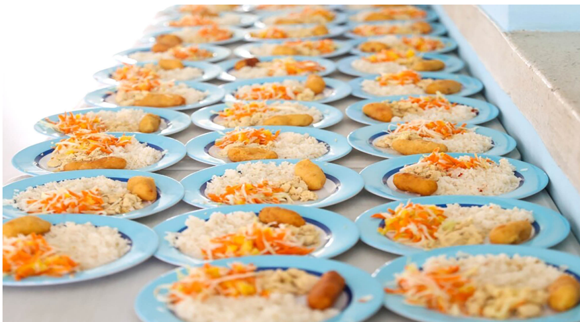
Se espera que las gestiones realizadas durante las vacaciones escolares permitan restablecer el servicio del PAE para los estudiantes de Algeciras en julio.

El secretario de educación departamental, Orlando Parga Rivas, declaró en su momento, que la suspensión del servicio del PAE se debió a la falta de garantías de seguridad para los estudiantes y el personal involucrado en la entrega de alimentos en el municipio. Esta situación generó preocupación no solo por la