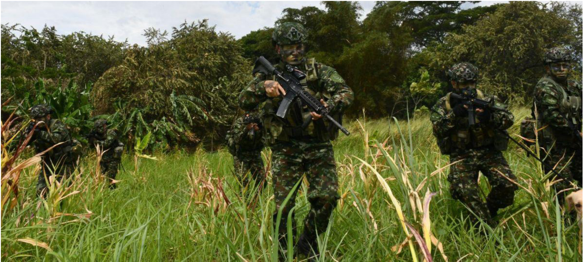
Enfrentamientos entre Disidencias y Ejército, incrementan el desplazamiento forzado.

Roja y un panelista de la Universidad Cooperativa, hablará de justicia restaurativa.