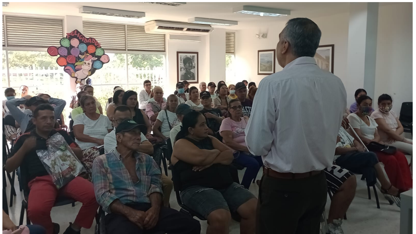
En el mes de febrero, se dieron 94 cartas de compensación por un valor cercano a los $770 millones, entregaron a población víctima en el Huila.