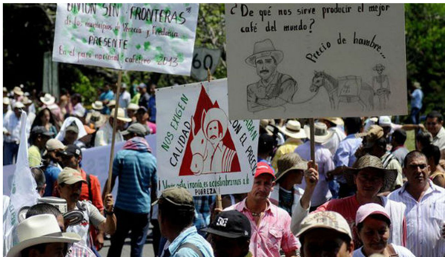
En cuanto a la situación actual del gremio cafetero a nivel nacional, existe una división evidente entre los productores, lo que dificulta la articulación de una postura común.

En consecuencia, el 17 de abril se movilizarán a lo largo de las carreteras del país, con la esperanza de que la presión social les otorgue las reivindicaciones que tanto necesitan.