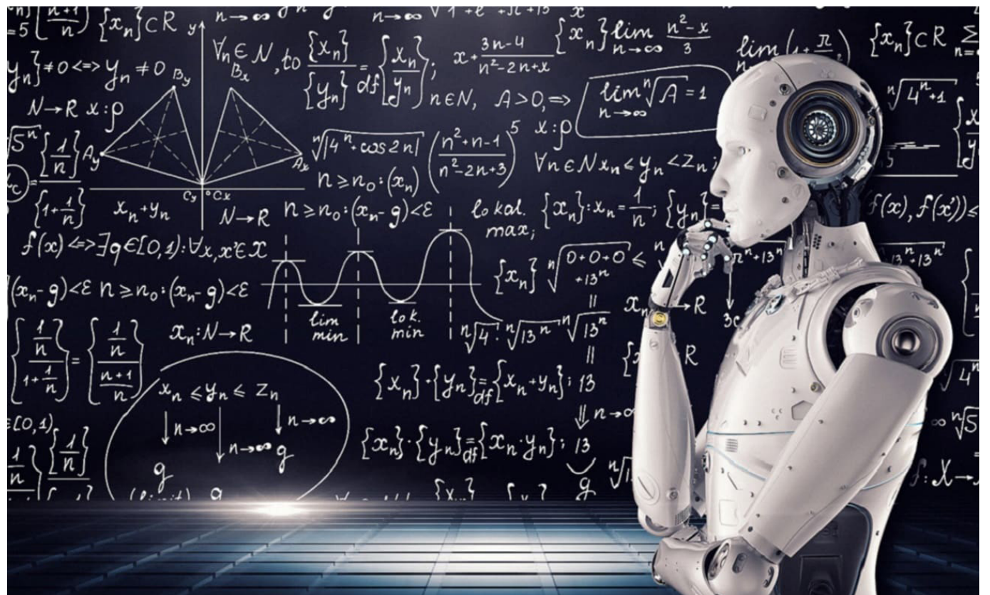
El avance de la inteligencia artificial es vertiginoso, mientras que los currículos educativos tradicionales se quedan atrás.

Una sinergia entre el sector educativo y el industrial es clave para actualizar los programas de estudio y alinearlos con las necesidades reales del mercado laboral.