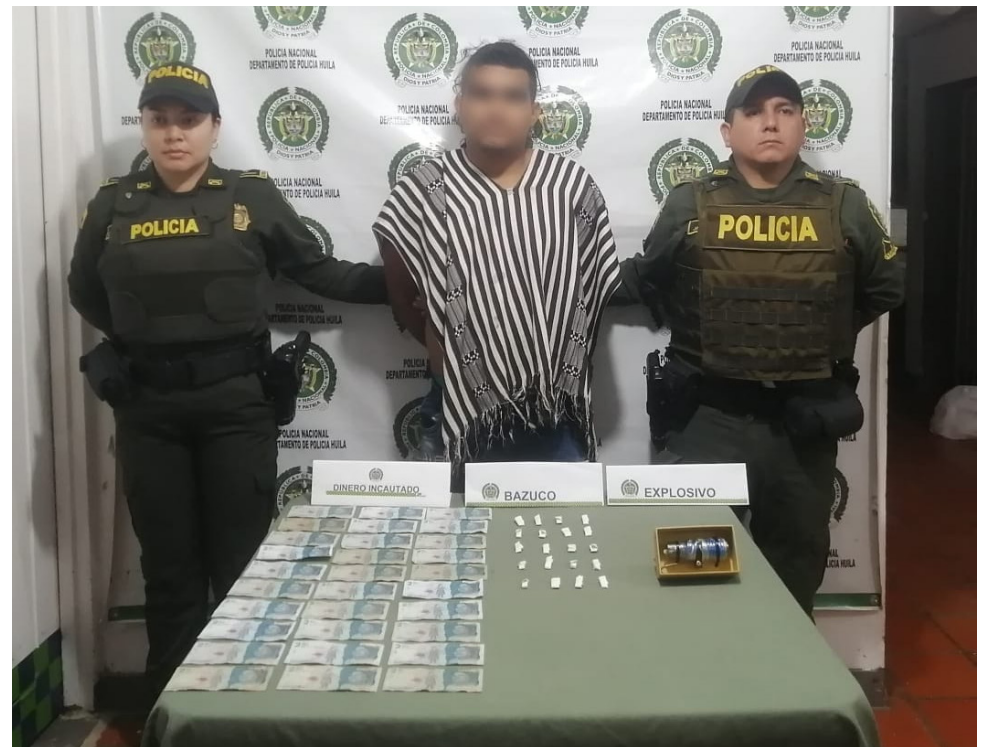
Cerca de 200 personas han sido detenidas en el Valle de Laboyos.

"Por ejemplo, lamentablemente nos asesinaron a un taxista, pero en menos de 24 horas, ya teníamos a una persona capturada. Porque anteriormente, se ofrecía una recompensa de $5 millones y la subimos a cerca de $30 millones", dijo el mandatario.