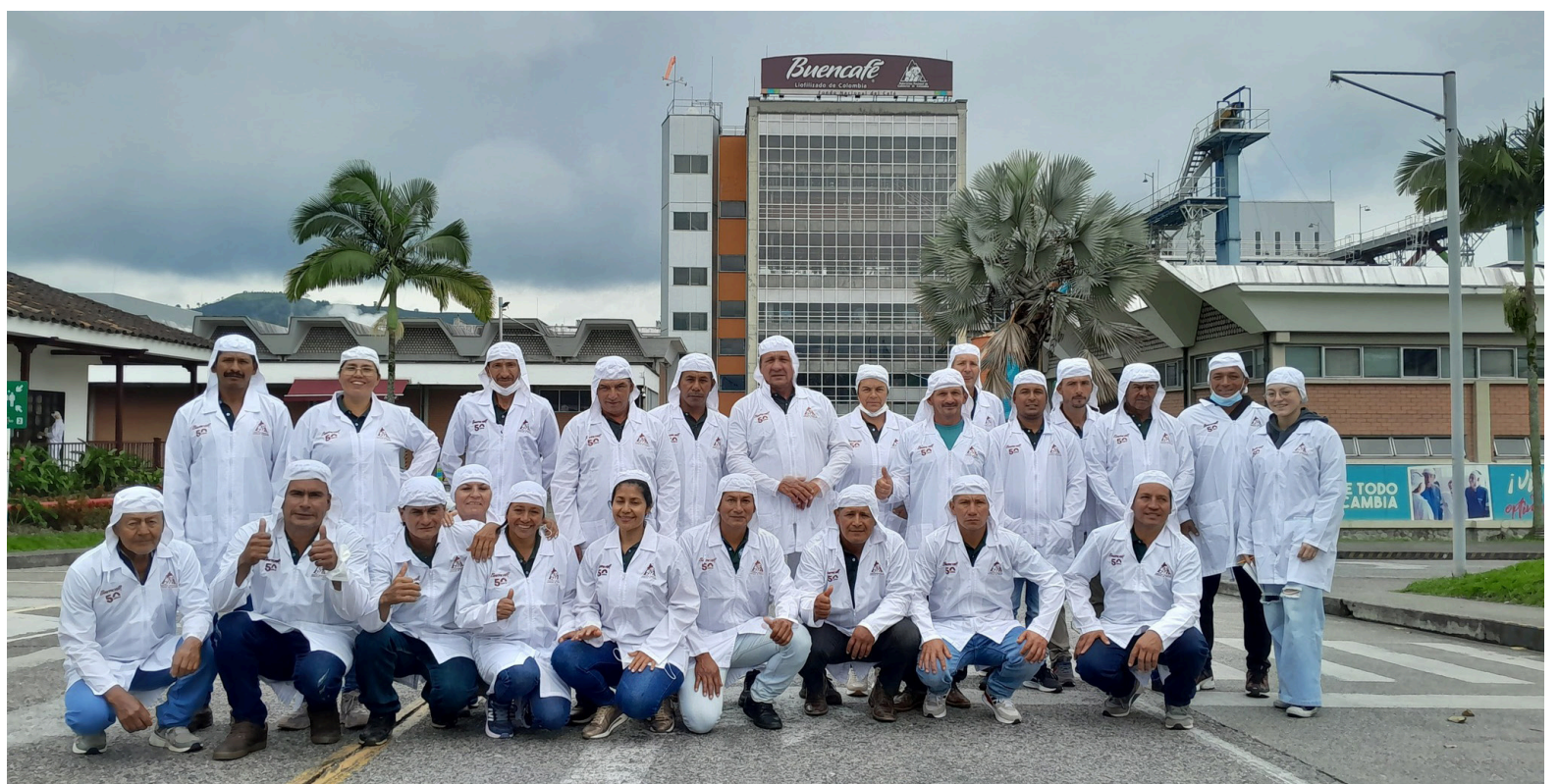
El Presidente del Comité Municipal de Cafeteros de Isnos indica que el llamado es a cosechar, para mantener una alimentación asegurada y balanceada desde las fincas.