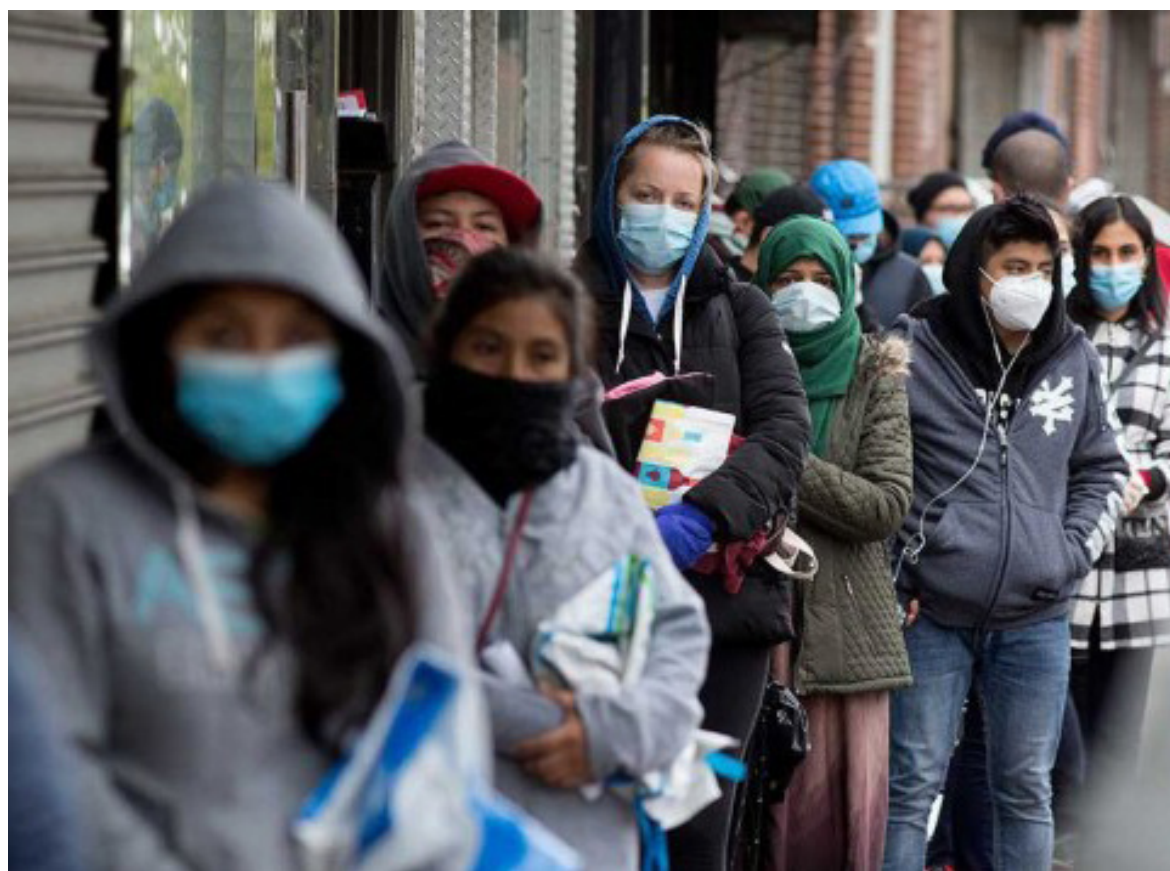
La dinámica del desempleo en Colombia ha sido influenciada por diversos factores, como la pandemia y las medidas económicas gubernamentales, según los datos del Dane sobre el mercado laboral.

A nivel nacional, la tasa de desempleo promedio se mantuvo en un 10,2% durante el año 2023, revela el compendio histórico publicado por el DANE.