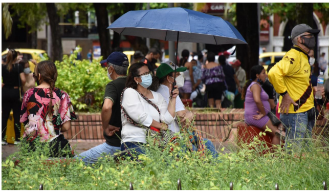
Bajó el desempleo en el Huila