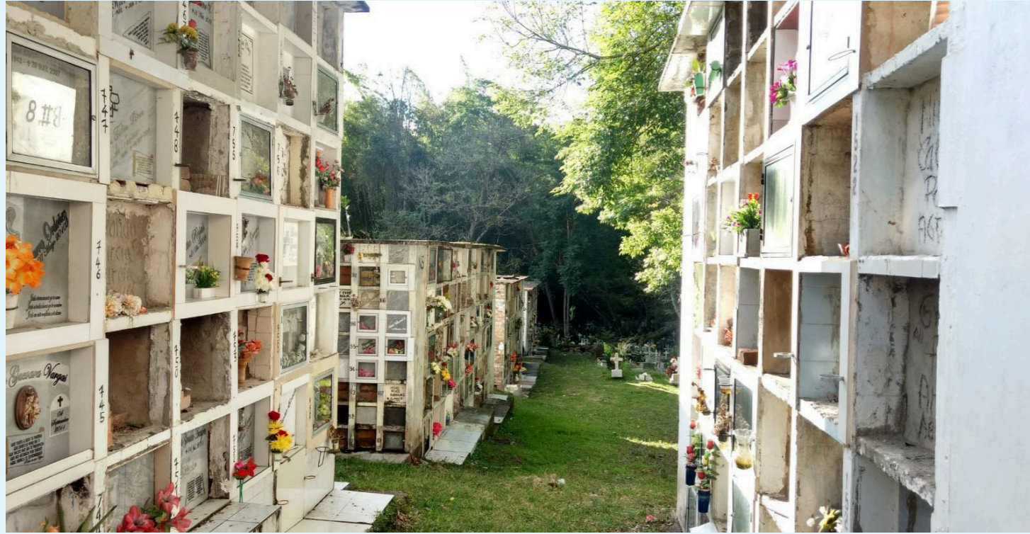
Cementerio San Antonio de Padua, Pitalito: En este cementerio, reposan los restos de al menos doscientas personas no identificadas relacionadas con el conflicto armado, motivando una labor humanitaria conjunta para su recuperación.

El municipio de Pitalito se prepara para un emotivo proceso de recuperación y dignificación de las víctimas del conflicto armado colombiano. La Unidad de Búsqueda de Personas Desaparecidas (UBPD), liderará acciones humanitarias de prospección y recuperación de cuerpos en el cementerio central de Pitalito y otras localidades cercanas.