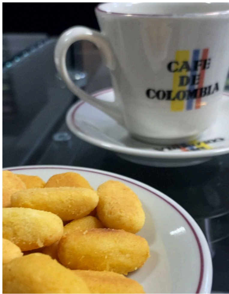
En el Huila, donde el café y la achira se entrelazan en un abrazo de tradición y sabor.

la achira, cultiva árboles frutales, maíz, yuca y plátano, lo que le permite mantener una alimentación balanceada para su familia y generar ingresos adicionales.