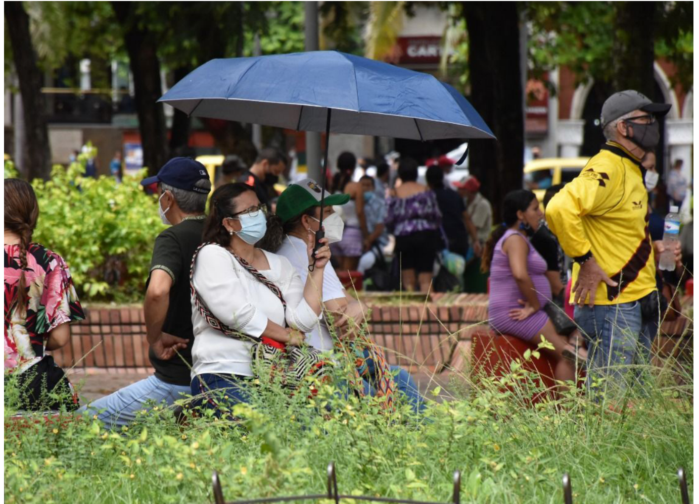
En 2023, Huila se destacó por tener una tasa de desempleo del 8,1%, siendo uno de los departamentos con los registros más bajos a nivel nacional.

El Departamento de Huila figura entre las regiones con tasas de desempleo inferiores al 10% durante el año 2023, según el reciente informe del DANE.