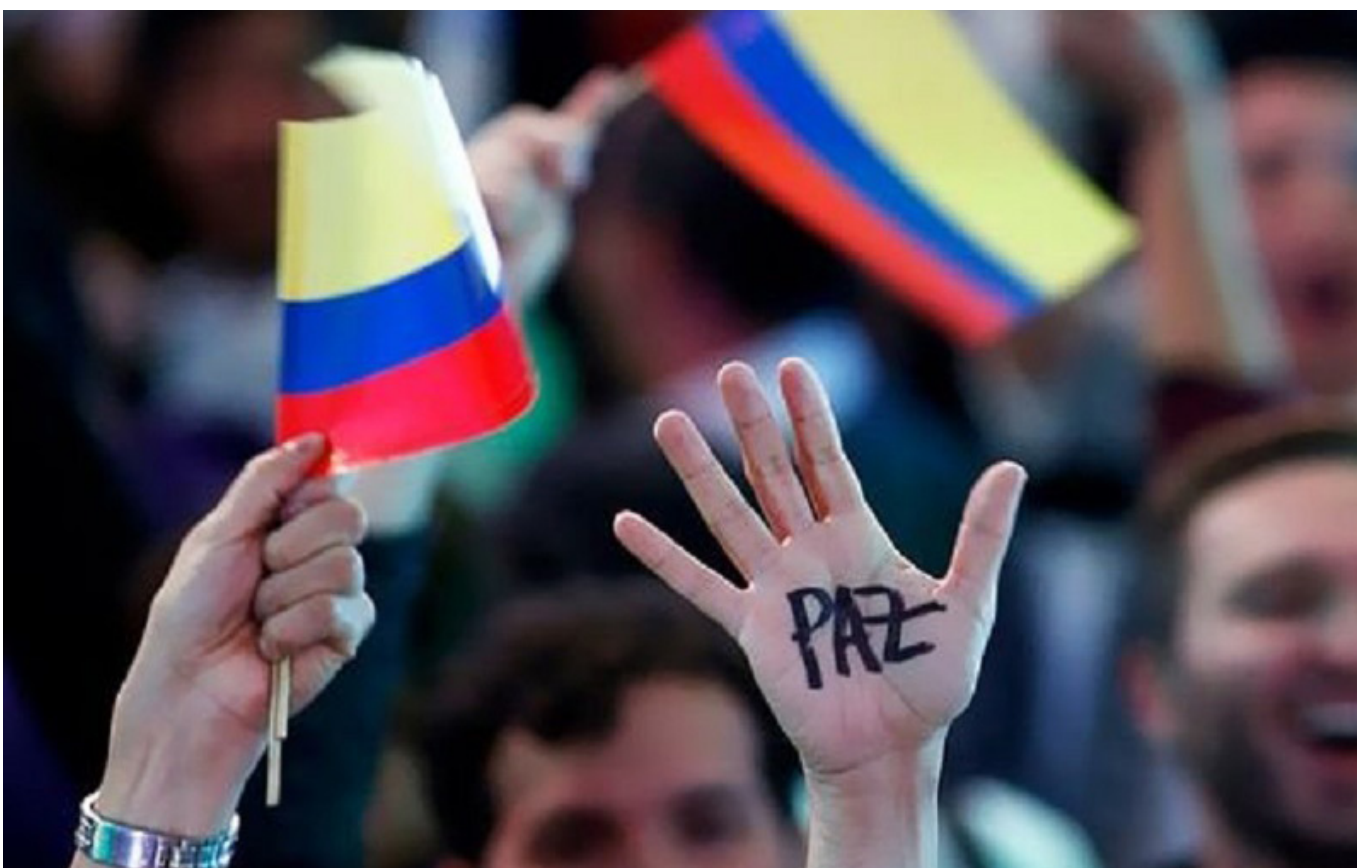
La jornada académica, va a permitir analizar: ¿para dónde va la paz en la ciudad de Neiva?

“Y en el departamento del Huila, hay 1.149.000 mil habitantes, de los cuales el 20%, corresponde a víctimas del conflicto armado y desde que inició la implementación de esta ley, en el Departamento han entregado $196 mil millones”, agregó la directora.