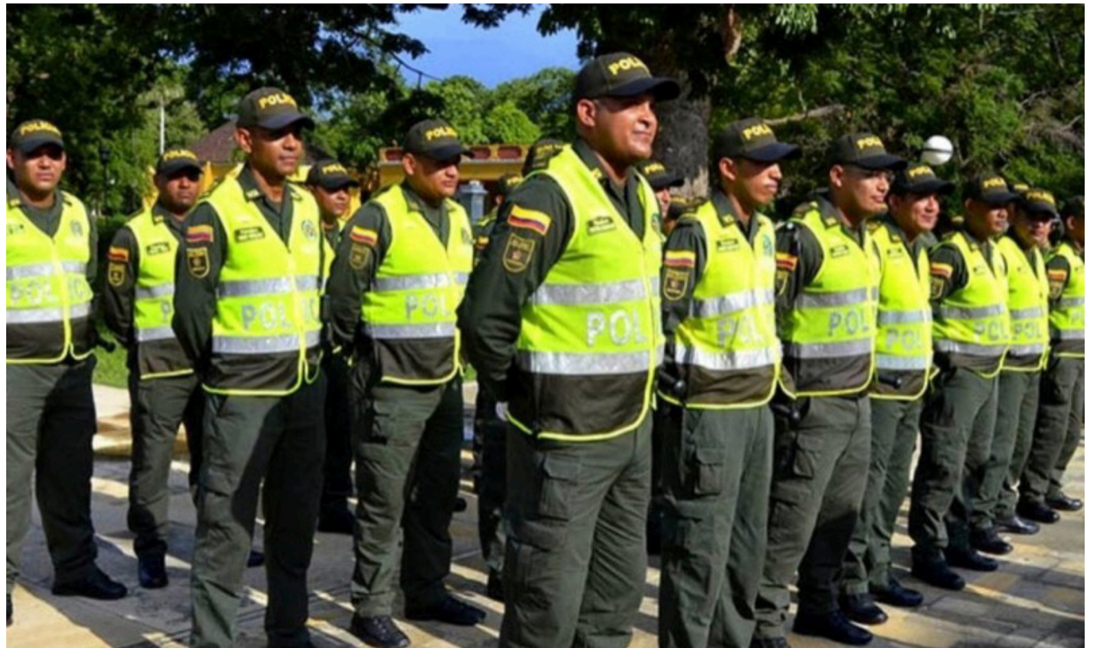
Esta localidad cuenta con 100 nuevos policías.