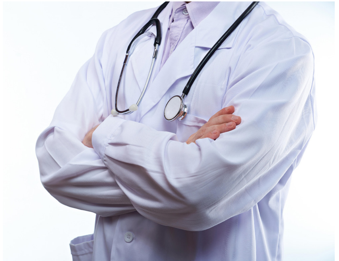
Marcha Batas Blancas.

En ese sentido, sostienen que los presidentes de las agremiaciones que suscriben dicho comunicado y que no tienen intereses políticos manifiestan su respaldo a la llamada Marcha de Batas Blancas, programada para el 21 de abril en todo el territorio nacional.