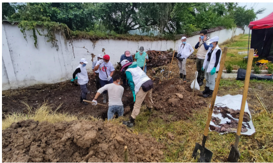
Intervendrán cementerio central de Pitalito