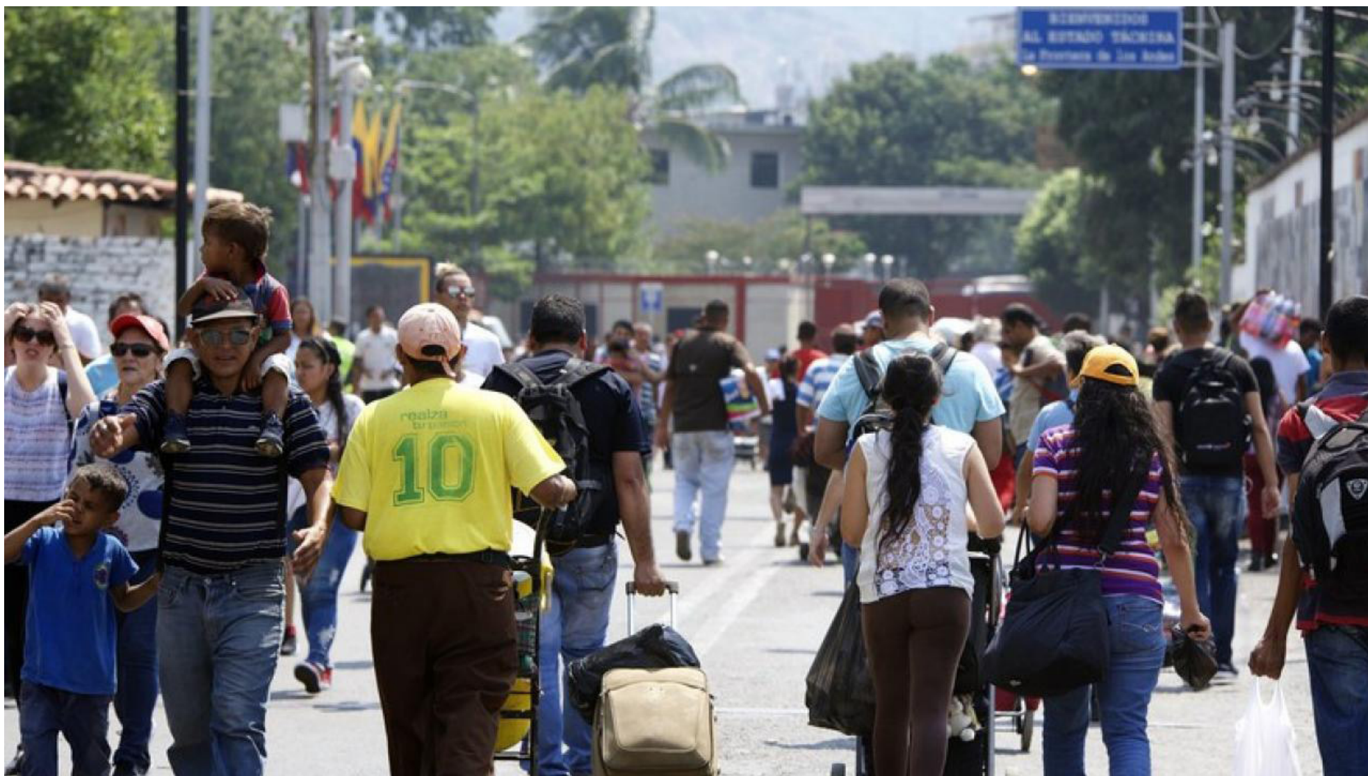
La tasa de desempleo nacional promedio en 2023 se mantuvo en un 10,2%, según el Dane, reflejando la situación general del país en materia laboral.

años después, esta cifra ha mostrado un descenso notable hasta llegar al 11,7%.