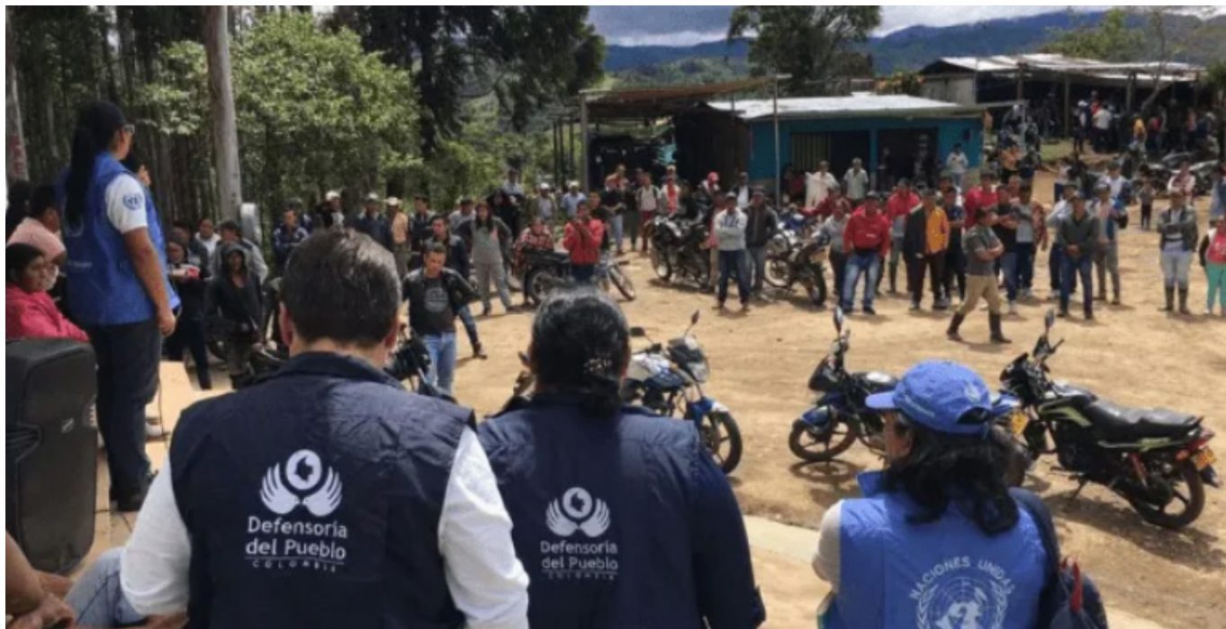
El desplazamiento, homicidio y desaparición forzada, es lo que más afecta a la población civil.

De igual manera, habrá tres conversatorios. El primero de ellos es sobre minas antipersona, una charla sobre derechos humanos y derecho internacional humanitario, a cargo de un funcionario de la Cruz