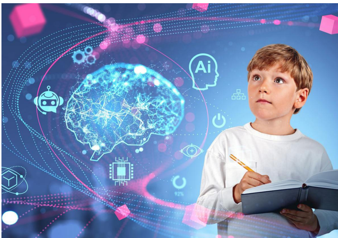
La inteligencia artificial ofrece un mundo de posibilidades, desde la creación de nuevos puestos de trabajo.

La inteligencia artificial ofrece un mundo de posibilidades, desde la creación de nuevos puestos de trabajo hasta la solución de problemas globales. Juntos, podemos allanar el camino para que futuros profesionales aprovechen al máximo el potencial transformador de la IA y contribuyan a una sociedad más justa, inclusiva y sostenible.