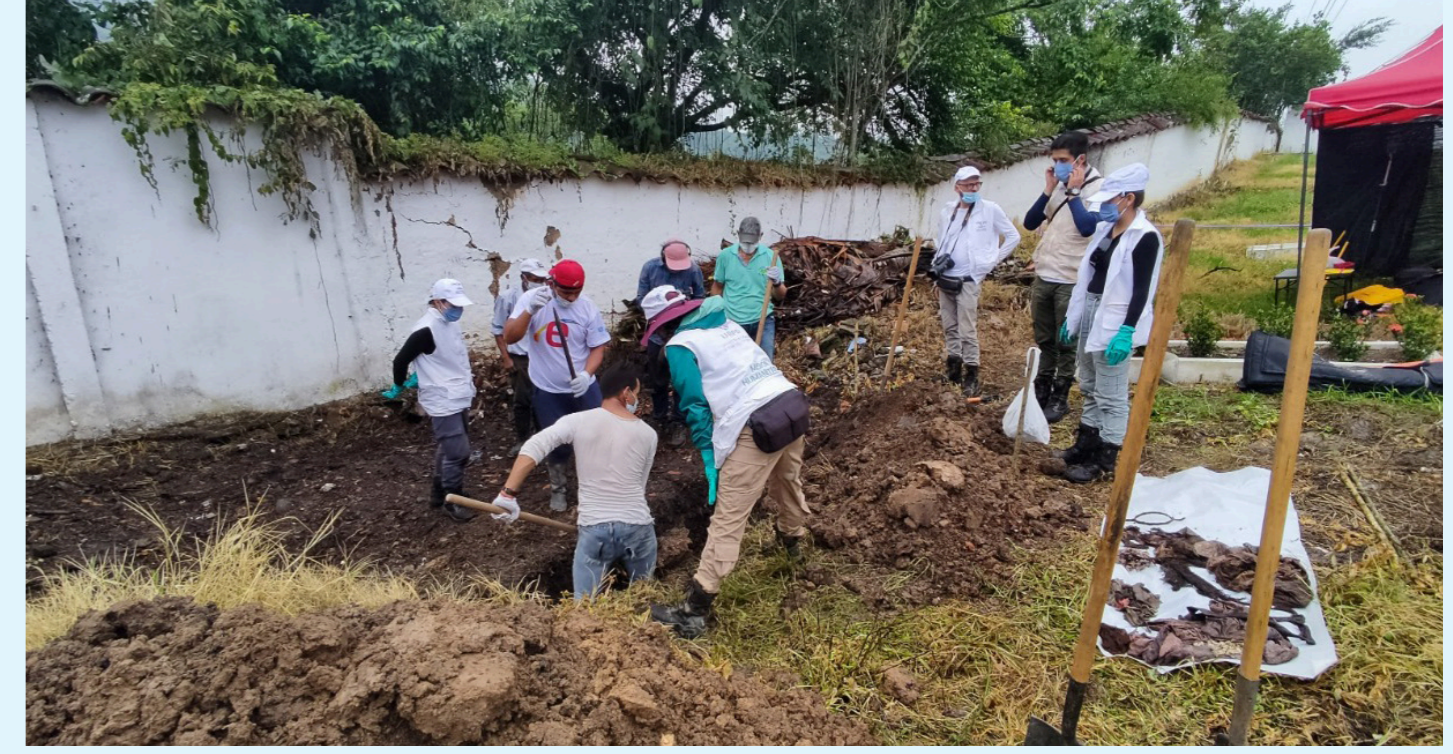
La UBPD enfatiza la importancia de la colaboración de la comunidad en la búsqueda de personas desaparecidas. Todas las operaciones se realizan bajo estricta confidencialidad para garantizar la seguridad y privacidad de los involucrados.