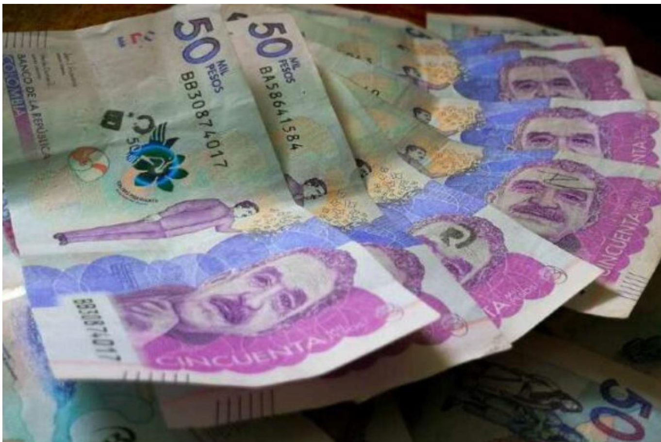
Incrementaron de $5 a $30 millones el pago de recompensas.