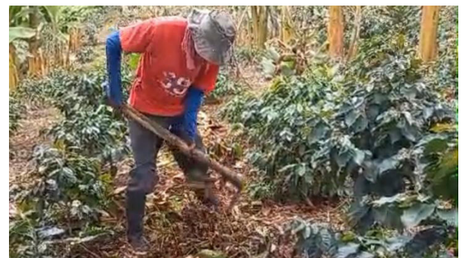
Café y achira: esencia huilense