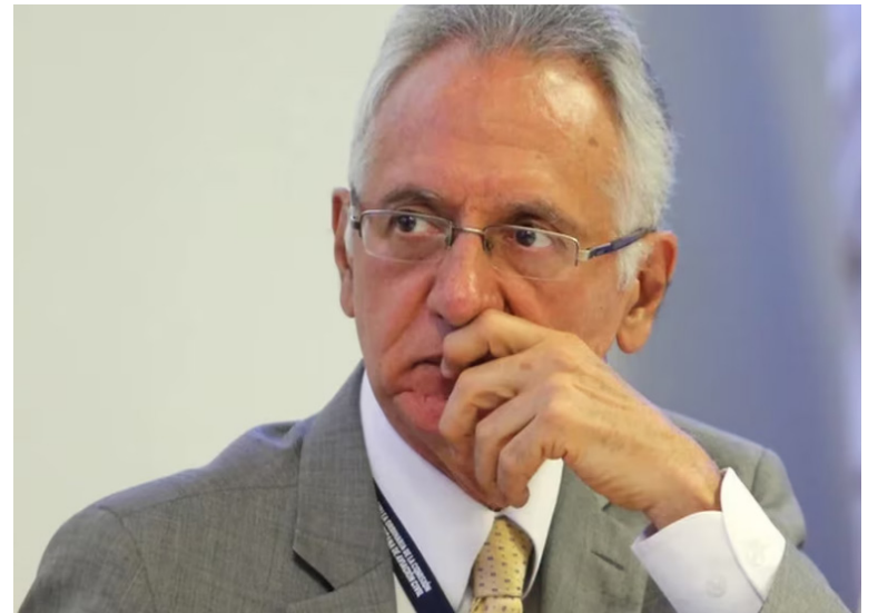
El Ministerio de Salud, en cabeza de Guillermo Alfonso Jaramillo, y la Superintendencia Nacional de Salud, liderada por Luis Carlos Leal, anunciaron esta semana nuevas medidas para el sector.

Esta misma semana, la Asociación Colombiana de Sociedades