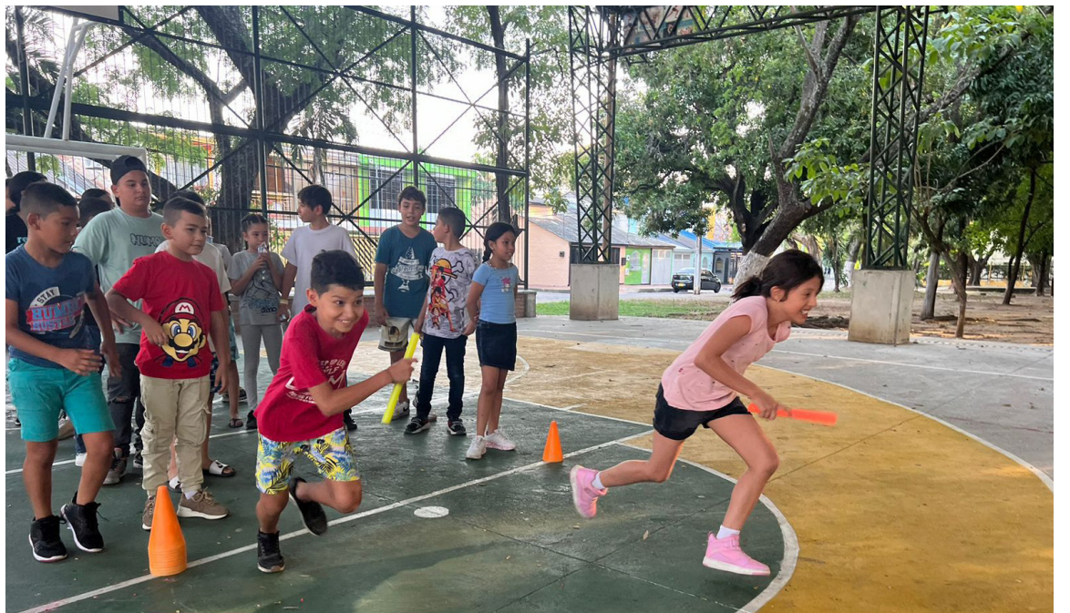
La Secretaría de Deporte y Recreación en un trabajo articulado con la Policía Nacional, llega a las comunas de la ciudad, por medio del programa 'Vías activas y saludables' con la estrategia 'Activa tu barrio'.