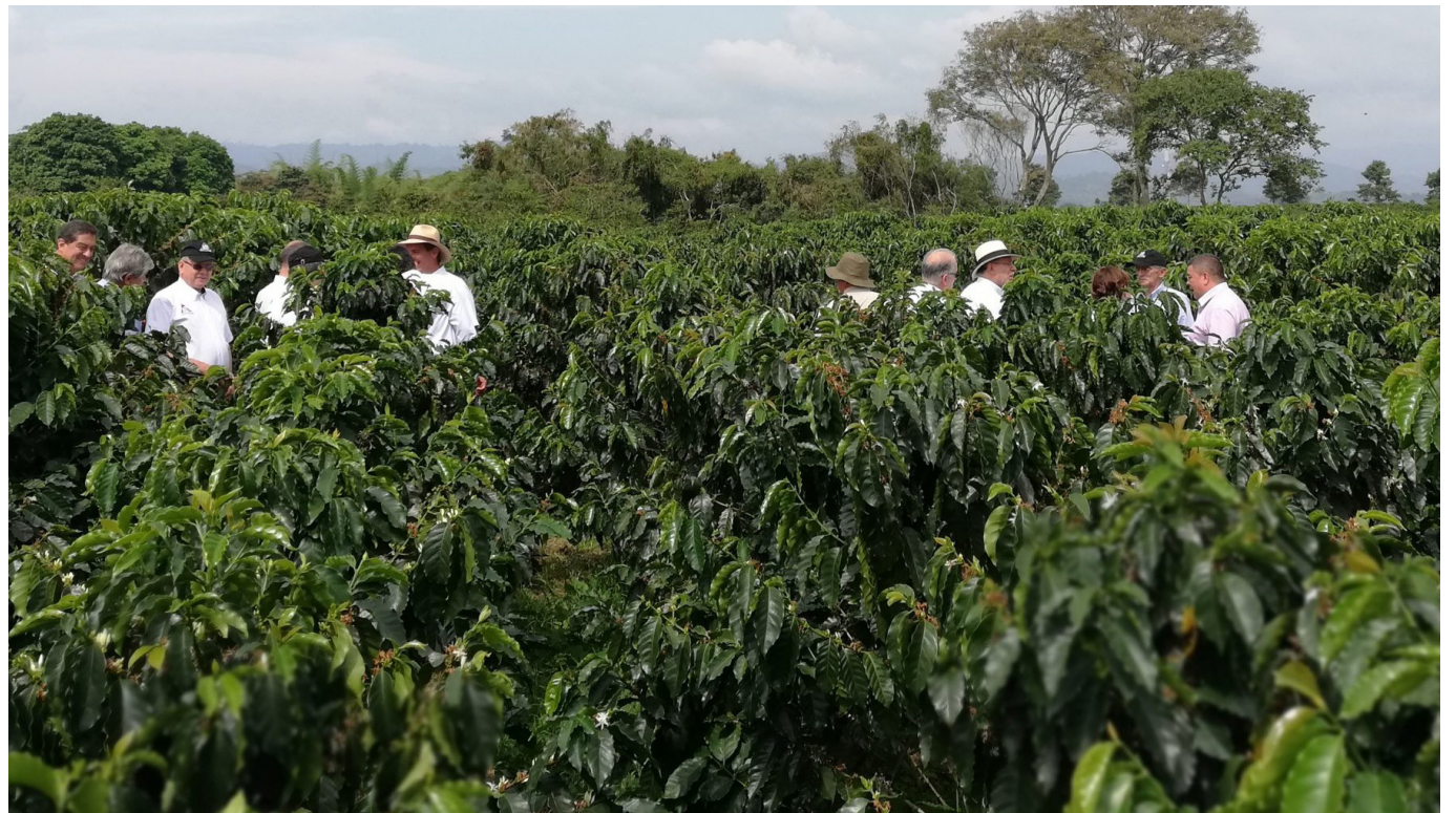
La falta de inyección de recursos por parte del Gobierno Nacional a la Federación Nacional de Cafeteros ha generado preocupación entre los productores.

Mientras los cafeteros del norte del Huila optan por dar tiempo al gobierno para tomar medidas, otros sectores del país se preparan para una movilización nacional debido a la crisis que atraviesa el gremio y la falta de apoyo gubernamental.