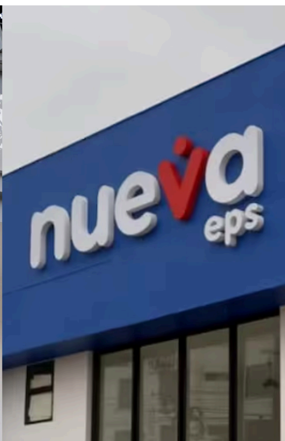
Sanitas y la Nueva EPS fueron intervenidas por la SuperSalud.

Científicas también había anunciado su respaldo a la marcha y también invitó “a los profesionales médicos de todas y cada una de sus especialidades y formaciones académicas y científicas, y en general al talento humano en salud y a la comunidad en general, a participar de la referida marcha, en procura de la salud de todos los habitantes del territorio nacional”, como lo expresó en un comunicado.