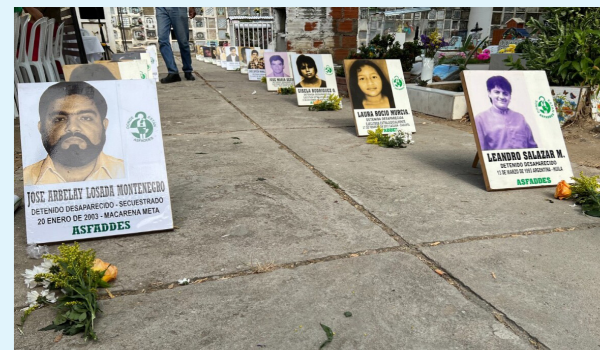
De acuerdo con la Unidad de Búsqueda de Personas Desaparecidas (UBPD), al menos 1.500 individuos han desaparecido en Huila como resultado directo de este conflicto desde la década de los 80 hasta diciembre del 2016.