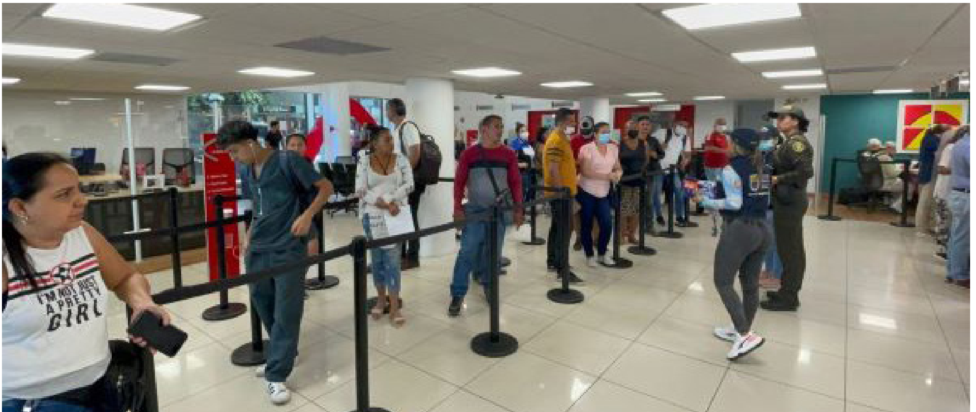
Las ciudades capitales demostraron ser las más peligrosas en estas fechas.

Respecto a la prevención del hurto, la alcaldesa anunció que se harán 206 campañas de prevención en zonas priorizadas que demostraron ser las de mayor afectación en el 2022, siendo estas las localidades de Ciudad Bolívar, Usme, Kennedy, San Cristóbal, Rafael Uribe, Bosa, Engativá y Suba.