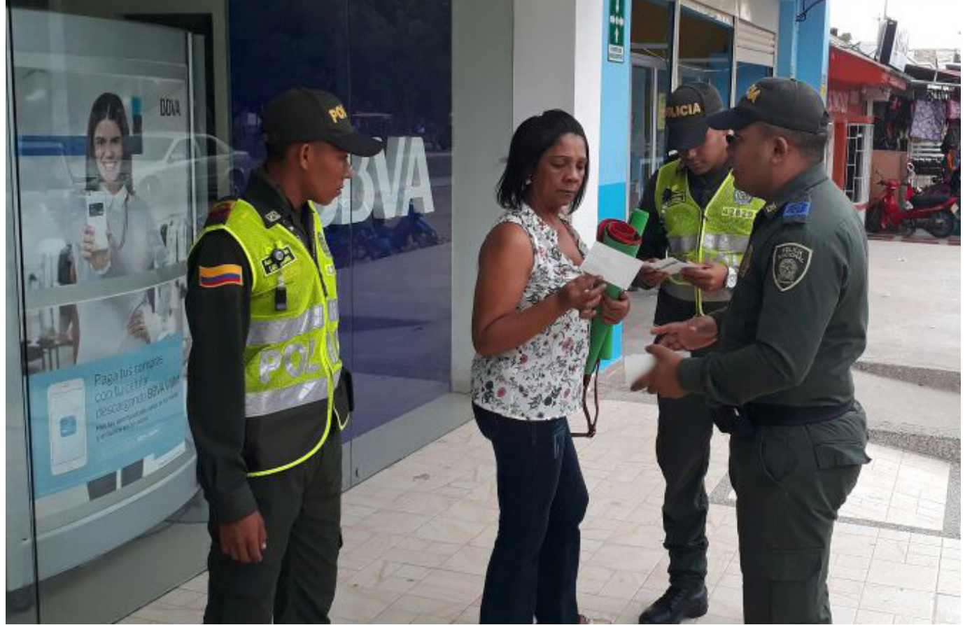
Bogotá representa la ciudad más peligrosa de todo el país en esta temporada.

Buena parte de los casos de robo sí fueron mediante el empleo de algún objeto para intimidar a sus víctimas. El 13 % de las personas fueron robadas con un arma blanca, mientras que el 18 % fue con arma de fuego.