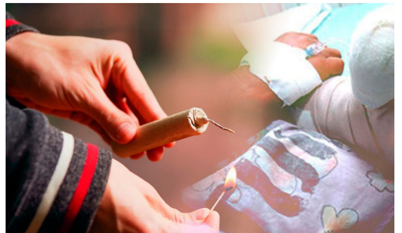
Pese al llamado constante de las autoridades a no usar pólvora durante las celebraciones decembrinas, la ciudadanía insiste en esta práctica.

Gracias al boletín número 12 del INS también se conoció que el 64,8 % de las actividades en las que se presentaron los quemados fue por manipulación, 24,8 % por observación, 1,7 % por fabricación, 1,0 %