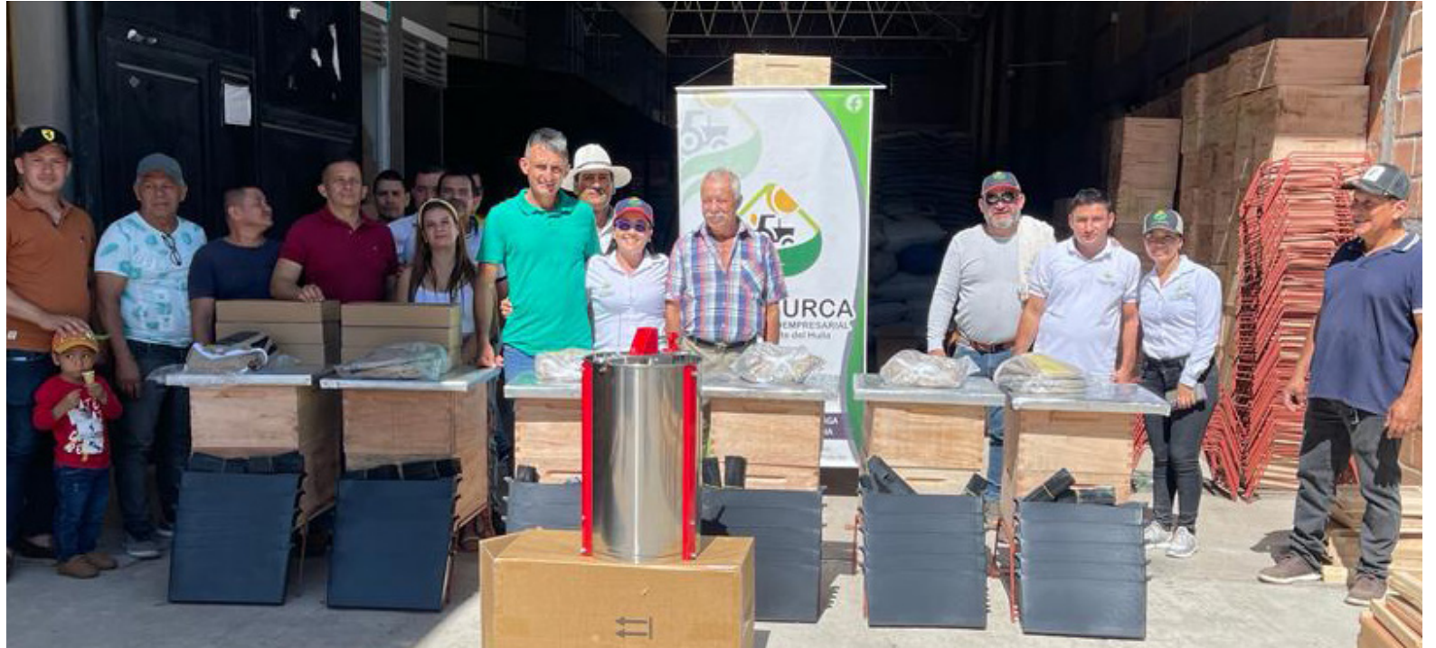
Auxilios dados a los productores.

Y entre los elementos que serán entregados a los beneficiarios para fortalecer las capacidades productivas se encuentran, 1.890 colmenas tipo Langstroth que consta de un techo forrado en lámina metálica, subtapa, alza profunda con 10 marcos alambrados, 1 cámara de cría con 10 marcos alambrados, 1 piquera, un soporte en varilla, 25.000 láminas de cera estampada (16 por colmena), 1.575 alimentadores internos plásticos importados con sistema