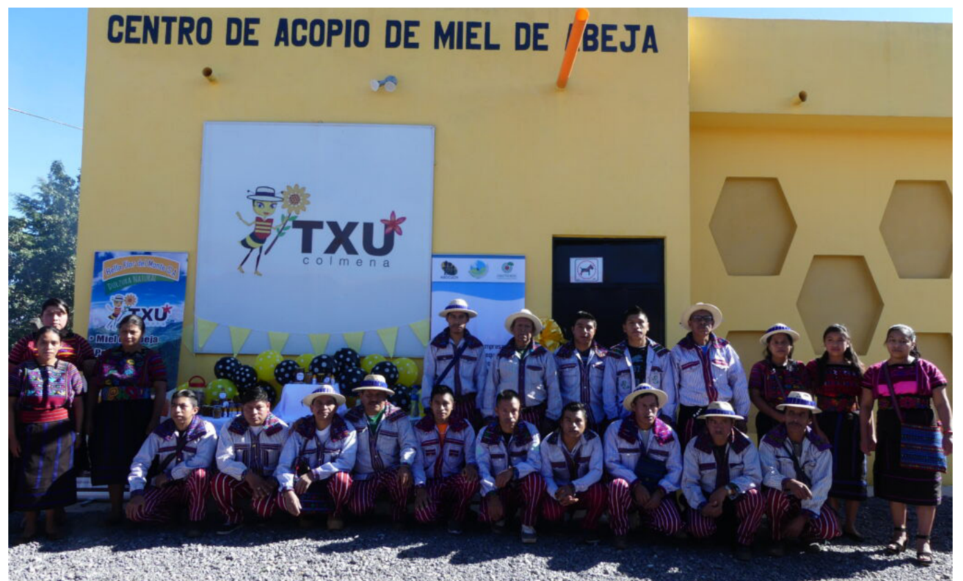
Otra de los proyectos a futuro que beneficiaría al sector, es la creación de un Centro de Acopio de miel y sus derivados.

Además de contribuir con la reactivación económica del sector, el evento también permitió hacer un llamado a la sociedad sobre la importancia de las abejas como agentes polinizadores, por lo que se debe replantear el uso de pesticidas en las labores agrícolas.