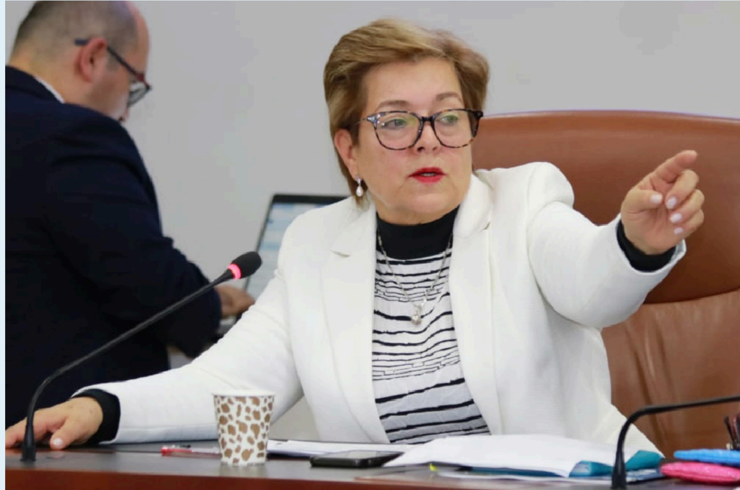
La ministra del Trabajo defendió la reforma diciendo que es hora de actualizar el código de sustantivo del trabajo, que tiene 70 años.

La reforma laboral finalmente avanzó en su trámite legislativo, si bien solo se aprobaron 16 artículos de 98, el proyecto sigue vivo y el debate se reanudará en febrero de 2024.