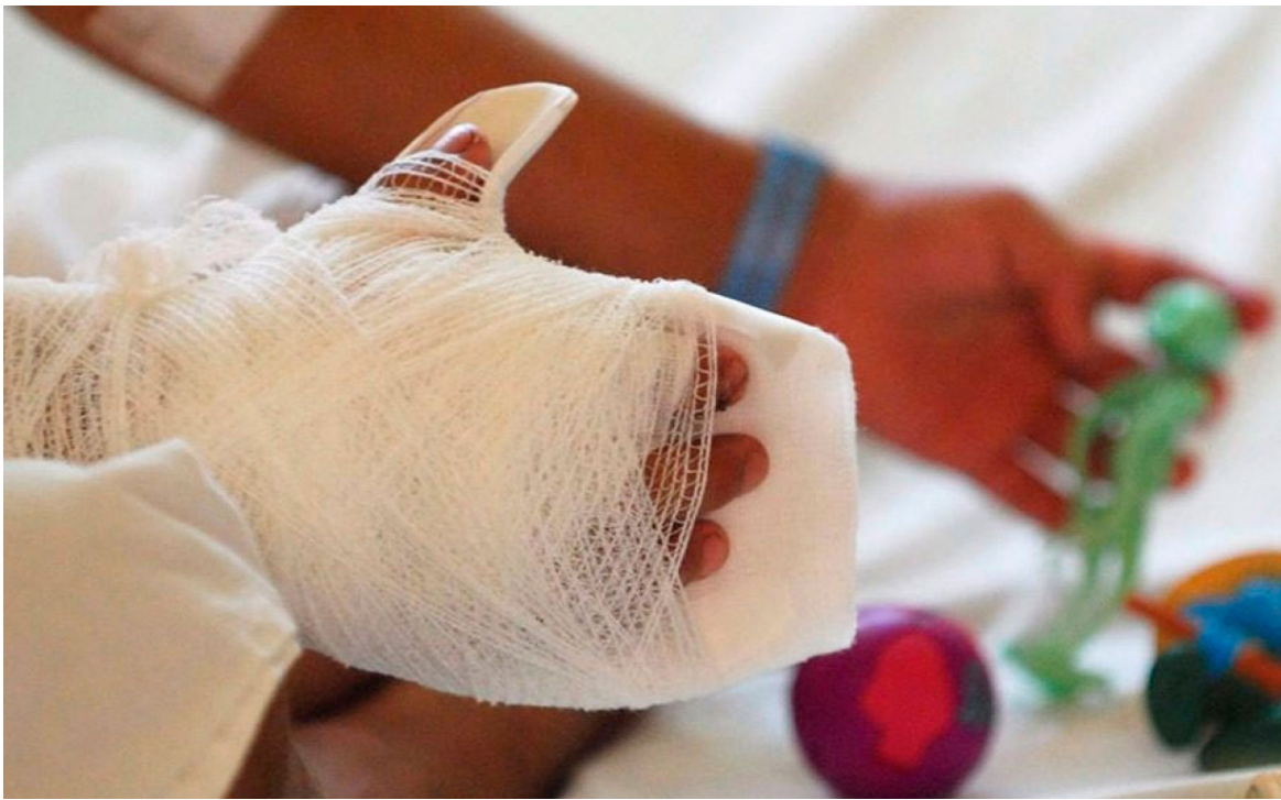
Reporte del INS sobre quemados en Colombia durante diciembre de 2023.

■ El Instituto Nacional de Salud emitió su boletín número 12. De esos 290 quemados, 100 son menores de edad (seis de ellos estaban en compañía de un adulto bajo efectos del alcohol) y 190 adultos (65 en estado de embriaguez).