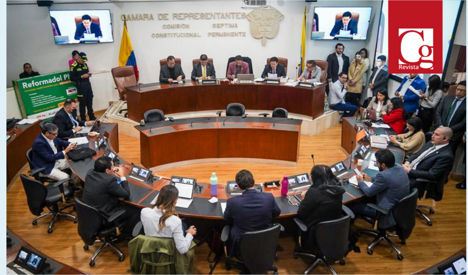
Comisión VII de la Cámara de Representantes.

También se aprobaron los límites en la subordinación laboral; medidas para la eliminación de la violencia, el acoso y la discriminación laboral; el artículo que define que las plataformas digitales de reparto deberán asumir el 60 % de la seguridad social de los repartidores; la supervisión humana de los sistemas automatizados; la regulación del trabajo de los migrantes en el país.