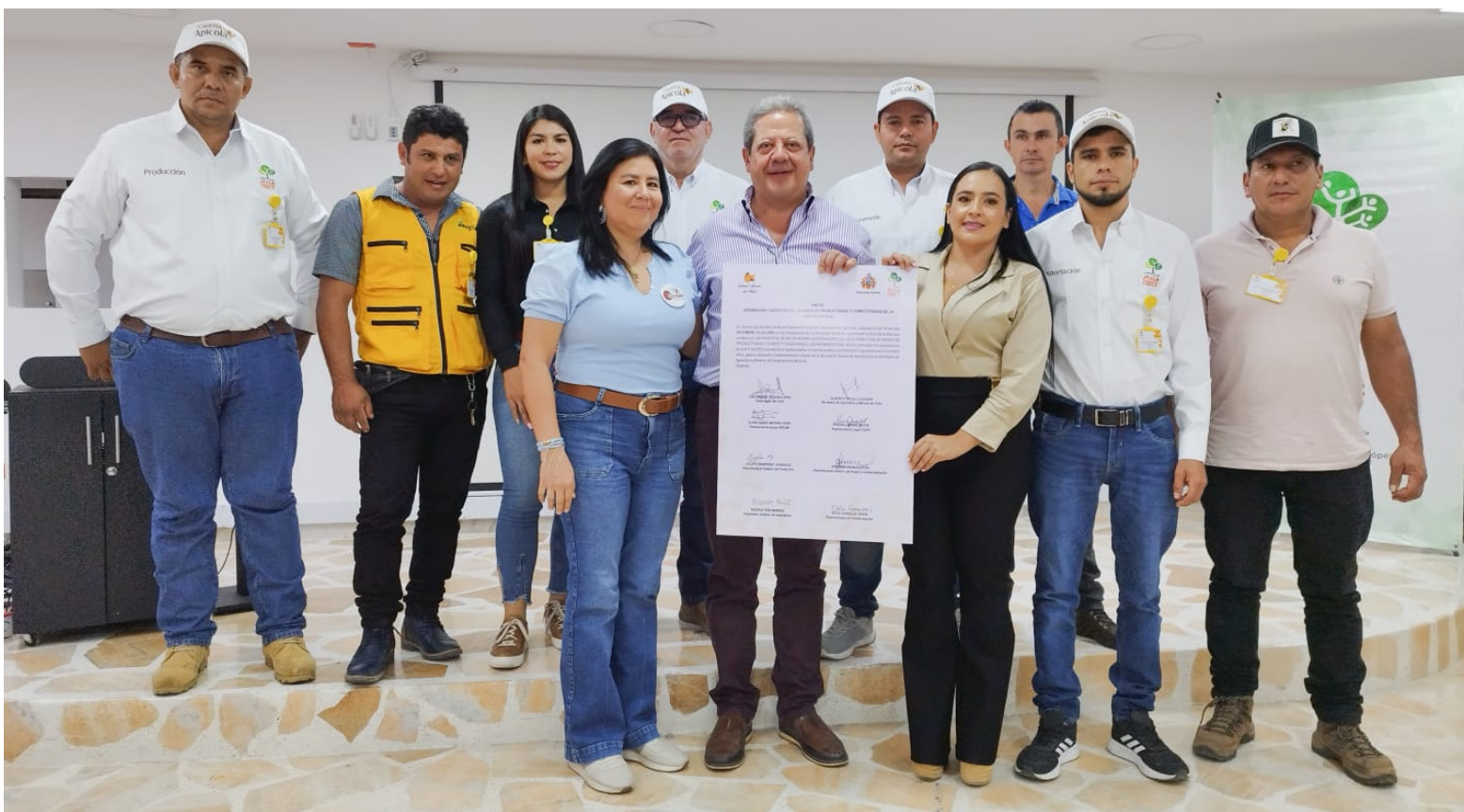
El Acuerdo de Productividad y Competitividad Apícola, ya es un hecho.

Además, de la miel, los operarios trabajan con el polen, propó-