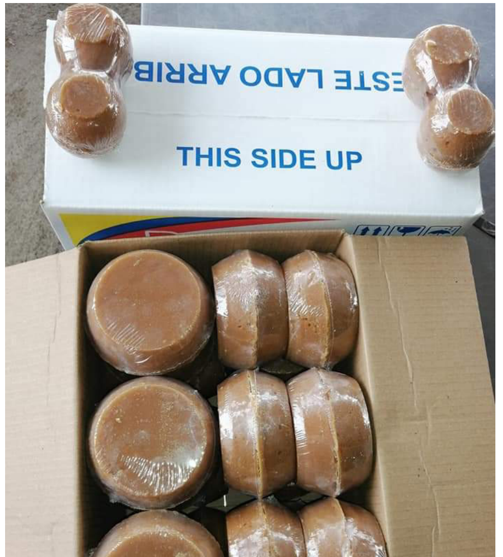
De manera estimativa, 1.200 toneladas anuales llegar a los mercados internacionales.