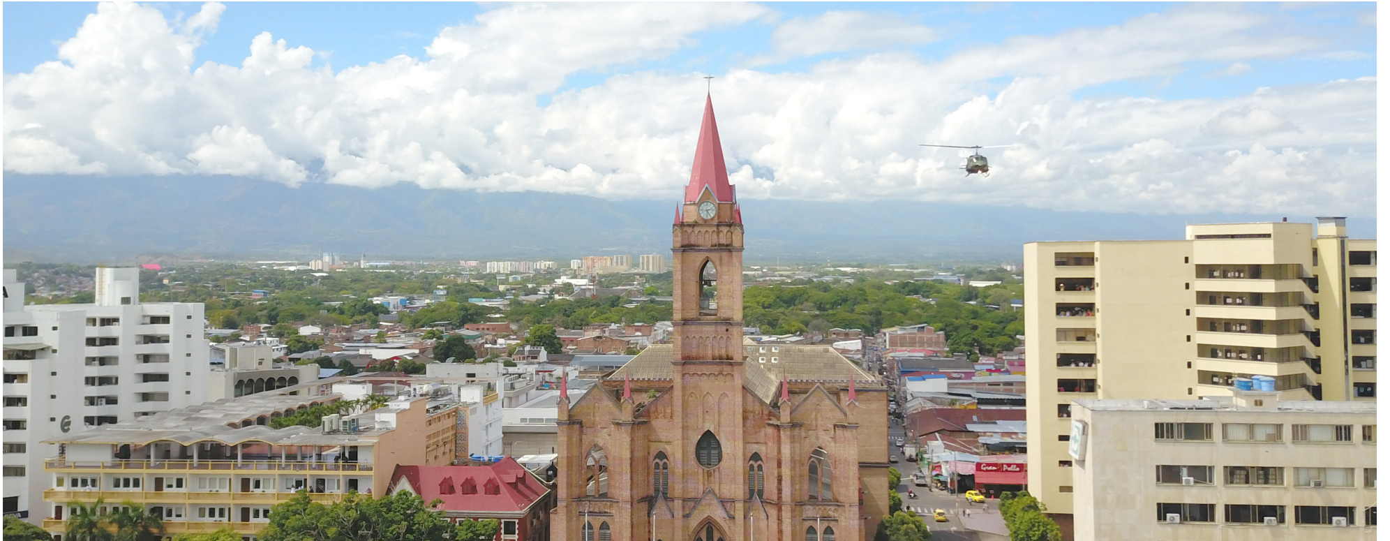
El panorama pintado por Amaya es desolador, mencionando que el municipio enfrenta embargos en 28 cuentas.