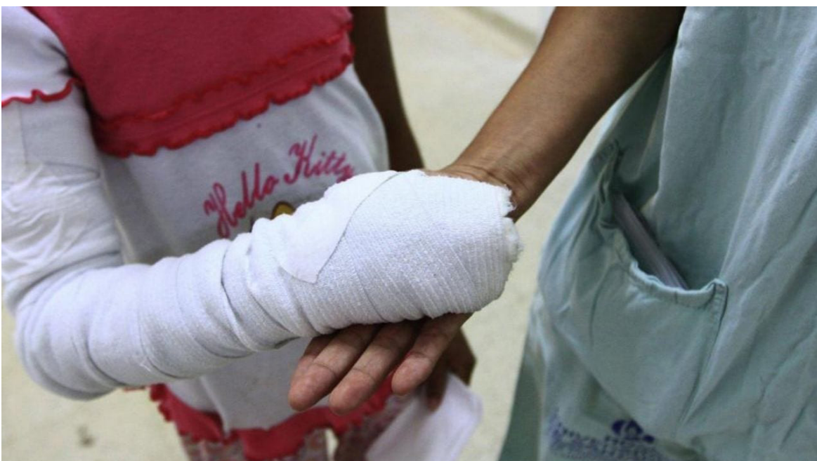
Entre diciembre de 2022 y enero de 2023, un total de 1145 personas sufrieron lesiones relacionadas con pólvora.

El Instituto Nacional de Salud (INS) reportó este 10 de diciembre de 2023 que la cifra de quemados aumentó en 22 casos, pasando de 268 a 290 este domingo. Esta cifra representa una variación del 5,1 % con respecto al mismo periodo de 2022.