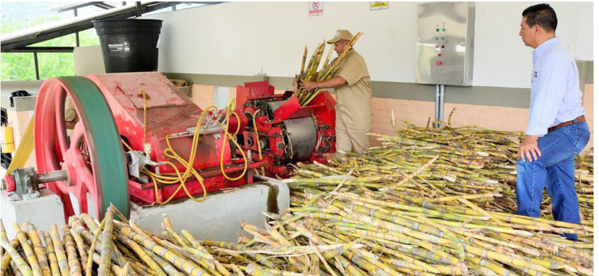
Según Fedepanela, se calculan que existen 350.000 familias paneleras en Colombia.