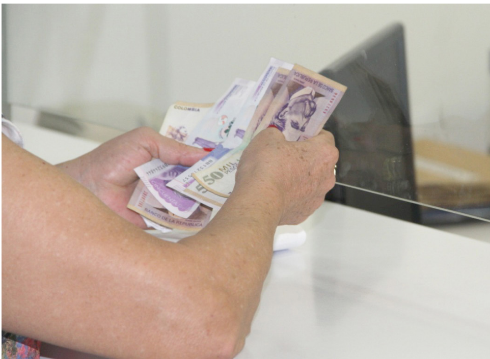
En medio de la actual crisis financiera, se encuentra en proceso la firma de un convenio con la Comisión Nacional del Servicio Civil para la inclusión en la carrera administrativa de 247 personas.