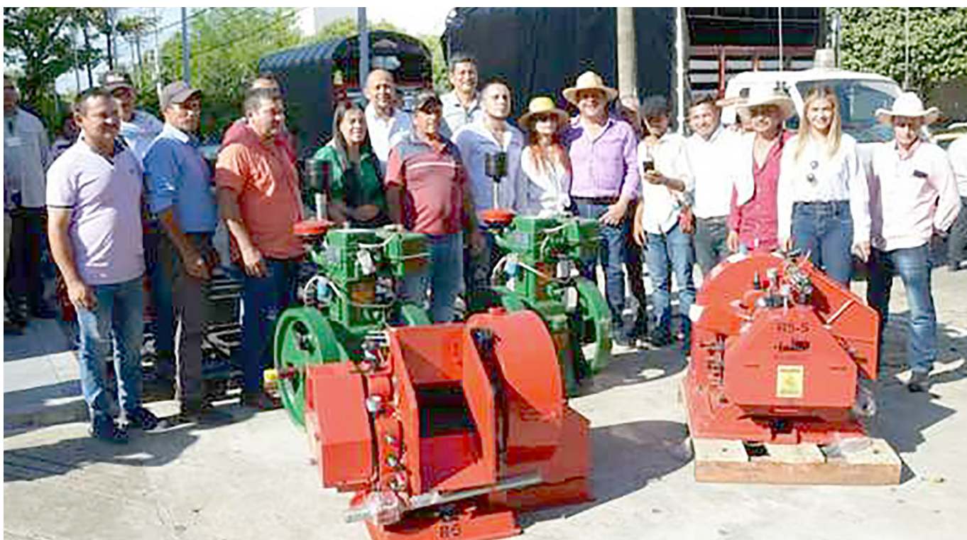
Entrega de trapiches para mejorar la producción.

Por su parte el gobernador Luis Enrique Dussán López, sostuvo que las inversiones para el sector panelero durante el cuatrienio superan los $7.000 millones, y hacen parte de la estrategia de fortalecimiento de cadenas, enmarcadas dentro de las políticas de construcción de un nuevo modelo de desarrollo productivo, que espera se le dé continuidad por parte del nuevo gobernador.