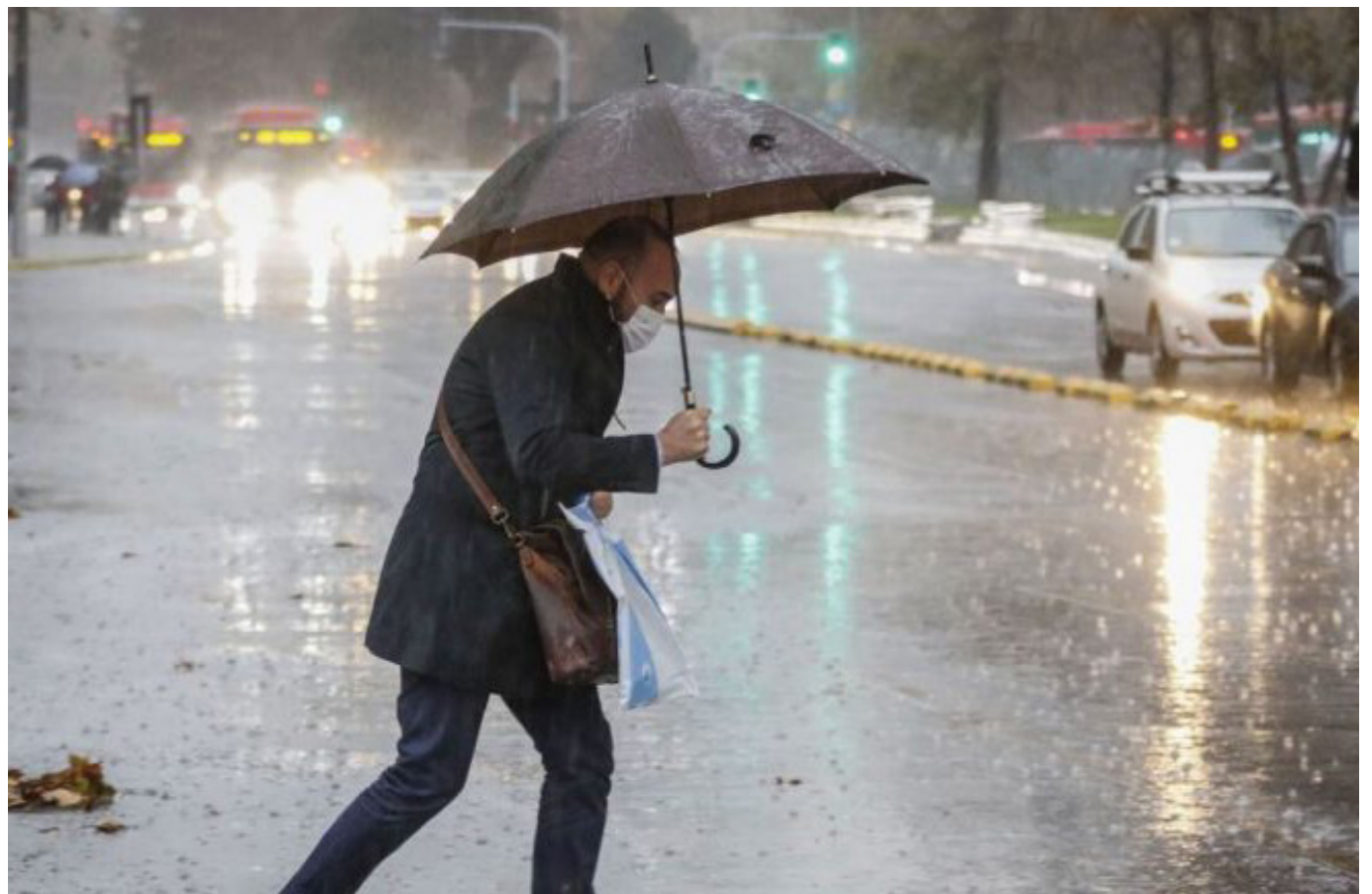
El 24 y 31 de diciembre, la gente no habría salido a departir debido a las lluvias.