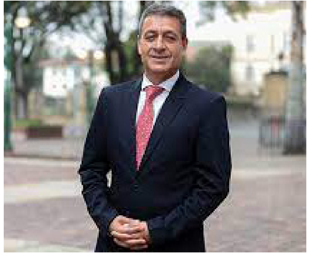
Néstor Mario Urrea, director General de Apoyo Fiscal del Ministerio de Hacienda.

consumo de qué trata la Ley 223 de 1995, que rigen para el primer semestre del año 2024, son los siguientes: cervezas, trescientos treinta y un pesos con ochenta y cuatro centavos $331,84, por unidad de 300 centímetros cúbicos”.