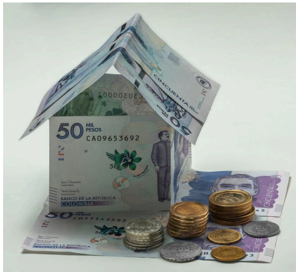
Colombia ha suscrito CDI con Reino de España, República de Chile; Estados Unidos Mexicanos; República de Corea; Reino Unido de Gran Bretaña e Irlanda del Norte; República de Italia; República Francesa; Japón, entre otros.

Las personas naturales sin residencia, no está obligada a declarar, cuando la totalidad de sus ingresos hubieren estado sometidos a la retención en la fuente de que tratan los artículos 407 a 409 del Estatuto Tributario y dicha retención en la fuente les hubiere sido practicada.