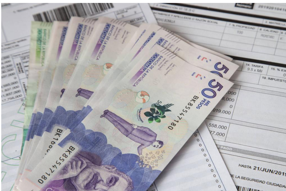
Una persona natural puede ser residente fiscal en dos estados.