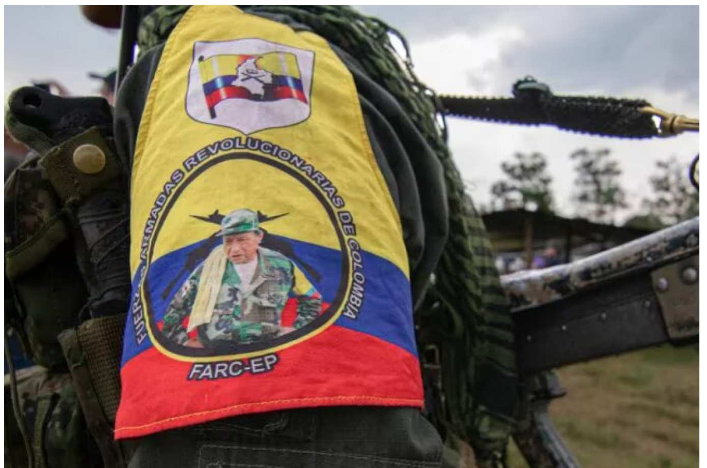
Ante la extensión del cese al fuego por seis meses, es crucial recordar que, en el Huila se registraron las primeras violaciones a este acuerdo.

La medida, que va hasta el 15 de julio de 2024, buscaba fortalecer el proceso de paz y abordar objetivos clave para el país.