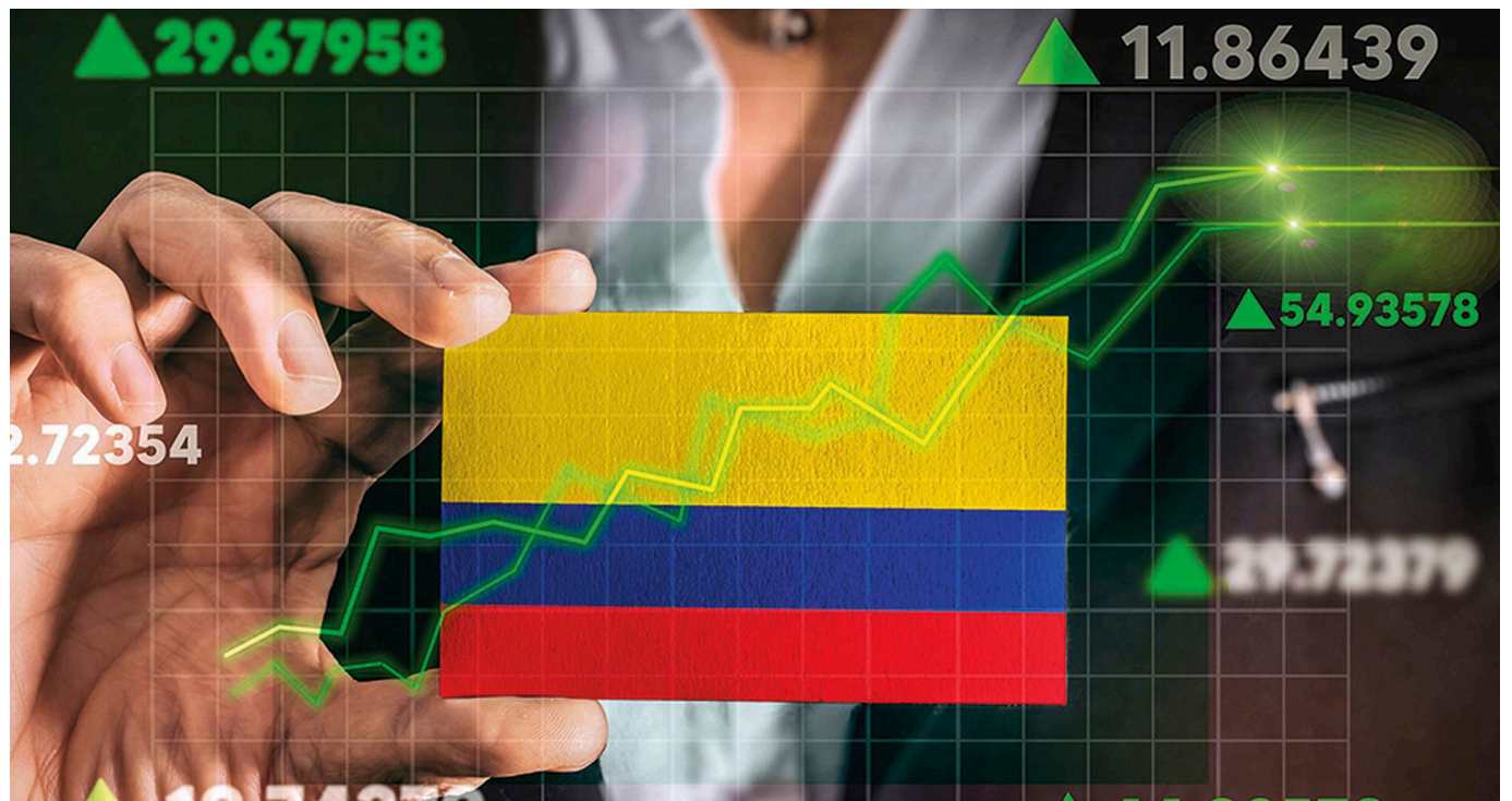
Las personas naturales no residentes están sujetas al impuesto sobre la renta, sobre sus ingresos de fuente nacional, y a su patrimonio poseído dentro del país.

Las personas naturales residentes están sujetas al impuesto sobre la renta, sobre sus ingresos de fuente nacional como de fuente extranjera, y a su patrimonio poseído dentro y fuera del país.