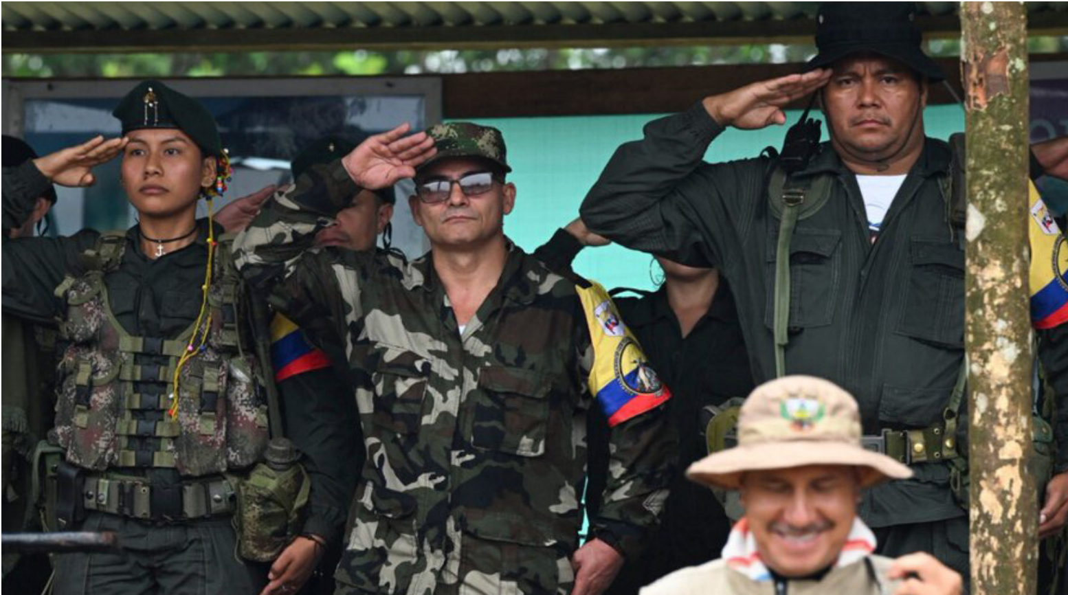
La tarea primordial en esta fase será establecer una agenda clara de negociación.