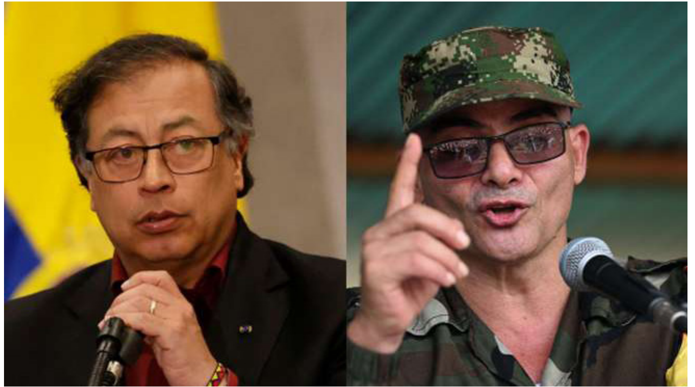
El diálogo de paz entre el Gobierno y el EMC, liderado por alias 'Iván Mordisco', ha entrado en su tercer ciclo en Bogotá.

El presidente Gustavo Petro, mediante el decreto 0016 del 14 de enero, confirmó la extensión del cese al fuego por seis meses más, logrando un acuerdo con las disidencias de las FARC-EP.