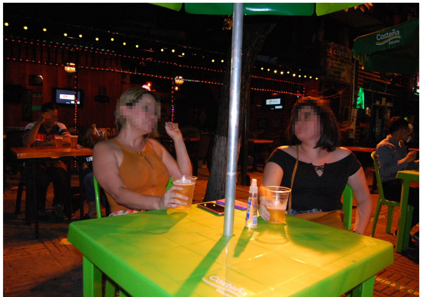
El precio de la cerveza subió.

“Desafortunadamente, siendo una ciudad de clima caliente, cuando hay precipitaciones, la gente no sale a divertirse. El 31, nos llovió hacia la media noche, donde la ciudadanía se está alistando para salir de sus casas, después de estar con la familia, causando que no tuviéramos las ventas que se esperaban”, agregó el representante.