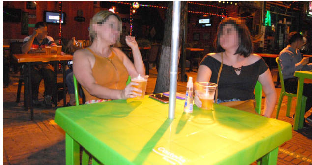
Gastrobares de Neiva, afectados por bajas ventas