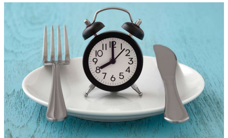
Los expertos sugieren cenar dos horas antes de irse a dormir. Se puede ir a caminar después de las comidas, especialmente las personas con diabetes.