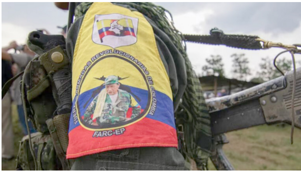
Se extiende hasta julio el cese al fuego