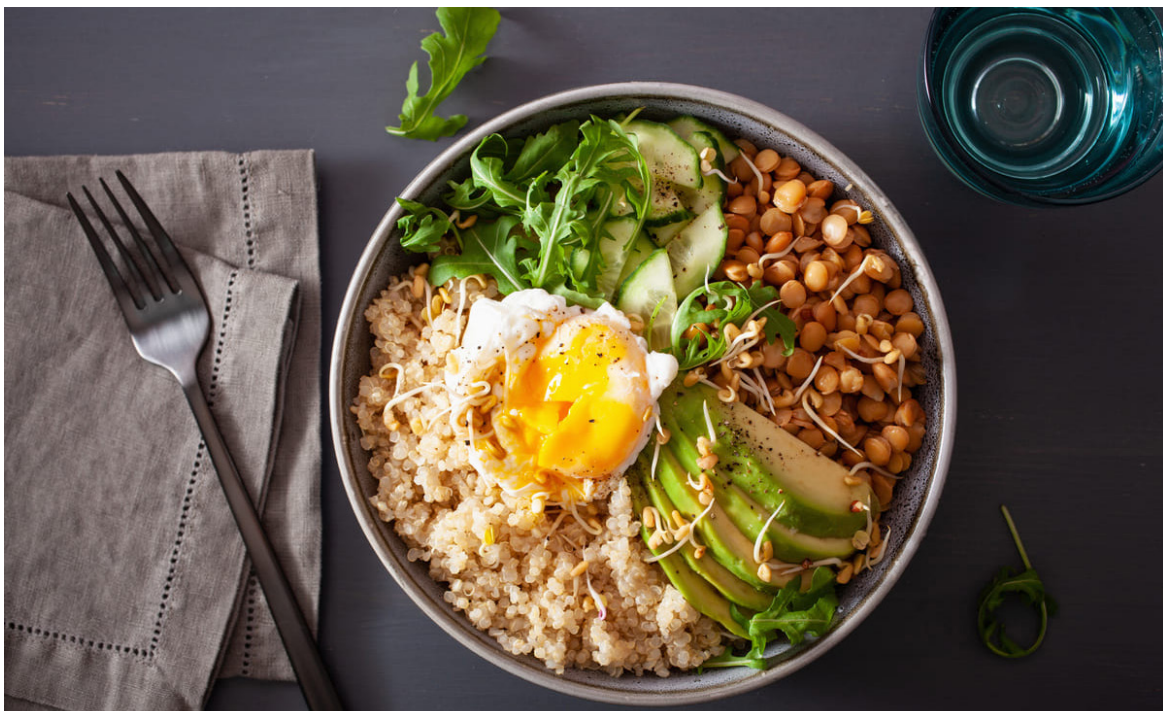
Un efecto de la cena tardía es que puede hacer que el cuerpo almacene más grasa y reduzca los niveles de leptina, que es la hormona que le dice a su cerebro cuando está lleno.

“Estos hallazgos muestran mecanismos convergentes por los que comer tarde puede resultar en un balance energético positivo y un mayor riesgo de obesidad”, escribieron los autores.