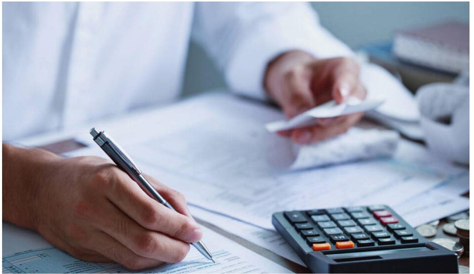
Los CDI buscan eliminar o reducir el impacto de la doble tributación.

1. Poseer patrimonio y haber obtenido en el respectivo año gravable ingresos en el país sobre los cuales se haya practicado retención en la fuente según los con-