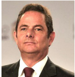
Germán Vargas Lleras

Comienza el año con los desconcertantes anuncios de Petro y de su ministro Bonilla, de iniciar la discusión y el trámite de una nueva reforma tributaria. El país recuerda muy bien el compromiso de ex ministro Ocampo en las discusiones de la reforma del 2022 en cuanto a que esa sería la única reforma fiscal que propondría el Gobierno. Pues no. Ahora nos vienen con la muy trampa propuesta de que la iniciativa solo buscará reducir el impuesto a personas jurídicas del 35 % actual al 30 %. Difícil creer en la sinceridad de esta propuesta, pero, aun en este caso, ¿cómo asegurar que en el trámite del proyecto no se terminen reviviendo todas las pretensiones no atendidas en la reforma pasada o aquellas que la Corte encontró inconstitucionales en sus recientes decisiones?