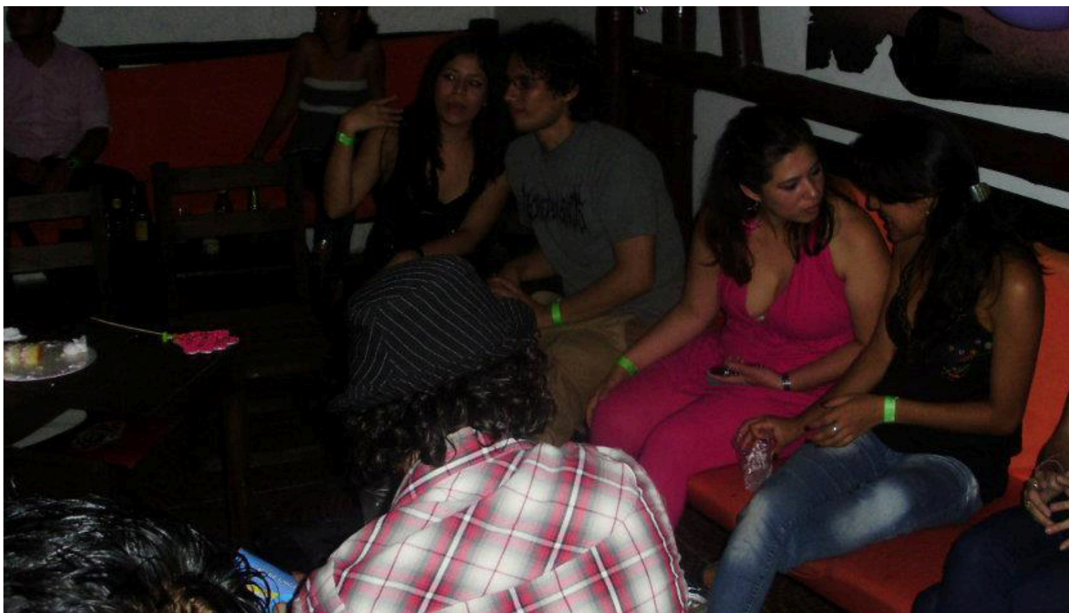
Las ventas disminuyeron ostensiblemente ante los pocos clientes.