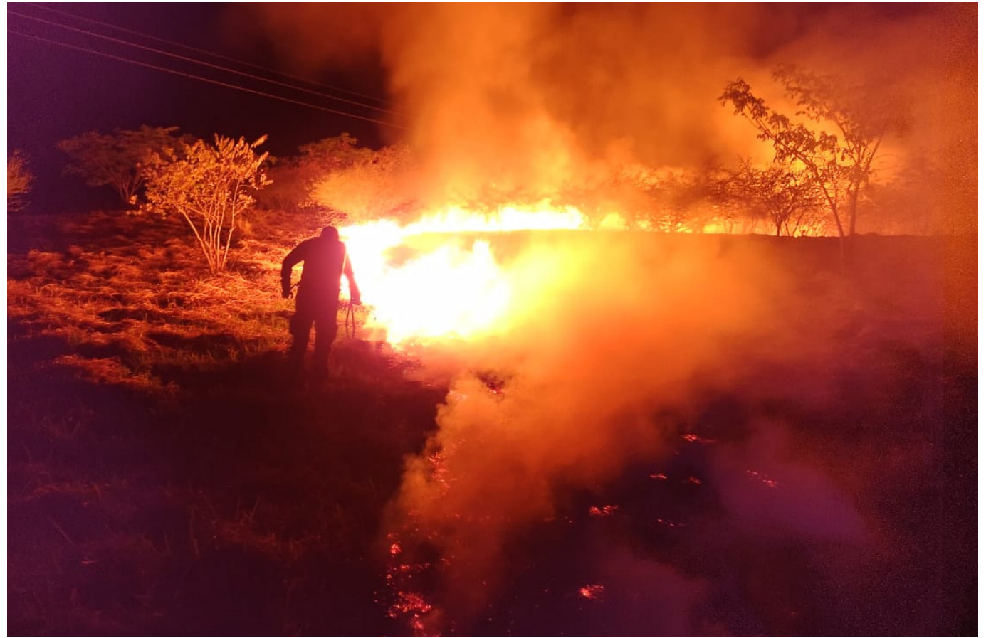
Municipios a prepararse ante posibles conflagraciones forestales.

“La CAM desde el mes de junio, a través de la resolución 1545, restringe las quemadas en la región e invitamos a los agricultores a no realizar estas prácticas, que terminan en incendios forestales de gran magnitud”, agregó la ingeniera ambiental, Osiris Peralta.