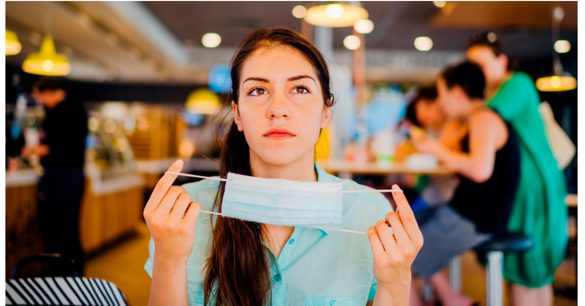
Las autoridades han pedido incrementar medidas de autocuidado.

En medio del retorno académico y laboral, el defensor del Pueblo, Carlos Camargo, instó a las autoridades nacionales y territoriales, en cabeza del Ministerio de Salud y las secretarías de Salud, a implementar planes de contingencia ante la presencia de la variante JN.1 del Covid-19 en Colombia.