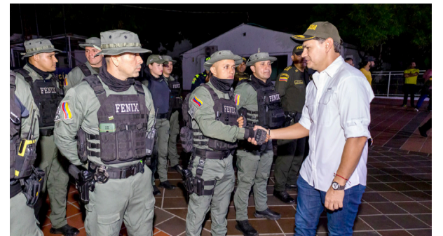
¡A recuperar la seguridad en Neiva!