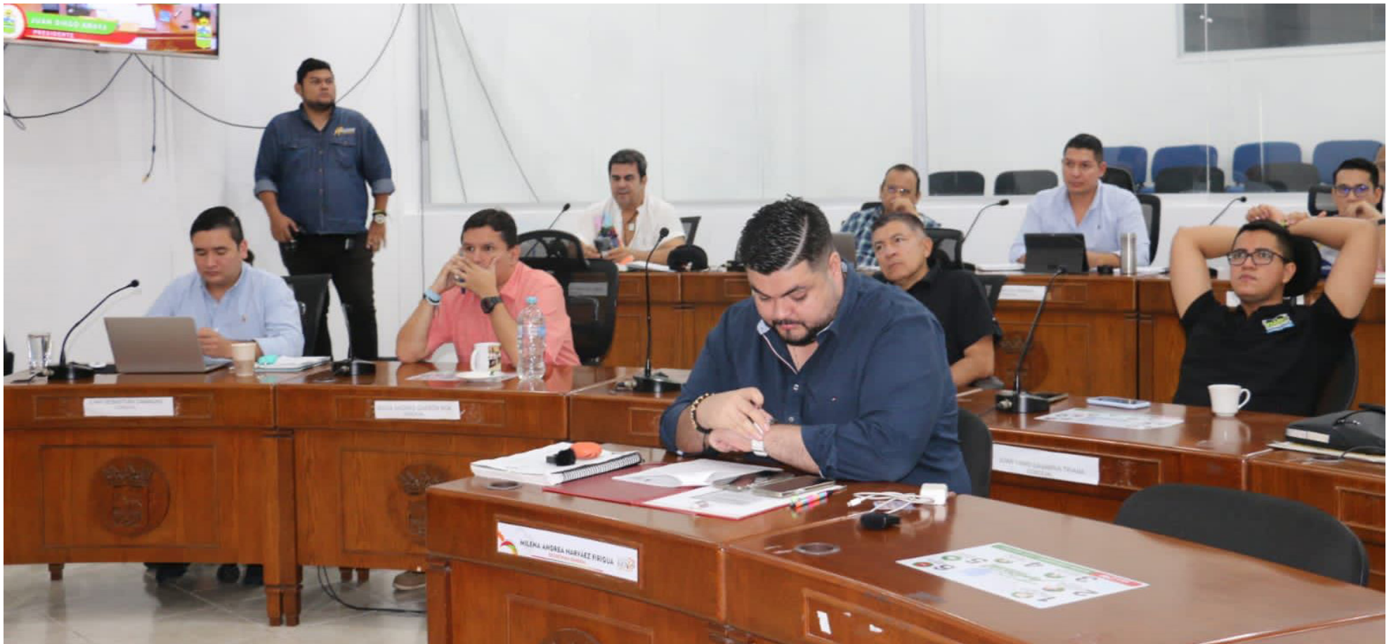
Ocho concejales de Neiva votaron en contra de las recusaciones, generando descontento en la ciudadanía y participantes, que buscaban garantías en el proceso de elección de personero.