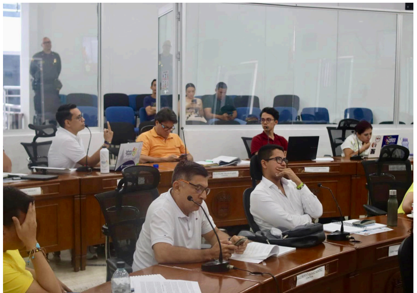
La mesa directiva dio a conocer la nueva fecha de la entrevista, será mañana 16 de enero, se espera estar eligiendo al personero el día 20 de enero.

La Mesa Directiva del Concejo de Neiva decidió invalidar la primera entrevista en el proceso de elección del personero. Controversias sobre la metodología y convocatoria llevaron a esta decisión.