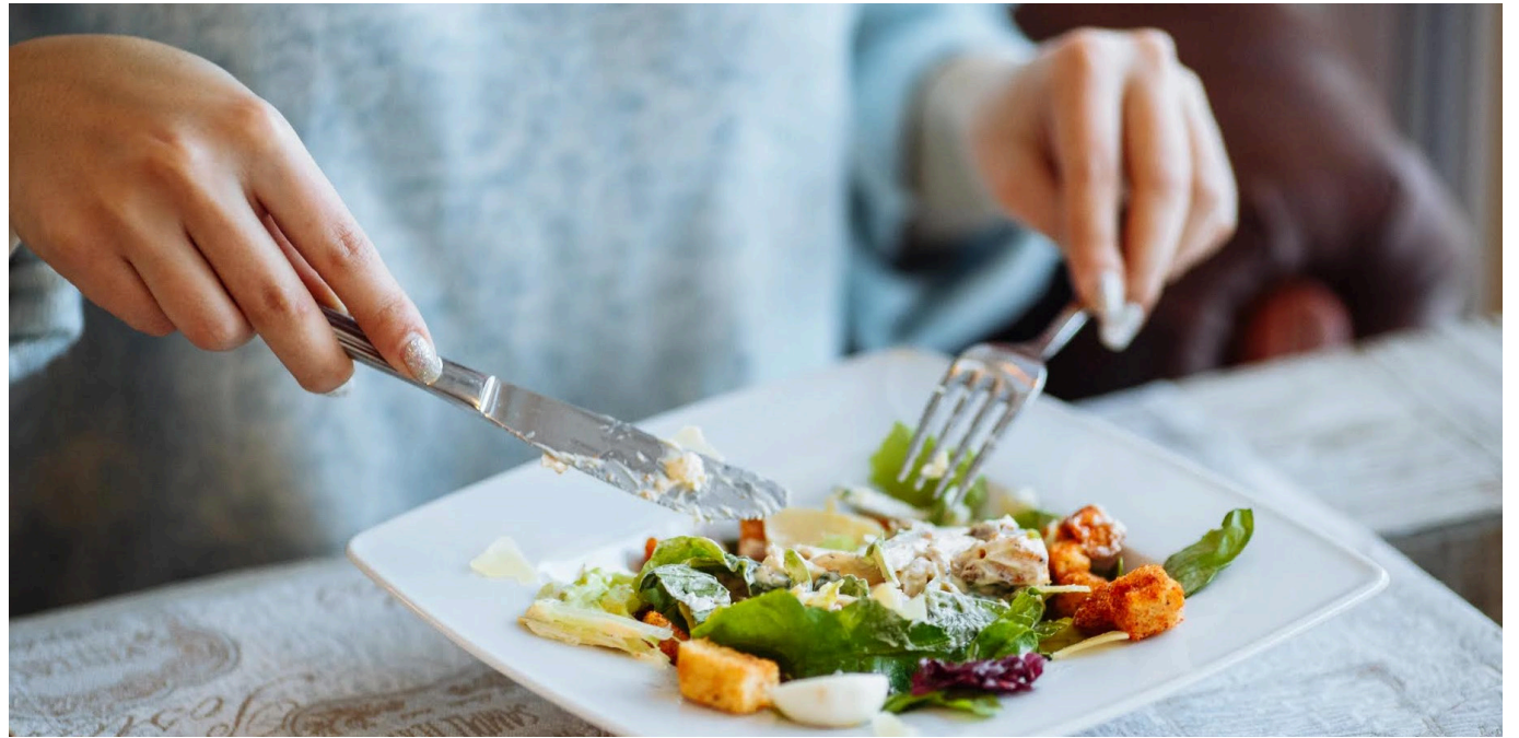
Ya hay pruebas que muestran que el momento en que se come y el tipo de comidas que se consumen influyen en el aumento de riesgo de diferentes enfermedades.

Recientemente, investigadores de España y Francia descubrieron que el horario en que se realiza tanto el desayuno por la mañana y se cena también pueden ser condicionantes para el desarrollo de la diabetes.