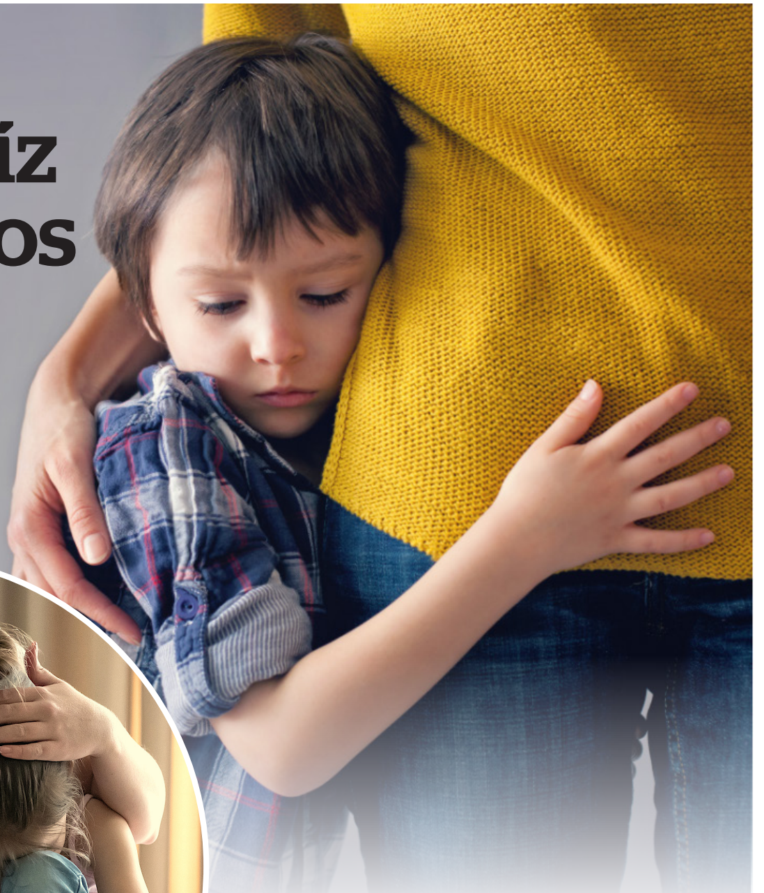
La falta de independencia en la niñez, la principal causa de enfermedades mentales.

Es por eso que hay que volver a fomentar los juegos y las actividades independientes duran-