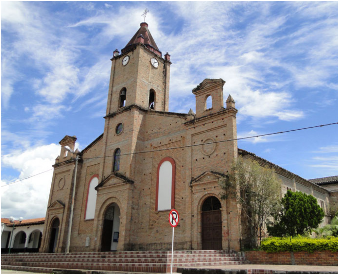
Elías, no cuenta con este servicio para la atención de emergencias.

tuación que nos preocupa desde la Delegación Departamental de Bomberos, en virtud a que no se está garantizando el servicio público esencial. Las comunidades están siendo desprotegidas ante cualquier tipo de situación”, reveló el funcionario.