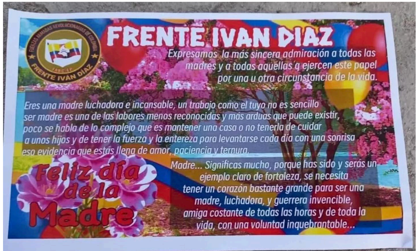
Los volantes distribuidos por las disidencias de las Farc en Algeciras generaron controversia por su inusual mensaje en el Día de la Madre.

La distribución de volantes con mensajes sensibles por parte de las disidencias de las Farc en Algeciras ha sacudido a la comunidad, generando debates sobre la presencia de grupos armados ilegales en la región.