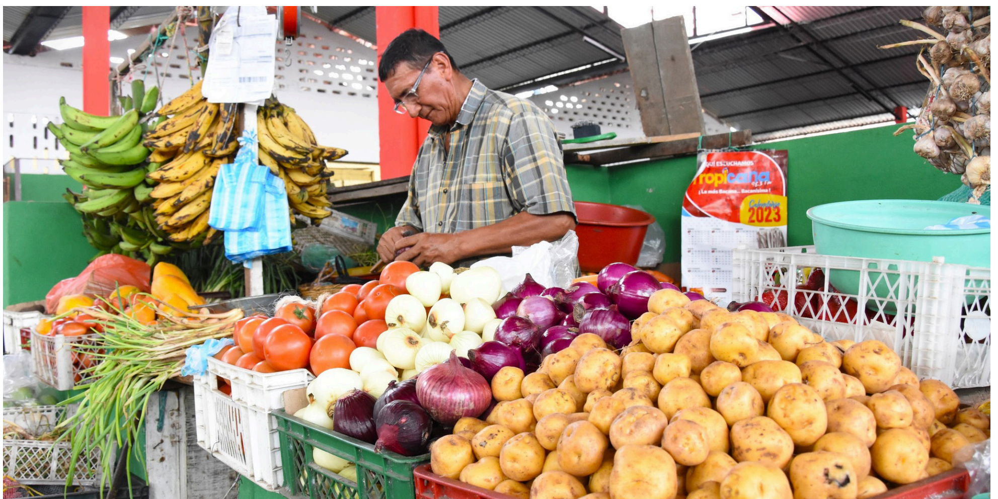
Los alimentos son la categoría que más ha registrado subidas en la inflación.

mercializa en varios restaurantes del país, que cuenta con distintos ingredientes y que tiene un costo menor a los platos que se