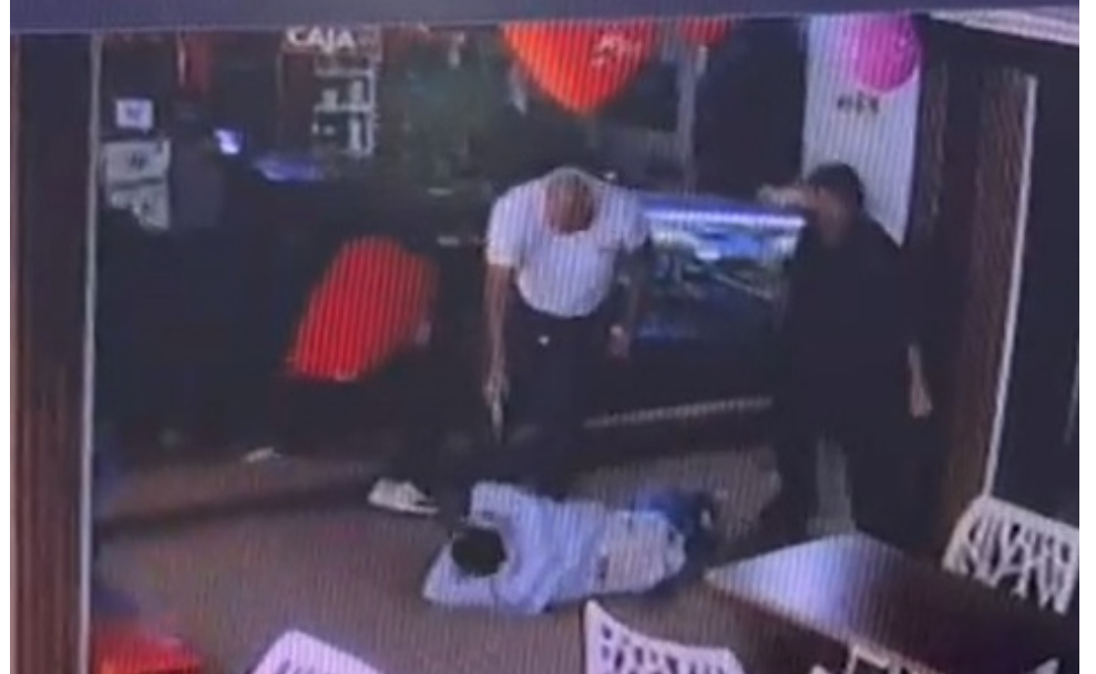
Cámaras de seguridad registraron los hechos al interior del establecimiento.

Una vez notificada las autoridades sobre lo ocurrido, dicha camioneta fue abordada en la Carrera Séptima con Calle 7 en el centro de Neiva, allí la policía hizo el transbordo de la persona herida, la cual presentaba dos impactos con arma de fuego, la cual fue llevada de urgencia a un centro médico. Mientras que sus acompañantes fueron abordados con el fin de establecer los