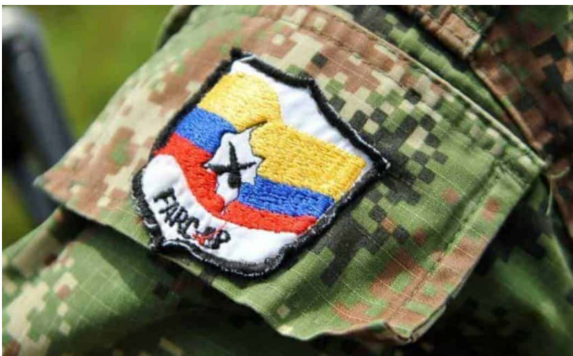
Los volantes que fueron repartidos por miembros del frente Iván Díaz del Estado Mayor Central (EMC), disidencias de las Farc que operan en esta región del país.

“Hemos visto imágenes que nos muestran esta situación, donde estos grupos al margen de la ley entregan útiles escolares en veredas del departamento de Huila. Este es un instrumento de engaño para que la gente entre en confianza y les permita la entrada, y después viene toda una cantidad de condiciones y restricciones para las mismas comunidades”, señaló el funcionario.