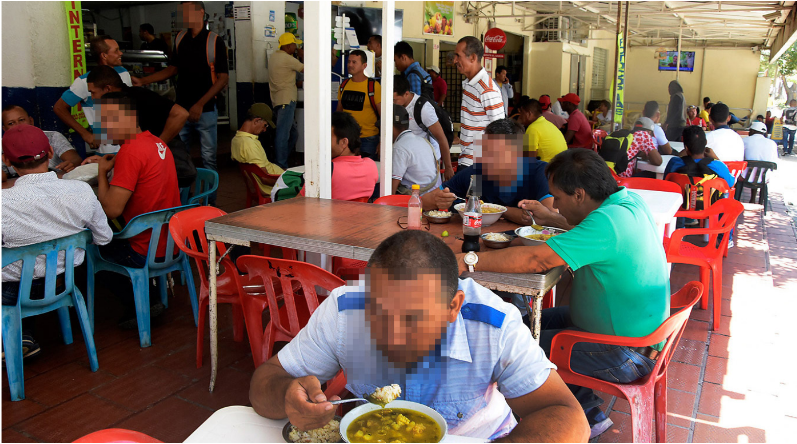
Foto 4: La inflación en Colombia muestra un descenso por decimotercer mes consecutivo, según el Dane.

en este período. Sin embargo, se anticipa que la inflación, excluyendo los alimentos, continuaría su tendencia a la baja, posibilitando que el índice total de inflación cierre cerca del 5,4% al finalizar 2024.