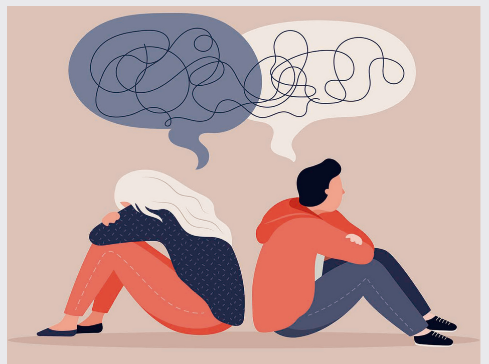
Las actividades independientes son fundamentales para el desarrollo de los niños.

La falta de independencia puede generar ansiedad y depresión en los jóvenes, ya que, al no sentirse capaces de resolver sus propios problemas, pierden la confianza en sí mismos.