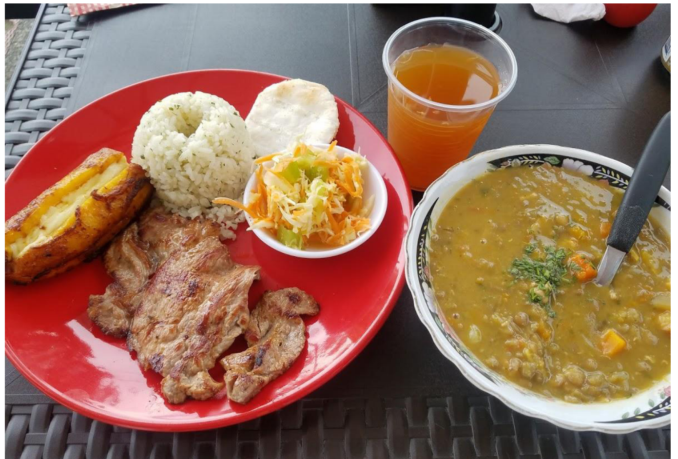
Sube de precio el corrientazo en Colombia.

De hecho, aunque el Gobierno celebra la reducción en la inflación, lo cierto es que la baja debería ser más pronunciada y similar a los países de la región, que actualmente cuentan con una inflación de entre el 3% y 5%.