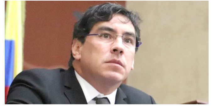
'Retaliaciones' de Petro colocaron a Prada en juicio