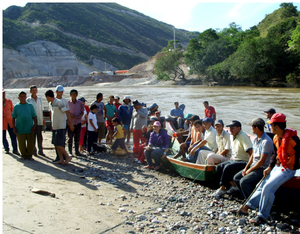
En el Huila adquirirían 2.200 hectáreas para los afectados del Quimbo.