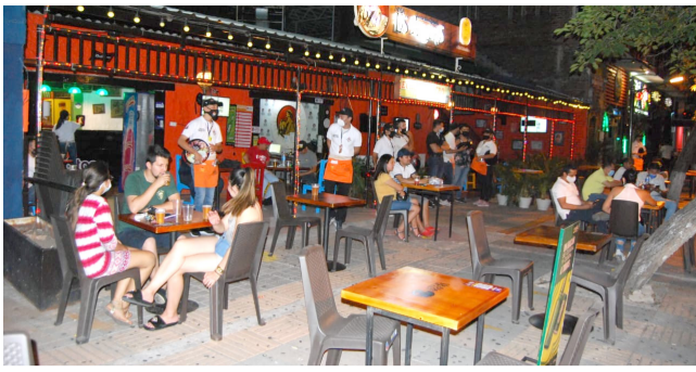
Día de las Madres en Neiva no favoreció al comercio nocturno