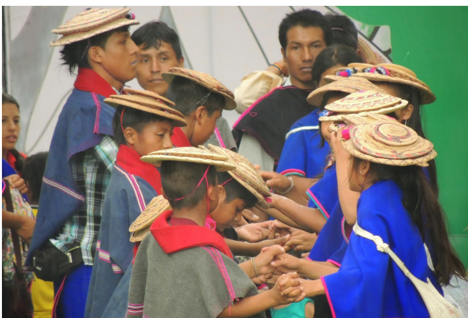
En la región se darán 5.000 hectáreas a la comunidad indígena.

En este sentido la Reforma Rural Integral sienta las bases para la transformación estructural del campo, crea las condiciones de bienestar para la población rural y contribuye a la construcción de una paz estable y duradera. Busca la erradicación de la pobreza rural extrema y la disminución en un 50% de la pobreza en un plazo de 10 años, la promoción de la igualdad, el cierre de la brecha entre el campo y la ciudad, la protección y disfrute de los derechos de la ciudadanía y la reactivación del campo, especialmente de la economía familiar, señalaron desde el Gobierno Nacional.