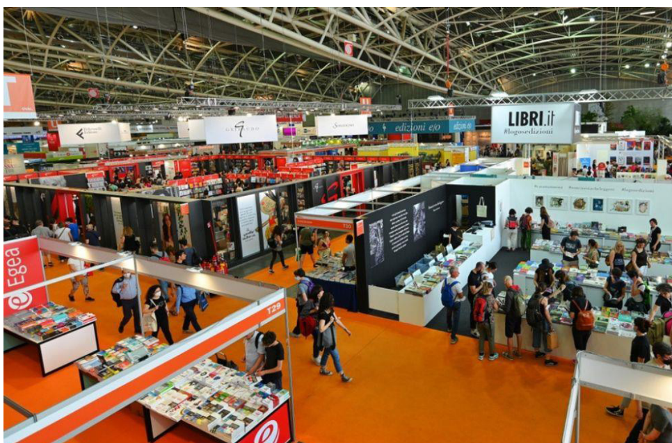
Uno de los eventos culturales más importantes en el país es la Feria del Libro.

Durante el año 2023, Invest in Bogotá canalizó inversiones extranjeras para contrarrestar los efectos económicos de la pandemia, generando nuevas oportunidades, apoyando proyectos de infraestructura y captando eventos internacionales. Este impulso se tradujo en la materialización de 41 proyectos de inversión, la creación de miles de empleos y la captación de eventos que generaron flujos de capital significativos.