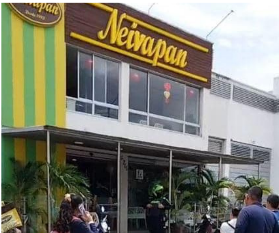
Los hechos se registraron al interior de una panadería en el sur de Neiva.

"El sueño de él, era poder vivir en Estados Unidos, allá tenía al hermano, me decía viejito yo quiero ir a trabajar, a ayudarlos a ustedes, ustedes se matan mucho mi viejo, yo lo quiero sacar de donde usted está, que descanse, pero yo le dije no papi, piense en usted que yo ya soy un señor de edad, me quedaran pocos años de vida, yo con mi trabajo me consigo la comida mi amor", indicó entre lagrimas.