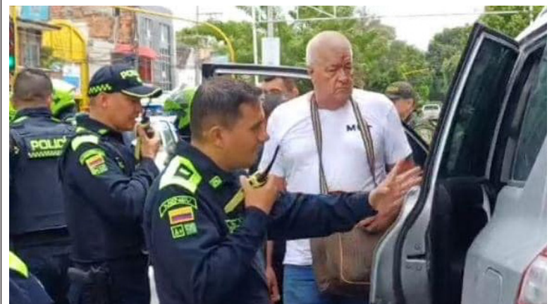
Las autoridades auxiliaron a la persona que resultó herida.