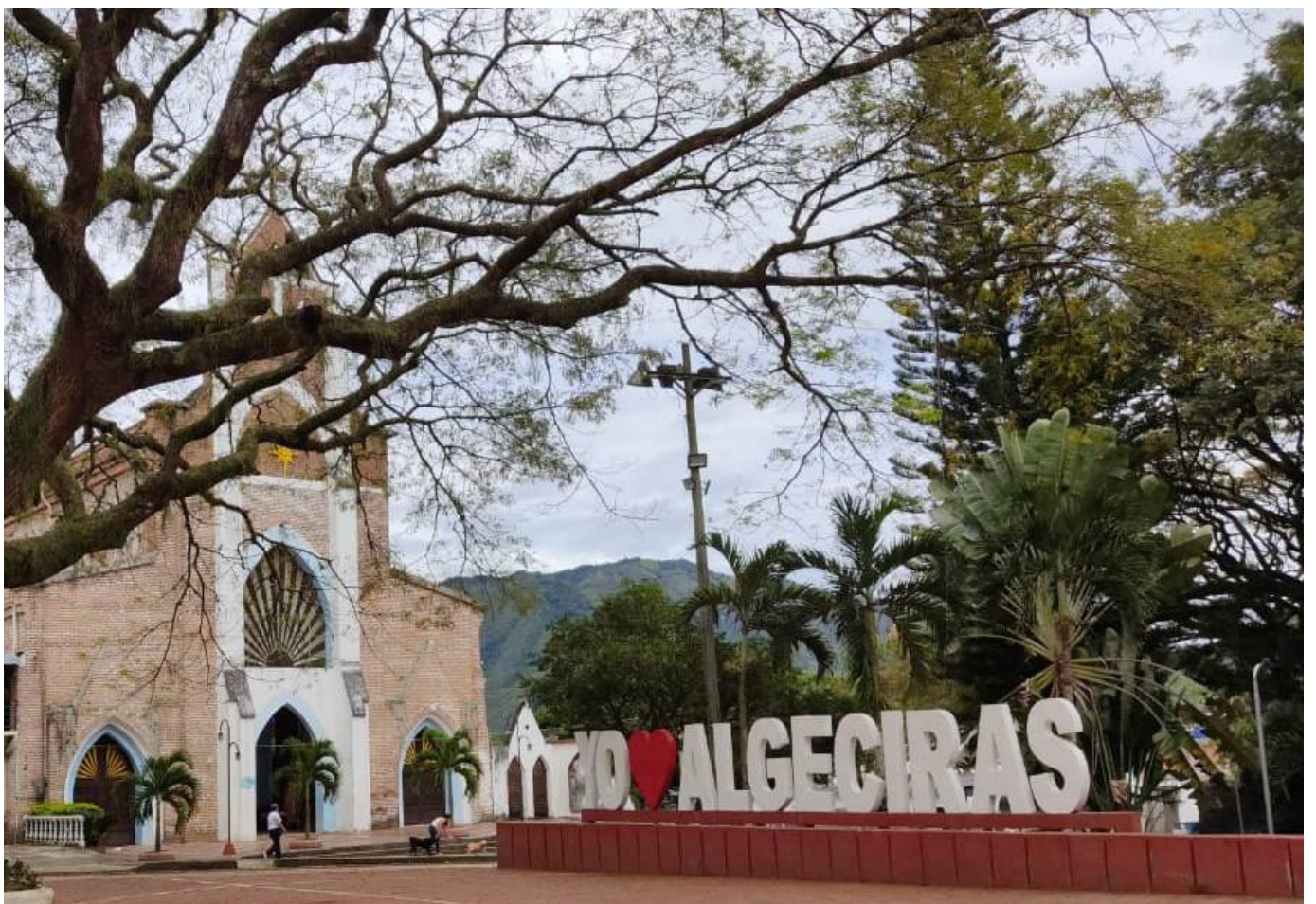
La población de Algeciras se muestra cautelosa y en alerta tras la distribución de volantes por parte de las disidencias de las Farc, evidenciando la incertidumbre y el temor en la comunidad.

la zona rural. Hombres armados irrumpieron en una vivienda en la vereda El Silencio y acabaron con la vida de sus ocupantes, dejando consternada a la comunidad. Tres hombres y una mujer perdieron