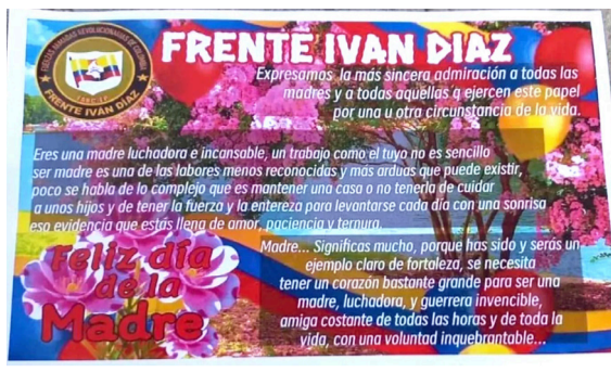
Disidencias celebraron el Día de la Madre en Algeciras