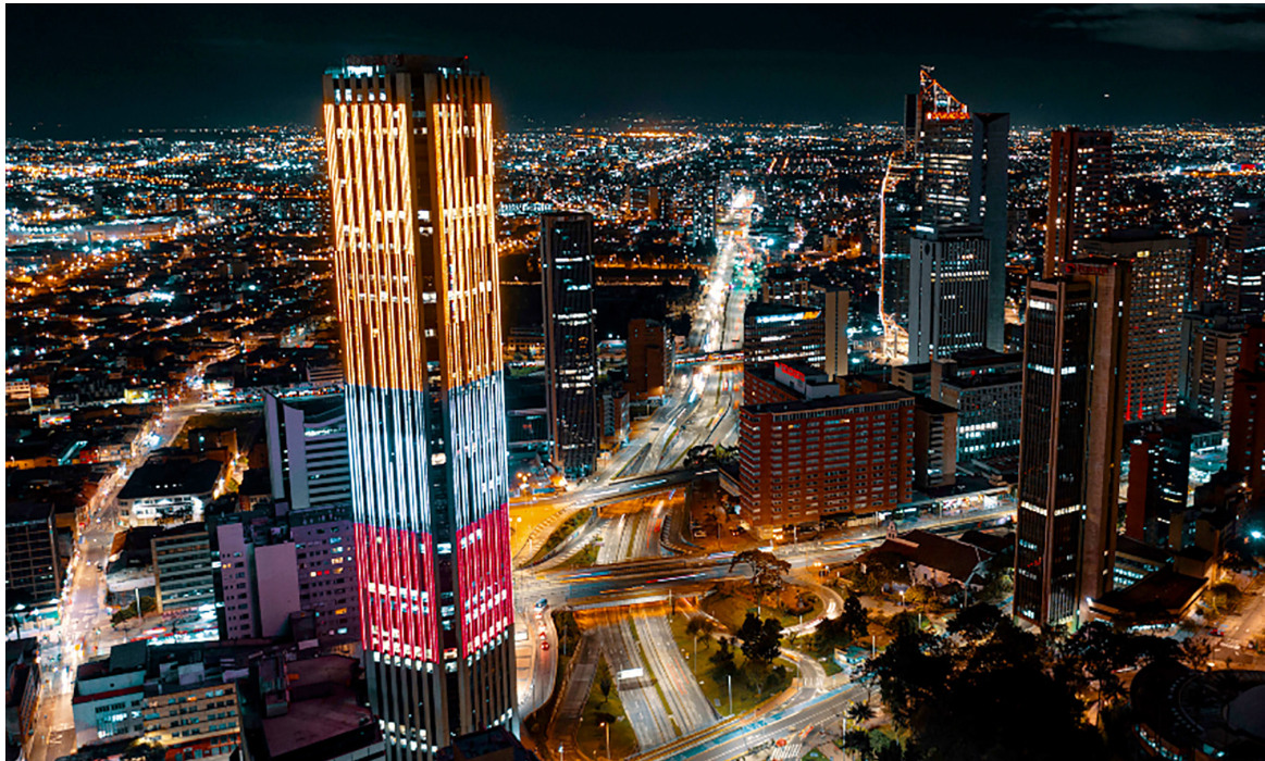
La capital del país, quedó en el tercer lugar, después de Sao Paulo y Buenos Aires.