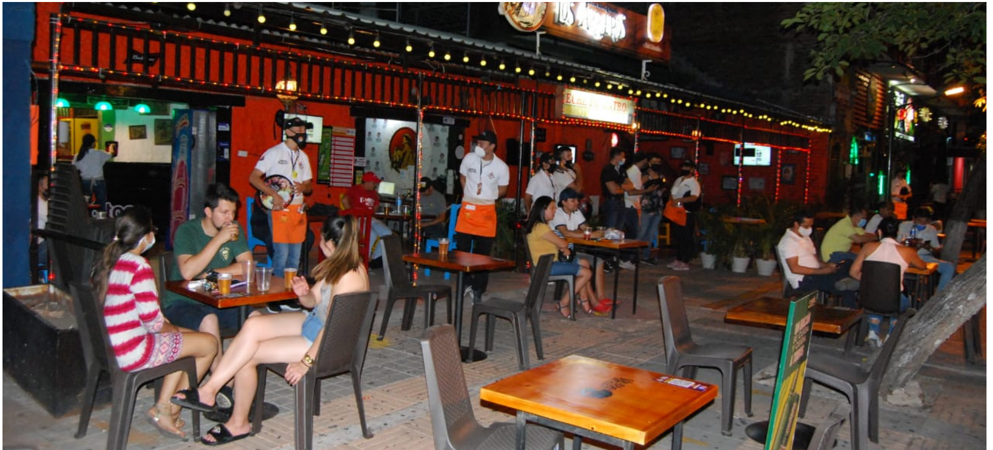
La baja ocupación en los restaurantes de Neiva durante el Día de las Madres reflejó la crisis económica que afecta al sector.

■ La celebración del día de las madres durante el puente festivo, no fue la mejor para el sector de gastrobares y de entretenimiento en Neiva. Según Asobares, las ventas fueron las más bajas. A esta situación se suma, el informe de Fenalco, sobre las ventas en negativo del mes de abril.