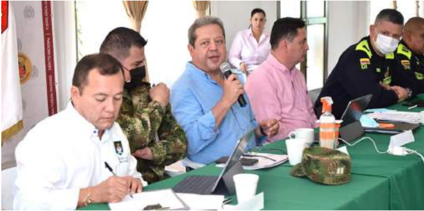
Una de las mesas donde se analizó la situación de seguridad del municipio y dictaron algunas prohibiciones.

a final de año para que todos los recursos sean ejecutados y los niños reciban educación de calidad.