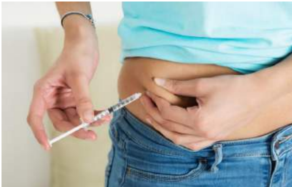
La insulina imita algunas funciones de un páncreas normal.

La terapia de bomba de insulina imita algunas funciones de un páncreas normal de manera mucho más precisa y sustituye la necesidad de inyecciones frecuentes de insulina al suministrar dosis precisas las 24 horas del día, con el fin de satisfacer las necesidades del cuerpo entre comidas y durante la noche, y en ese sentido, mantener los niveles de glucosa en un rango saludable la mayor parte del tiempo.