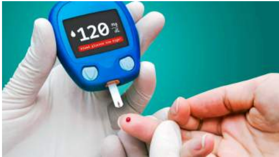
En el tratamiento, es importante hacer monitoreo a los niveles de glucosa.

Existen tres tipos de diabetes, la 1, la 2 y la gestacional. Las primeras dos son las principales y es común que se confun-