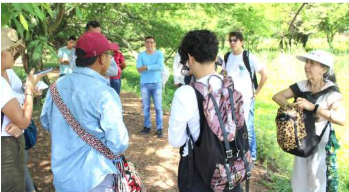
Este trabajo ya ha logrado realizarse en las comunas 1, 6, 8, 9 y 10, por lo que se espera continuar con estos talleres en las comunas faltantes.

La segunda para se dio en la unión entre el río del Oro y el río Magdalena, que se encuentra por la avenida Circunvalar. “Este segundo punto viene hilado a la parada anterior dado que los desechos que se produce la ciudad van directamente al río Magdalena, entonces hicimos esta parada allí, para identificar también como le hemos dado la espalda al río. Es un tema también de ordenamiento territorial, ambiental, social y cultural. Falta de cultura