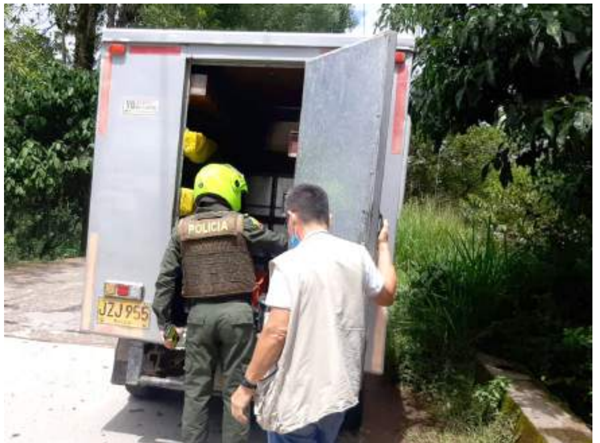
Operativos de control.