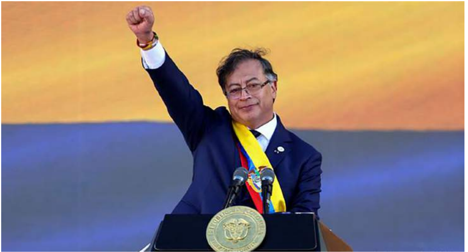
Petro cumple 100 días en el poder.