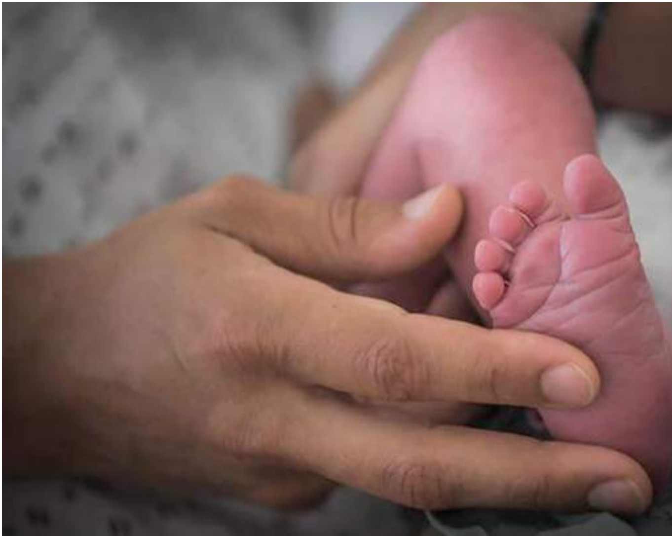
Ingrid todavía llora la muerte de su hijo.