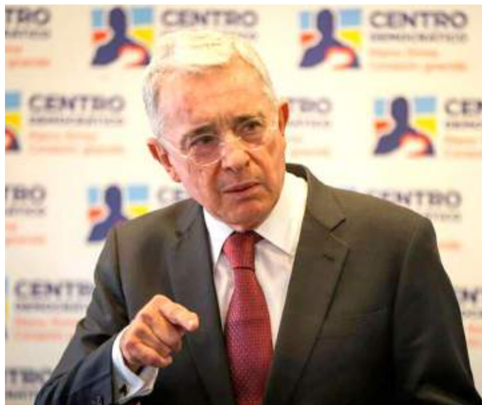
Uribe calificó como ‘coherente’ el periodo de Petro en la presidencia.

Las discusiones que tendrá que adelantar Petro durante los próximos días también estarán enmarcadas en la fijación del aumento del salario mínimo.