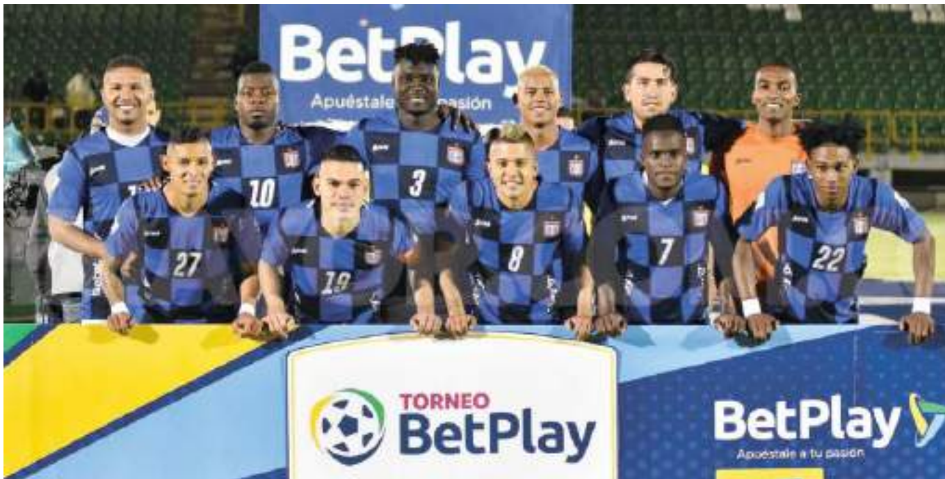
Boyacá Chicó es el campeón vigente del primer torneo del año.

Si Chicó vence al Huila y se queda con el torneo Clausura, no habrá final anual y el repechaje de la reclasificación para conocer al otro ascendido sería el 16 y el 19 de noviembre.