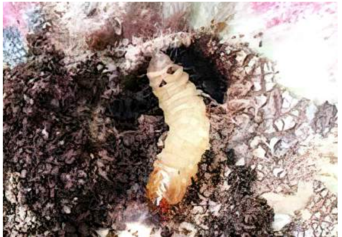
Plaga que viene afectando los cultivos de cacao.

La presencia de plagas y enfermedades como la Escoba de bruja, Monalonia, Phytophthora, entre otras, tienen un impacto negativo más representativo en la producción de cacao, son la Moniliasis, y más recientemente la Carmenta negra (con presencia en 13 de los 35 municipios productores).