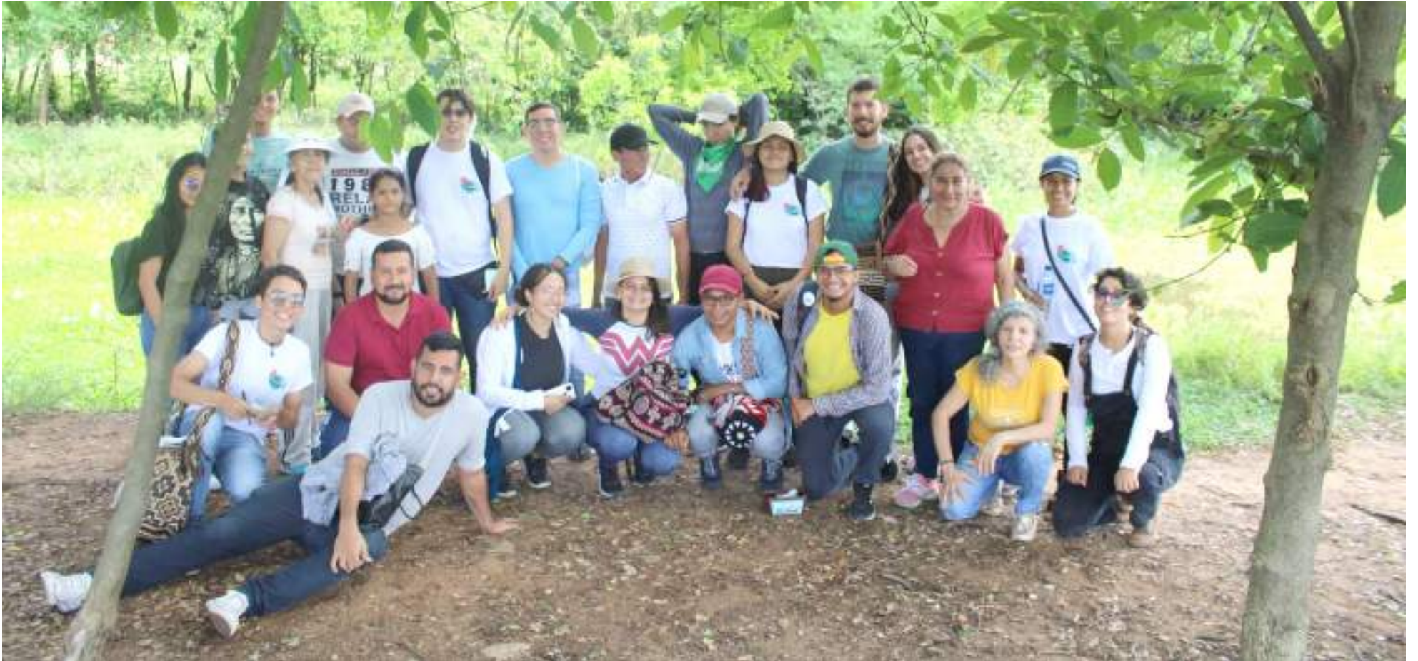
El recorrido por cuatro sitios estratégicos.