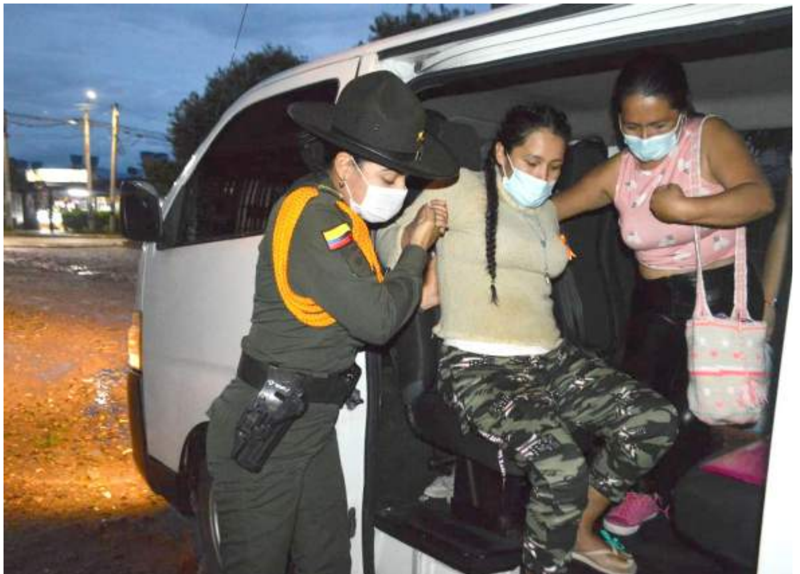
Aquí retornaba a su vivienda tras la salida del Hospital, luego del sangriento ataque en el que murió su bebé.

Frente a la pena que le colocaron al responsable de los hechos, considera fue justa, la pérdida de su primer hijo en esas circunstancias es un daño que ni con mil años de cárcel se puede sanar, tal y como lo aseguró la víctima.