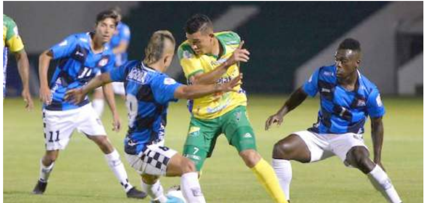
Atlético Huila se mide al Boyacá Chicó en Juego de vuelta esta noche en el Plazas Alcíd.

“Tenemos un 1 a 0 en contra y acá en casa vamos a remontar para ganar esta llave que es el primer objetivo, fortaleciéndonos en lo que lo hemos hecho, para poder sacar el resultado”.