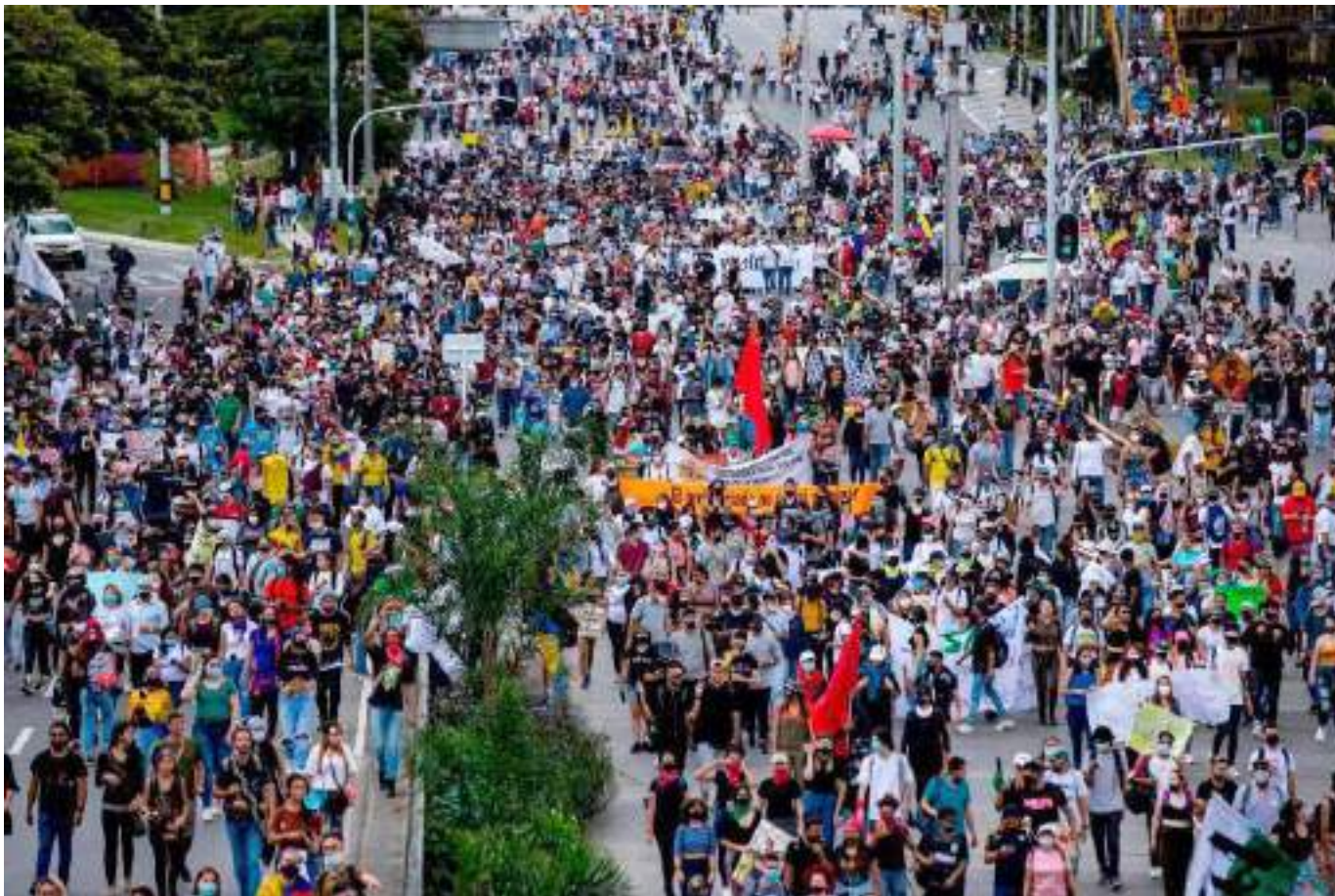
Las manifestaciones harán parte de la jornada de hoy.

los diálogos con la Guerrilla del Ejército de Liberación Nacional ELN los cuales ya han tenido sus primeros pinitos y al parecer iría por buen camino.