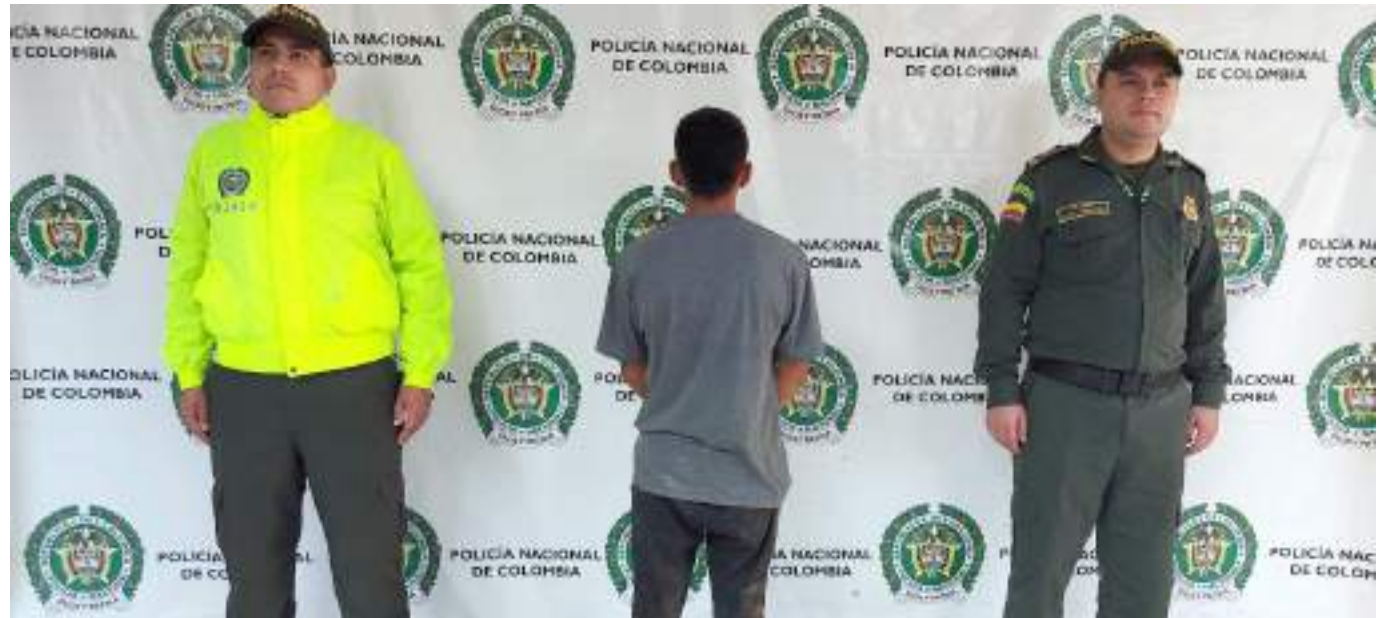
Estaría vinculado a un homicidio.

Fue igualmente aprehendido en agosto de 2020 por unidades de la Policía Nacional, cuando fue sorprendido portando una granada de fragmentación y un chaleco balístico.