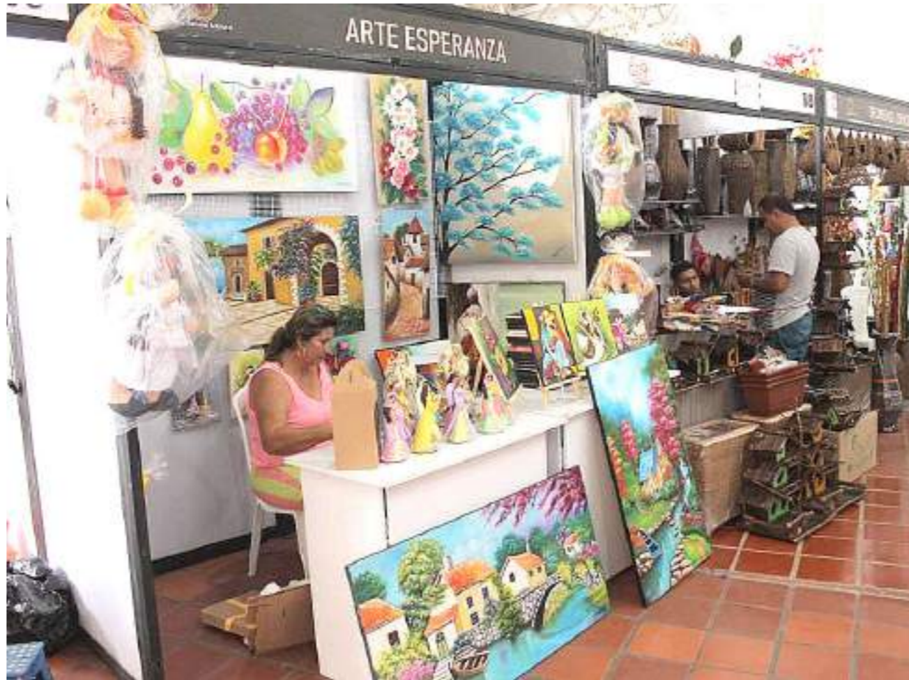
Diferentes expositores llegaron a ofrecer sus productos.

Las posibilidades económicas que se generan con la realización de las ferias fueron significativas para diferentes sectores inclusive para la informalidad que aprovecha la presencia de gran afluencia de personas a los diferentes eventos para realizar sus ventas.