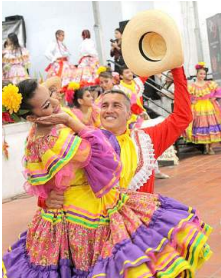
Apertura 56 FERIA de Pitalito en este 2022.

DIARIO DEL HUILA, REGIONAL Por: Hernán Guillermo Galindo M