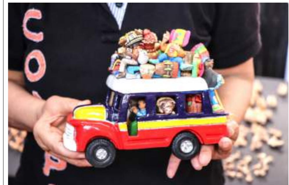
La tradicional Chiva de Pitalito símbolo de las artesanías locales

Uno de los atractivos desde sus inicios en la Feria de Pitalito es la Exposición equina que este año contó con una gran participación de criaderos y ejemplares de distintas regiones de Colombia.