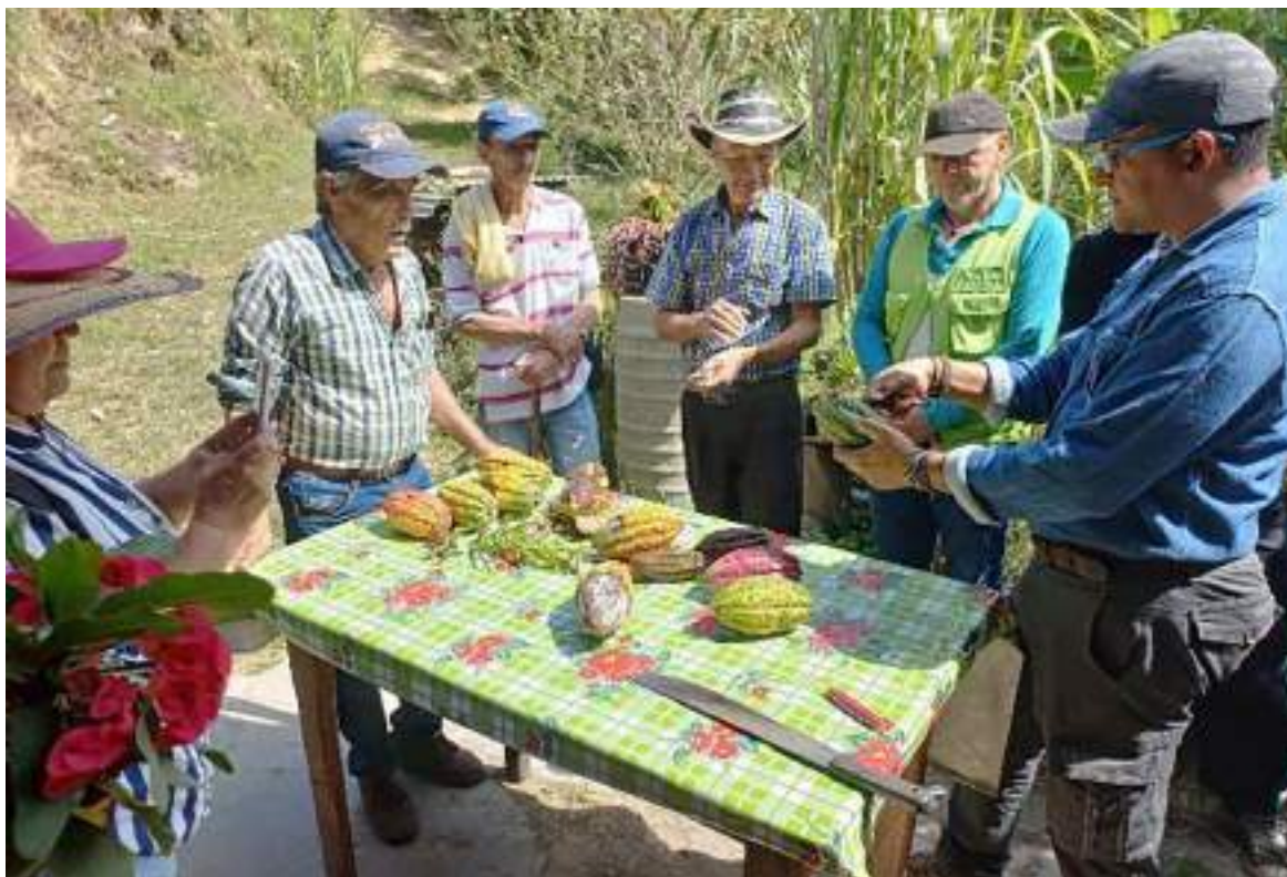
Evaluación del cultivo.

“Se van a realizar una serie de visitas a los productores en zonas productivas de los municipios de Rivera y Campoalegre, para concientizar a los productores sobre la importancia de cumplir con las recomendaciones en materia sanitaria como la recolección semanal, de mazorcas enfermas por Monilia, Phytophthora, Escoba de bruja y Carmenta negra; e igualmente se espera que todos los proyectos que vienen siendo financiados por la Gobernación del Huila, incluyan dentro de sus actividades el control de plagas y enfermedades, lo que permitirá que su ejecución se cumpla idealmente”, concluyó el funcionario.