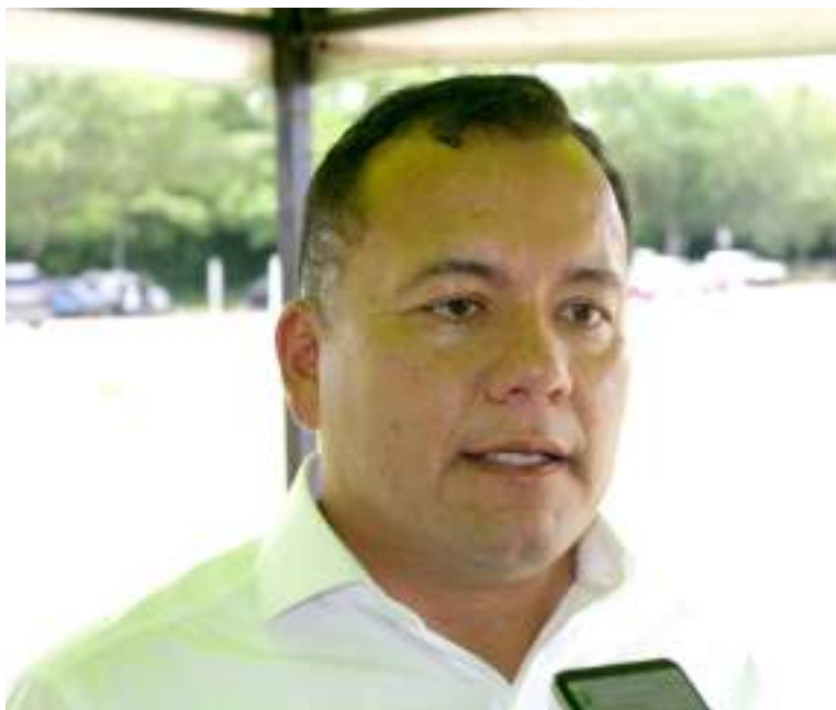
Edgar Muñoz Torres, alcalde de Pitalito.

El tema de seguridad significa que Pitalito no es ajeno a la realidad nacional. Nosotros estamos enfrentando -por tema de la primera emergencia sanitaria que nos correspondió- la peor crisis económica del último siglo que ha dejado gravísimas afectaciones económicas y con ella -no la casa directa, pero si una de las acciones determinantes- la peor crisis de seguridad