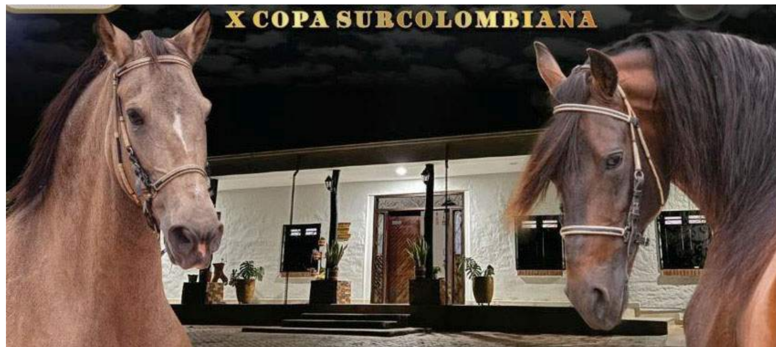
Así se promocionó la parte Equina que es un atractivo fundamental en la Feria de Pitalito.

95 expositores del departamento del huila de los municipios: • Rivera • Acevedo • Algeciras • Garzón • Gigante • Guadalupe •