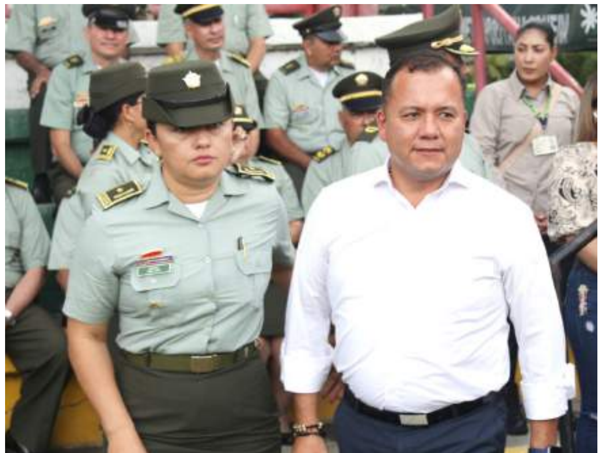
Gracias a la gestión de la Policía se ha logrado avanzar en el tema de seguridad.

Teníamos un rezago de más de 937 cuerdas de pavimentación y ya estamos avanzando en eso, pues estamos construyendo 300 porque ahí había un atraso histórico muy importante. Estamos poniendo al día escenarios deportivos, haciendo dos 'Sacúdete', la Villa Olímpica, nuestro Estadio de Fútbol, Escuela de Música, la Plaza de Mercado y construyendo polideportivos. De tal manera que, siento que se ha hecho una buena gestión y se ha conseguido recursos. El gobierno departamental ha participado muy activamente y nos ha apoyado con inversión. Ese es el ejercicio y en eso estamos avanzando.