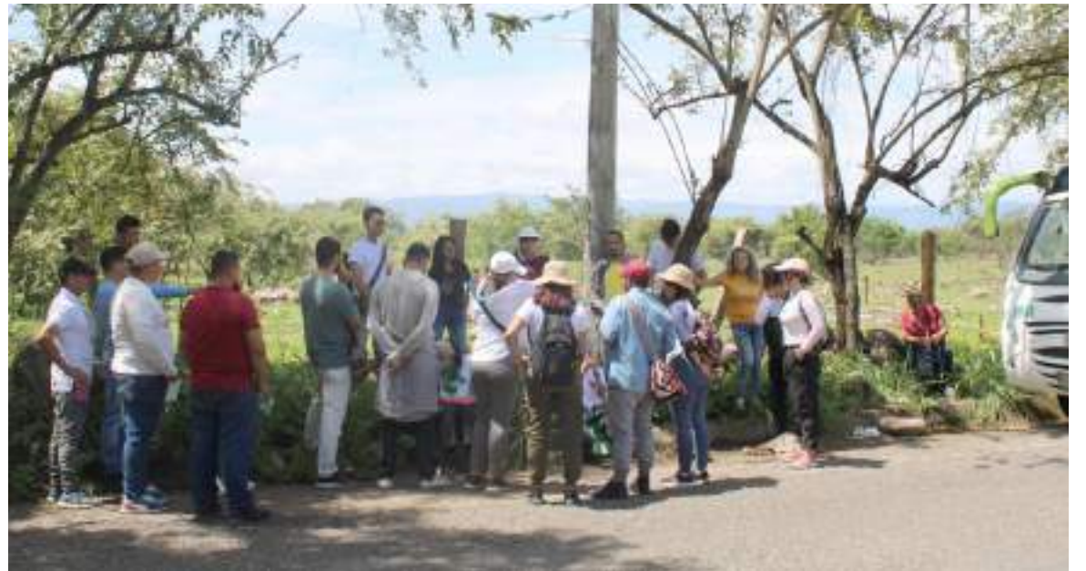
Grupo de 12 profesiones y estudiantes pertenecientes al colectivo Globo Verde

La agenda ambiental que pretende ser entregada a inicios del próximo año se ejecuta de manera articulada e inició con la construcción de unas cartografías de las cinco comunas que han logrado impactar en la actualidad.