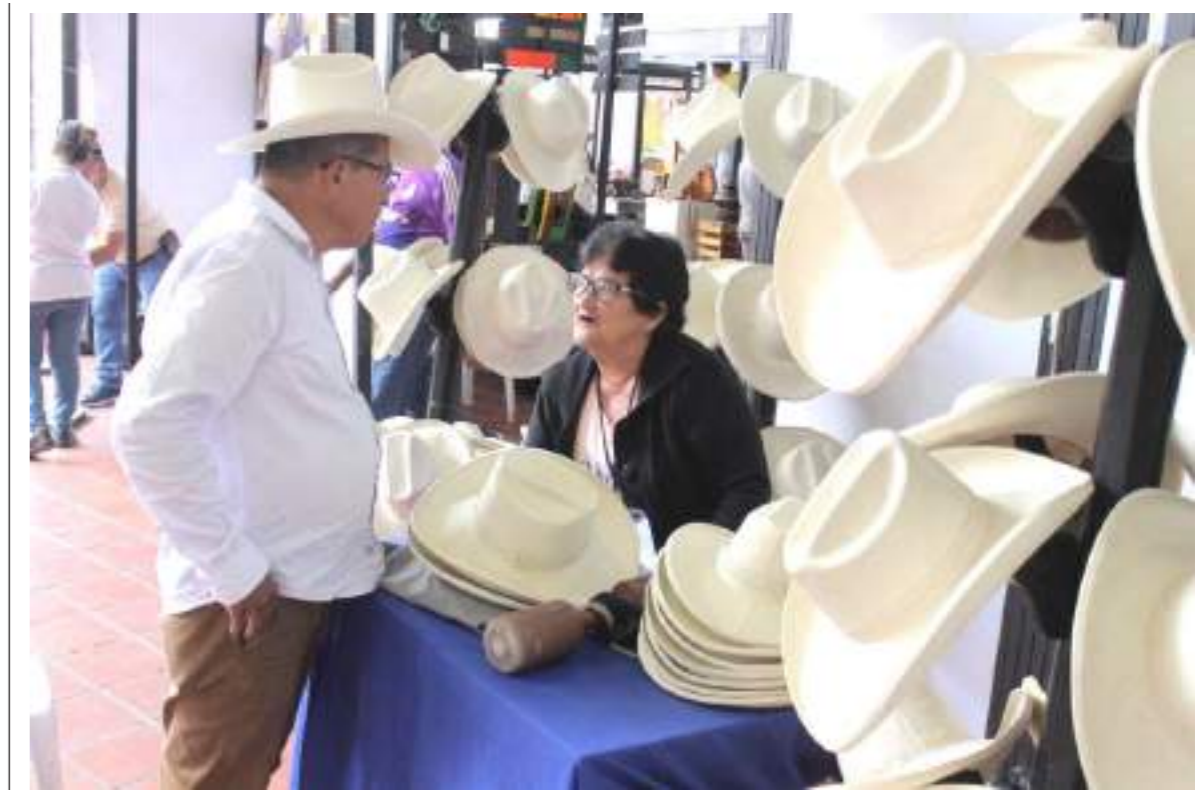
El sombrero Suaceño fue uno de los preferidos en la Feria Artesanal.

En la edición número 56 de la Feria Nacional Artesanal de Pitalito en el departamento del Huila. Un evento organizado por la Cámara de Comercio del Huila con el apoyo de la Alcaldía municipal, la Asociación de Artesanos del Sur y Artesanías de Colombia; que tuvo lugar en Pitalito en la Av. Pastrana de 9:00 a.m. a 8:00