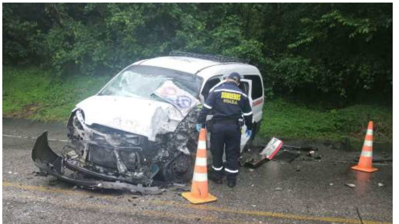
Siniestro presentado en la vía Hobo-Gigante.

En comparación con el fin de semana anterior, el primero del mes de noviembre con puente festivo, donde hubo cuatro personas fallecidas, en esta oportunidad la seccional de Tránsito y Transporte Departamental reportó una favorable cifra de 0 muertos por accidentes de tránsito.