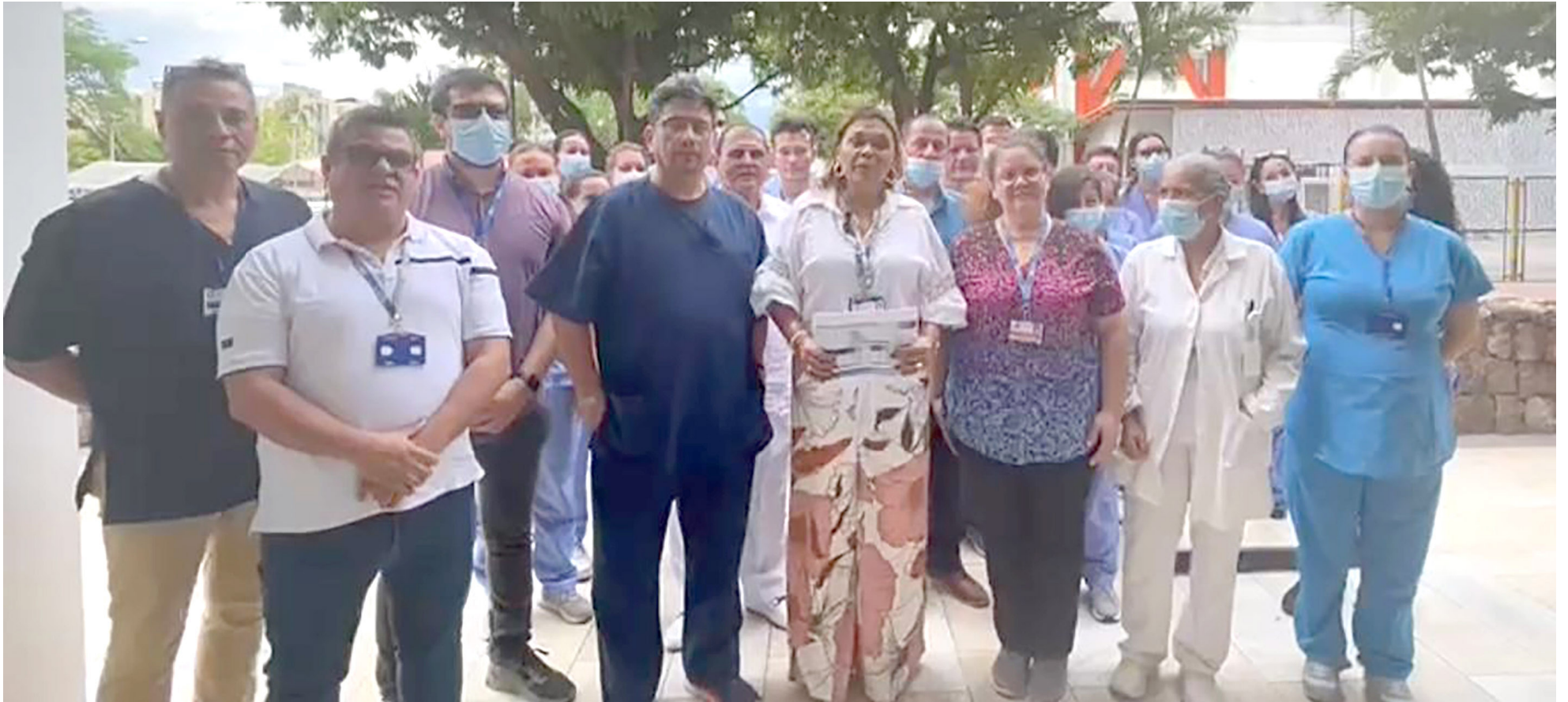
Médicos y personal de salud se suman al plantón nacional en Colombia para exigir el pago de deudas por parte de las EPS y el Gobierno, poniendo en riesgo la atención médica de la población.