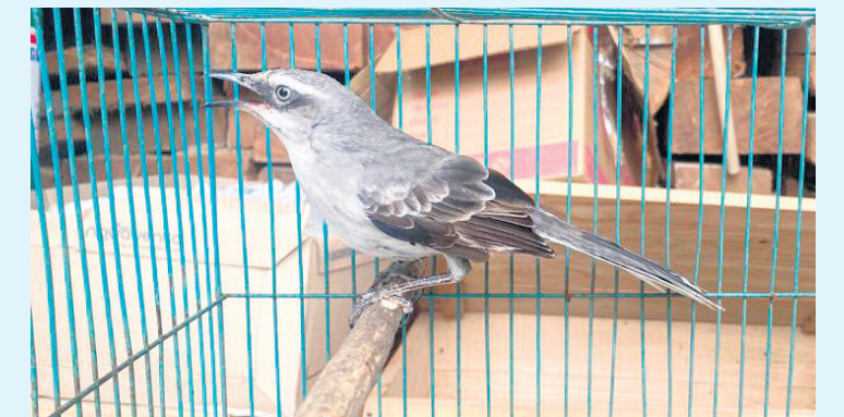
Las autoridades trabajan para evitar el tráfico de fauna silvestre.

Las autoridades colombianas, incluyendo el Ministerio de Ambiente y Desarrollo Sostenible, la Policía Nacional, el Instituto Nacional de Parques Naturales (Parques Nacionales) y entidades ambientales regionales, han intensificado sus esfuerzos para combatir el tráfico de fauna en 2023. Se han realizado operativos en carreteras, inspecciones en zonas residenciales y seguimiento a denuncias de la comunidad.