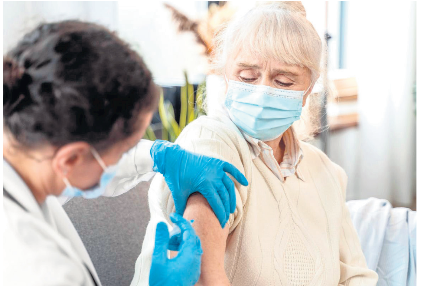
Adultos mayores son prioridad en inmunización contra la influenza.

“Vemos que todavía nos cuesta a los padres de familia, llevar a los niños a inocularse. Principalmente, tenemos complicaciones con los menores de 5 años y a esa edad, es donde se les aplican retrovirales contra patologías como tétano, tosferina, sarampión, la varicela, difteria y poliomieltis”, añadió, Rodríguez.