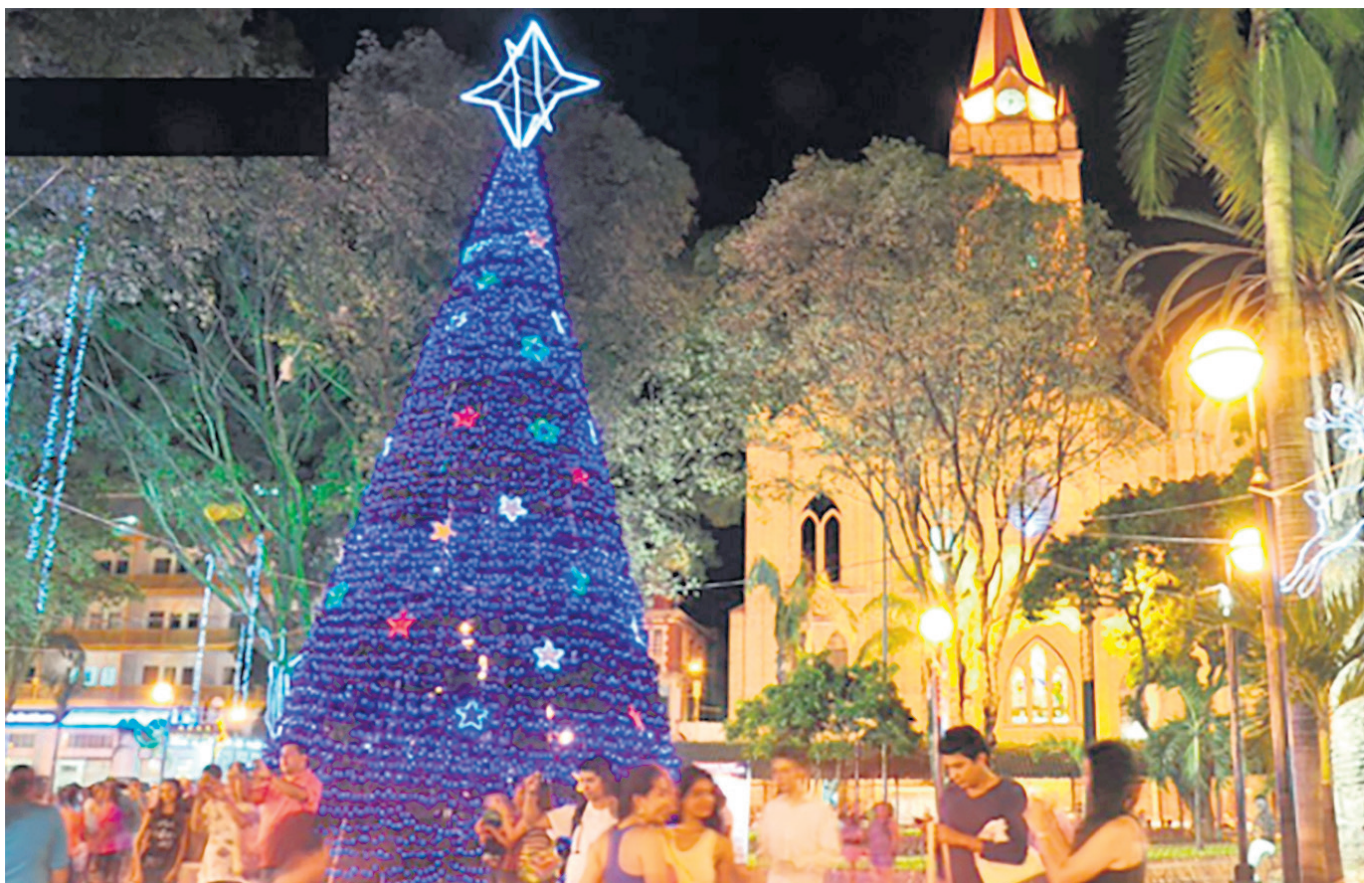
En la época decembrina la ciudadanía se vacuna menos.

Se insta a las IPS y a la población en general a continuar realizando pruebas diagnósticas a toda persona sintomática respiratoria y a sus contactos de acuerdo con las directrices del Ministerio de Salud y Protección Social. El diagnóstico de casos es fundamental para detectar tempranamente cambios en la positividad.