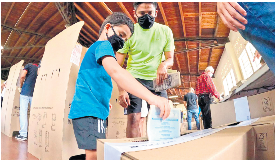
La colaboración ciudadana y la coordinación con autoridades locales fortalecen la seguridad electoral en el Huila

Estaciones biométricas aseguran la transparencia en las elecciones del Huila