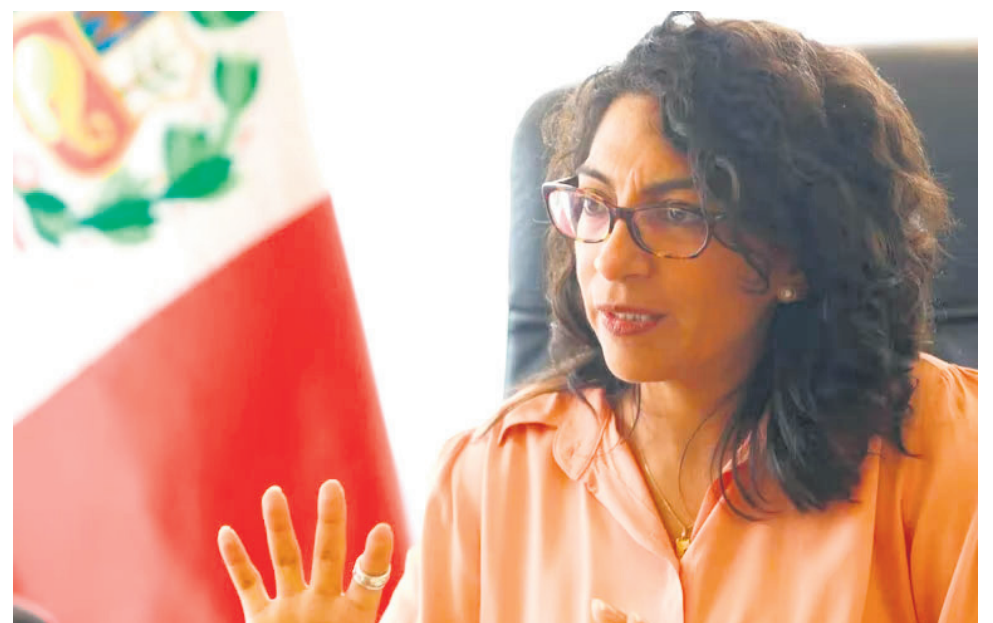
La ministra Leslie Urteaga emitió un pronunciamiento para aclarar que se tratarían de momias prehispanicas.

“Concluyo que los tres dedos en la mano son el resultado de retirar falanges y metacarpos de los dedos