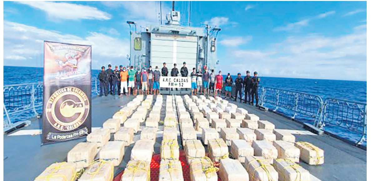
Pese a los operativos de las autoridades, en 2022 se dispararon los cultivos de coca y la producción de cocaína.

“Una vez se contó con la plena localización de la embarcación con el Grupo de Tarea compuesto con los medios militares aéreos y de superficie, la URR de Guardacostas logró la interdicción de la motonave a 313 kilómetros de las costas de San Andrés. Esto, luego de una persecución de varias horas, que terminó gracias a la presión y los procedimientos utilizados por los patrulleros marítimos de la Aviación Naval que lograron que los sospechosos se rindieran y pararan las máquinas de la em-