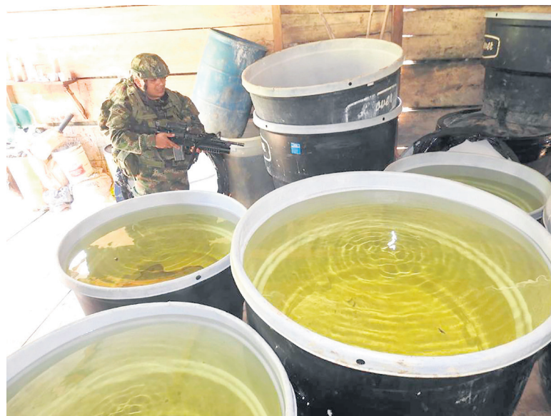
Tibú, Norte de Santander, el municipio colombiano con más cultivos de coca.

La cocaína está a punto de convertirse en el principal producto de exportación de Colombia, superando al petróleo, ya que la producción del estupefaciente sigue aumentando mientras el Gobierno adopta una política más indulgente.