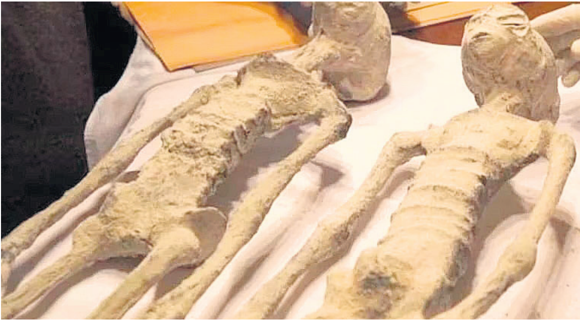
Jaime Maussan presentó cuerpos disecados de presuntos aliens.

pulgar y meñique. Los pies habrían sufrido las mutilaciones, además del corte de la piel y tejido blando del pie detrás de los dedos, produciendo un pie con dedos extremadamente largos, sin planta unificada de apoyo y funcionalmente inútiles”, indicó en un artículo.