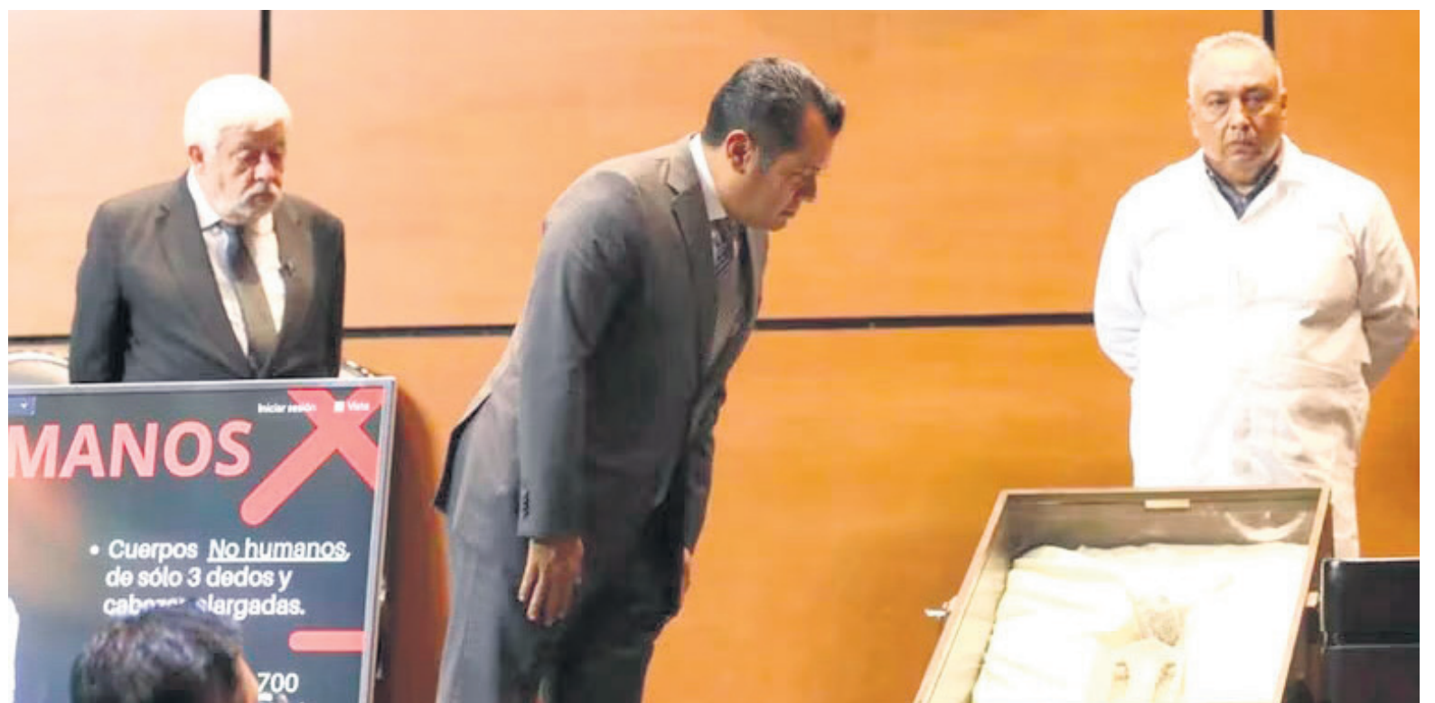
Fueron en total cinco ejemplares hallados entre las ciudades de Palpa y Nazca.

Este caso trae a la memoria de la colectividad peruana lo que ocurrió en 2018 en nuestro país, cuando se logró que un legislador organizara una actividad oficial para que se presentaran el ‘increíble hallazgo’ de ‘momias alienígenas’ ante el Congreso de la República de Perú.