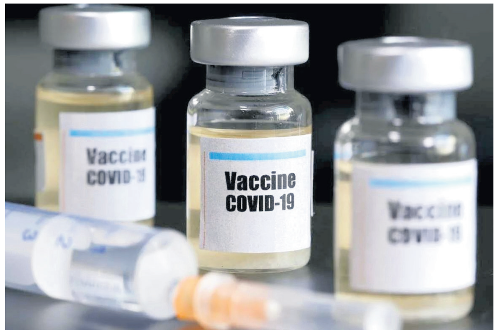
Según los expertos, la vacuna contra el virus también llegará a otros países |

De igual manera, “las personas con inmunodeficiencia moderada o grave reciban al menos tres dosis de la vacuna contra el covid-19, y que al menos una de ellas sea la vacuna actualizada.