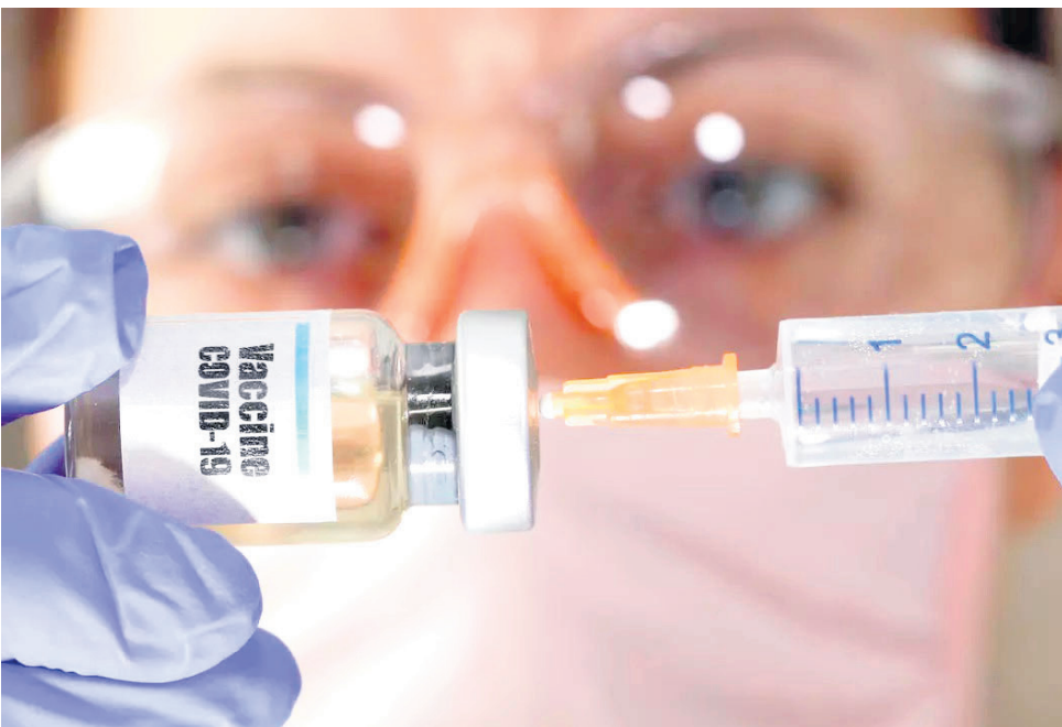
Las vacunas se producen con moléculas del virus.