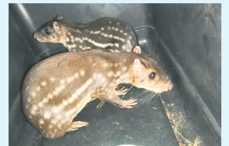
Crear conciencia en la comunidad es fundamental.

Además, se ha fortalecido la cooperación internacional en la lucha contra el tráfico de fauna, con intercambio de información y apoyo técnico de organizaciones como INTERPOL y la Convención sobre el Comercio Internacional de Especies Amenazadas de Fauna y Flora Silvestres (CITES).