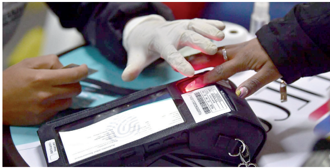
El Huila tendrá estaciones biométricas