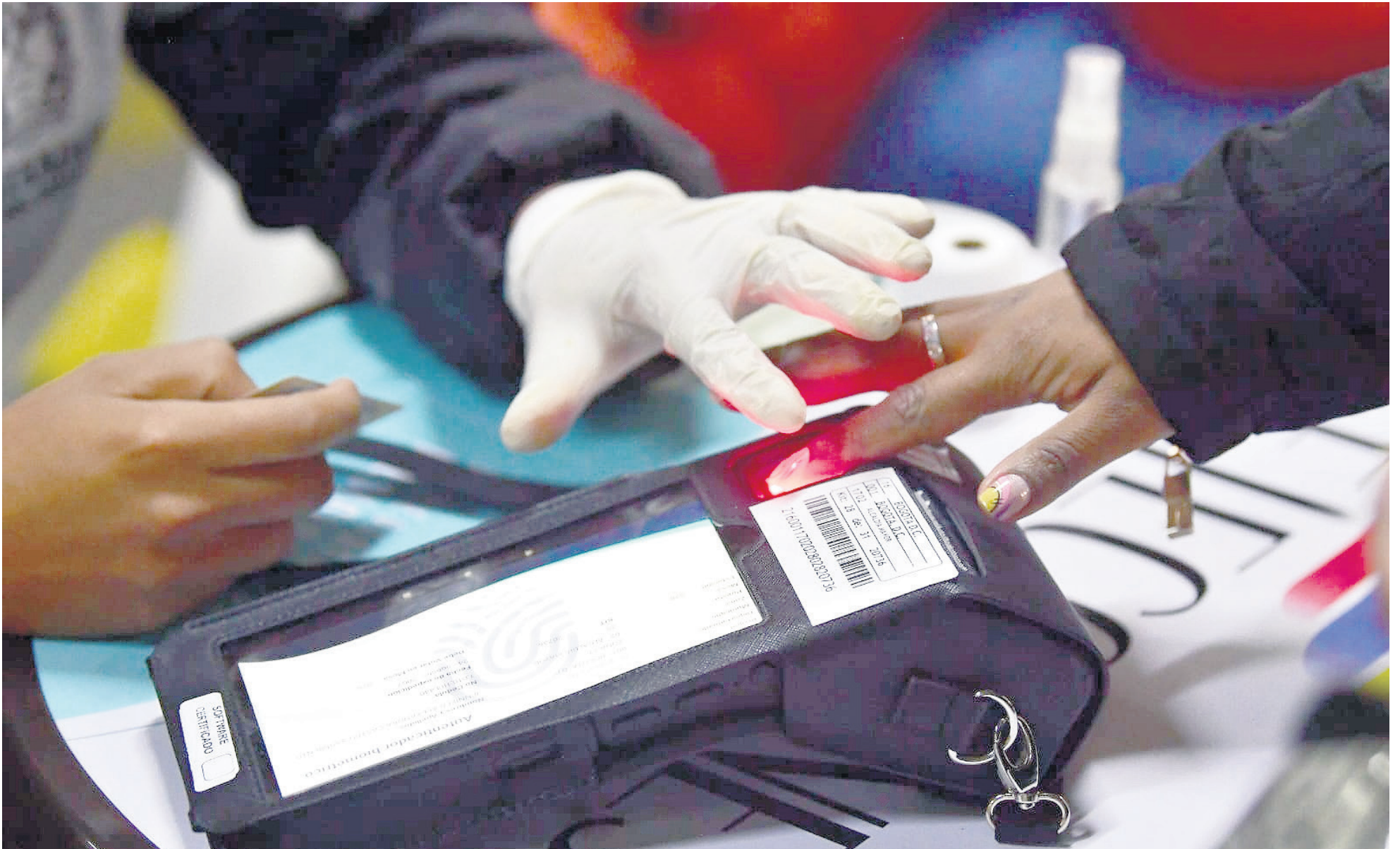
Ciudadanos del Huila autentican su identidad mediante estaciones biométricas en los puestos de votación de Neiva.