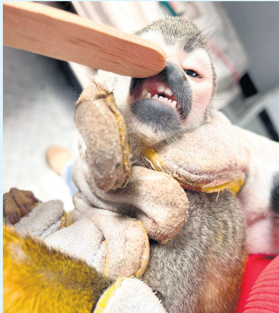
Para la recuperación de estas especies, la entidad ambiental ofrece la atención.

La conservación de estas especies es esencial para garantizar un equilibrio ecológico y un futuro sostenible para Colombia y el mundo.