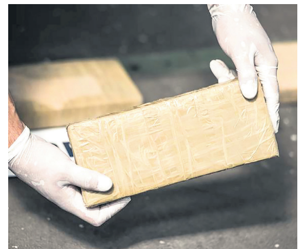
La producción de clorhidrato de cocaína aumentó en 24 %.

Los cuatro capturados, los equipos de comunicación, la embarcación inmovilizada y el alcaloide avaluado en 100 millones de dólares en el mercado ilegal internacional fueron puestos a disposición de funcionarios de la Fiscalía Gene-