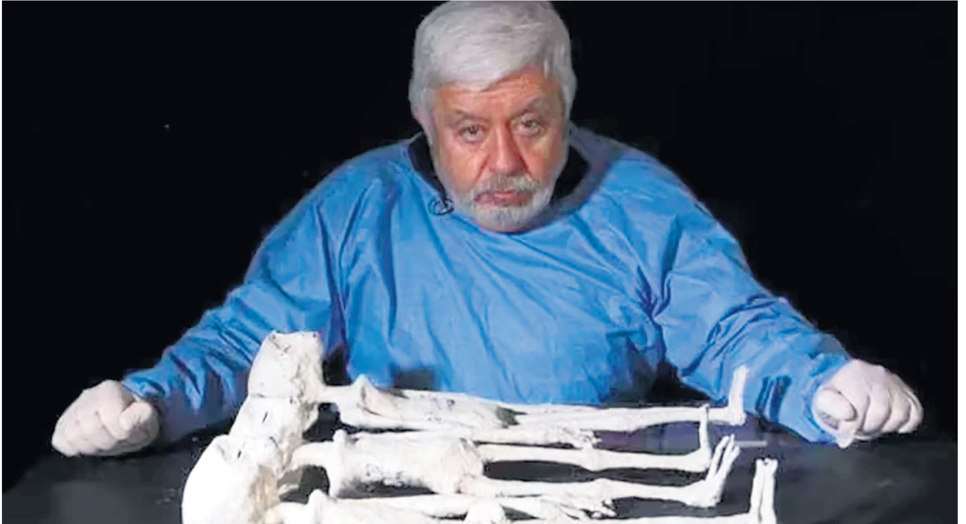
Se presentaron en cámara de diputados lo que se asegura es un cuerpo de un ser de otro planeta.

■ Perú se convirtió, nuevamente, en el centro de atención por un hallazgo que data del 2017. Se trata de cinco individuos de distintos tamaños y extrañas características que generó un gran debate sobre si se trataba de verdaderos seres humanos o 'alienígenas'