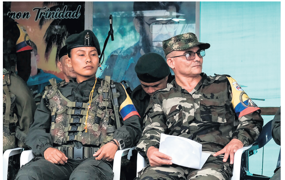
Este grupo armado es uno de los que tiene mayor injerencia en el Huila.

“Comienza un segundo proceso de paz. Se establecerá una mesa entre el Gobierno y el Estado Mayor Central”, escribió el Jefe de Estado a través de su cuenta de Twitter y posteriormente dio detalles de la decisión en una declaración a medios de comunicación en el municipio de Rosas (Cauca), donde puso en marcha la ruta alterna provisional entre los departamentos de Cauca y Nariño, afectada por deslizamientos de tierra en la región.