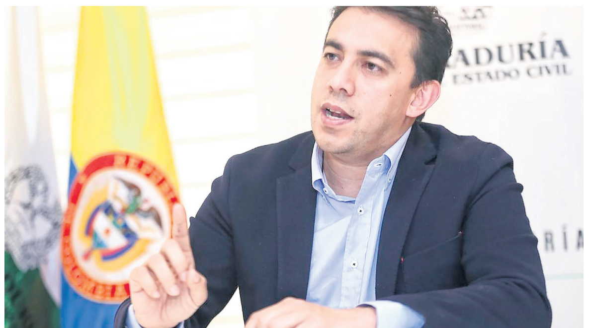
Registrador Alexander Vega anuncia medidas para prevenir la corrupción electoral y garantizar elecciones limpias.

Registraduría Nacional implementa medidas adicionales para garantizar la seguridad electoral. Estaciones biométricas aseguran la transparencia en las elecciones del Huila