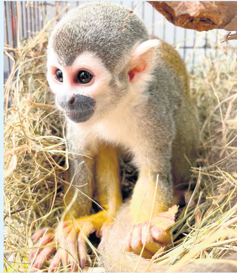
En cuanto al tráfico de fauna silvestre en el departamento, la última acción mostró la historia de ocho individuos recuperados.

tamento del Huila para combatir el tráfico ilegal de fauna silvestre. Esta labor es fundamental para proteger la biodiversidad de la región y rescatar a especies que se