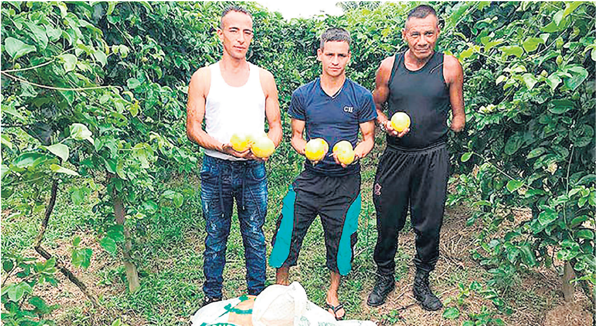
Esperan potenciar unidades productivas de excombatientes.

Desde la Gobernación del Huila, se planea realizar la hoja ruta, que permita seguir el camino de la reincorporación para los próximos años en el departamento y de paso se conozcan los proyectos productivos, adelantados por este grupo poblacional, para que no los dejen acabar. Y también, se encuentran a la espera de las reuniones entre la Presidencia de la República y las disidencias Estado Mayor Central.