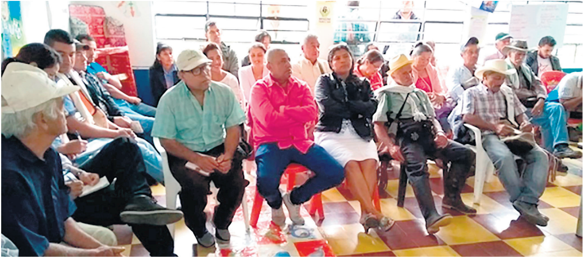
En el Centro de Convenciones finaliza el Encuentro Departamental de Reincorporados.

unos países garantes, están listos para el diálogo.