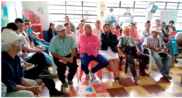
Aplazada hoja de ruta de reincorporación