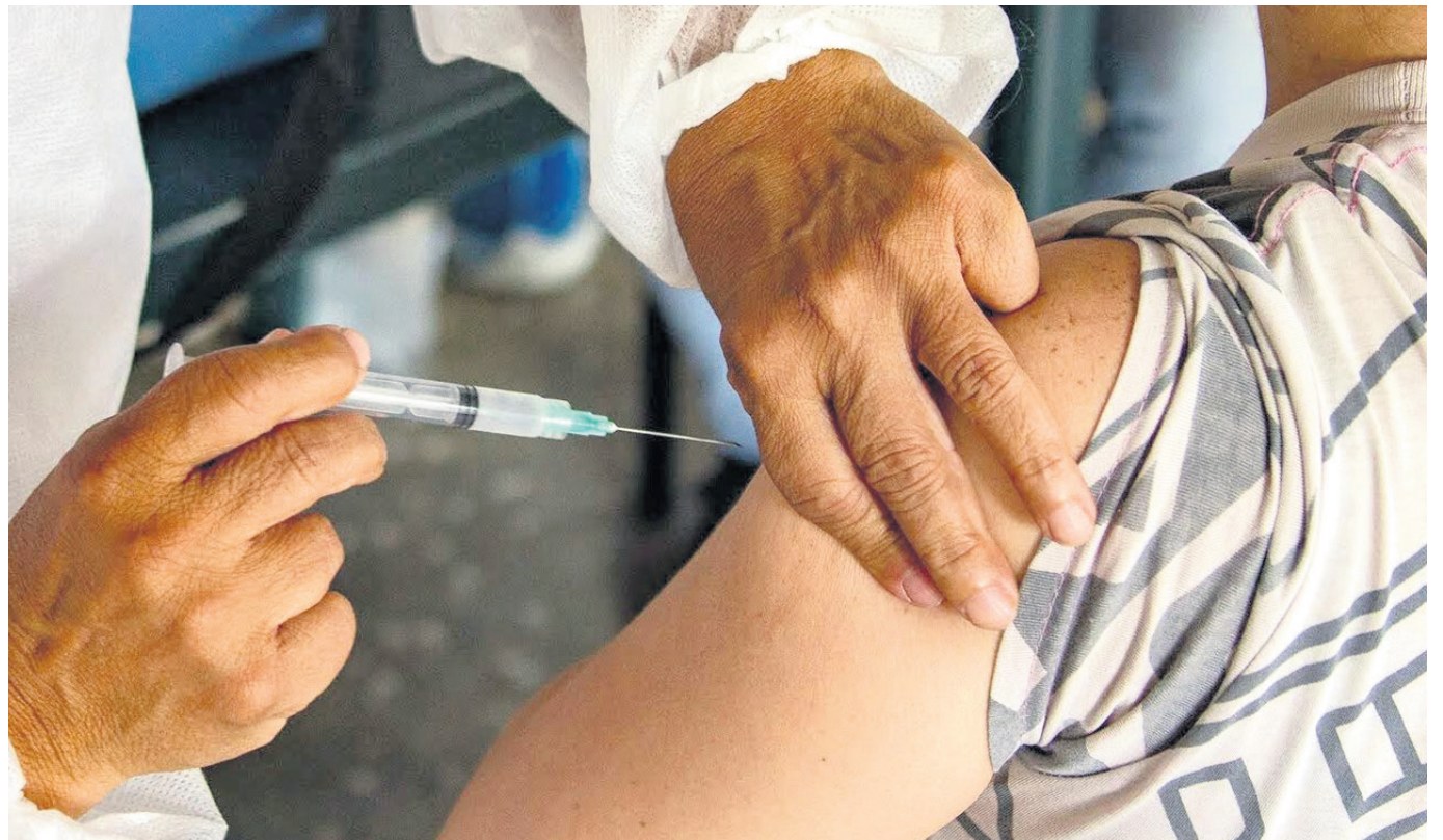
Aunque ya no es una emergencia, es importante no bajar la guardia con las medidas contra el covid.

Según la autorización ASUE, la vacuna de Moderna estará disponible para mayores de 18 años con alto riesgo de complicaciones, que hayan recibido al menos la primera vacuna frente a la COVID-19.