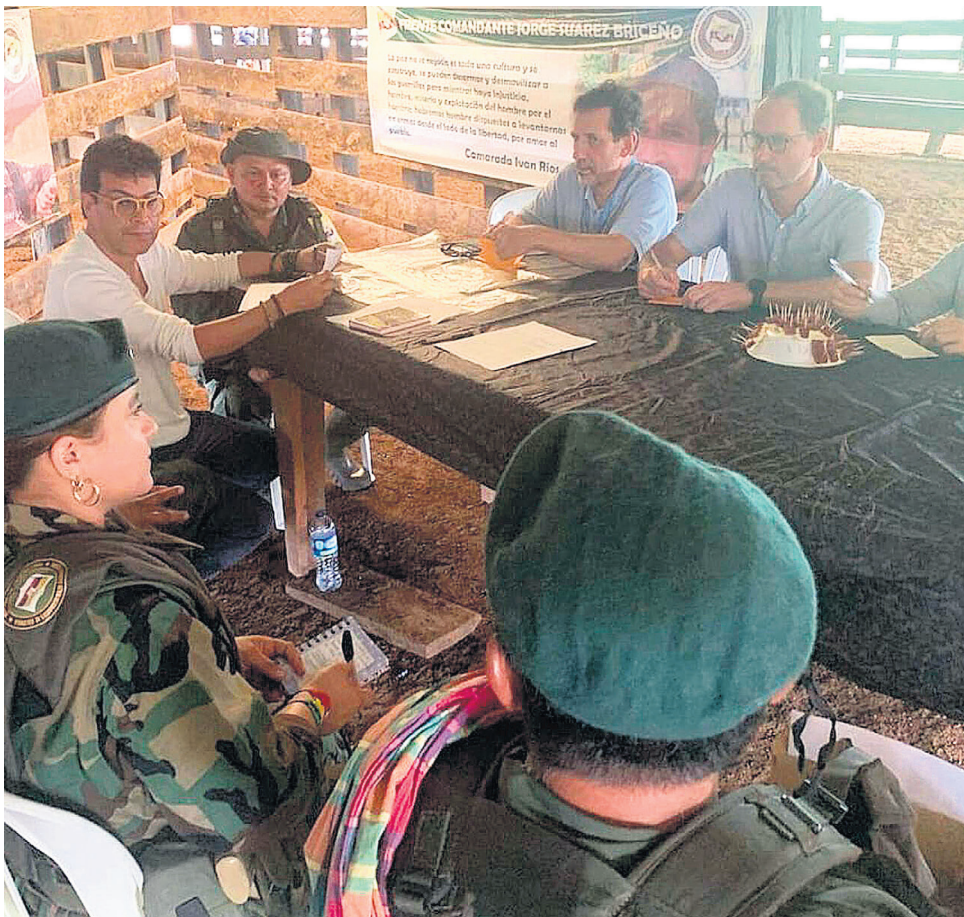
El próximo 17 de septiembre, se reunirá delegados del Gobierno Nacional con miembros del Estado Mayor Central.

Ya el próximo 17 de septiembre se van reunir delegados del Gobierno Nacional con miembros del Estado Mayor Central, que es uno de los que hacer presencia en el Huila. También, funcionarios del Alto Comisionado de Paz, van a hacer misiones humanitarias para verificar los avances de los pactos.