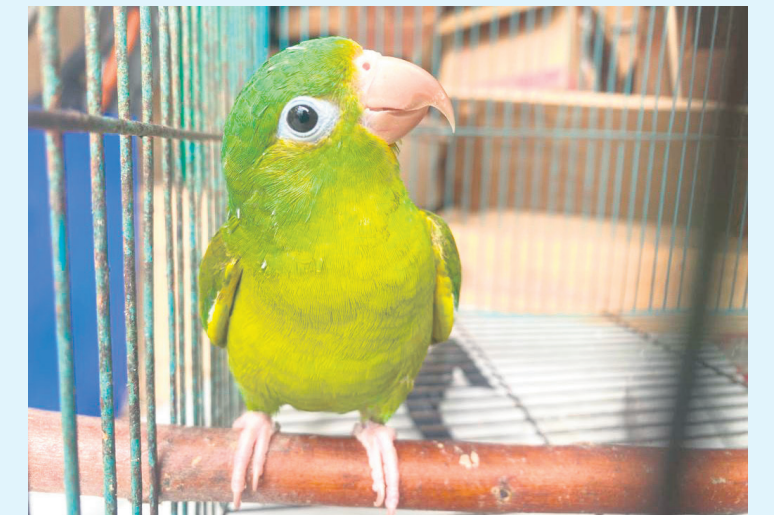
La CAM hace un llamado a la comunidad para que en caso de evidenciar el tráfico ilegal de fauna.