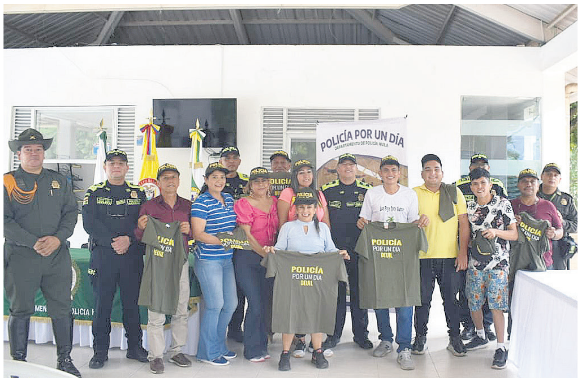
En el Centro de Vida Manzanares de la comuna 6 de Neiva, finalizó la celebración del Adulto Mayor en el departamento del Huila, una jornada que se llevó a cabo en los municipios, y en la que se ofrecieron actividades lúdico recreativas y de escucha para las personas mayores.