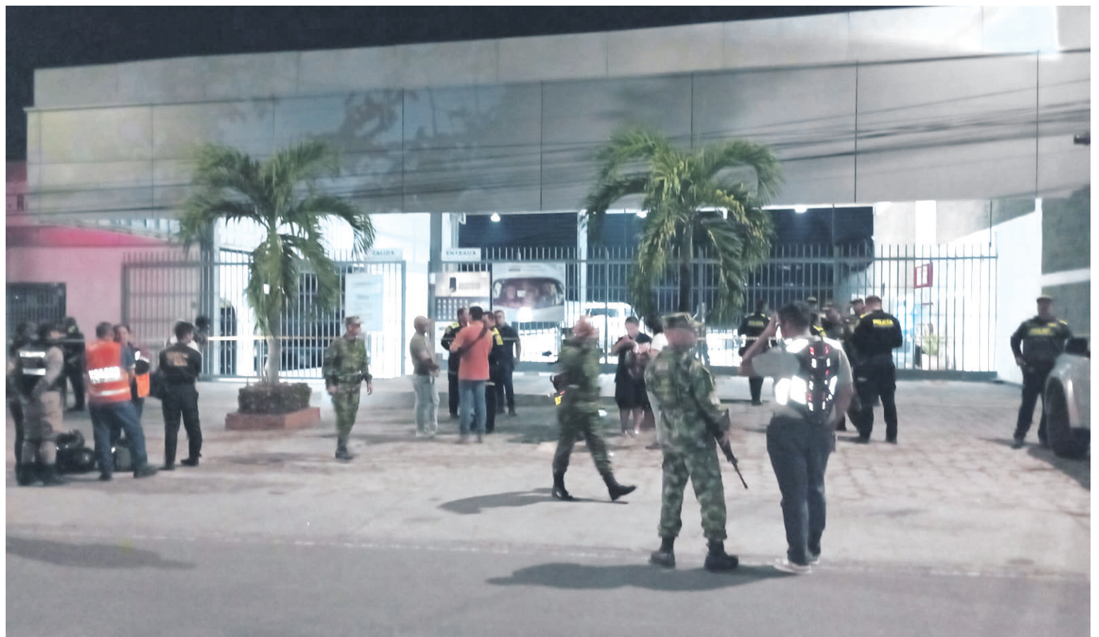
Concesionario objeto del ataque con granada.

Ya en cuanto al estallido, ocurrido la noche del pasado jueves, los testigos del hecho, indicaron