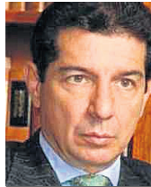
JOSÉ FÉLIX LAFAURIE RIVERA