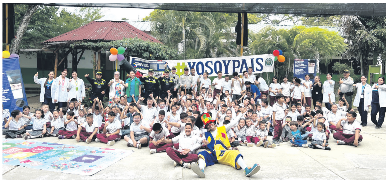
El Grupo Protección a la Infancia y Adolescencia, en compañía del grupo de Protección al Turismo y Patrimonio Nacional de la Policía Metropolitana de Neiva, en coordinación del Instituto Colombiano de Bienestar Familiar, realizan actividad de prevención en el colegio Ceinar sede “Renaciendo” de Neiva.