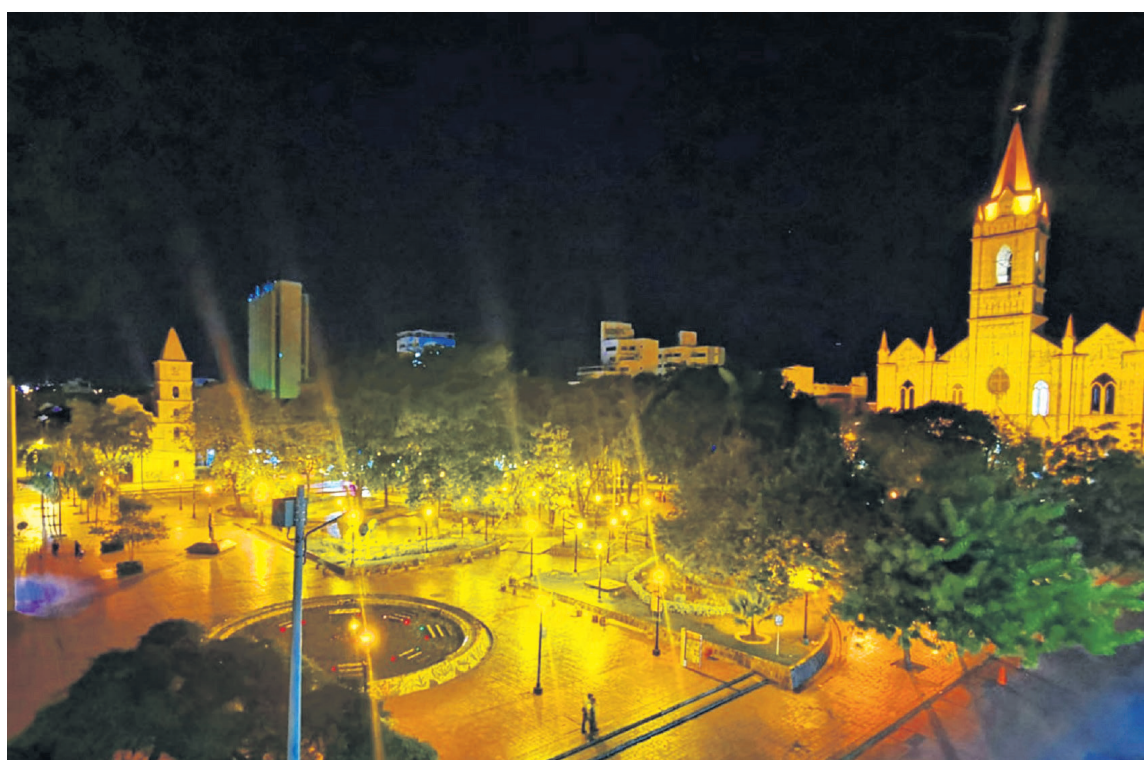
La estrategia 'Mi destino, tu noche' ofrece una amplia variedad de opciones de entretenimiento nocturno en Neiva, desde gastrobares hasta festivales culturales.

El lanzamiento oficial del programa está programado para los días de Semana Santa, con cinco programas nocturnos que ofrecerán una experiencia única en Neiva. Estos programas incluyen actividades como "Neiva más cerca de las estrellas", "Noches de Bulevar", "Noche Plan tour de la Quinta", "Neiva Parrandera" y "Con el Folclor en la Sangre". Cada uno de estos planes ofrece un recorrido por la ciudad, experiencias gastronómicas y opciones de entretenimiento.