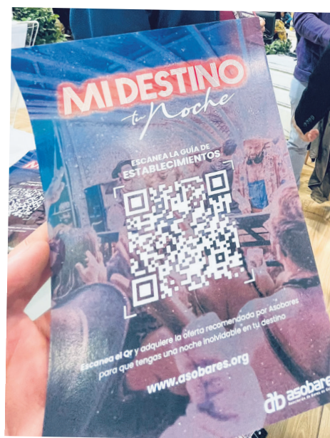
El lanzamiento oficial del proyecto 'Mi destino, tu noche' está programado para el 28 de marzo en la capital del Huila, Neiva.

Tafur Guzmán destaca que estos cinco programas nocturnos se complementan con cuatro ofertas