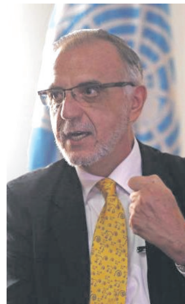
El ministro de Defensa, Iván Velásquez, estará en Neiva con los altos mandos de la Fuerza Pública.

“Esperamos que la comunidad nos brinde información, tenemos dos variantes involucradas en estos ataques, el Estado Mayor Central y otra de delincuencia común. Esperamos que los ciudadanos,