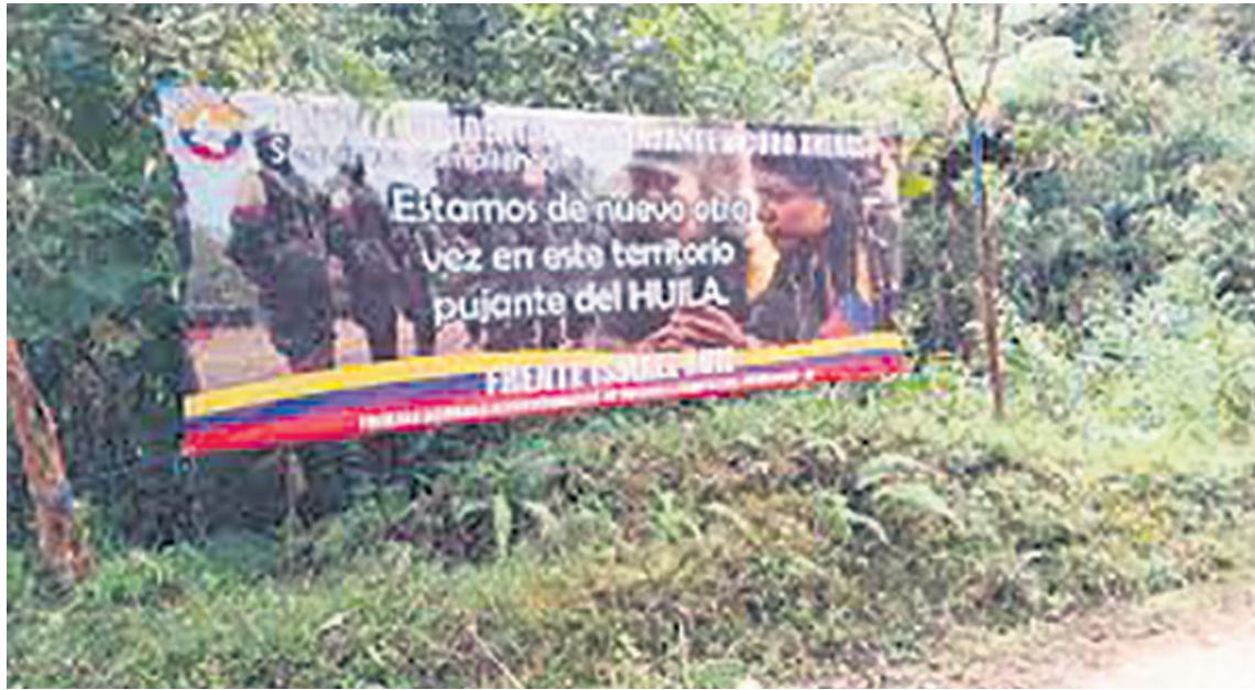
El frente Ismael Ruiz cobra vacunas en todo el Huila.

Esta organización criminal "existe desde la suscripción del acuerdo de paz con las extintas Farc EP en diciembre del año 2016, y a la fecha no ha sido desarticulada, lo que permite establecer su vocación de permanencia y durabilidad. Sometiéndose a los habitantes de esos sectores ya descritos a múltiples delitos: atentados contra la vida, cobro de "vacunas" o extorsiones y demás, de esta manera la empresa criminal ha puesto en zozobra e intranquilidad a esas comunidades alte-