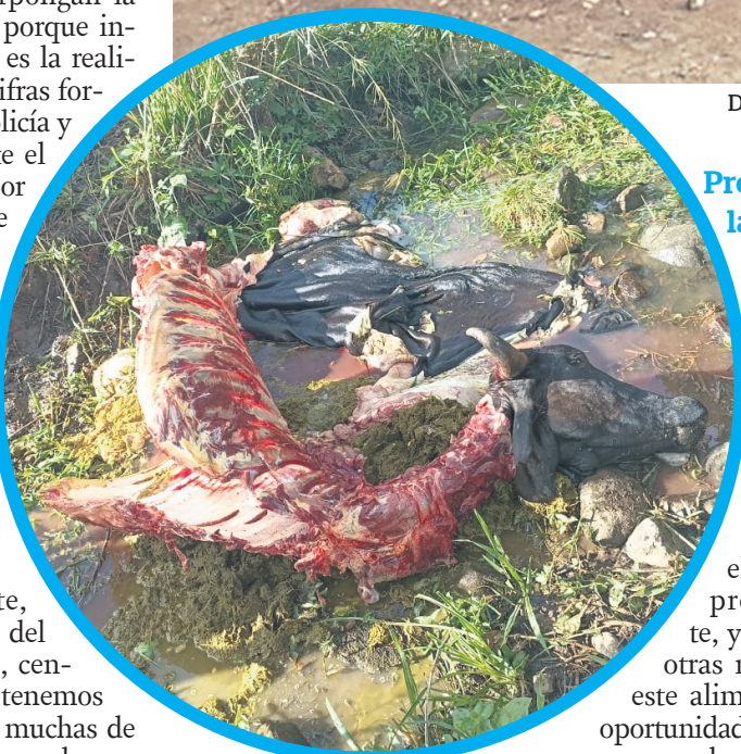
El municipio de Tesalia, es afectado por el 'carneo'.