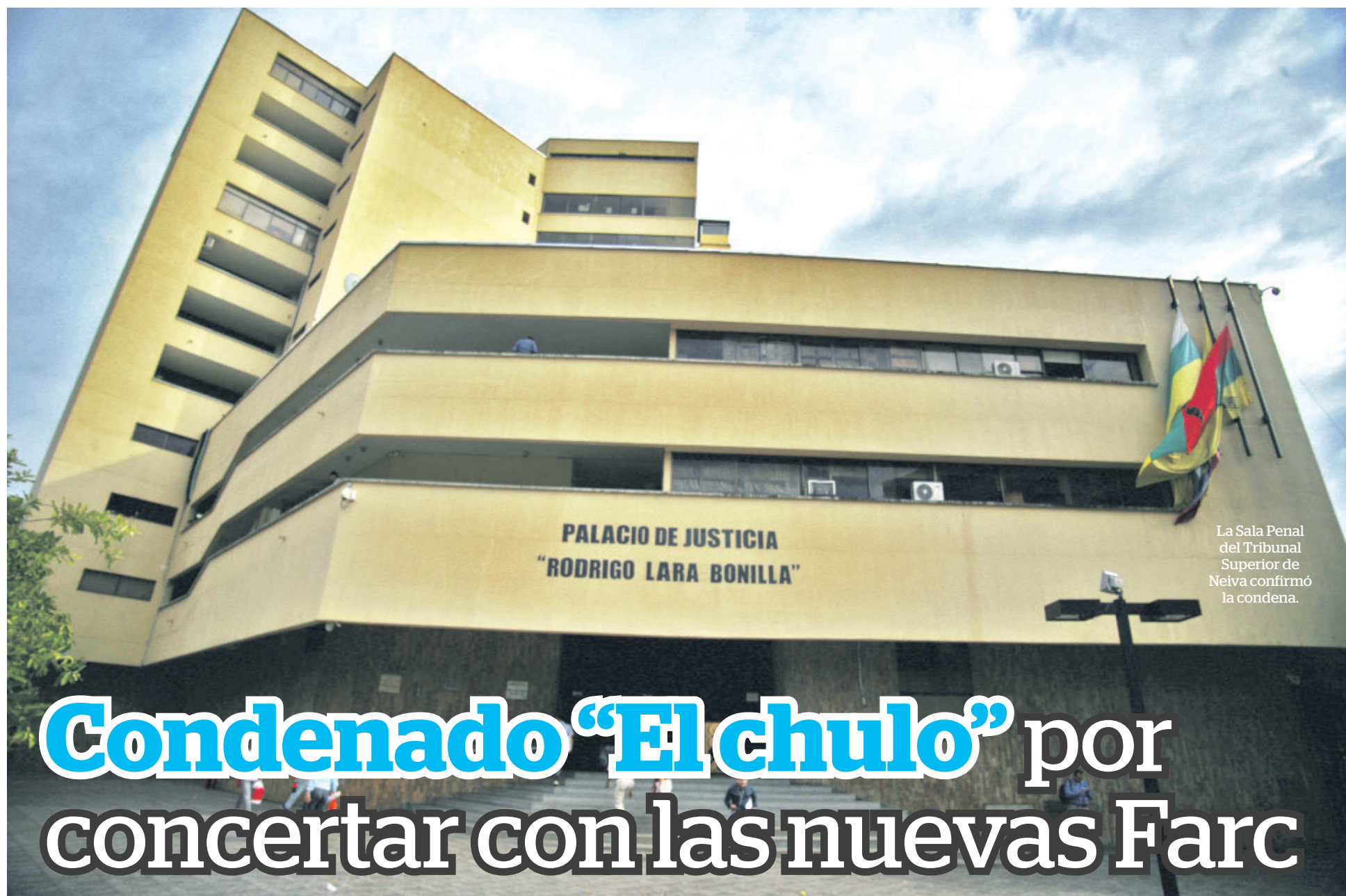
La Sala Penal del Tribunal Superior de Neiva confirmó la condena.