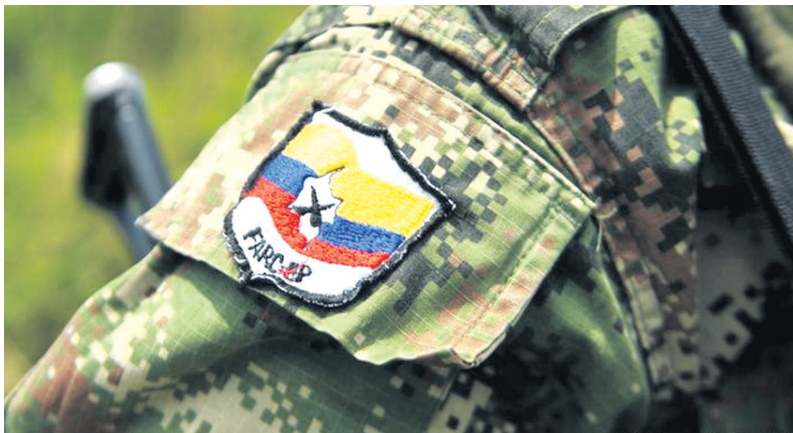
Las disidencias de las Farc siguen atacando a la población civil en el Huila.

Alias "Carlos" lo identifican como cabecilla Red de Apoyo de Estructuras Residuales - RAER comisión Huila y es el encargado de recibir el dinero producto de la exigencia económica que realizan a las víctimas, además, es el encargado de liderar las reuniones del brazo armado con las comunidades, donde les imparten supuestas normas de convivencia y doctrina subversiva.