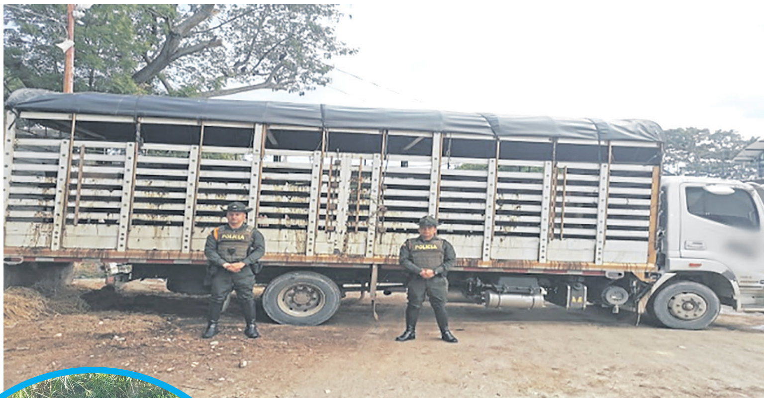
Dieciséis cabezas de ganado, valoradas en $30 millones, fueron recuperadas en noviembre de 2023.

“Las víctimas están asistiendo a los puntos donde son citados y dependiendo de las actividades a que se dedican, así les exigen los montos de dinero, que van desde los $5 millones, hasta los $30 millones. Y esto preocupa porque es arrebatarle la tranquilidad a los productores y es una realidad que está pasando en el departamento del