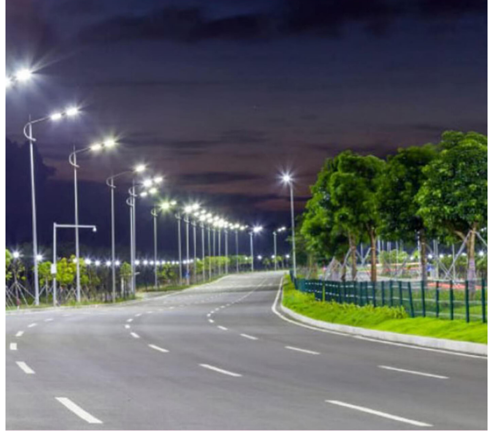
El temor a posibles apagones persiste en medio de la situación crítica que enfrentan los embalses del país.

mentando medidas para evitar recurrir al racionamiento. Además, se enfatizó que esta medida sería considerada como último recurso.