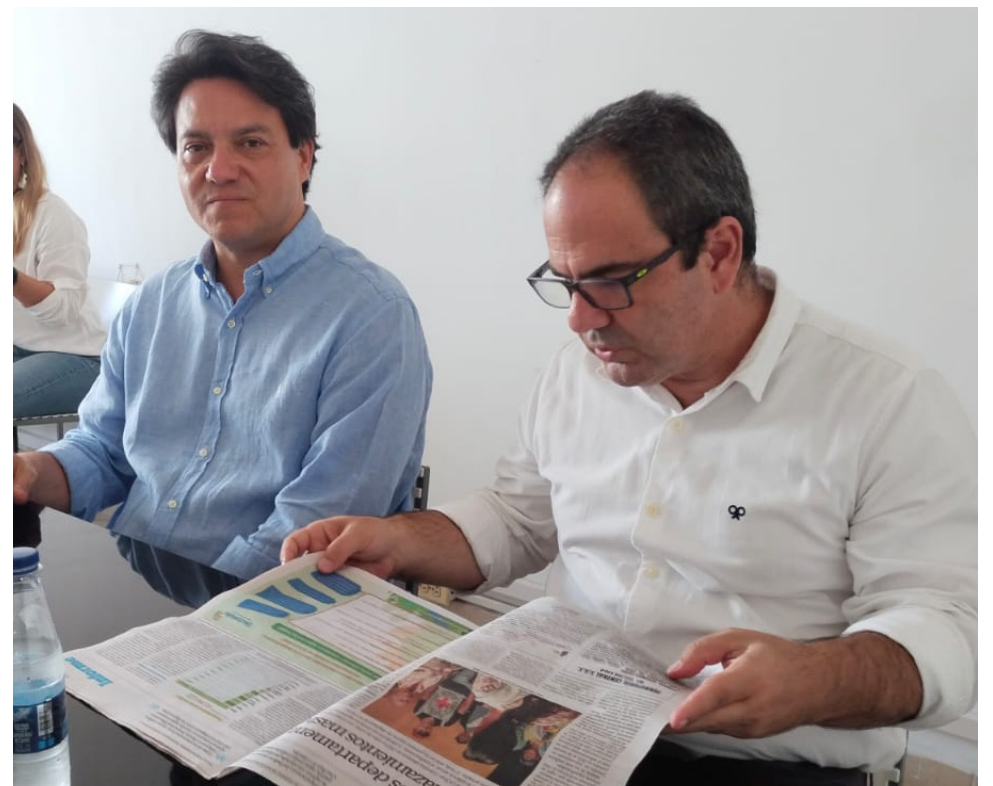
El líder político mostró su preocupación por la situación de seguridad del Huila.

El partido está inmerso en un proceso de autocrítica, revisando los problemas, dificultades y errores para reconquistar la confianza y el afecto de la ciudadanía. Este proceso debe ser inclusivo, abarcando a todos los sectores: estudiantes, profesores, sindicalistas, trabajadores, pequeños y grandes empresarios, agricultores, entre otros. En segundo lugar, es crucial identificar nuevos liderazgos políticos que nos permitan recuperar el espacio perdido en 2026. No somos un partido del viejo orden político. El candidato o candidata presidencial que elijamos debe poseer el liderazgo necesario para crear puentes de unidad con otros sectores políticos que se oponen al gobierno de Gustavo Petro. Debemos construir un frente común para evitar que el proyecto de Petro se mantenga en el poder.