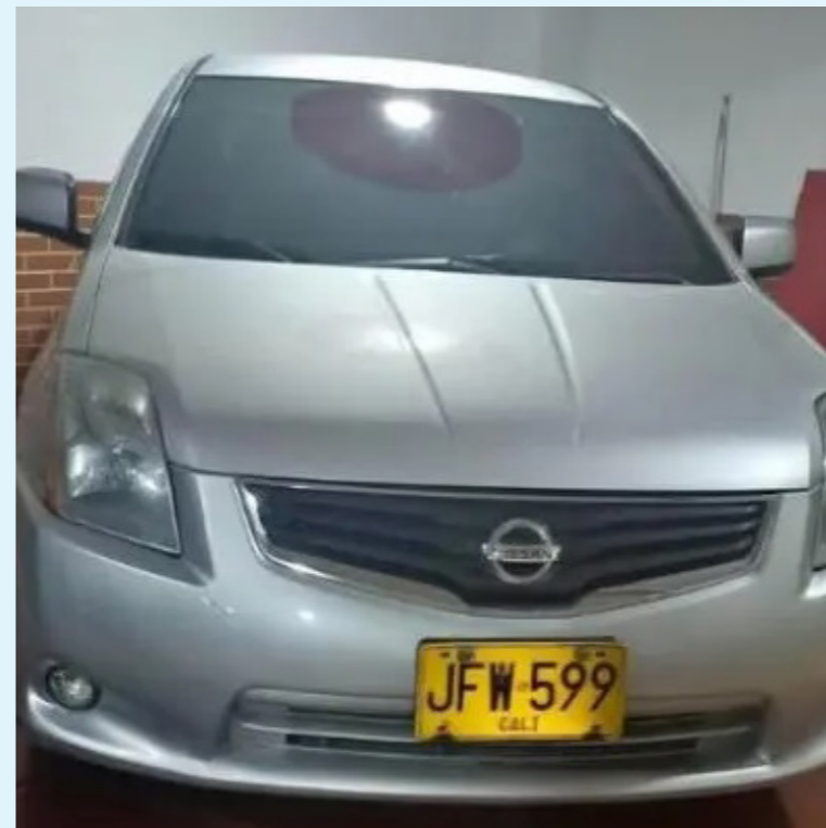
Este es el vehículo que trajeron al Huila a vender y que fue hallado 'gemelado' en Garzón.