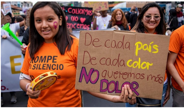
“Los feminicidios necesitan penas severas”