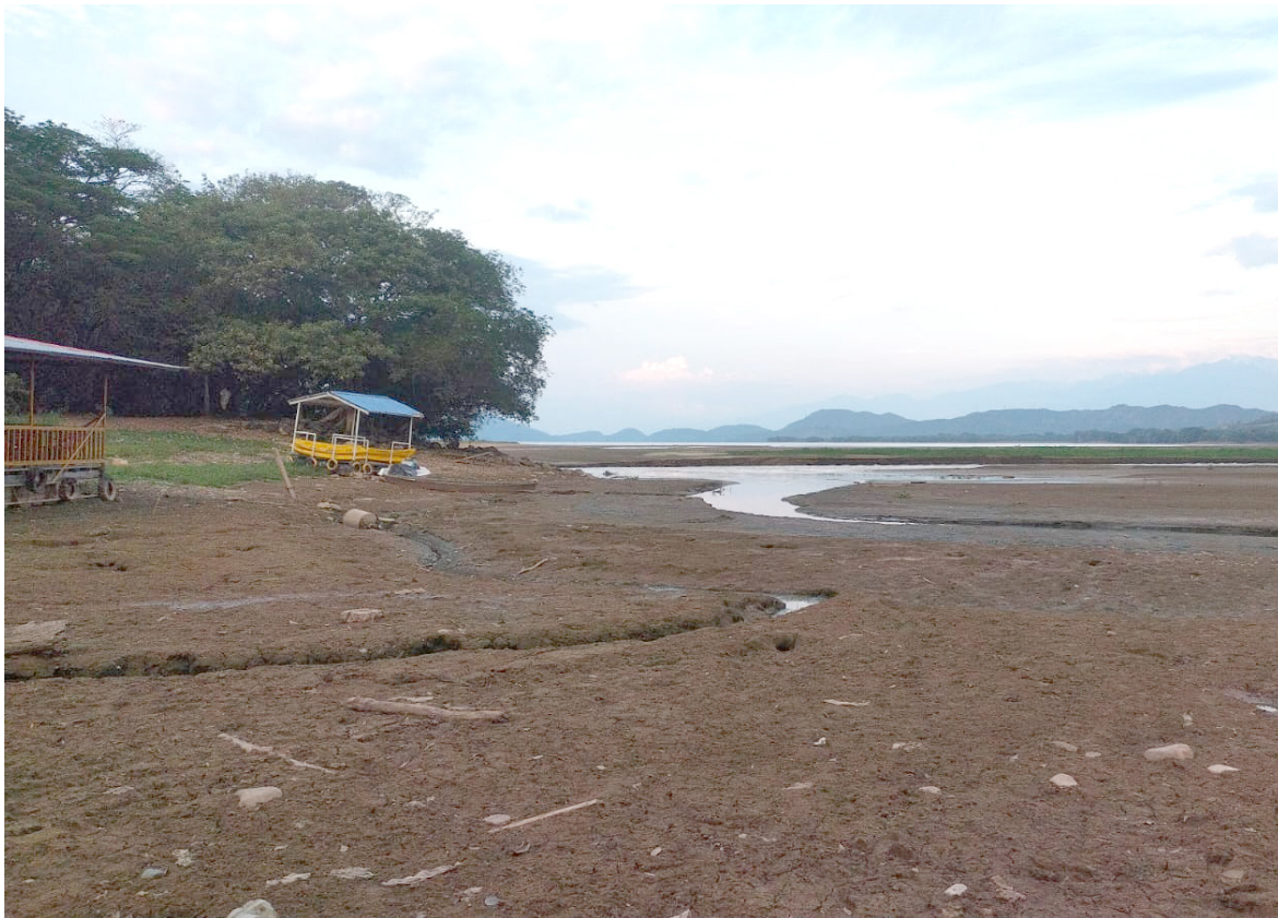
Preocupación por la escasez de agua y posibles apagones: El nivel de las reservas de agua en Colombia está en un preocupante 29,78%, según datos de XM.

La posibilidad de un racionamiento energético no se descarta, según las declaraciones del presidente de la Comisión de Regulación de Energía y Gas (Creg), Omar Prías, luego de la reunión convocada por el ministro de Minas y Energía, Andrés Camacho.