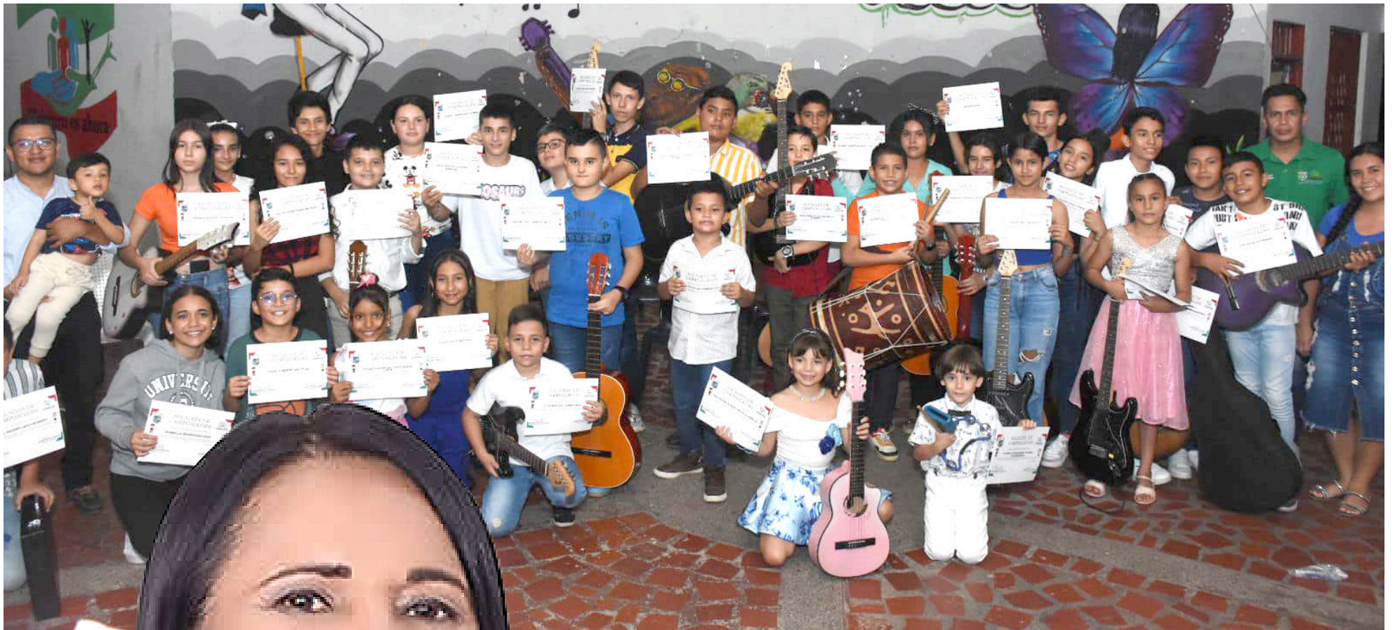
Con las escuelas de formación artística, esperan llegar a los 37 municipios de la región.

■ La dependencia de Cultura del Huila, maneja tres ejes fundamentales, atienden el área de teatro, música y danza, que van a ser articuladas con los distintos alcaldes y hablarán con los secretarios de esta dependencia. Asimismo, se encuentran estructurando programas y proyectos para el gremio de los artesanos.