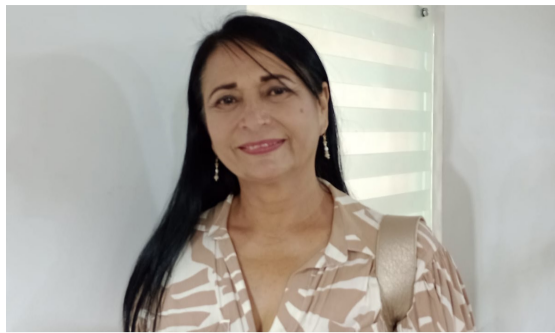
“La Secretaria de Cultura es más que San Pedro”