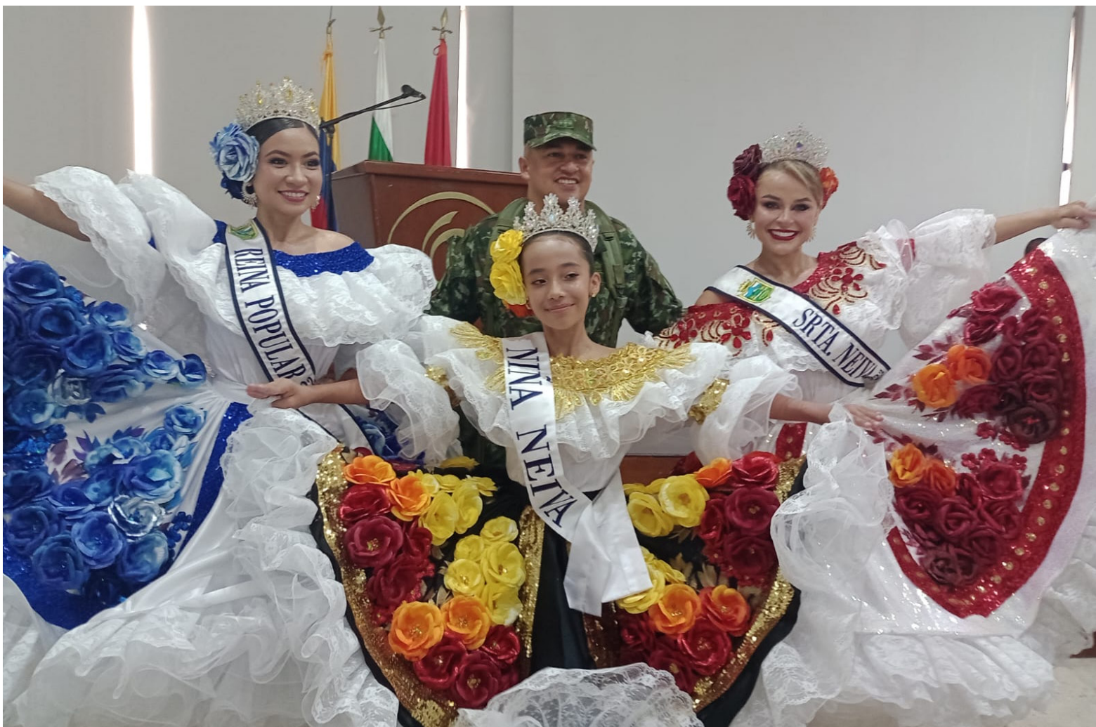
Reinas que participaron en el evento del lanzamiento del nuevo afiche del San Juan y San Pedro.

Incluso tienen asociaciones de mujeres, donde hacen el trabajo y por lo general ellos acuden es a la Alcaldía, para que les permitan llegar a las Instituciones Educativas y encontrarse con los estudiantes que son oriundos de las localidades, para que hagan su formación propia de este hermoso producto artesanal.