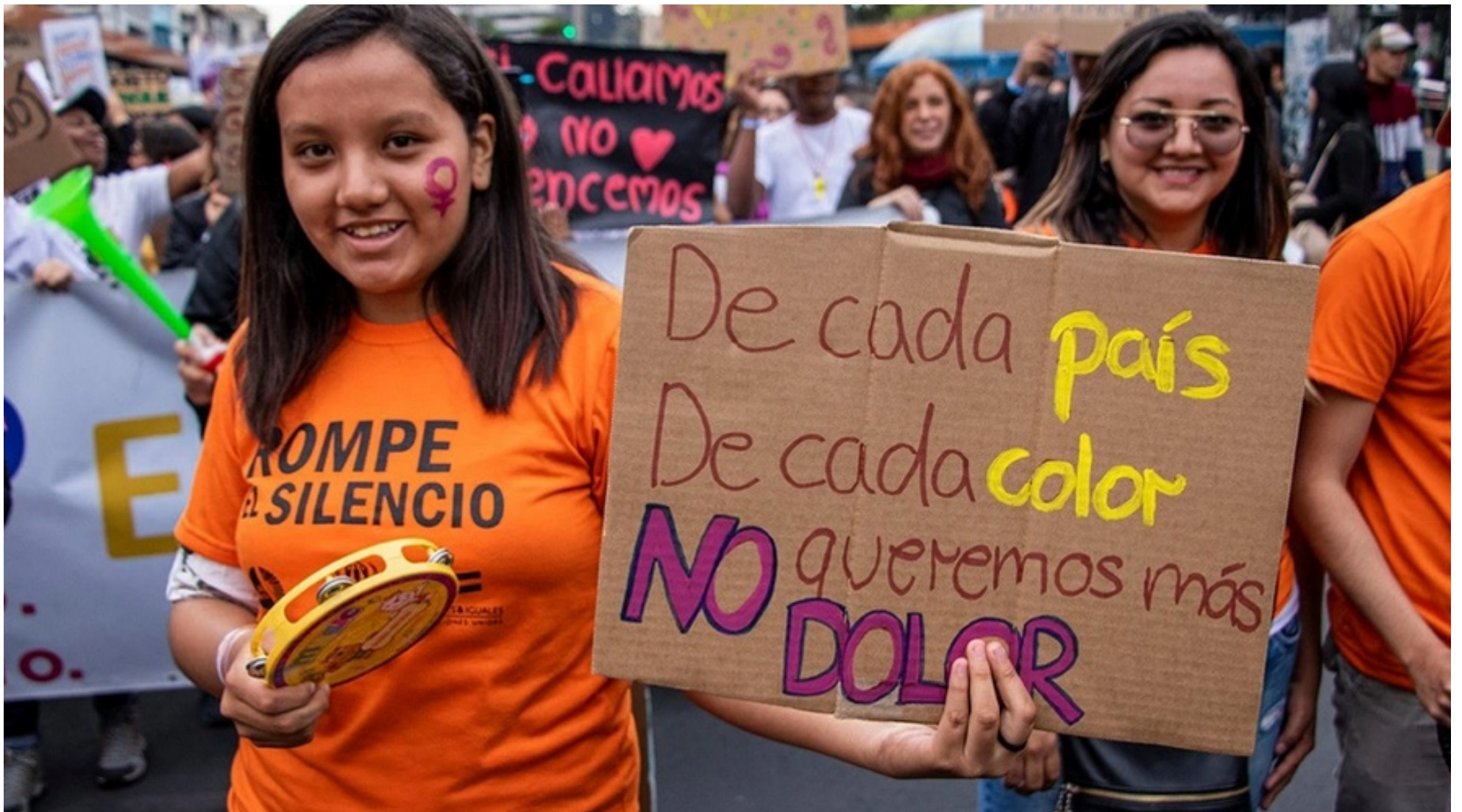
La violencia contra la mujer no cesa en el Huila.