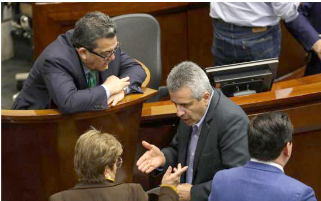
Jaime Dussán, director de Colpensiones, Gloria Inés Ramírez, ministra del Trabajo, y Luis Fernando Velasco, ministro del Interior.

Después de siete meses, el gobierno del presidente Gustavo Petro logró consolidar las mayorías para que avance su reforma pensional en la plenaria del Senado.