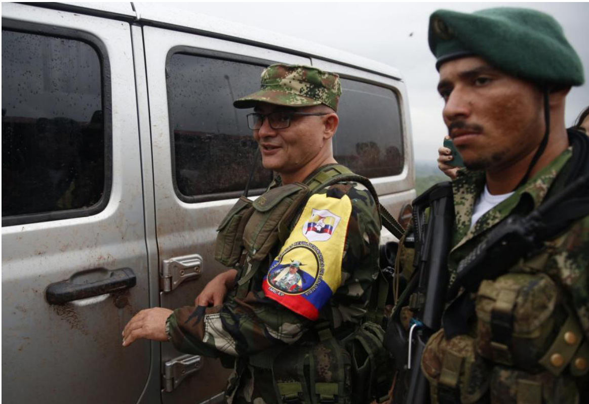
En un comunicado leído por el comandante del Comando Conjunto de Oriente, la célula subversiva reiteró su lealtad a Iván Mordisco, líder del Estado Mayor Central de las disidencias de las FARC.

jetivo era resolver la crisis desencadenada tras la suspensión del cese al fuego.