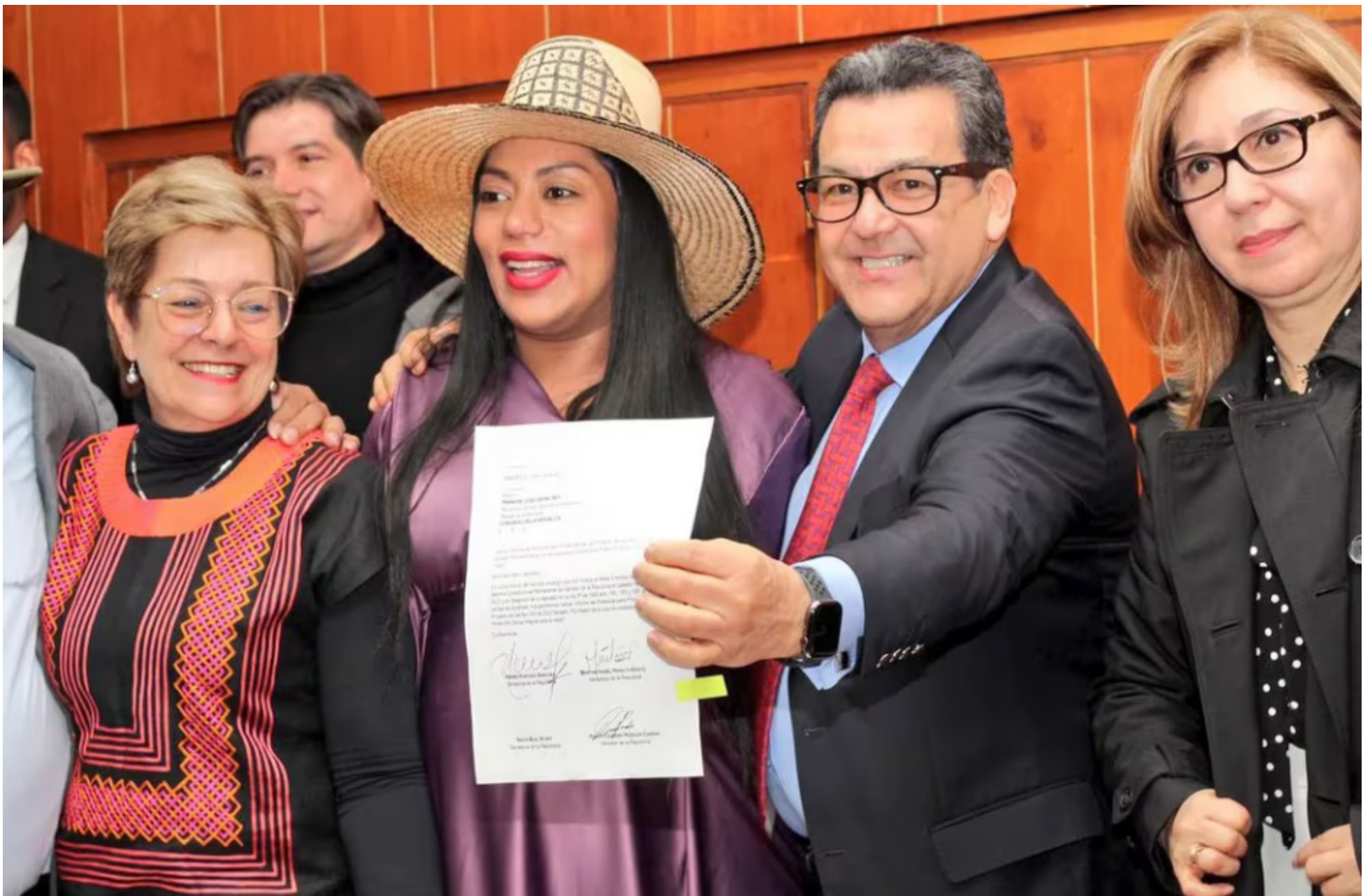
Hoy iniciará el segundo debate de la reforma pensional en el Senado.

este país, que tiene como objetivo central la protección a la tercera edad, a los adultos mayores y hoy como sociedad estamos cumpliendo. Hoy existe un régimen que no honra su función y que no pensiona. Y buscamos es que avancemos hacia los derechos, con una estructura de pilares, equidad y cobertura, dijo.