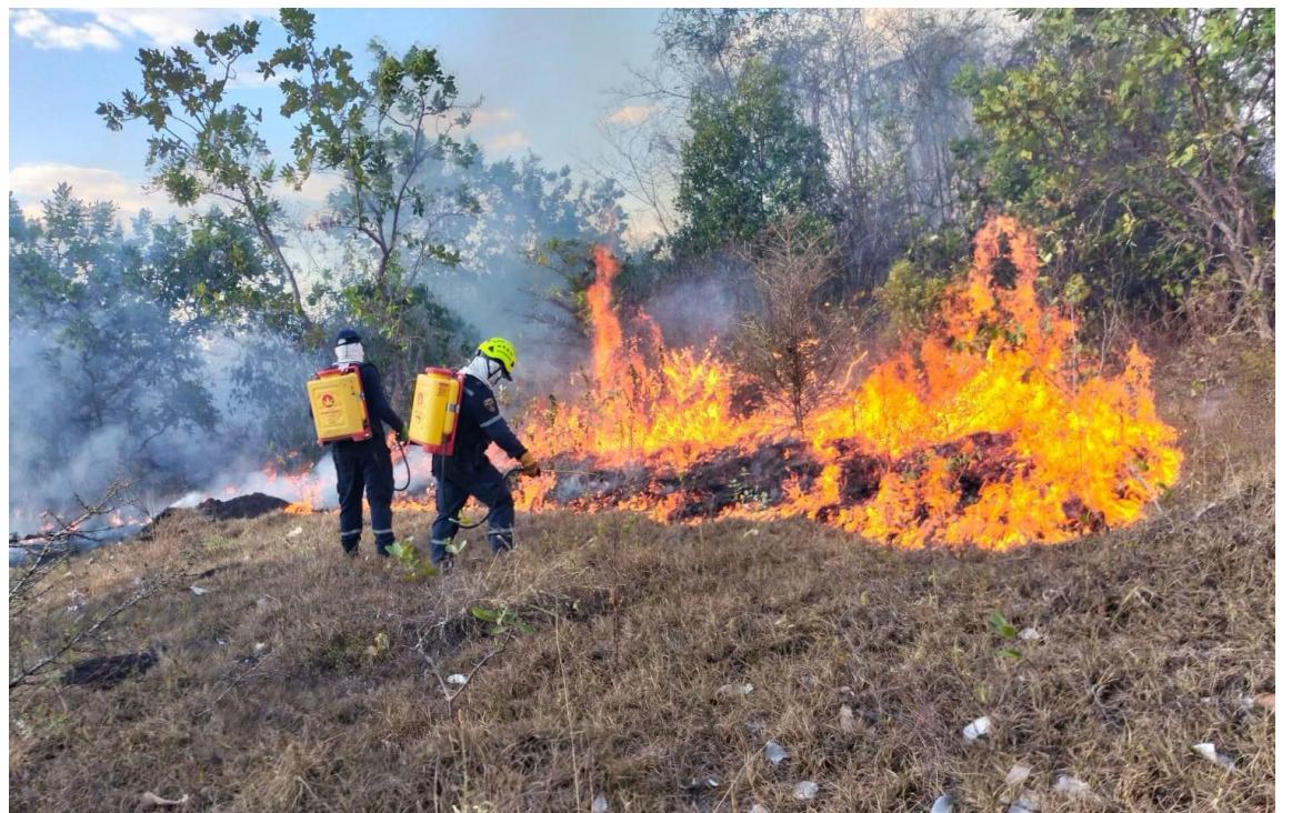
Un incendio forestal entre la vereda La Plata y Motilón Alto, que afectó más de 75 hectáreas y perjudicó nacimientos de agua que se encuentran en el sector, fue atendido con prontitud por el Cuerpo Oficial de Bomberos de Neiva.