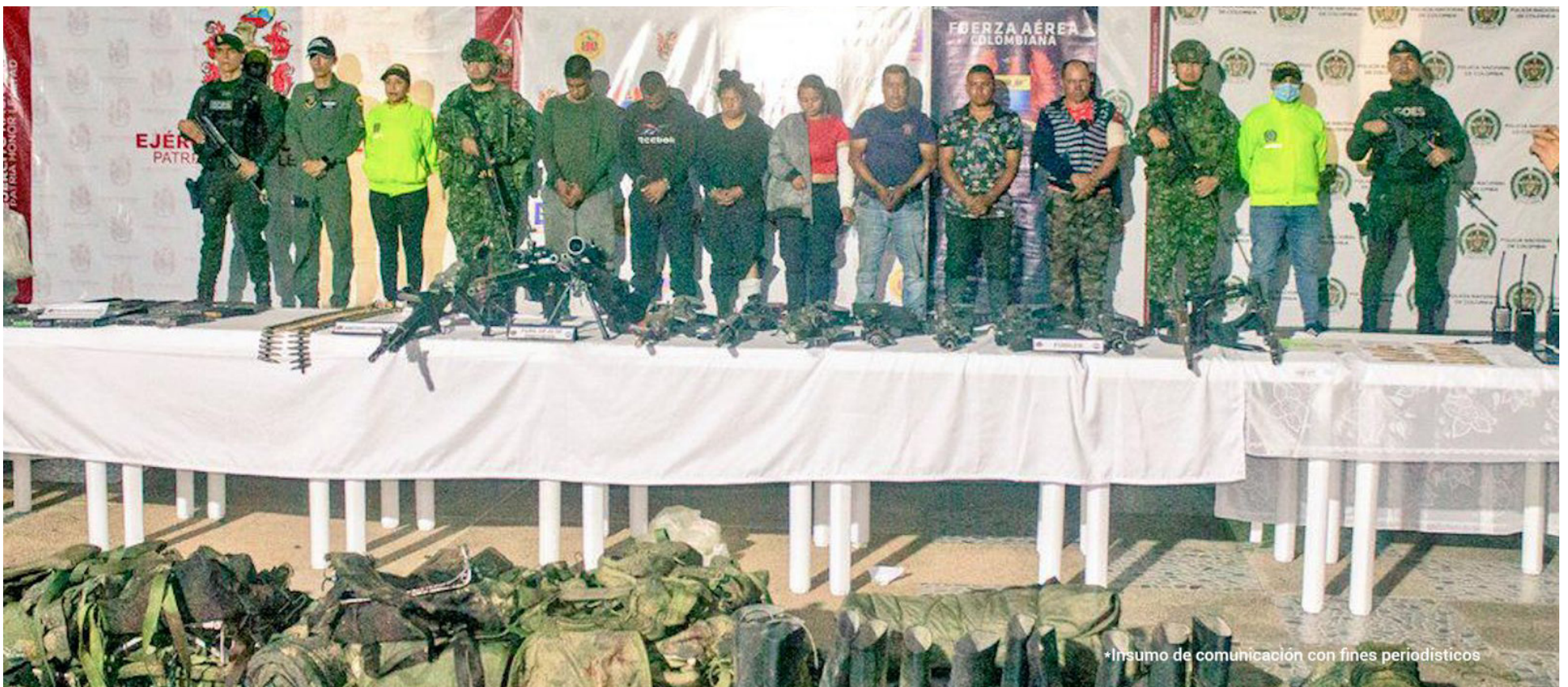
• Insumo de comunicación con fines periodísticos

Ante las especulaciones sobre una posible división interna en las disidencias de las FARC, el Comando Conjunto de Oriente (CCOr) emitió un comunicado reafirmando su apoyo a Néstor Gregorio Vera Fernández, alias Iván Mordisco.