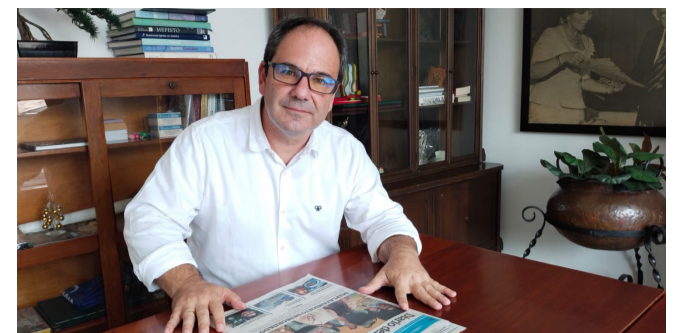
“La situación de seguridad del Huila es alarmante”