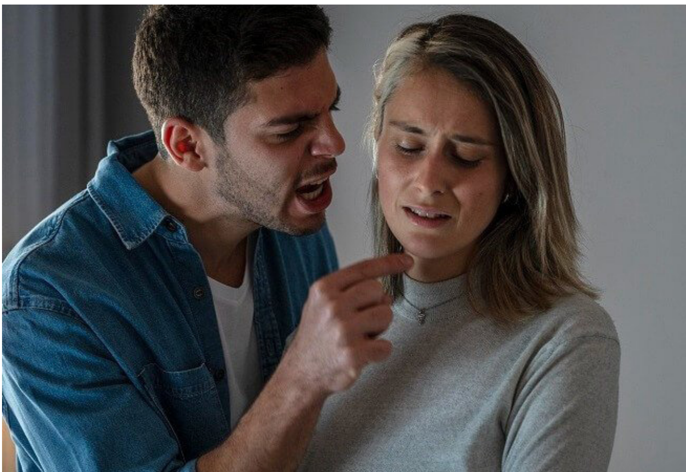
En las mismas Casas de la Justicia, se deslegitima las versiones dadas por las víctimas.

“Son violencias generadas por el ‘papel’ que ejercemos en la sociedad y eso tiene unos enfoques diferenciales que la institucionalidad no atiende. Por esto donde una mujer ve que sus procesos no avanzan, seguramente se va a quedar a la mitad del mismo, porque no tiene una representación jurídica”, agregó la cabildante.