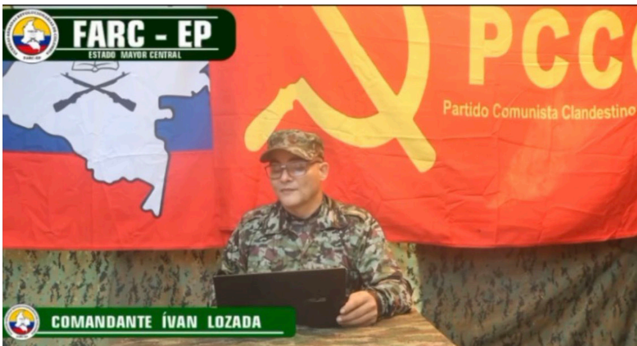
A pesar de las dudas planteadas desde diversos sectores sobre el futuro de los diálogos con el EMC, el líder del grupo no abordó directamente el tema en el video.

Es importante recordar que los miembros de este bloque, al igual que los delegados de las estructuras de Arauca, no asistieron a una reunión extraordinaria que se llevó a cabo en San Vicente del Caguán a principios de abril, cuyo ob-