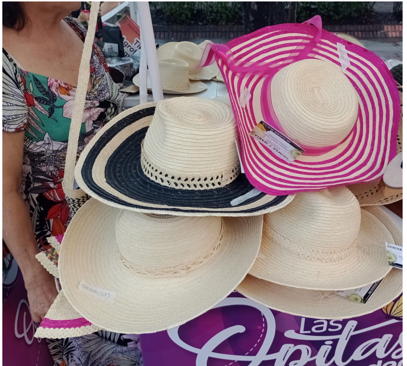
Temor a que se pierdan los saberes ancestrales, como el 'sombrero de pindo'.

“Hay Instituciones Educativas, quienes se han interesado, porque no se pierda el legado artesanal, porque hay municipios, preocupados, porque el proceso termina con la muerte del último de los sabedores, por ejemplo en el caso del sombrero de pindo que se da en Palermo”, reveló la funcionaria