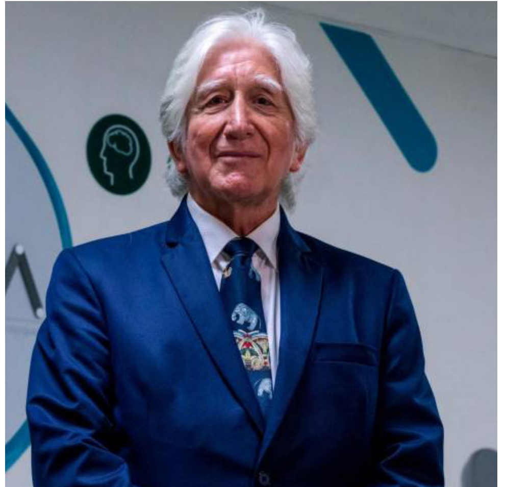
Francisco Lopera es un neurólogo colombiano reconocido internacionalmente por su trabajo en la investigación y tratamiento de la enfermedad de Alzheimer.

En los inicios de los años ochenta, mientras realizaba su residencia de neurología en el Hospital San Vicente de Paul, en Antioquia, un joven Francisco Lopera examinó a un paciente con un raro caso de alzhéimer: tenía solo 47 años.