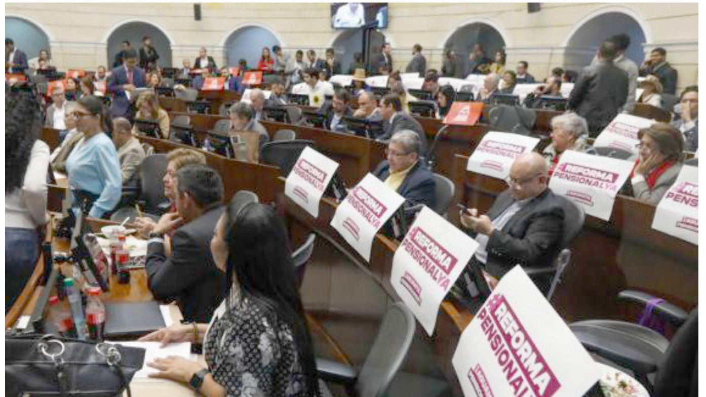
Debate de la reforma pensional en el Senado.

Las mayorías de esa corporación aprobaron en la noche de este lunes 15 de abril la ponencia positiva del proyecto, que había sido radicada en octubre del 2023, y ahora comenzará la discusión del articulado. Fueron 33 votos negativos y 49 positivos.