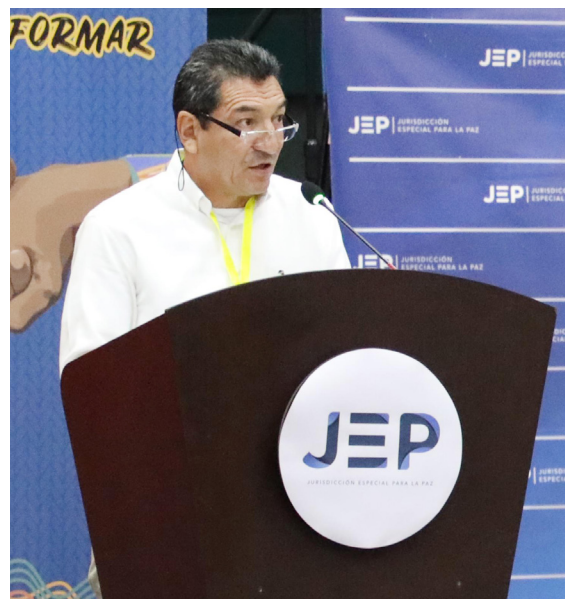
Los beneficios se otorgan por su comparecencia y la verdad aportada.

litos dolosos cometidos después de su aceptación en la JEP. El beneficio finaliza tras los 24 meses desde el primer desembolso, sin posibilidad de extensión ni pagos retroactivos por periodos en los que no se cumplieron las condiciones.