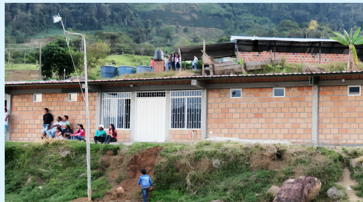
Se requiere la ayuda de los grupos humanitarios para la comunidad y la seguridad.

la organización, realizó una visita a las zonas de conflicto en el país, donde pudo constatar de primera mano la cruda realidad que enfrentan las comunidades afectadas.