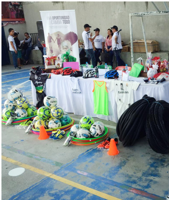
El acompañamiento de la ARN será igualmente psicosocial a ellos y sus familias.

Entre el 8 y el 10 de agosto pasados, los huilenses y colombianos vimos con horror en la audiencia de reconocimiento y aceptación de responsabilidad de los comparecientes procesados por la Jurisdicción Especial para la Paz en el subcaso Huila del Caso 03 “Asesinatos y desapariciones forzadas presentadas como bajas en combate por agentes del Estado” o por los mal llamados ‘Falsos Positivos’. Pese a que muchos ciudadanos no creyeron en el arrepentimiento de los exmilitares, estos reconocieron sus responsabilidades ante las víctimas por tres patrones criminales, en los que muchas veces reclutaron personas con promesas de trabajo y las asesinaron para mostrar efectividad y subir las estadísticas, en un ambiente lleno de presión por par-