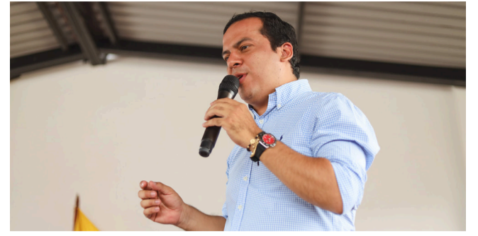
Corte Constitucional dejó por fuera a exrepresentante opita