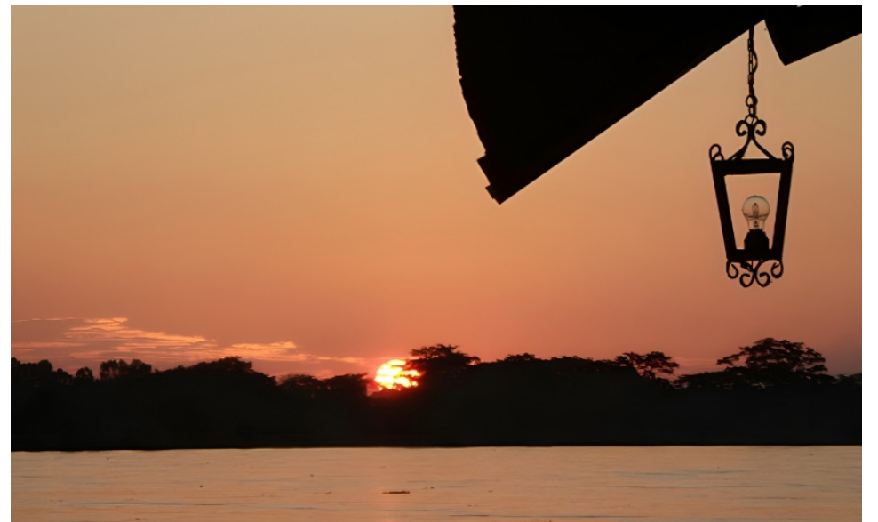
En el amor en los tiempos del Cólera, Gabriel García Márquez, ‘pinta’ con sus palabras los paisajes vistos a su paso por este emblemático río.

Fermina Daza no veía los animales de sus sueños: los cazadores de pieles de las tenerías de Nueva Orleans, habían exterminado los caimanes que se hacían los muertos con las fauces abiertas durante horas y horas en los barrancos de la orilla para sorprender a las mariposas, los loros con sus algarabías y los micos con sus gritos de locos, se habían ido muriendo a medida que se les acababan las frondas, los manatíes de grandes tetas de madres que amamantaban a sus crías y lloraban con voces de mujer desolada en los playones eran una especie extinguida por las balas blindadas de los cazadores de placer. Fragmentos del Banco de la República.