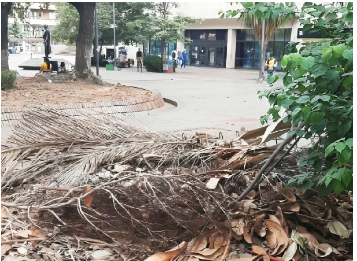
El abandono en el que se encuentran varios parques de la ciudad, entre ellos el parque Santander, cara de la capital opita. Ciudadanos reclaman aseo, ornato y embellecimiento para la ciudad.