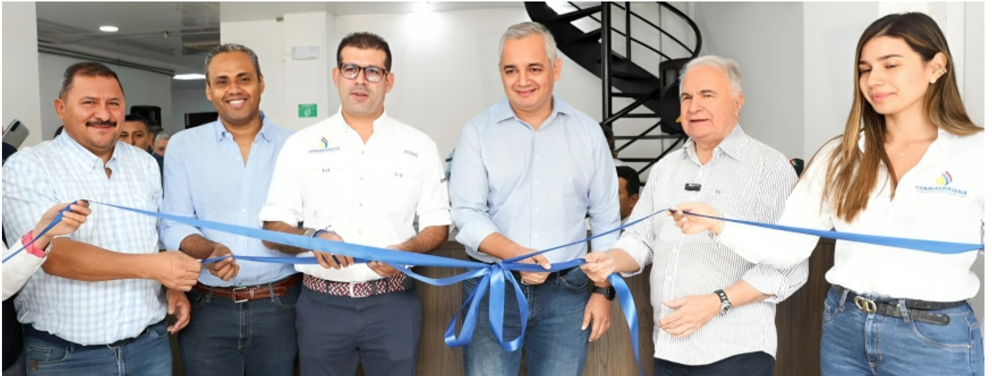
En Neiva la entidad tendrá una nueva sede.

quienes cuentan en sus regiones la importancia del afluente.