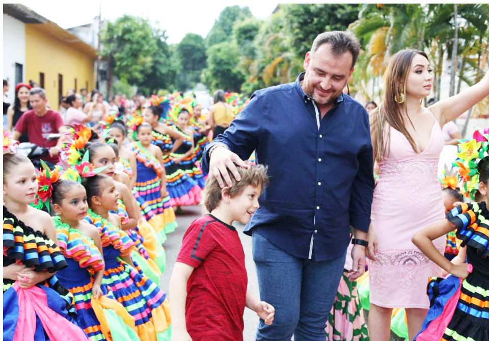
Las Fiestas Reales son para unirnos, compartir y promover el turismo, dijo el mandatario.

“Estoy seguro de que celebraremos las mejores fiestas porque somos conscientes, en la administración municipal y seguramente en el propio pueblo yaguarano, que esta es la mejor vitrina