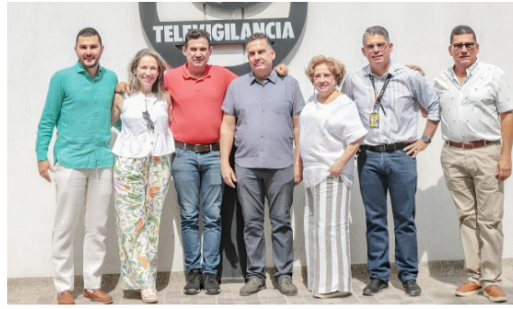
Treinta años de tradición en seguridad