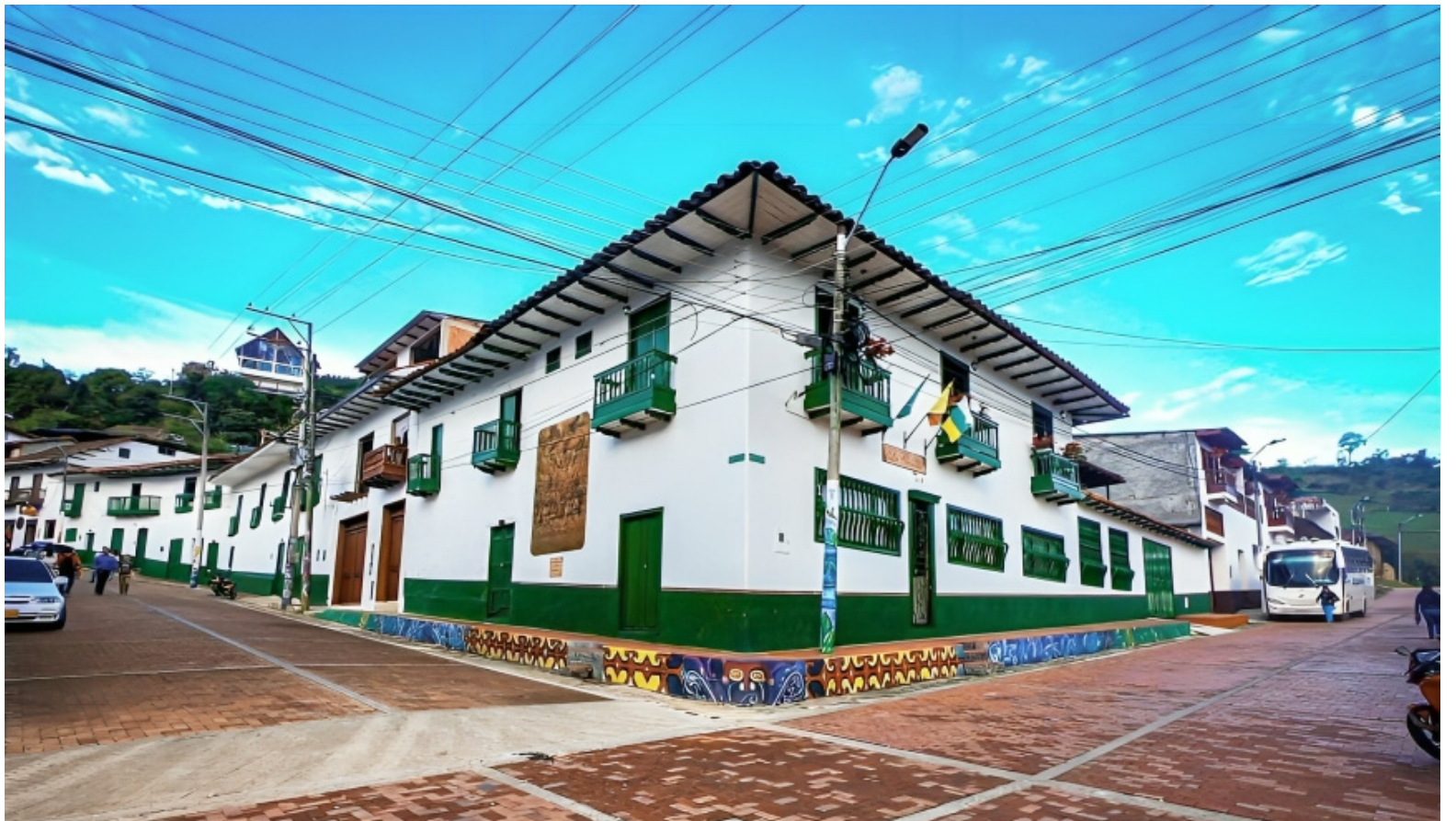
La travesía iniciará en San Agustín, el próximo 3 de septiembre.

la principal hidrovía que tiene este país, que es el río Magdalena”.