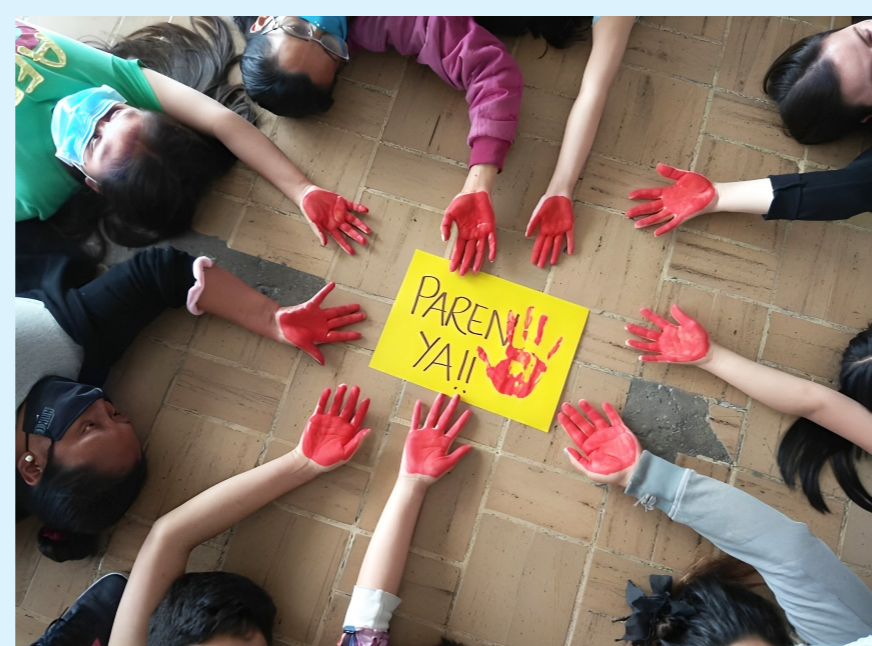
Militares colombianos protegen las zonas apartadas del territorio.