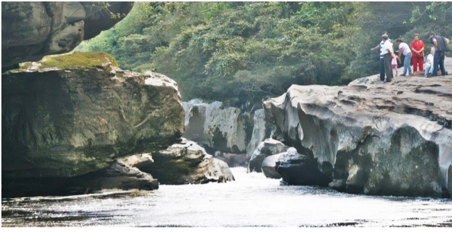
Entre amores y desamores con el río Magdalena