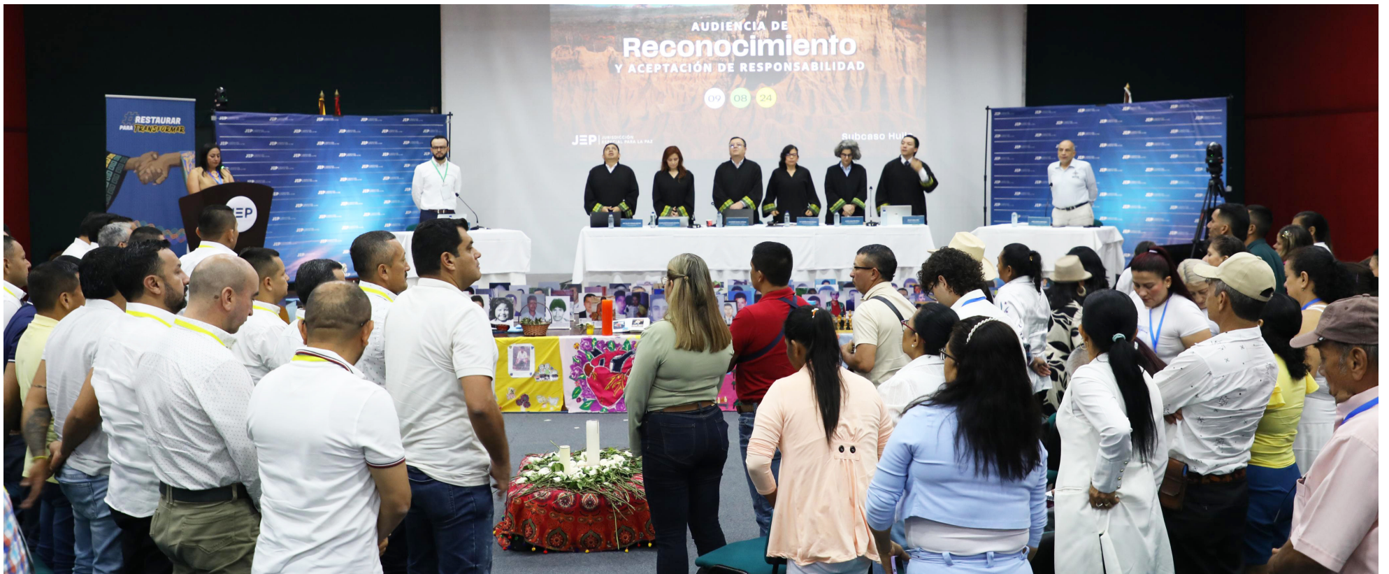
Los comaprecientes de la fuerza pública tendrán apoyos económicos y sociales.

■ La Resolución 1578 de 2024, emitida por la ARN el pasado 28 de junio, establece los beneficios y el proceso de acompañamiento que tendrán los exmilitares comparecientes ante la Jurisdicción Especial para la Paz.