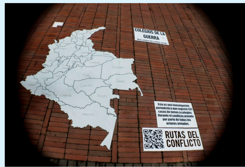
COLEGIOS DE LA GUERRA Esta es una investigación periodística que registra 231 casos de niños y jóvenes durante el conflicto armado por parte de todos los actores armados. RUTAS DEL CONFLICTO

El Consejo Noruego para Refugiados (NRC) entregó su más reciente reporte sobre el número de colombianos que vive en zonas donde tienen influencia grupos armados y aseguró que este aumentó en un 70% desde 2021.