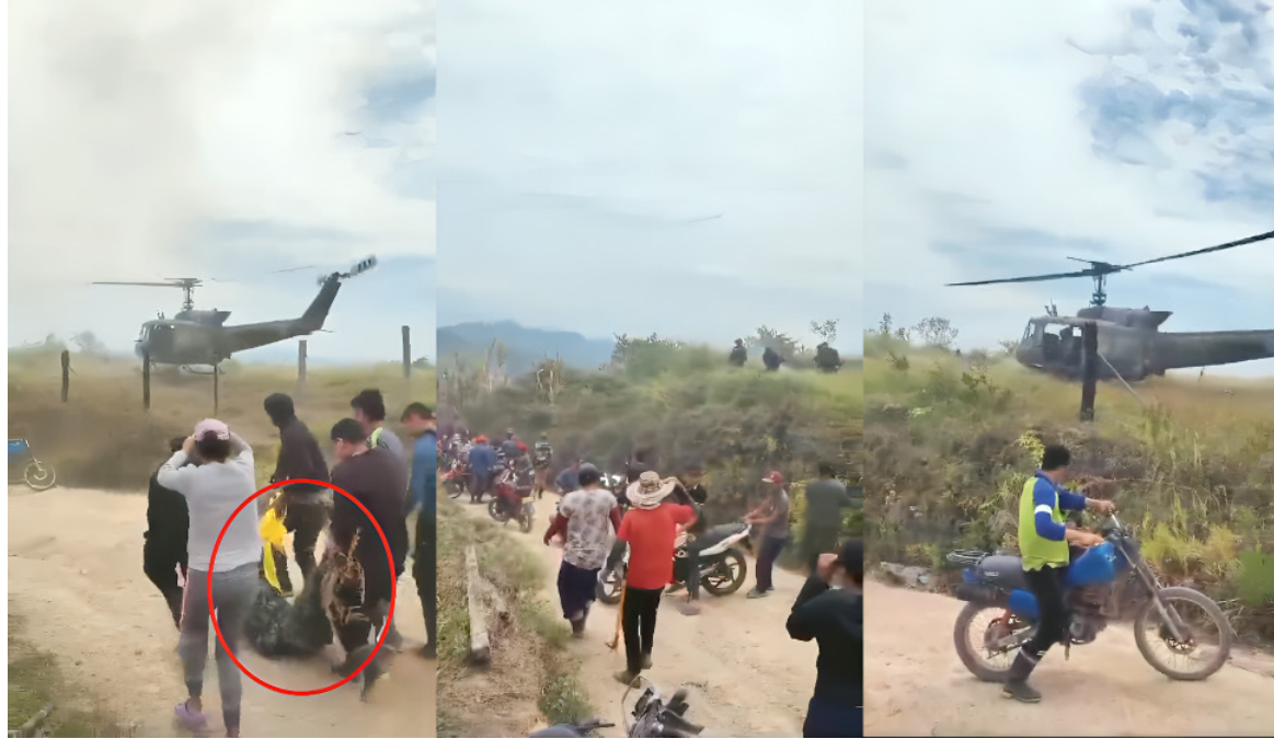
Momentos en los que llevaban el cuerpo del disidente.