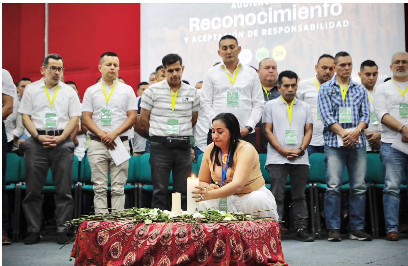
Se espera que con este proceso de acompañamiento puedan reintegrarse a la sociedad plenamente.

En cuanto a la orientación jurídica, la Resolución delinea mecanismos cruciales para facilitar la integración jurídica y socioeconómica de los miembros de la Fuerza Pública en el Proceso de Acompañamiento. El artículo 33, en particular, establece que la ARN brindará orientación jurídica a los beneficiarios desde su ingreso hasta la finalización del proceso. Esto incluye información sobre la competencia de la ARN en el contexto de la JEP según la Ley 2294 de 2023, y la inducción al Programa Permanente de Inducción de la JEP, liderado por el Sistema Autónomo de Asesoría y Defensa - SAAD. Además, se proporciona información sobre derechos fundamentales, mecanismos para su protección, y los deberes ciudadanos dentro del régimen legal y constitucional. No obstante, la ARN no ofrecerá defensa técnica ni representación en procesos judiciales o administrativos, limitando su rol a la orientación y no a la representación legal directa.