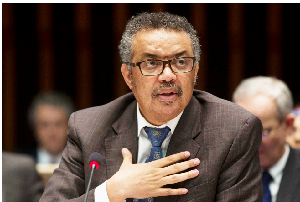
El director general de la Organización Mundial de la Salud (OMS), Tedros Adhanom Ghebreyesus.

esta declaración siguiendo el consejo de un Comité de Emergencias del RSI, compuesto por expertos independientes que se ha reunido a primera hora del día para examinar los datos presentados por expertos de la OMS y de los países afectados. El Comité ha informado al Director General, que considera que el recrudecimiento de la mpox, es una ESPII con potencial para extenderse aún más por los países de África y posiblemente fuera del continente.