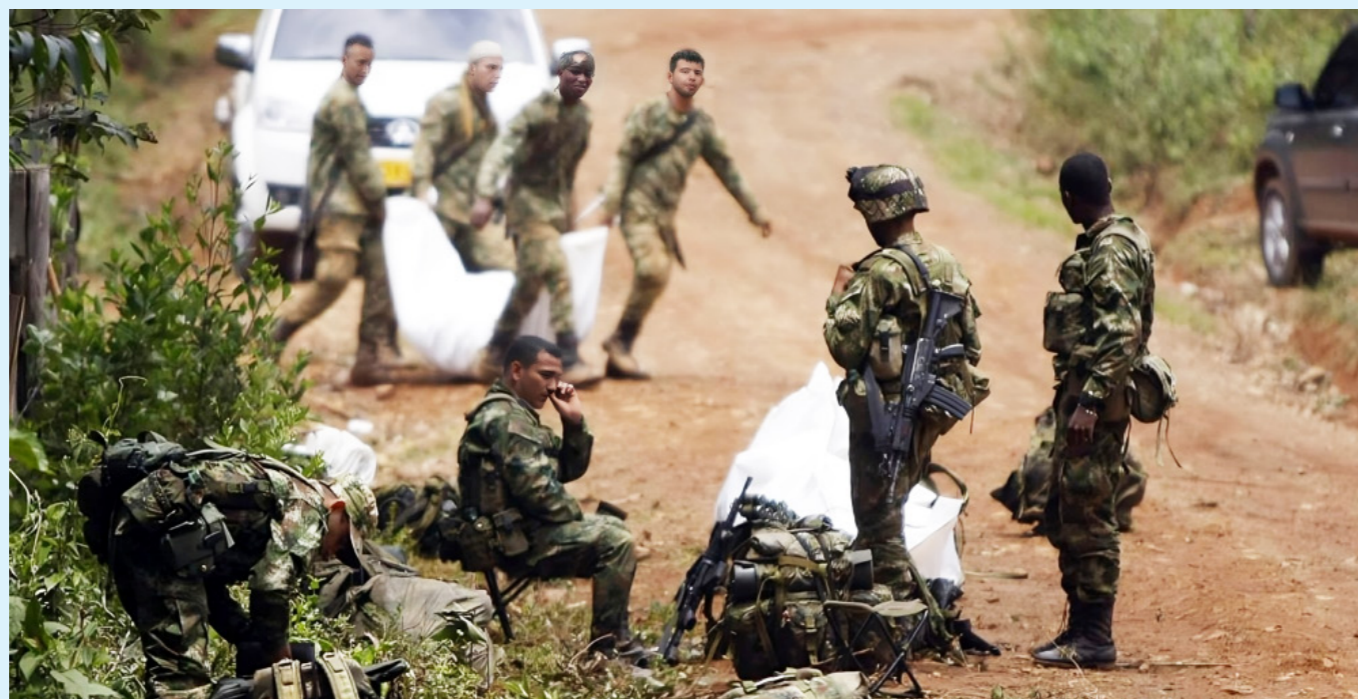
Guerrilleros de la disidencia de las Farc y otros grupos armados afectan a la población colombiana.

Los grupos armados presentes en las zonas rurales utilizan una serie de tácticas para imponerse y controlar la vida de los habitantes de estas zonas. Entre ellas, les impiden a la población salir de sus comunidades, una situación conocida como "confinamiento".