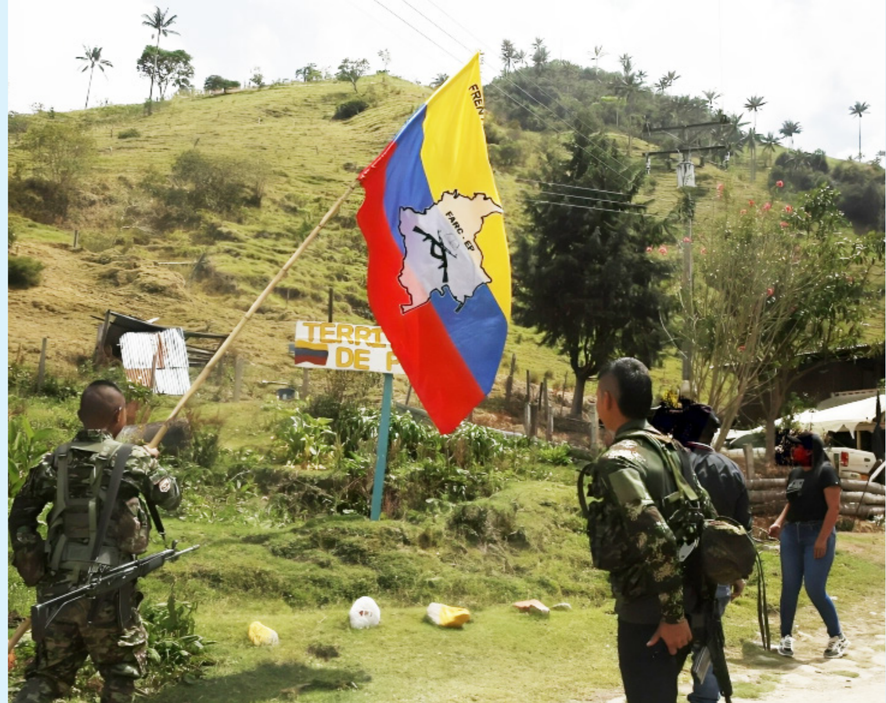
Hay territorios abandonados que requieren presencia de la fuerza pública.

En sus declaraciones, Egeland expresó su profunda preocupación por la situación, señalando que la esperanza de paz, que fue tan intensa hace una década durante su última visita a Colombia, se está desvaneciendo rápidamente, especialmente en las zonas rurales del país.