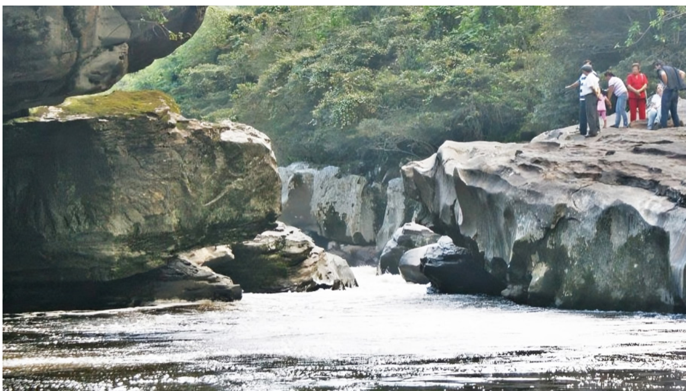
Estrecho del Magdalena.

Ya en cuanto a quienes harán parte de este recorrido, el funcionario extendió la invitación a todos los colombianos, a los medios de comunicación para que hagan parte de ella. Y Cormagdalena, tiene un grupo de jóvenes llamados los vigías del río,