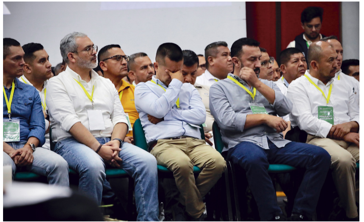
En el caso por los falsos positivos en el Huila hubo más de 70 exmilitares comparecientes.

La Resolución plantea enfoques diferenciales en el acompañamiento, permitiendo que este se adecue a las necesidades de los comparecientes de la fuerza pública y al contexto que los envuelve.