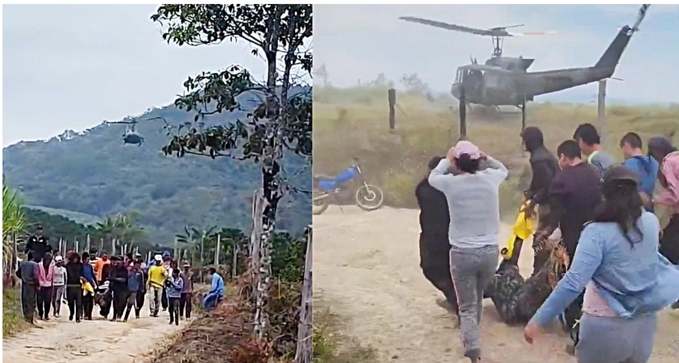
Los soldados trataron de recuperar el cuerpo en vano.

El Ejército se vio en la difícil situación de tener que detener sus acciones para evitar un enfrentamiento directo con los civiles manipulados por los disidentes. Según las autoridades, esta es una táctica recurrente de los grupos armados, quienes instrumentalizan a las comunidades vulnerables para proteger sus intereses y evitar que las Fuerzas Armadas continúen con sus operativos. La intervención de la población civil en estas acciones genera un escenario complejo, donde los derechos humanos de los habitantes están en constante riesgo.