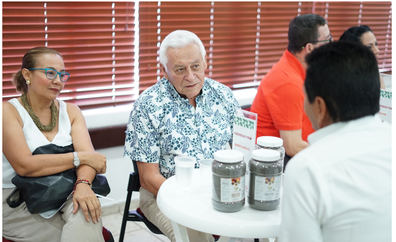
Según la presidenta de la Cámara de Comercio del Huila, es importante fortalecer las cadenas de comercialización.

Según el estudio de la Estimación del Potencial de Comerciantes 2023, realizado por la Cámara de Comercio, el tejido empresarial del departamento estuvo conformado por 39,885 unidades productivas, experimentando una reducción del 0.51% en comparación con el año anterior.