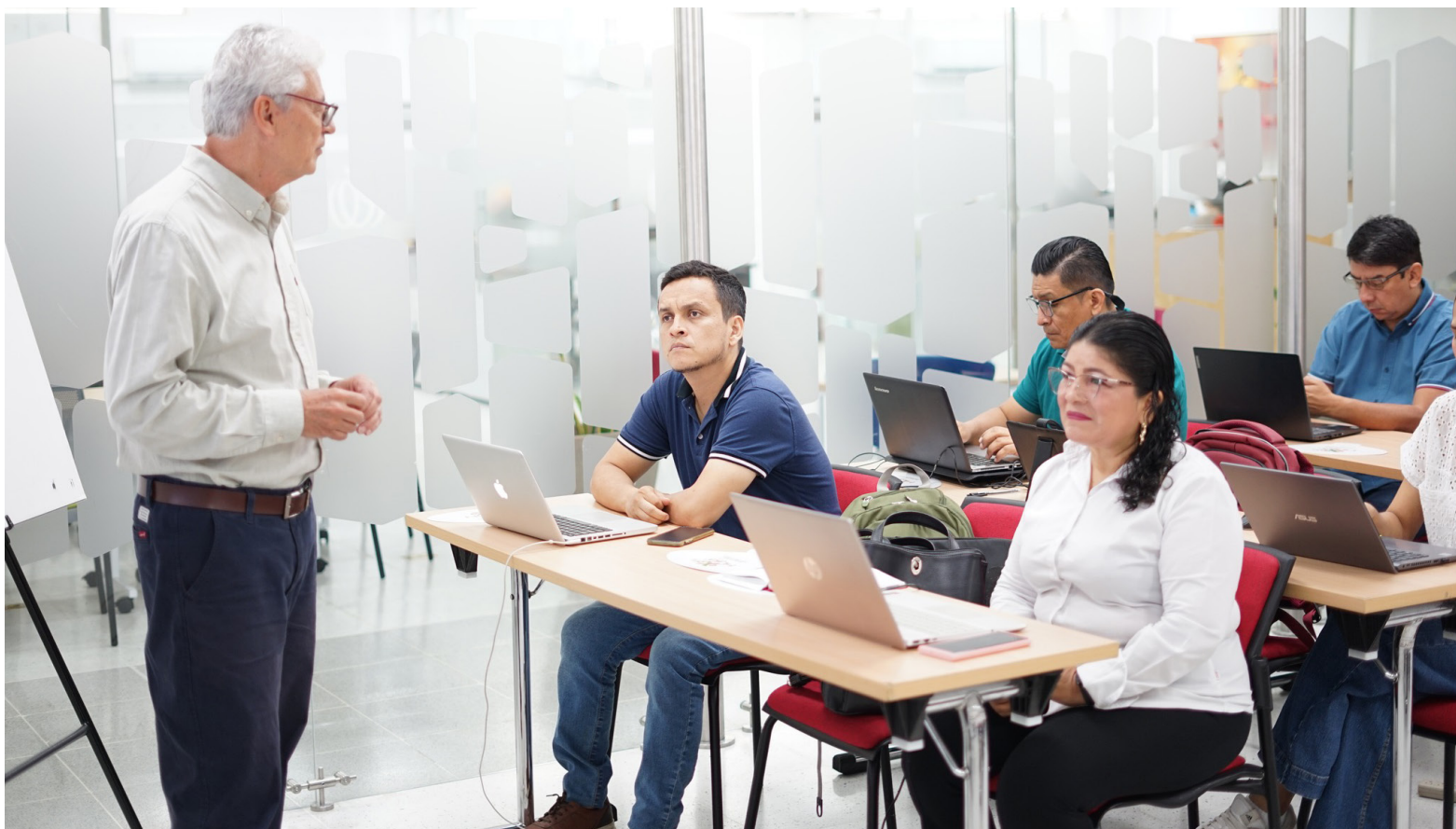
Uno de los sectores a fortalecer es el de los tenderos.

La mayoría de las empresas se ubicaban en la zona norte (57%), seguida por la zona sur (23.16%), el centro (12.66%) y el occidente (7.18%). La dinámica empresarial durante el año reflejó la coyuntura económica del país, afectada por altas tasas de interés, inflación y desaceleración de la inversión. En términos de constituciones, se crearon 7,607 unidades productivas, lo que significó una disminución del 10.20% respecto al año anterior. Este descenso se debió principalmente al comportamiento negativo en los sectores de comercio al por mayor y al por menor, actividades artísticas, de entretenimiento y recreación, y alojamiento y servicios de comida, con contribuciones negativas de 4.18 p.p., 2.16 p.p. y 1.55