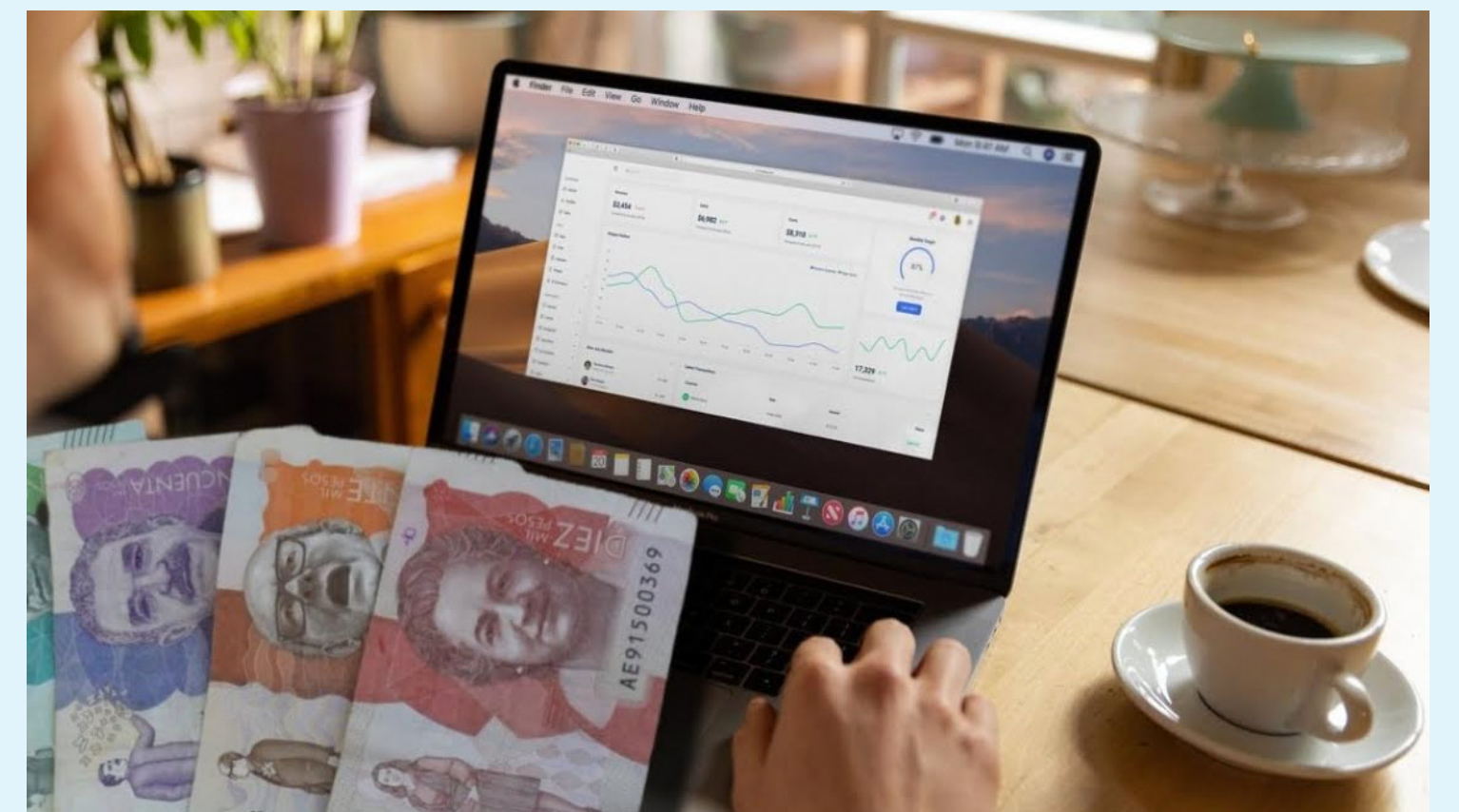
Las 46 horas semanales se podrán distribuir en máximo seis días a la semana