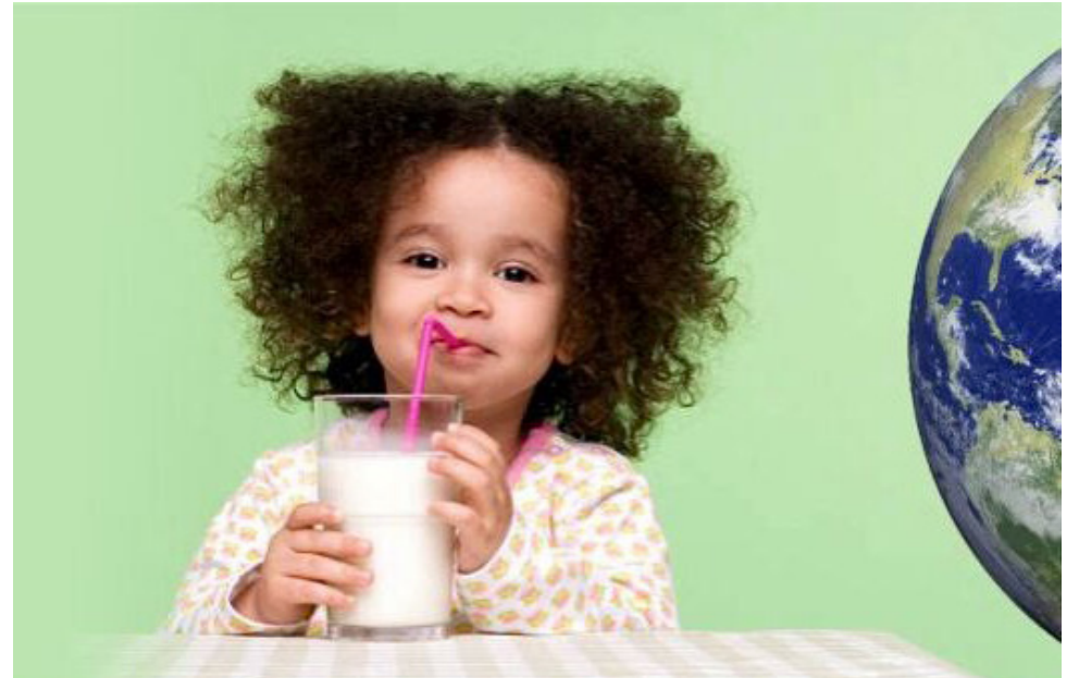
La invitación es a consumir leche y a suministrar estos productos a los niños.

La directora, señala que una de las estrategias, que tienen desde el sector lechero, es trabajar en la renegociación del TLC con Estados Unidos, que impacta de manera negativa a los productores del país. Otra de las tácticas es la construcción de plantas ‘pulverizadoras’ del lácteo”.