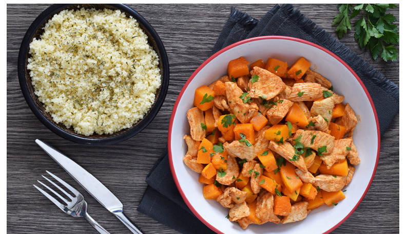
Entre algunos 'remedios caseros' a los que puede acudir para disminuir los síntomas está el jugo de salvia o aloe vera con miel al gusto.

SII al mejorar el equilibrio de la flora intestinal.