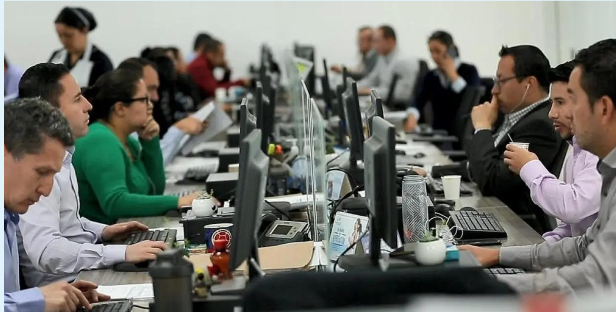
La iniciativa hace parte del Ministerio del Trabajo y bajo la ley 2101 del 15 de julio de 2021.

"La reducción de la jornada laboral en Colombia no afectará la remuneración ni las prestaciones sociales de los trabajadores, alineando al país con los estándares internacionales y mejorando la productividad empresarial", afirmó el Ministerio de Trabajo.