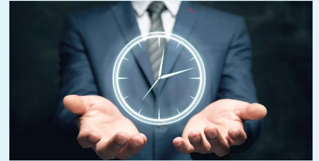
La reducción de jornada no implica una disminución salarial, indicó el Ministerio del Trabajo.

En el contexto de la OCDE, Colombia ha sido uno de los países con las jornadas laborales más largas y, paradójicamente, uno de los más improproductivos. La implementación de esta ley busca cambiar esa realidad, ali-