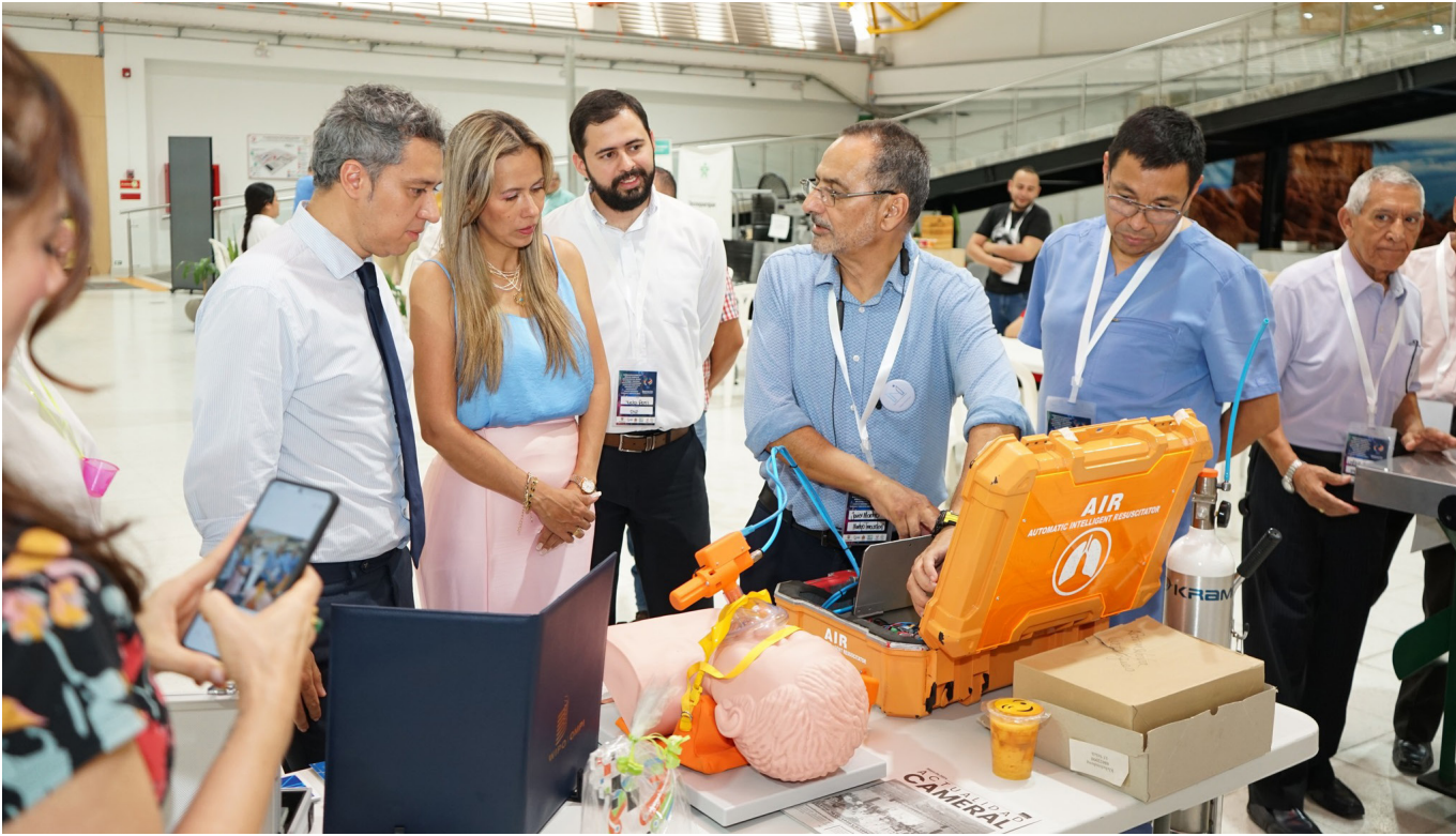
Las ruedas de negocio buscan que las empresas generen alianzas entre ellas en el departamento.