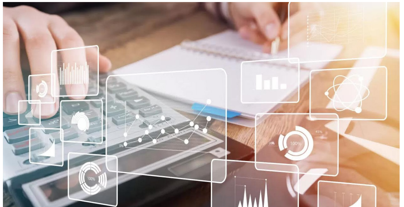
La Superintendencia de Sociedades se pronuncia sobre la posibilidad de compensar el valor negativo de los ajustes por adopción de las NCIF con utilidades acumuladas al 31 de diciembre de 2023.

Las opiniones son responsabilidad de los socios de Araque Asociados Consultores Tributarios y Legales. Nos basamos en el entendimiento de las normas vigentes y en el conocimiento del derecho tributario, y puede no ser compartido por las autoridades tributarias. Consúltenos en www.araqueasociados.com Preguntas y sugerencias en el correo: contacto@araqueasociados.com . Atención personalizada: Carrera 5 No. 14-32 oficinas 5, 7 y 8 Pasaje de la Quinta de Neiva, Huila, teléfonos 321 452 3315