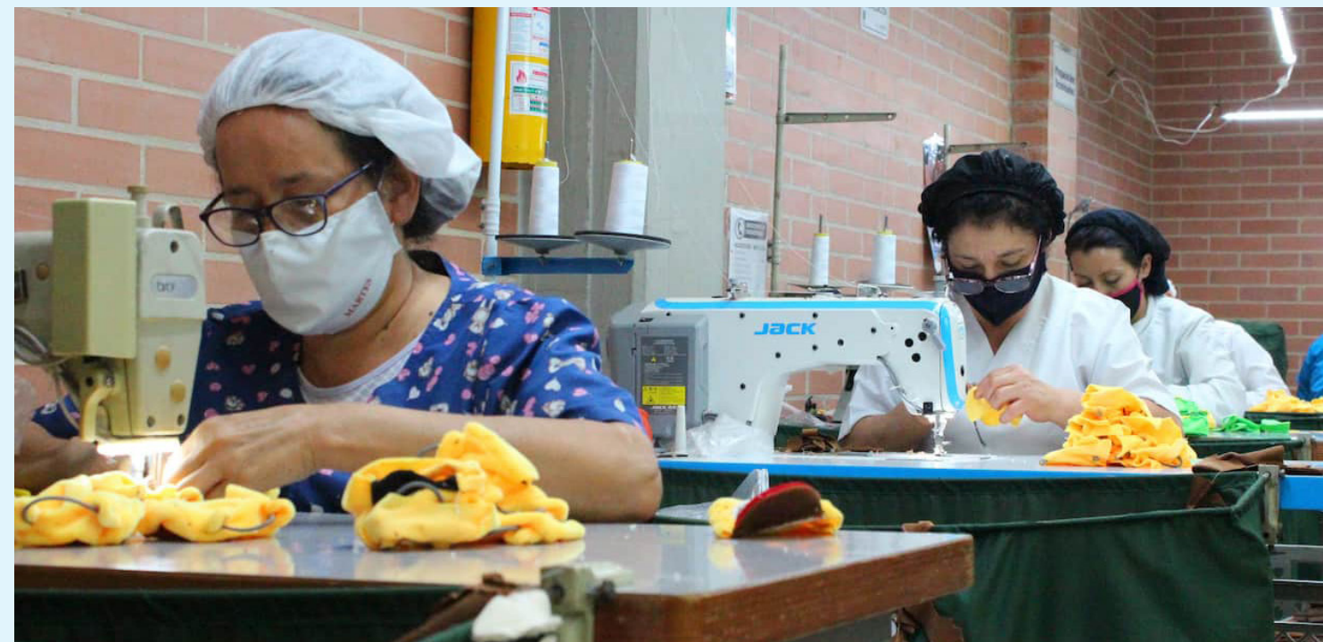
De acuerdo con el Ministerio del Trabajo, la decisión está cobijada por la ley 2101 del 15 de julio de 2021.

La reducción de la jornada laboral en Colombia representa un paso significativo hacia la mejora de las condiciones laborales y la productividad. Sin embargo, su éxito dependerá de la cooperación entre empleadores, empleados, y las entidades reguladoras. La gradualidad de la medida, junto con la flexibilidad en su implementación, busca asegurar una transición suave que beneficie a todas las partes involucradas. La vigilancia y el cumplimiento serán esenciales para que los beneficios de esta reforma se materialicen plenamente, haciendo de Colombia un país más competitivo y justo en el ámbito laboral.