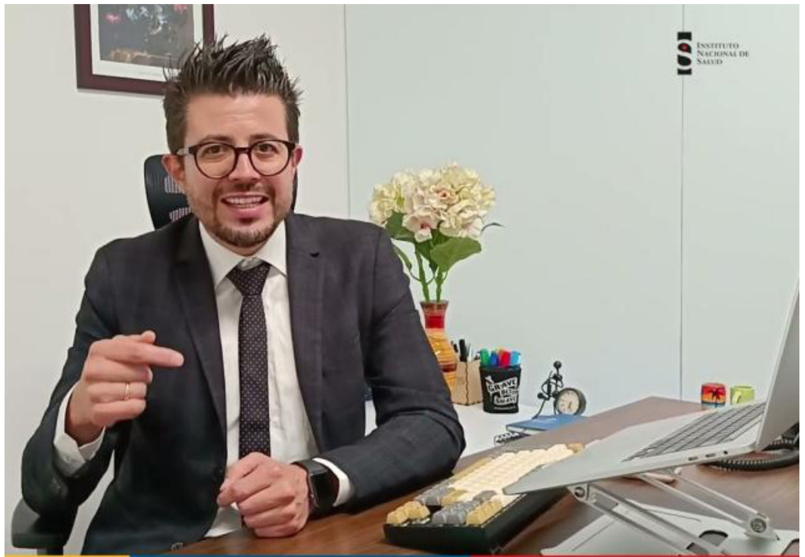
Carlos Castañeda Orjuela, director del Instituto Nacional de Salud.

"Y que la institucionalidad, actuemos de manera ágil, para empoderarla y brindarle el acompañamiento no solo emocional, ni psicológico, sino de alternativas ocupacionales y de emprendimiento, porque la dependencia económica, hace que ellas desistan de denunciar", resaltó la funcionaria.