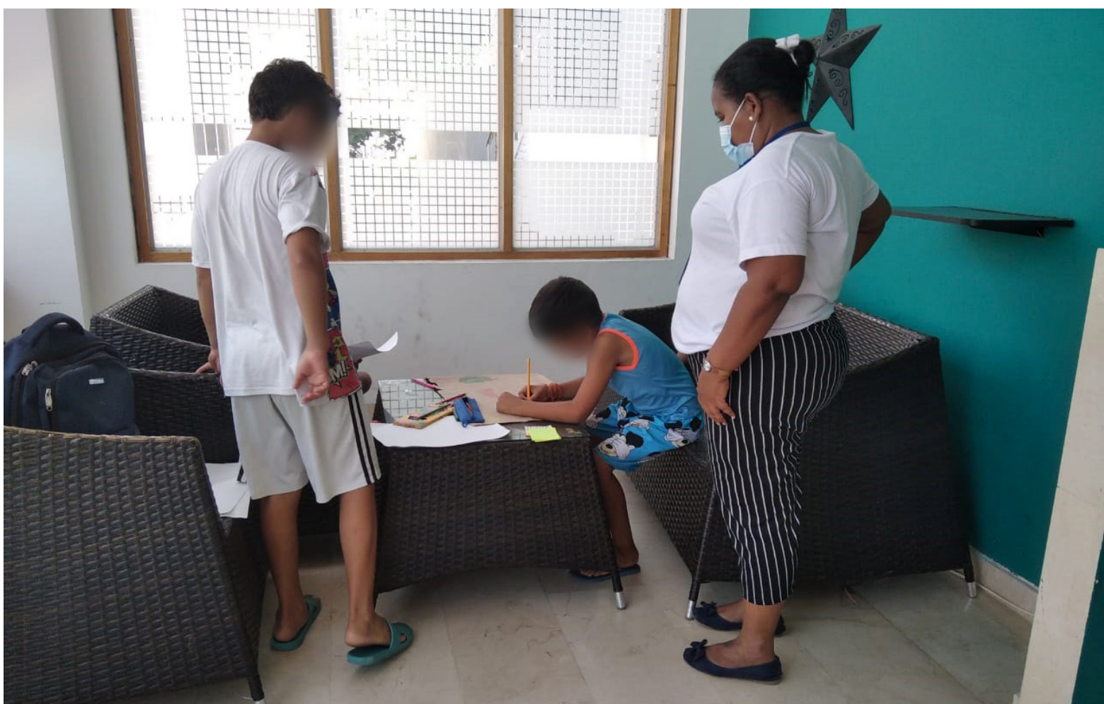
Neiva, no cuenta con una 'Casa Refugio'.