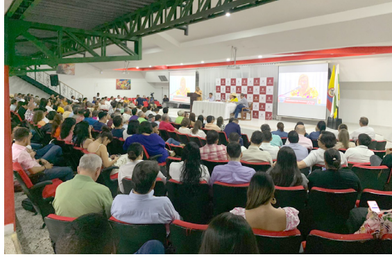
¿Volverá el tren al Huila?