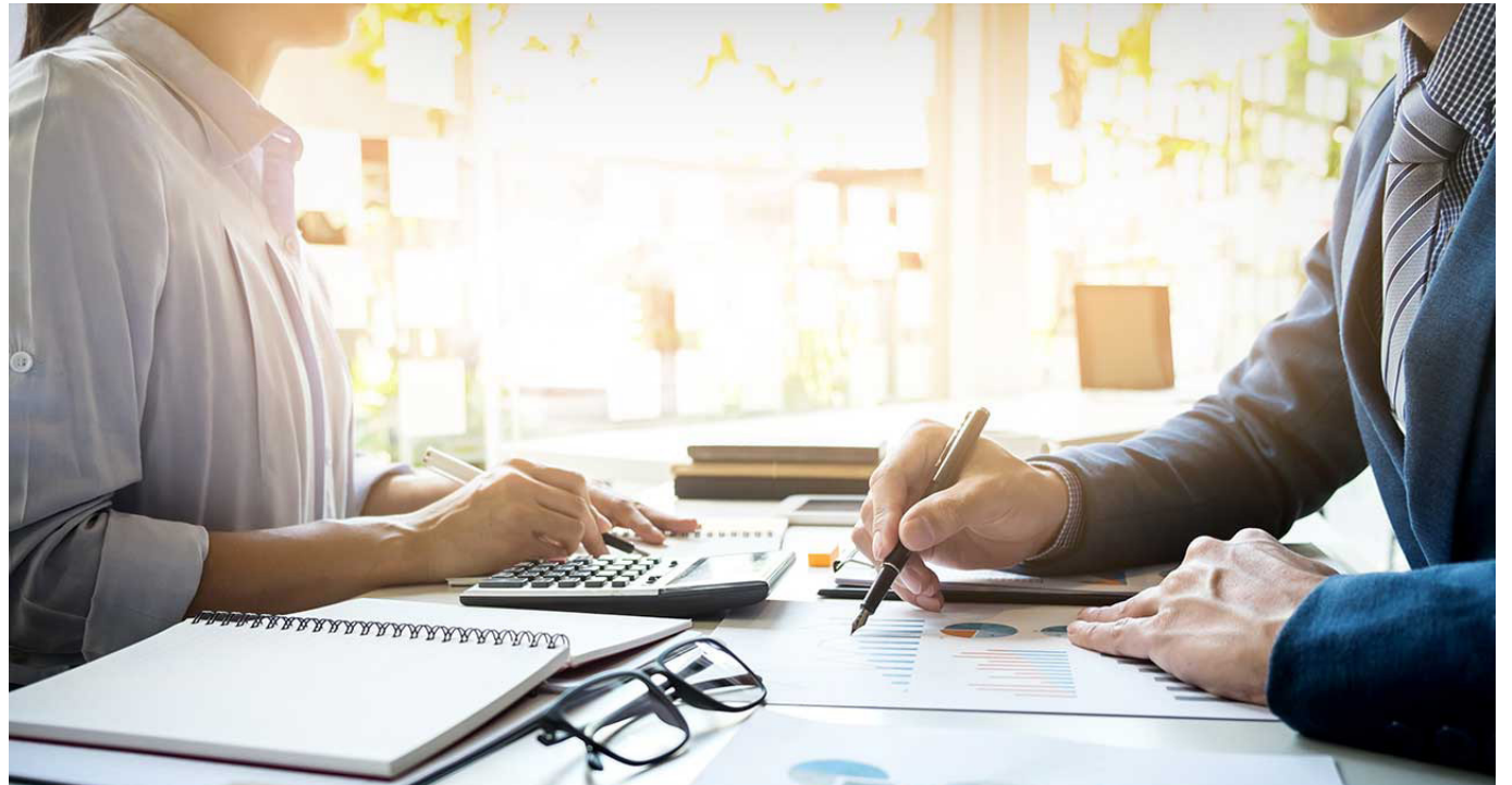
Sabía usted que se vuelve a implantar la retención fuente de la seguridad social por parte de los empleadores o contratantes por prestación de servicios.

En todos los contratos de mandato, la DIAN establece que las facturas deben ser expedidas por el mandatario. Además, cualquier adquisición realizada en cumplimiento del mandato debe estar facturada a nombre del mandatario, quien debe certificar al mandante los costos y gastos para la declaración de renta y el IVA descontable.