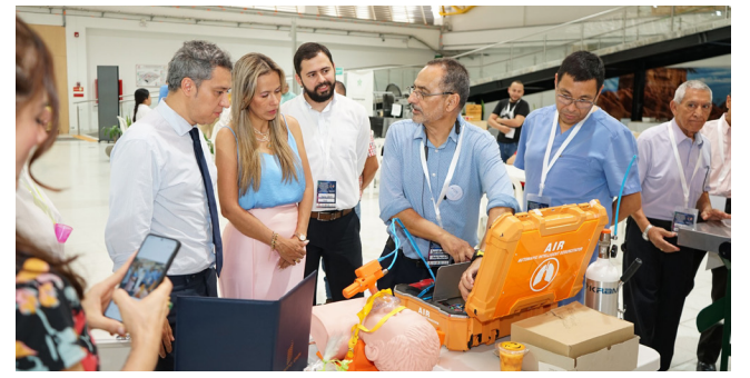
'Es fundamental fortalecer la comercialización'