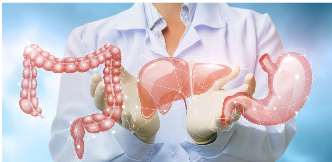
La Helicobacter Pylori es una de las bacterias que afectan el estómago, uno de los órganos principales del ser humano. Causa, principalmente, enfermedades consideradas de alguna manera 'cotidianas' como la gastritis, la úlcera y la irritación del colon.

Además, se están desarrollando terapias innovadoras como la estimulación eléctrica del nervio vago y los trasplantes fecales, aunque aún se encuentran en etapas experimentales.