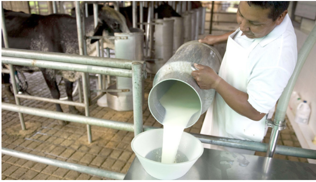
Lecheros opitas afectados con el TLC