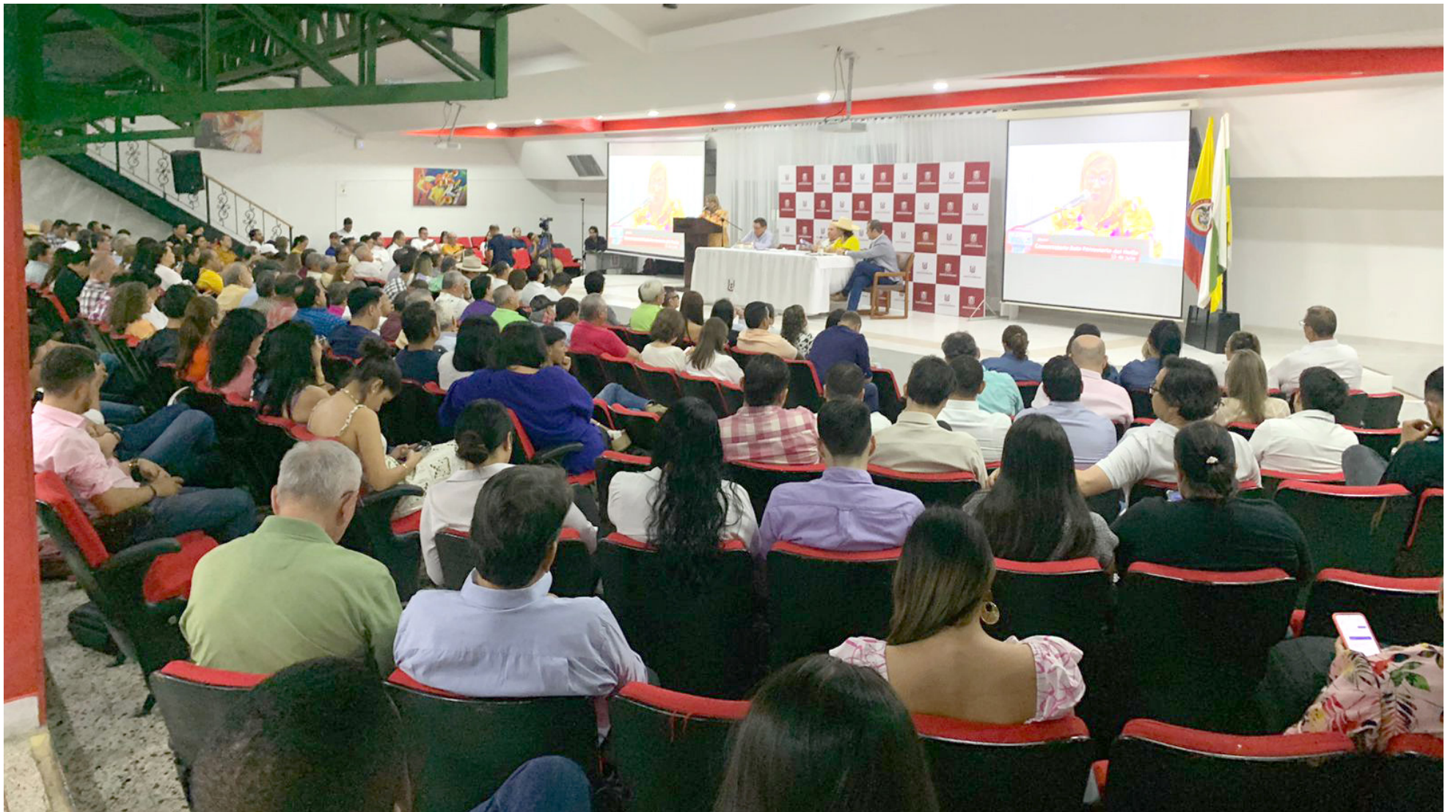
El conversatorio se desarrolló en el auditorio Olga Tony Vidales con la participación del gobierno nacional, la academia, el gobierno departamental y los sectores empresarial y financiero.