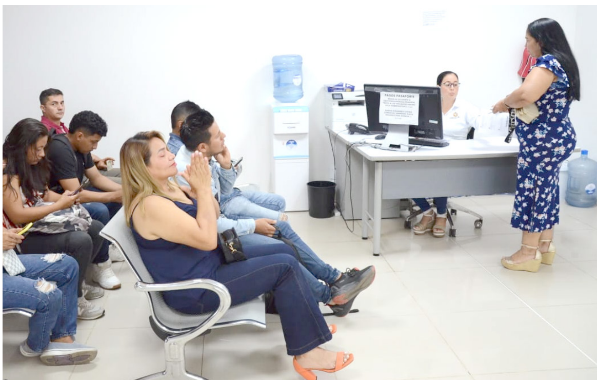
La funcionaria recordó que el diligenciamiento del pasaporte es de manera fácil, ordenada y segura, a través de la plataforma de la Gobernación del Huila.