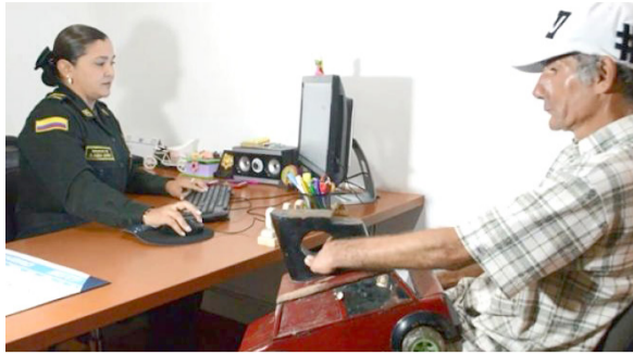
70 casos mensuales reciben los Centros de Conciliación