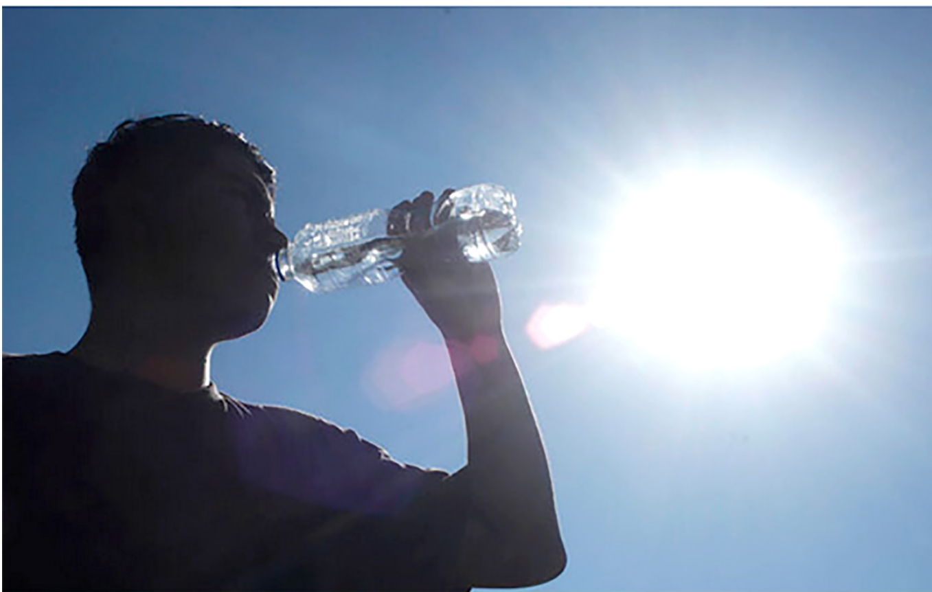
Los municipios del norte del departamento, son los que se verían más afectados por la 'ola' de calor.

Y ante la posibilidad de escasez del agua, la funcionaria recalzó: “por eso son importantes, los planes de contingencia de las empresas de servicio público en los municipios, también para proteger a la población y poder atender rápidamente una situación de emergencia, derivada de la temporada seca, propia