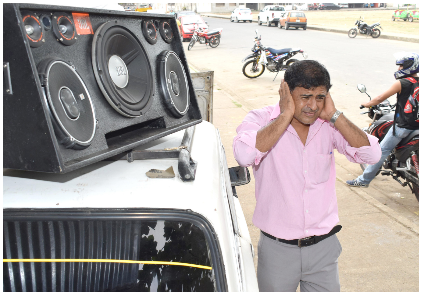
Uno de los conflictos recurrentes entre vecinos, se da por exceso de ruido.