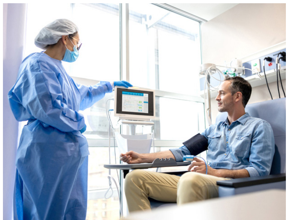
Estos avances tecnológicos representan un cambio significativo en la atención oncológica en Colombia.