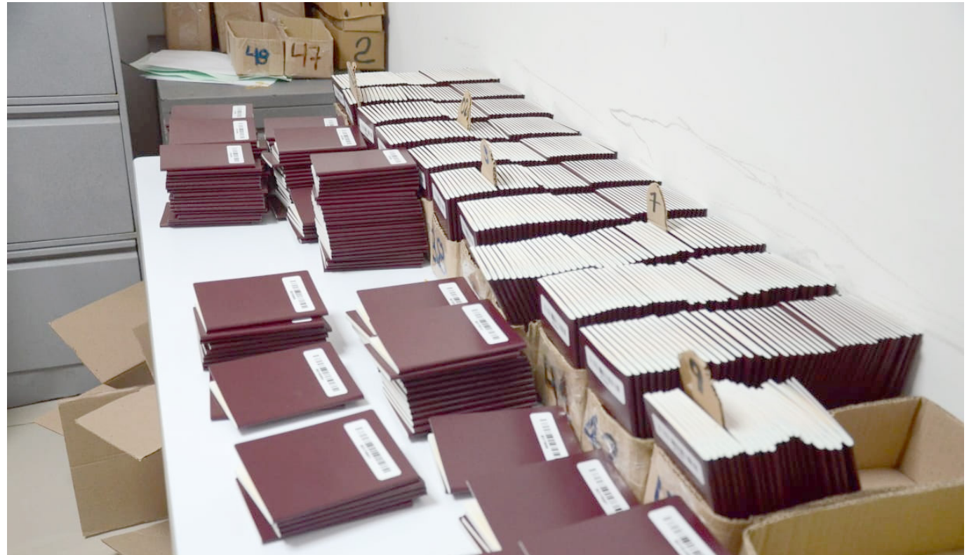
La Gobernación del Huila hace el llamado a los ciudadanos que solicitaron el documento, a reclamarlo con urgencia.

Un llamado de urgencia a la comunidad realizó la Gobernación del Huila a través de la Secretaría General, debido al riesgo que existe de perderse 2.500 pasaportes que han sido diligenciados por personas interesadas en salir del país.