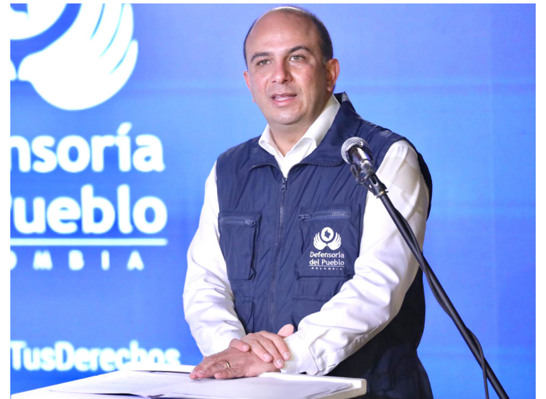
El Defensor del Pueblo, Carlos Camargo Assis.

La Defensoría del Pueblo reitera a la 'Ciprunna' la urgencia de implementar efectivamente la Línea de Política Pública de Prevención del Reclutamiento, Uso, Utilización y Violencia Sexual de Niños, Niñas y Adolescentes. Asimismo, hace un llamado a las institucio-