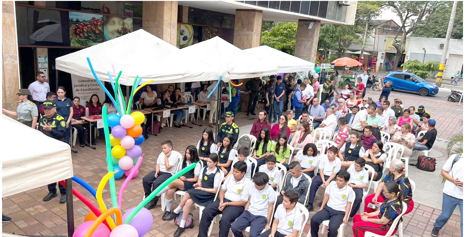
Socialización de los Centros de Conciliación.

Por ejemplo, el no recoger el popo de los animales, esta conducta es multada, según el artículo 124 del Código de Policía (CP), implica una sanción de cuatro salarios mínimos diarios, tipificada como infracción tipo 1: "Omitir la recogida de los excrementos de