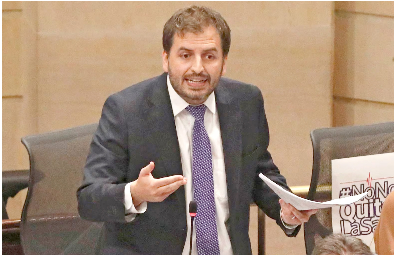
El congresista del Centro Democrático Andrés Forero.