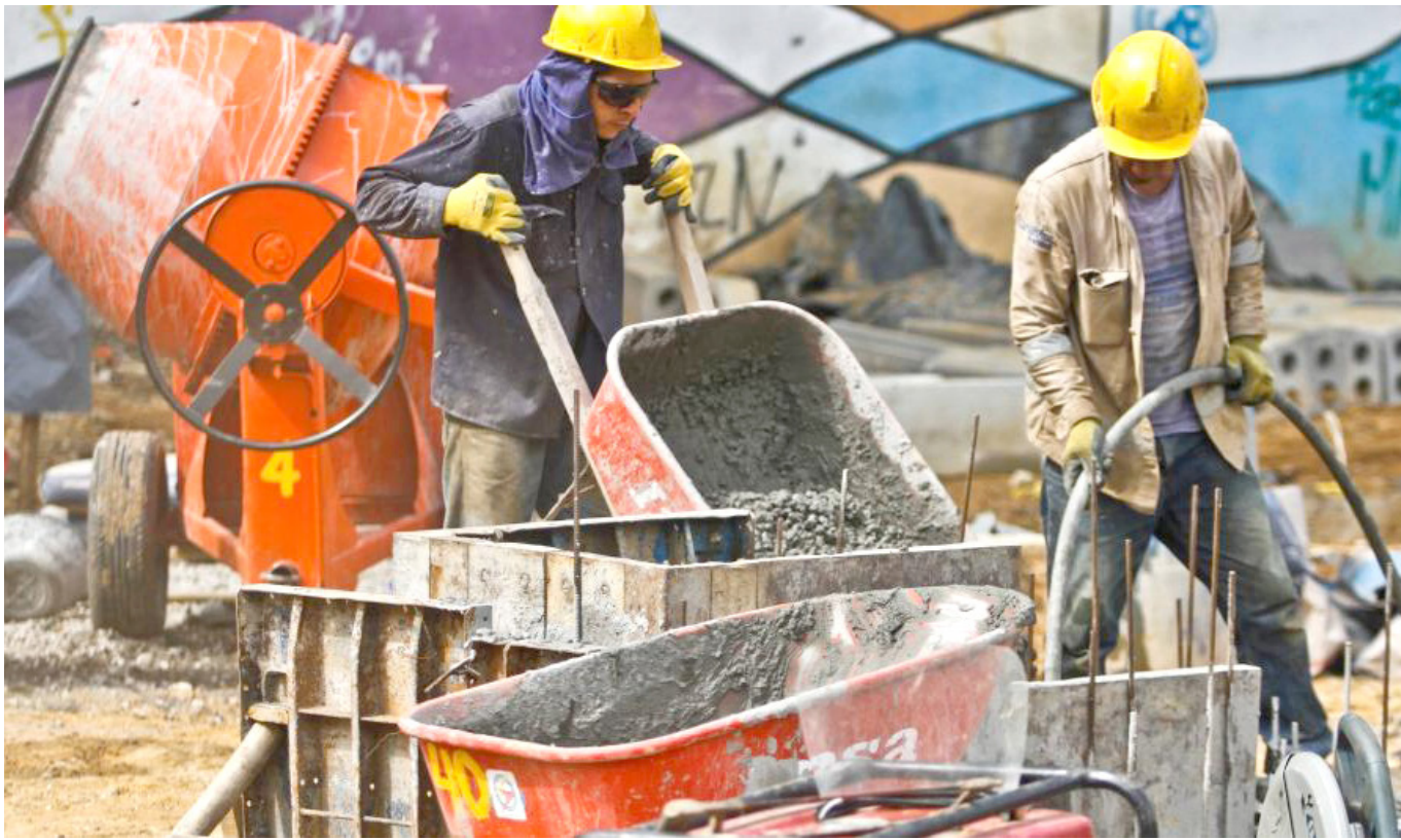
La construcción experimenta su peor desempeño desde 2020, con una caída del 8%, destacando la urgencia de medidas para reactivar obras civiles y vivienda.

En el comercio, la contracción del 3.5% refleja las señales de desaceleración que ya se observaban. Al analizar los datos, se destaca el bajo rendimiento de los subsectores de alojamiento y servicios de comida, así como los de transporte y almacenamiento, que presentan las mayores retracciones.