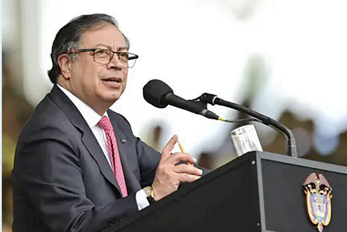
El presidente Gustavo Petro aseguró que es necesario que Colombia deje de mantener la regla fiscal.

En el mismo evento, solicitó a la Junta Di-