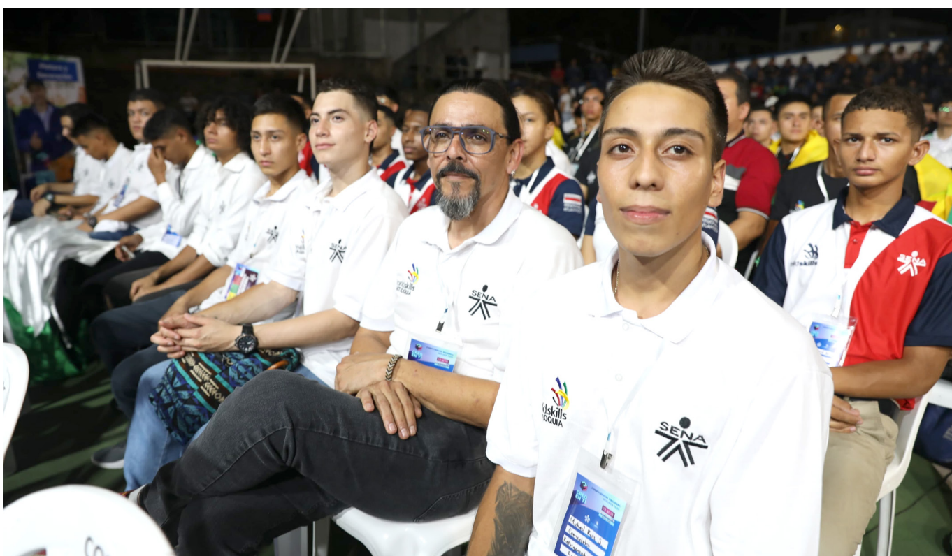
La ciudad se convierte en el epicentro de la excelencia técnica, mostrando al mundo que Colombia está lista para destacarse en las competiciones internacionales.

Estos jóvenes no solo buscan el reconocimiento nacional, sino que también aspiran a representar a Colombia en el escenario internacional de WorldSkills Américas en Brasil 2024.