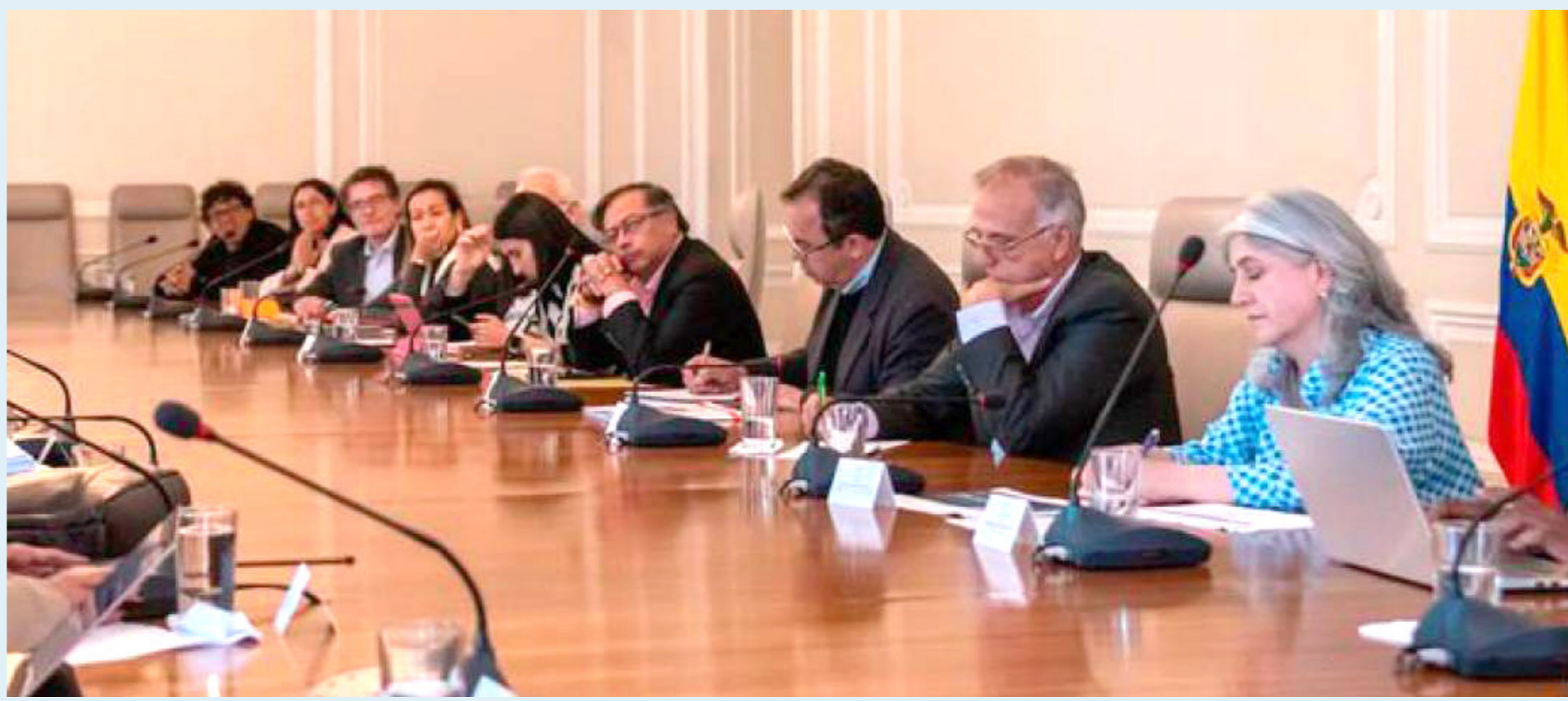
El presidente adujo que es necesario que crezca la inversión pública.