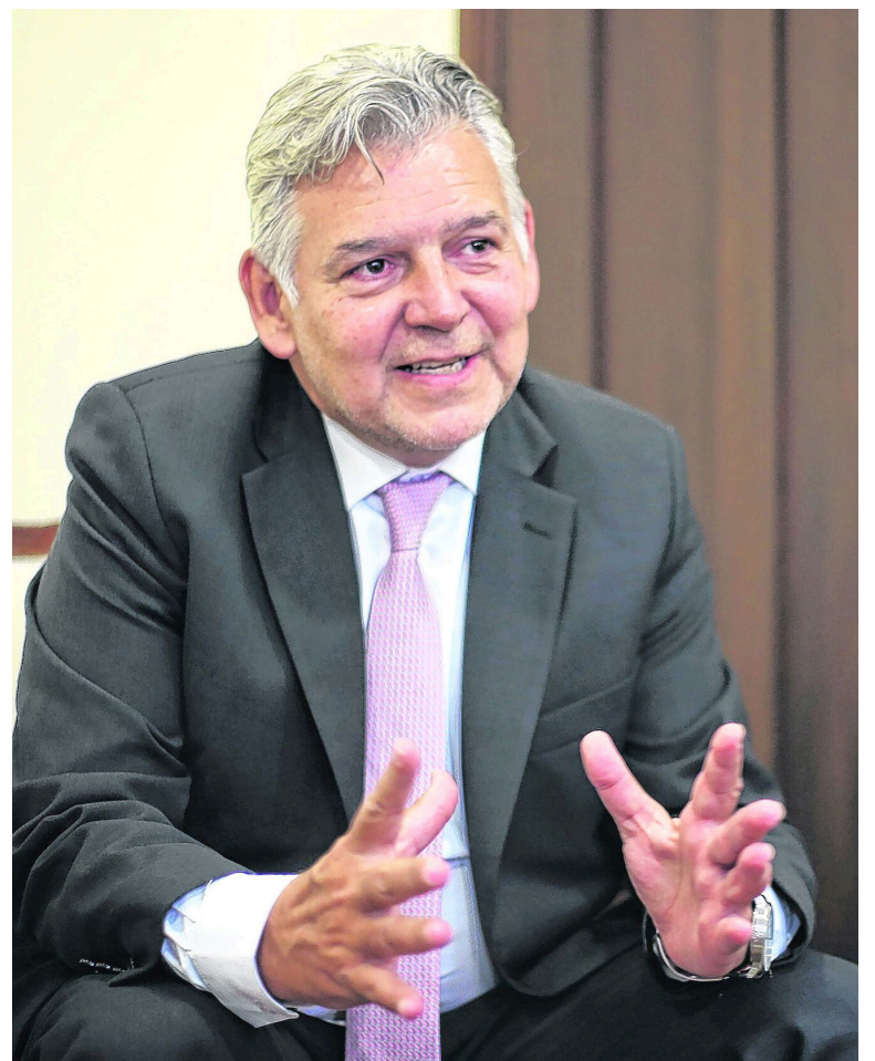
Jaime Alberto Cabal, presidente de Fenalco, advierte sobre la necesidad urgente de un “plan de choque” para evitar una recesión profunda, especialmente ante el impacto en el empleo y el PIB.

Al desglosar los datos del PIB industrial, se observa que los peores desempeños se registran en la fabricación de productos textiles, confección de prendas de vestir y calzado; junto con la fabricación de productos metalúrgicos básicos.