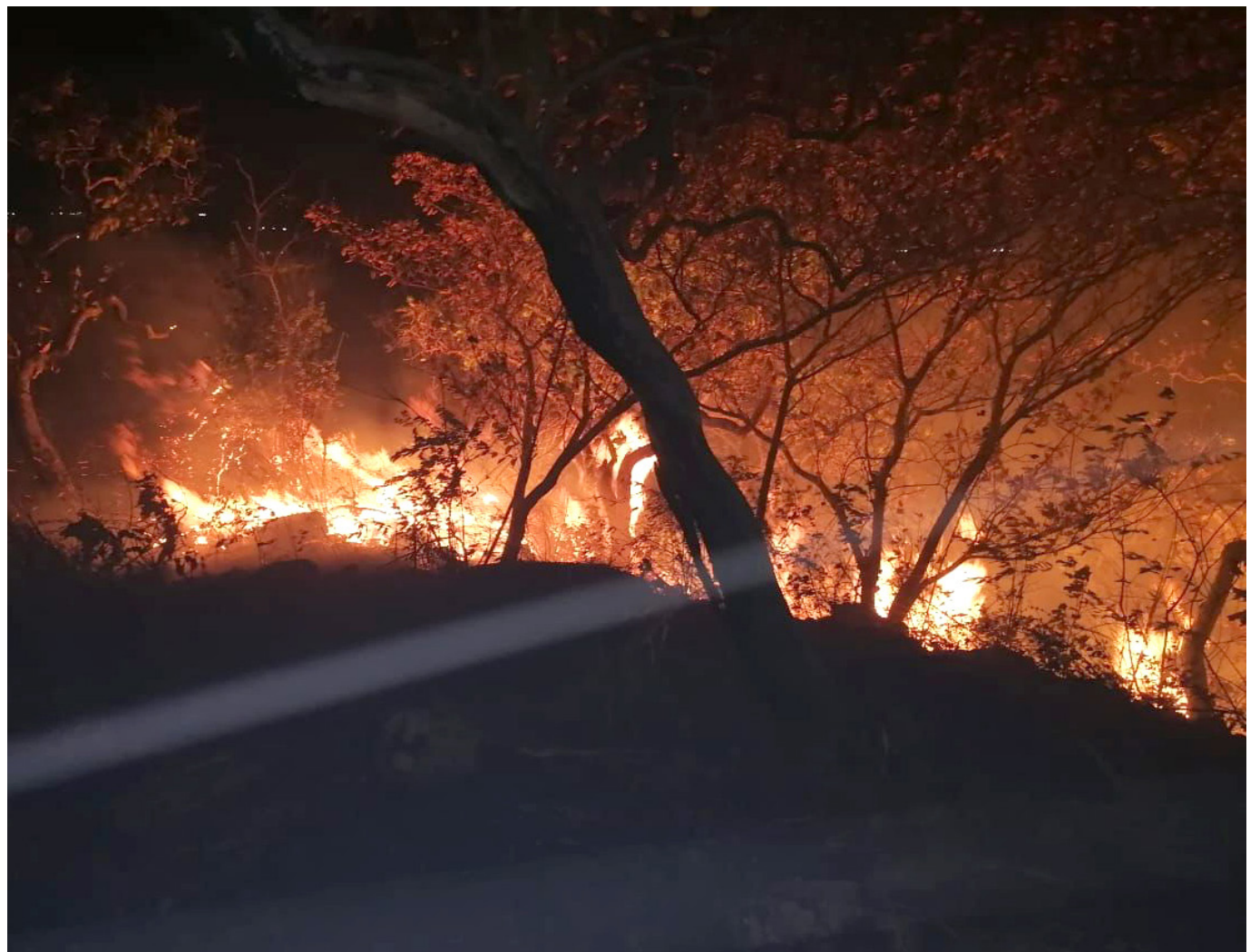
La Cam invita a denunciar a los pirómanos.

“Las lluvias son temporales y esta semana la tendencia a las altas temperaturas y a la disminución de las precipitaciones, por eso ya estamos sintiendo calor en el norte del departamento”, añadió la funcionaria.