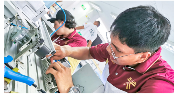
Arrancaron los WorldSkills Colombia