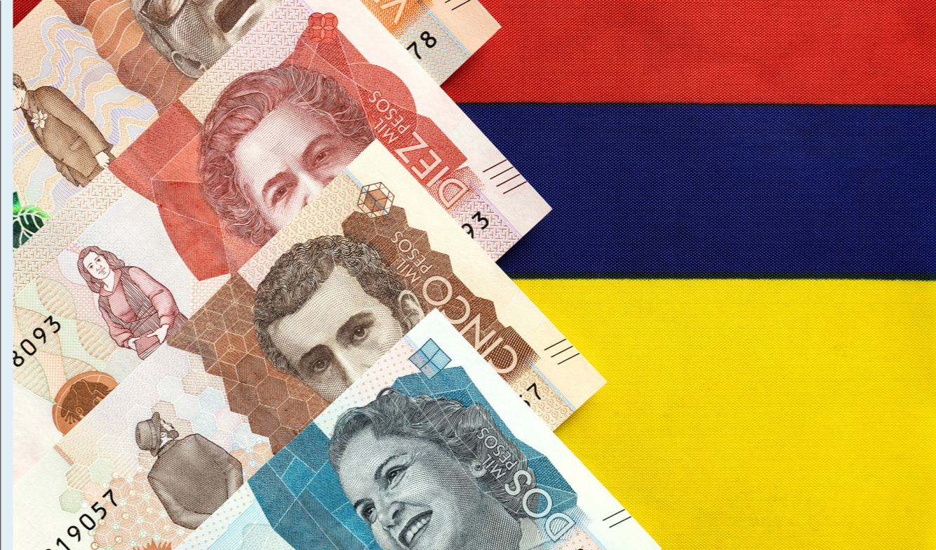
La tasa de interés y la tasa de interés real cada vez es mayor, porque en la medida en que baja la inflación.

Los cambios que sugiere el Gobierno nacional están relacionados con el reiterado planteamiento del presidente Petro de que las inversiones en materia de conservación ambiental, sean descontadas del pago de la deuda externa.