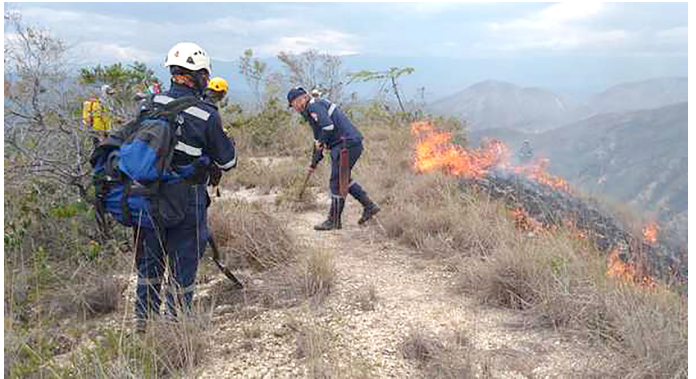
Los incendios han dejado 12.500 hectáreas afectadas.

“La CAM va a implementar una red automática en tiempo real de