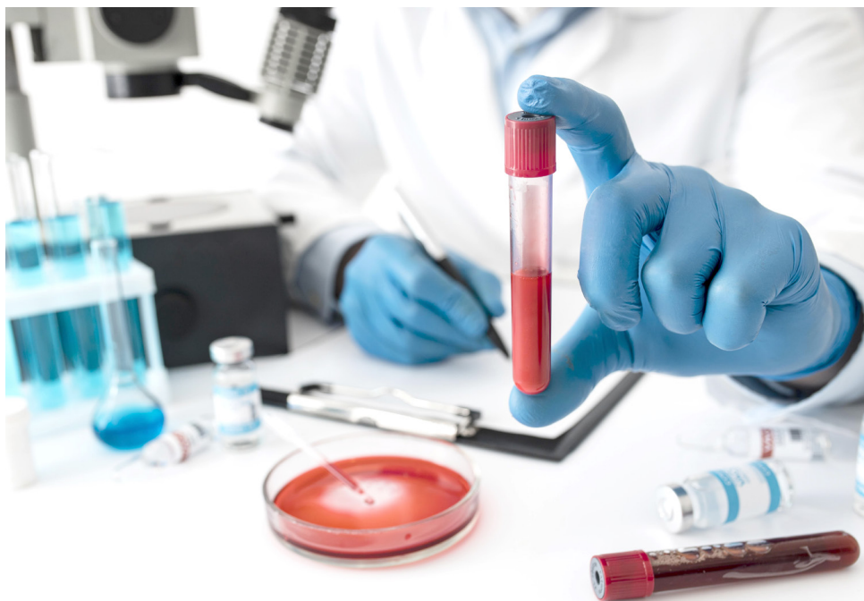
Este es uno de los cánceres más comunes en todo el mundo.

Estos avances tecnológicos representan un cambio significativo en la atención oncológica en Colombia y la región, ofreciendo tratamientos de radioterapia más precisos y personalizados, lo que se traduce en una mayor tasa de control del cáncer y una mejor calidad de vida para los pacientes.