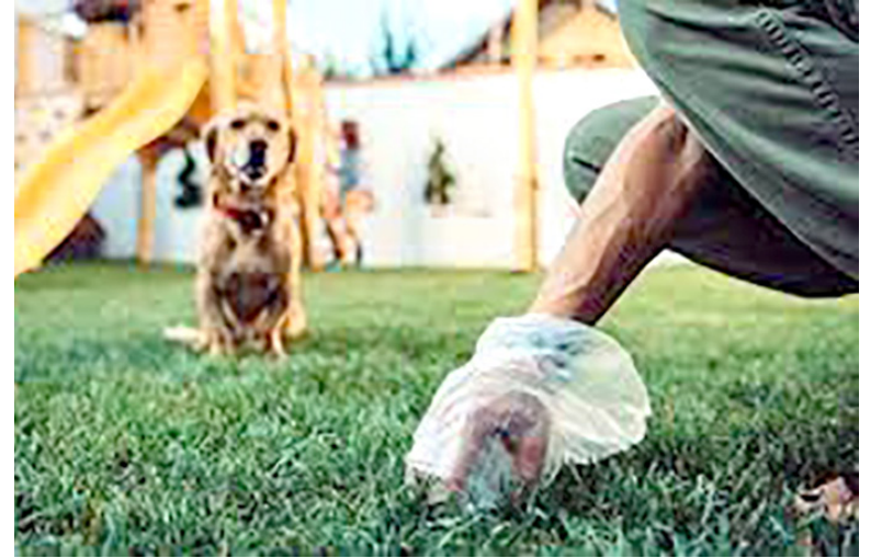
Otro aspecto que genera discordia es no recoger los excrementos de las mascotas.

De acuerdo con el docente: “lo peligroso es que cuando se entroniza (intolerancia) en una sociedad como práctica recurrente se empieza a vivir un fenómeno de normalización o naturalización de ese comportamiento”.