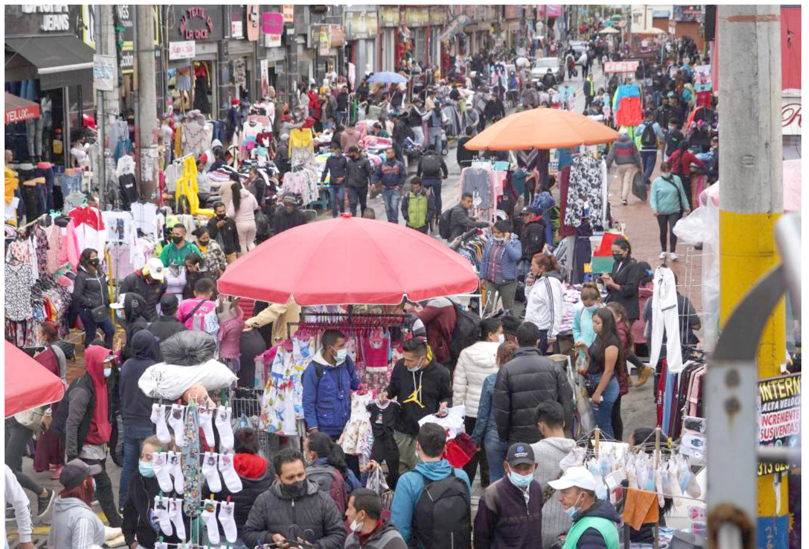
El estancamiento en el consumo y la alarmante caída del 33.5% en el sector de inversión plantean desafíos económicos significativos, exacerbados por reformas y tasas de interés elevadas.

Colombia, actualmente por debajo de países como México, China y Estados Unidos en términos de crecimiento económico, enfrenta un futuro incierto. La reducción en el consumo y la inversión plantea desafíos significativos, y la implementación de medidas efectivas se presenta como imperativa para revertir la tendencia negativa y promover la recuperación económica.