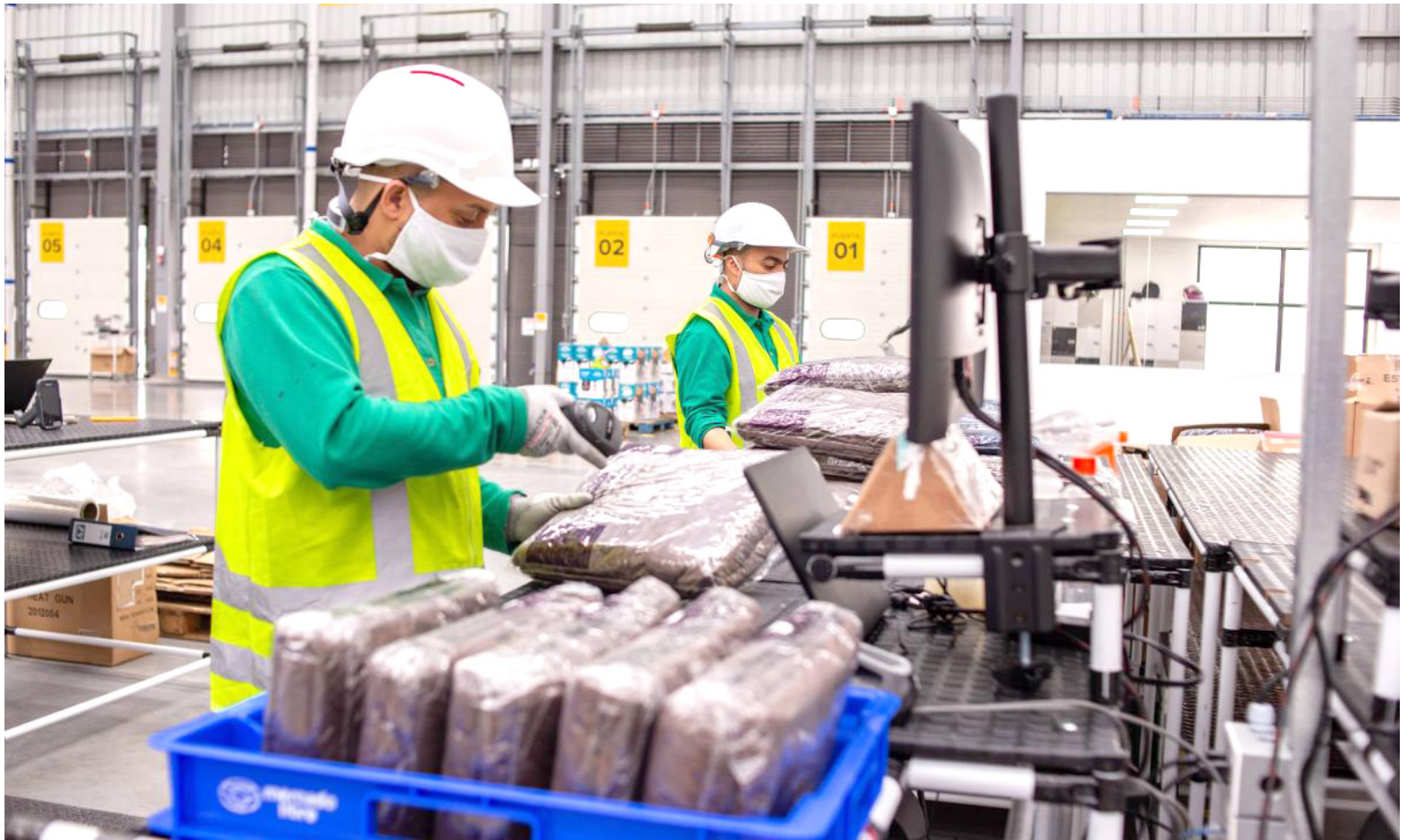
La industria, el comercio y la construcción, sectores clave de la economía colombiana, arrastran el PIB a una caída inesperada en el tercer trimestre.

La economía colombiana se sumerge en una sorprendente contracción en el tercer trimestre, desafiando las expectativas del gobierno, empresarios y académicos, según Fenalco.