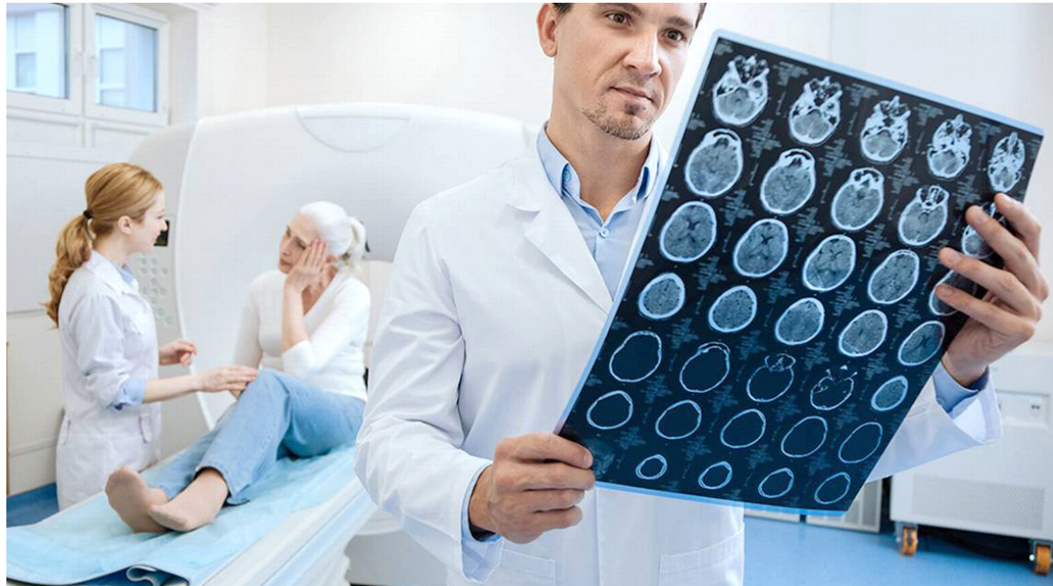
Para el año 2040, la Organización Mundial de la Salud, OMS, estima un incremento cercano al 40 por ciento en los casos de cáncer en todo el mundo.

En ese sentido, la tecnología resulta una aliada fundamental para contrarrestar el avance de este mal en el país. La Fundación Santafé de Bogotá, por ejemplo,