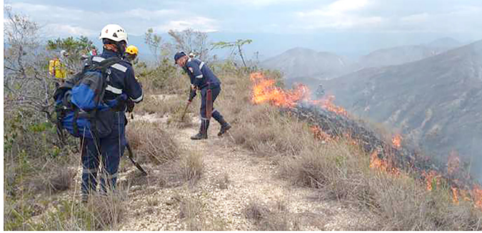
Fenómeno del Niño disminuye lluvias en el Huila