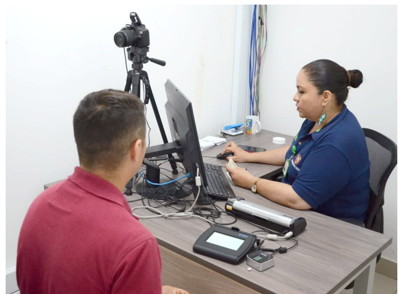
Se han dispuesto de horarios flexibles para reclamar los documentos pendientes.

Para facilitar el proceso de reclamo, se han establecido horarios flexibles. Los ciudadanos pueden acudir de 7:00 a.m. a 12:00 p.m. y de 2:00 p.m. a 4:30 p.m., donde se les entregará su pasaporte sin necesidad de hacer fila ni enfrentar retrasos.