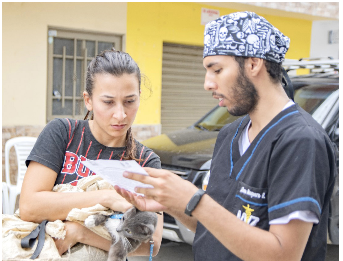
A través de las Brigadas de Salud Animal, más de 60 jornadas de atención se llevaron a cabo en diversos municipios.

Además, las brigadas de salud animal proporcionaron una valiosa experiencia para los estudiantes de últimos semestres de medicina veterinaria y zootecnia de la Universidad.