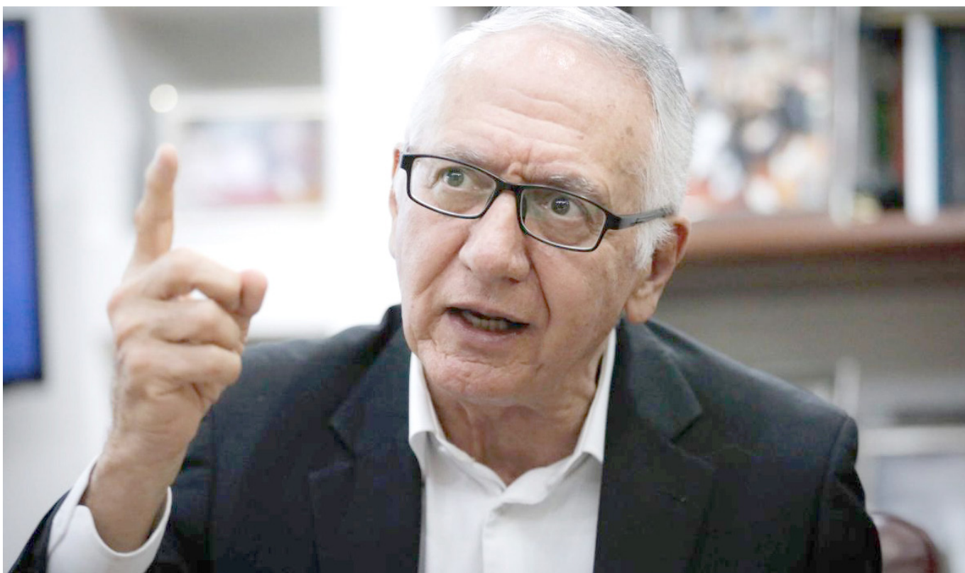
El ministro de Salud, Guillermo Alfonso Jaramillo.

“Invito a @CeDemocratico a algo más racional, vengan, nos tomamos un tinto y miramos cuál es su problema con la reforma de la salud que presentamos. Si hay puntos en común los presentamos a la fase de debate en el senado”, afirmó el jefe de Estado.