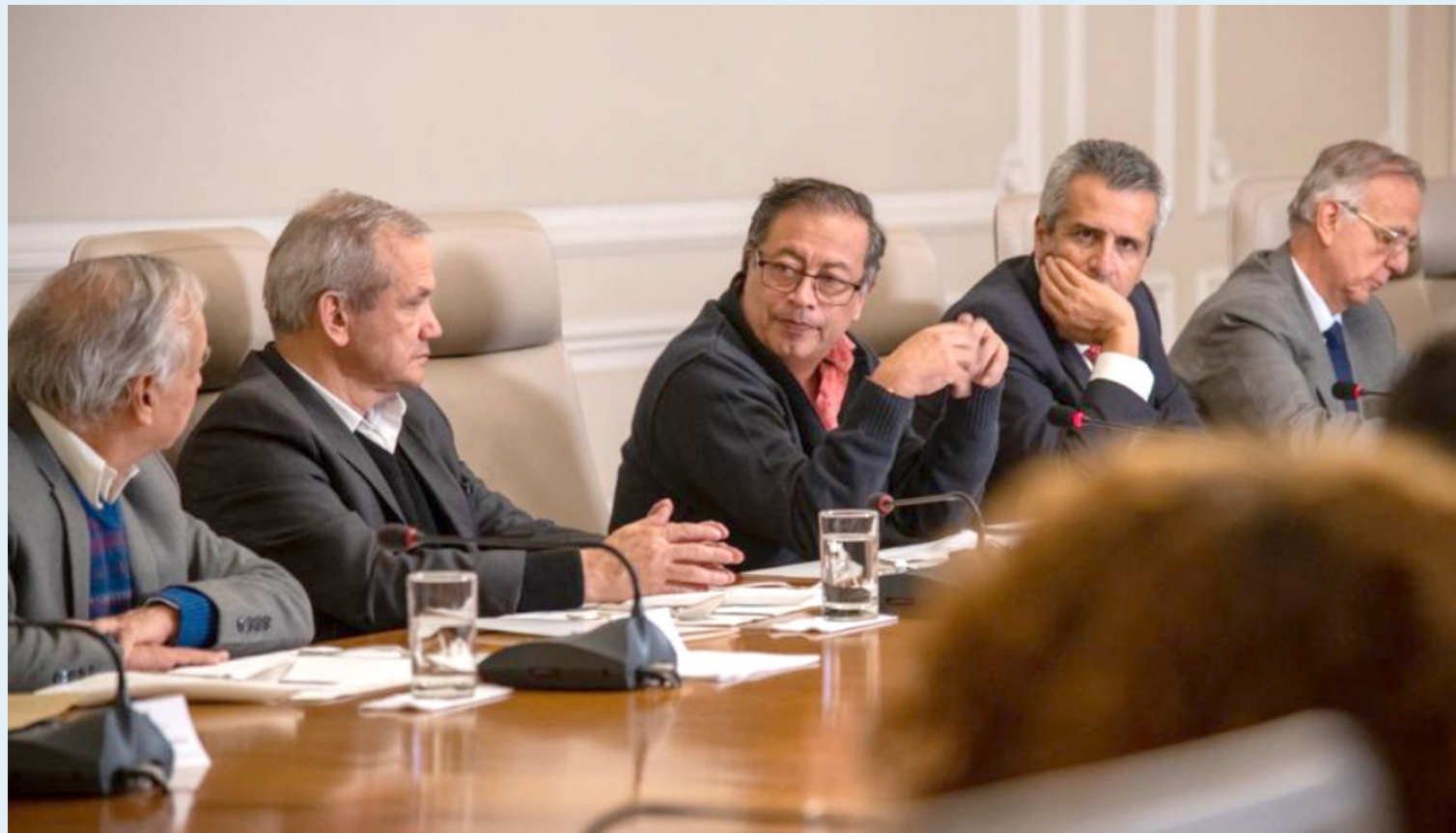
De acuerdo con el mandatario, es necesario que crezca la inversión pública.

Así las cosas, enfatizó en que hoy todos los miembros de la Junta Directiva del Banco de la República están llamados a una discusión sobre las cifras: “Pueden provocar ahora, ya vencida la inflación, el crecimiento del empleo y el crecimiento de la producción real de Colombia”.