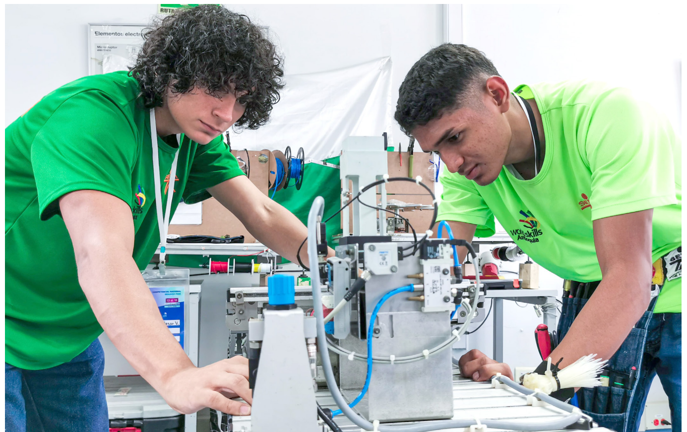
En una emocionante ceremonia de inauguración, la ciudad de Neiva se ilumina con la energía y el entusiasmo de los 113 competidores de WorldSkills Colombia.

La Competencia WorldSkills Colombia en el Sena Neiva no solo pone a prueba las habilidades técnicas de los aprendices, sino que también promueve un intercambio cultural y fortalece la formación integral de los participantes.