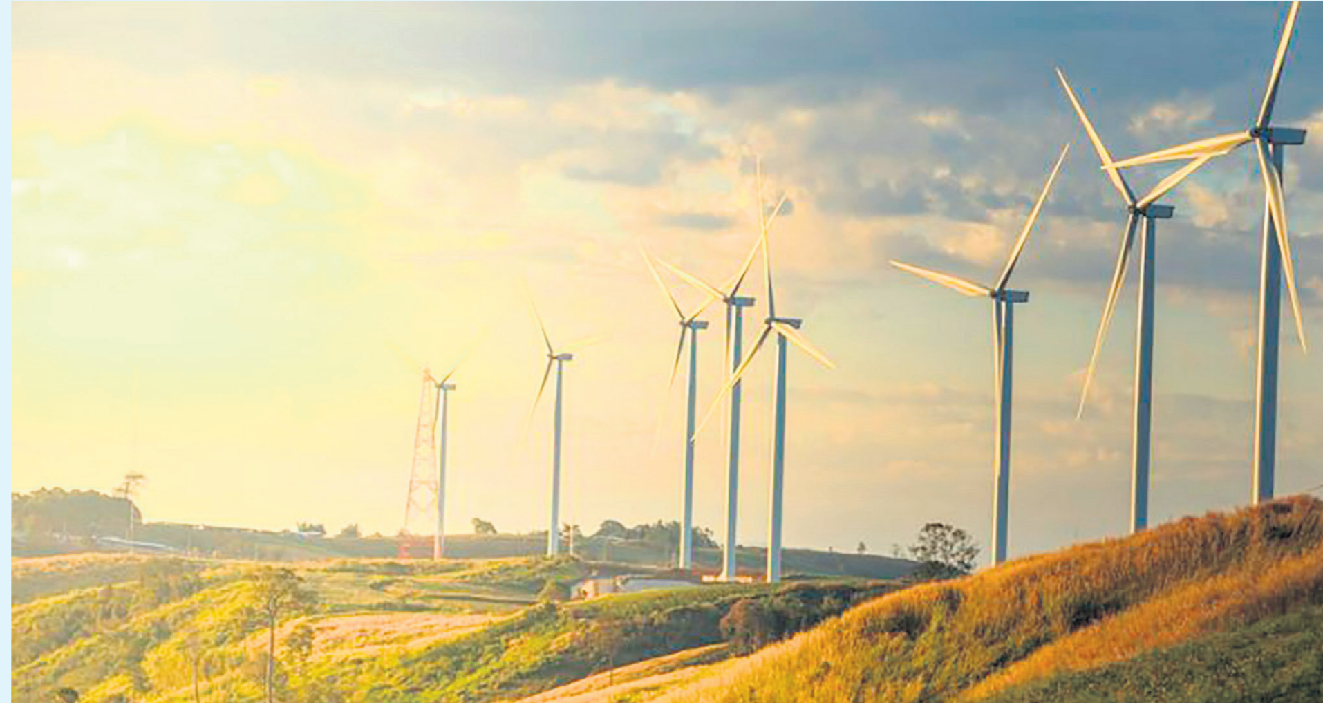
Lo ideal es generar energías no contaminantes.