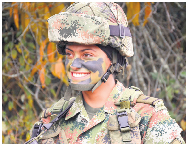
Se presentan más mujeres al Ejército.

“Con las mujeres vemos más ese potencial a incorporarse, con ellas siempre cumplimos la meta. Esta vez recibiremos 36 de las que se presenten”, agregó el oficial.