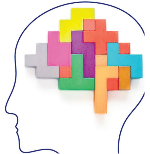
El estrés crónico podría desencadenar Alzheimer.

Si bien la relación entre el Alzheimer y el estrés crónico es intrigante, aún se necesita más investigación para comprender completamente este vínculo. Sin embargo, estas investigaciones sugieren que la gestión efectiva del estrés podría ser una estrategia preventiva importante en la lucha contra la enfermedad de Alzheimer. La promoción de estilos de vida que incluyan técnicas de reducción del estrés, como la medi-