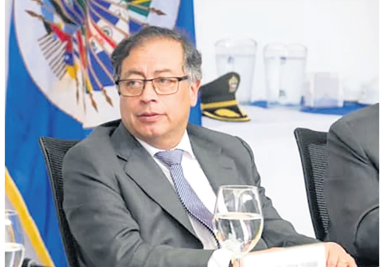
El presidente ha hecho declaraciones por la red 'X'.

Ya el gobierno de Israel había anunciado la suspensión de las exportaciones de material de seguridad a Colombia en respuesta a las declaraciones consideradas hostiles y antisemitas por parte del presidente de nuestro país.