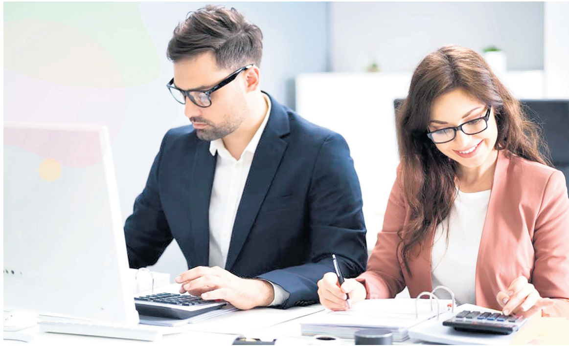
Para promover el crecimiento económico y el desarrollo, los gobiernos suelen otorgar beneficios tributarios a ciertos contribuyentes y sectores.

Con los contribuyentes del Impuesto sobre la renta y complementarios que en el año o período gravable inmediatamente anterior hayan obtenido ingresos brutos iguales o superiores a 33.610 Unidades de Valor Tributario “UVT” ($1.425.467.000 con