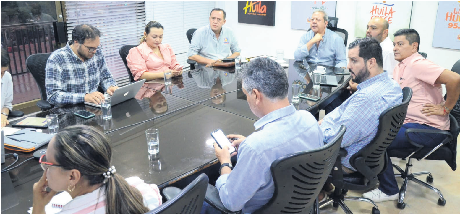
La comunidad local y los actores de la industria esperan que las medidas adoptadas por las autoridades ayuden a estabilizar la situación y prevenir futuras crisis similares.

provocada por el Fenómeno “El Niño”, sino también por la elevada demanda nacional y los compromisos internacionales.