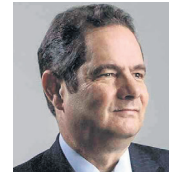
Germán Vargas Lleras

Está clara la animadversión de este gobierno por el sector privado. No solo por las empresas, sino también por cualquier tipo de organización no estatal. Toda la política pública tiene este común denominador porque el presidente Petro no concibe que pueda generarse ninguna utilidad ni beneficio en el desarrollo de actividades productivas como la salud, el transporte, la infraestructura, los seguros, la vivienda, los servicios públicos, la educación, para citar solo algunos.