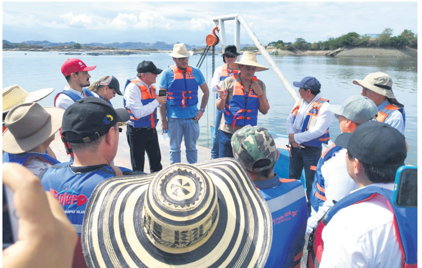
Comisión técnica realizó una visita al embalse de Betania para evaluar los efectos de los bajos caudales en la producción piscícola.

Autoridades toman medidas cruciales para enfrentar la crisis en el embalse de Betania y asegurar la producción piscícola en medio del impacto del fenómeno de El Niño.