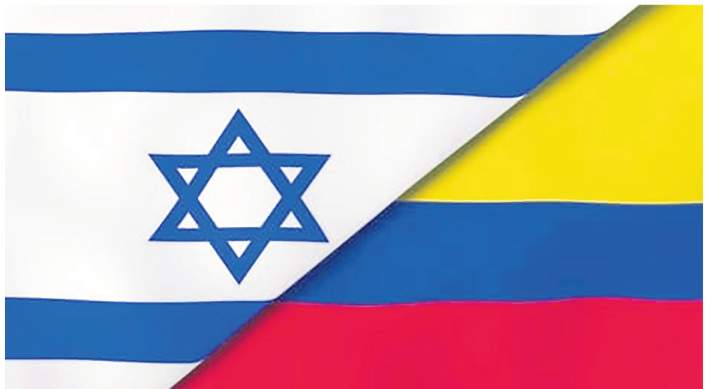
En vilo relaciones entre los dos países.

Ya el gobierno de Israel había anunciado la suspensión de las exportaciones de material de seguridad a Colombia en respuesta a las declaraciones consideradas hostiles y antisemitas por parte del presidente de nuestro país.