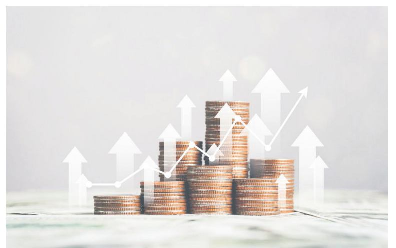
Las startups colombianas lograron inversiones de alrededor de $1.870 millones de dólares.

Asimismo, un 41% de los fondos de CVC consideran importante invertir en inteligencia artificial, el 31% en movilidad eléctrica y en temas relacionados con la sostenibilidad y el medioambiente.