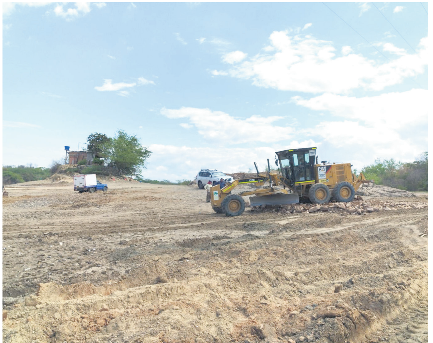
Piscicultores alertan sobre la disminución brusca de los niveles de agua en el embalse de Betania, afectando la producción y el abastecimiento de alimentos en la región.

Reunión de alto nivel entre Gobierno Nacional, departamental y actores clave de la industria para buscar soluciones a la crisis en Betania.