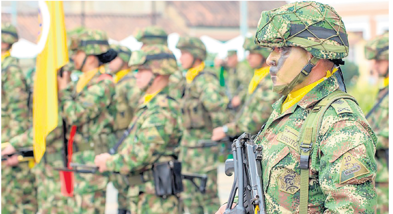
El proceso de incorporación inicia el 1 y va hasta el 17 de noviembre próximo.

“Vamos a incorporar 15.348 hombres que harán parte del mismo contingente de las mujeres, ha sido un poco más difícil y esto es un reto que nos han colocado las mujeres, una competencia, por eso el llamado a los hombres para que en los quince días restantes que nos quedan,