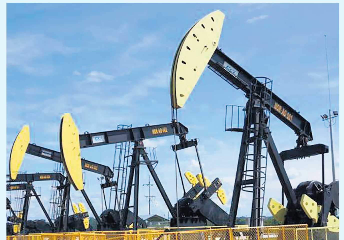
El mundo es dependiente del petróleo.

En este sentido, las potencias económicas, están buscando contaminar menos. Lo ha hecho Europa, lo intenta hacer Estados Unidos y dice que lo va a ser China. ¿Y cómo lo ha hecho Europa? allí no hay una reducción de emisiones en el transporte pero es