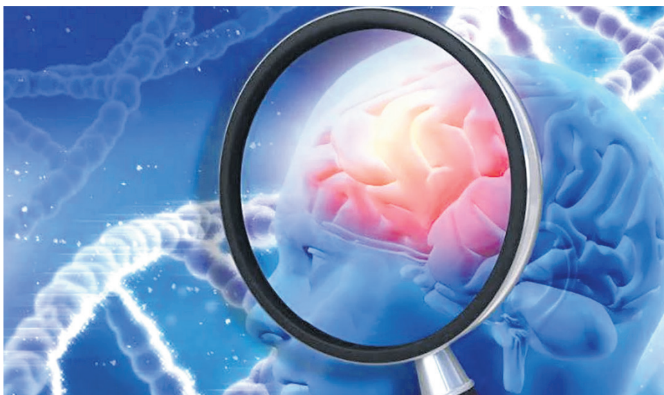
Cerebro humano puede sufrir deterioro.

Un estudio publicado en la revista Nature Communications en 2020 encontró que la exposición a niveles elevados de estrés crónico se asociaba con un mayor riesgo de deterioro cognitivo y, potencialmente, el desarrollo de Alzheimer. Los investigadores sugirieron que el estrés crónico podría acelerar la acumulación de placas amiloides en el cerebro, una característica distintiva de la enfermedad de Alzheimer. Además, el estrés crónico podría tener un efecto negativo en la salud vascular, lo que a su vez puede aumentar el riesgo de demencia.