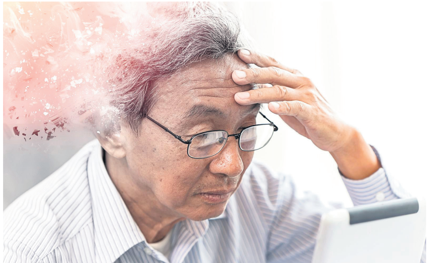
Alzheimer y estrés crónico estarían relacionados, según estudio.

El Alzheimer, una enfermedad neurodegenerativa que afecta a millones de personas en todo el mundo, continúa siendo un enigma en términos de su origen y tratamiento.