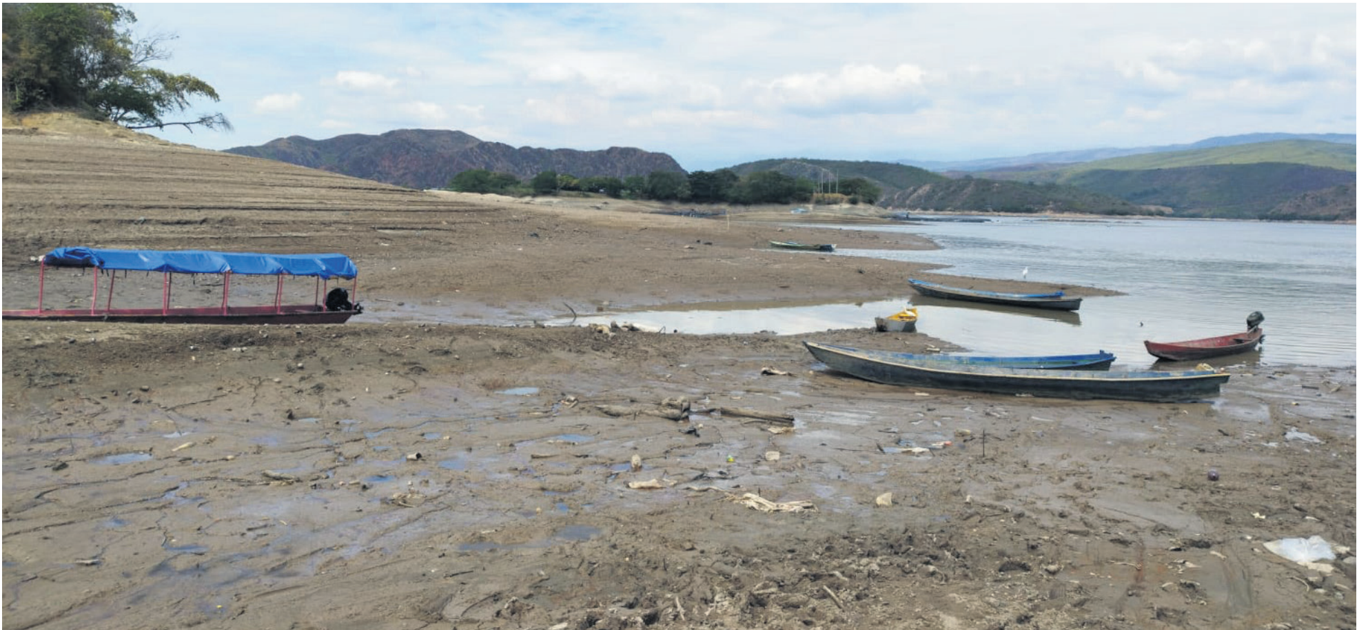
La temporada de verano ha agravado la situación, provocando la disminución de los niveles de agua en los embalses.

■ Ante la crisis actual que afecta al embalse de Betania, la cual amenaza la producción piscícola de la región debido al impacto del fenómeno de El Niño, las autoridades gubernamentales a nivel nacional y departamental han adoptado medidas inmediatas con el objetivo de asegurar tanto la generación de energía como la actividad acuícola.