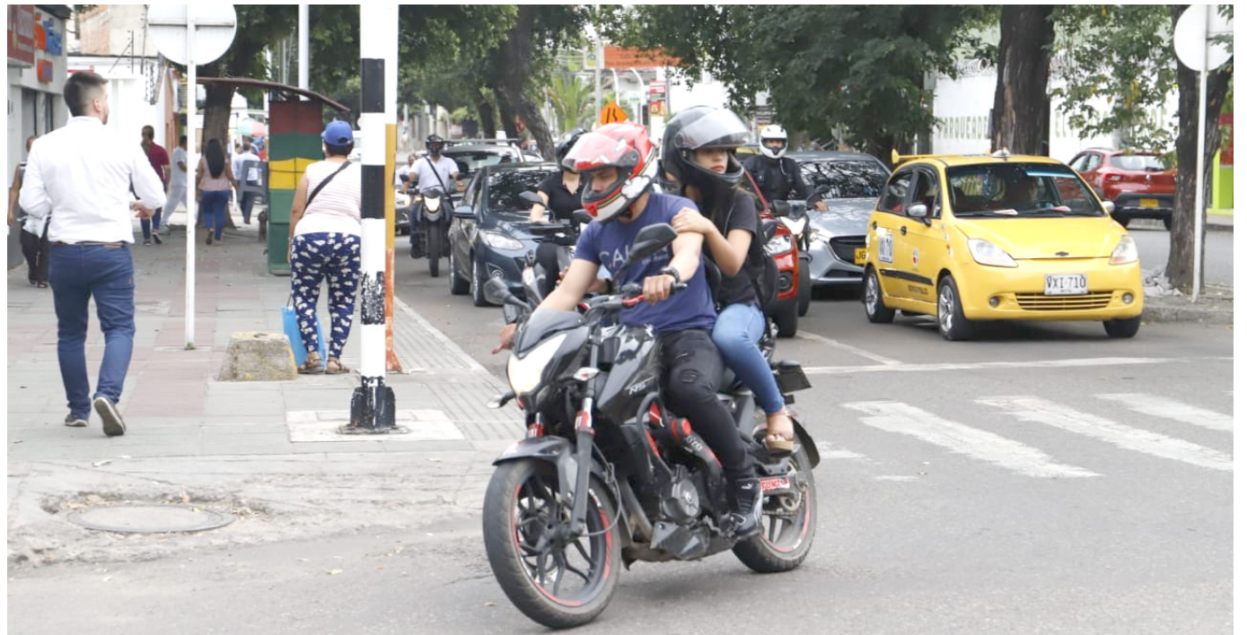
Las medidas regirán a partir del 1 de marzo.

La medida del no parrillero sería “constante, ya hemos hablado con el gremio y algunos líderes de