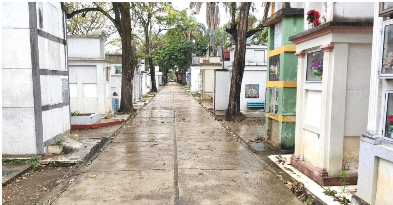
Así como en otros cementerios, en Neiva se daría la búsqueda de restos óseos.