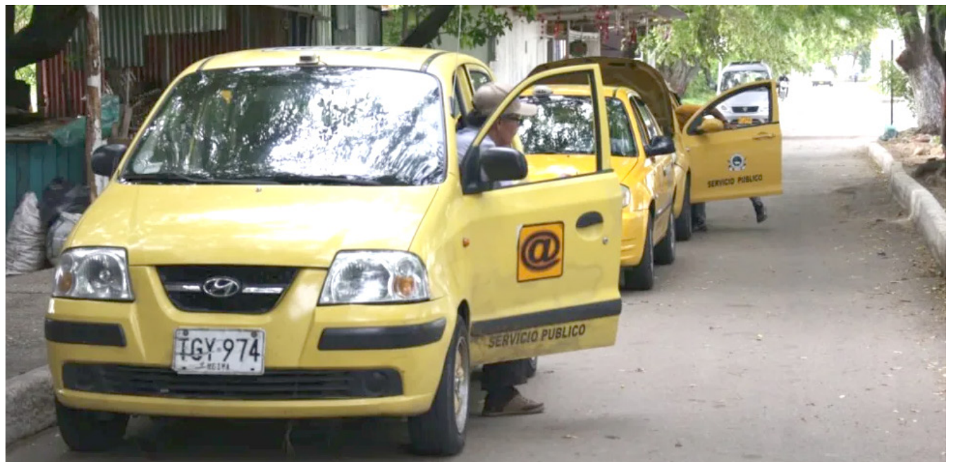
Esta modalidad de robo que se practica desde hace varios años, se está convirtiendo en la favorita de los delincuentes en la capital opita.

En los cuatro casos registrados el ‘modus operandi’ es el mismo y consiste en que las personas salen de las discotecas, abordan un taxi y en medio del recorrido los escopolaminan sin conocerse aún como. Lo cierto es que, se están utilizando cantidades pequeñas de escopolamina, pero técnicamente pensando en que las víctimas no pierdan la capacidad de voluntad y poder ir a los cajeros automáticamente. Una vez los hurtan los dejan en algún sitio y no recuerdan mucho, pero tenemos certeza que es a partir del vehículo que ellos tomaron para llegar a sus destinos.