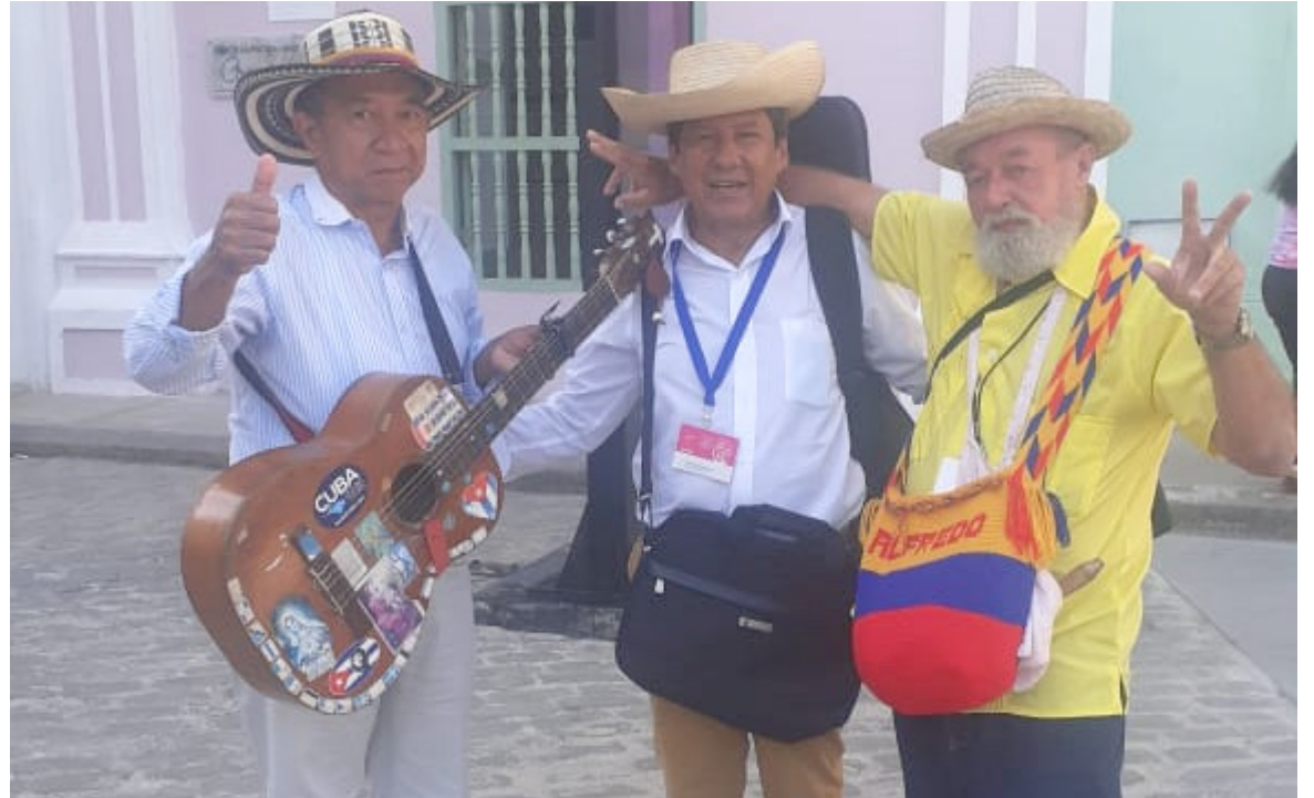
La expresión de la rajaleña lo ha llevado a darse a conocer en otros países.

“Seguí de manera investigativa al arte, primero en la pintura,