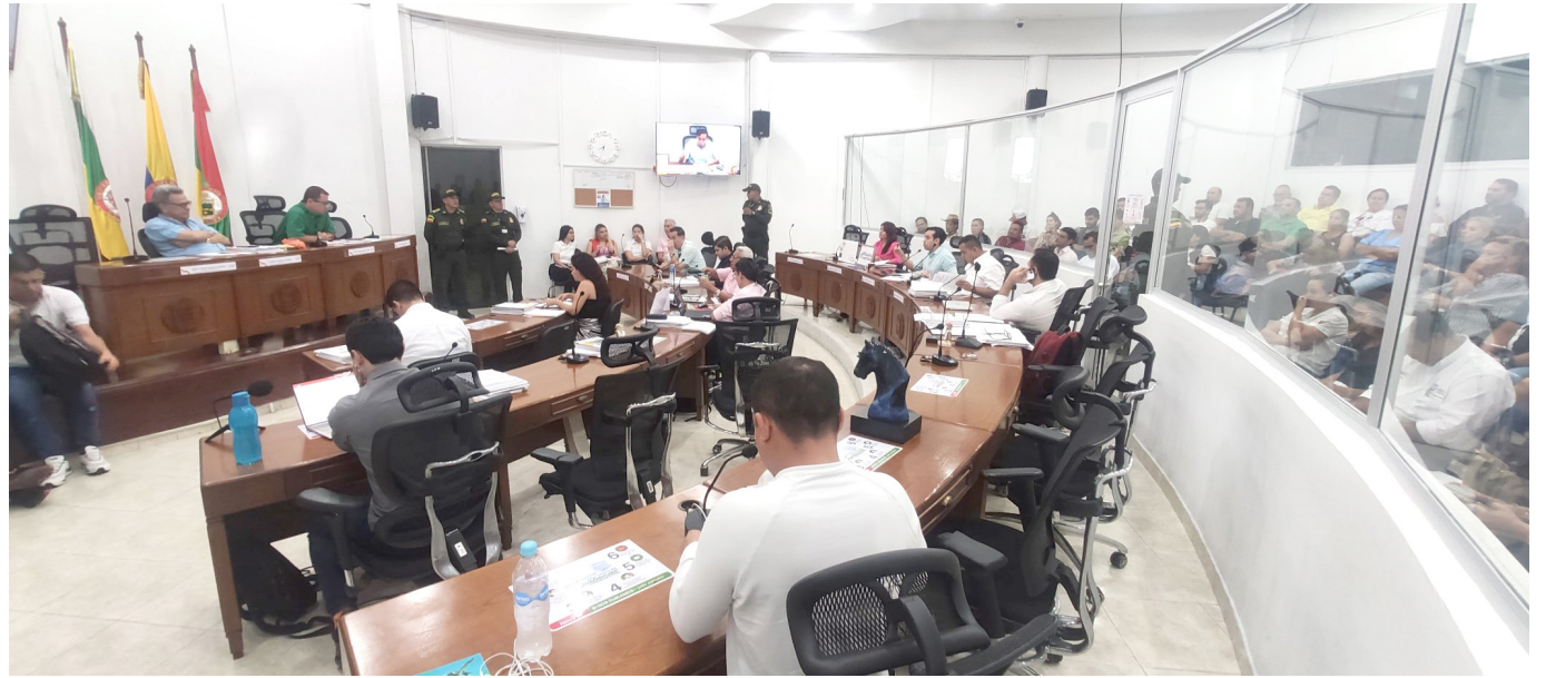
Estudio del proyecto.

El Concejo de Neiva se convirtió como en un rin de boxeo donde se tocaron no solo temas técnicos referentes al proyecto, sino también aspectos personales que riñeron en el irrespeto entre los cabildantes.