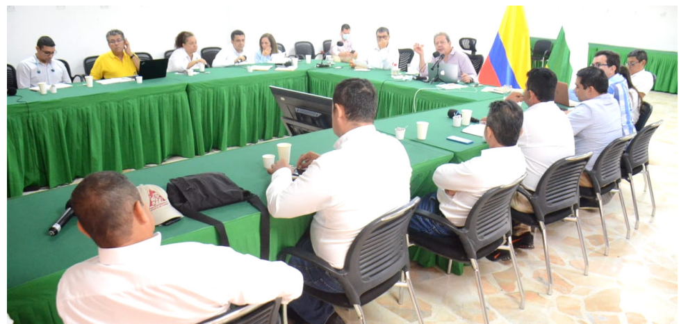
A través de una mesa de trabajo se dieron a conocer los proyectos.

Dichos dineros estarían invertidos en 3 proyectos estratégicos para el sector cafetero, el primero enfocado en la renovación y la reconversión de cafetales por socas o siembras nuevas que para el Huila es fundamental y que tendrá una inversión de 6.400 millones; el segundo enfocado a la seguridad alimentaria que consisten en la siembra de 2.000 hectáreas de frijol y 2.000 hectáreas de maíz para apoyar a los cafeteros en zonas donde se hacen las renovaciones, el cual, tendrá inversión de $9.700 millones y finalmente proyectos en infraestructura vial para la construcción de alcantarillas, placas huellas y otras obras con recursos del