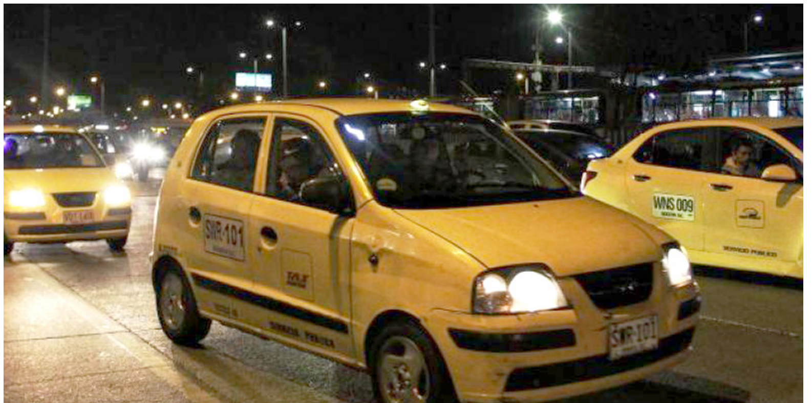
En Neiva se han registrado cuatro casos de 'paseos millonarios' en menos de dos semanas.

A pesar de que salió con varios amigos, cada uno tomó un taxi para llegar a sus destinos, sin embargo, infortunadamente fue escopolaminado y hurtado. "Pienso yo que es una dosis leve porque en mi primer momento de lucidez me logré percatar de lo sucedido, me doy cuenta de que tienen mis pertenencias y no sé cómo logré bajarme del taxi. Allí me doy cuenta de que estoy a las afueras de la ciudad de Neiva, vía Palermo, pero gracias a Dios no todos