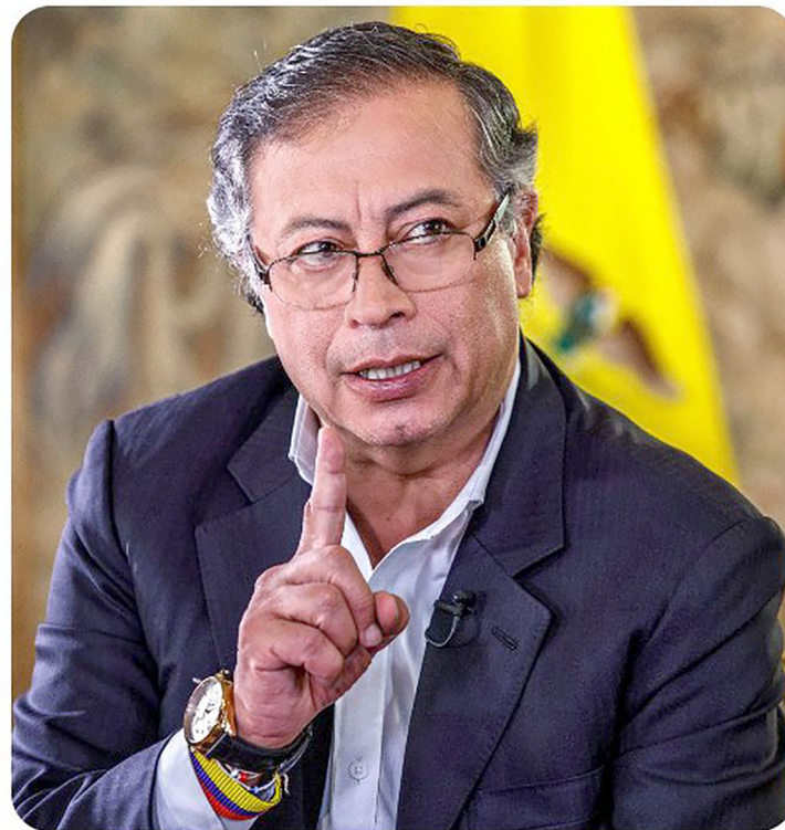
Por tres meses el presidente asumirá la regulación de los servicios públicos.

Petro podrá solicitar apoyos técnicos a las comisiones de regulación y demás entidades de cada sector, según el artículo 2.