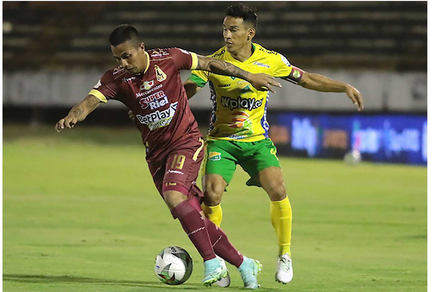
Se juega en Neiva el clásico 108 en la historia del Derby del Tolima Grande.

Desde el surgimiento de este clásico, ambos equipos se han enfrentado en 107 oportunidades, con 54 triunfos para los 'Pijaos', 32 empates y 21 triunfos para los 'Opitas'.