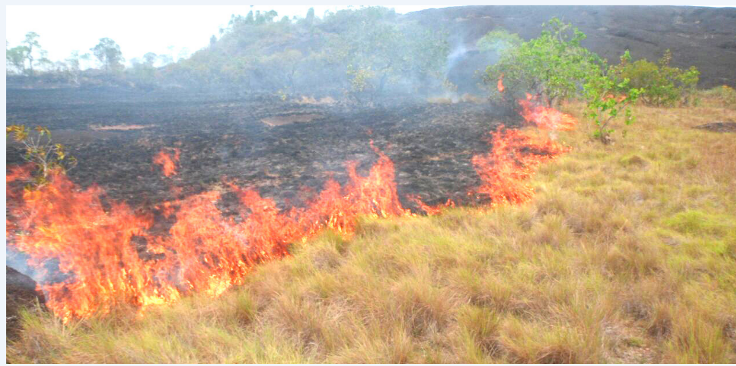
Los incendios forestales están proliferando.