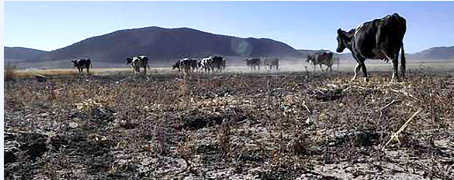
Altas temperaturas afectan el agro colombiano.

“Aunque la producción se mantiene en los niveles normales, es claro que en el futuro la misma se va a ver afectada ante la pérdida en los cultivos, esperamos que la afectación no sea tan grave.