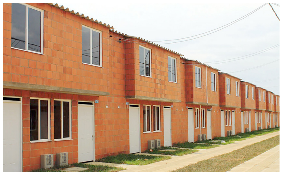
En áreas rurales, los hogares con Sisbén entre A1 y C14 recibirán un subsidio de 30 SMMLV.

Los subsidios se otorgarán a los beneficiarios de acuerdo con la disponibilidad, el puntaje de priorización y según el orden de