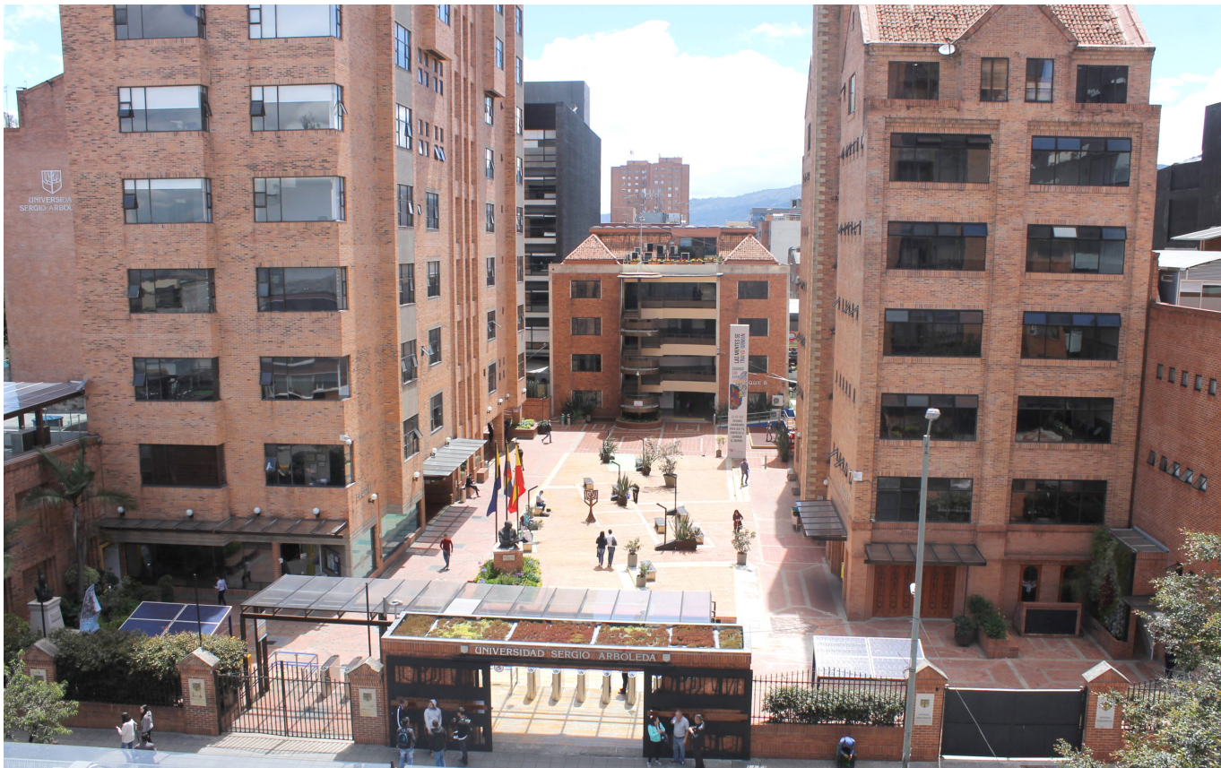
Hasta el momento he contado con el apoyo de la Facultad de Ingeniería de la Universidad Sergio Arboleda que es donde estoy haciendo la maestría en inteligencia artificial.

miento. A qué me refiero, hay que pasarle mucha información y hacer muchísimas pruebas, hasta tener un 90% de satisfacción de los resultados que me va a arrojar la máquina. Inicialmente es un apoyo, pero podríamos llegar a tener una máquina que nos podría llegar a redactar una acción de tutela.