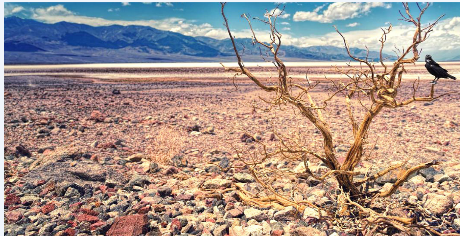
2023 será un año de altas temperaturas advierten científicos.

Los fenómenos de El Niño y La Niña son la principal causa de las diferencias meteorológicas interanuales en muchas regiones. En los años de La Niña, los vientos alisios del Pacífico de este a oeste son más fuertes, empujando las aguas cálidas superficiales hacia el oeste y atrayendo aguas más profundas y frías hacia el este. El Niño se produce cuando los vientos alisios disminuyen, lo que permite que las aguas cálidas vuelvan a extenderse hacia el este, sofocando las aguas más frías y provocando un aumento de las temperaturas globales.