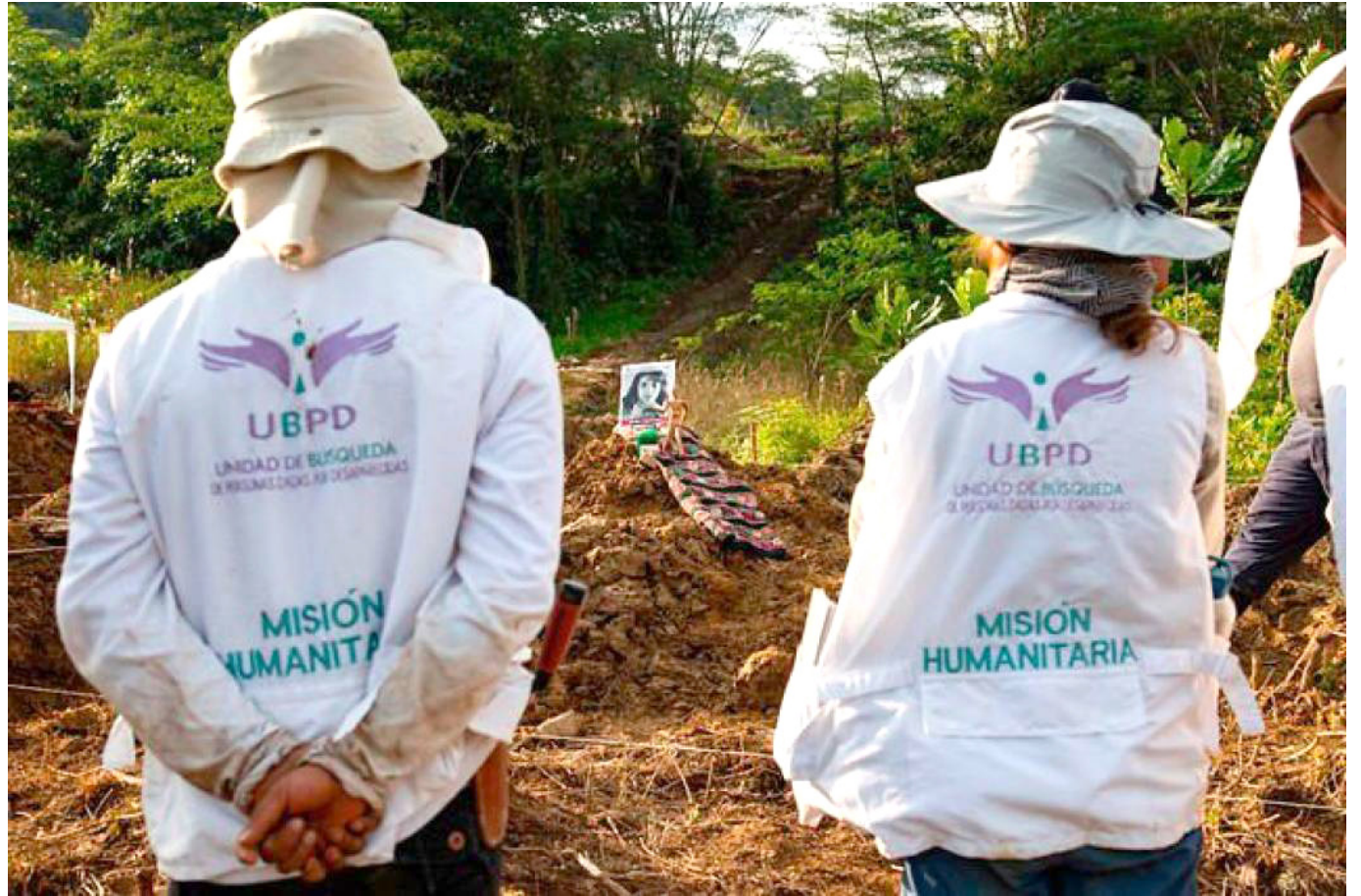
La UBPD no ha dado fechas de inicio.

Los familiares no han sido informados de algunas fechas específicas para tal fin y mucho menos de quien realiza esa función.