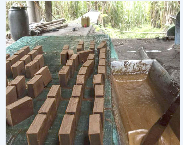
Los paneleros temen que se caiga la producción.

Lo que si dejó en claro es que nunca es conveniente que se tengan mortalidades por encima de lo normal. “Otra complicación que les puede generar las altas temperaturas es que muchas enfermedades se disparan por esos niveles altos de temperatura, por eso toca tratar de que esta no suba tanto”, concluyó.