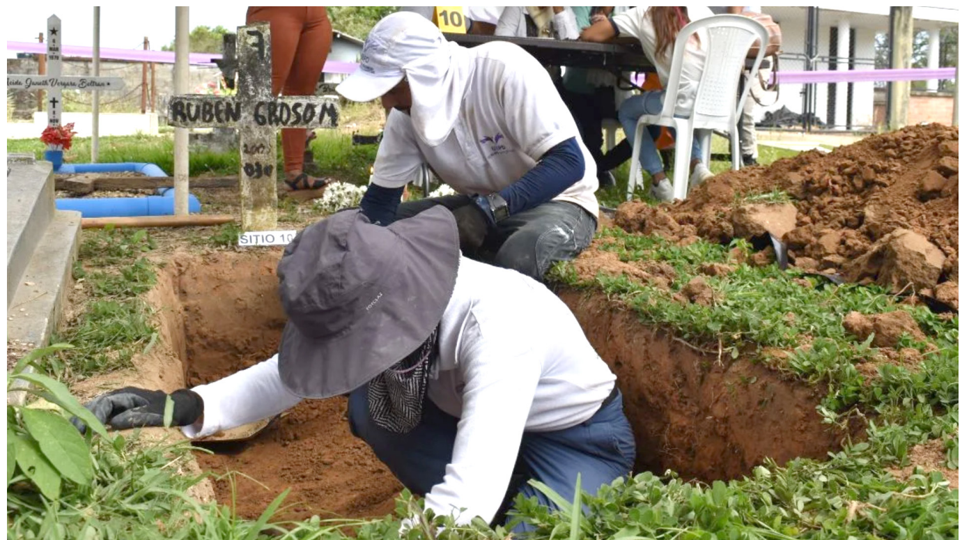
La Unidad de Búsqueda de Personas Dadas por Desaparecidas realizó un mapeo en el Cementerio Central de Neiva.

Para ella estos procesos requieren de unos pasos que se han venido marcando durante el último tiempo.