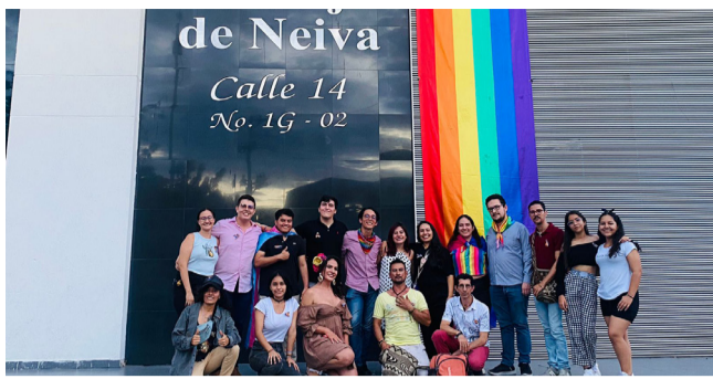
“A las personas LGBTIQ+, las asesinan por su orientación sexual”