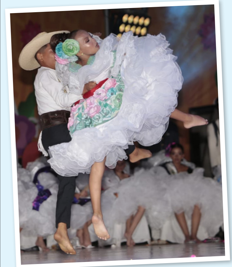
Destacado 1: La velada de coronación contó con una masiva participación de la ciudadanía, quienes aplaudieron y animaron a las candidatas.