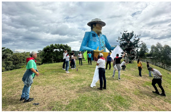
Arrancaron las caravanas turísticas