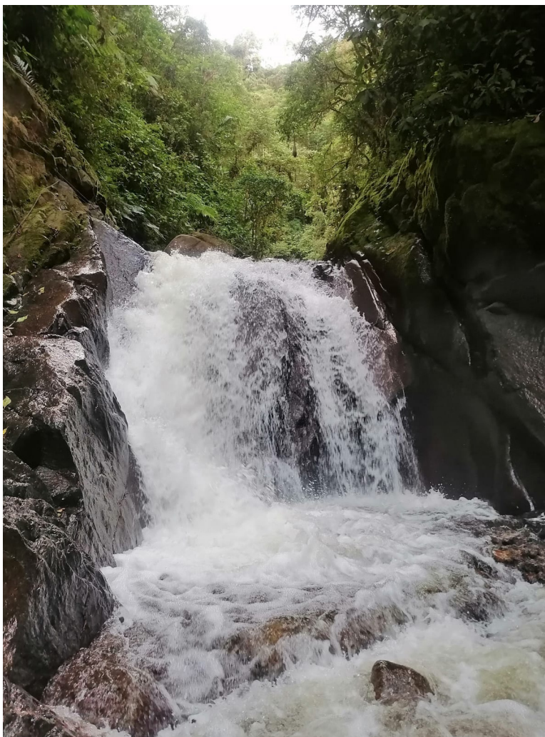
Es importante ordenar el territorio alrededor del agua. Afluente ubicado en el municipio de Gigante.

“Este es un plan que ha contado con una amplia discusión, que ha sido revisado y que contiene los elementos necesarios para que las comunidades y las instituciones tengan herramientas del manejo ambiental para el Huila”, indicó el consejero que representa al Presidente de la República.