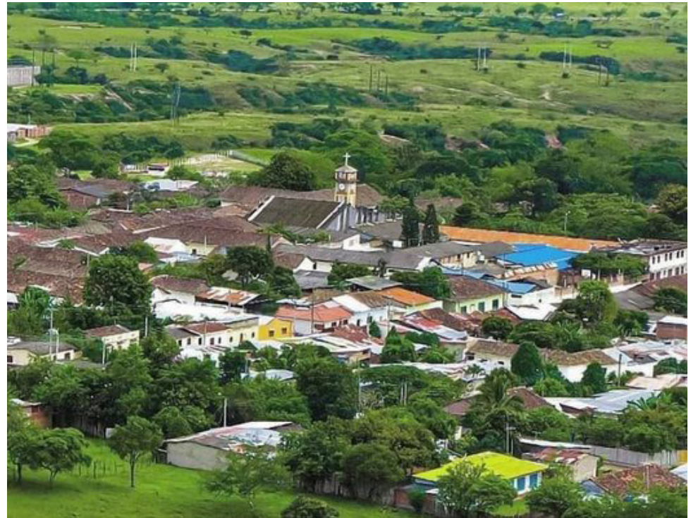
Existe un plan para embellecer los municipios del Huila, con miras a dinamizar el turismo en la región.

Y en cuanto a la seguridad, el funcionario, destacó: “ese es un tema aislado, por esta razón queremos demostrarle a toda la gente del departamento y a los visitantes nacionales, que no existe ningún inconveniente para disfrutar del Huila, donde pueden gozar de todos los pisos térmicos”.