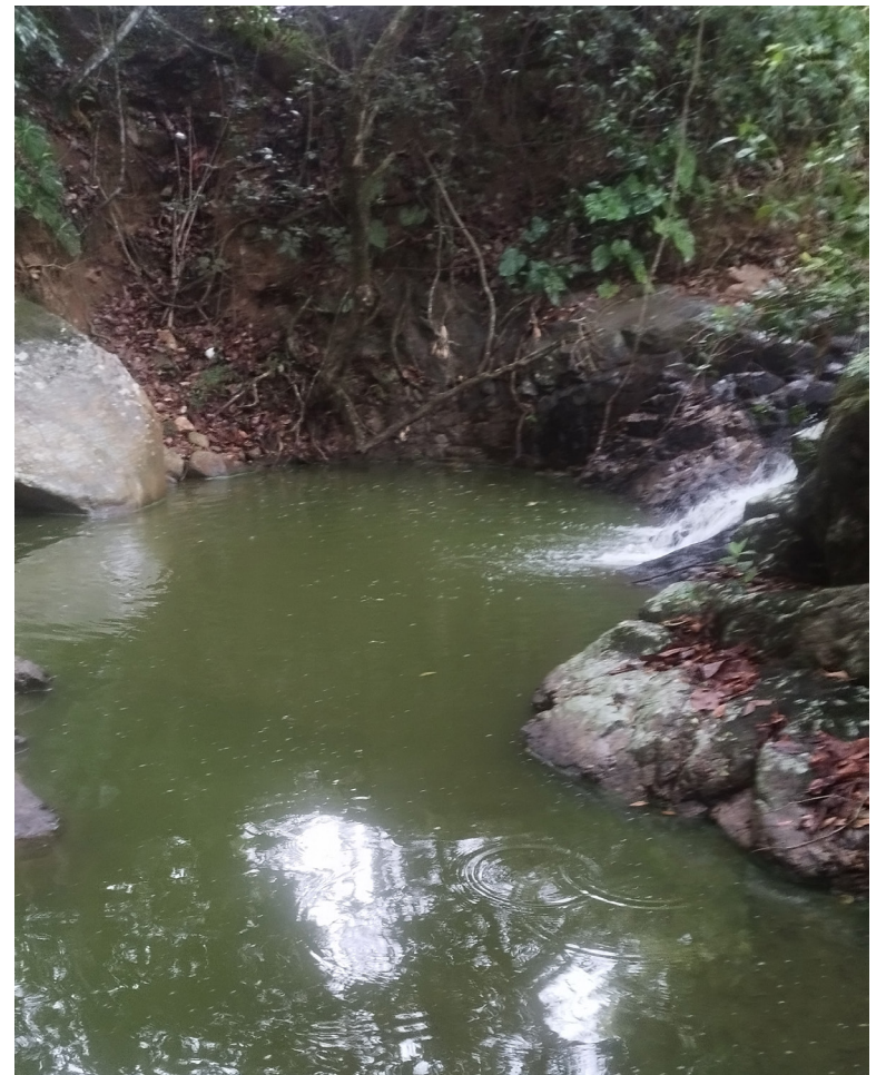
La quebrada El Neme en Teruel, afectada por vertimientos de piscícolas.

De igual manera, en el pasado mes de febrero, este medio de comunicación, conoció que la quebrada El Neme, también conocida como Baurá, es perjudicada, por unas empresas pesqueras, quienes al parecer arrojan los residuos líquidos, provenientes del proceso piscícola a este afluente, sin ningún control.