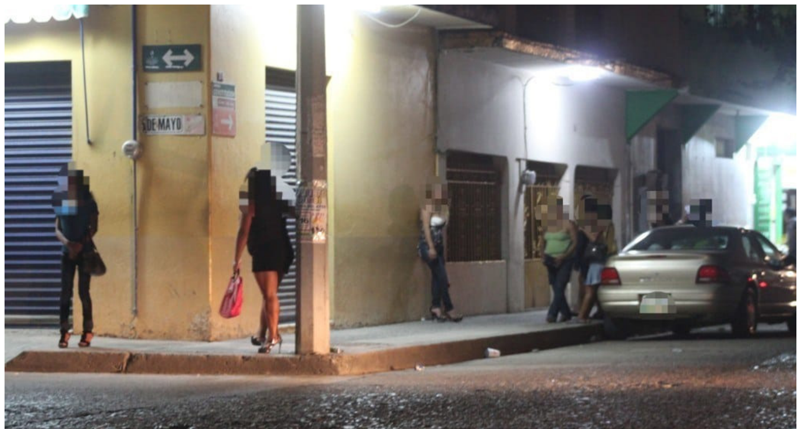
A los 'Trans', no les queda otro camino que la prostitución.

"Creo que principalmente lo que está afectando a la Colectividad, es la estigmatización. En los espacios escolares hemos visto diferentes escenarios de este tipo, incluso de matoneo entre los mismos estudiantes, eso sucede acá en Neiva y a nivel nacional y lo que necesitamos es que las Instituciones Educativas, brinden un acompañamiento psicosocial para los niños, y adicionalmente a la familia, porque esas no son situaciones fáciles".