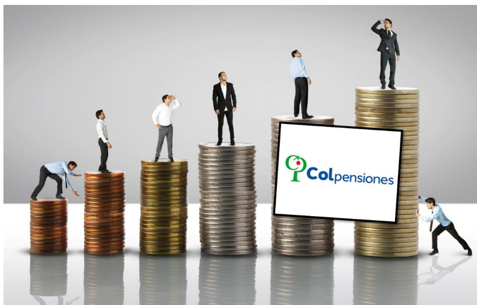
Todas las personas tendrían que cotizar en Colpensiones hasta 2,3 salarios mínimos.

El proyecto incluye un pilar solidario para todos los hombres de 65 años y mujeres de 60 años en pobreza extrema, pobreza o vulnerabilidad, quienes recibirán una renta por encima de la línea de pobreza, equivalente a 223,000 pesos, ajustada anualmente por la inflación. Estos recursos provendrían del Presupuesto General de la Nación.