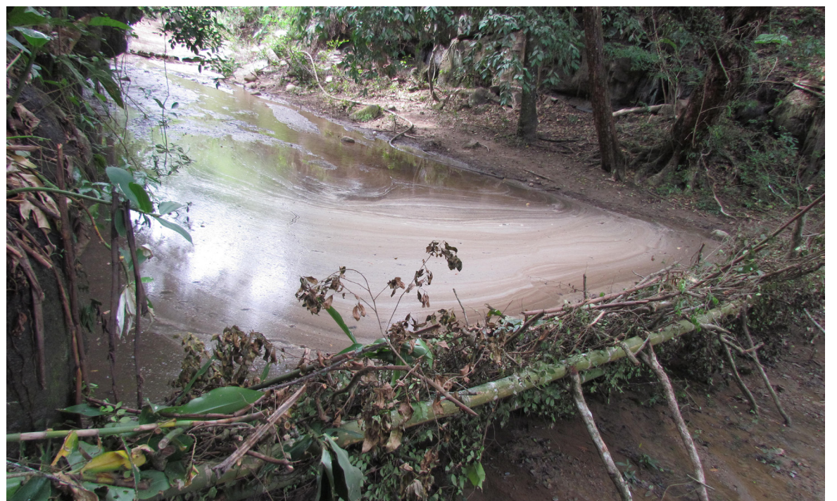
Contaminación en la quebrada ‘El Zapallo’, Hobo.

“Acá hay un debate de fondo, cuál es la escala de minería que se debe hacer sobre todo, cuando estamos hablando de minería que afecta bocatomas de acueductos, concesiones de agua. Lo que dice nuestro Plan de Desarrollo, es ordenar el territorio alrededor del agua”, expresó Susana Muhamad, ministra de Medio Ambiente.