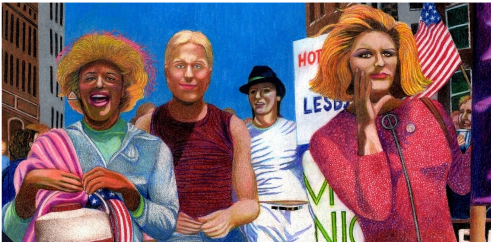
Agresión policial en la década del 60 en Estados Unidos, encendieron la mecha del actual movimiento LGBTI.

La problemática que enfrentan las personas LGBTIQ+ en Colombia, sigue siendo motivo de estudio y preocupación en diver-