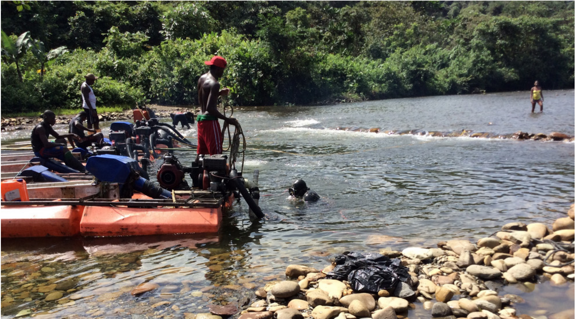
La pequeña minería, deberá proteger el recurso hídrico.