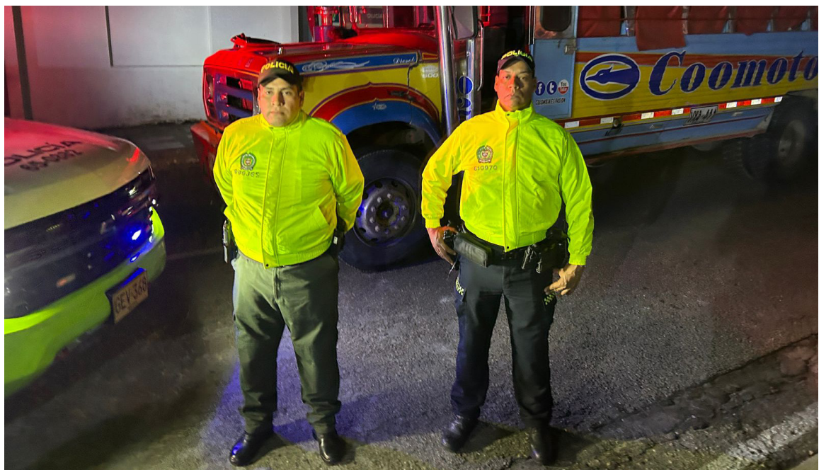
La Policía Metropolitana de Neiva, en diferentes actividades desplegadas, logra la recuperación de un bus escalera que había sido hurtado de un parqueadero al sur de Neiva.