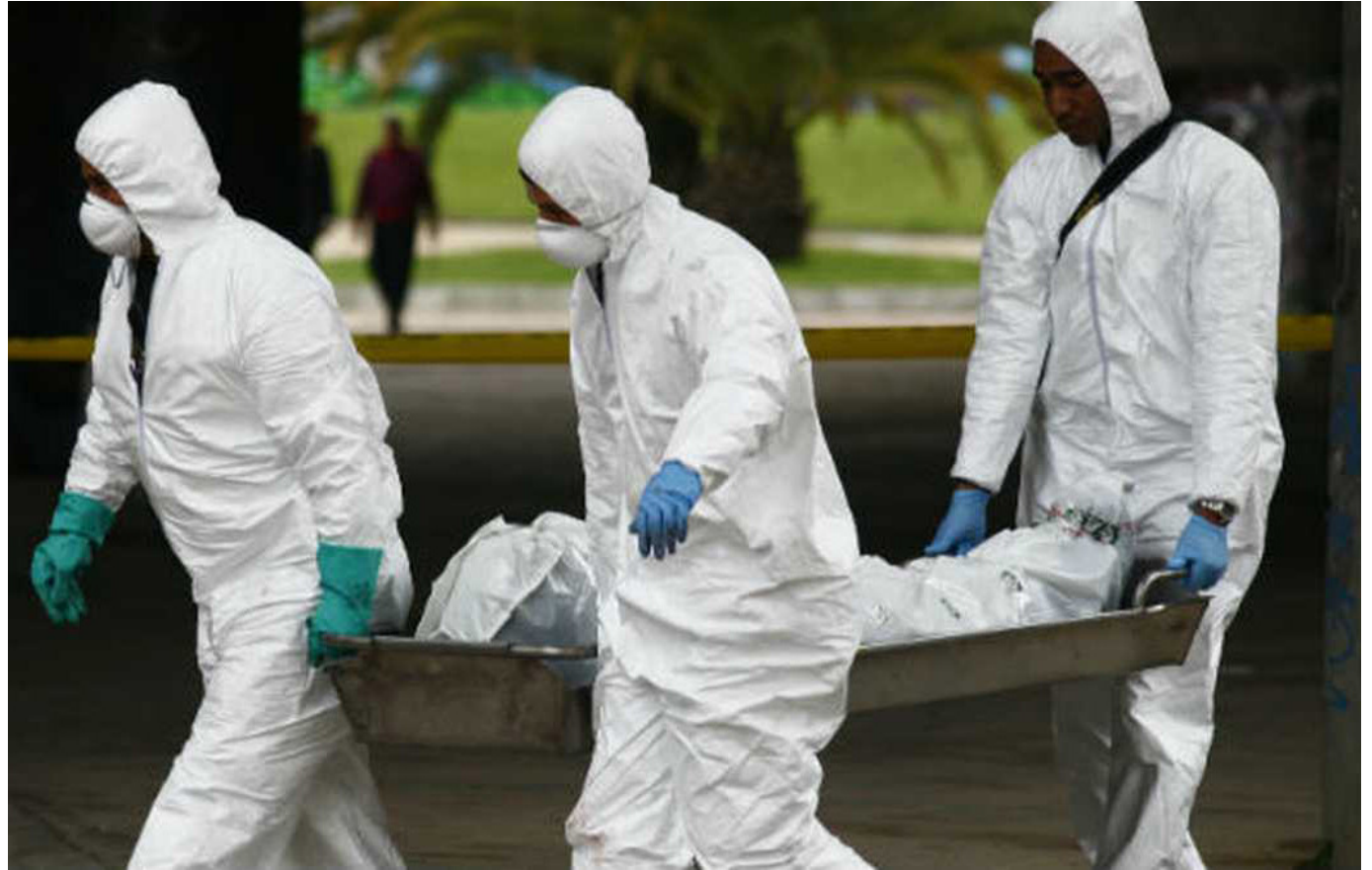
Tres personas con orientación sexualmente diversa, fueron asesinadas en el Huila-2023.