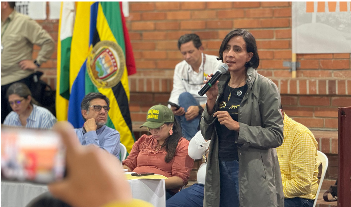
Susana Muhamad, ministra de Medio Ambiente.

públicas nacionales y el objetivo es comprometernos todas las autoridades ambientales, Fuerza Pública, para evitar deforestación, la minería legal que causa tanto daño le causa al medio ambiente, y también el tráfico ilegal de fauna y flora, este es un compromiso grande”.