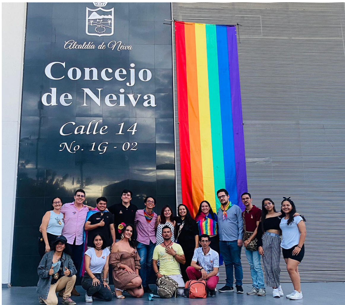
Primera vez que en el Concejo de Neiva, se iza la bandera del orgullo gay.

En los ámbitos. Esto se debe a que, a pesar de los avances legislativos y sociales que se han registrado en los últimos años, continúan existiendo violaciones a sus derechos humanos. Estas violaciones incluyen, entre otras, discriminación, violencia física y verbal, amenazas y exclusión social. Incontables, es un informe que presenta una radiografía detallada de las experiencias vividas por las personas LGBTIQ+ a lo largo del año 2023.