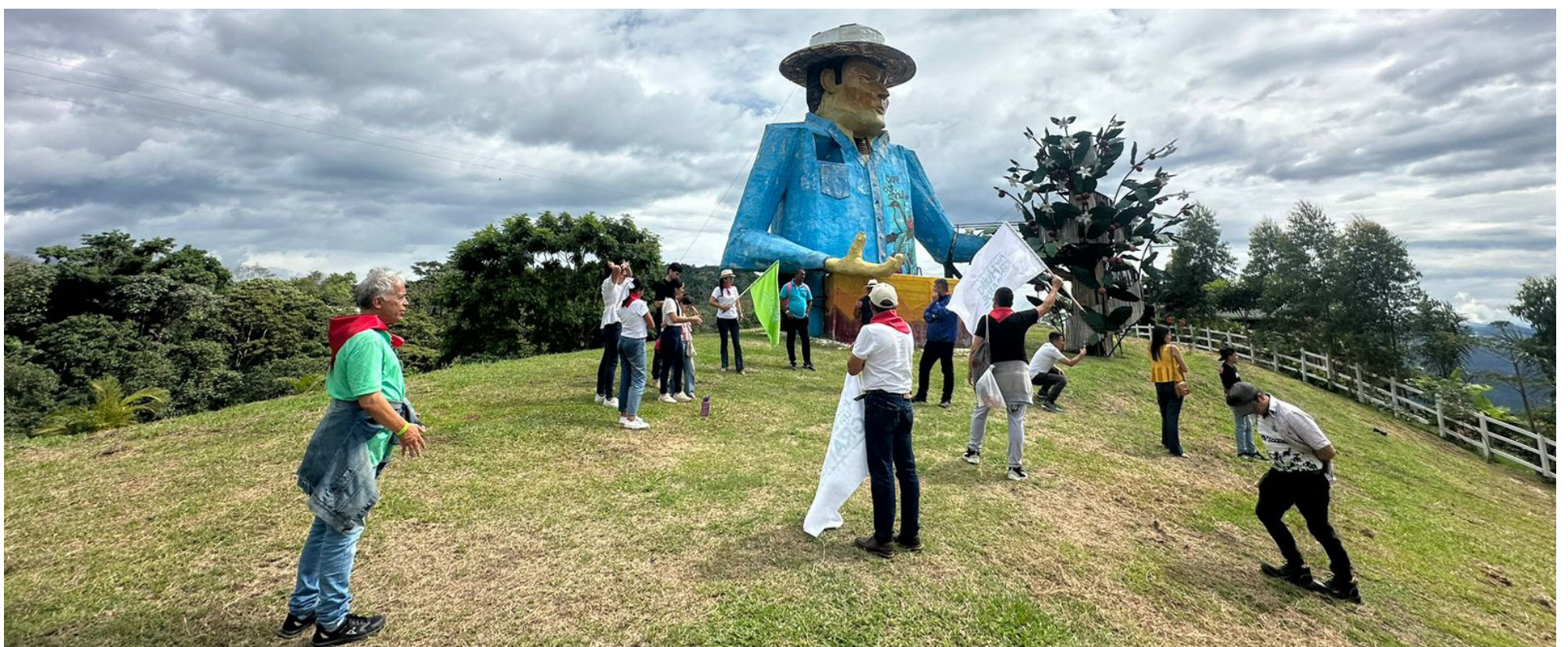
Los visitantes tenían tres rutas para escoger.

disfrutar del Huila, donde pueden gozar de todos los pisos térmicos, contamos con sitios emblemáti-