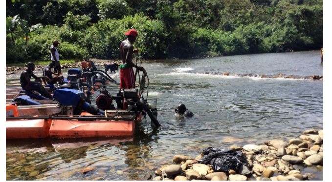
Sí a la ‘pequeña’ minería en Colombia