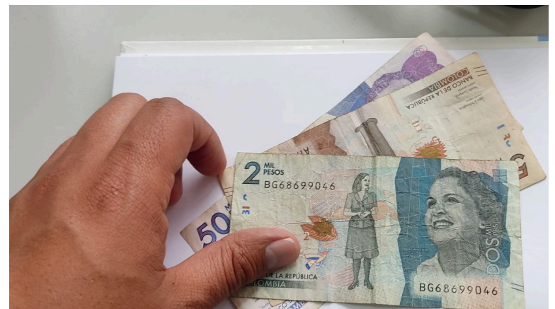
Para transferir la pensión se debe primero saber si es un afiliado o un pensionado para hacer el trámite.

Colombia vive un momento de incertidumbre a causa de la actualidad económica. Por un lado, el costo de vida parece que seguirá caro en los próximos meses. Por ejemplo, el Departamento Administrativo Nacional de Estadística (Dane) reveló que la inflación interanual en mayo se ubicó en 7,16%, misma cifra de abril, luego de venir con 13 meses en descenso.