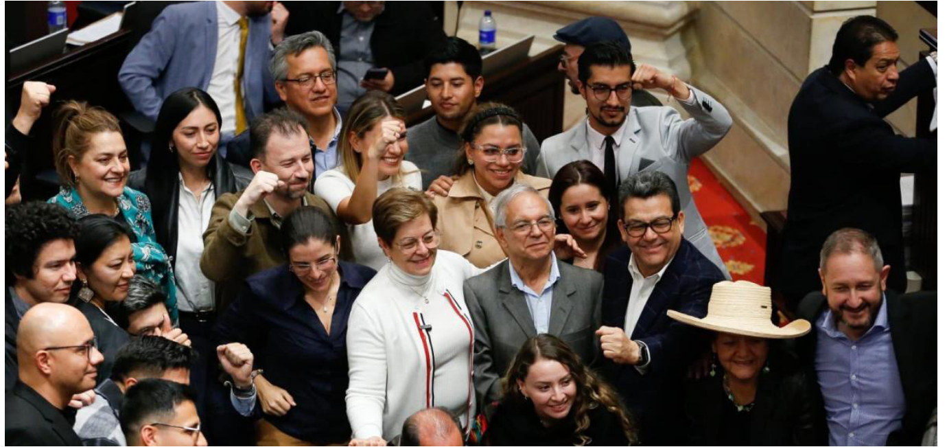
Ministros en la aprobación de la pensional en Cámara.

Las cotizaciones hasta 2,3 salarios mínimos irán a un fondo de ahorro que administrará el Banco de la República. Este fondo se llenará con las cotizaciones y se invertirá en activos como renta fija y variable.