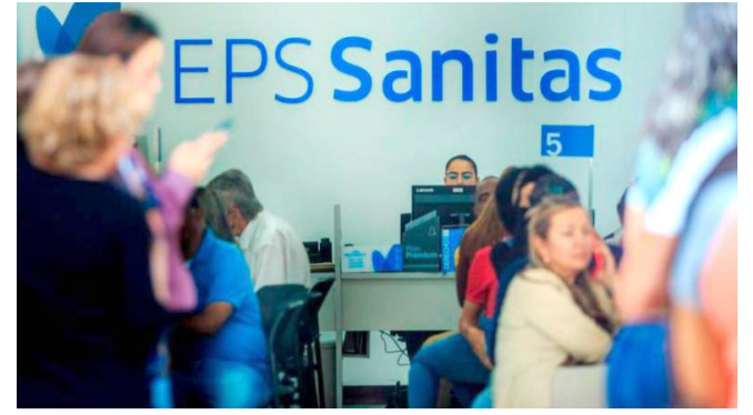
¡Usuarios requieren soluciones ya!