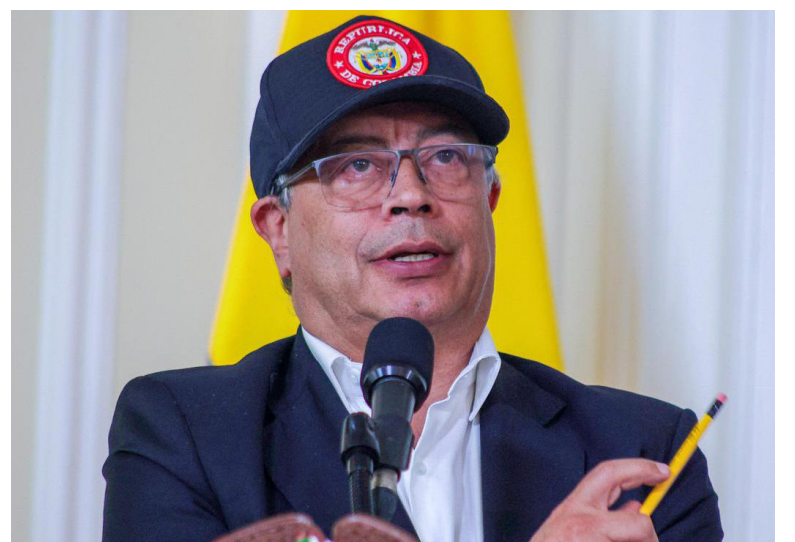
Gustavo Petro, presidente de Colombia, se reúne en la tarde del 16 de mayo con los miembros de la Junta Directiva del banco de la República para discutir sobre el crecimiento económico del país.

“Siempre mintiendo Gustavo Petro: el portafolio de Finagro no es de $9 billones, es de $2,8 billones”, indicó el exfuncionario. Asimismo, recordó que dicha entidad no puede prestar dinero de manera directa, sino que solo les da recursos a los bancos, principalmente, al Banco Agrario que Petro politizó.