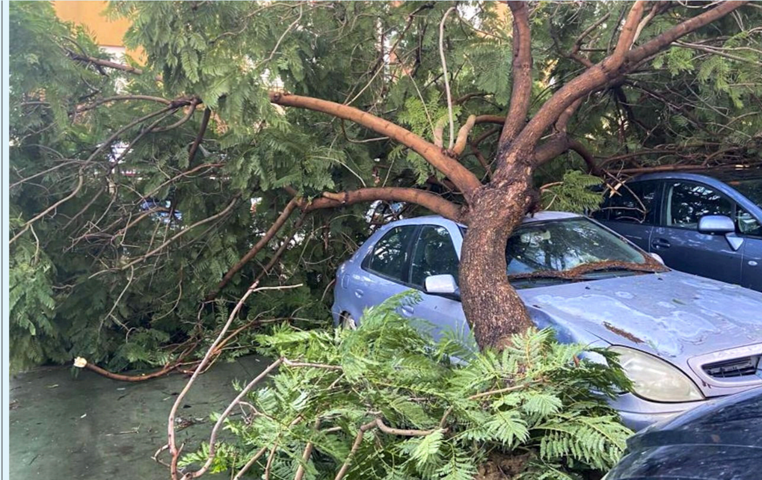
El territorio nacional pasará por un periodo de incremento de lluvias, huracanes y ciclones durante el fenómeno de La Niña.

Asimismo, insistió en que se deben vigilar los puntos de emergencia que se identificaron entre 2010 y 2011 para evitar situaciones de riesgo y desastres naturales.