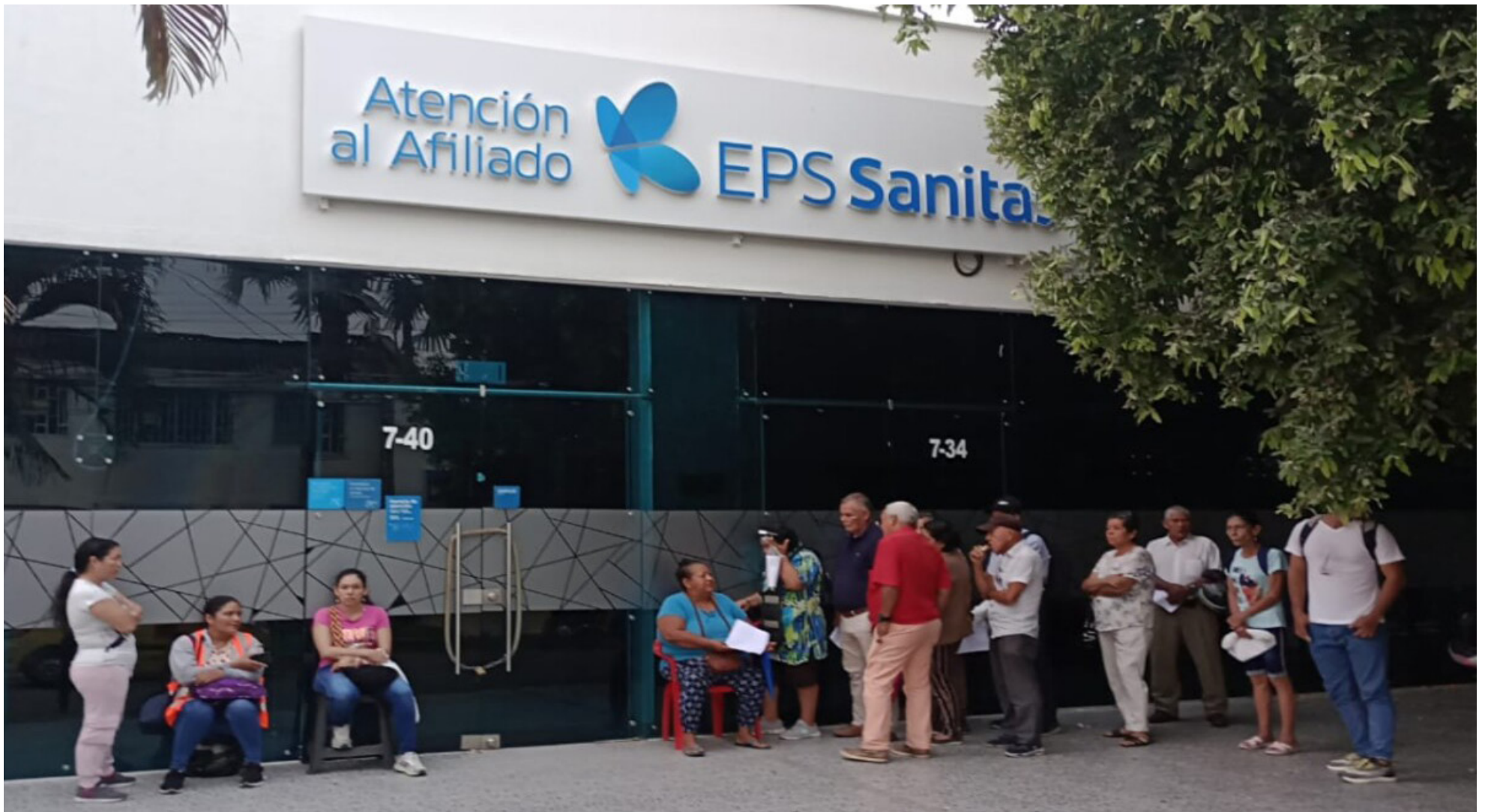
La EPS Sanitas, bajo intervención del Gobierno Nacional, ha puesto en marcha un ambicioso plan para abordar las quejas y reclamos de sus afiliados en todo el territorio nacional.

■ Con el objetivo de reducir en un 50% las reclamaciones antes de su proceso de intervención, la EPS ha iniciado un recorrido por diferentes regiones del país, siendo Neiva el punto de partida de esta importante iniciativa.