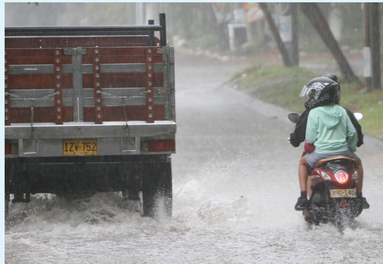
Regiones como la Caribe, Pacífica y Andina, podrán tener una temporada de lluvias récord, en las próximas semanas. En la Orinoquía y la Amazonía, se presentaría una temporada seca.

Así las cosas, la ministra Susana Muhamad pidió que se prioricen las zonas del país en las que se podrían presentar avenidas torrenciales, inundaciones y movimientos en masa. Igualmente, solicitó que los cuerpos operativos responsables de atender emergencias se capaciten y se preparen para afrontar situaciones de urgencia.