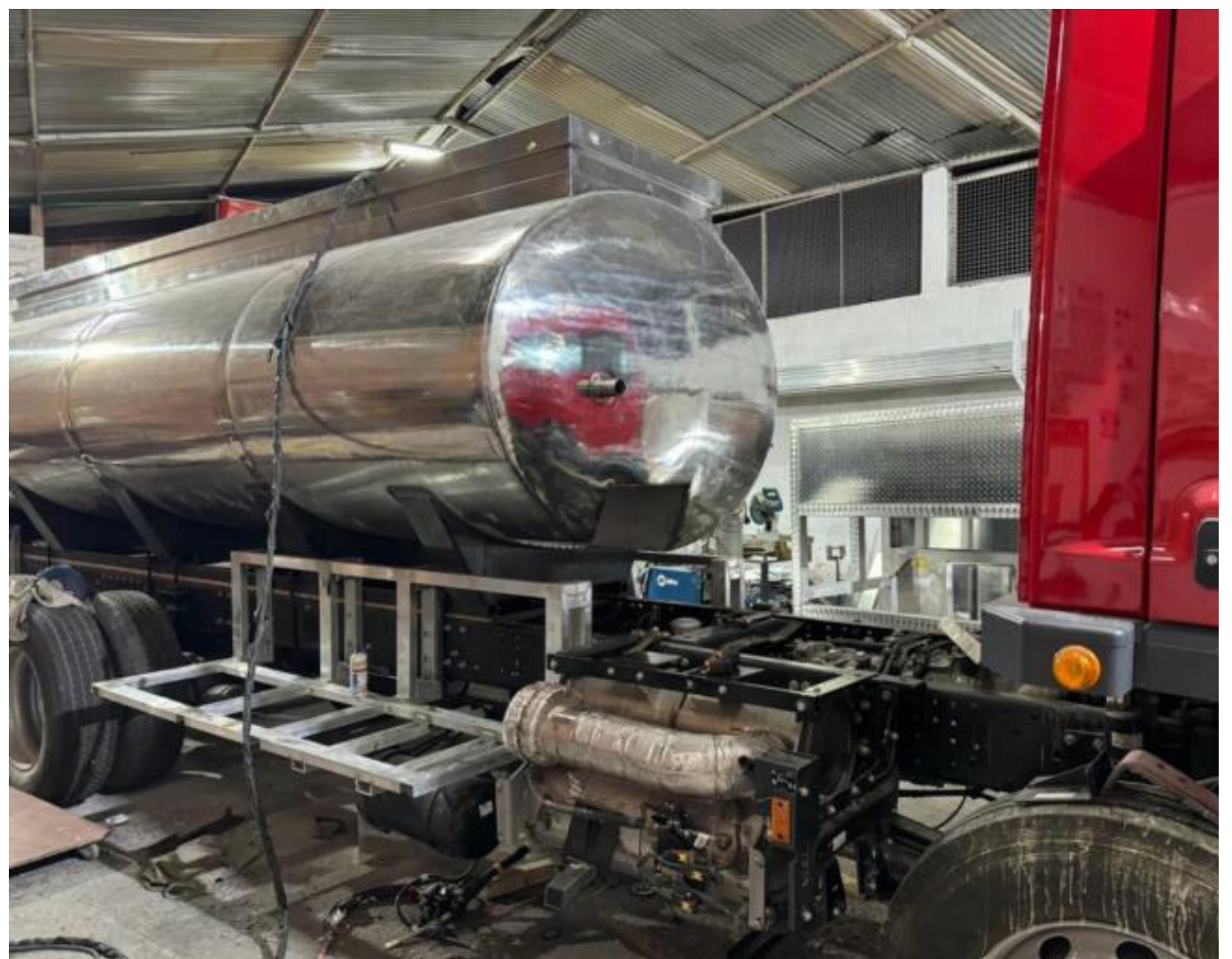
La Procuraduría Regional del Huila ha iniciado una investigación sobre el proceso de adquisición y entrega de los vehículos bomberiles, buscando esclarecer posibles irregularidades.

Este hecho ha generado preocupación y ha llamado la atención de la Procuraduría Regional del Huila, que ya ha requerido a la Gobernación del departamento para que entregue toda la documentación relacionada con la compra de los vehículos. El escándalo en torno a esta situación ha despertado una serie de interrogantes sobre la transparencia y legalidad del proceso de adquisición.