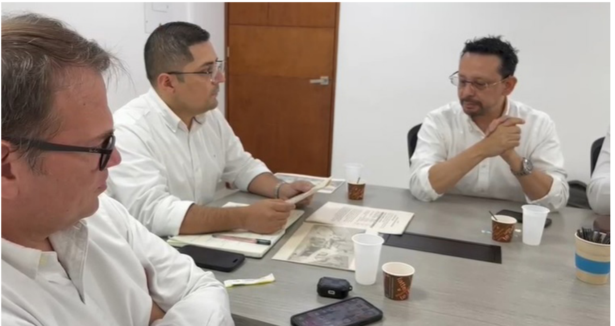
Representantes de instituciones prestadoras de salud y autoridades se reunieron en la jornada de trabajo en Neiva.

Por otra parte, las instituciones prestadoras de salud (IPS) y las que prestan servicios al Magisterio se llevaron el segundo lugar por detrás de las EPS como las responsables de recibir más tutelas, con el 4.92%. Le siguió el sistema de salud de las Fuerzas Militares y de Policía, con el 4.47%.