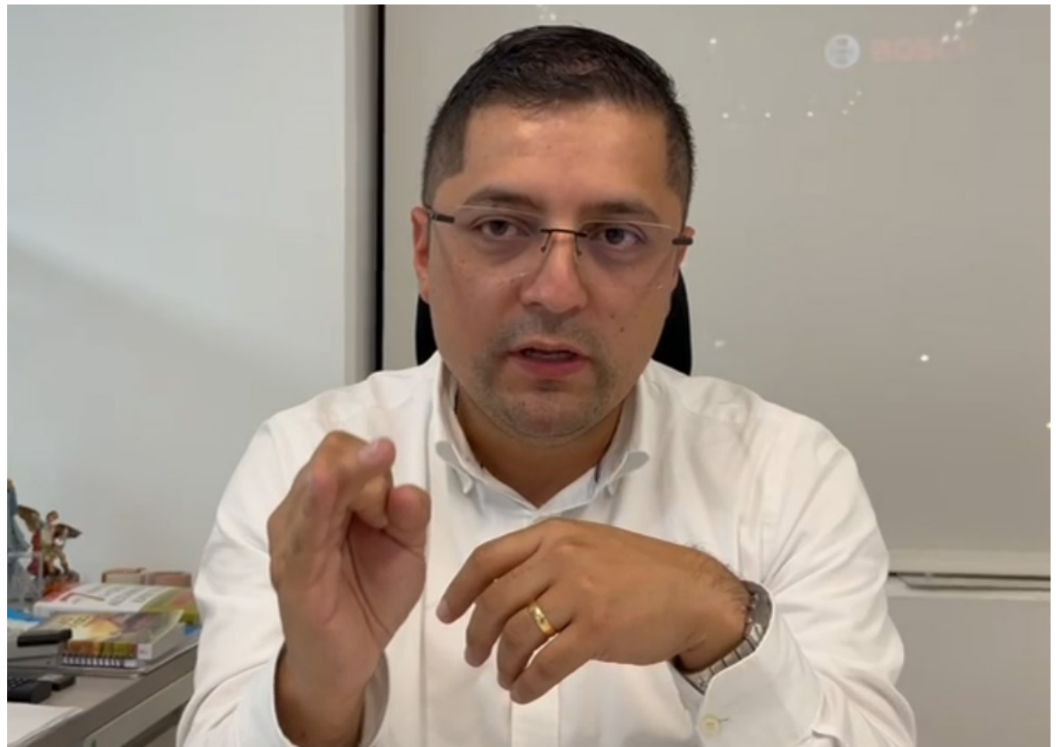
El Agente Especial Interventor, Duver Vargas Rojas, lideró la primera de cinco mesas de trabajo programadas en diferentes regiones del país para atender las quejas de los afiliados de EPS Sanitas.

La Defensoría del Pueblo reporta un aumento del 26.44% en las acciones legales por temas de salud.