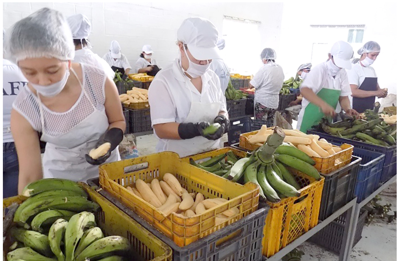
El municipio de Tello, es el principal productor de banano del Huila.

Según el burgomaestre, esta municipalidad es la primera en fabricación de banano del Departamento. “Sin embargo, la mayor producción la tenemos en el café, contamos con alrededor de 3.000 hectáreas del cultivo. En este sentido el convenio interadministrativo, va a beneficiar a todas las familias caficultoras”.