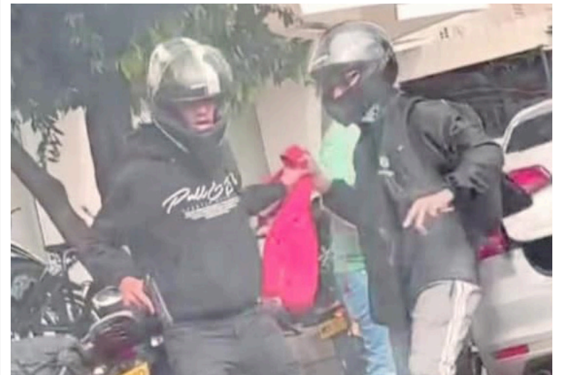
Los sujetos iban tras los 30 millones de pesos que la víctima había retirado minutos antes.

Minutos después de esto, llegaron al lugar dos uniformados de la policía, quienes encontraron a la víctima herida y siendo auxi-