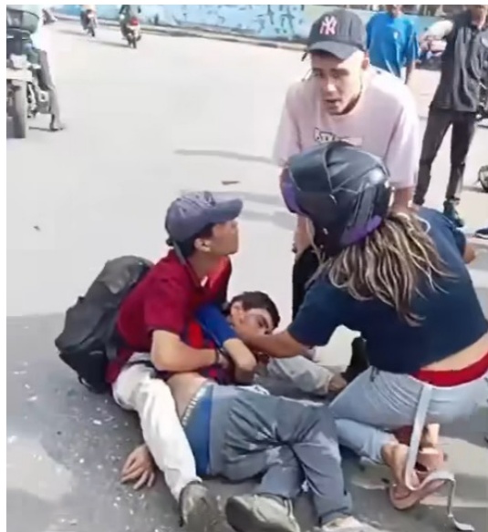
Un peatón resultó herido en el múltiple accidente.

Unidades de tránsito estuvieron a cargo del levantamiento del croquis del accidente.