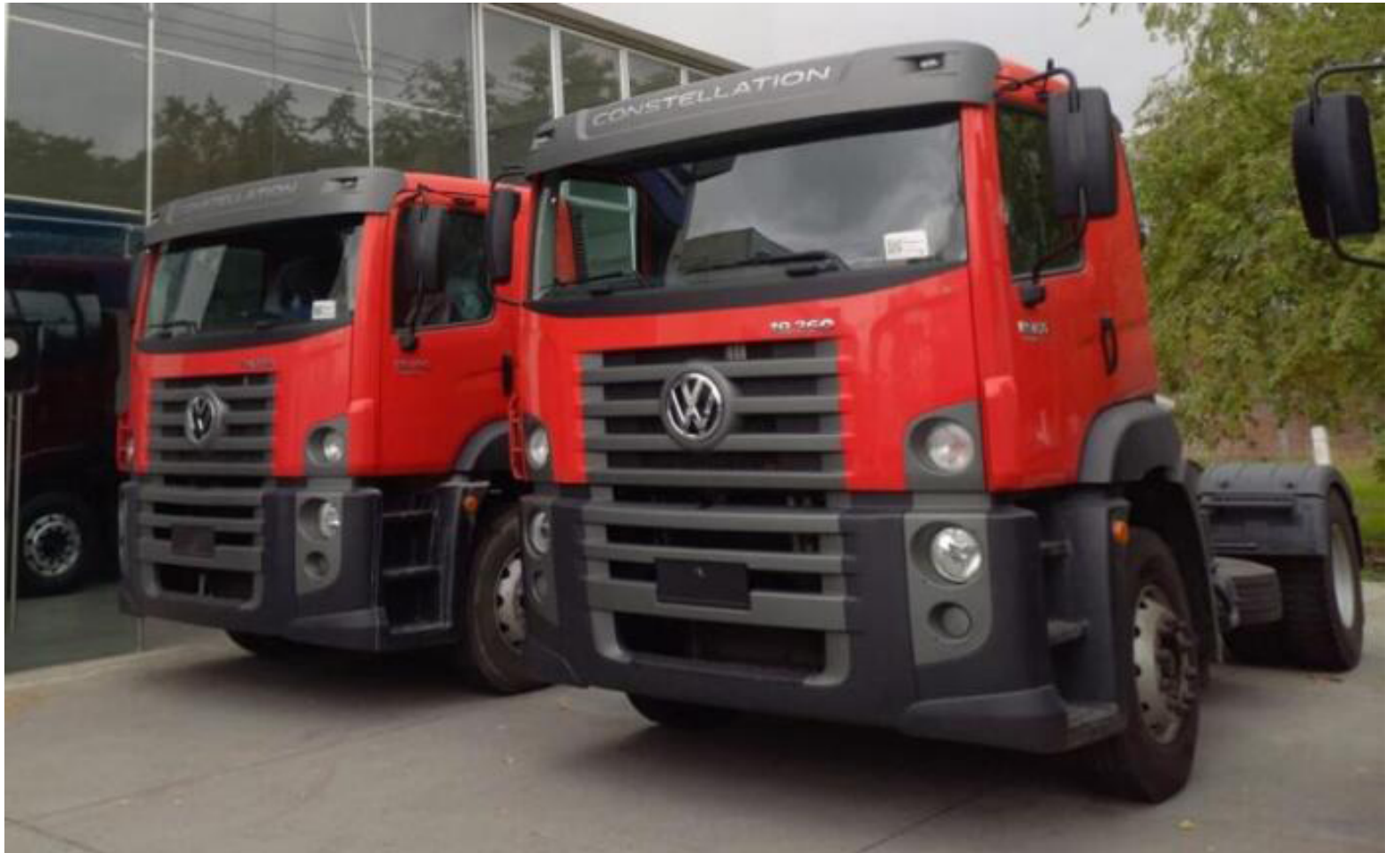
Los vehículos bomberiles adquiridos para el Huila han generado controversia debido a su adecuación y entrega.

Departamental de los Cuerpos de Bomberos del Huila, expresó su descontento con la situación: “Nos sentimos insatisfechos porque el gobierno dice que ejecutará el contrato tal y como fue dise-