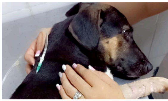
Los neivanos no denuncian el maltrato animal