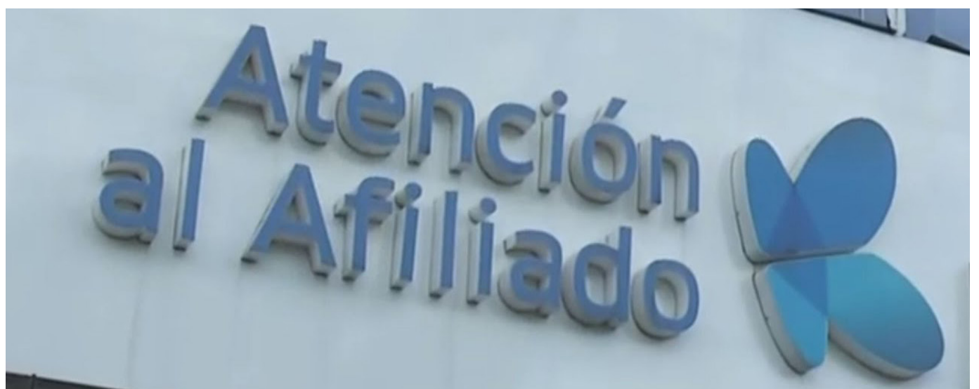
La ciudad de Neiva fue seleccionada como punto de partida para el recorrido nacional de la EPS Sanitas, siendo el escenario donde se realizó el primer ejercicio de socialización con instituciones prestadoras de servicios de salud.

La EPS, intervenida por el Gobierno Nacional, busca disminuir un 50% las reclamaciones antes de su intervención.