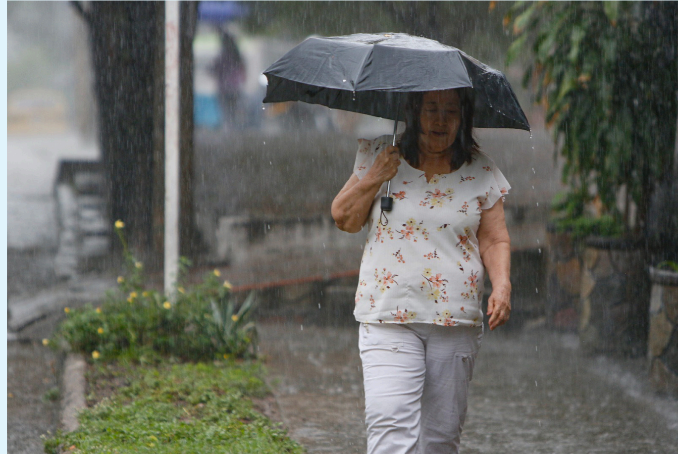
Por la temporada de más lluvias que vive el país, 613 municipios están en alerta por deslizamientos, de los cuales 267 se encuentran en alerta roja, un número que ha venido aumentando en los últimos 5 días, principalmente en la región Andina.

En ese sentido, Susana Muhamad señaló: "Vamos a tener condiciones de amenaza importantes que se presentarán a partir de julio. Hoy tenemos condiciones de vulnerabilidad en los territorios luego de una sequía deriva-