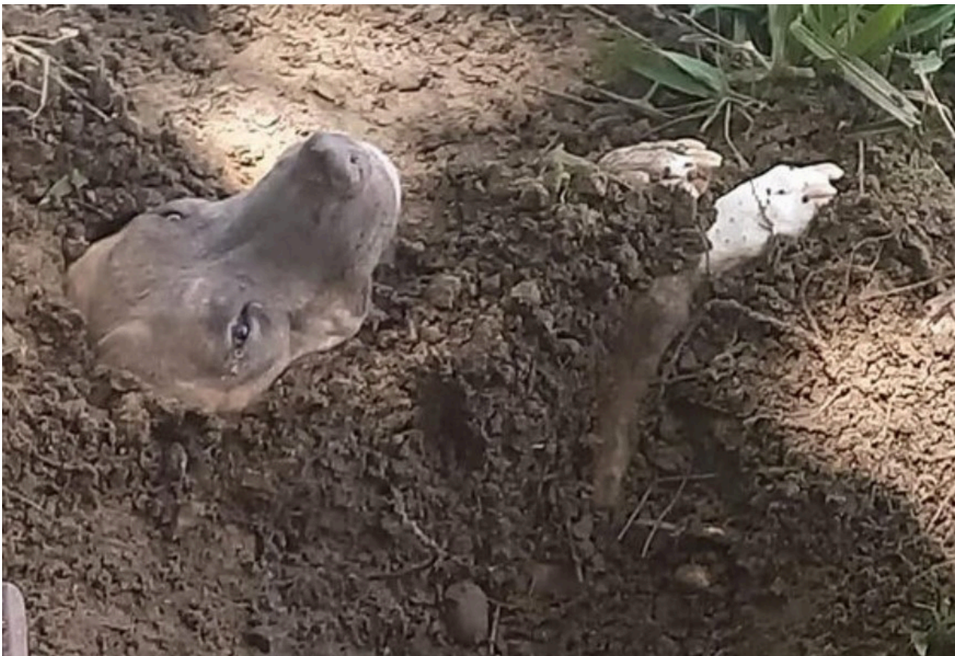
Así encontraron a un canino en Neiva.

Destacado 2. "Es importante trabajar entre todos los actores de la sociedad, para que la gente conozca este tipo de iniciativas, encaminadas no solamente a lograr la denuncia, sino en crear conciencia en la ciudadanía de la protección de los derechos de los animales", destacó el psicólogo.