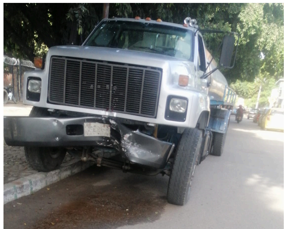
Este es el carrotanque que generó el múltiple choque en Santa Isabel.