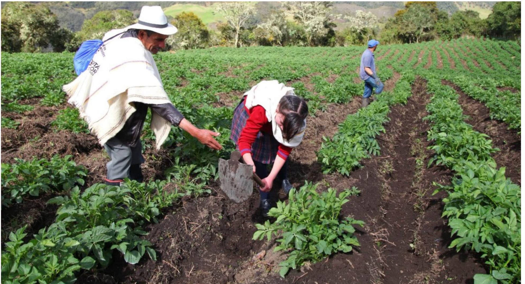
La reindustrialización del campo es uno de los objetivos del Gobierno Petro.