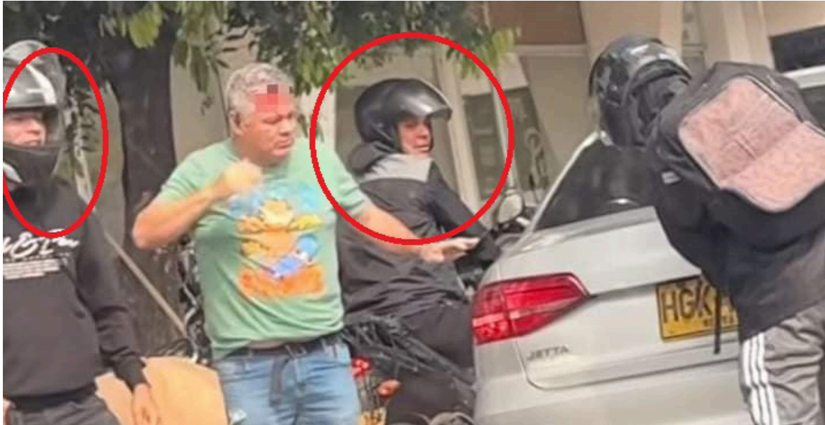
Gracias a los vídeos grabados por la comunidad, se puede observar el rostro de 2 de los 4 delincuentes.

■ Un nuevo caso de inseguridad se registró en el barrio Calixto Leiva de la capital opita, sujetos en motos y con armas de fuego detuvieron el tráfico durante varios minutos, mientras cometían su fechoría.