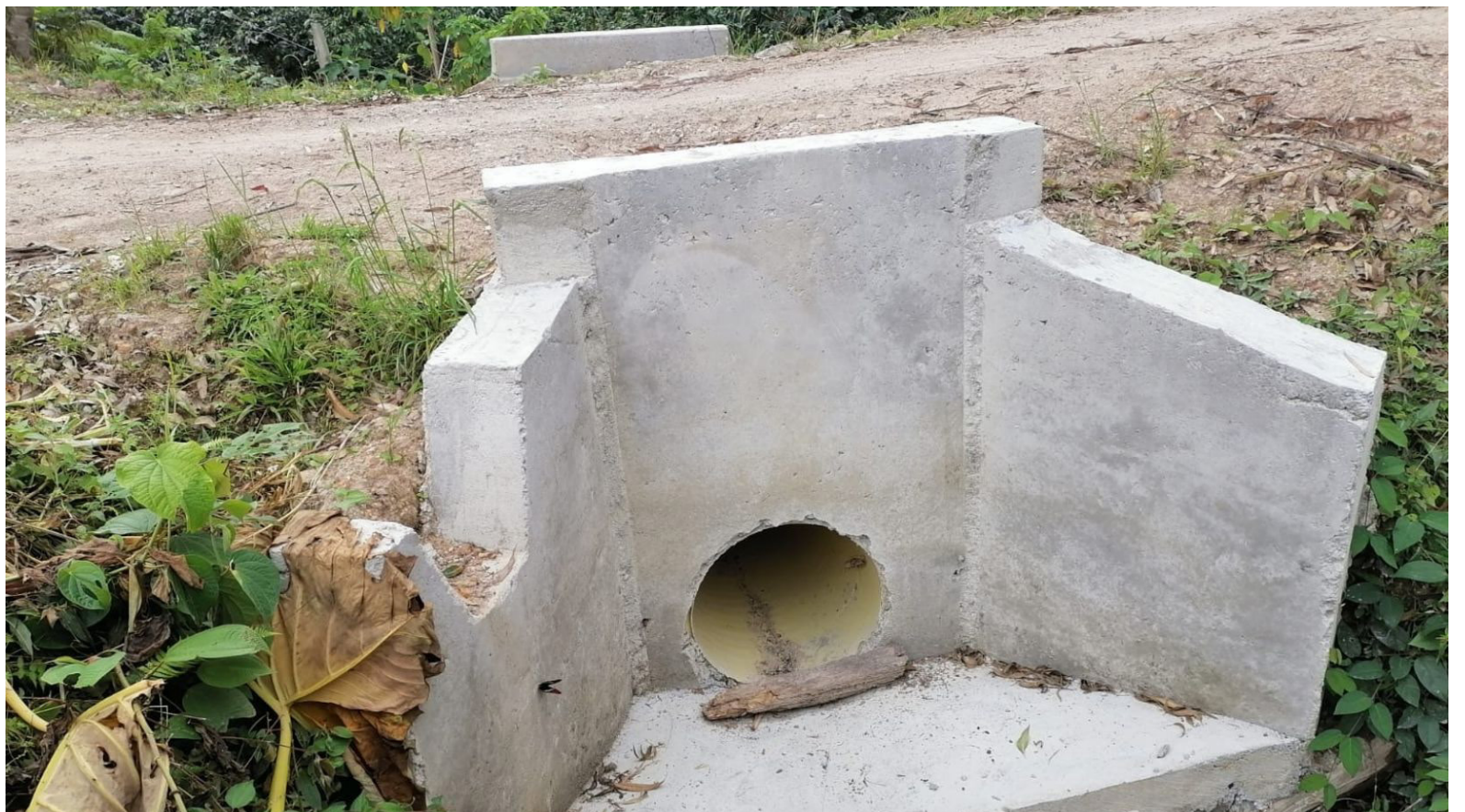
La construcción de las alcantarillas, beneficia las vías terciarias.

Asimismo, se creó la Dirección de Seguridad y Convivencia Ciudadana, conforme a la Ordenanza 003 del 5 de abril de 2024, esta dirección, adscrita a la Secretaría de Gobierno, Asuntos Comunitarios y Seguridad, tiene como misión principal coordinar, articular y controlar el proceso de seguridad y convivencia ciudadana, paz, derechos humanos y atención a víctimas en el departamento.