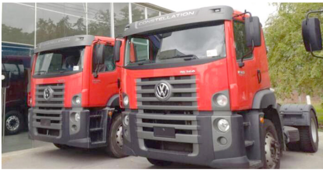
'Embolatada' entrega de vehículos bomberiles