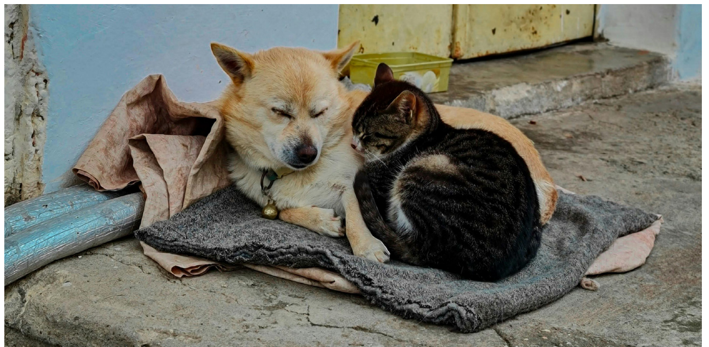
Entre 2019 y 2022 la población de gatos y perros en Colombia pasó de 8.3 millones a más de 11 millones.

Y al preguntarle al ‘animalista’, Oscar Páez, lo relacionado con denuncias, señaló: “en cuanto al número de casos registrados, no se tiene por dos situaciones, la primera es que la ciudadanía no tiene la cultura de la denuncia...”