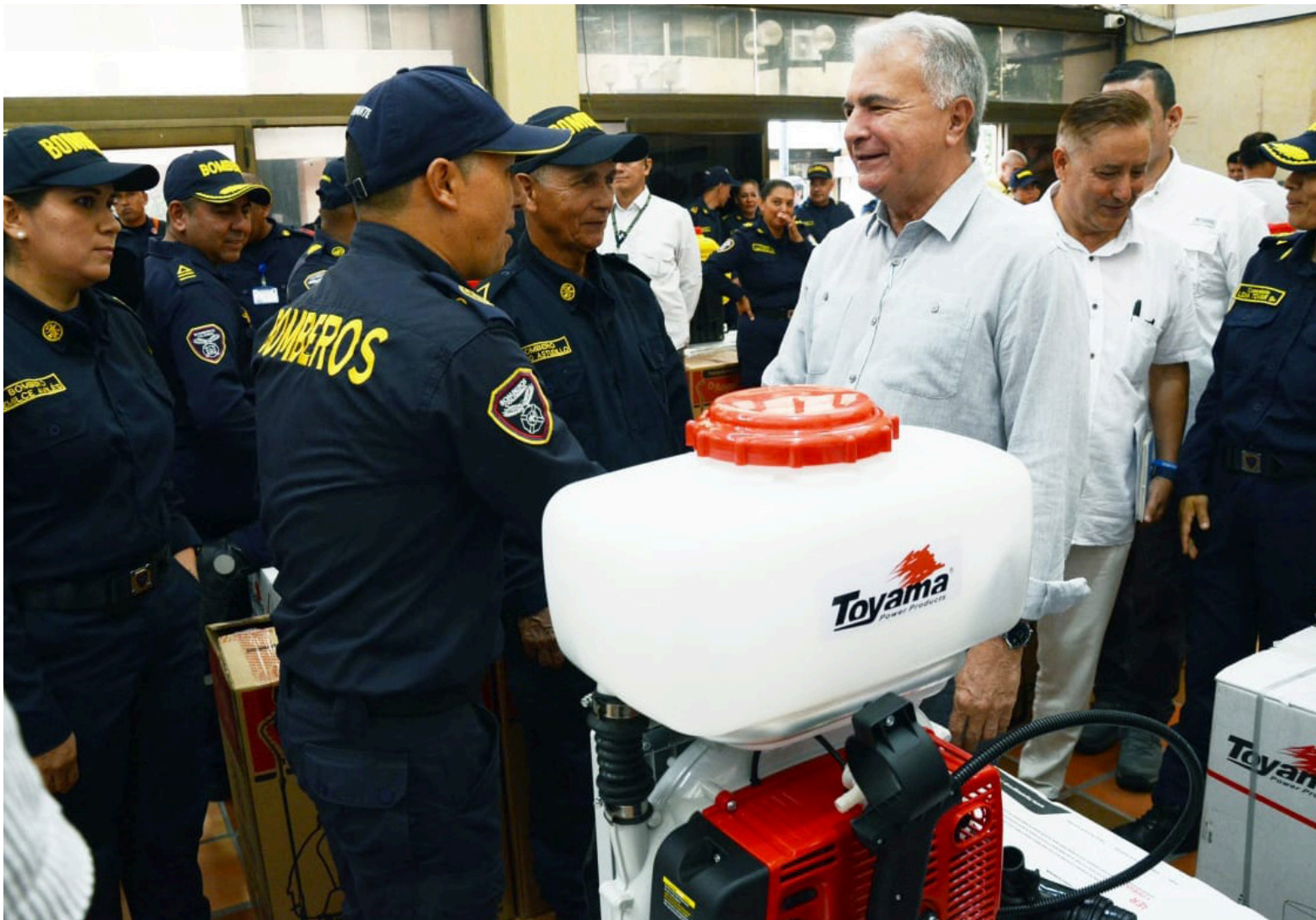
Los vehículos destinados a fortalecer los cuerpos de bomberos del Huila fueron recibidos en el almacén del Departamento, pero su entrega final sigue siendo un tema de debate.