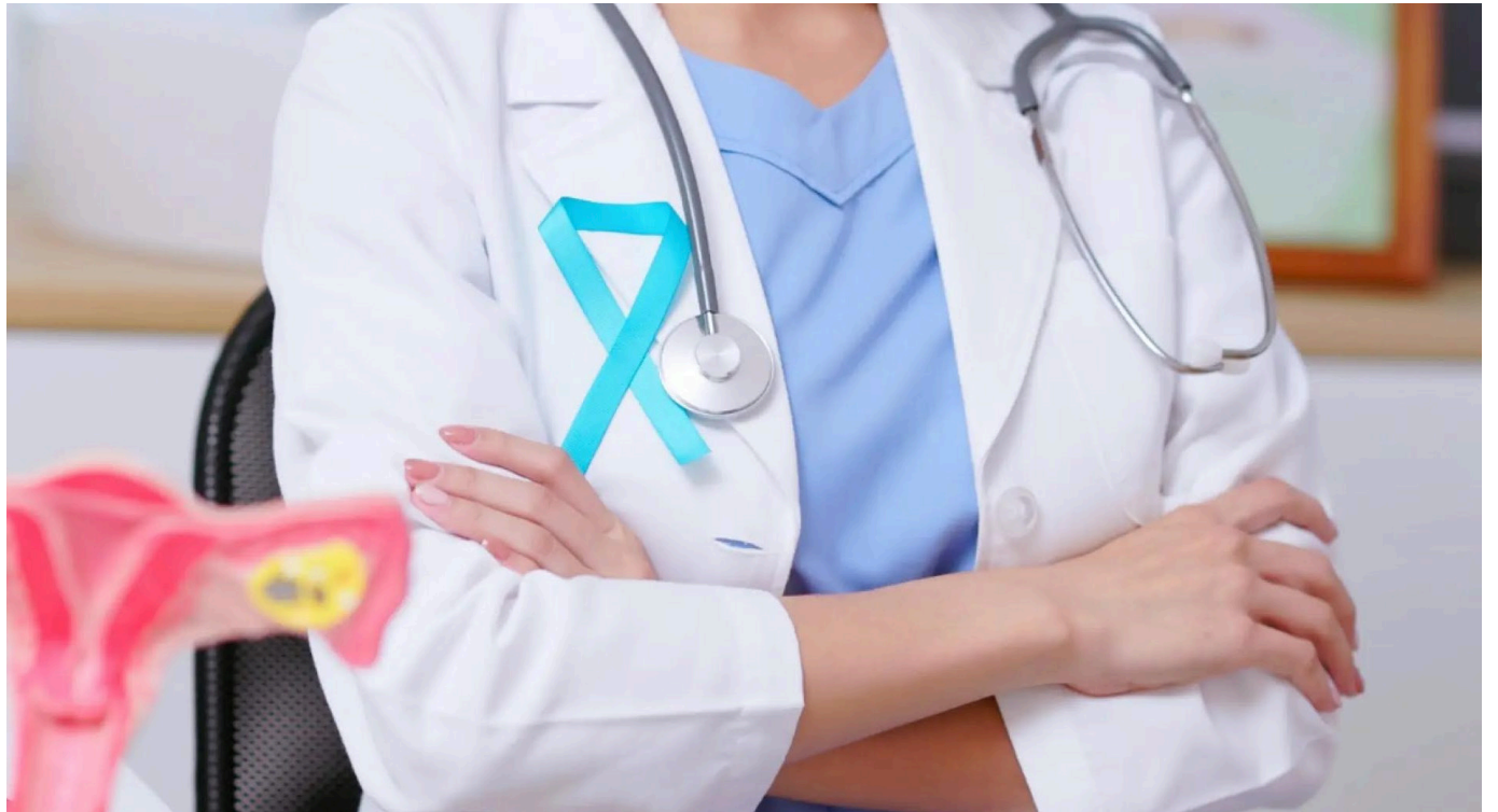
Dado que una de las causas del cáncer es el exceso de estrógenos, se intenta nivelar con otra de las hormonas femeninas, la progesterona.

Para ese grupo de mujeres en edad fértil afectadas por un cáncer de endometrio y con deseo de tener hijos se abre una nueva vía de tratamiento, una investigación liderada por el Hospital La Fe de Valencia, con el fin de preservar el útero.