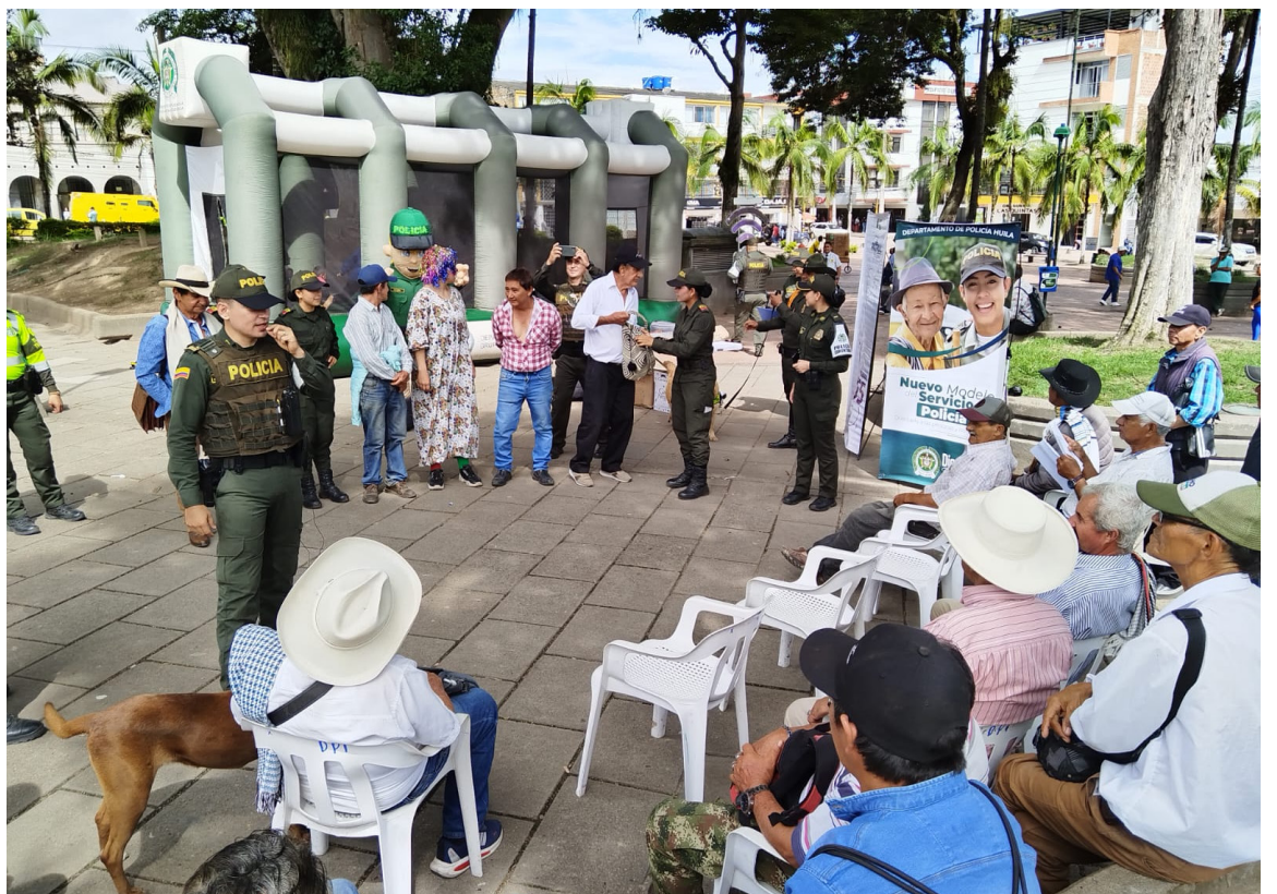
Policía realiza actividades lúdicas y de prevención en el parque principal de Pitalito, luego del gran operativo contra el tráfico local de estupefacientes. La policía recupera estos espacios para que la ciudadanía comparta con en familia.