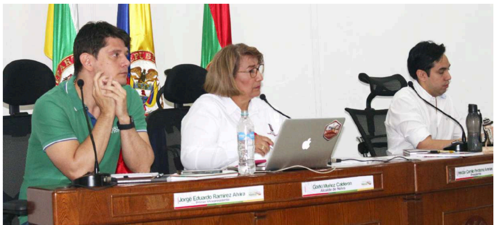
El espacio se aprovechó para realizar llamados importantes a la rectora del Alma Mater

“Tenemos que revisar la normatividad y pensar en una infraestructura tecnológica para tener una educación virtual de calidad y llegar a todas las regiones no solamente del Huila sino del país. Estamos haciendo un estudio de pertenencia de los programas académicos para ver cuáles son los que deben continuar y cuáles son los programas nuevos que se necesitan en la región. Yo hice un informe real de lo que hizo la universidad en el año 2021 y creo que es bastante positivo. No se trató como tal, pero de pronto la no inversión total en los recursos del año 2021 se debió a la pandemia y los paros que impedían hacer muchas cosas”, puntualizó la rectora de la Surcolombiana.