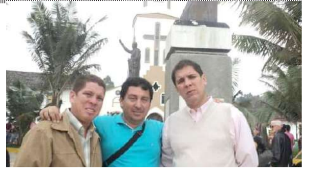
Preparador físico de origen huilense triunfa en el Salvador