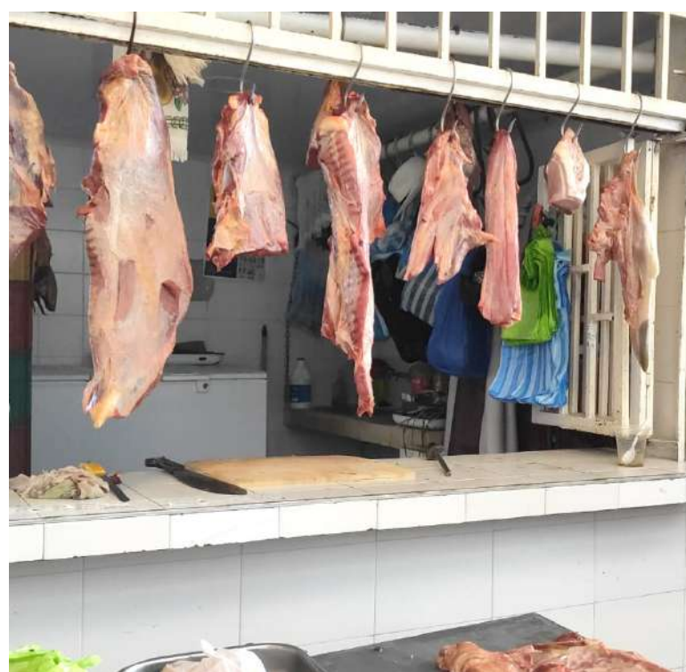
Esa informalidad ha traído incómbete de alteración de precios y problemas sanitarios

Precisamente, esa informalidad ha traído incómbete de alteración de precios y problemas sanitarios que en últimas es lo que se bus-