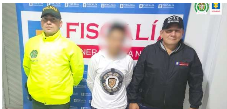
Capturado por abuso sexual