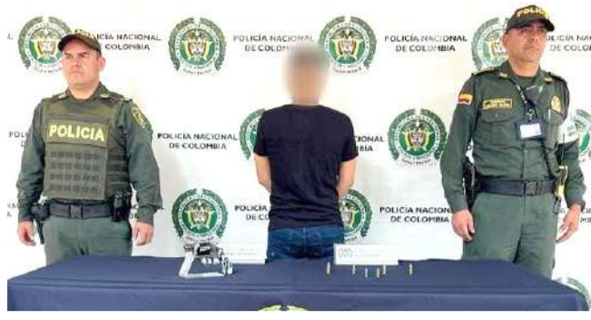
Capturado menor de edad en Neiva