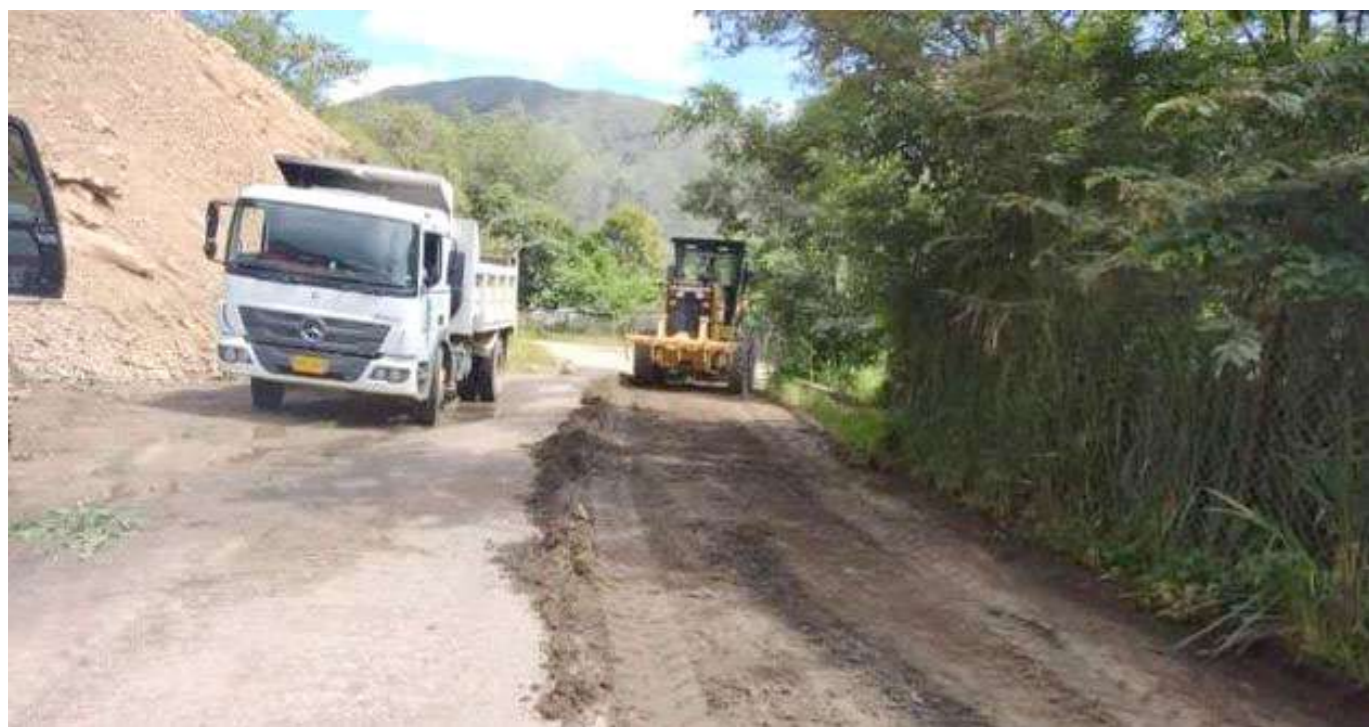
Cada quien aportó lo que estuvo a su alcance.

Los integrantes de la minga que inició el pasado fin de semana en los municipios de Palermo y Santa María, se sintieron motivados al ver que desde el domingo llegó maquinaria pesada de la Secretaría de Vías del departamento, con lo que se pudo agilizar los trabajos y continuar con lo proyectado desde que iniciaron, para Solarte esto ha sido valioso pese a algunos inconvenientes como que la máquina cargadora se varó el domingo por cuatro horas, pero con el esfuerzo de todos cree que los trabajos culminarán este sábado.