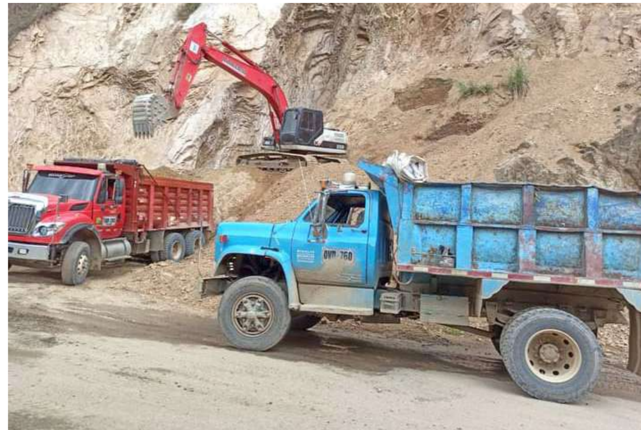
La gobernación se unió a este esfuerzo de la comunidad

Aprovechó Solarte para recordar que con trabajo conjunto y el esfuerzo de todos se logran los objetivos, “esto de las mingas ha entregado excelentes resultados, ya mencioné lo de Teruel, lo más reciente en el sector de la Lupa con cuatro días de trabajo y soluciones viales importantes”, añadió