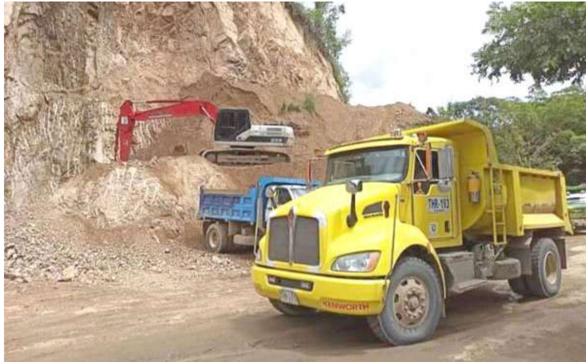
Unión de esfuerzos para rehabilitar la vía los Guásimos-Palermo-Santa María.

■ Con participación de las comunidades y el apoyo del sector marmolero se comenzaron los trabajos de rehabilitación de la vía entre Palermo y Santa María en especial desde el sector de Guásimos, el propósito es poner en mejores condiciones este importante corredor vial que se ha visto afectado por el invierno.