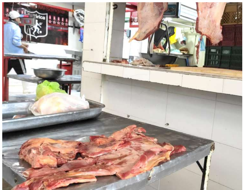
El panorama para la industria cárnica a nivel mundial, nacional y regional, es alentador

Ante esto Fedegán pidió al gobierno controlar la intermediación que el gremio denomina “ociosa” porque rompe la cadena productiva de la carne y, además de eso, especula con los precios de este alimento básico en la ingesta de los colombianos.