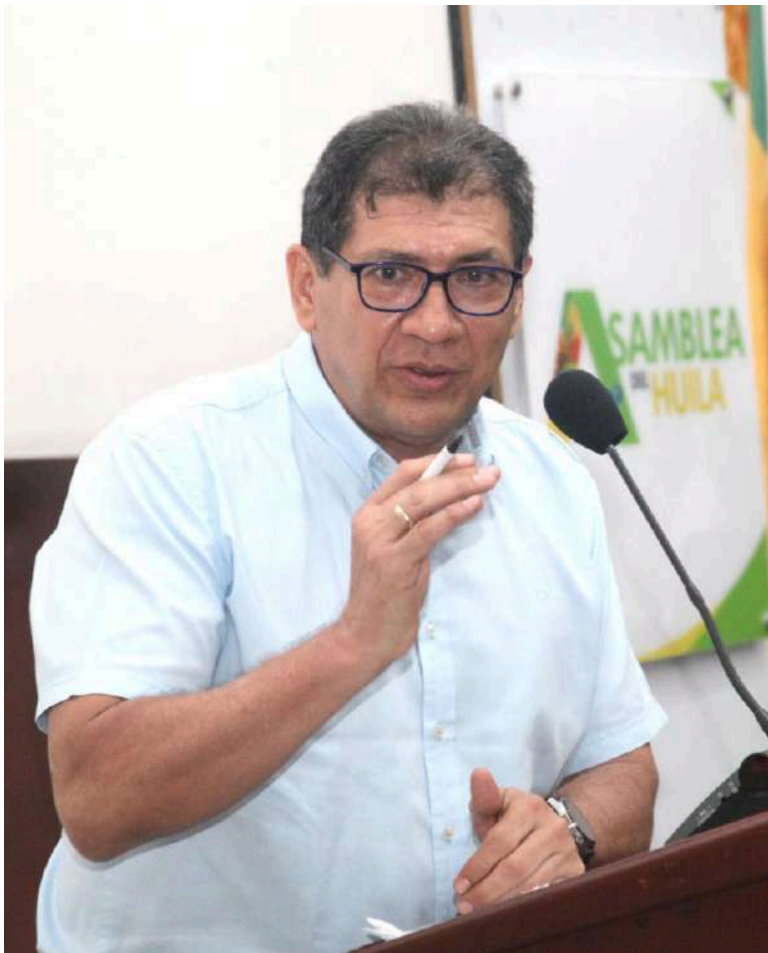
El secretario de Salud del departamento aseguró que la responsabilidad para con el proyecto es absoluta.

Lo que se ha querido evitar, de acuerdo con lo dicho por el funcionario, es que no haya pluralidad de oferentes por desfinanciación del proyecto “no podríamos correr el riesgo de que presentáramos la ejecución y que no tuviéramos quién lo ejecutara”.