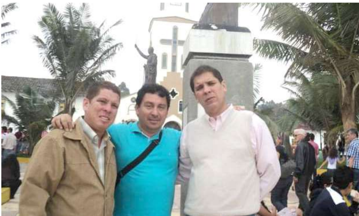
Acaba de celebrar el título con el Club FAS del Salvador.

Con orgullo represento a la comunidad de mi club Aston Huila, al departamento del Huila, al municipio de Neiva y a mi comunidad de educación física de la universidad surcolombiana.