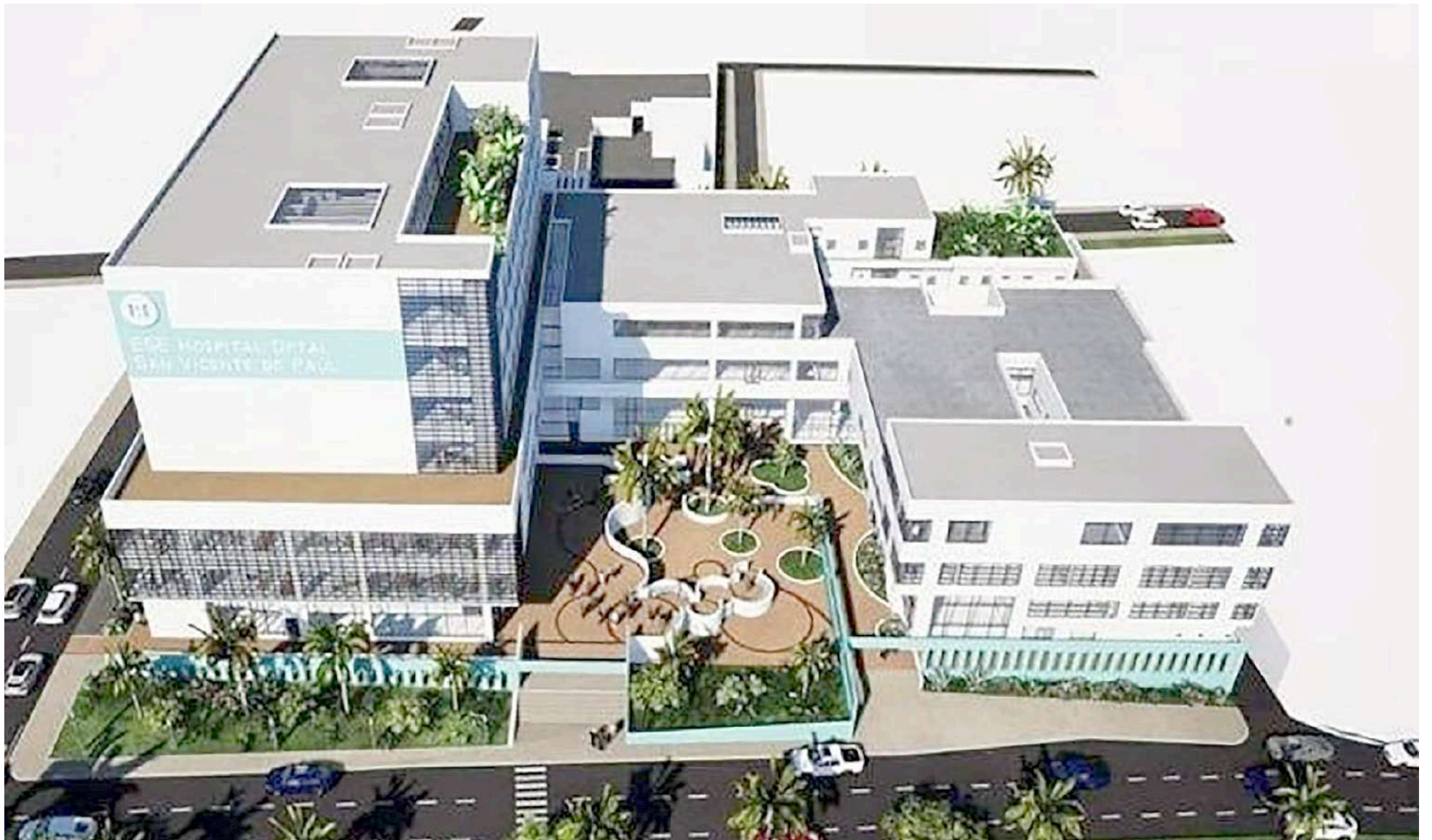
Maqueta del proyecto.

El proyecto está por un valor cercano a los $80mil millones de pesos y según lo dicho por el gerente “seguramente no necesitará más ajustes, pues los que se ganen el concurso, analizarán los cambios del mercados y correrán con los ajustes”.