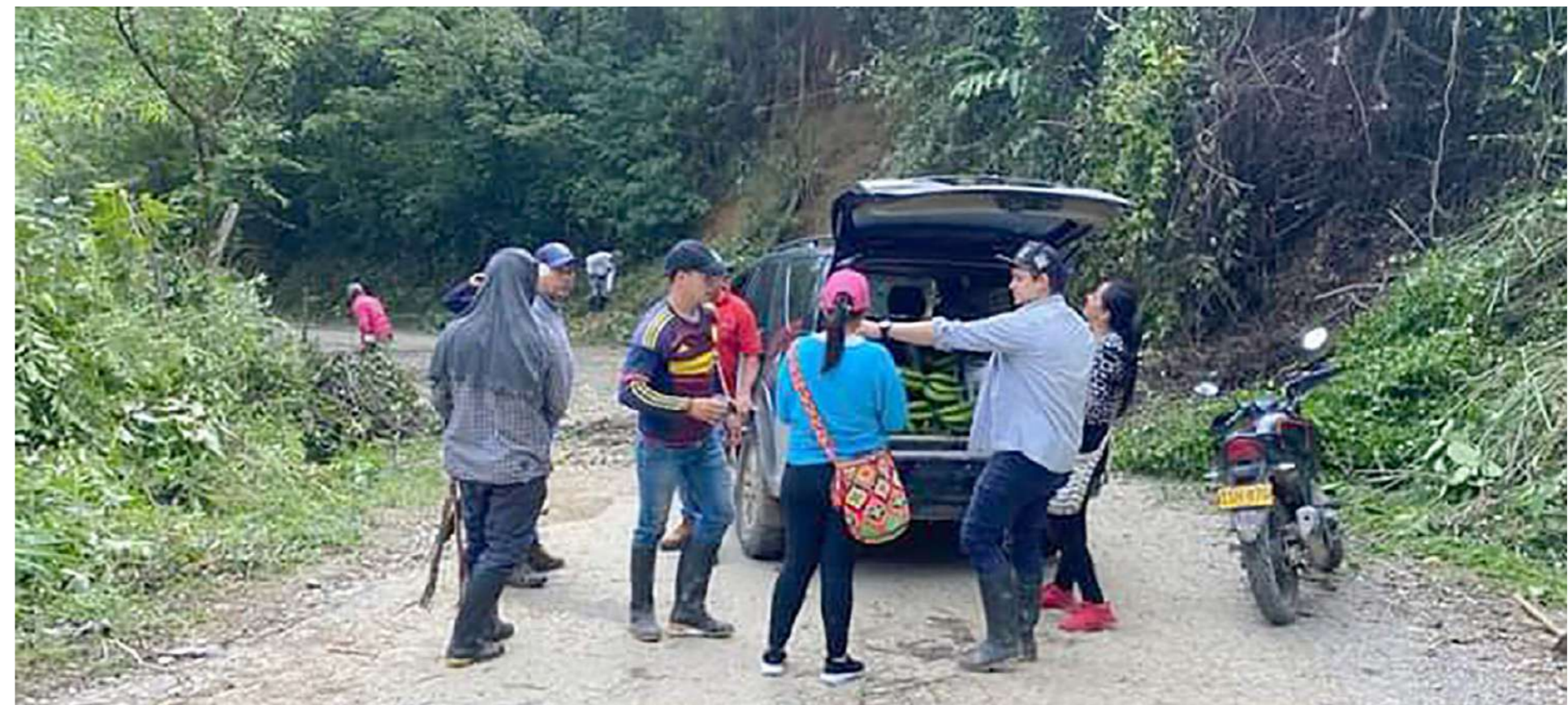
La unión hace la fuerza en estos trabajos conjuntos