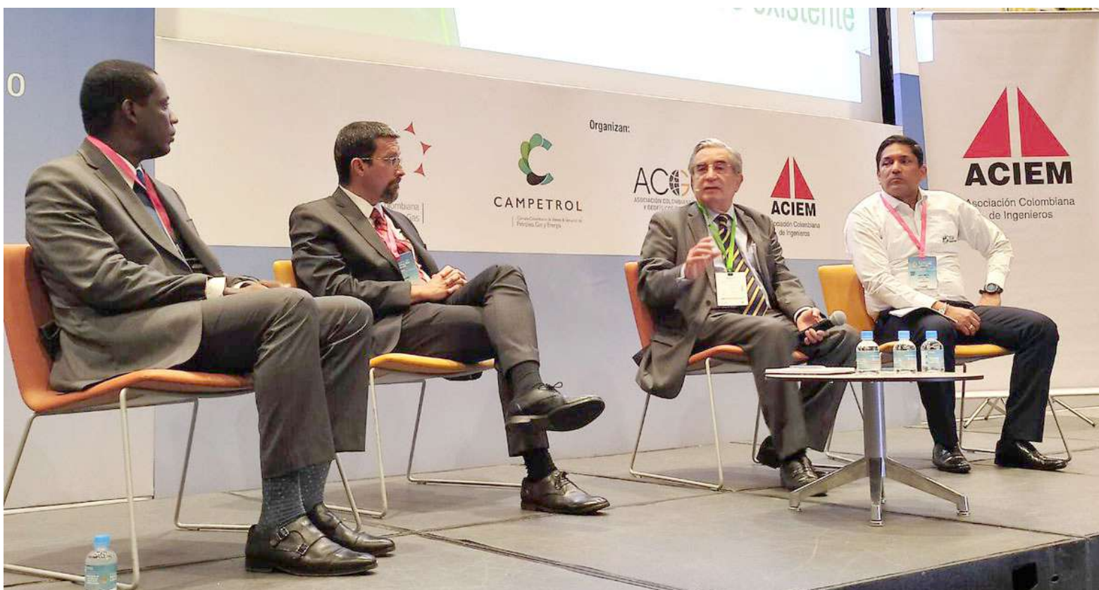
Instalación de agenda académica de la V Cumbre del Petróleo, Gas y Energía

Este evento es organizado por la Asociación Colombiana del Petróleo y Gas (ACP), la Cámara Colombiana de Petróleo, Gas y Energía (CAMPETROL), la Asociación Colombiana de Geólogos y Geofísicos del Petróleo (ACGGP) y la Asociación Colombiana de Ingenieros (ACIEM).