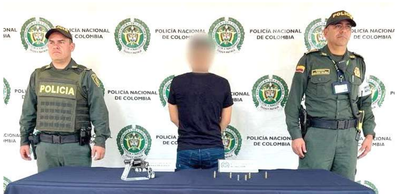
Menor de edad capturado.

Unidades del cuadrante 04 del CAI Cándido, en efectiva respuesta a denuncia ciudadana, logran en inmediaciones del barrio el Triángulo de la ciudad de Neiva, la aprehensión de un menor de 15 años.