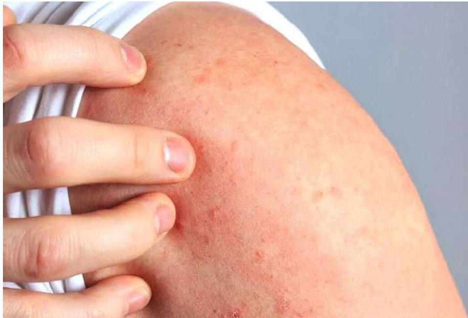
El enrojecimiento es un signo de inflamación

Si bien la inflamación se desarrolla en el cuerpo principalmente a nivel celular, está lejos de ser un mecanismo simple que ocurre de forma aislada. Se ha demostrado que el estrés, la dieta y la nutrición, así como los factores genéticos y ambientales, regulan de alguna manera la inflamación.