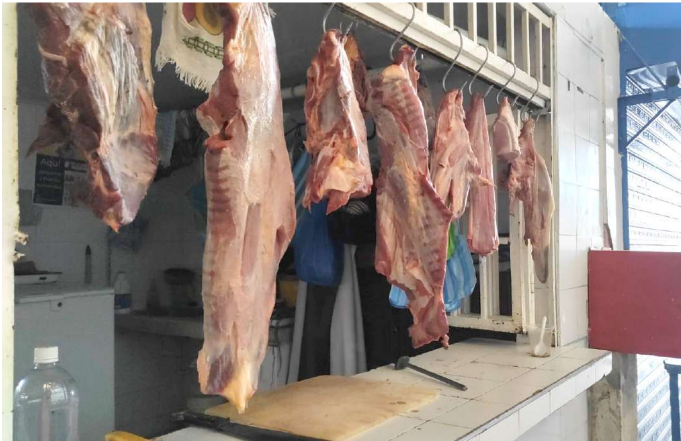
Producto cárnico por las nubes

sobre por qué ha subido tanto el precio de la carne y, yo la respuesta, se sintetiza en que existe un fenómeno de especulación muy clara. Evidentemente cuando el precio del novillo aumenta, al mismo tiempo sube el de la carne, pero cuando baja, como sucedió en junio, julio, agosto y septiembre, la carne, según el Dane, continuó con su tendencia alcista.