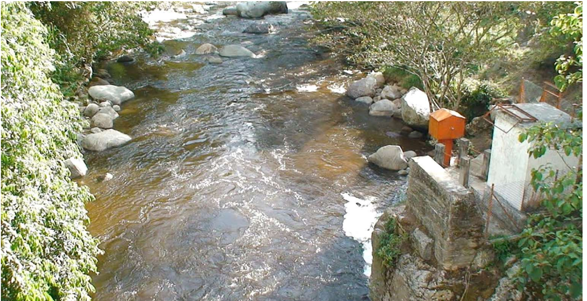
Desapareció en el agua

do. Al sargento no lo vimos sino un par de segundos y se perdió”, afirmó uno de los militares que habló para Diario Del Huila y que estuvo presente en el momento de la tragedia.