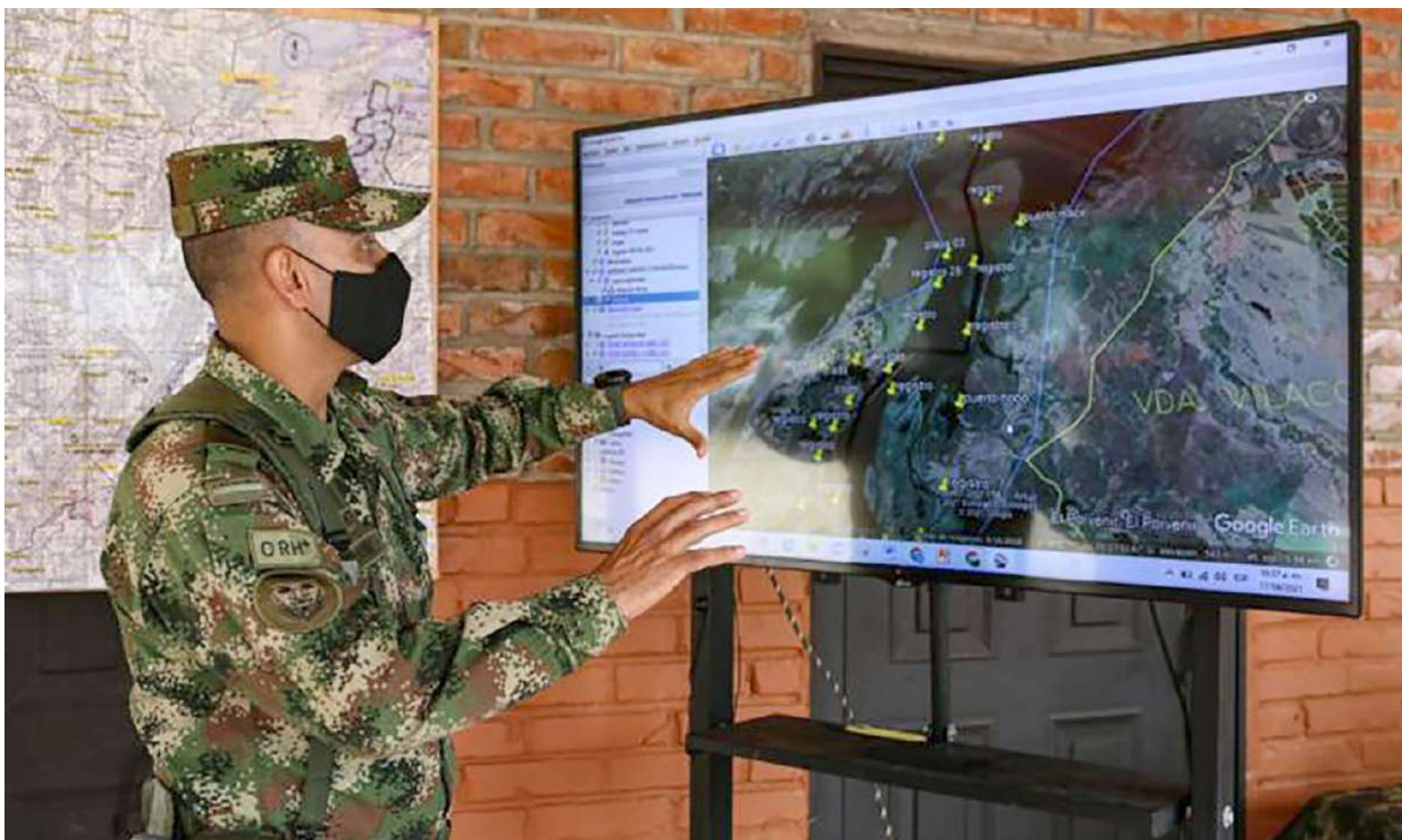
En tiempo real, miembros del Ejército monitorearon el río por más de 150 días, sin obtener respuesta.

“Mi sargento se quitó el equipo, el radio y solo se quedó con el uniforme, en el grupo había un soldado experto en desastres y operaciones de rescate y le advirtió que eso era peligroso, que lo mejor era esperar o que le permitiera a él tantear el terreno, pero mi sargento le dijo que no, que él lo hacía y que seguidamente nosotros (...) el bajó hasta la ladera del río y ni siquiera alcanzó a ponerse en posición, cuando ya había sido arrastrado, apenas estaba amaneciendo, el cielo estaba nublado y los minutos se hicieron horas, una vez ocurrió eso corrimos de inmediato para ayudarlo, pero nada fue suficiente; adicionalmente, no teníamos señal para informar a los superiores lo ocurrido, uno de los muchachos le tocó ir hasta un punto de la zona para agarrar señal y así notificar en la brigada lo que había ocurri-