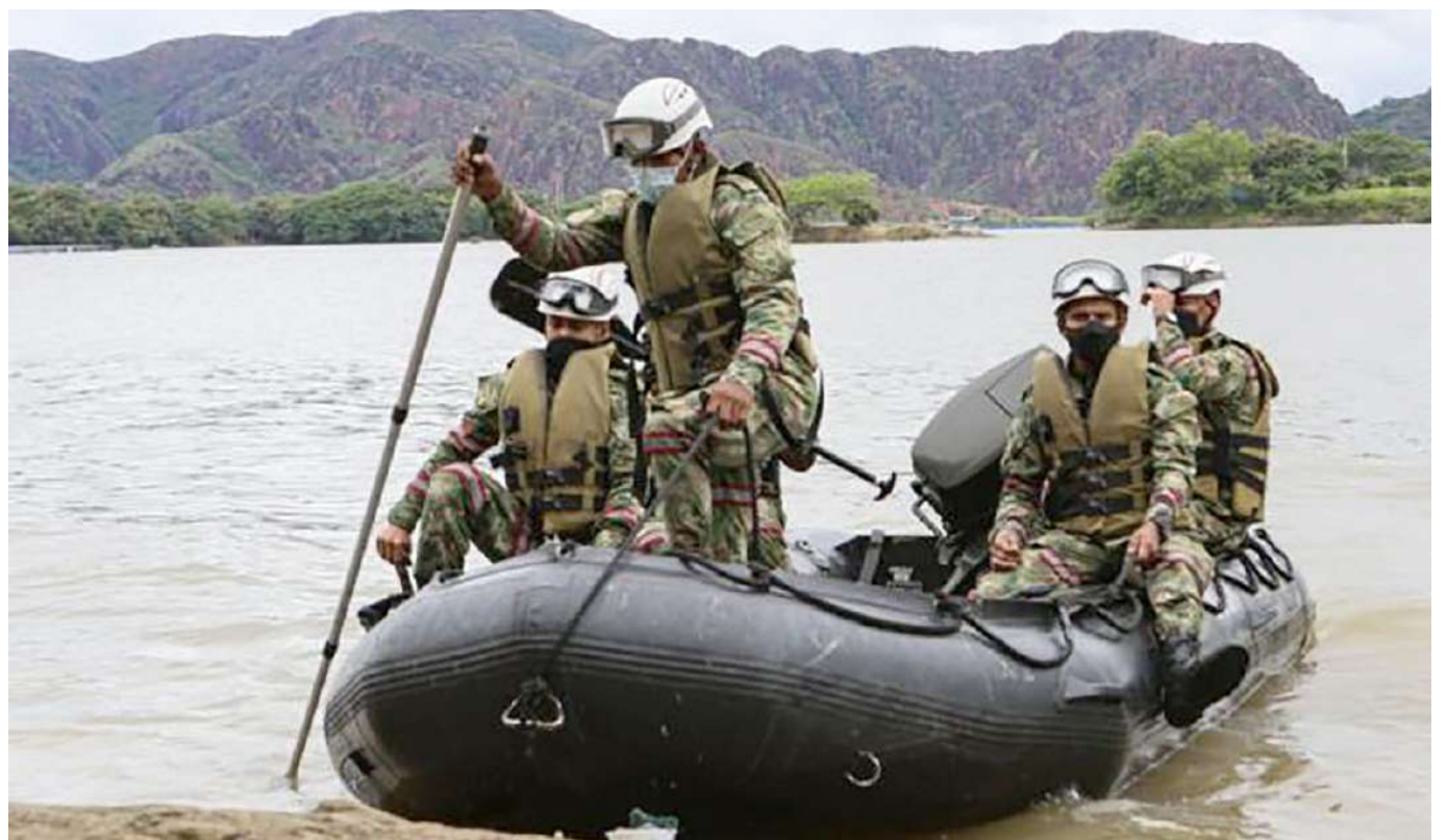
Por agua, tierra y aire, el suboficial fue buscado.

Del militar solo recuperaron la bota izquierda y su camiseta, pistas que no fueron suficientes para rescatar el cuerpo.