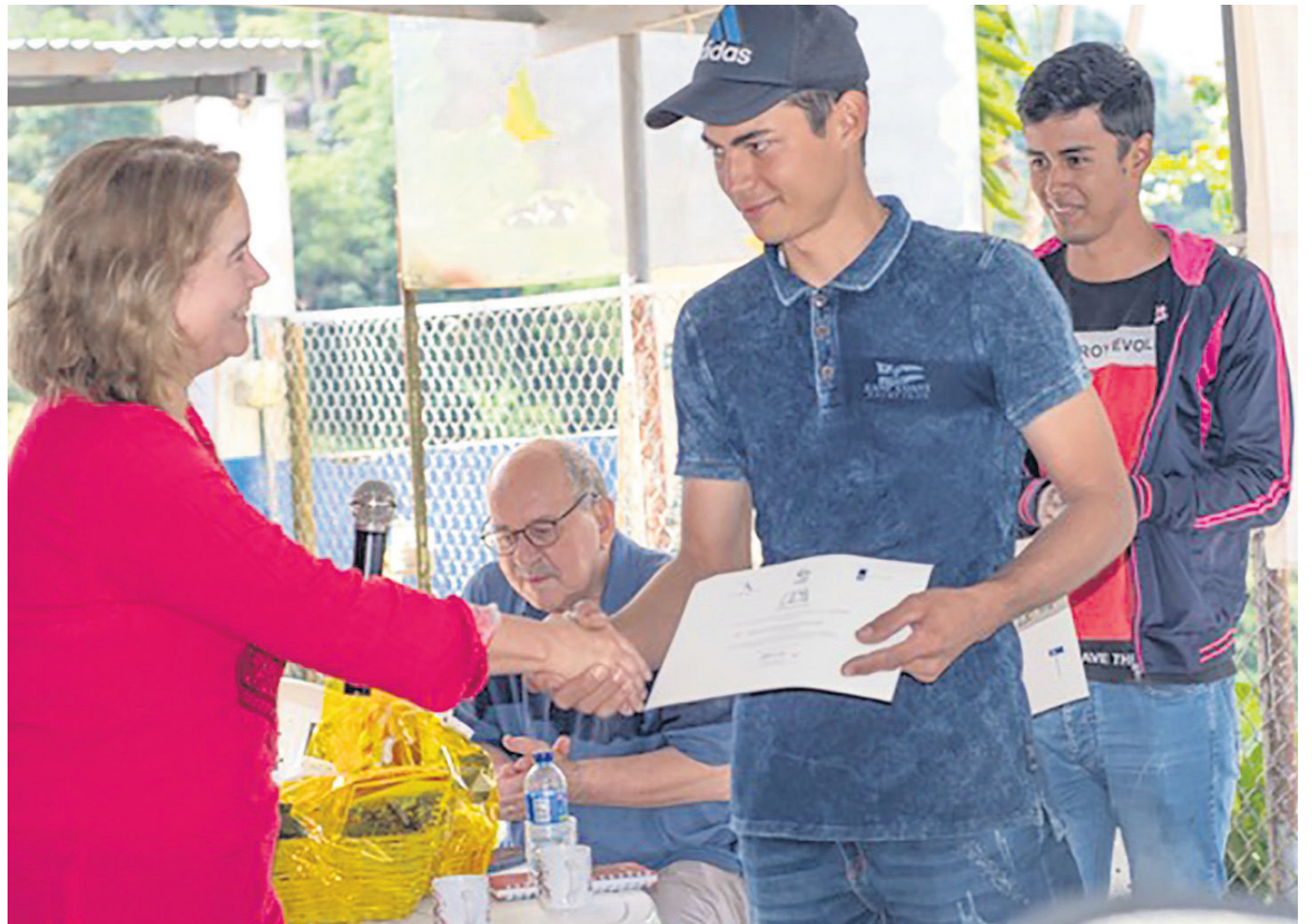
En la vereda El Batán, municipio del Hobo, la Administración Departamental, adelantó un proyecto piloto en titulación de tierras.