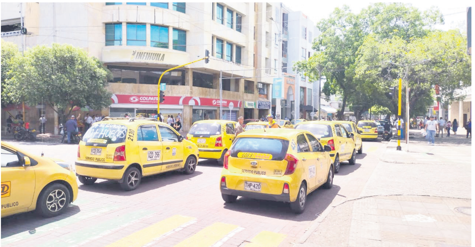
Ministro del Interior celebra acuerdo para revisar tarifa diferencial en el combustible para gremio de taxistas.

Por eso, no faltan los que critican que el Gobierno se apresure a tomar caminos que resultan más escabrosos que los mismos problemas que intenta solucionar.