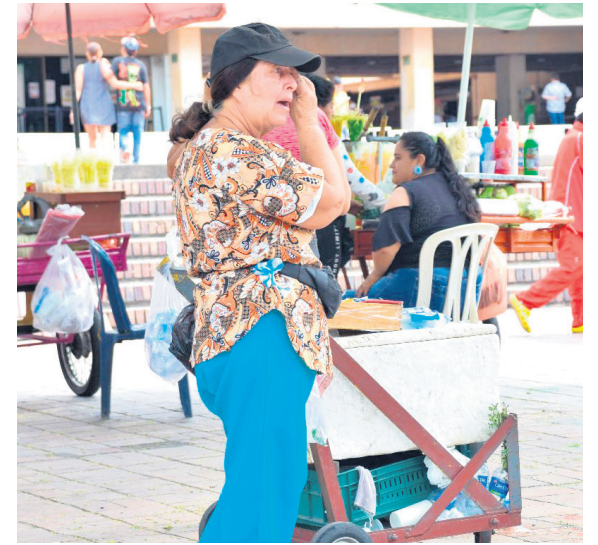
La ciudad de Sincelejo se destaca como la más afectada por la informalidad laboral en Colombia, con un asombroso 68,8% de su población trabajando en empleos informales, según el informe del Dane.

Desde 2021, la informalidad laboral en Neiva ha fluctuado en un rango que va desde el 43% hasta el 52% del total de personas empleadas en la ciudad. Las áreas con los niveles más altos de informalidad incluyen el sector del