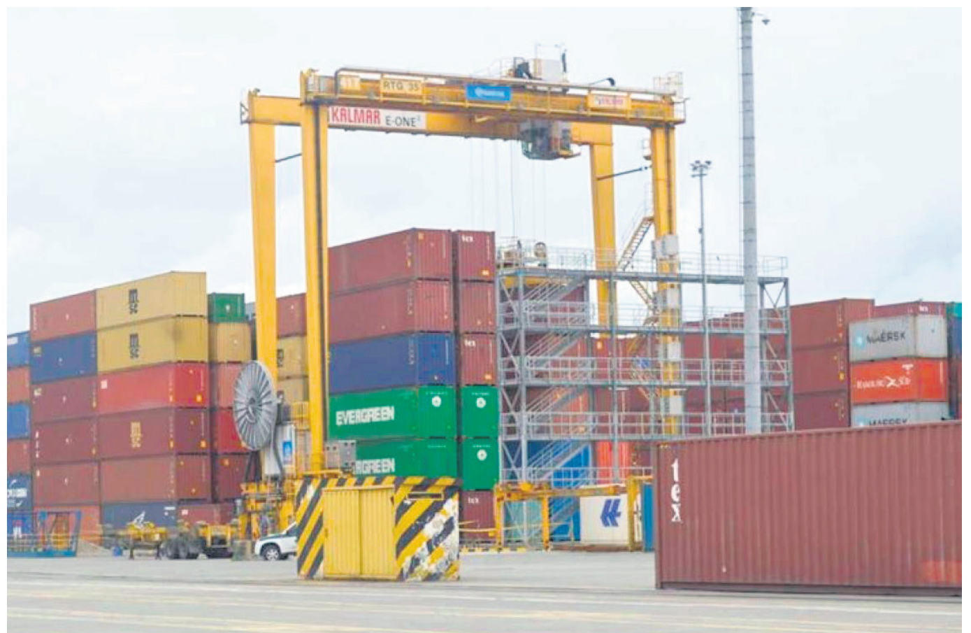
Colombia ha fortalecido sus lazos comerciales con Palestina a través de acuerdos bilaterales, lo que representa una dinámica comercial en crecimiento.

El futuro de las exportaciones de café de Colombia a Israel y las relaciones comerciales en general se encuentran en un estado de incertidumbre debido al conflicto reciente. A pesar de las tensiones políticas y diplomáticas, los expertos hacen un llamado a mantener un enfoque equilibrado que permita preservar los beneficios económicos de esta relación comercial mientras se resuelven las cuestiones políticas en juego.