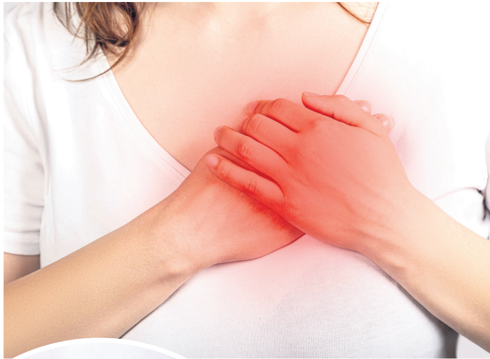
Los síntomas de las enfermedades cardiovasculares son variados.