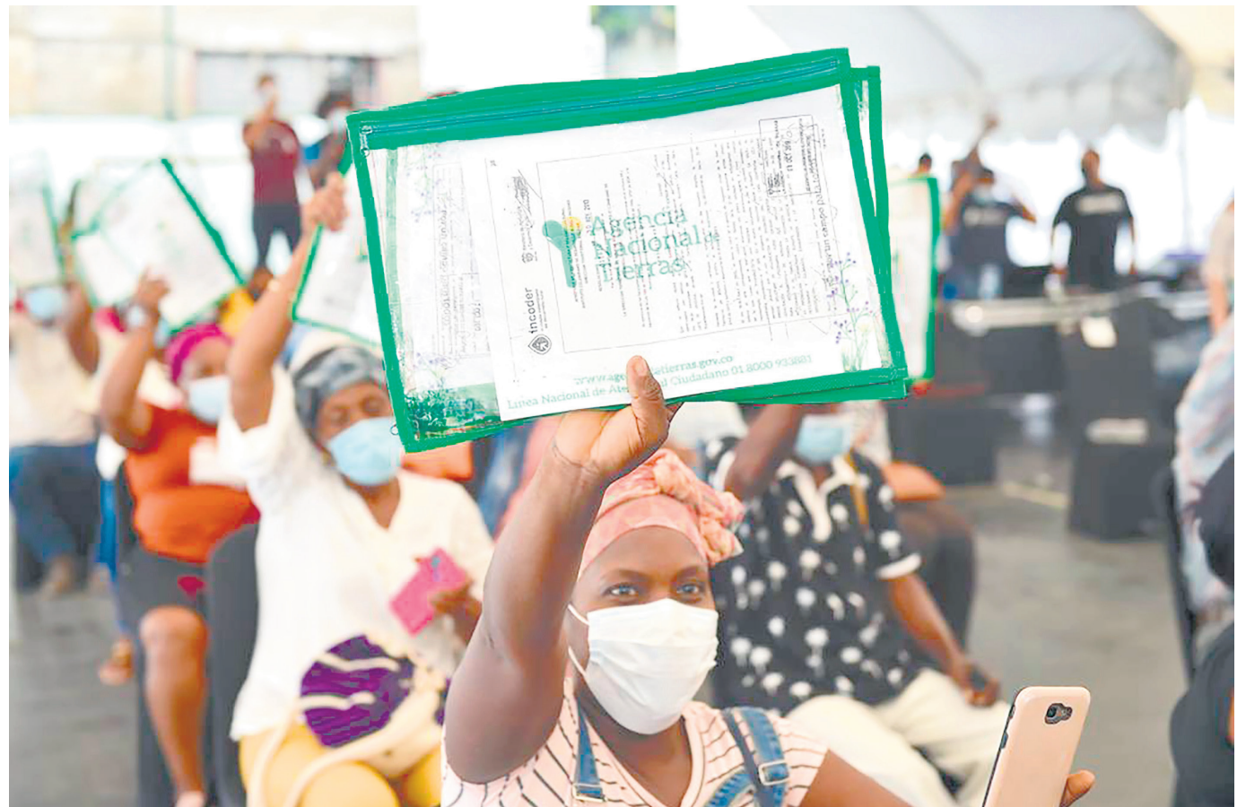
El presunto índice de informalidad de la tierra en el Huila, está en el 39.9%.