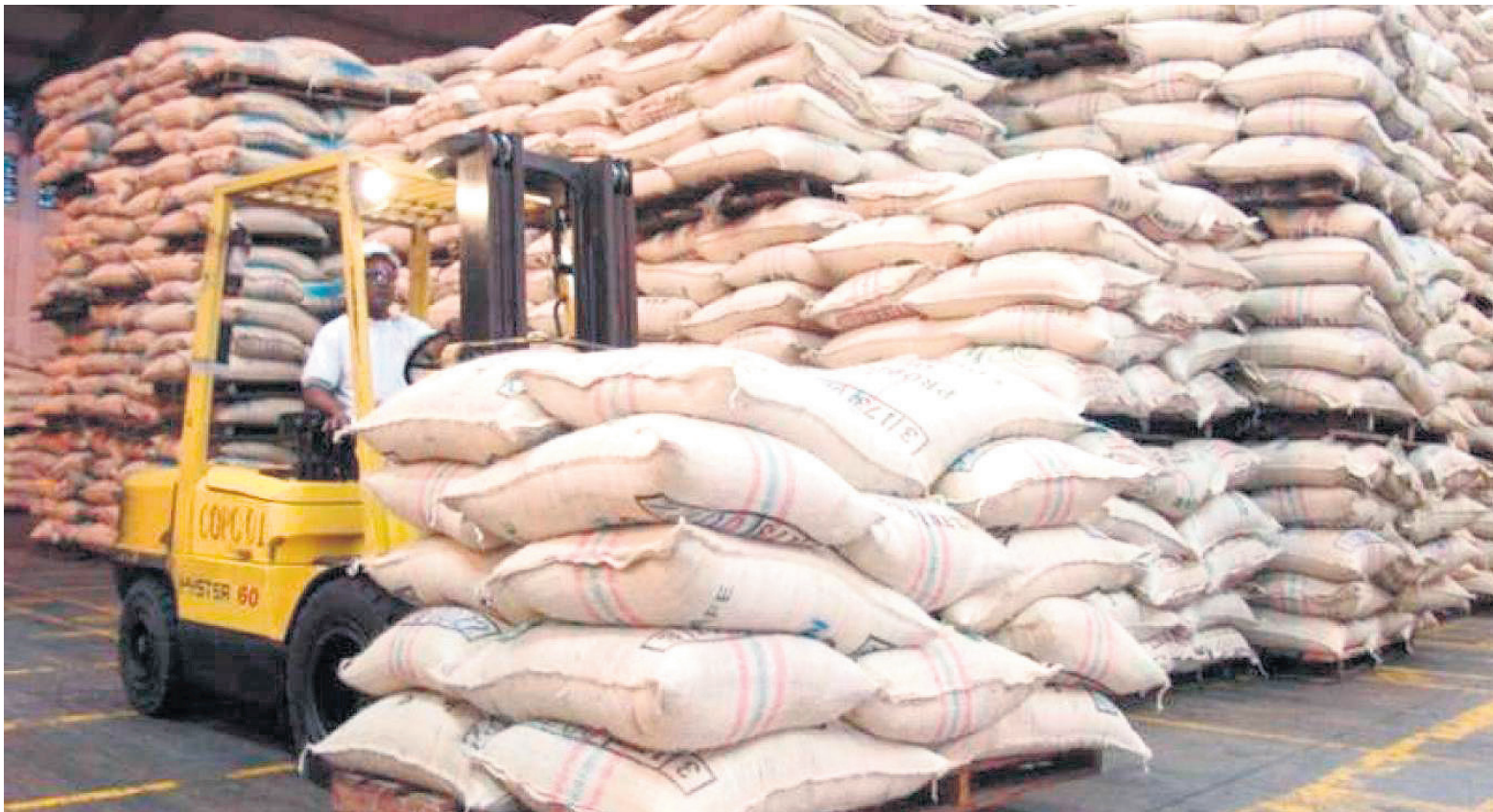
Las exportaciones de café colombiano a Israel han disminuido en medio de la incertidumbre causada por el conflicto en la región.