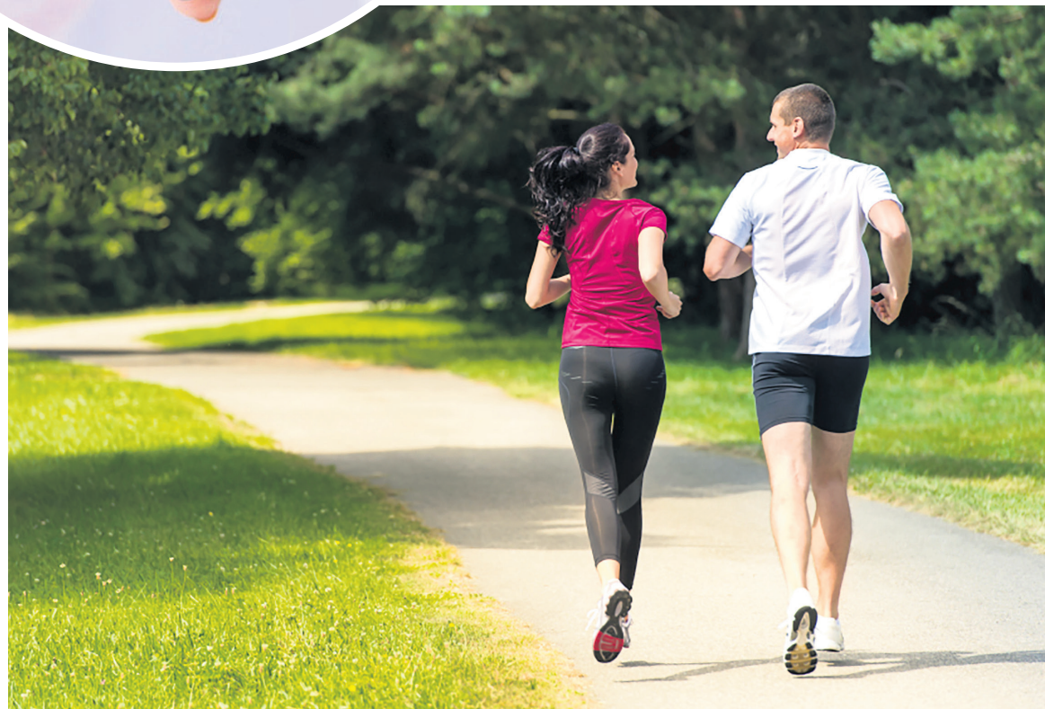
Para regular el colesterol alto y evitar problemas cardiovasculares es importante mantener una dieta balanceada.

Las enfermedades cardiovasculares representan una carga significativa para la salud de los colombianos y el sistema de salud del país.