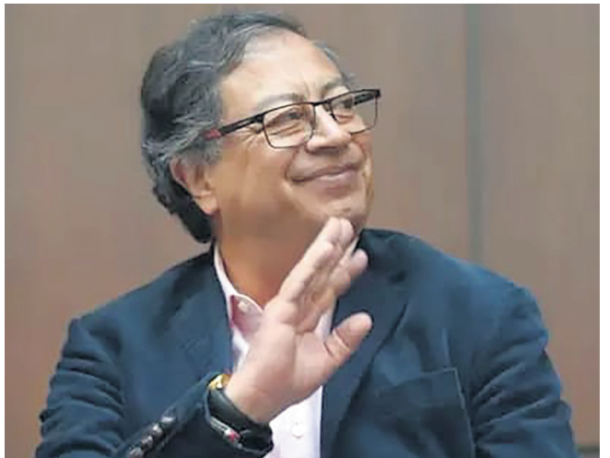
El presidente Gustavo Petro, solicitó máxima responsabilidad en los acuerdos.