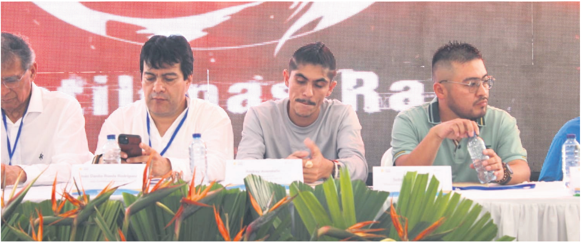
La Mesa de Diálogo, ya se instaló.