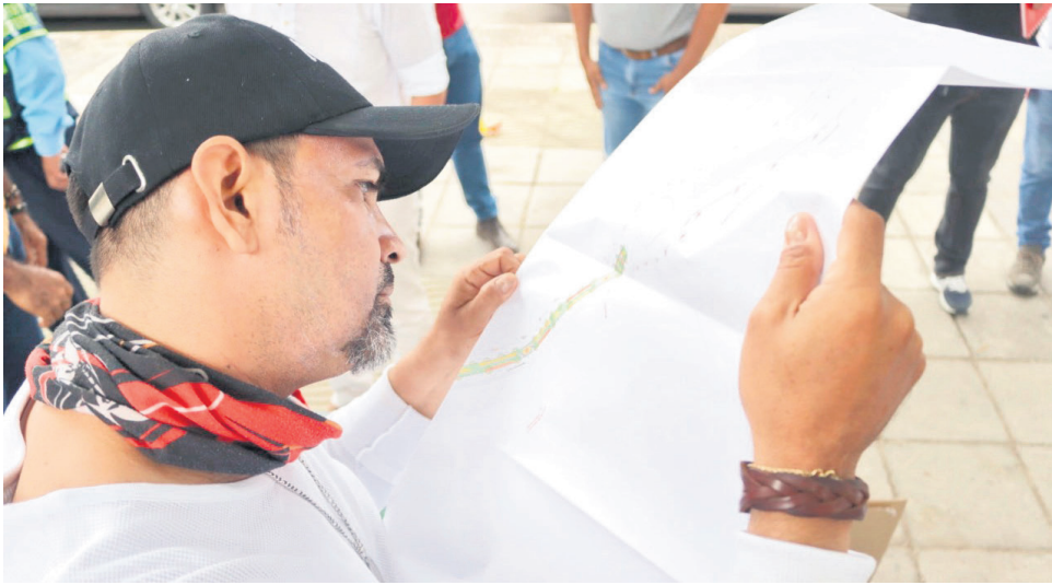
El informe del Dane muestra que, en Neiva, el sector de comercio y reparación de vehículos es una de las áreas con los niveles más altos de informalidad laboral.

junio a agosto 2023, la proporción de informalidad de las mujeres fue de 82,8%, mientras que para los hombres fue de 83,6%.