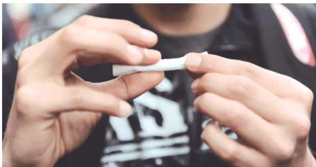
Alrededor de 258,000 escolares en Colombia han consumido o están consumiendo sustancias psicoactivas.