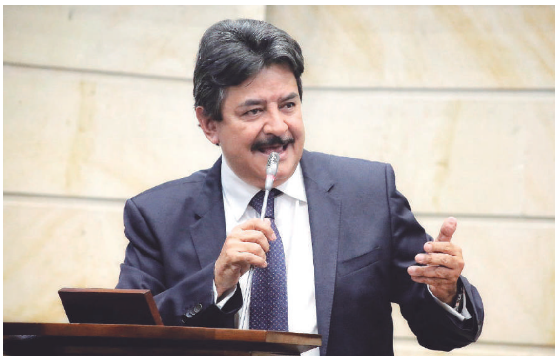
El congresista Carlos Julio González Villa compartió cifras inquietantes sobre la niñez colombiana durante el debate pasado en el Congreso de la República.

El congresista Carlos Julio González Villa reveló cifras inquietantes sobre el consumo de drogas y la deserción escolar en la niñez. Durante el debate en el Congreso de la República sobre esta problemática, el parlamentario huilense propuso la creación de la 'Mesa Nacional por los Hijos de Colombia'.