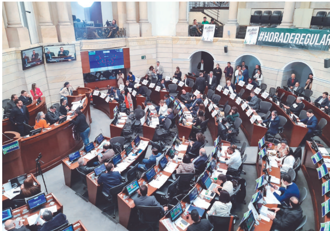
El parlamentario huilense propuso la creación pasada de la 'Mesa Nacional por los Hijos de Colombia' como una alternativa para enfrentar el consumo de drogas y la deserción escolar.