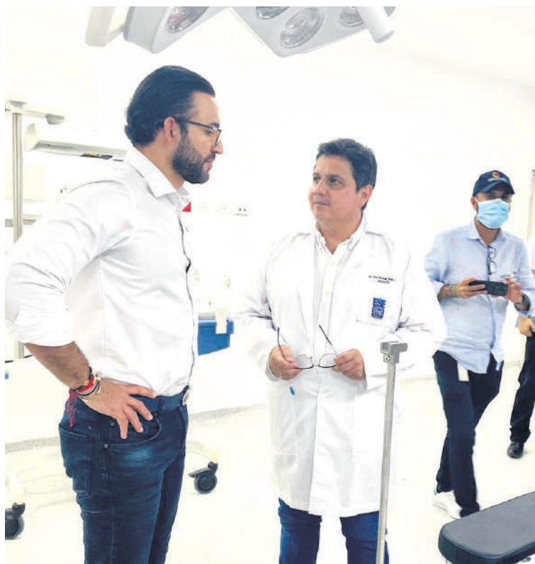
El funcionario reconoció el esfuerzo que se realizó para terminar, dotar y poner en funcionamiento el CAIMI.

Estos son los proyectos que alientan el valor de la Contraloría en los territorios, porque justamente lo que buscan más allá de un fallo de responsabilidad