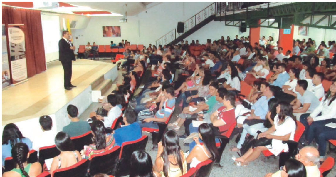
La ejecución del contrato para el mejoramiento del auditorio de la Facultad de Economía de la Universidad Surcolombiana en Neiva, valorado en cerca de $5 mil millones, ha sido declarado de impacto nacional por la Contraloría.

Además, la Contraloría insta a las administraciones entrantes y salientes a tomar medidas concretas para asegurar la culminación satisfactoria de los proyectos en beneficio de la comunidad, marcando un hito en la lucha contra la corrupción y la irresponsabilidad gubernamental.