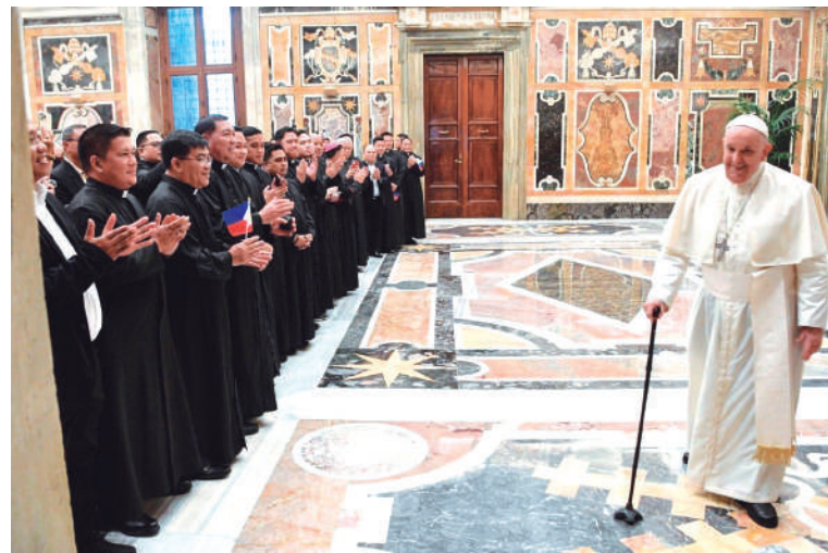
El Santo Padre recibió en audiencia a fieles de la archidiócesis de Ozamiz, Filipinas

Concluyó asegurando a los peregrinos su cercanía espiritual e invocando la intercesión de la Santísima Virgen María, pidiendo gracia y bendiciones para su camino de fe.