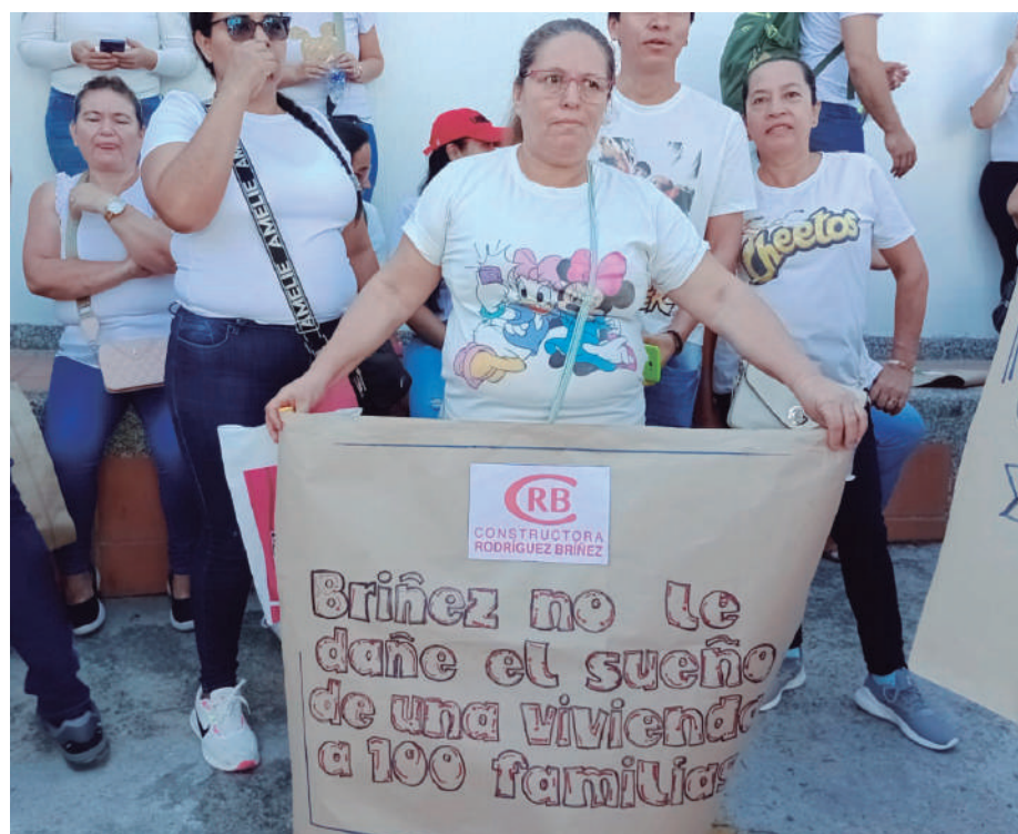
Con pancartas y sonidos de vuvuzelas, beneficiarios de proyecto de vivienda protestaron.