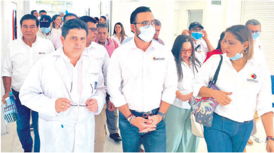
El Contralor destacó las bondades que ofrecen las instalaciones del CAIMI a la comunidad.