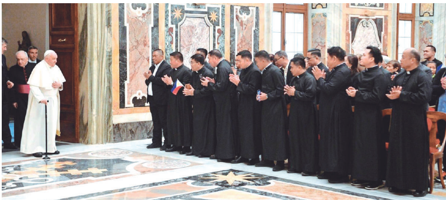
Peregrinación de la diócesis de Ozamiz.

Me gusta que el gesto de María, el que la retrata como es, es éste: en Caná ¿qué dijo? “¿Haced lo que Él os diga?”. María señala