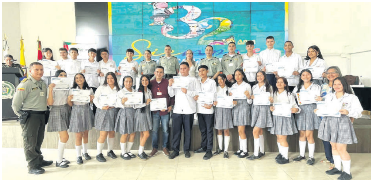
En un trabajo de articulación entre el Programa de Turismo de la Secretaría de Competitividad, la Policía de Turismo y el SENA Huila, se realizó la certificación del servicio social en turismo a 93 estudiantes de las instituciones educativas Liceo Santa Librada, Rodrigo Lara Bonilla e INEM Julián Motta Salas.