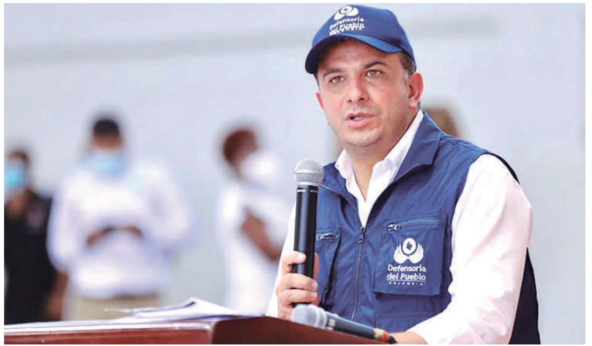
Carlos Ernesto Camargo Assis, defensor del Pueblo.