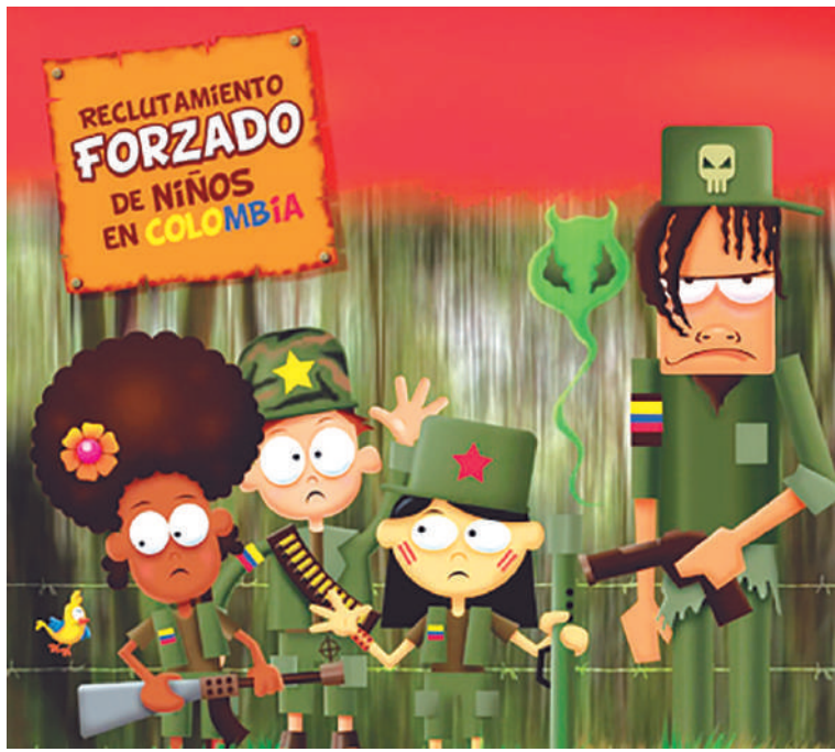
Podrían ser más los hechos, pero no son denunciados por temor.

denuncia: “hemos aprehendido a menores de edad en varias operaciones realizadas, los utilizan para hacer atentados y extorsiones, luego les pagan. Los disidentes, están instrumentalizándolos, para ejecutar acciones terroristas, debido a que las leyes para ellos son distintas y estarían pagándole a reclutadores con el fin de que le lleven jóvenes a sus filas”.