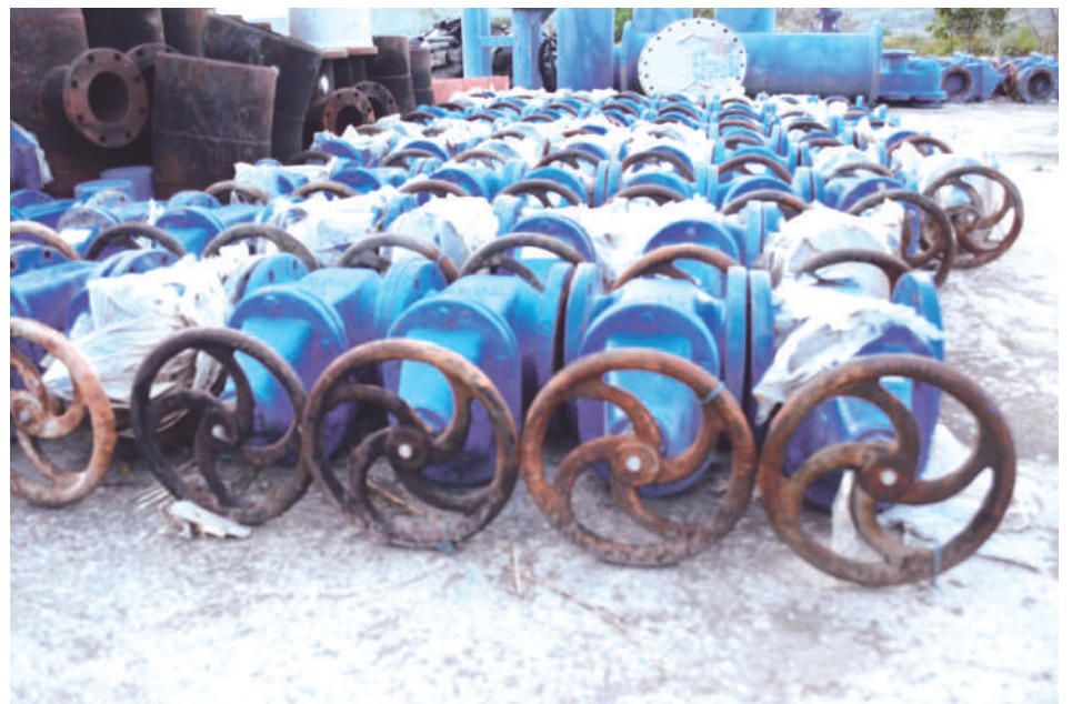
La Contraloría General de la República ha imputado responsabilidad fiscal por $55.801 millones debido a irregularidades en la ejecución del Distrito de Riego Tesalia-Paicol, marcando un precedente en la lucha contra la corrupción en obras públicas.