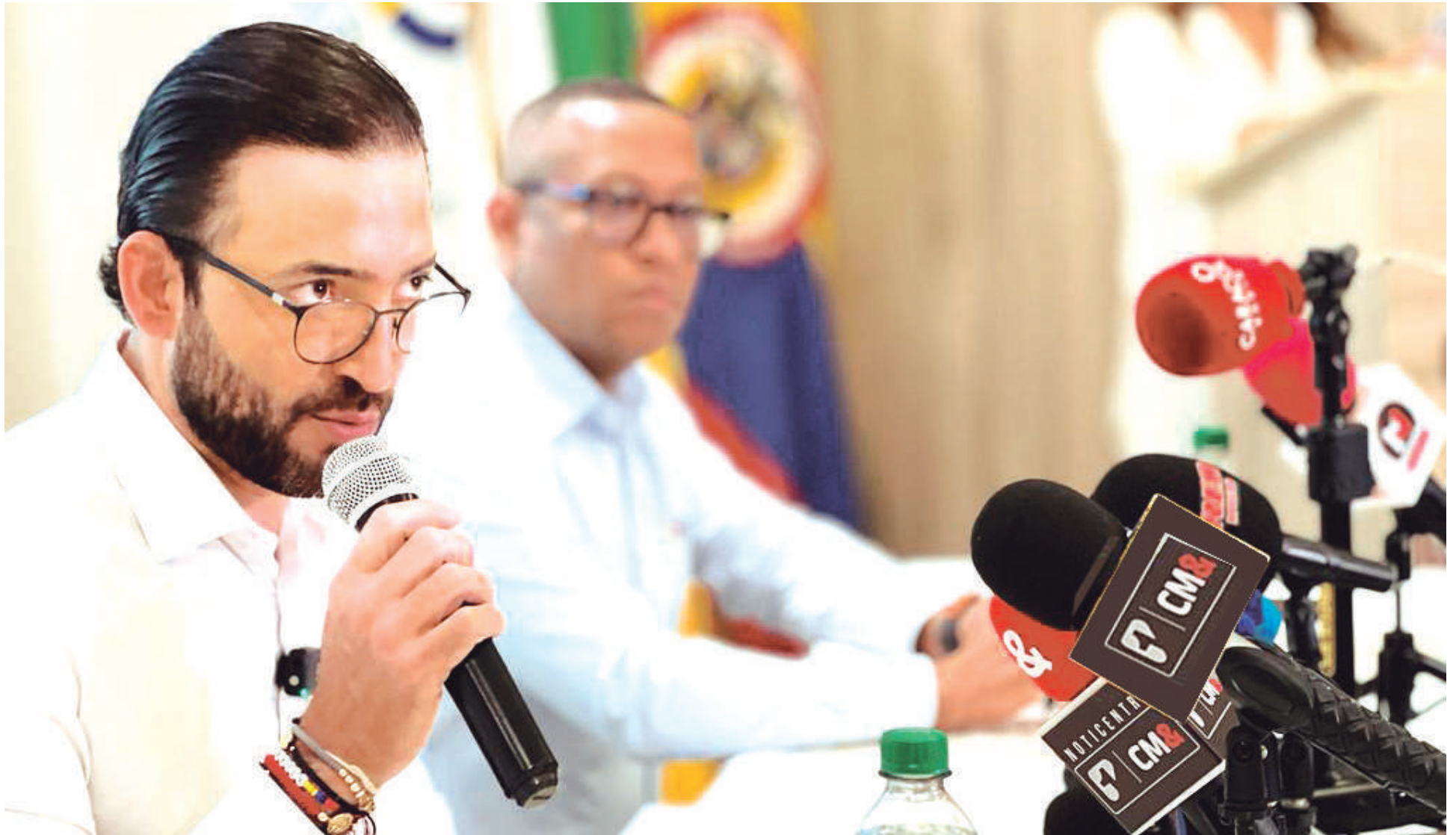
El vicecontralor en funciones de Contralor General de la República, Carlos Mario Zuluaga, indicó que la capital del Huila enfrenta la carga más pesada con 7 proyectos que acumulan $4.8 billones.

de la Universidad Surcolombiana se pueda terminar, en pro del desarrollo cultural y educativo para los habitantes del departamento del Huila.