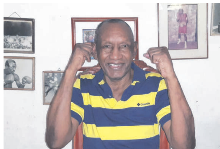
Figura de la semana

Vea columna completa en www.diariodelhuila.com