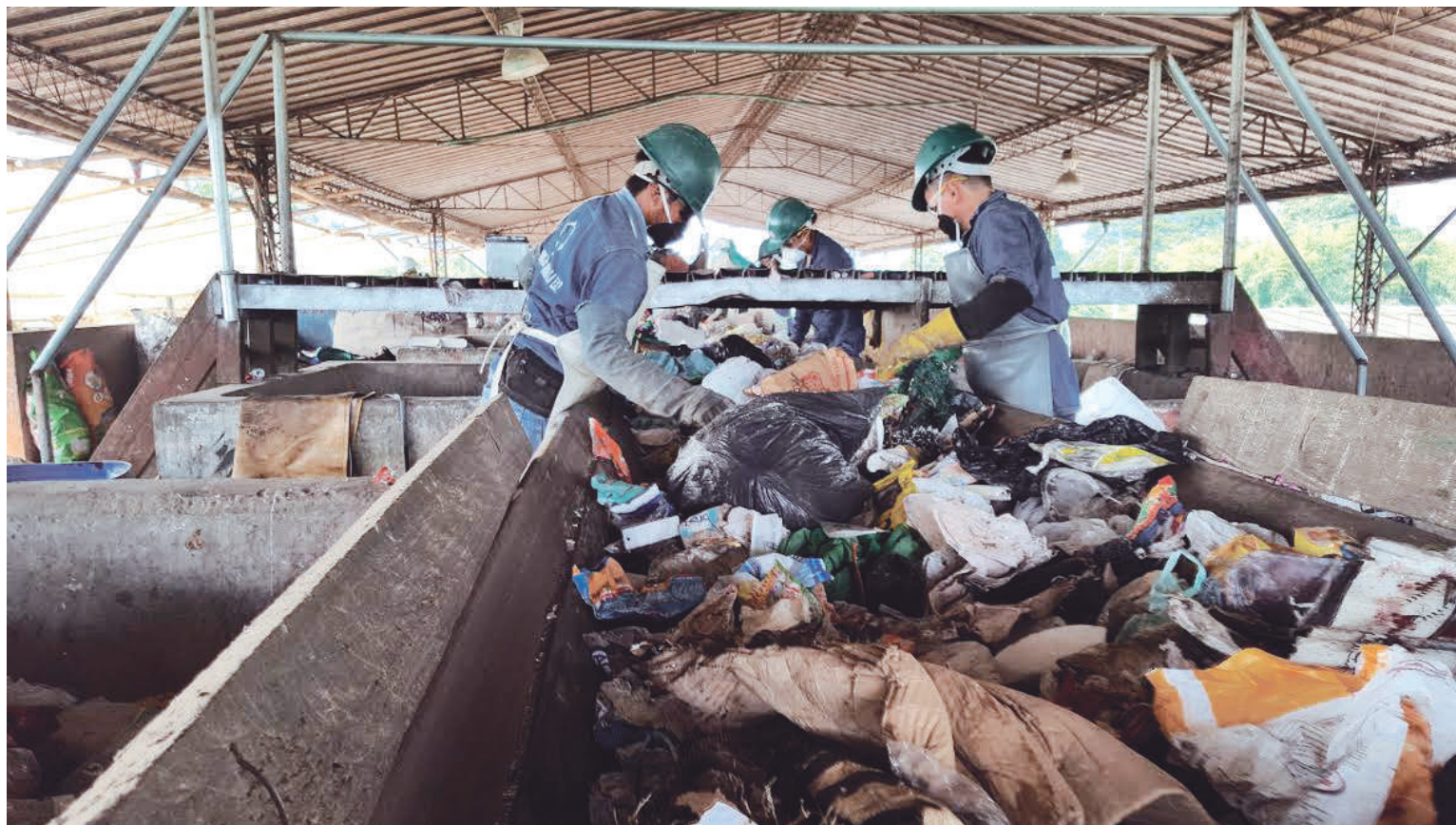
El patrimonio también reflejó una disminución del 2,9%.

Para la Contraloría las causas de este fenómeno contractual tienen relación con las falencias en la su-