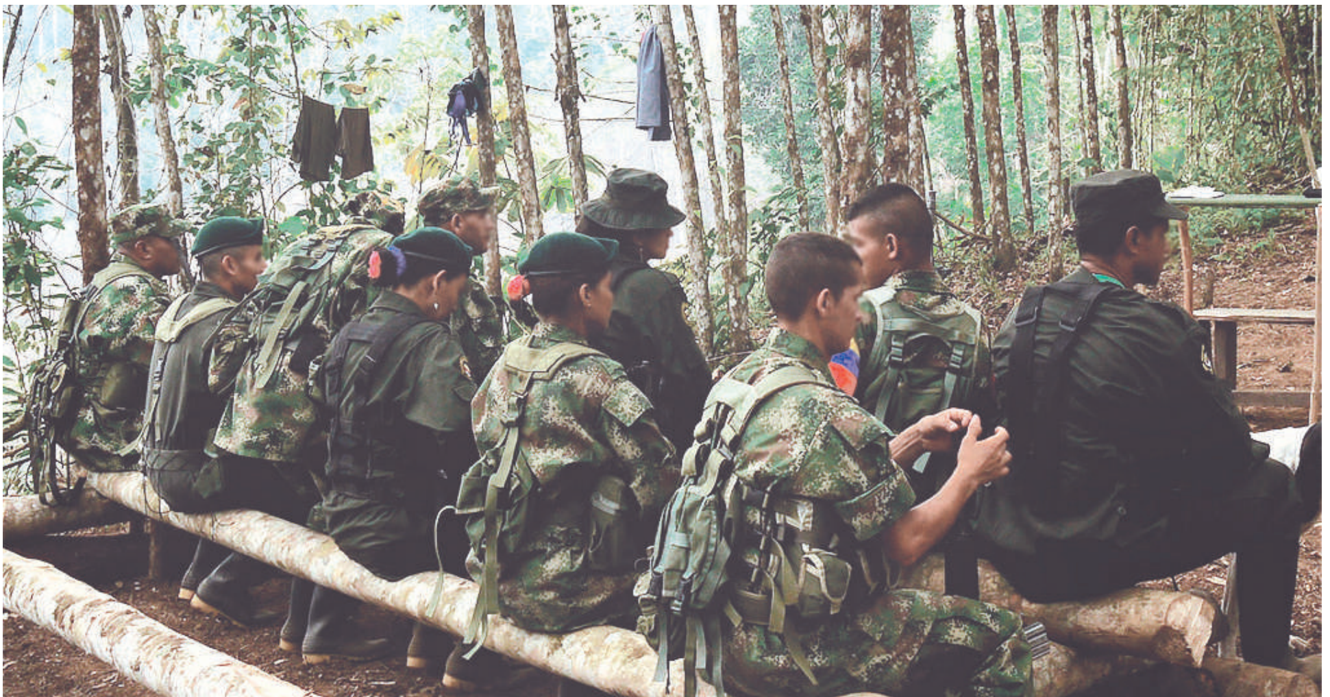
Seis serían los casos de reclutamiento de menores en el Huila.