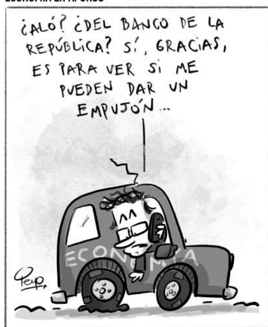
ECONOMÍA EN APUROS