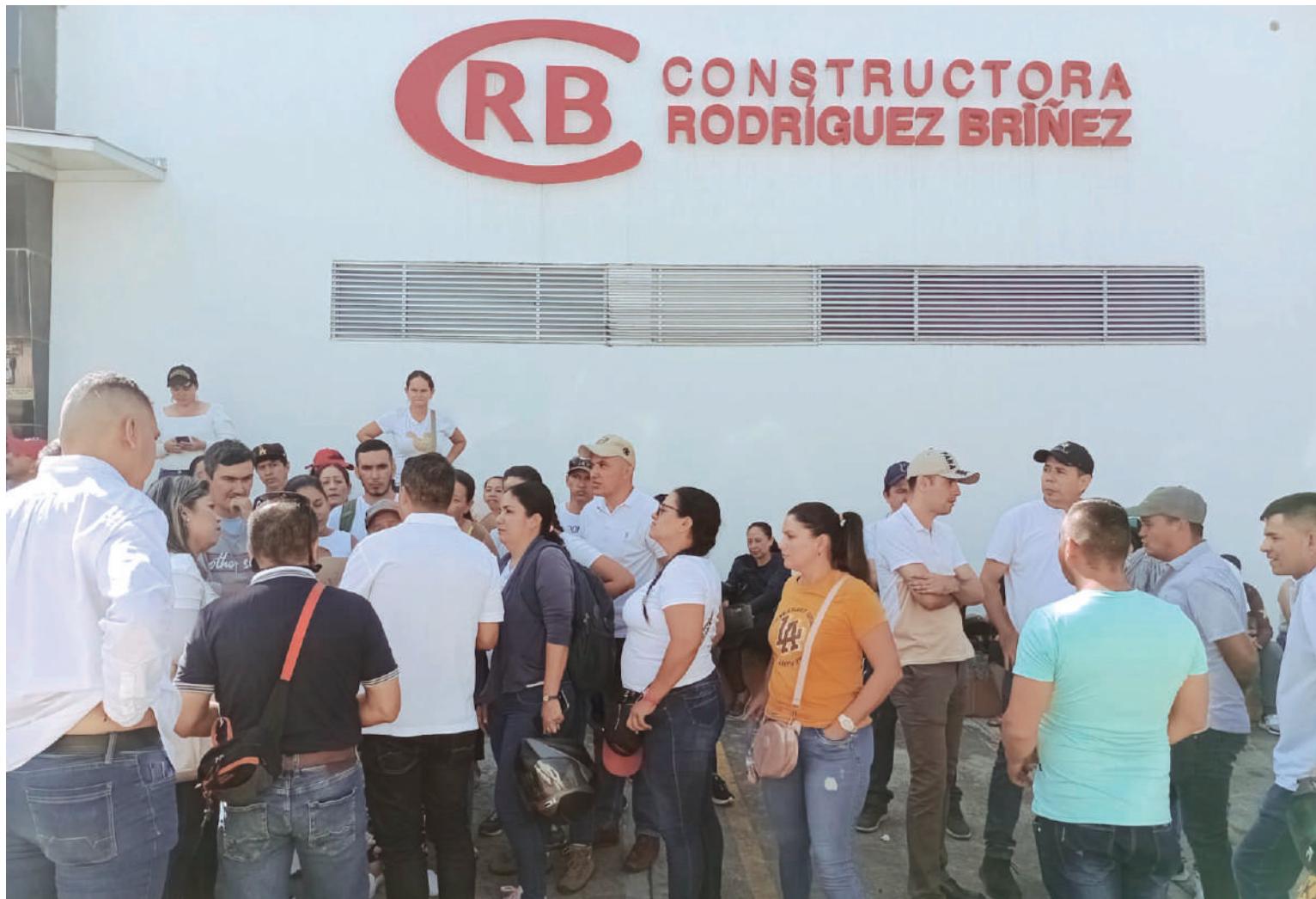
Los manifestantes se agolparon frente a la sociedad constructora.

Según el funcionario, hay que tener en cuenta, que debido al incremento en los precios de los materiales de construcción, y efectos de