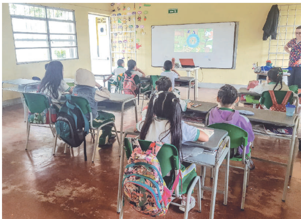
Según cifras del Ministerio de Educación, entre noviembre de 2022 y mayo de 2023, de cada 100 niños que ingresan al preescolar, solo el 30% se gradúan de bachilleres, según datos del mismo periodo.