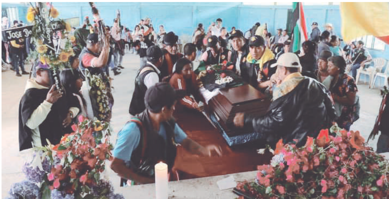
La comunidad le hizo una sentida despedida.