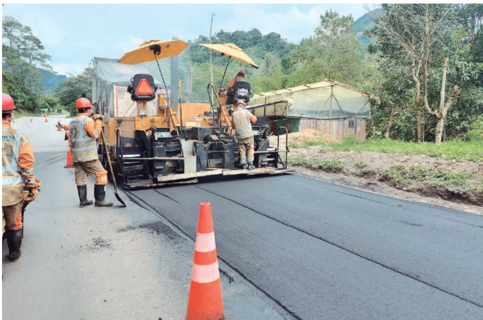
El proyecto crítico del corredor vial Santana-Mocóa-Neiva, valuado en $4.7 billones, ha sido el epicentro de la crisis de corrupción en el Huila, generando pérdidas millonarias.

En el Huila, la Contraloría General de la Nación identificó 17 proyectos críticos y 36 Elefantes Blancos u Obras Inconclusas, por un total de $5,3 billones. Se declaró de impacto nacional la ejecución del contrato para mejorar el auditorio de la Facultad de Economía de la Usco en Neiva. El objetivo, determinar si hubo detrimento en los recursos por $5 mil millones.