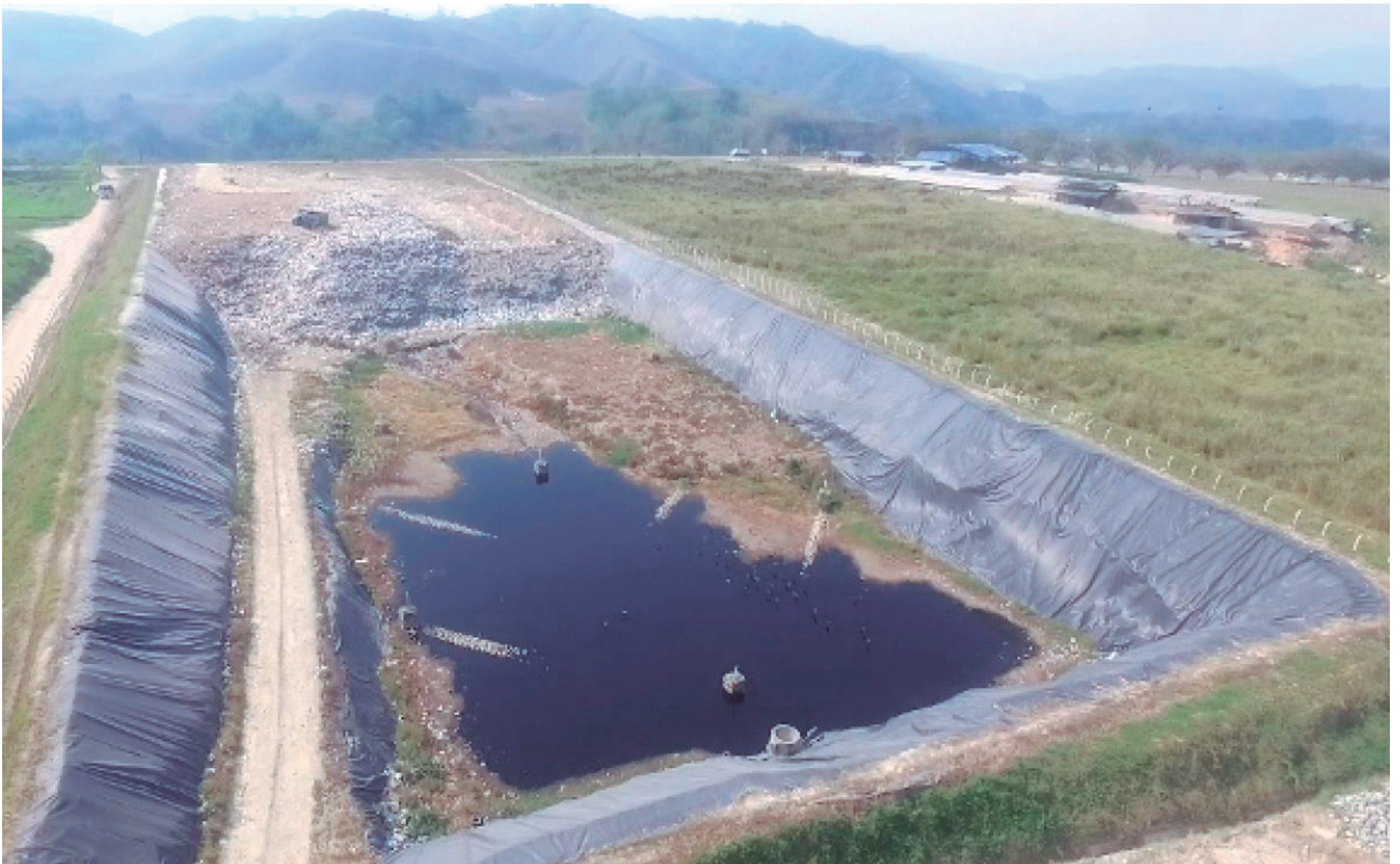
Desde mediados de este año se ha venido advirtiendo del eventual colapso de Biorgánicos del Sur.

Un informe preliminar de la Contraloría Departamental del Huila señala tres observaciones que darían a una posible incidencia disciplinaria y sancionatoria. Se advierte un déficit presupuestal. Problemas en contratación.