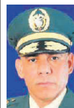
EDUARDO ENRIQUE ZAPATEIRO ALTAMIRANDA General en retiro del Ejército Nacional

Como soldado de esta nación y ciudadano colombiano, estoy llamado a preservar el orden, la libertad y el respeto irrestricto a la Constitución, que es el juramento que hacemos todos los nacionales y los servidores públicos en las tres ramas del poder.