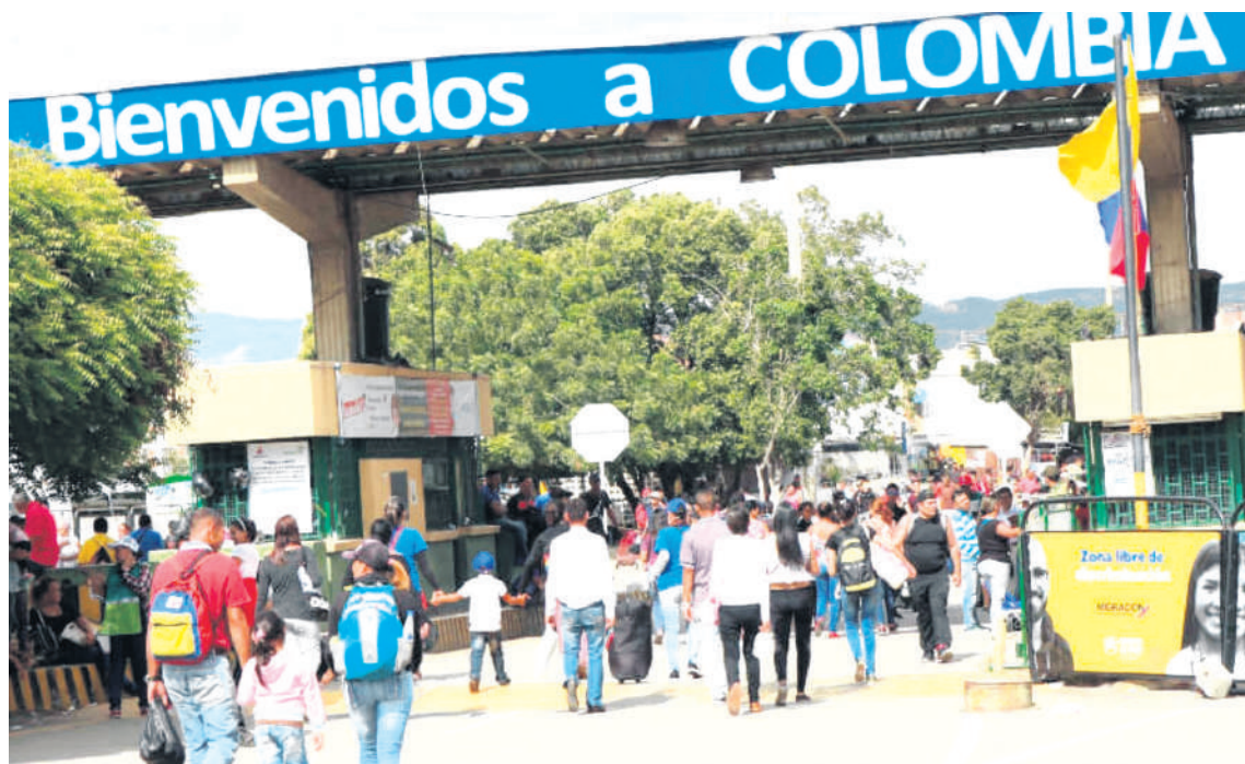
Aumenta población de migrantes venezolanos en Colombia.

En la actualidad en el departamento del Huila se tiene un censo