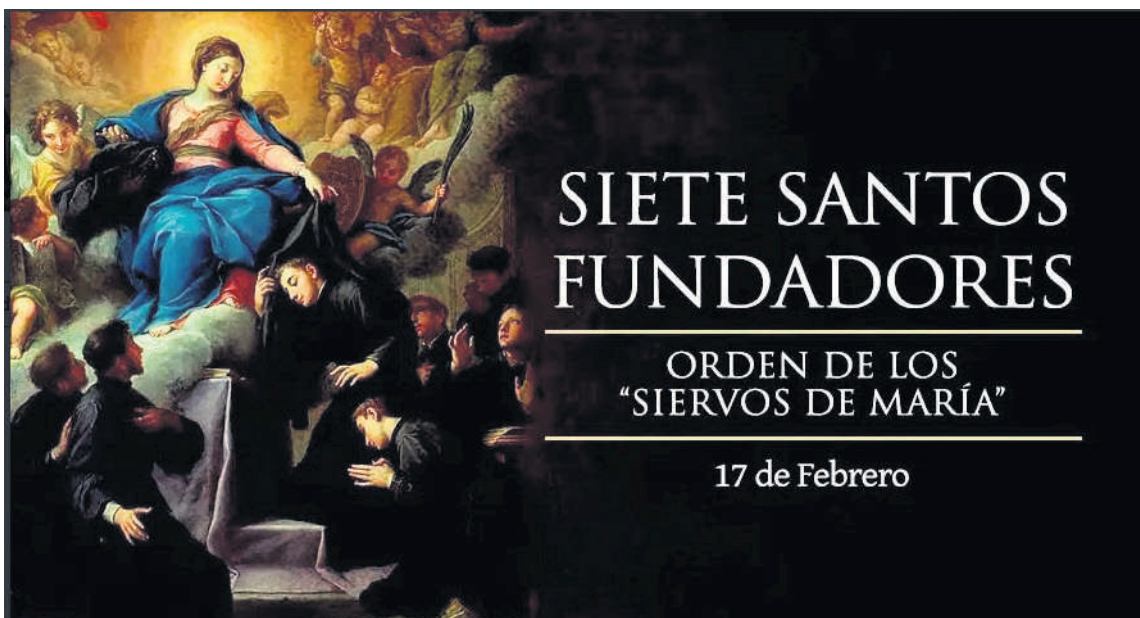
Se celebra todos los 17 de febrero.

Llegar a la santidad, es muy hermoso, pero todavía sería más hermoso aún que lográsemos esa santidad dentro de un grupo, ayudándonos unos a otros, estimulándonos con nuestro buen ejemplo, siguiendo las huellas de este hermoso caso de santidad colectiva.