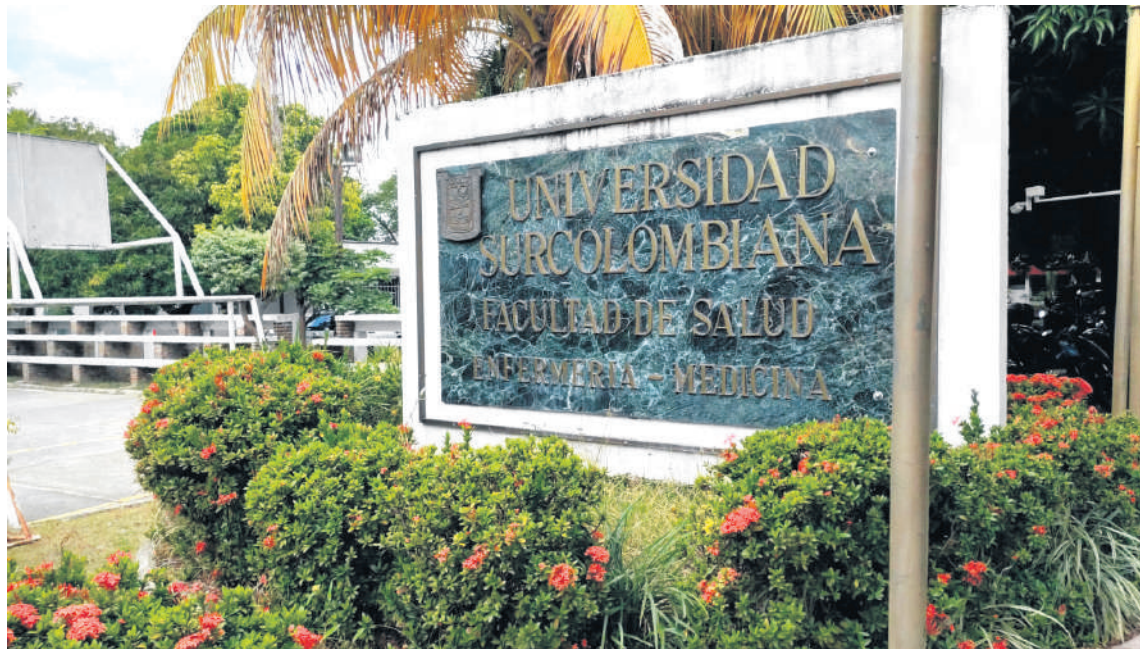
Su liderazgo, conocimiento, cercanía con la comunidad universitaria y, desde luego, su trayectoria profesional fueron determinantes para alcanzar este deseo.

Yo pienso que en este momento la facultad tiene que ser protagonista de la formación de