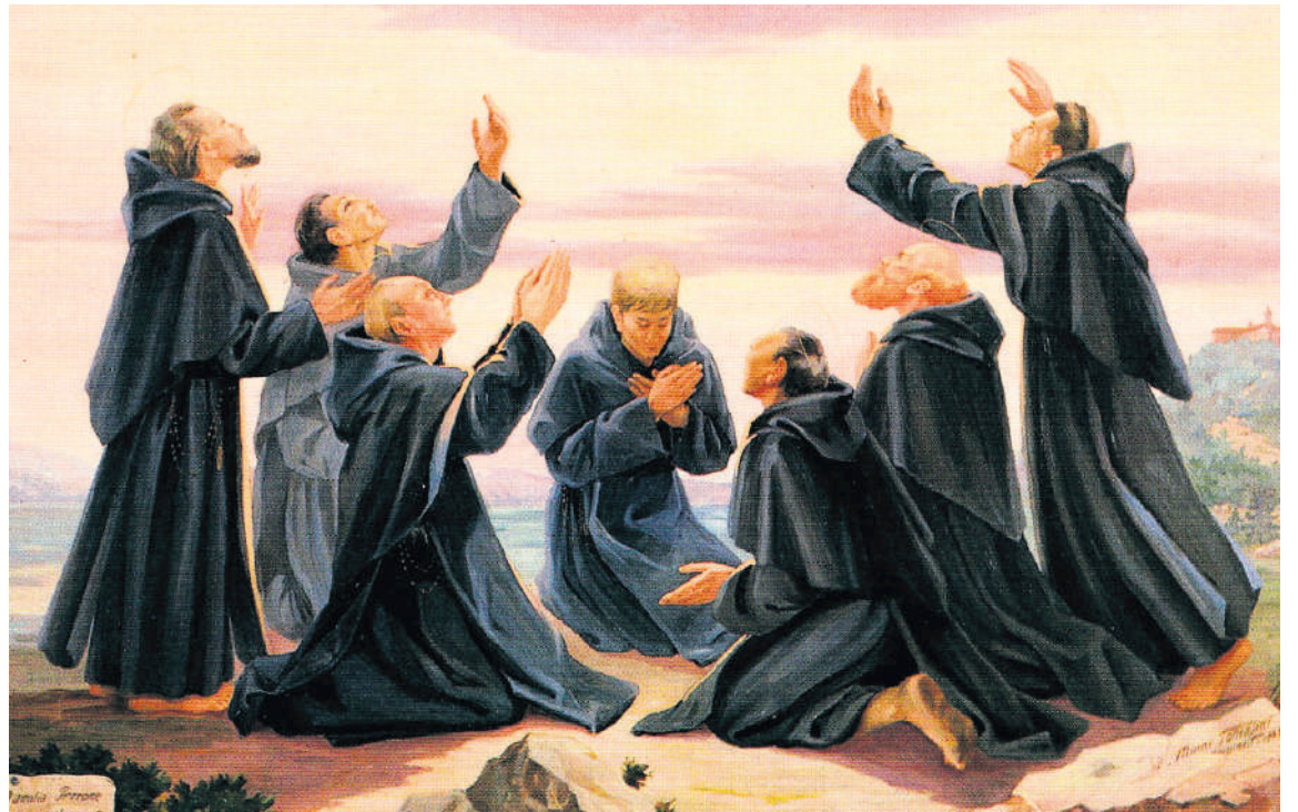
Los siete santos fundadores de la Orden de los Siervos de María.

Los siete nacieron en Florencia; primero llevaron una vida eremítica en el monte Senario, dedicados en especial a la veneración de la Virgen María. Después predicaron por toda la región toscana y fundaron la Orden de los Siervos de Santa María Virgen, aprobada