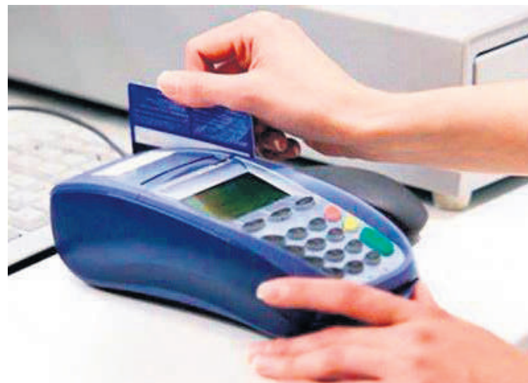
Es importante controlar el uso de las cuentas bancarias para evitar que las consignaciones lleguen a ser superiores a 56 millones de pesos.

Lo que durante mucho rato se especuló sobre aplicar impuesto a las pensiones finalmente se mantuvo el tratamiento de no imponerles ningún gravamen. La realidad es que el 92% de los pensionados tienen pensión mínima. Apenas el 1% caerían en el monto que causaría impuesto que se estimaba en 8 millones en adelante. Por ello, el gobierno desestimó esta apli-