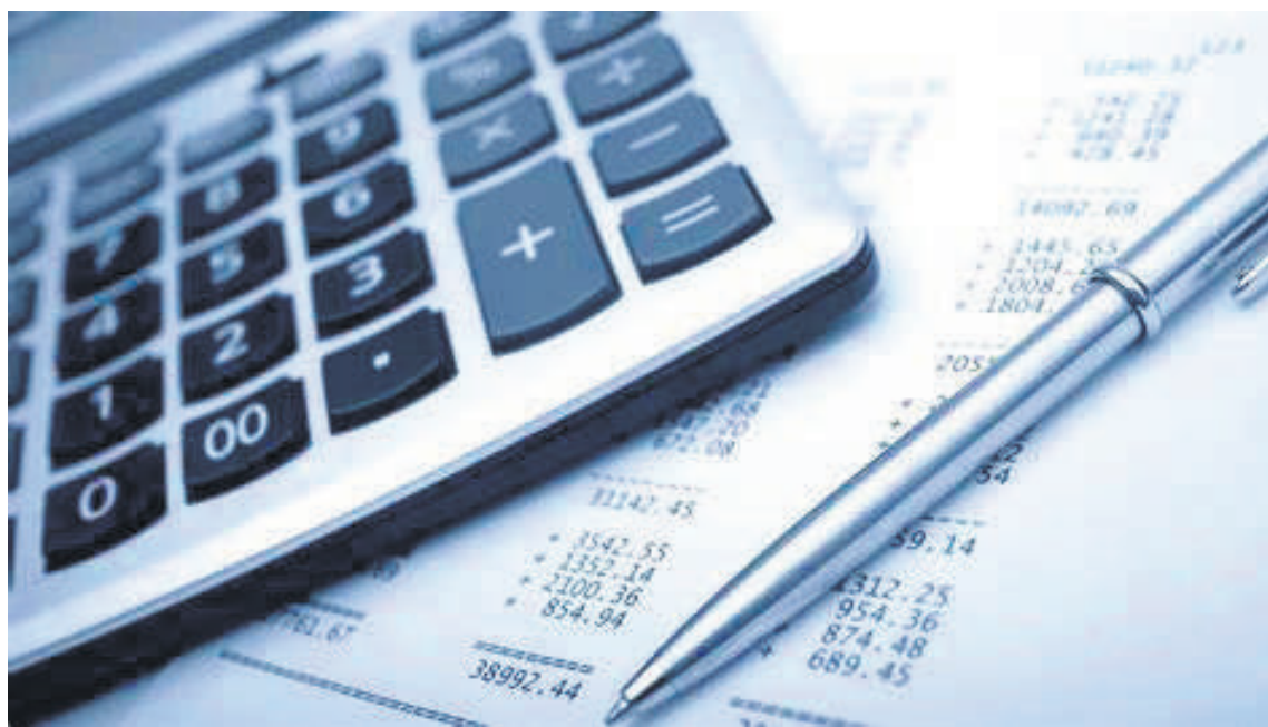
El impuesto a los dividendos pasó del 10% al 15% (querían incrementar al 35%).

De acuerdo con el Objeto de la Reforma Tributaria (Art.1 Ley 2277 de 2022), esta se orienta a "apoyar el gasto social en la lucha por la igualdad y la justicia social y consolidar el ajuste social, adoptando una reforma Tributaria que contribuya a la equidad, progresividad y eficiencia del sistema impositivo, a partir de la implementación de un conjunto de medidas dirigidas a fortalecer la tributación de