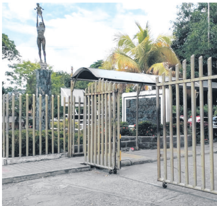
"Dicen que la tercera es la vencida y esta fue la tercera vez que yo me presentaba a la decanatura".

Previo a la designación yo estuve hablando con profesores y estudiantes, incluso varios elementos que tengo consignados en mi propuesta fueron productos de sus recomendaciones. Yo he visto con alegría que en general todos los estamentos han sentido que ha sido una designación responsable, en donde se han tenido en cuenta los méritos cosa que no todas las veces ha ocurrido y noto un muy buen ambiente. Yo como decana de la facultad siempre gobernaré para la facultad. Nosotros los enfermeros y enfermeras no somos importantes, somos imprescindibles y podemos llegar hasta donde no lo proponíamos. Yo creo que mi llegada a la decanatura es parte de ese cambio que se ha empezado a gestar en el país.