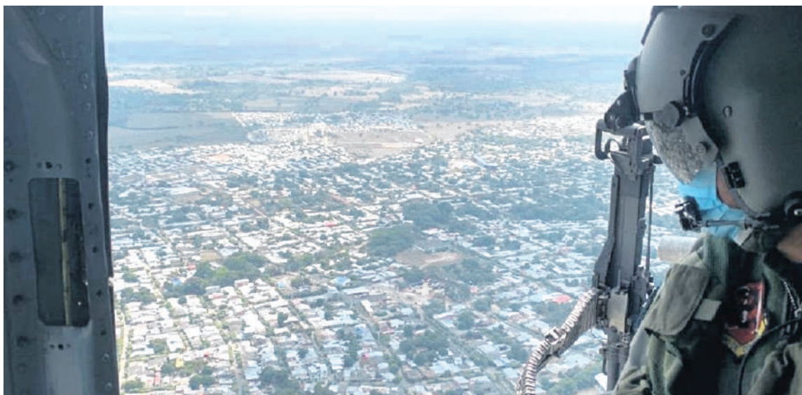
Por aire también estuvo siendo buscado, pero nada fue tan eficiente como la información que sus mismos secuaces tenían para acabar con su vida.

Las autoridades le respiraban en la nunca a 'Paciencia', pero ni 409 hombres fue suficiente para ubicarlo, solo bastó dos gatilleros quienes conocieron su paradero y así lo asesinaron, sacando literalmente del camino.