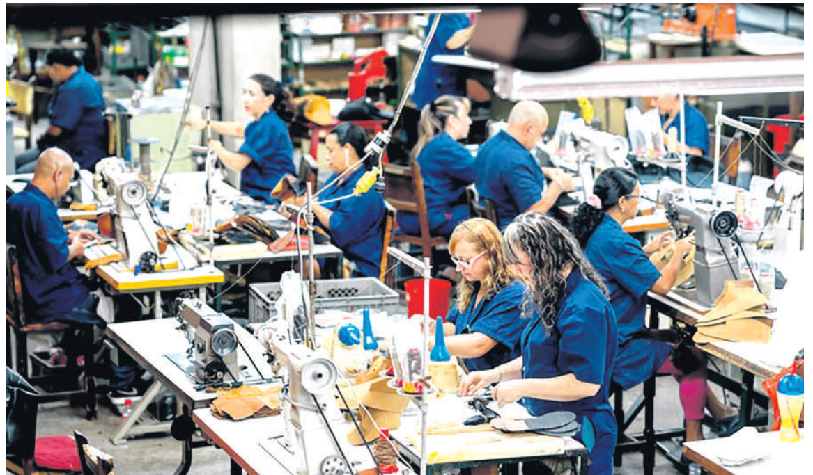
Colombia tiene su fuerza de trabajo en la mano de obra calificada.

Lo mismo sucede con las horas extras entendiendo que en Colombia el total de horas es de 48 horas el propósito de esto es “que el día termine a las 6 de la tarde, no a las 10 de la noche”, dijo Petro en su última locución.