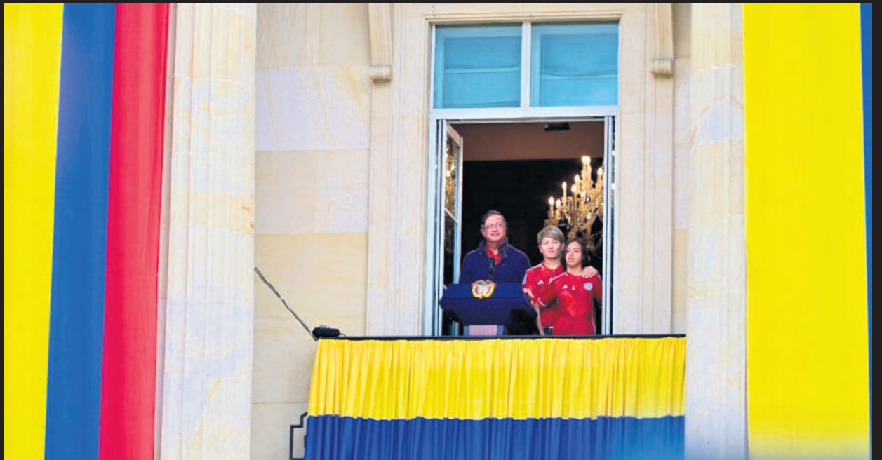
Petro en el balcón día en la marcha

El presidente Petro sacó a sus seguidores a la calle para apoyar sus reformas, presionar al país y al Congreso, pero, salió más gente de la oposición a protestar. ¿Por dónde 'marcharán' los congresistas en la reforma a la salud?