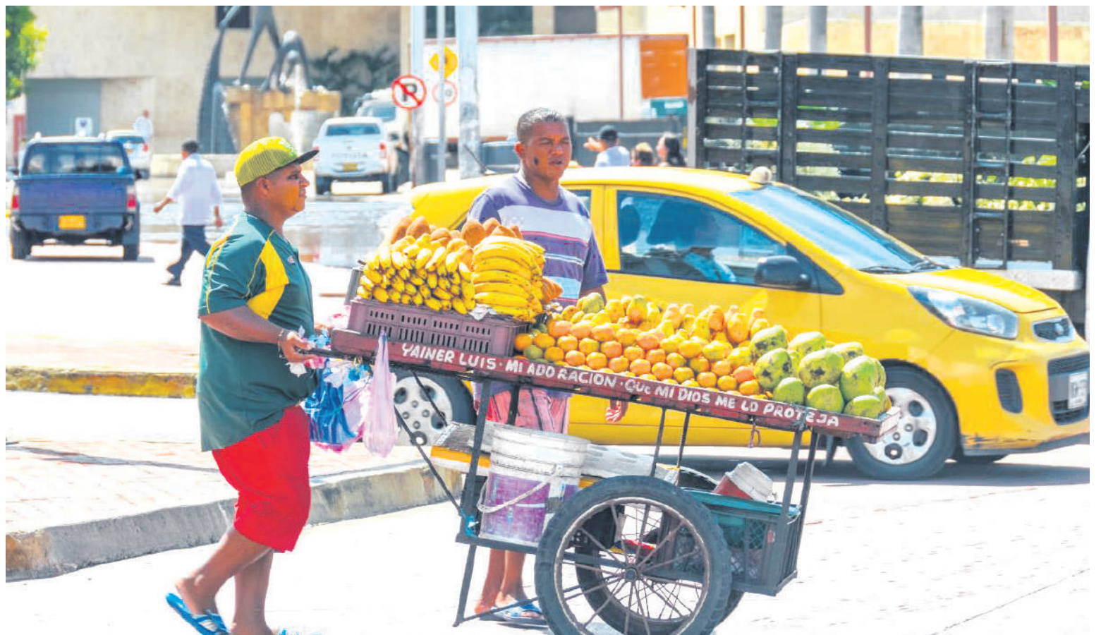
Uno de los problemas que se quiere atacar es la informalidad.

Según se conoce, la reforma estaría siendo realizada por padres del derecho laboral y teniendo en cuenta realidades del mercado y criterios internacionales de progresividad de derechos y garan-