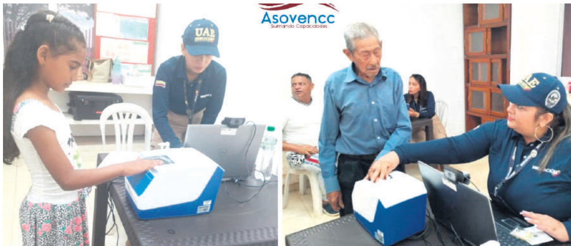
En el Huila son atendidos por la Asociación de Venezolanos en la Cordillera Central.

blación que logró regularizar su estatus migratorio a través de un mecanismo establecido por el gobierno anterior para protección de sus derechos.