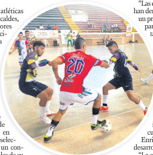
Las primeras competencias se realizaron en el fútbol de salón.

El equipo de fútbol de salón del municipio de Acevedo salió victorioso en su primer partido ante el seleccionado de Timaná con un contundente 8 a 1 con tres goles de su