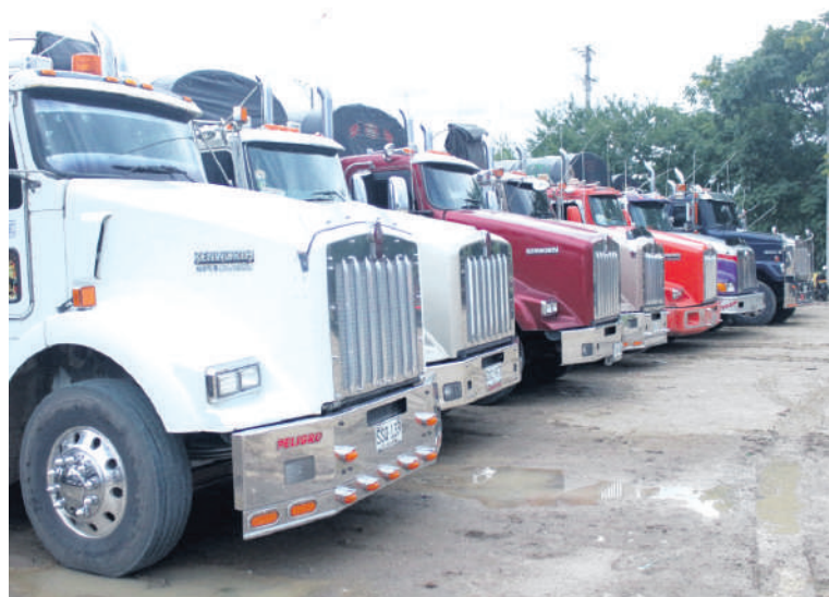
No es la primera vez que sucede en el Huila.