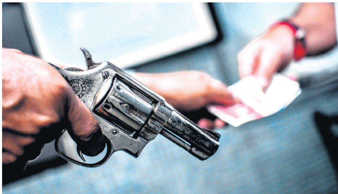
Las autoridades aseguran desconocer esta situación e invita a instaurar las respectivas denuncias.

Por su parte, otra de las fuentes, dijo claro que, en horas de las noches solamente se pueden andar bajo la responsabilidad de cada uno dado que la