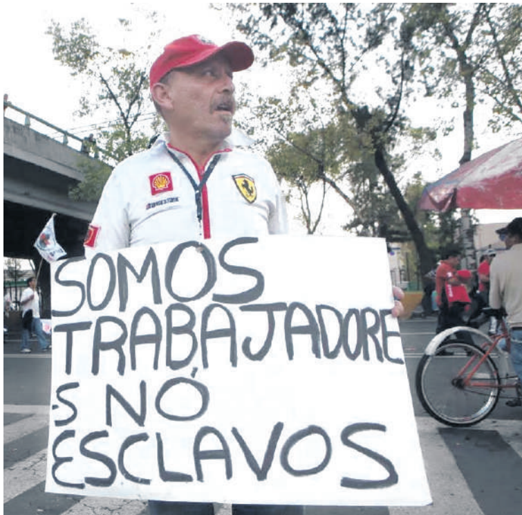
Los colombianos siguen reclamando mejores oportunidades.