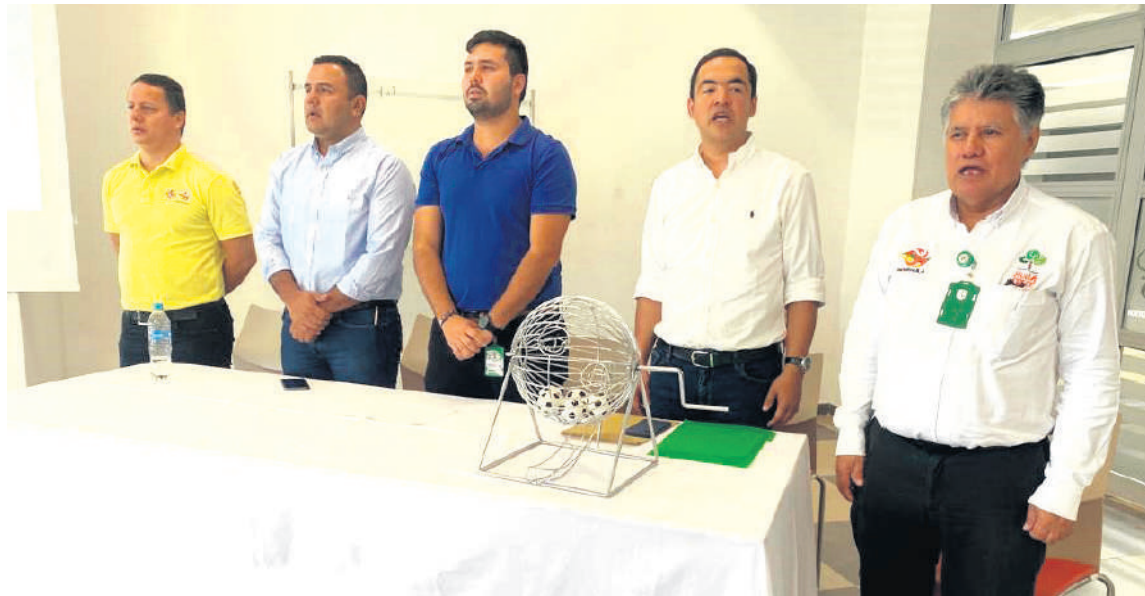
Sorteo del zonal de los Juegos Departamentales en Pitalito.

De acuerdo a la programación establecida, los zonales continuará en Garzón el 24 de febrero; proseguirán en La Plata el 3 de marzo y finalizará en el Muni-