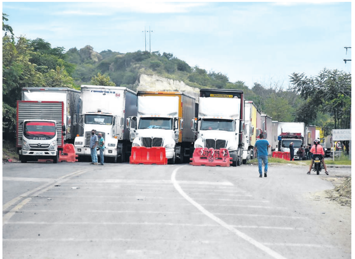
Llenos de temor algunos transportadores denunciaron en exclusiva para el Diario Del Huila que están siendo víctimas del cobro de vacunas.

Llenos de temor algunos transportadores denunciaron en exclusiva para el Diario Del Huila que están siendo víctimas del cobro de vacunas. Esta situación que se vive en las vías del Huila y algunos de los departamentos aledaños, al parecer, es una situación que se viene presentando desde hace varios meses. Las autoridades aseguran desconocer esta situación e invitan a instaurar las respectivas denuncias.