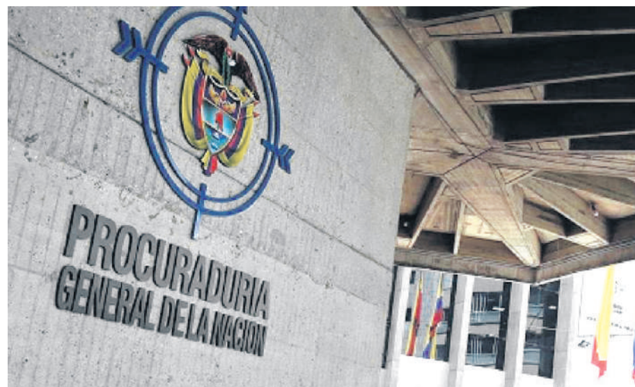
Quitan facultades a la Procuraduría General de la Nación.

Para el alto tribunal está claro que “no se puede criminalizar una irregularidad que solo podría ser una amonestación disciplinaria”. Entre otras cosas, la deci-