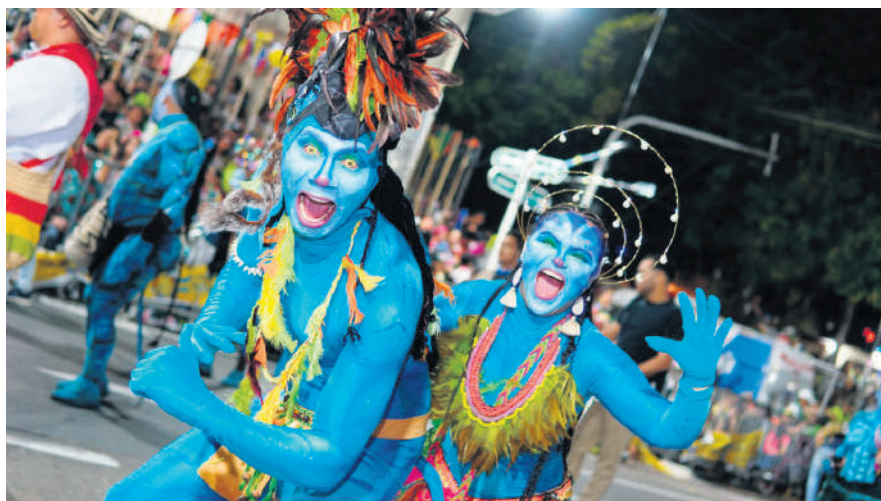
Imagen del día

El Carnaval de Barranquilla no solo se goza en la capital del Atlántico. Los demás municipios del departamento también se suman a las actividades de las carnestolendas ofreciendo un abanico de opciones y posibilidades para propios y turistas. La programación inicia en la tarde de este viernes, 17 de febrero, con el Carnaval Educativo en Sabanalarga, y el Carnaval de los Niños en Usiacurí, Tubará y Baranoa.