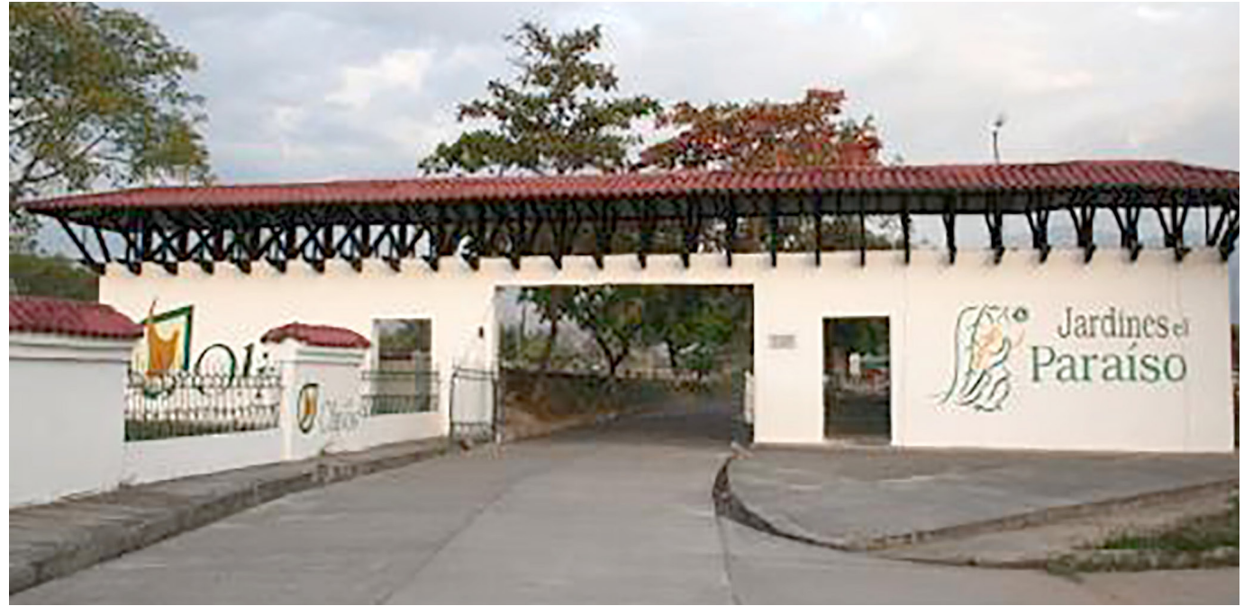
El hombre fue hallado muerto al interior del cementerio.

El cuerpo del hombre fue llevado a Medicina legal para la continuación de las diligencias de rigor, identificarlo y posteriormente entregarlo a sus seres queridos.