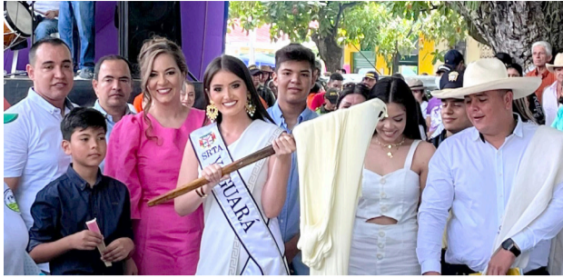
Reina Departamental del Turismo se despide