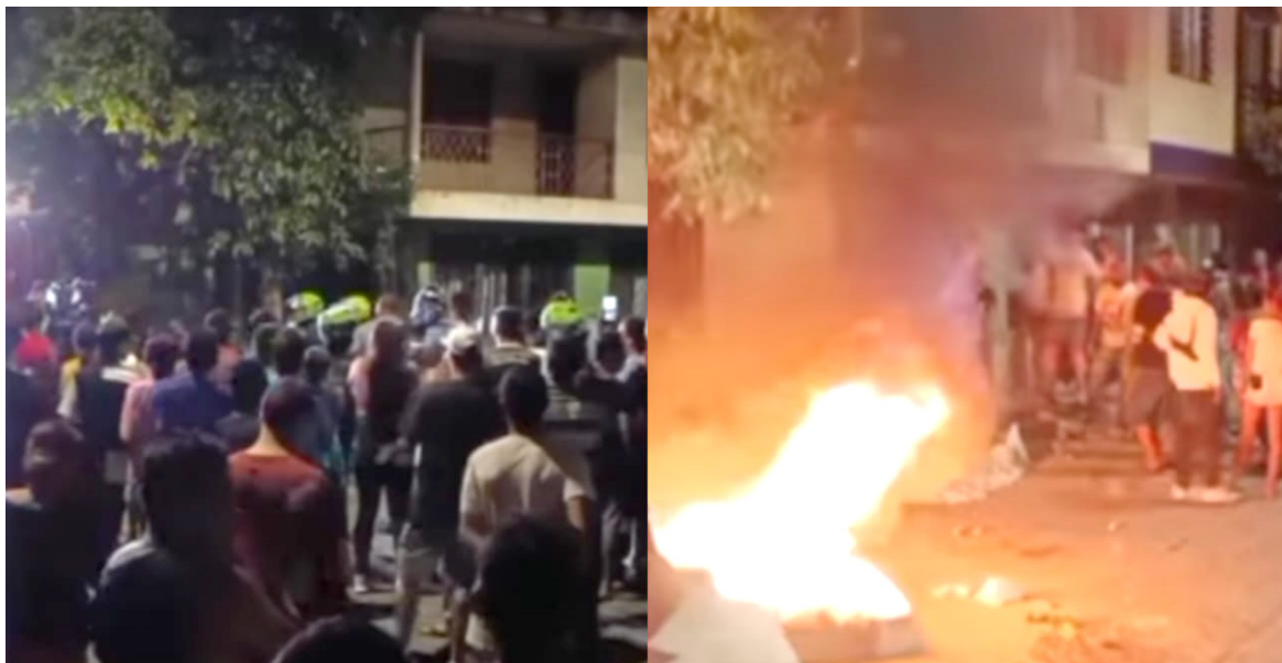
La situación rápidamente se tornó angustiante también para los vecinos que presenciaron la escena.

Las autoridades hacen un llamado a la calma y la cooperación de la comunidad en estos momentos delicados, mientras se investiga a fondo el incidente y se toman las medidas correspondientes.