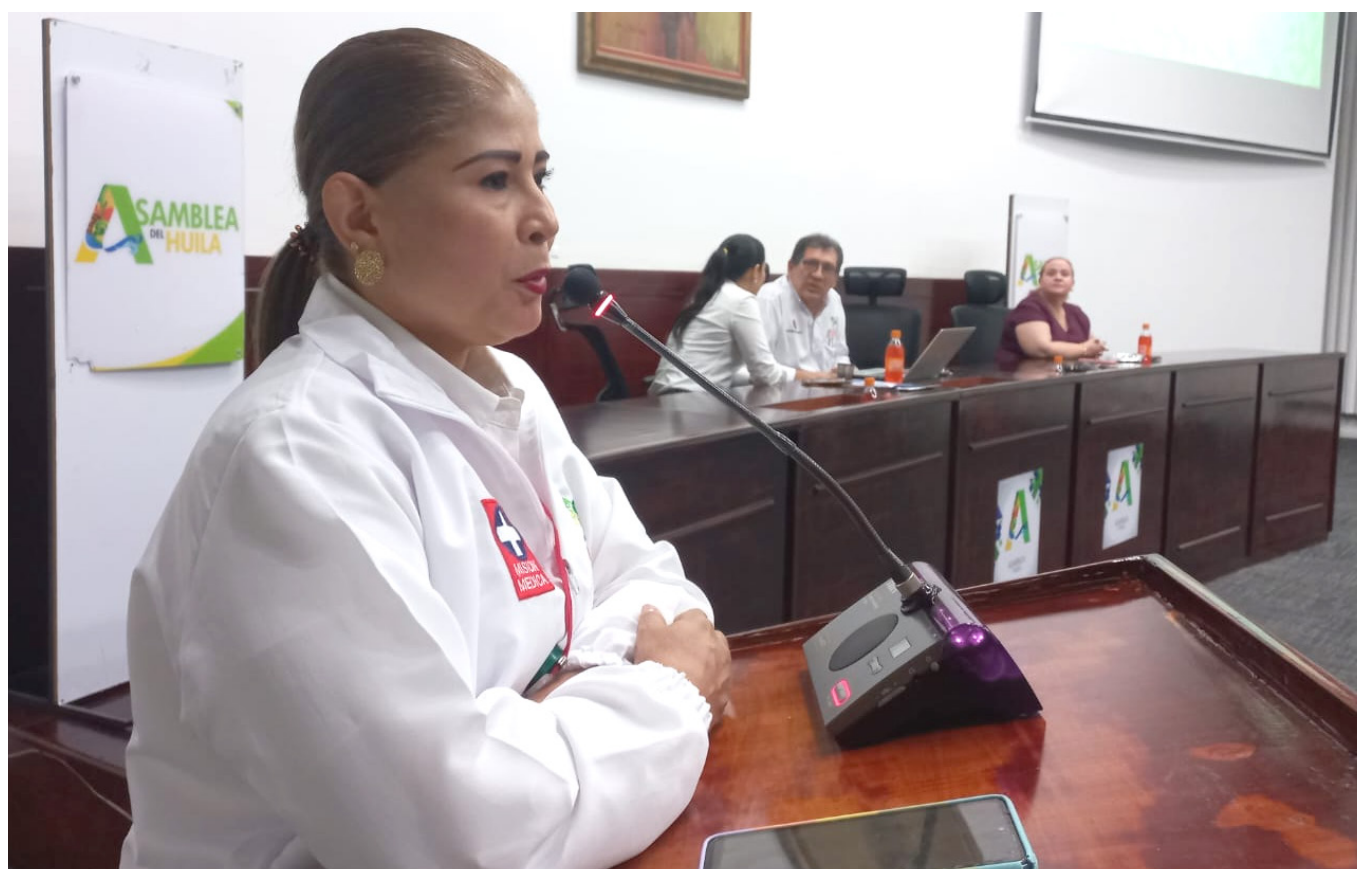
Los gerentes de las entidades de salud pública se reunieron en la Asamblea Departamental para recibir los reconocimientos

En el departamento del Huila, la Secretaría de Salud Departamental resaltó la labor que adelantan los municipios en la vigi-