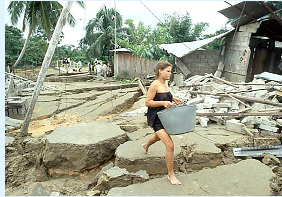
El 18 de octubre de 1992 un sismo abrió los suelos en Murindó, Antioquia

“La descripción de los daños en Cúcuta, da cuenta de la destrucción de la mayoría de construcciones, la ruina de otras y la muerte de varias personas bajo sus escombros. El “Boletín Oficial” del 8 de julio de 1875, reporta un total de 461 personas muertas en