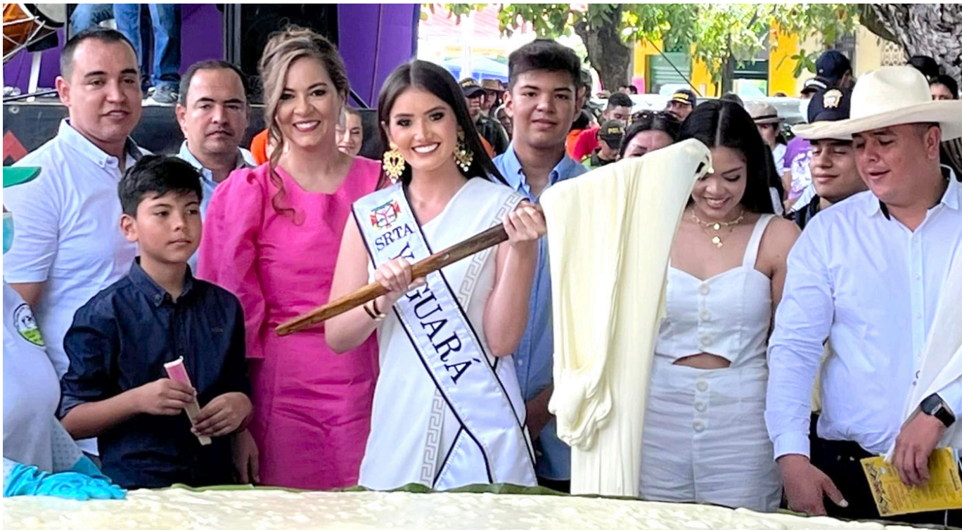
Elaborarán un quesillo gigante.