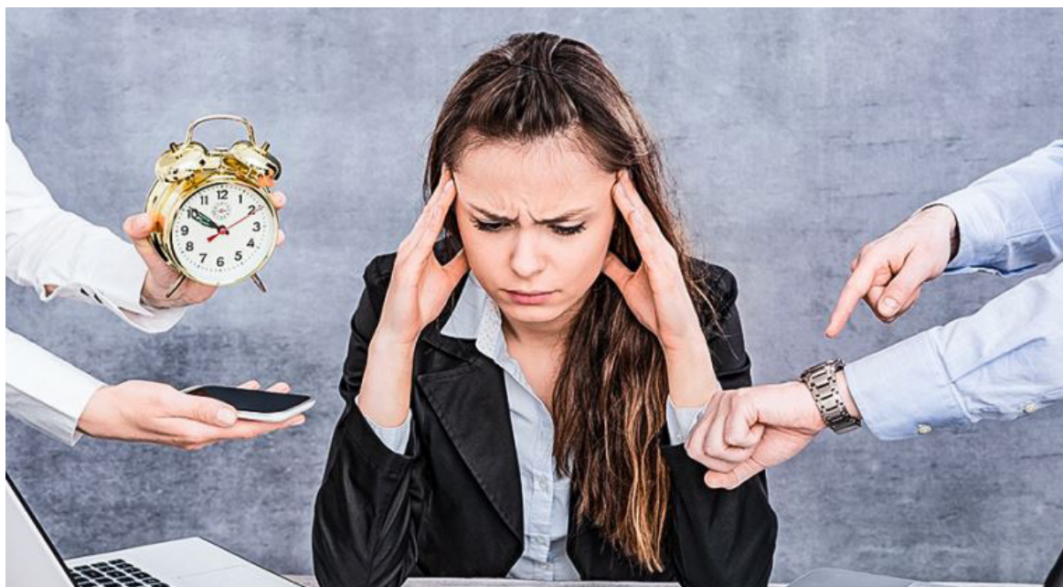
El estrés es un sentimiento de tensión física o emocional.

la fatiga y ayudan a calmar los nervios. Su consumo activa la secreción de melatonina, que ayuda a mejorar el sueño y a regular las condiciones de estrés.