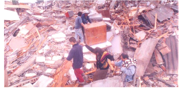
Los terremotos más fuertes que ha vivido Colombia