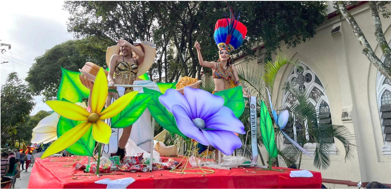
Habrá desfile de bienvenida a las aspirantes.

de la localidad y a las 7:00 de la noche, las bellas tendrán una entrevista con el jurado calificador.