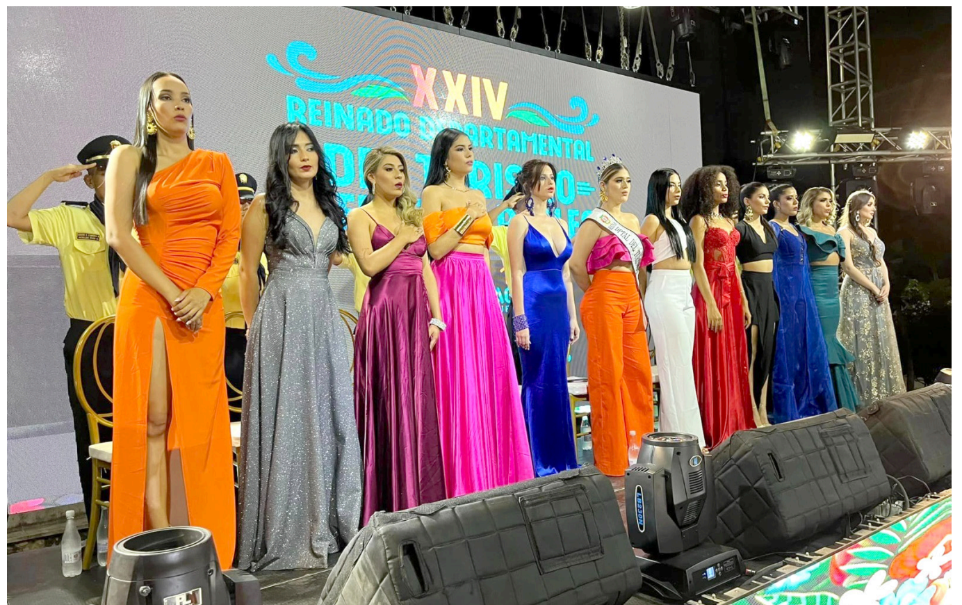
El día domingo se realizará la elección de la nueva soberana.

velada de elección y coronación de la Reina Departamental del Turismo 2023-2024, donde el