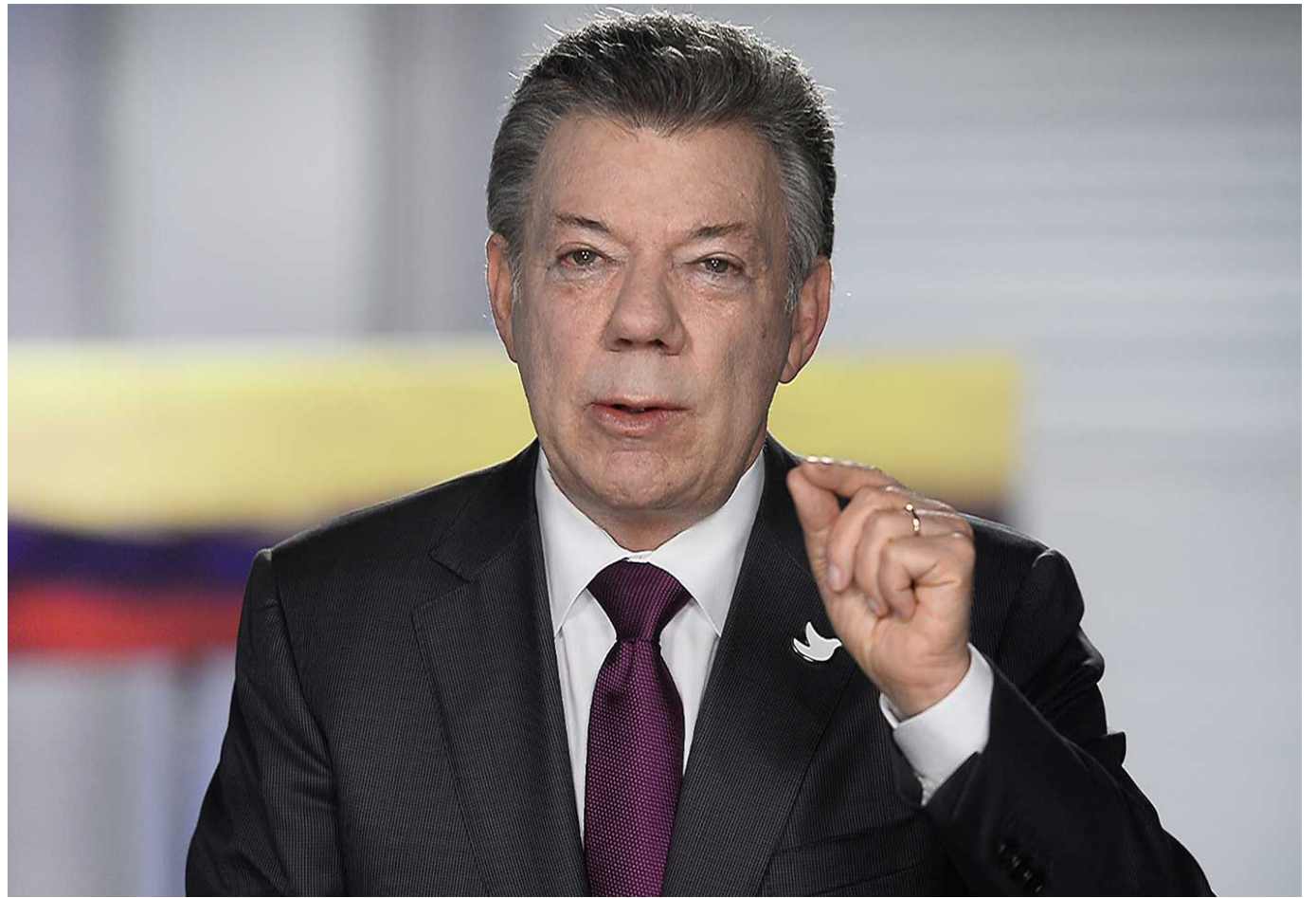
Juan Manuel Santos, expresidente de Colombia.

Ahora bien, las audiencias fueron radicadas en el Complejo Judicial de Paloquemao y se está a la espera de las respectivas fechas.