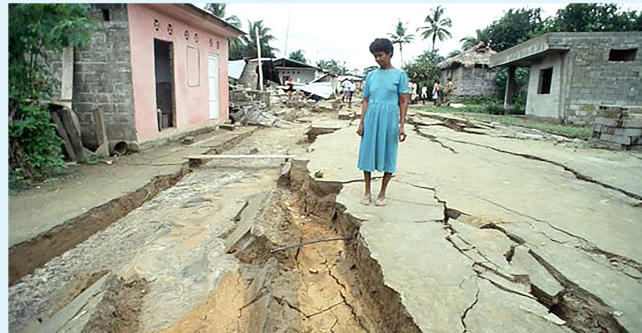
Registro fotográfico del sismo del 18 de octubre de 1992 en Murindó, Antioquia.