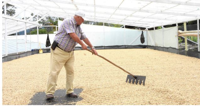
San Isidro, café con compromiso ambiental