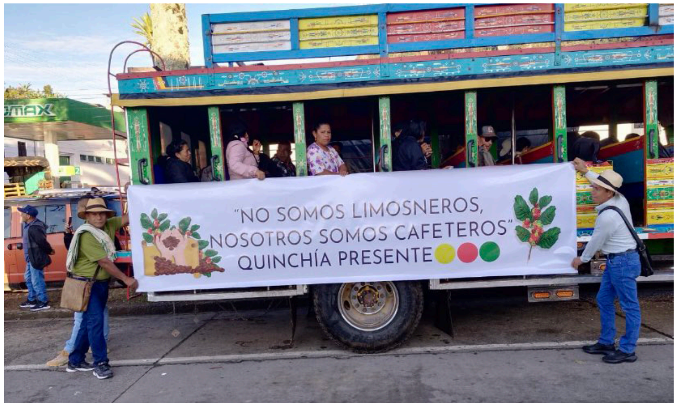
Movilización cafetera hoy en Armenia exigiendo mejor precio de café.

Los cultivadores aseguran que si no logran acuerdos nuevamente convocarán a un paro cafetero como el de 2013.