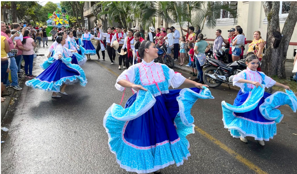
Las comparsas y sus coloridos trajes.

“Tendremos el gran festival del quesillo se elaborará uno gigante. Este producto va a ser hecho por mujeres, quienes han sacado a sus familias adelante con este bonito emprendimiento. Ellas son expertas en hacer este manjar por supuesto y vamos a ver todo el proceso de elaboración”, señaló la reina.