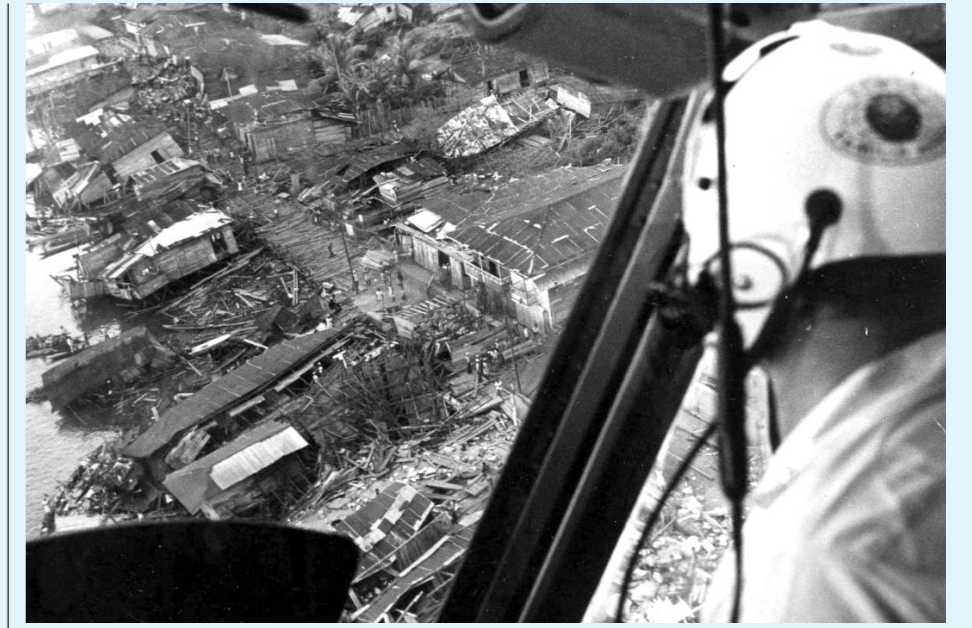
Sobrevuelo sobre los efectos del tsunami de diciembre de 1979 en Tumaco.

Estos son los seis eventos que dentro del Sistema de Información de Sismicidad Histórica del Servicio Geológico Colombiano han tenido una intensidad de 10, la más alta que los expertos. Foto 1: Sobrevuelo sobre los efectos del tsunami de diciembre de 1979 en Tumaco.