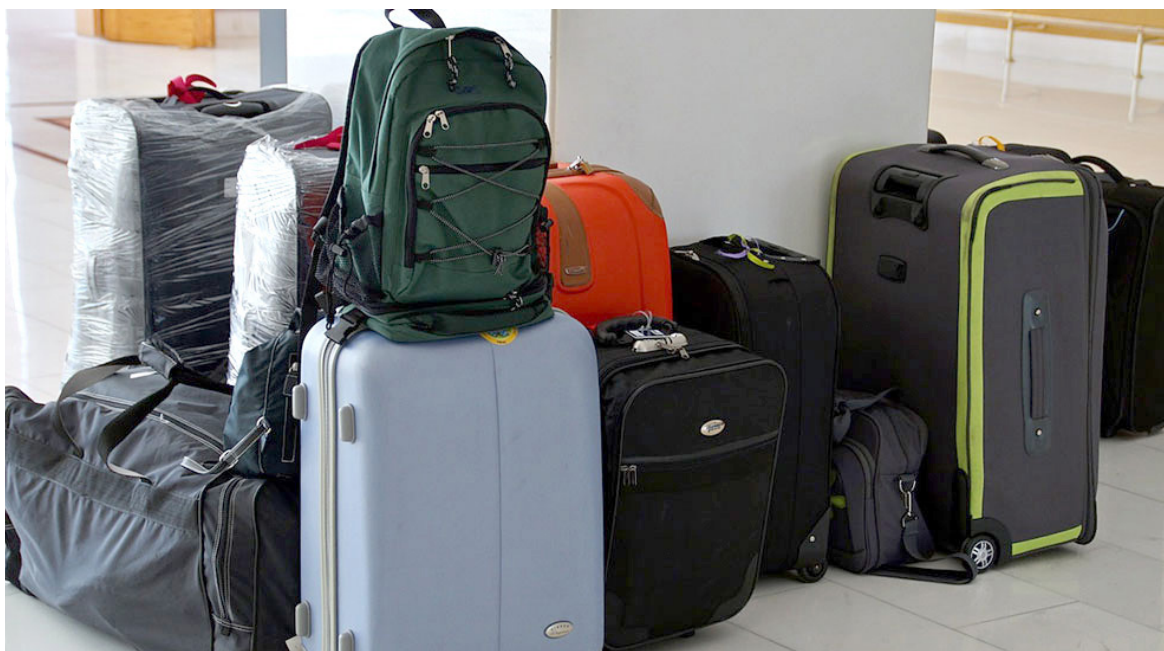
Cartagena y la Costa Caribe también reportaron los mejores resultados en ingresos en el primer semestre de este año.

La tasa de ocupación nacional para el mes de junio de 2023 se ubicó en 51,7 %, es decir 3,4 puntos porcentuales por encima de la tasa registrada en junio de 2019, cuando llegó al 48,3 %. Frente al mismo periodo de 2022 se ubicó 2,6 puntos porcentuales por debajo, y alcanzó 54,3 %.