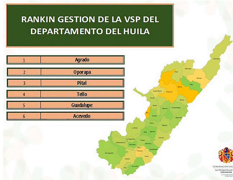
Rankin en la gestión de vigilancia de Salud Pública del Huila

EL Huila fue reconocido como uno de los 5 territorios con el mejor desempeño de vigilancia y seguimiento de los eventos de interés en Salud Pública, junto a Bogotá, Quindío, Barranquilla y Medellín.