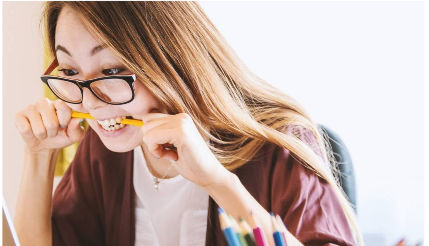
El estrés cada vez afecta a más personas en el mundo.

La falta de vitamina C se ha relacionado con un aumento en los niveles de estrés, precisa la fundación estadounidense AARP, en su página web.