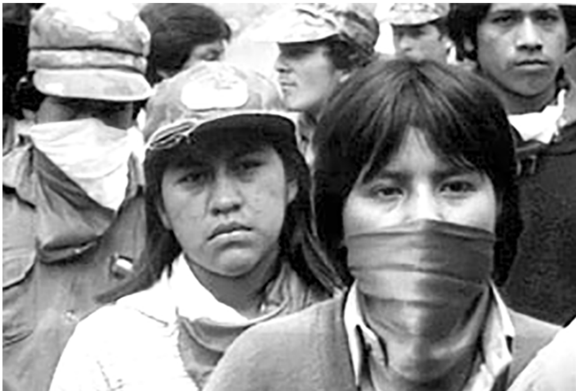
La mujer se desarrolló en el Tolima.

Luego en medio de las montañas de esta municipalidad, es capturada por una patrulla del Ejército, quienes la acusan de guerrillera. A diferencia de lo que hacían con los hombres que era ejecutarlos. “Con las