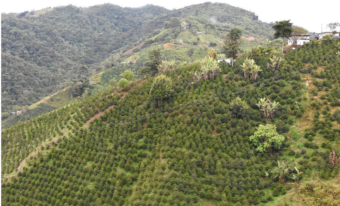
San Isidro se fundó hace 45 años y hoy por hoy cuenta con 85 asociados cafeteros de las localidades de Pitalito y Acevedo.

Collazos resalta con orgullo cómo San Isidro ha logrado unir a la comunidad en la búsqueda de mercados diferenciados para su café y cómo trabajan conjuntamente para la protección de las fuentes hídricas, incluyendo la implementación de beneficiadores de café para prevenir la contaminación de las quebradas.