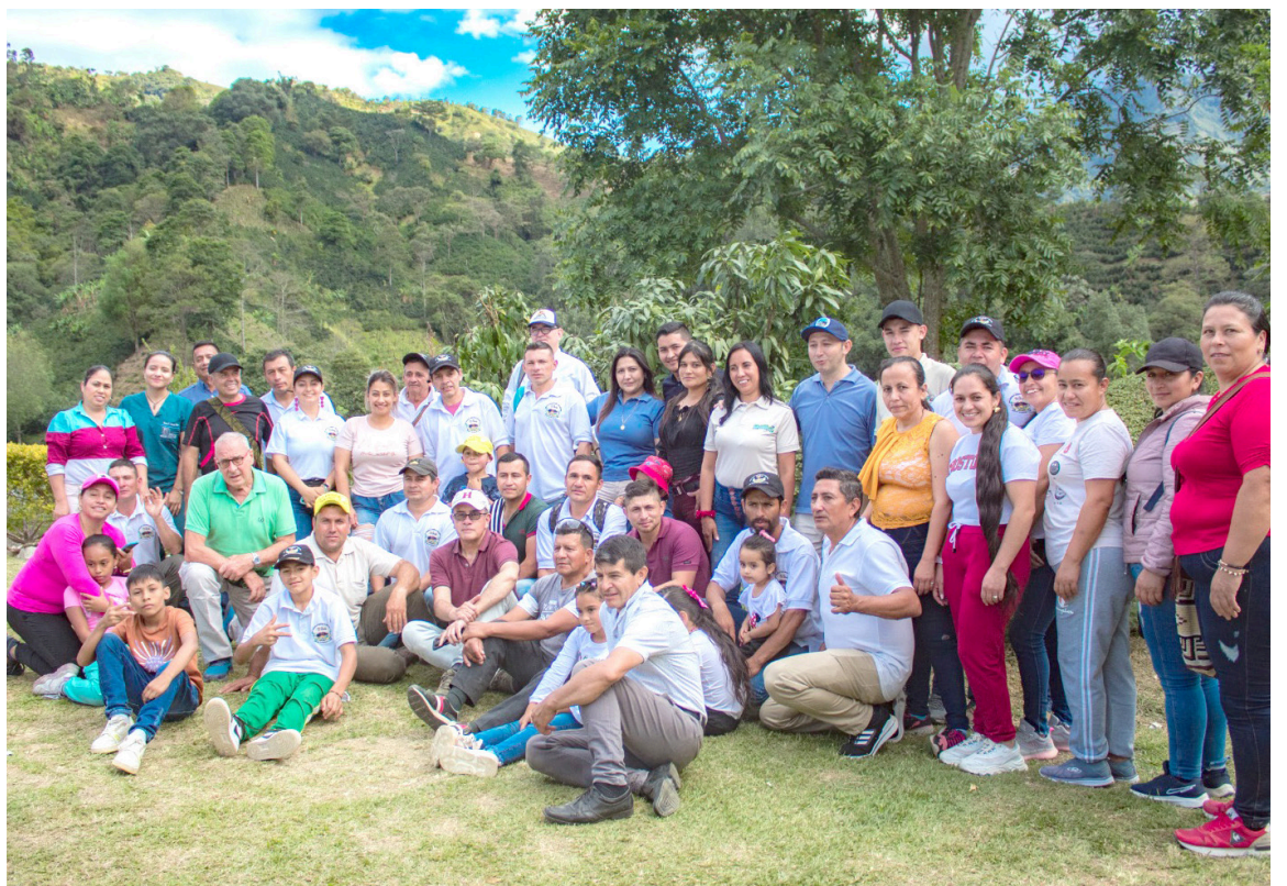
19 familias campesinas le apuestan a la apicultura como alternativa productiva y contribución al medio ambiente.