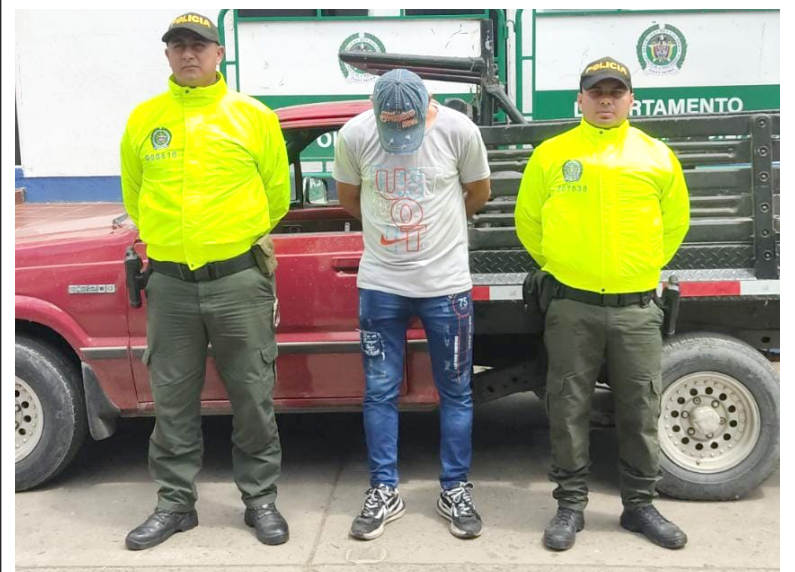
Este sujeto fue presentado ante la Fiscalía 38 local URI a espera que se defina su situación judicial.

Cabe anotar que el capturado al momento de presentar los documentos, presentó una licencia falsa, por lo que los técnicos automotores al verificar los sistemas de identificación (motor y chasis) identifican el requerimiento por hurto. Por esta razón los investigadores adelantan el proceso judicial con las autoridades del Valle del Cauca, para corroborar si el capturado tendría que ver algo en el hurto.