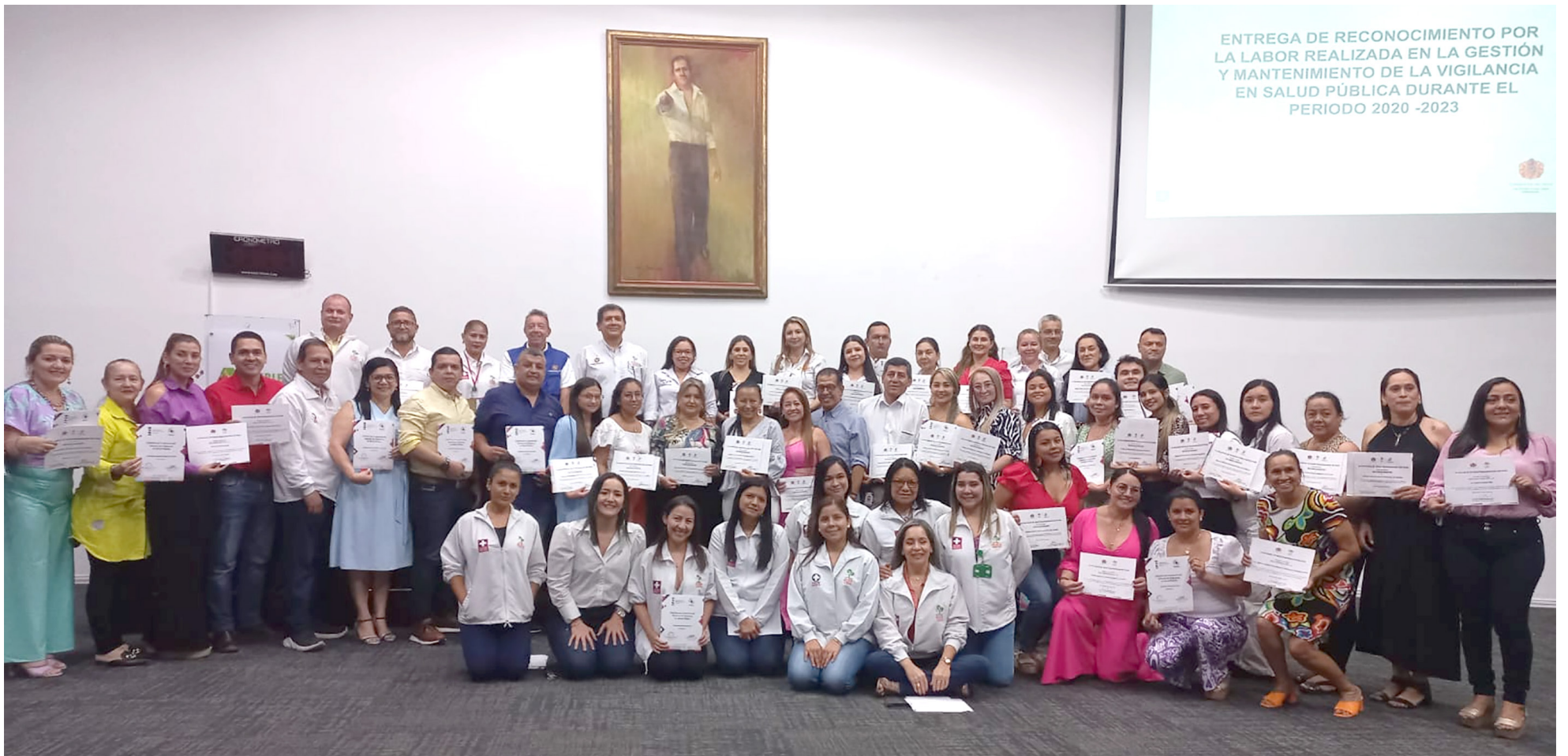
Reconocimiento a la labor de vigilancia en salud pública de los 37 municipios del Huila