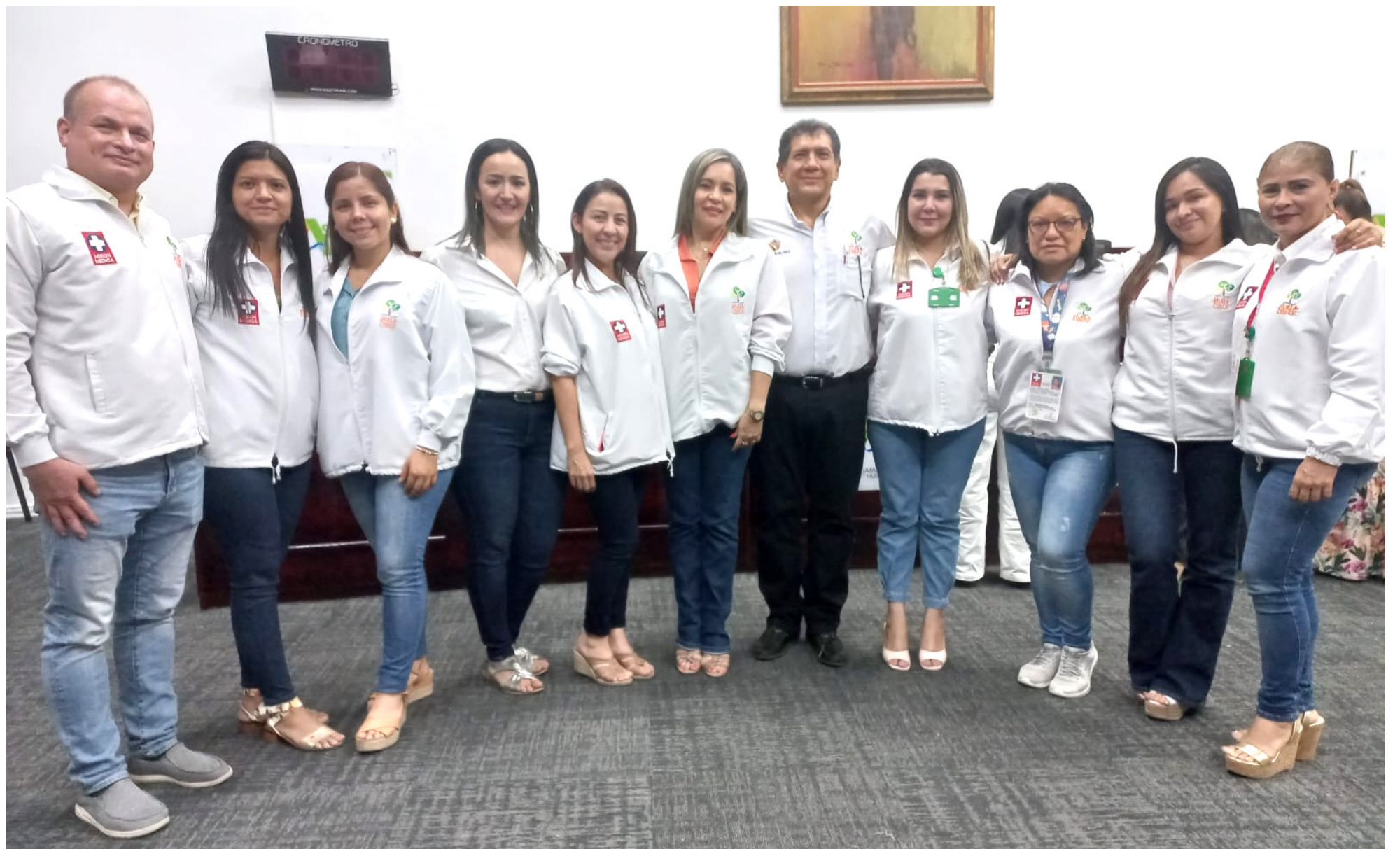
Cinco municipios cumplieron con los ítems con mejor desempeño en Salud Pública