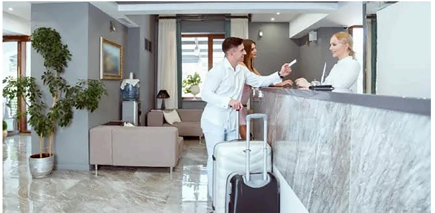
La tasa de ocupación nacional de los establecimientos de alojamiento para el primer semestre de 2023 se ubicó en 51,5 %.

Ante el panorama del departamento Archipiélago, el Viceministerio de Turismo adelanta asistencias técnicas en temas de planificación turística.