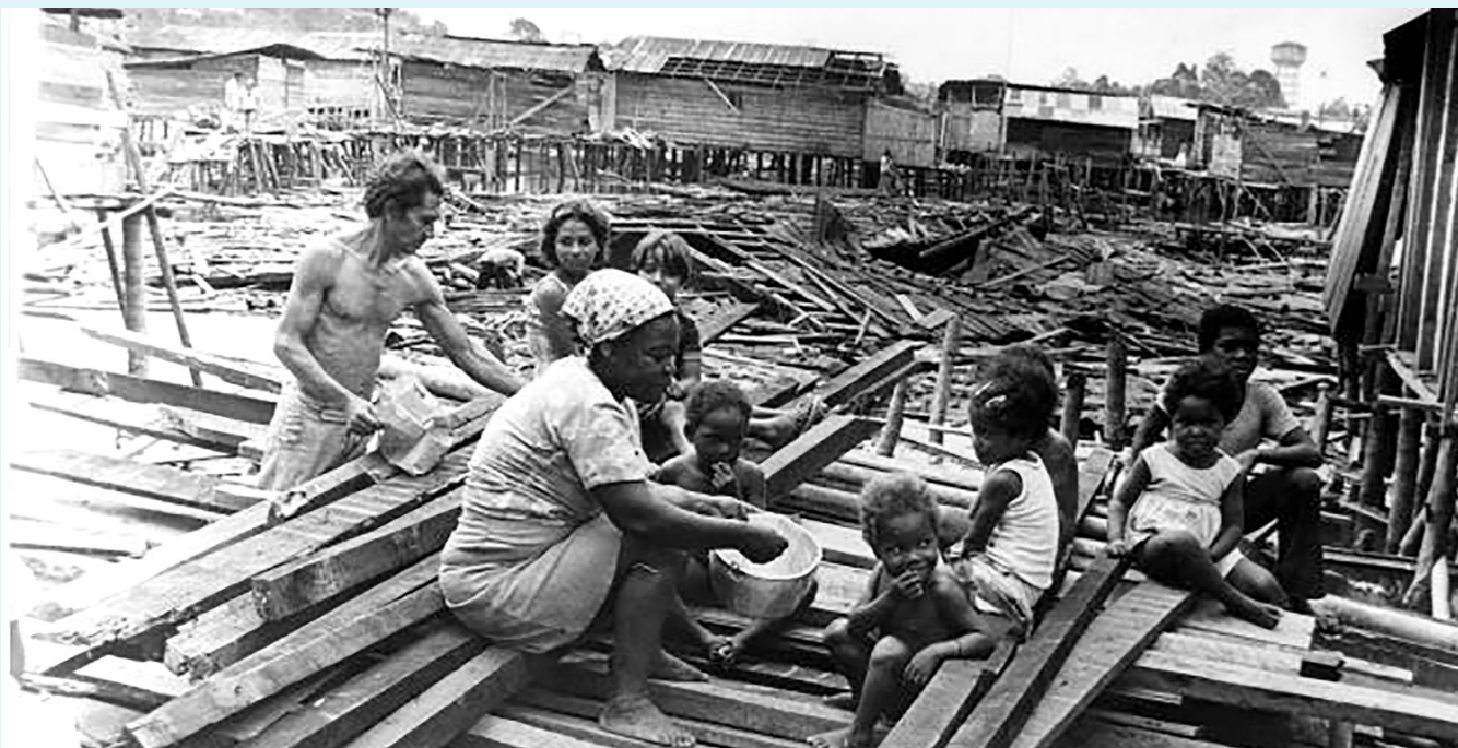
Sismo y tsunami del 12 de diciembre de 1979 en la costa Pacífica.

El sismo y tsunami de 1979 ocurrió 19 días después del terremoto que afectó al Eje Cafetero el 23 de noviembre de ese mismo año, un sacudón que se sintió en gran parte del territorio colombiano y que, según observaciones de los testigos, llevó hasta la costa comprendida entre Guapi y Tumaco unas tres olas de tres metros de altura que destruyeron a su paso viviendas construidas en madera que habían resistido al movimiento telúrico.