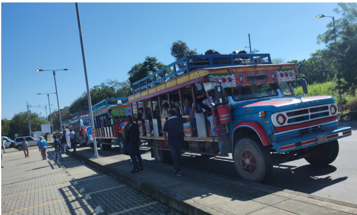
La delegación de Riosucio Caldas ya viene por el valle del Río Risaralda rumbo a la movilización cafetera de Armenia.