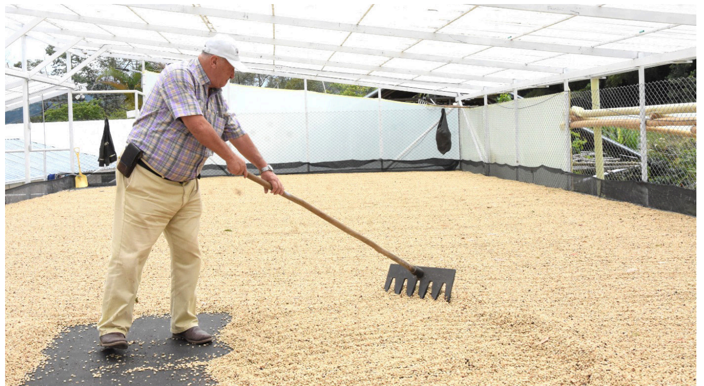
Uno de los logros de la asociación ha sido unir a la comunidad para buscar mercados diferenciados del café.

A la fecha, el grupo asociativo San Isidro cuenta con 85 asociados, más de 660 hectáreas en cultivos de café y 500 hectáreas en reserva natural, que la consideran un pulmón para el sur del Huila.