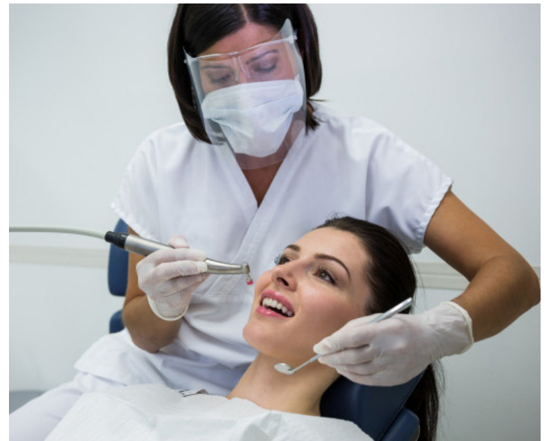
Las mujeres tienden a sufrir más ansiedad y estrés conforme van pasando los años.

Adicionalmente, estos alimentos contienen fósforo, mineral que protege el sistema nervioso y vitaminas B5, B9 y B12, que permiten luchar contra