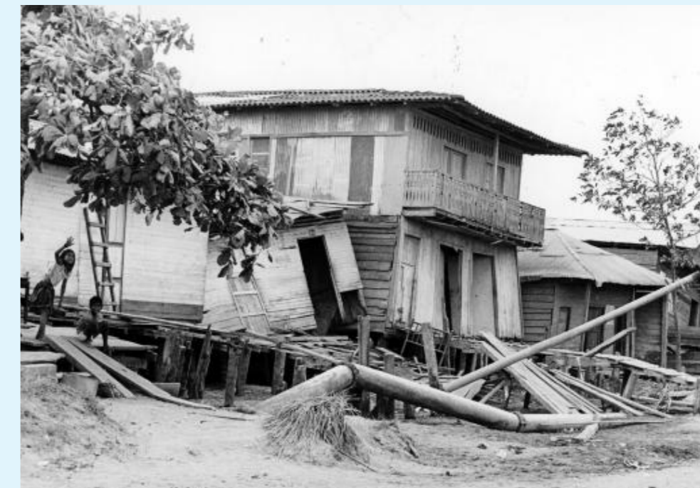
Casas destruidas en Tumaco por el sismo del 12 de diciembre de 1979.