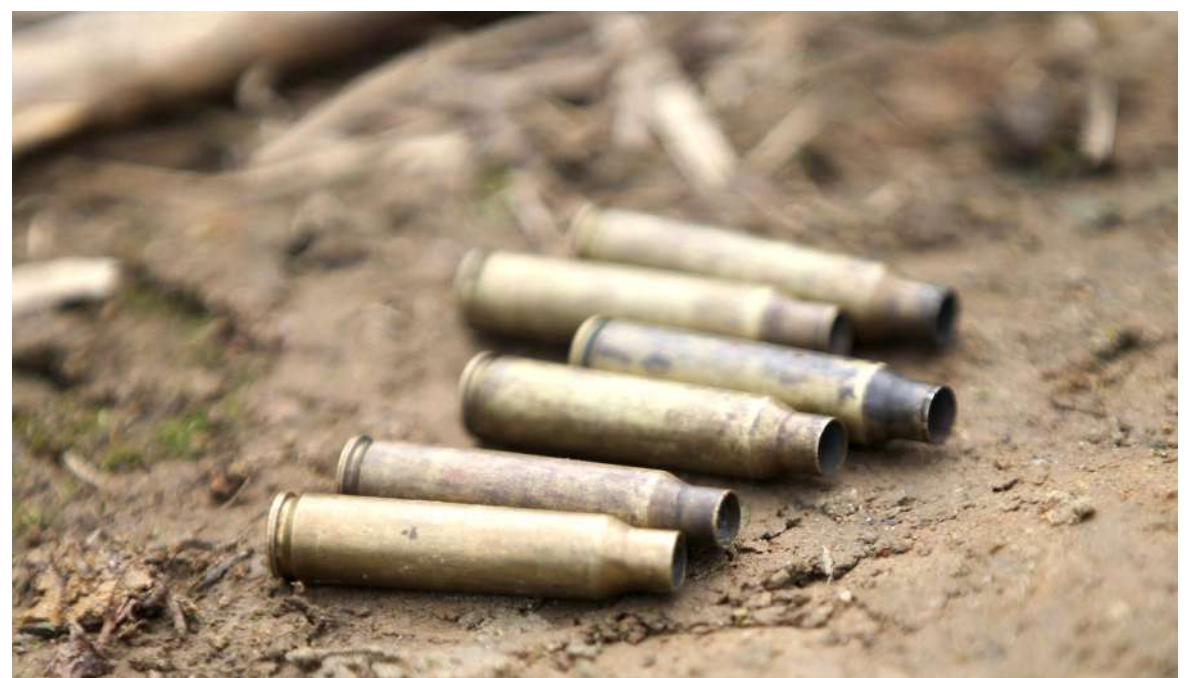
3 víctimas mortales más en el Putumayo.