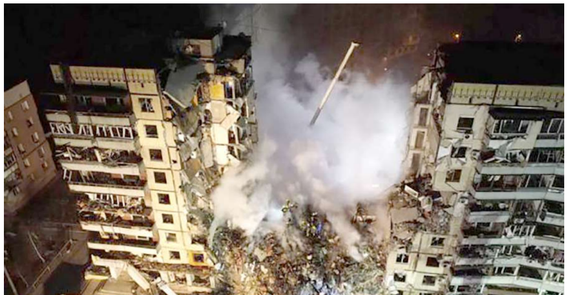
Es uno de los ataques más brutales desde el comienzo de la invasión rusa en Ucrania hace 11 meses. Al menos 40 personas murieron y 75 quedaron heridas al derribarse un complejo de apartamentos en Dnipro, en el este de Ucrania, por el impacto de un misil el sábado. Entre los muertos hay una adolescente de 15 años. Además, dos niños han quedado huérfanos, según las autoridades ucranianas.