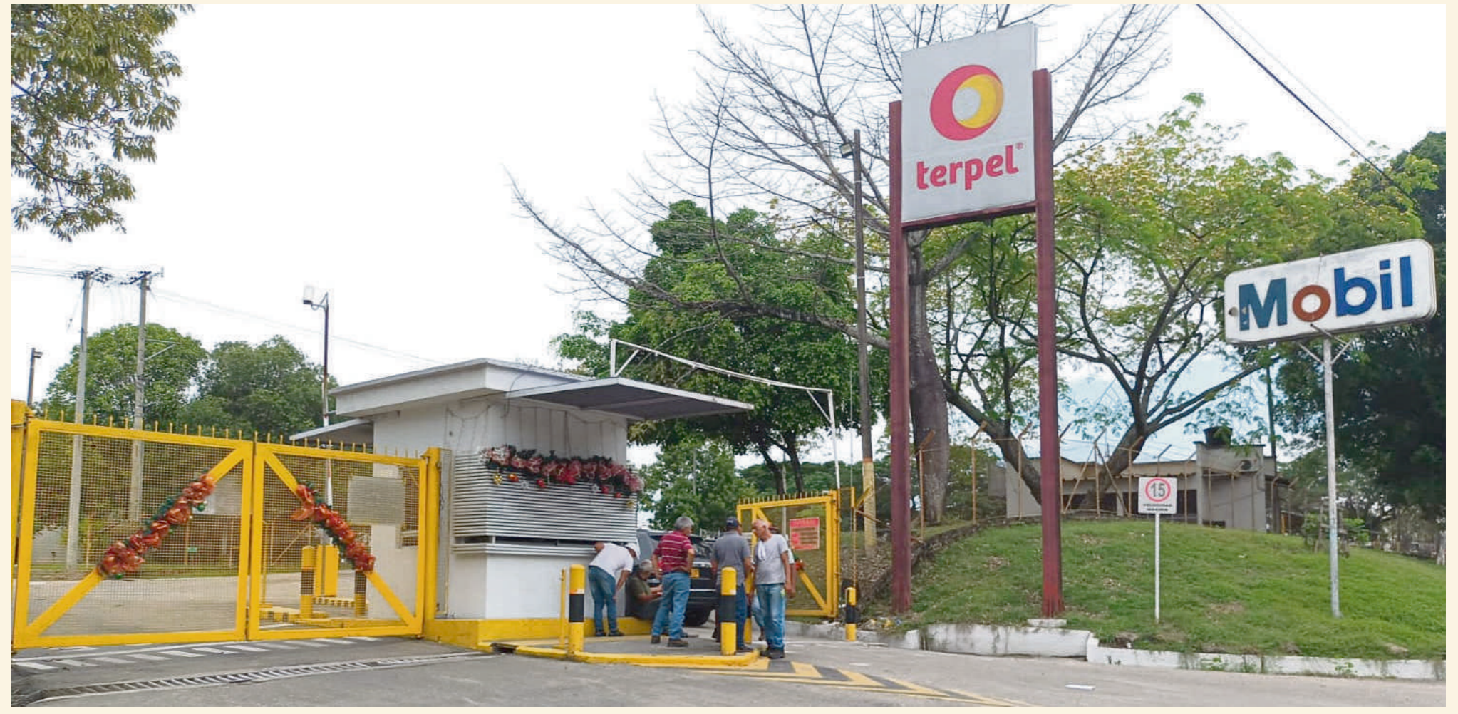
La planta de Terpel atiende la demanda para el sur del país