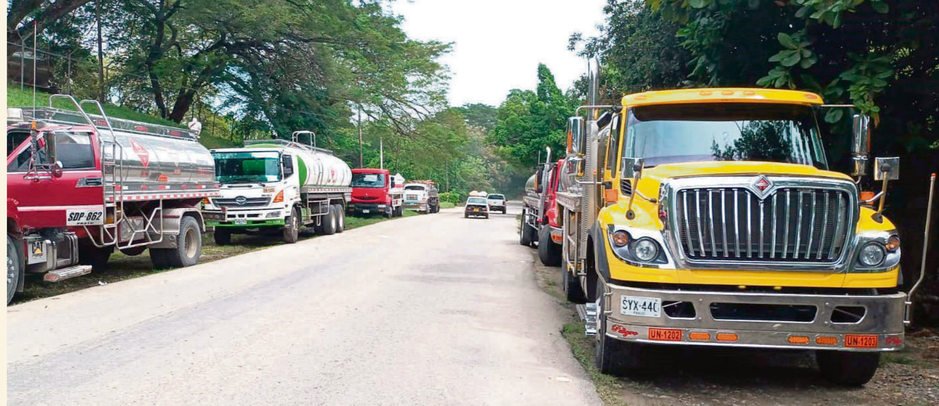
Los camiones se parquearon a lado y lado de la vía a Fortalecillas.

Después de haber recorrido 1.700 kilómetros desde la ciudad de Pasto, pasando por Quito, subiendo a lago agrio, pasando al Putumayo hasta llegar a este sitio en zona rural de Neiva”