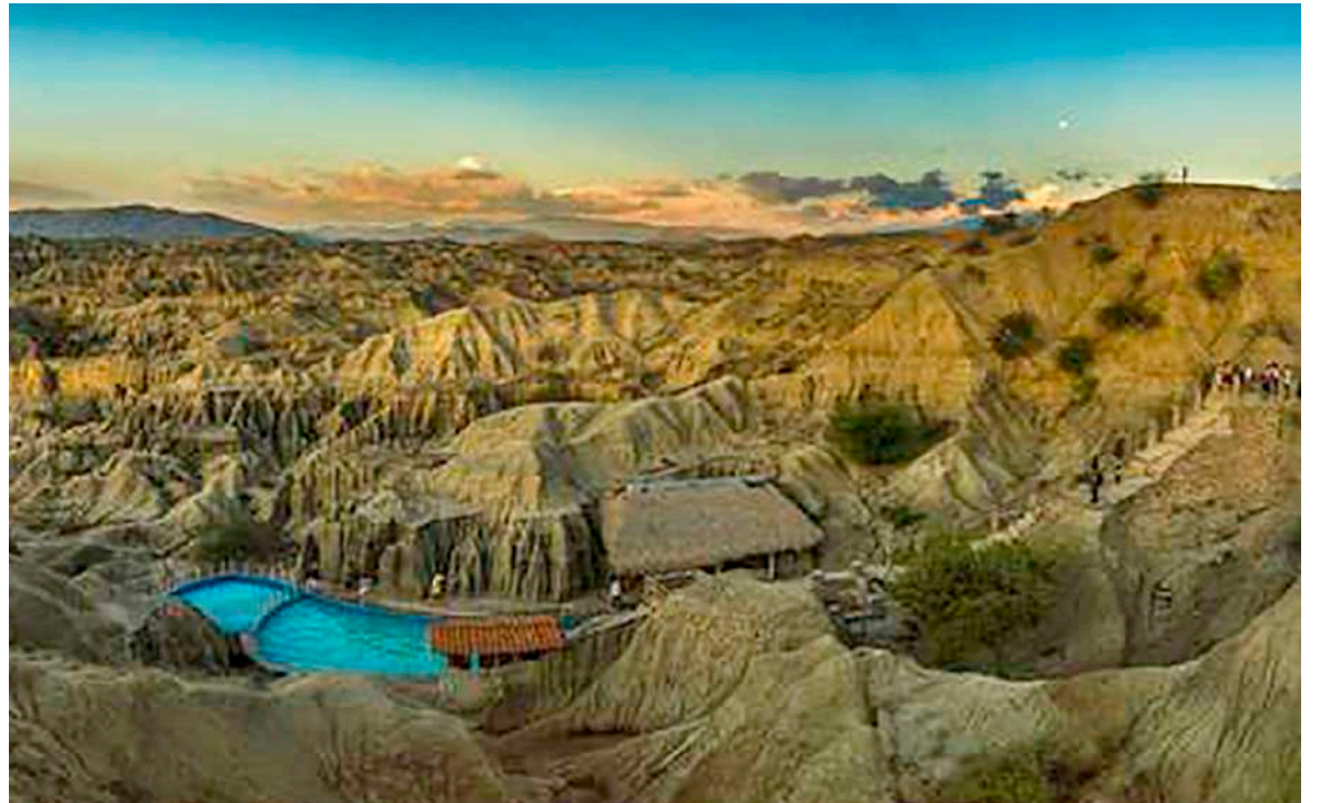
La reactivación en el 2021 se estimó en un 30% después de estar en cero y la proyección era que a partir del año 2022 siguiera creciendo un 8% anual.

La reactivación en el 2021 se estimó en un 30% después de estar en cero y la proyección era que a partir del año 2022 siguiera creciendo un 8% anual, de tal manera, que sobre el año 2030 se pudiera equilibrar con respecto al año 2019.