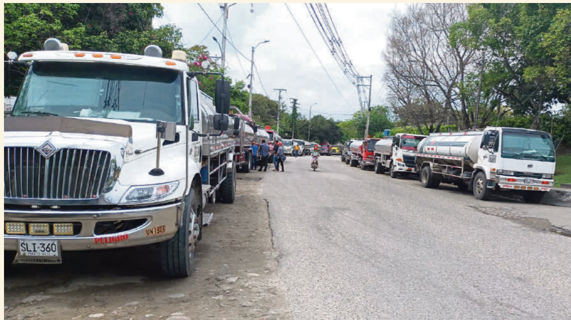
Llegaron camiones especialmente de Nariño.

“Nos tocó dar la vuelta por el Ecuador para poder ingresar por el Putumayo y luego llegar