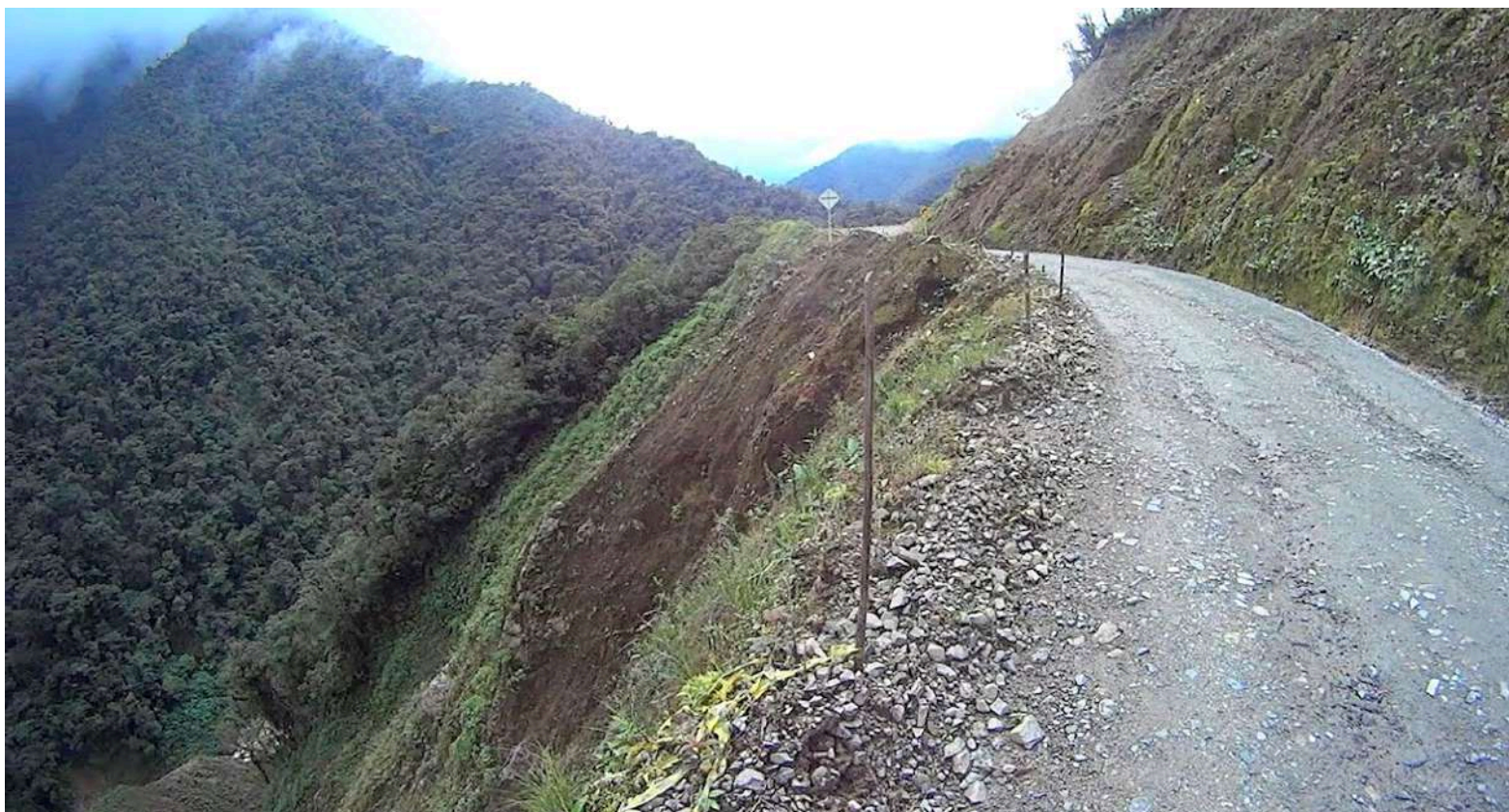
Sector del ‘trampolín de la muerte’.

Sin embargo, muchos conductores se abstienen de transitar las vías alternas porque se les dañan sus vehículos, se agotan fuertemente, se triplican los gastos y el riesgo es alto, además, de tener que aguantar largas filas generadas. Igualmente, la otra vía alterna que sale frente a Rosa – Quindío – Popayán es muy estrecha, pero, insistió en que, “los transportadores somos valientes y quienes movemos la economía del país. Buscamos ayuda de todo el pueblo porque no solamente