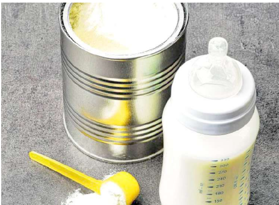
Las leches artificiales no tienen el mismo grado de alimentación que la leche humana y tampoco los mismos beneficios.