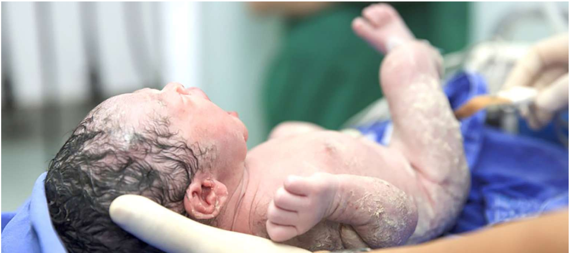
Preocupación por parte de la ONU por la tasa de mortalidad en bebés antes del primer mes de vida.