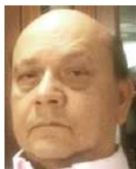
Luis Humberto Tovar Trujillo

Por las decisiones adoptadas en este gobierno, malas por demás, donde su credibilidad populista, cada día llega a niveles de desastre; como buen personaje de la extrema izquierda, no da pie con bola en nada de la realidad nacional.