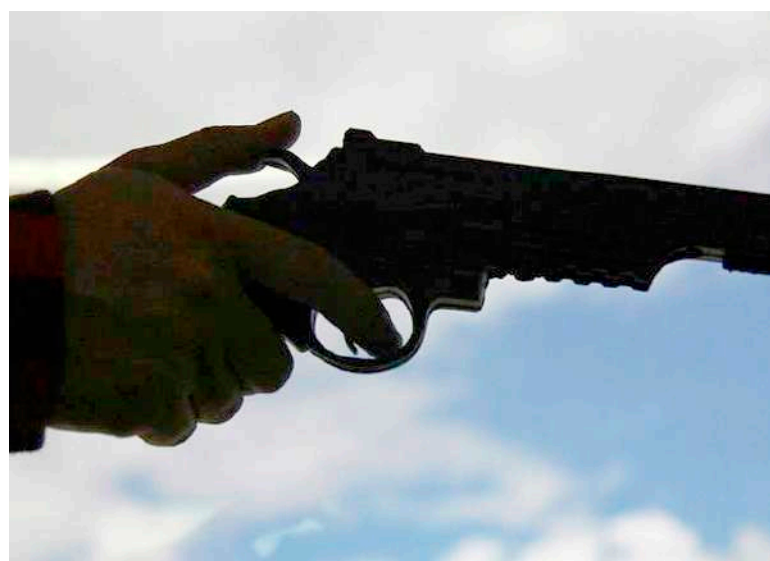
Dos fueron las víctimas de este hecho.

Según el coronel Gustavo Adolfo Camargo Romero, comandante del Departamento de Policía Huila, los controles conjuntos con el Ejército Nacional son permanentes en puntos estratégicos del Departamento, para evitar el transporte de sustancias o elementos peligrosos que puedan llegar afectar la seguridad de los habitantes del departamento.