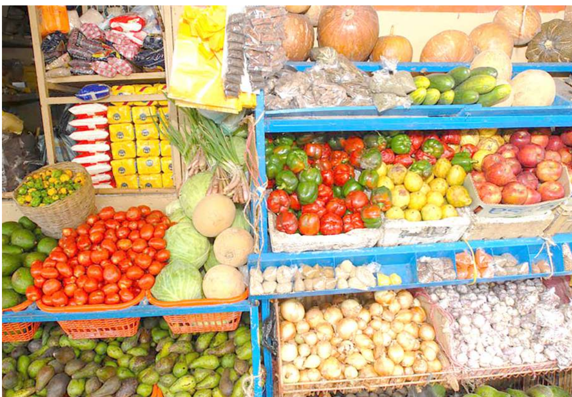
Llega impuesto a los alimentos y bebidas ultra-procesadas

Y en cuanto a los lácteos el 42% de los encuestados dijo consumirlos de 1 a 3 veces por semana mientras que el 31% lo hacía de 3 a 5 ocasiones por semana, seguido de un 23% que lo hacía 5 veces por semana y de un 4% que lo hacía ocasionalmente.