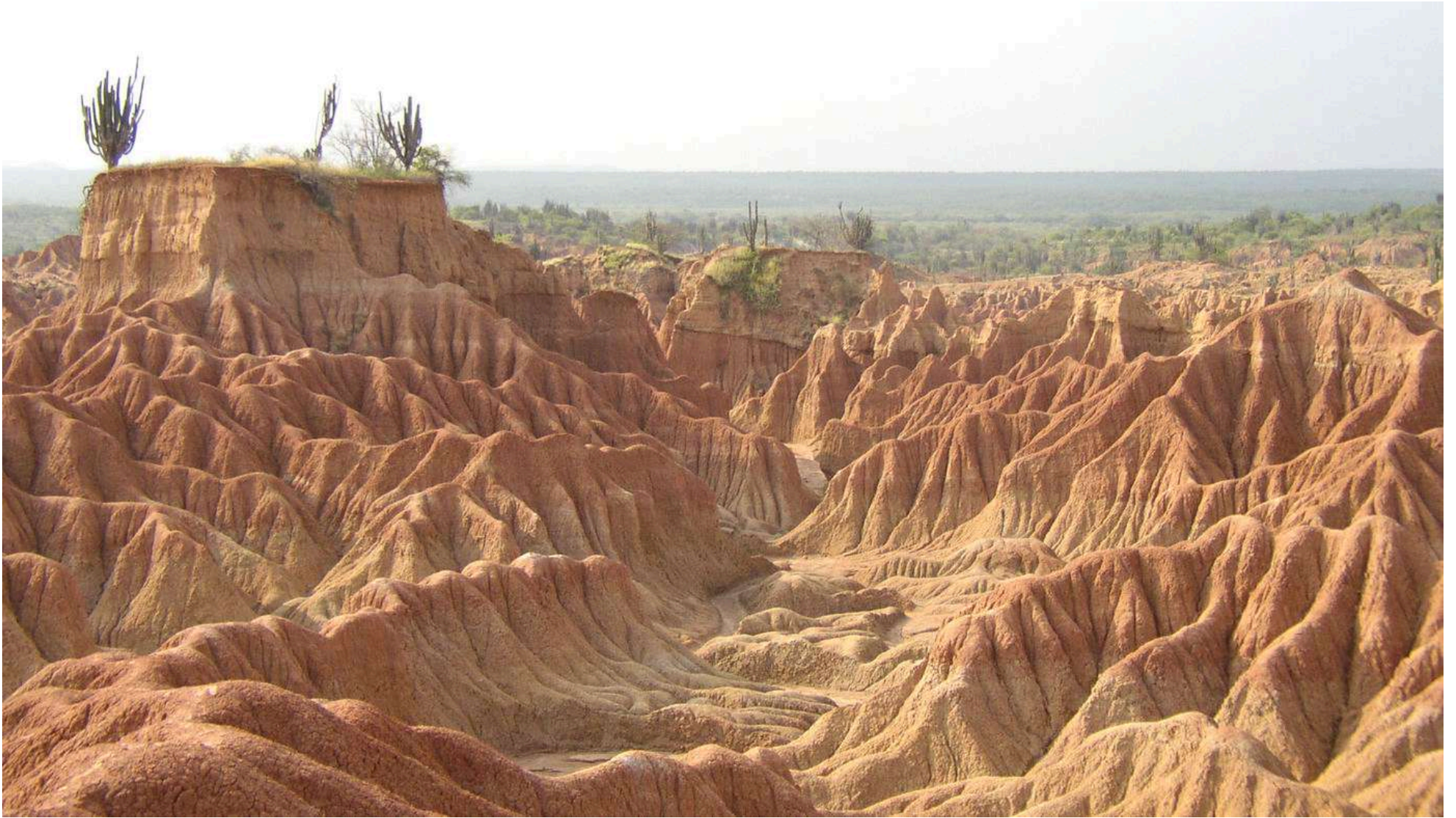
Turismo del Huila debería implementar mayores estrategias