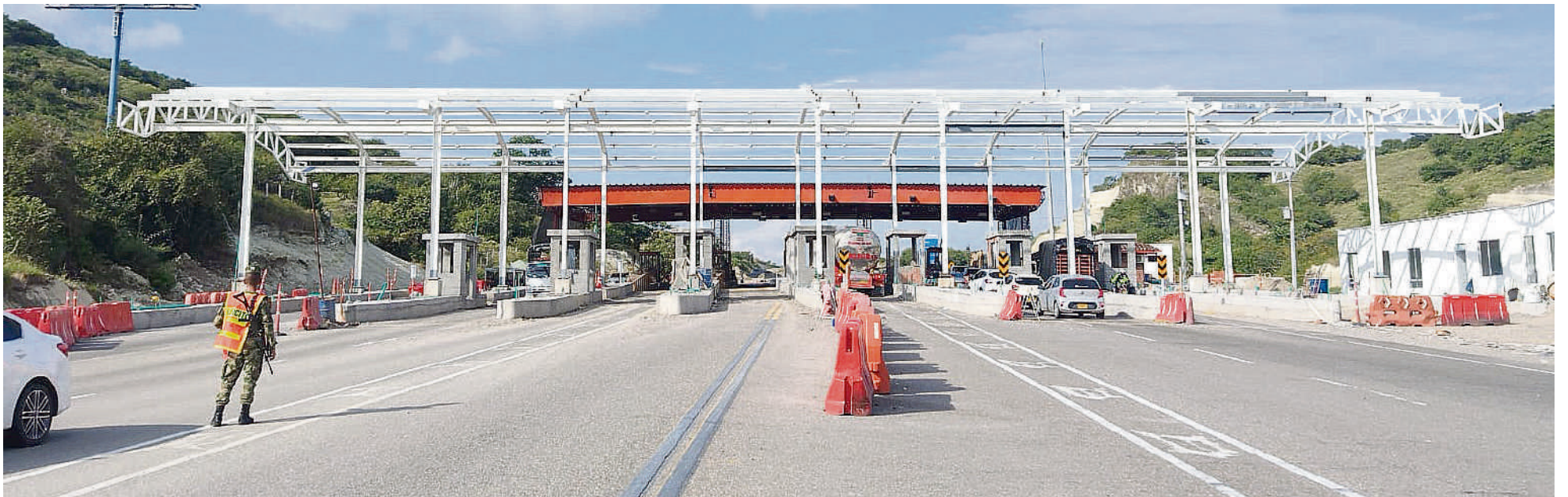
Peaje Los Cauchos que tuvo que reajustar sus tarifas.