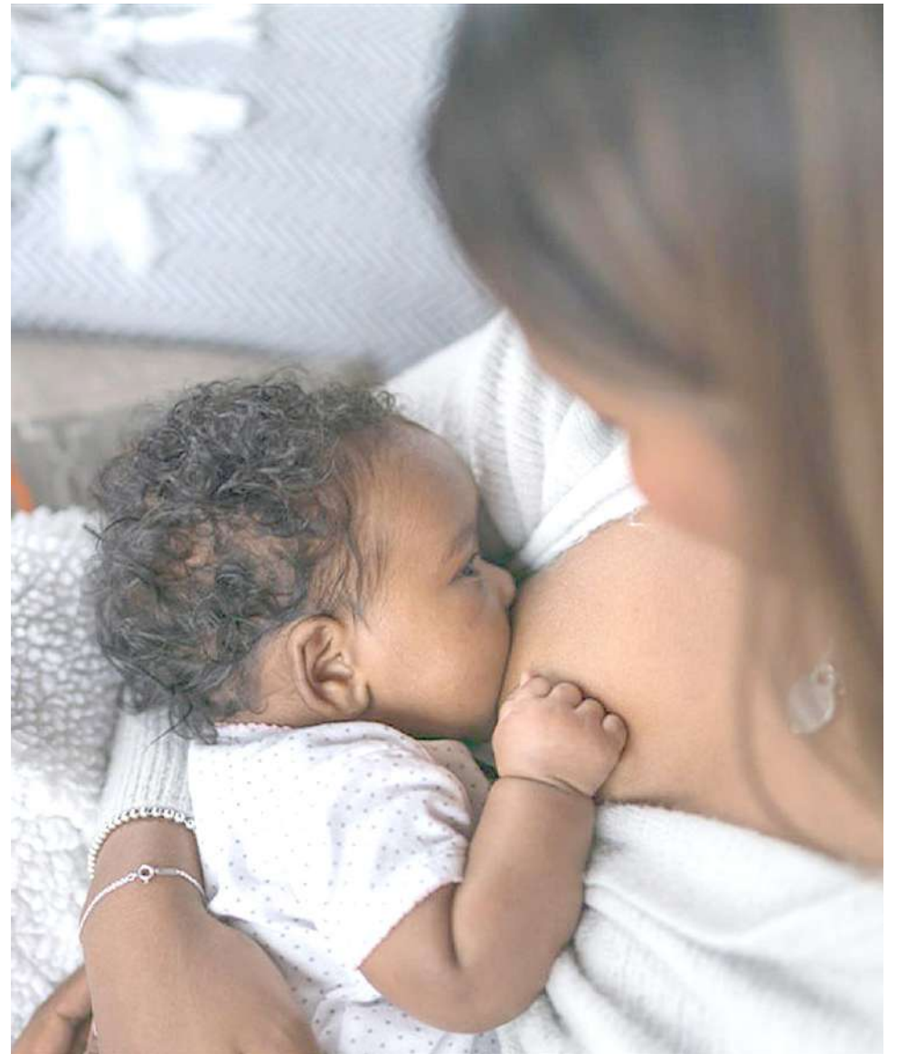
Amamantar causa beneficios en la madre y en el bebé.

En este momento, lo que más ocupa a la OMS es que las estrategias de marketing usadas por las empresas que venden productos con la falsa promesa de que pueden reemplazar la leche materna, están logrando que las mamás dejen de lactar.