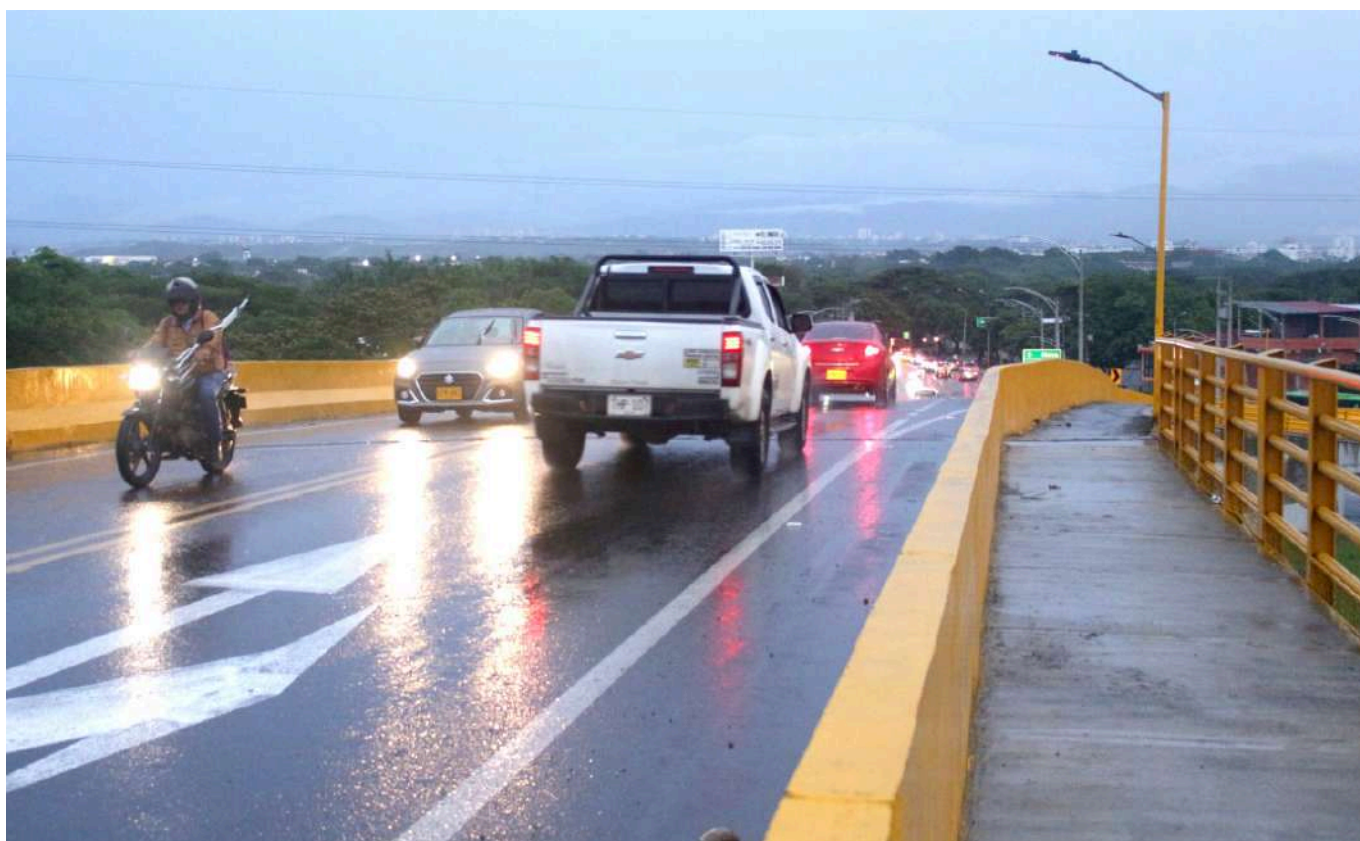
Eso resulta grave porque no solamente repercute en los territorios aledaños, sino que, genera impacto a nivel nacional.