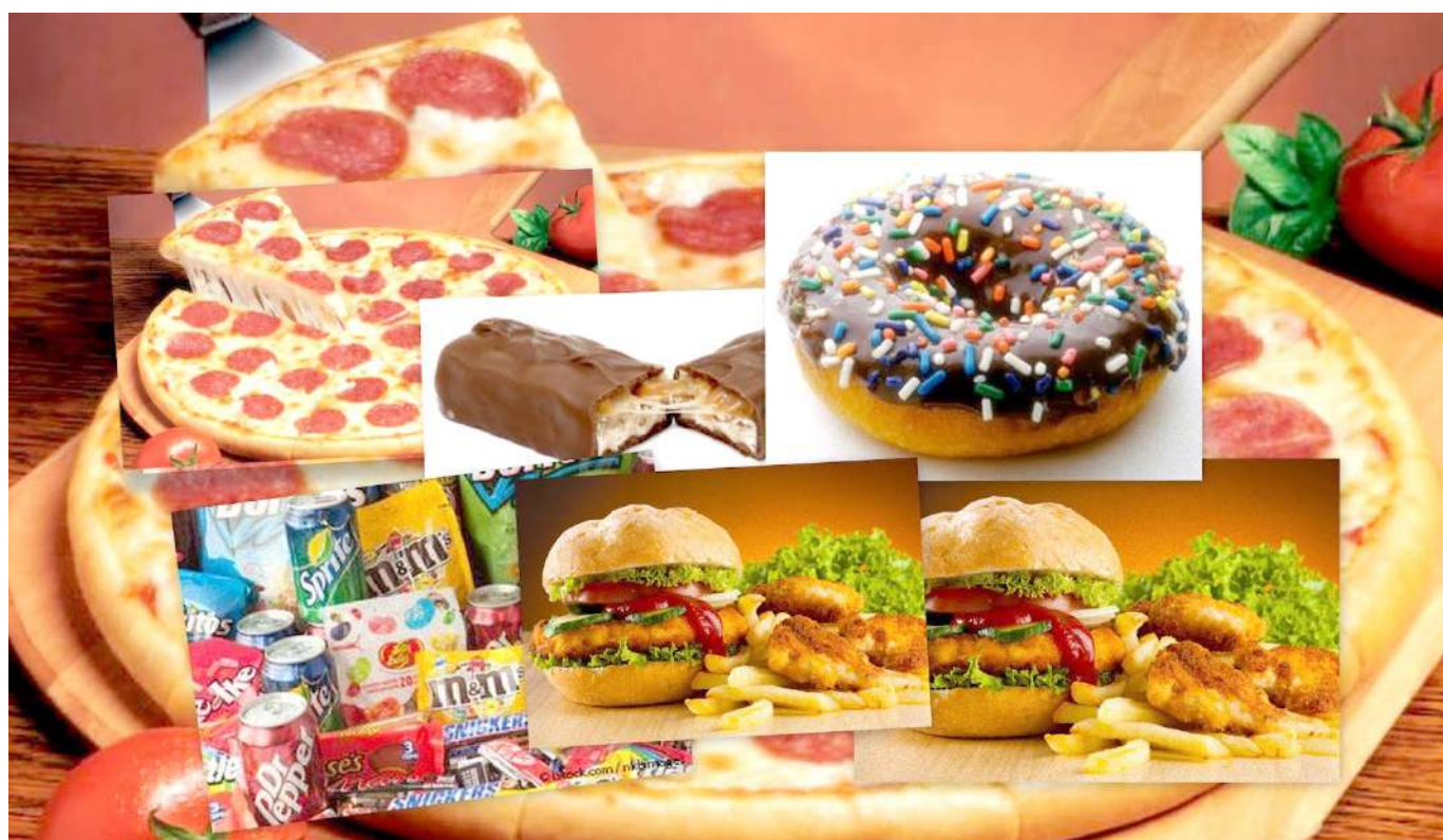
El 89% de los colombiano consumen alimentos saludables en su dieta.

En el caso de las verduras, el 43% de los encuestados las consumía de 1 a 3 veces por semana, mientras el 41% las comía de 3 a 5 veces y el 16% lo hacía más de 5 veces en este mismo lapso.