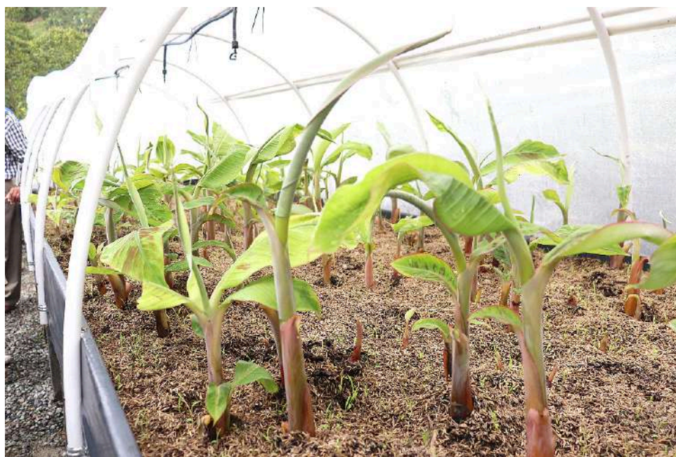
El proyecto ha empezado a dar buenos frutos.

Es así como, en tiempos de pandemia, algunos productores tomaron la decisión de unir esfuerzos y articularse para desarrollar proyectos de investigación y generación de tecnologías para el sector agropecuario. Con esta estrategia, las instituciones con capacidades para investigar, transferir e innovar, buscaron un posible financiador para generar alternativas de solución; en este caso los productores de plátano del Huila habían manifestado en diferentes escenarios, la necesidad de disponer de semilla de calidad e incrementar la productividad en el departamento, ya que es una de las más bajas a nivel país.