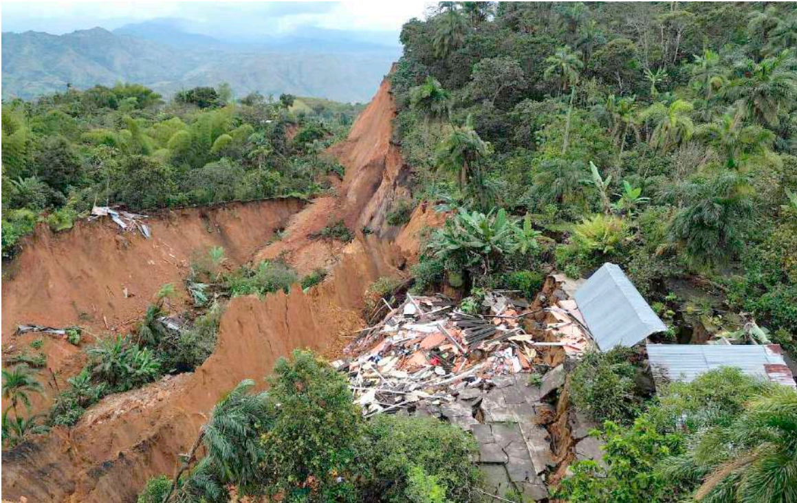
Un difícil panorama se ha generado luego del cierre de la vía Panamericana en el kilómetro 75 por cuenta del derrumbe ocurrido en el municipio de Rosas

nos beneficiamos nosotros, sino las ciudades y el departamento”.