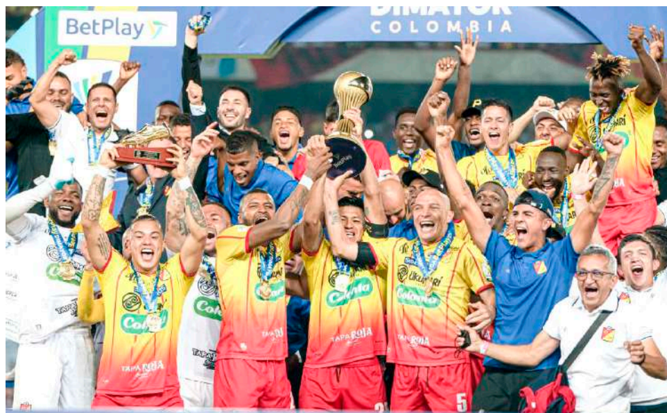
Deportivo Pereira es el actual campeón.

Ahora falta conocer el formato y fecha de inicio para que el único equipo colombiano que ha sido campeón de la Copa Libertadores Femenina, El Atlético Huila se estrene en el nuevo torneo.