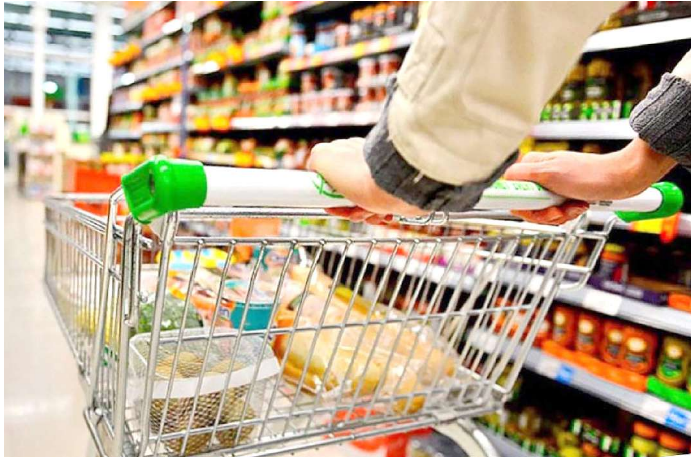
Colombianos tendrán que hacer un ajuste económico en el 2023 para temas de alimentación.

Así las cosas, estas cuentas ya no van a dar, pues los costos en la alimentación prácticamente cambiarán la ecuación de los gastos del hogar.