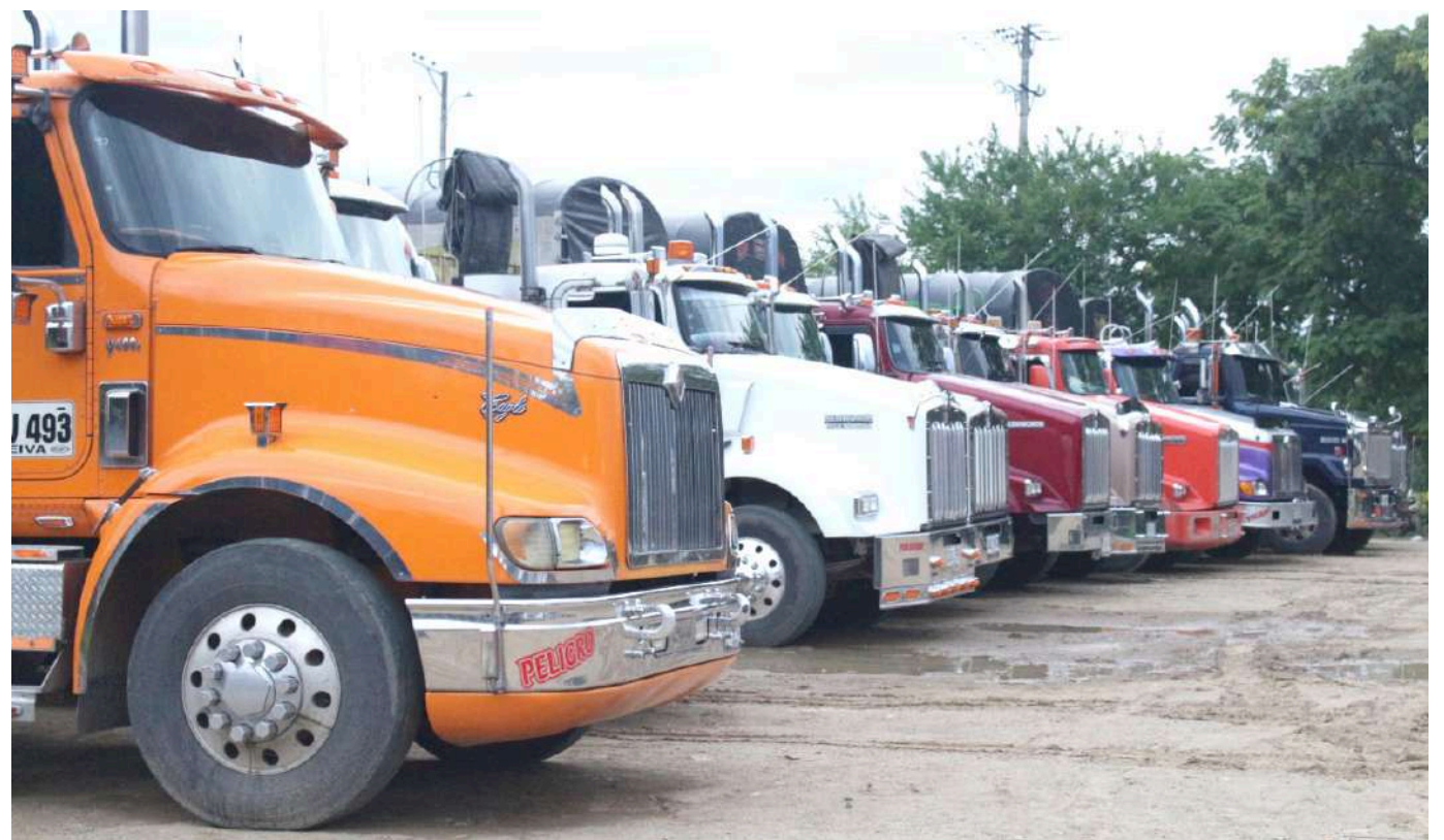
Transportadores huilenses afectados por el cierre de la vía Panamericana.

Según estimaciones de Fedetranscarga, hay 1.000 vehículos atrapados entre los departamentos de Cauca y Nariño.