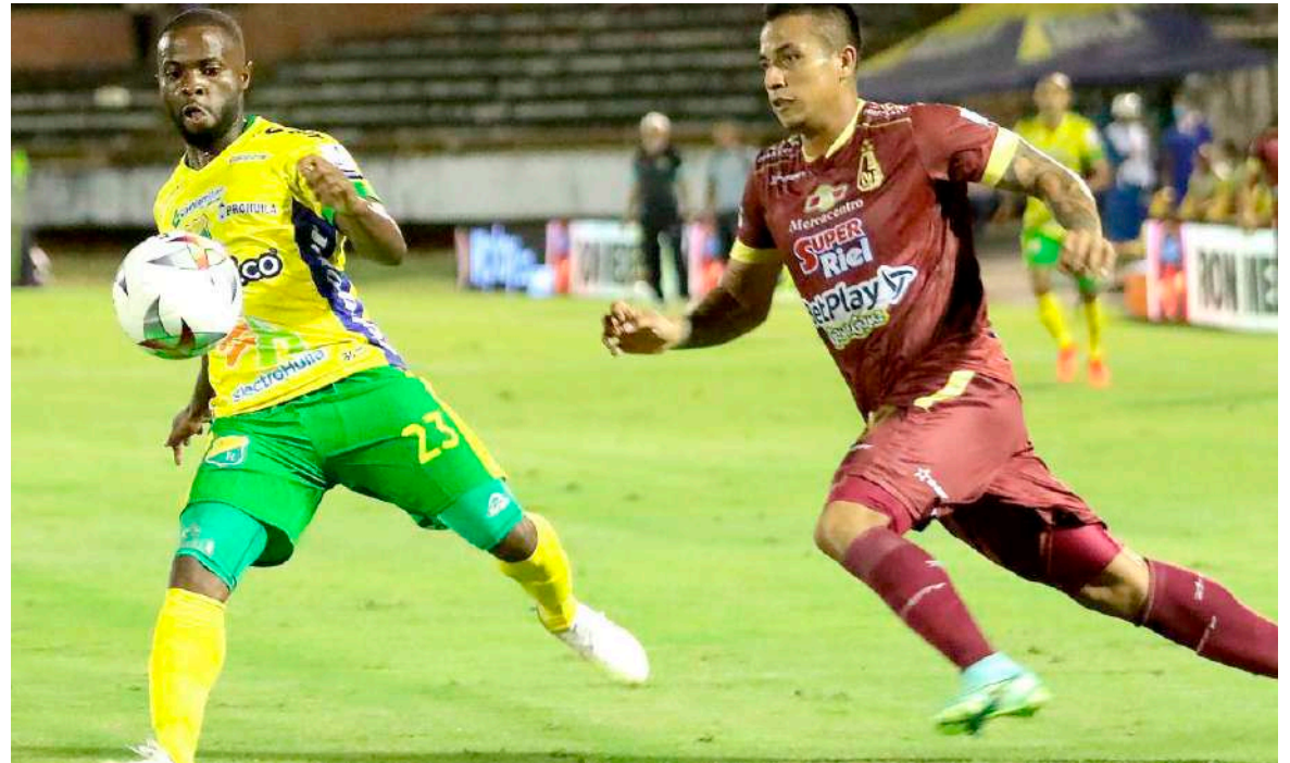
Vuelve la Liga profesional en Colombia.

Huila que retorna a la primera división será visitante en el Sierra Nevada de Santa Marta ante el Unión Magdalena el miércoles 25 a las 3 y 10 de la tarde.