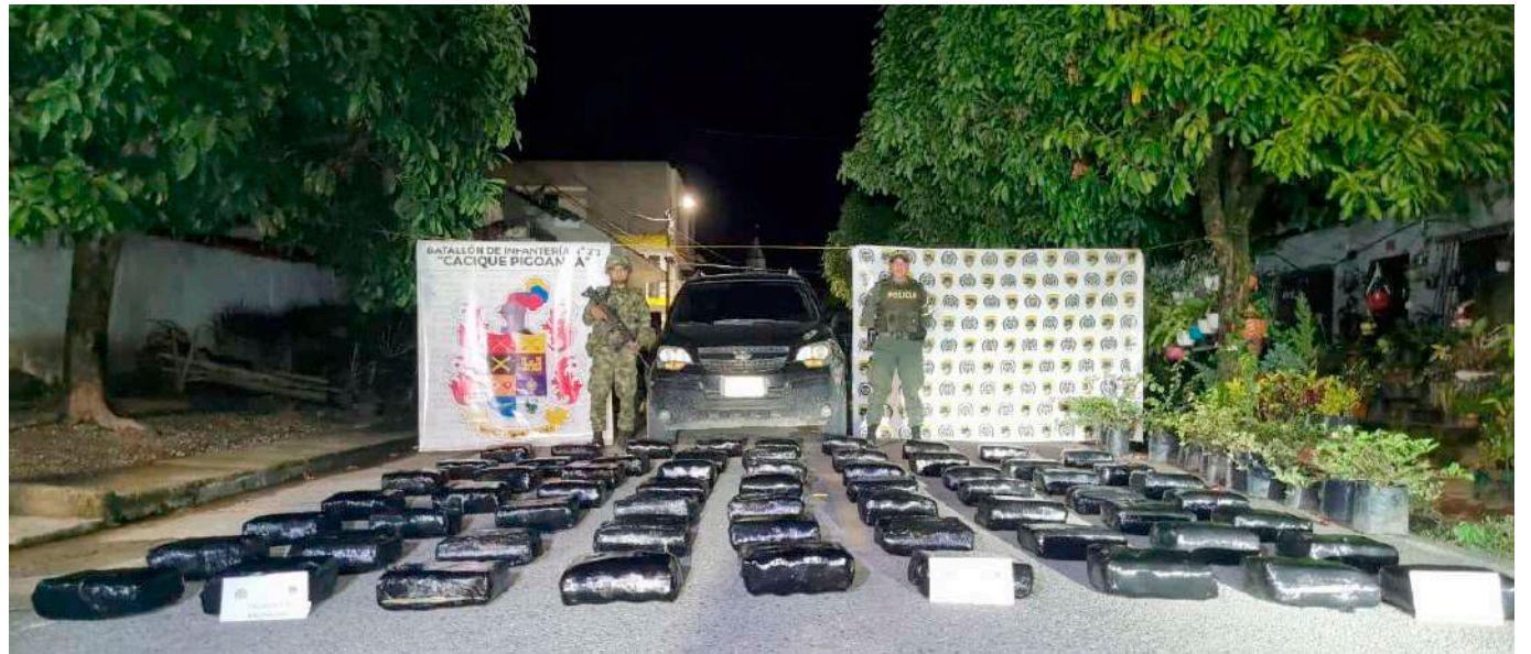
El material incautado.