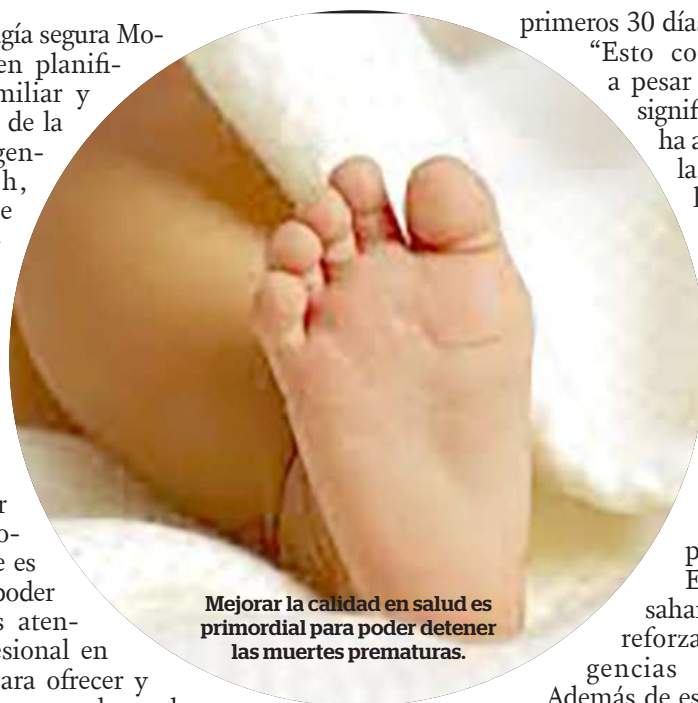
Mejorar la calidad en salud es primordial para poder detener las muertes prematuras.

Hay que decir, que, pese a que en la cifra en el 2021 se redujo en comparación con la del 2017, esta no tiene una reducción lo suficientemente significativa pues en el 2017 murieron 2,5 millones de bebés que murieron en su primer mes y para el 2021 2,3 millones de niños y niñas recién nacidos que no sobrevivieron los