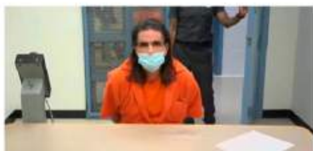
Alex Saab enfrentó por primera vez a la Justicia de EE.UU