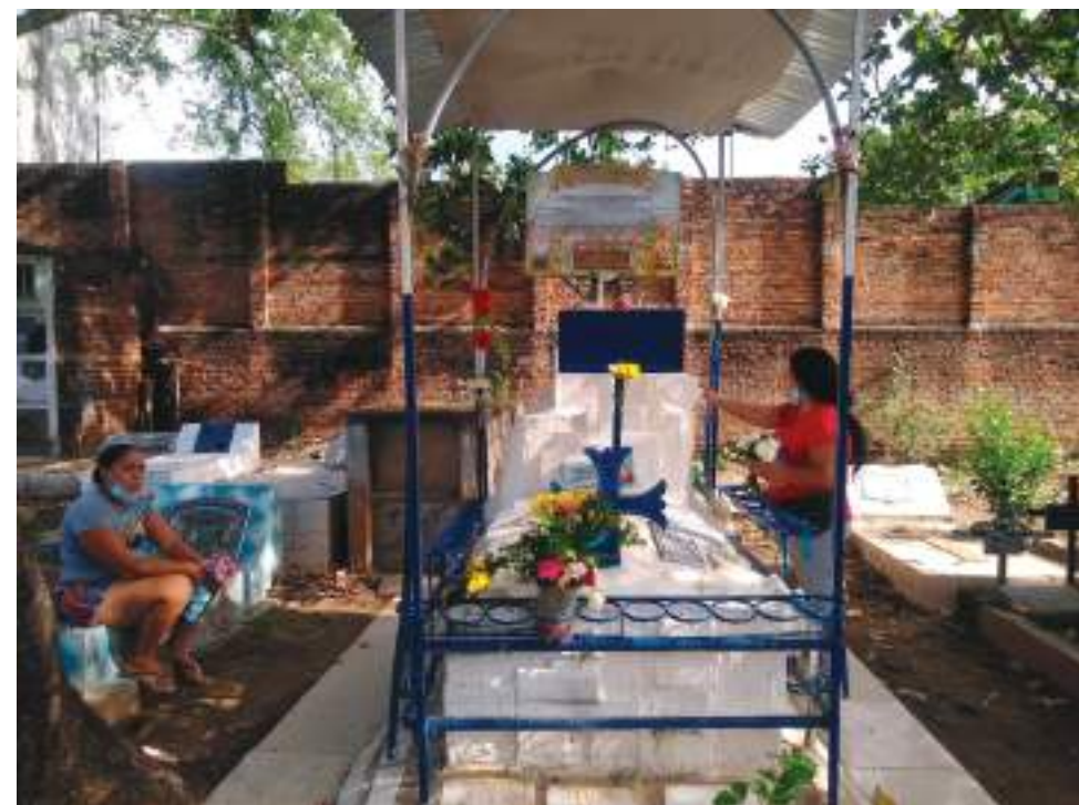
Al ingresar al camposanto, que guarda más de 130 años de historia en cada uno de los mausoleos, bóvedas y sepulcros, nos encontramos con una gran romería de gente que llega a rezar o acompañar a un amigo.