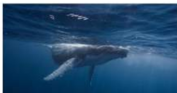
Estudiarán los riesgos de las especies marinas por el calentamiento