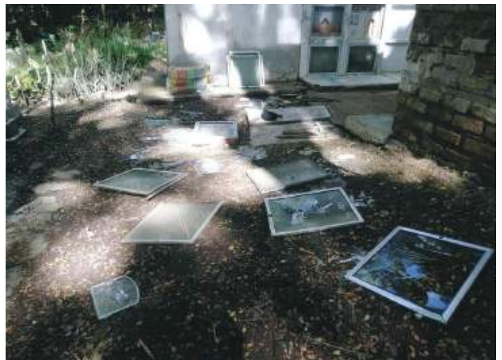
Panorama de la situación que se vivió en el cementerio.