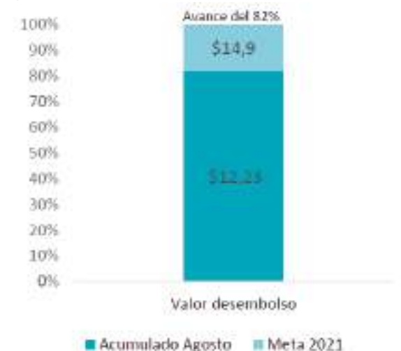
Movilización acumulada vs. Meta de movilización

La colocación de créditos del sistema financiero con garantía FNG destinados a la línea empresarial, se concentra en 2021 principalmente en la ciudad de Bogotá con un 31,5%, seguido de los departamentos de Antioquia 16,6% y Valle del Cauca con un 8,9%. En el departamento del Huila se han colocado el 2,0% de los créditos durante el año, a nivel nacional.