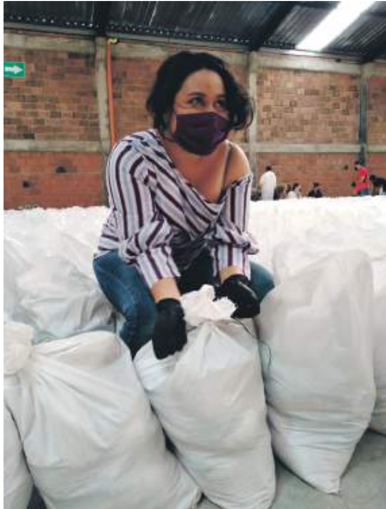
“Yo no quiero que las personas se sientan solas como en algún momento yo llegué a estarlo”

“Las personas que deseen ayudar con su granito lo puedan realizar, pues manejamos una cuenta bancaria donde las personas que quieran aportar recursos económicos para el sostenimiento de las diferentes actividades y proyectos sociales que tenemos. La autogestión, muchas veces nosotros lo