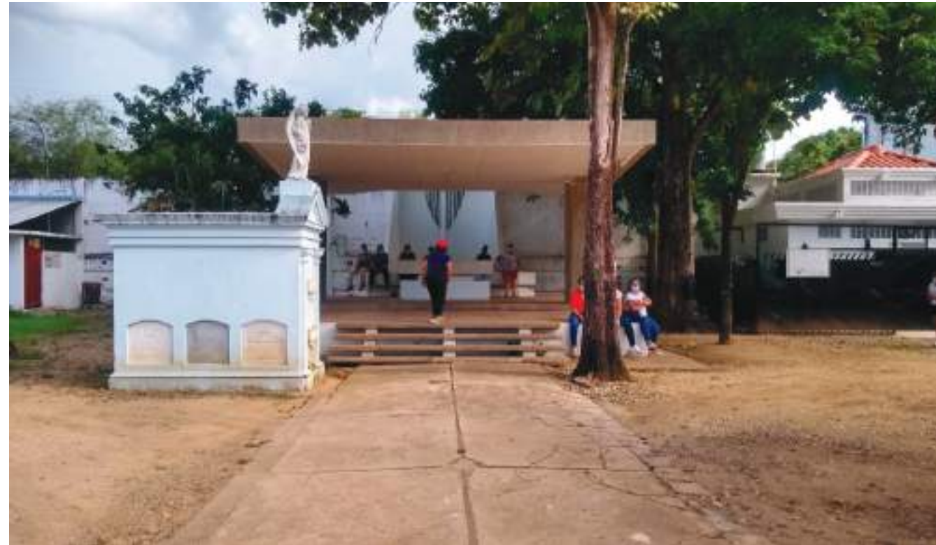
Estas dos fechas están íntimamente unidas entre sí, como la alegría y las lágrimas encuentran en Jesucristo una síntesis que es fundamento de nuestra fe y de nuestra esperanza.