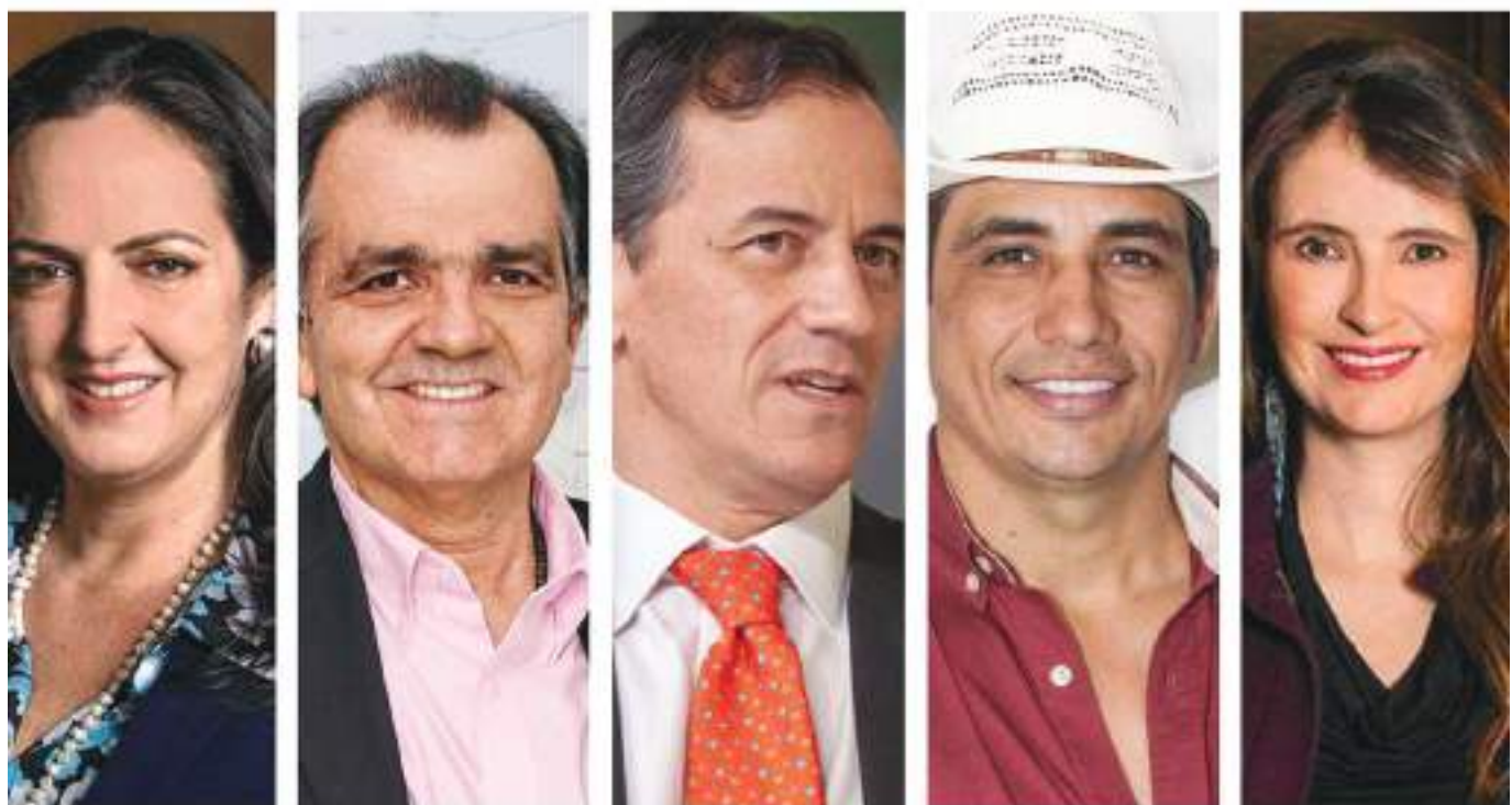
Centro Democrático: María Fernanda Cabal, Óscar Iván Zuluaga, Rafael Nieto Loaiza, Alirio Barrera y Paloma Valencia.

Como se ven las cosas, el panorama aún es incierto, y en estos escasos cinco meses cualquier cosa puede pasar.