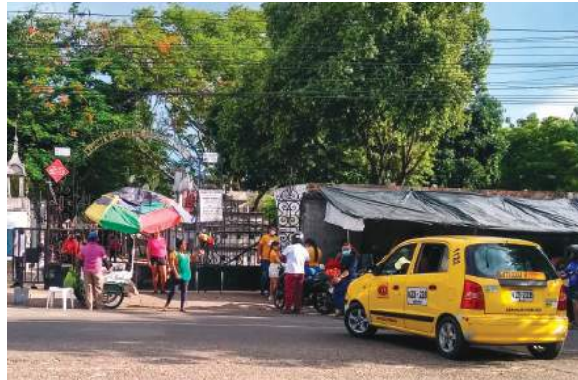
Los lunes se mantiene la tradición de visitar a los santos difuntos en Neiva.