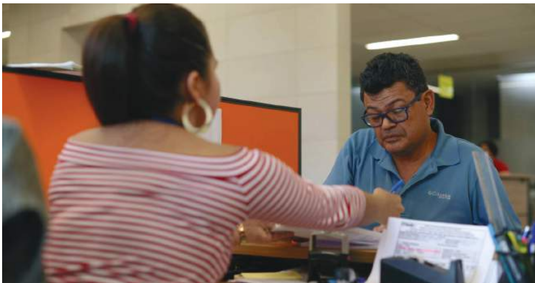
Varios millones de trabajadores independientes dejaron de percibir o vieron reducidos sus ingresos por el Covid-19.

El FNG garantizó créditos por valor de $48,7 billones durante el cuatrienio 2014-2018. Se ha establecido para el cuatrienio 2019-2022 una meta de garantizar créditos por valor de $58,5 billones.