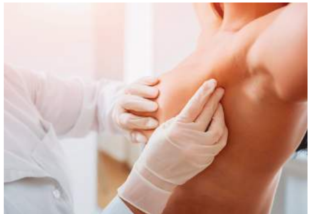
“A todas las mujeres, queremos invitarlas a que cuiden su salud y que no dejen de hacerse el autoexamen de forma mensual”.

“Así mismo, a las mujeres que han sido diagnosticadas con cáncer de mama, las invito a que no dejen de luchar, un diagnóstico jamás termina con nuestra vida, termina cuando decidimos dejarnos vencer y rendirnos ante la enfermedad”, sostuvieron.