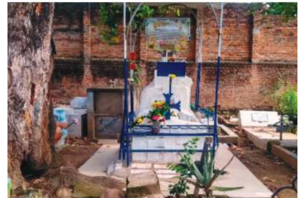
Las tumbas más visitadas son las del médico Hernando Moncaleano y del guerrillero Saúl Quintero. Se les atribuyen milagros.