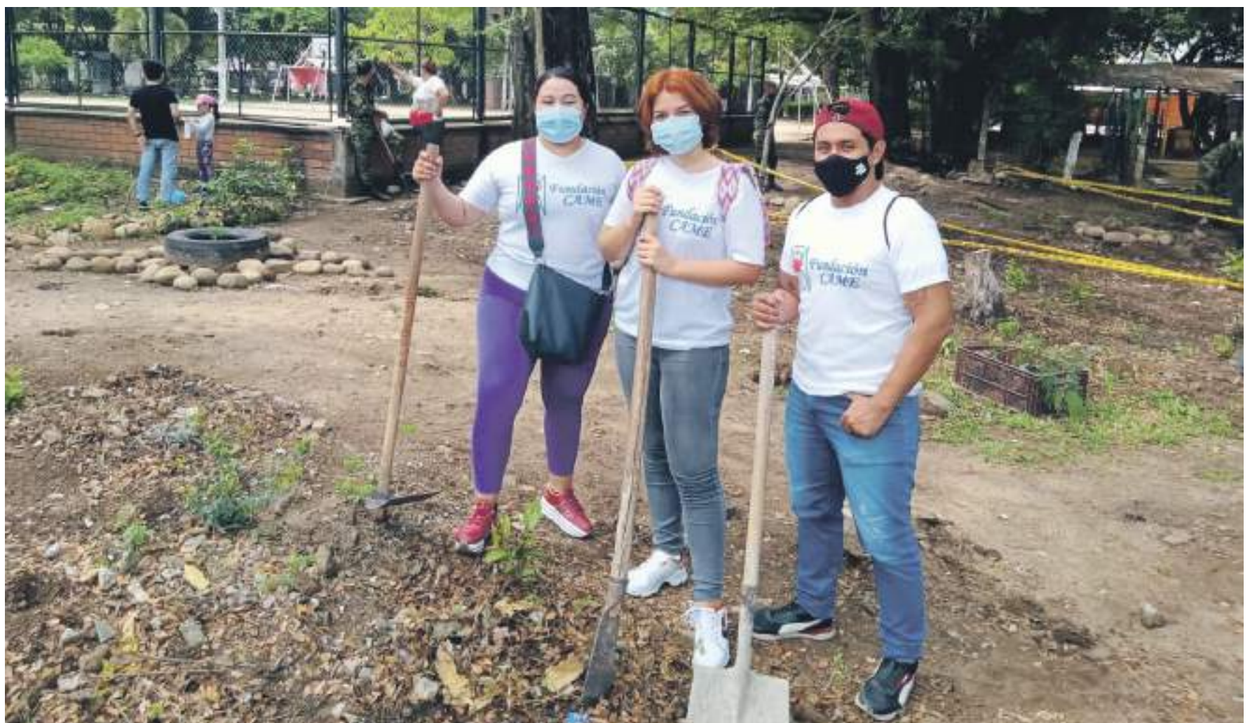
Ha ejecutado diferentes actividades con niños y jóvenes, en pro de su desarrollo.

Expresa que las personas deben sentir amor por el prójimo, y que esta labor humanitaria debe empezar por la familia, ya que, es un núcleo fundamental para cada persona, habla sobre las problemáticas actuales que vive tanto Neiva como Colombia, por ejemplo, la niñez en la calle, la migración, el conflicto armado, y demás, por ello invita a que, desde