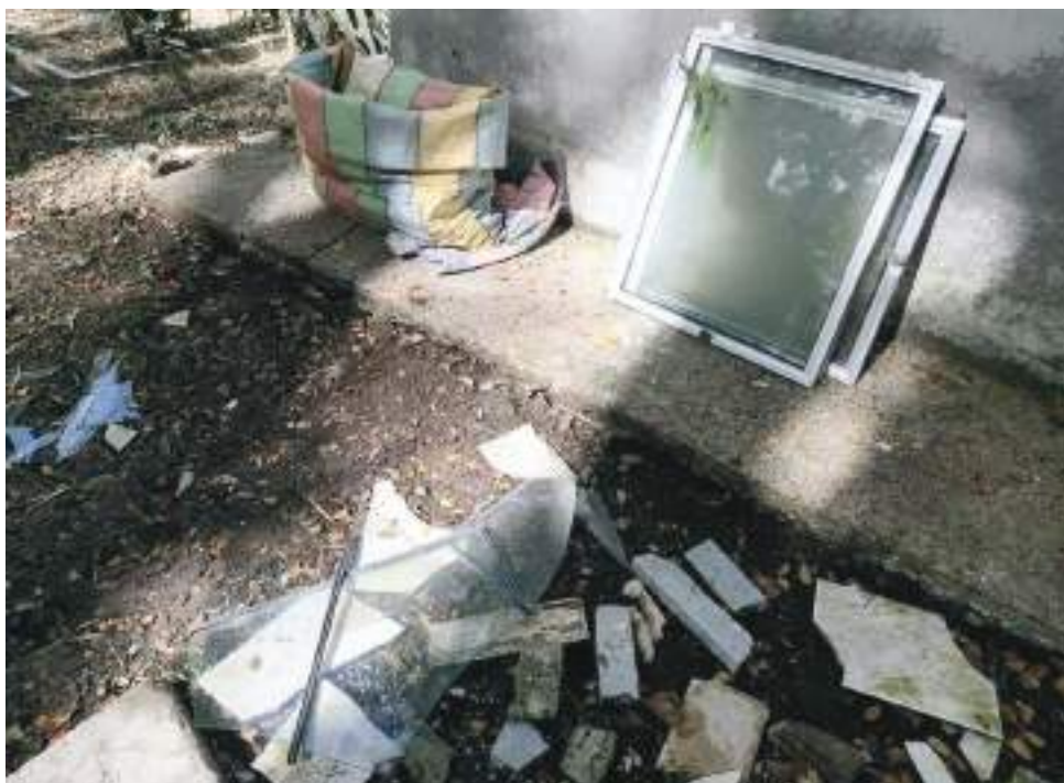
Los capturados fueron entregados a la fiscalía, uno de ellos tenía antecedentes por hurto.

El pasado 13 de octubre dos sujetos entraron al cementerio ubicado en el barrio Sucre Norte para llevarse aluminio, hierro que poseen algunas tumbas.