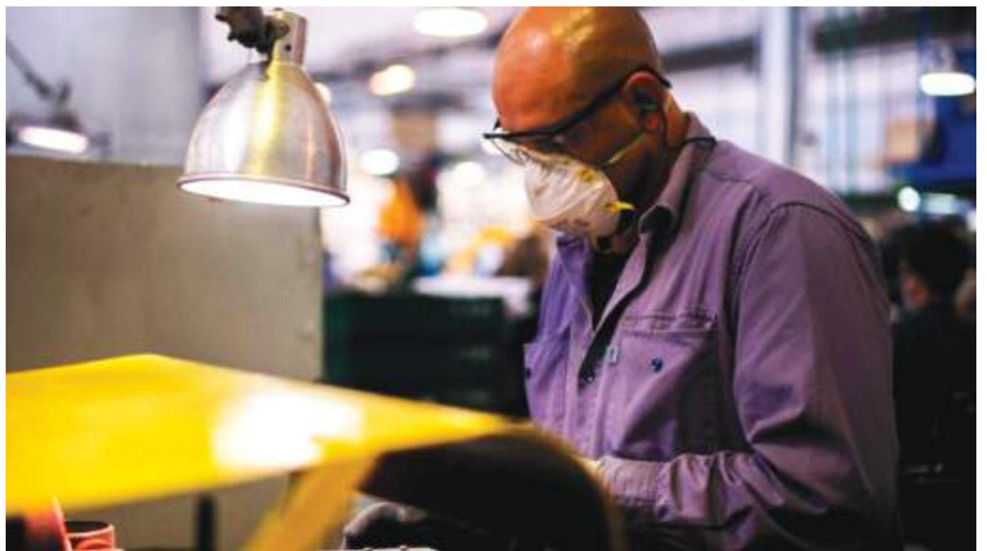
Los microempresarios garantizaron créditos por un valor de $245.079 millones a agosto de 2021

últimos años, garantías empresariales en los 32 departamentos del país y en 1094 municipios, logrando una importante cobertura regional.