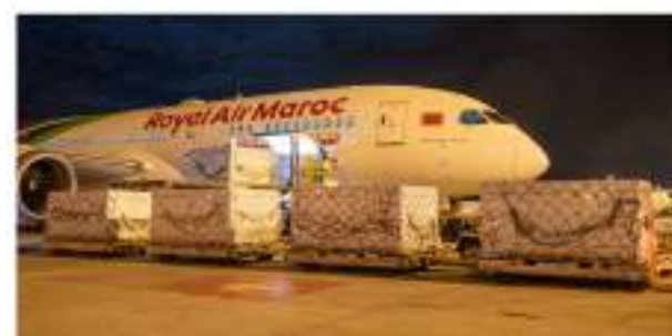
Llegaron al país 2.260.800 dosis de vacunas de Sinovac