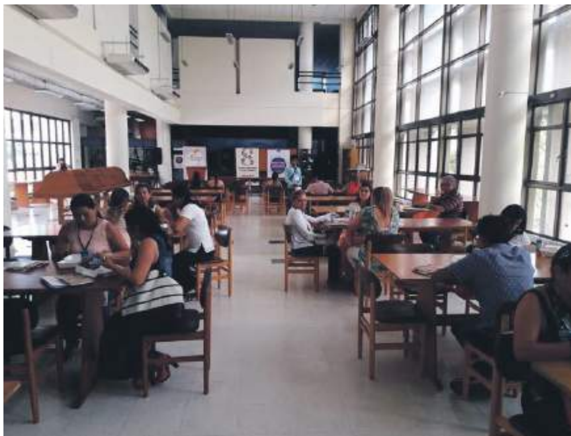
La Biblioteca Departamental será el escenario de estas actividades culturales para su reactivación.

años mínimos de residencia continua en el Departamento.