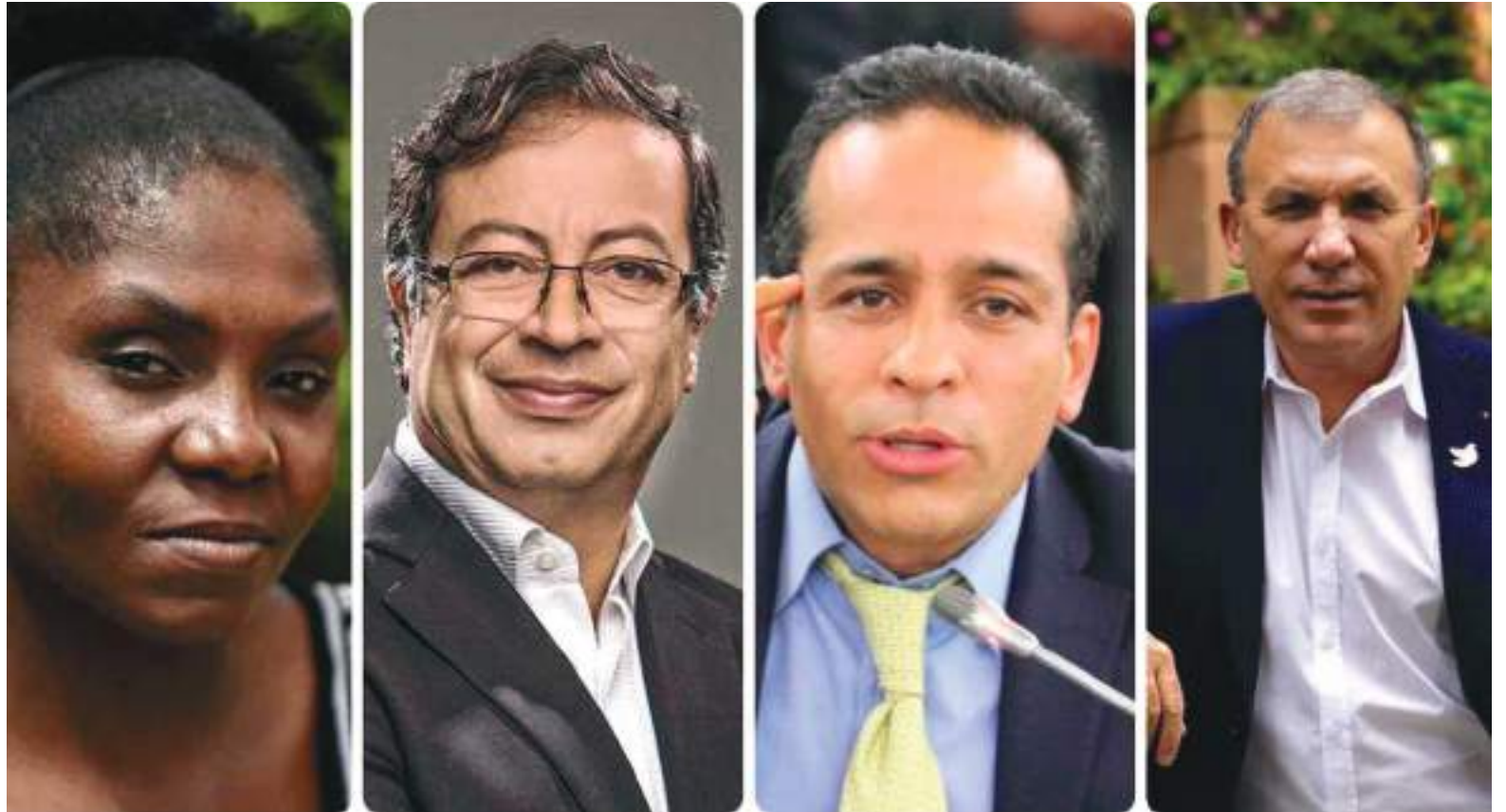
Pacto Histórico: Francia Márquez, Gustavo Petro, Alexander López y Roy Barreras.