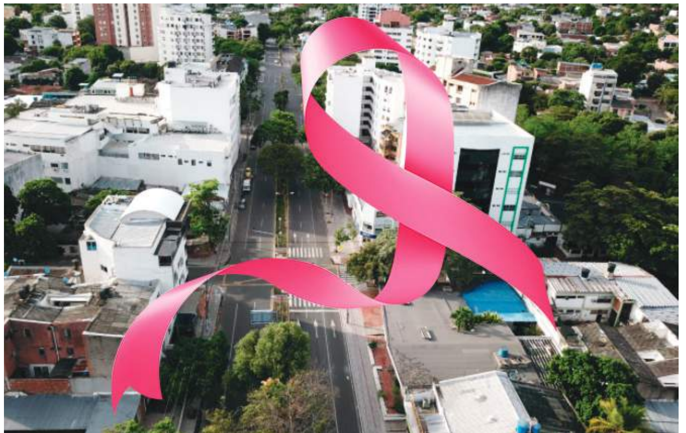
Hoy se conmemora en el mundo el Día Internacional del Cáncer de Mama, una fecha que busca sensibilizar y concientizar.

En cuanto a los chequeos que una persona debe realizarse, expresa que toda mujer mayor de 20 años debe hacerse el autoexamen de seno de manera mensual, 8 días después de finalizado su ciclo menstrual, a partir de los 40 debe solicitar su examen clínico