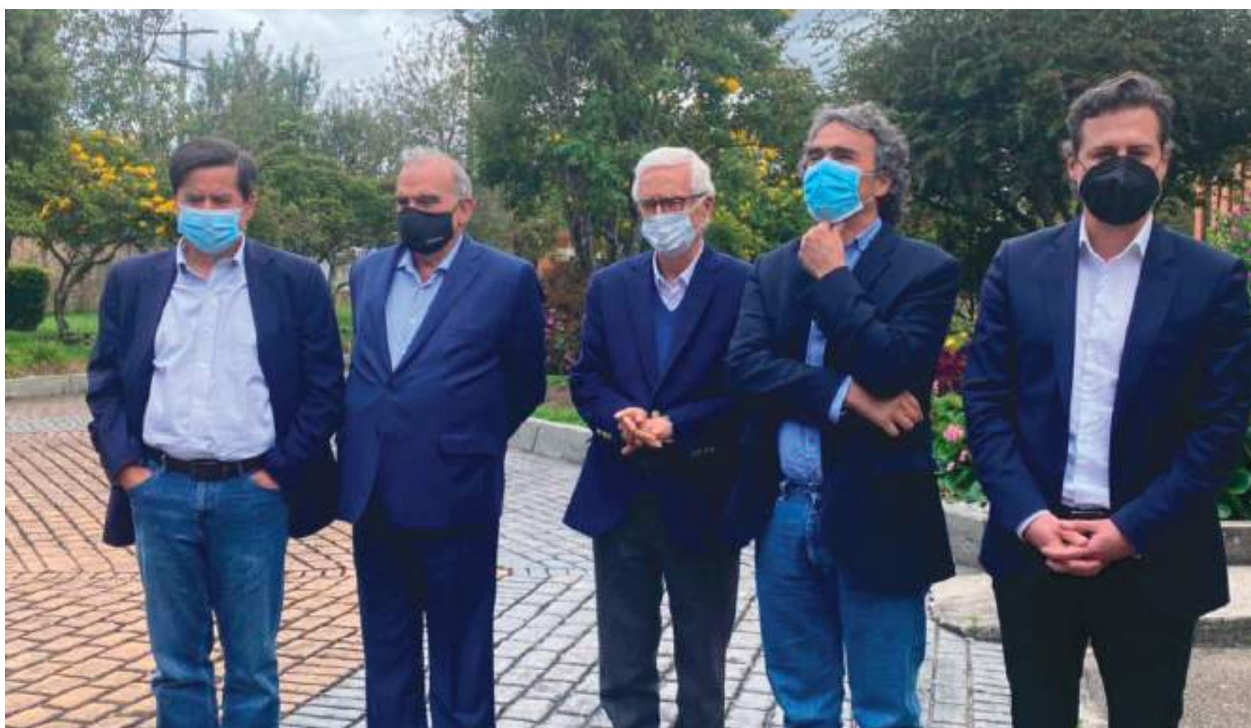
Coalición de la Esperanza: Juan Fernando Cristo, Humberto de la Calle, Jorge Enrique Robledo, Sergio Fajardo y Juan Manuel Galán.

■ Por el momento se están construyendo tres coaliciones o bloques, aunque podría surgir una más. No participar en las consultas podría ser un gran riesgo electoral. La campaña presidencial de 2022 está centrada en el pulso de las coaliciones. En 2018 los resultados marcaron el rumbo de la campaña, dejando por fuera a los que recogieron firmas que los respaldaran.