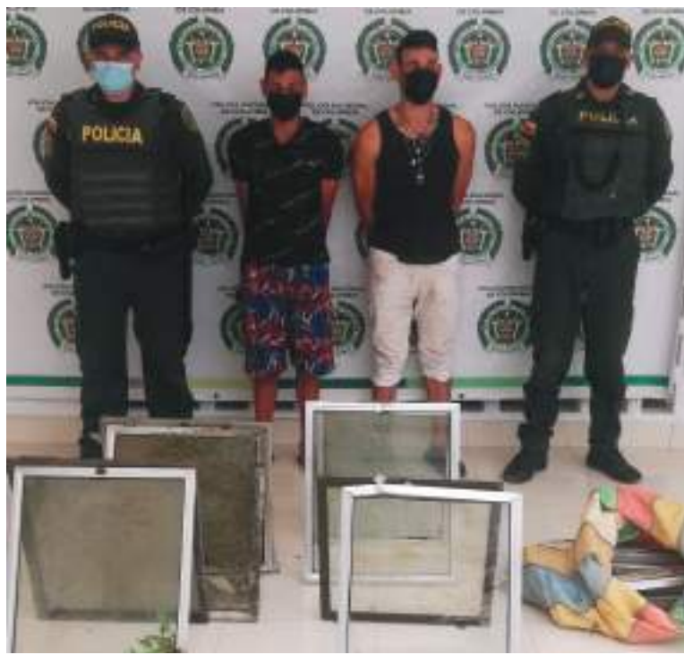
Capturados por el delito de hurto.

Un caso de hurto despertó comentarios en la comunidad de Pitalito, el pasado 13 de octubre dos hombres ingresaron al cementerio para desvalijar tumbas llevándose diferentes elementos como hierro, aluminio y demás. Las autoridades lograron la captura inmediata de los responsables y fueron puestos a la Fiscalía.