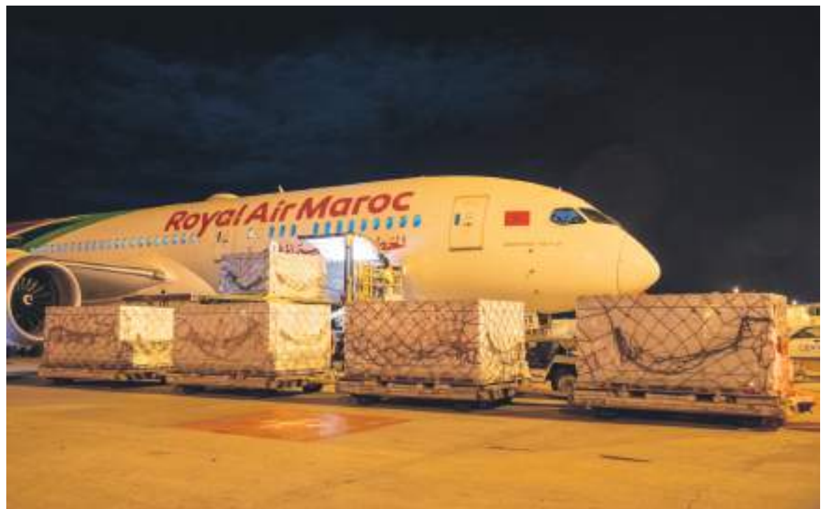
Este lunes llegó al país un nuevo lote de 2.260.800 dosis de vacunas de Sinovac contra el covid-19.

Frente a Sinovac, indicó que en total se han recibido 18.458.404 dosis de vacunas, de las cuales 12.000.004 llegaron vía bilateral, 2.100.000 fueron adquiridas por el sector privado y 4.358.400 por el mecanismo Covax.