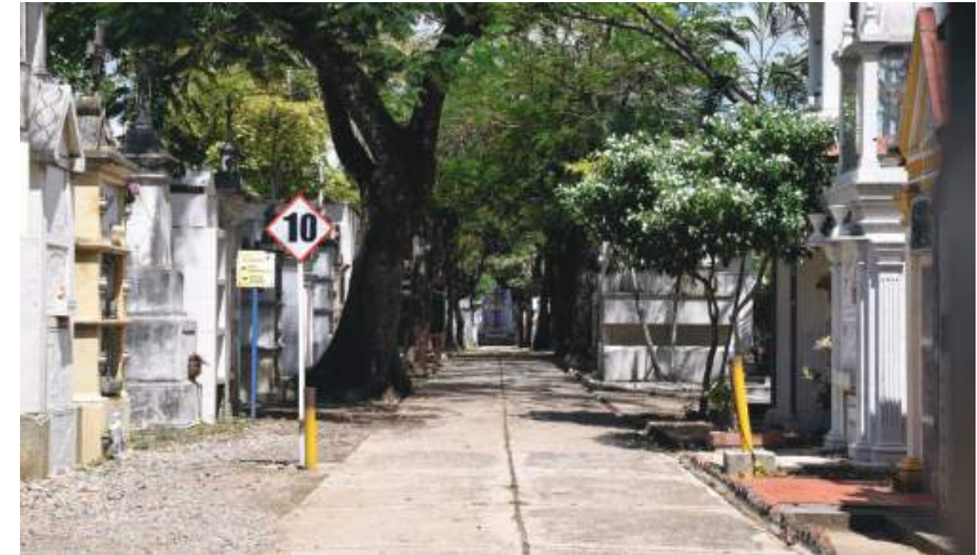
Para conocer qué tanto se conserva la tradición de visitar a los difuntos los lunes, fuimos hasta el Cementerio Central de Neiva para analizar la asistencia y conocer opiniones de los visitantes.

Es- tas dos fe- chas están íntima- mente uni- das entre sí, como la alegría y las lágrimas encuen- tran en Jesucristo una sín- tesis que es fun- damento de nuestra fe y de nuestra esperan- za, dice la Iglesia católica.