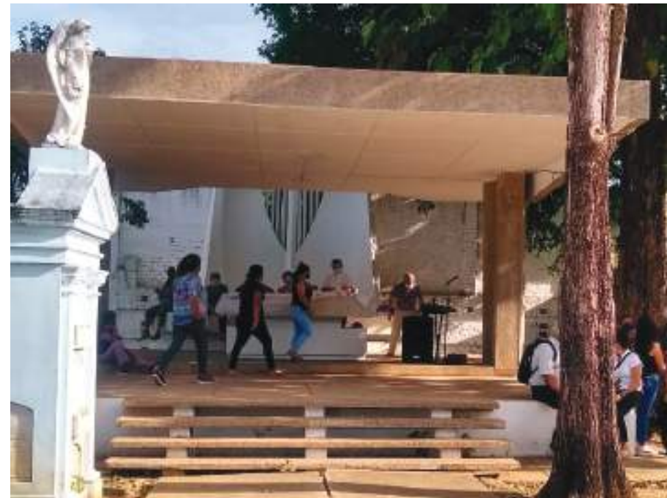
Los lunes y miércoles se oficia la santa misa en esta reapertura que se da entre las 2 y las cinco de la tarde.

Es- tas dos fe- chas están íntima- mente uni- das entre sí, como la alegría y las lágrimas encuen- tran en Jesucristo una sín- tesis que es fun- damento de nuestra fe y de nuestra esperan- za, dice la Iglesia católica.