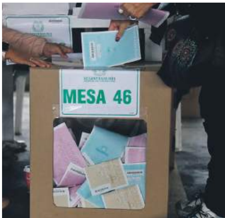
La Comisión Primera de la Cámara de Representantes volverá a debatir el proyecto de ley que busca implementar el “voto obligatorio” en Colombia.

“Buscamos lograr la reglamentación legal del deber de votar, como un deber obligatorio durante un periodo de 12 años. Con esto, queremos combatir la abstención electoral, proteger los recursos públicos destinados a las elecciones y buscar ma-